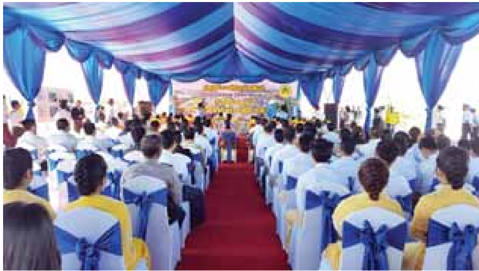
Eco Green City စီမံကိန်း ပန္နက်တင်မင်္ဂလာအခမ်းအနားနှင့် စီမံကိန်းဆိုင်ရာ ရှင်းလင်းပွဲအခမ်းအနား ကျင်းပစဉ်။

ဆောင်ရွက်ခြင်းဖြင့် ဒေသဖွံ့ဖြိုးရေးကို အထောက်အကူ ဖြစ်စေပြီး အလုပ်အကိုင် အခွင့်အလမ်းများလည်း ပေါ်ထွန်းလာမည်ဖြစ်ပါကြောင်း။