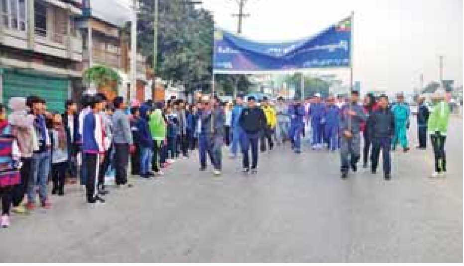
ပြည်ထောင်စုဝန်ကြီး ဒေါက်တာဖေမြင့် မြန်ကြားရေးဝန်ကြီးဌာနအောက်ရှိ ဝန်ထမ်းများနှင့် တွေ့ဆုံစဉ်။ (အပေါ်ပုံ)နှင့် လားရှိုးမြို့ စုပေါင်းလူထုလမ်းလျှောက်ပွဲအား အများပြည်သူနှင့်အတူ ပါဝင်ဆင်နွှဲစဉ်။ (အပေါ်ယာပုံ)