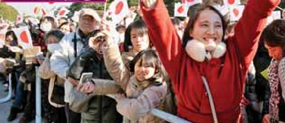
ဘေးဒုက္ခအမျိုးမျိုးနှင့် ရင်ဆိုင်ကြုံတွေ့နေရသည့် ပြည်သူများအပါအဝင် ၂၀၁၁ ခုနှစ်ကဖြစ်ပွားခဲ့သည့် ငလျင်လှုပ်