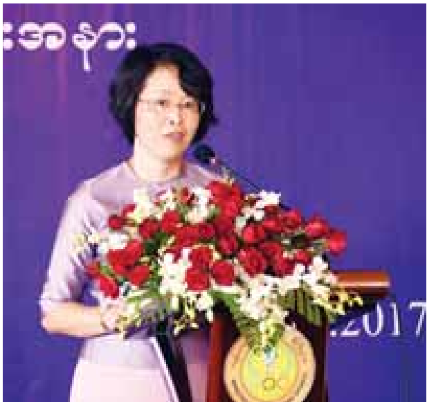
မြန်မာနိုင်ငံဆိုင်ရာ တရုတ်နိုင်ငံသံအမတ်ကြီး၏ ဇနီး Mrs.Wang Xue Hong ဒေါ်ခင်ကြည်အမျိုးသမီးဆေးရုံ လွှဲပြောင်းပေးအပ်ခြင်းနှင့် ဖွင့်လှစ်ခြင်း အခမ်းအနားတွင် နှုတ်ခွန်းဆက်စကား ပြောကြားစဉ်။

ဆရာမတွေဟာ အရေးကြီးတယ်လို့ မြင်ခဲ့ပါတယ်။ အခုလည်းပဲ ဒီအတိုင်းပဲ ကျွန်မမြင်ပါတယ်။ ဘာဖြစ်လို့လဲဆိုရင် သူနာပြုဆရာမတွေကသာ လူနာတွေကို တကယ့်အနီးကပ် ပြုစုနိုင်တာ၊ လူနာတွေကို အားပေးနိုင်တာကြောင့် ဖြစ်ပါ တယ်။