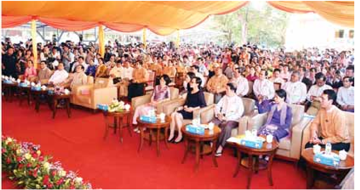
နိုင်ငံတော်၏အတိုင်ပင်ခံပုဂ္ဂိုလ် ဒေါ်အောင်ဆန်းစုကြည် ဒေါ်ခင်ကြည်အမျိုးသမီးဆေးရုံ လွှဲပြောင်းပေးအပ်ခြင်းနှင့် ဖွင့်လှစ်ခြင်းအခမ်းအနားတွင် အမှာစကားပြောကြားစဉ်။