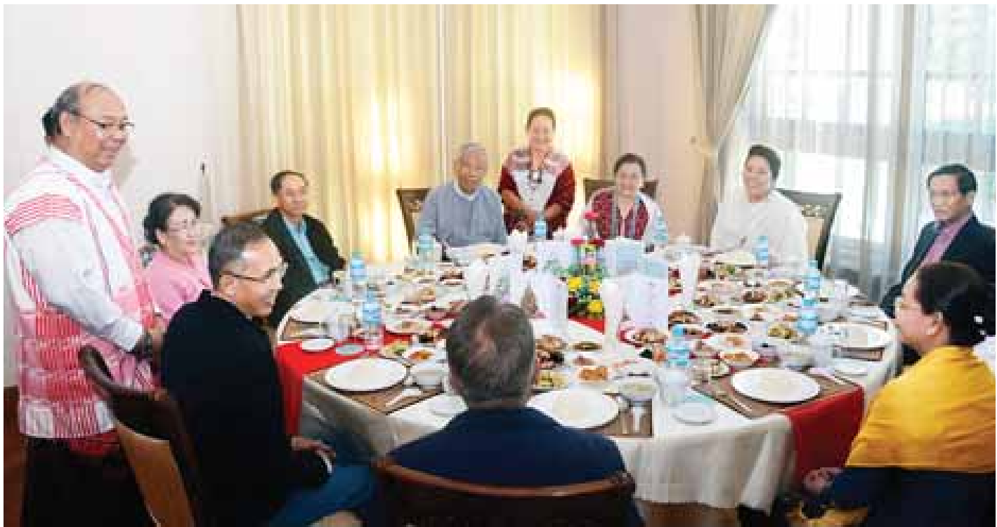
နိုင်ငံတော်သမ္မတ ဦးထင်ကျော်နှင့် ဇနီး ဒေါ်စုစုလွင်တို့ ခရစ်တော်မွေးနေ့(ခရစ္စမတ်)အကြို ဝတ်ပြုဆုတောင်းခြင်းနှင့် ကျေးဇူးတော်ချီးမွမ်းခြင်း အထိမ်းအမှတ်မိတ်ဆုံစားပွဲသို့ တက်ရောက်ကြစဉ်။

ခရစ်တော်မွေးနေ့(ခရစ္စမတ်)အကြို ဝတ်ပြုဆုတောင်းခြင်းနှင့် ကျေးဇူးတော်ချီးမွမ်းခြင်း အခမ်းအနားတွင် သိက္ခာတော်ရဆရာများက ခရစ္စမတ်ဒေသနာတော်ဟောကြားခြင်း၊ သမ္မာကျမ်းစာဖတ်ကြားခြင်း၊ ဂုဏ်တော်ချီးမွမ်းခြင်း၊ ဆုတောင်းမေတ္တာပို့သခြင်း၊ ဓမ္မတေးများ သီဆိုချီးမွမ်းခြင်းတို့ကို ဆောင်ရွက်ခဲ့ကြသည်။ သတင်းစဉ်