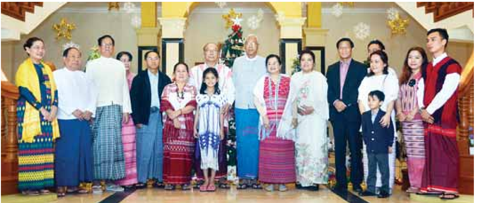
နိုင်ငံတော်သမ္မတ ဦးထင်ကျော်နှင့် ဇနီး ဒေါ်စုစုလွင်တို့ ကျေးဇူးတော်ချီးမွမ်းခြင်း အထိမ်းအမှတ် အခမ်းအနားသို့ တက်ရောက်လာကြသူများနှင့်အတူ မှတ်တမ်းဓာတ်ပုံရိုက်ကြစဉ်။