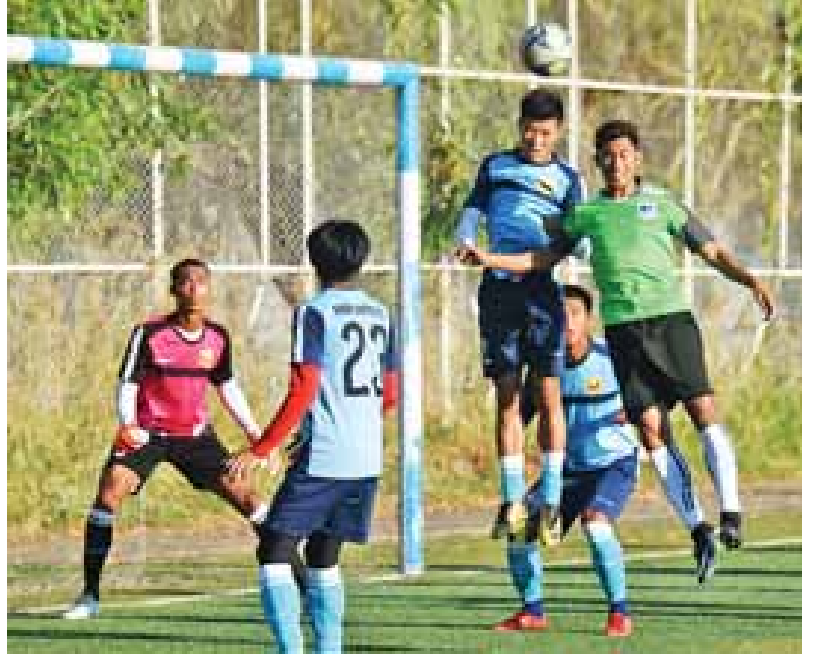
ရှမ်းယူနိုက်တက်နှင့် ရတနာပုံအသင်း ယှဉ်ပြိုင်နေစဉ်၊