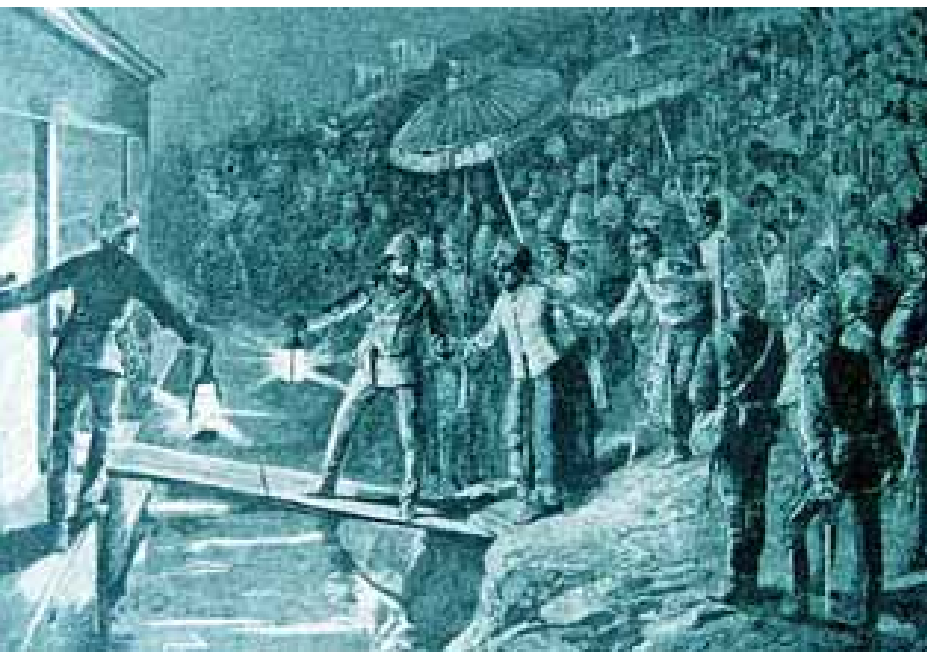
တစ်နိုင်ငံလုံး ဆုံးရှုံးပြီးနောက် ဘုရင်နှင့် မိဖုရား ဤသို့ ပါတော်မူခဲ့သည်။

ဒုတိယအကြိမ် လွတ်လပ်ရေးဆုံးရှုံး ၁၈၅၂ ခုနှစ် ဧပြီလ ၅ ရက်နေ့တွင် အင်္ဂလိပ်-မြန်မာ ဒုတိယစစ်ပွဲ စတင်ဖြစ်ပွားသည်။ ဒီဇင်ဘာလ ၁၇ ရက် တွင် အင်္ဂလိပ်တို့ အောက်မြန်မာနိုင်ငံကို သိမ်းပိုက်ခဲ့သည်။ တိုက်ခိုက်မှုများစွာ မြန်မာတို့ ဆုတ်ခွာကြသော်လည်း မြန်မာဘုရင်က စစ်ပြေငြိမ်းရေးစာချုပ် မချုပ်ဆို၊ ထို့နောက် ရခိုင်၊ တနင်္သာရီ အပါအဝင် တောင်ငူဒေသမှ အောက် မြန်မာနိုင်ငံတစ်ခုလုံး အင်္ဂလိပ်လက်အောက် ကျရောက် သွားခဲ့သည်။ အောက်မြန်မာပြည်ကို အင်္ဂလိပ်တို့ နယ်ခြား မှတ်တိုင်စိုက်၍ ဖဲ့ယူသွားသည်။ မြန်မာပြည်တစ်ဝက် လွတ်လပ်ရေးဆုံးရှုံးခဲ့ရသည်။ အောက်မြန်မာပြည်တွင် အင်္ဂလိပ်တို့ အခြေချမိခြင်း သည်ပင်လျှင် အထက်မြန်မာပြည်တွင် ထီးနန်းစိုက်ထူ သော ကုန်းဘောင်မင်းဆက် သက်တမ်းကုန်ဆုံးခြင်း၏ အစဖြစ်သည်။