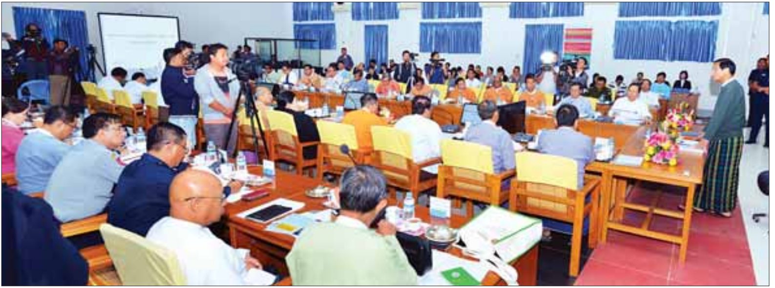
ဗဟိုယသမ္မတ ဦးဟင်နရီဇန်ထီးယူ အမျိုးသားသဘာဝဘေးအန္တရာယ်ဆိုင်ရာ စီမံခန့်ခွဲမှုကော်မတီ အစည်းအဝေးတွင် အမှာစကား ပြောကြားစဉ်။

၂၀၁၅ ခုနှစ် မတ်လတွင် ၇၀ နှစ် နိုင်ငံ ဆန်ဒိုင်းမြို့၌ ကျင်းပခဲ့သည့် တတိယအကြိမ် ဘေးအန္တရာယ် ကြောင့် ထိခိုက်ဆုံးရှုံးနိုင်ခြေ လျော့ချရေး ကမ္ဘာ့ညီလာခံတွင် သဘာဝဘေးအန္တရာယ်ကြောင့် ထိခိုက်ဆုံးရှုံးနိုင်ခြေ လျော့ချရေးဆိုင်ရာ ဆန်ဒိုင်းမူဘောင်ကို ချမှတ်ခဲ့ပြီး နိုင်ငံများက လိုက်နာဆောင်ရွက်လျက် ရှိကြပါကြောင်း။ ဆန်ဒိုင်းမူဘောင်၏ ဦးစားပေးလုပ်ငန်း(၄)ရပ်ဖြစ်သည့် သဘာဝဘေးအန္တရာယ်များ၏ သဘာဝဘာဝကို နားလည်ထားရန်၊ ဘေးအန္တရာယ်ကြောင့် ထိခိုက်ဆုံးရှုံးနိုင်ခြေလျော့ပါးစေရေးအတွက် စီမံခန့်ခွဲမှု ပိုမိုအားကောင်းလာရန်၊ ဘေးအန္တရာယ်ကြောင့် ထိခိုက်ဆုံးရှုံးနိုင်ခြေလျော့ချရေး လုပ်ငန်းများတွင် ရင်းနှီးမြှုပ်နှံမှုများ ဆောင်ရွက်ရန်၊ ဘေးအန္တရာယ်ဆိုင်ရာ ကြိုတင်ပြင်ဆင်မှုလုပ်ငန်းများနှင့် ပြန်လည်ထူထောင်ရေးနှင့် ပြန်လည်