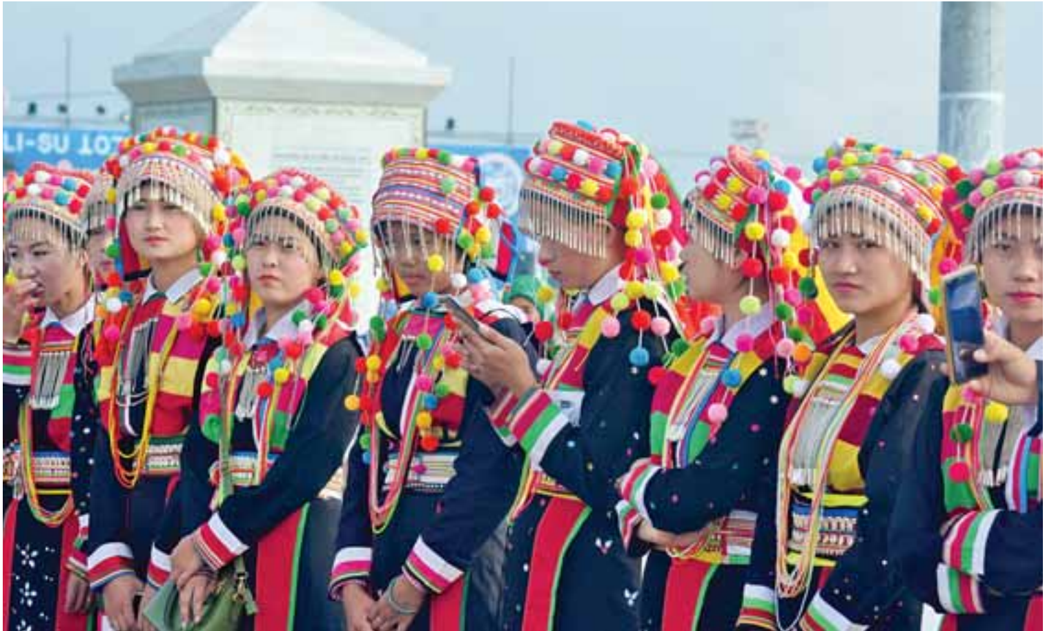
မြစ်ကြီးနား၌ ကျင်းပသော လီဆူစာပေနေ့ (၁၀၀) ပြည့် ဂျူပလီပွဲတော်ကြီး၌ တွေ့မြင်ရသော လီဆူအမျိုးသမီးများ။

လီဆူလူမျိုးများသည် လီဆူစာပေအရေး အသား မပေါ်ပေါက်မီကပင် ဘာသာစကား