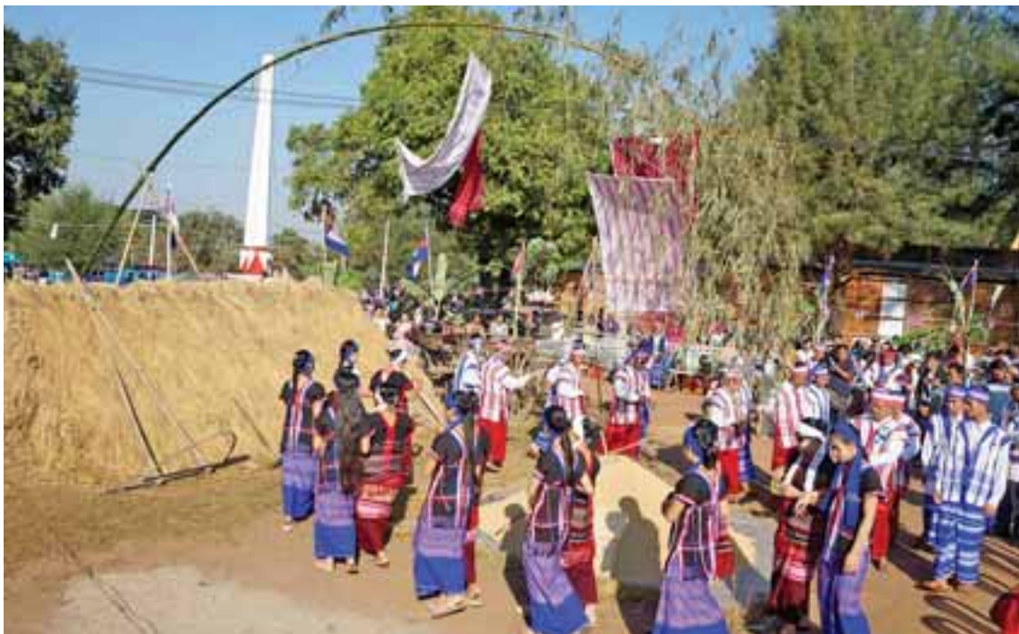
ကရင်နှစ်သစ်ကူးပွဲတော်ကို ဘားအံမြို့၌ ဤသို့ခမ်းနားစွာကျင်းပ။