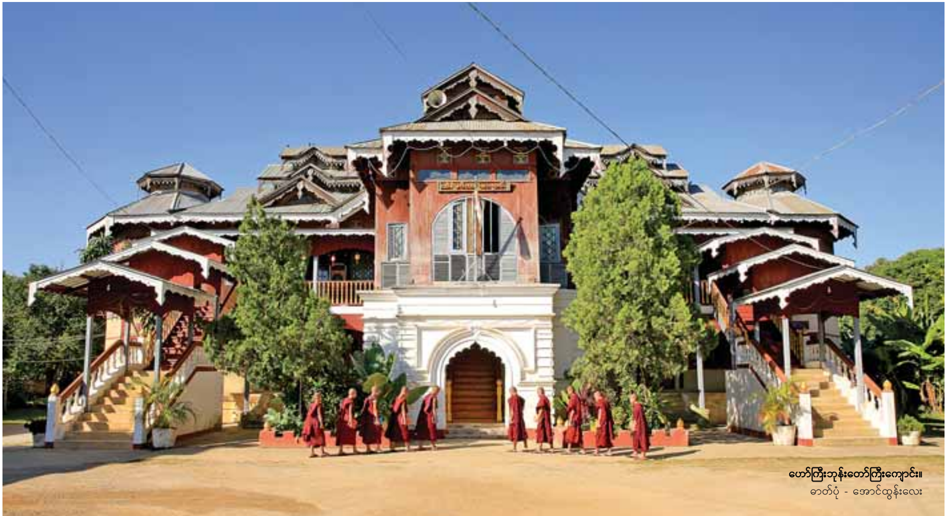
ဟော်ကြီးဘုန်းတော်ကြီးကျောင်း။