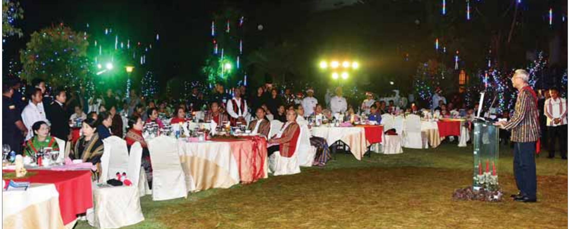
နိုင်ငံတော်သမ္မတ ဦးထင်ကျော် ခရစ္စမတ်ပွဲတော်နှင့် ကျေးဇူးတော်ချီးမွမ်းခြင်း အခမ်းအနားတွင် ခရစ္စမတ်နှုတ်ခွန်းဆက် ဆုတောင်းစကား ပြောကြားစဉ်။