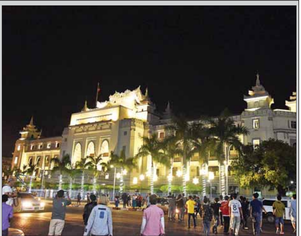
ဒီဇင်ဘာ ၂၂ ရက် ညပိုင်းတွင် ရန်ကုန်မြို့၊ မြို့တော်ခန်းမရှေ့၌ ခရစ္စမတ်အကြို ရောင်စုံမီးများ ထွန်းထားသည်ကို တွေ့ရစဉ်။ ဇော်ဇော်