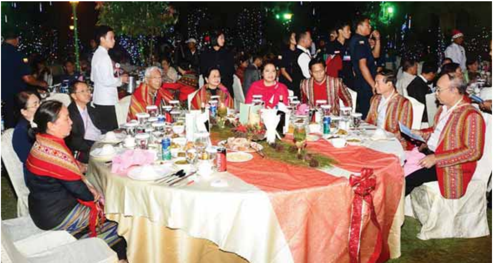
နိုင်ငံတော်သမ္မတ ဦးထင်ကျော်နှင့်ဇနီး ဒေါ်စုစုလွင်၊ ဒုတိယသမ္မတ ဦးမြင့်ဆွေနှင့်ဇနီး ဒေါ်ခင်သက်ဌေး၊ ဒုတိယသမ္မတ ဦးဟင်နရီဗန်ထီးယူနှင့်ဇနီး ဒေါက်တာရွှေလွမ်း၊ ပြည်သူ့လွှတ်တော် ဥက္ကဋ္ဌ ဦးဝင်းမြင့်၊ အမျိုးသားလွှတ်တော်ဥက္ကဋ္ဌ မန်းဝင်းခိုင်သန်းတို့ ခရစ္စမတ်ပွဲနေ့ မိတ်သဟာယညစာကို အတူတကွသုံးဆောင်ကြစဉ်။

နေပြည်တော် ဒီဇင်ဘာ ၂၂ နိုင်ငံတော်သမ္မတ ဦးထင်ကျော်နှင့် ဇနီး ဒေါ်စုစုလွင်တို့သည် ယနေ့ ညနေ ၆ နာရီတွင် ဒုတိယသမ္မတ ဦးဟင်နရီဗန်ထီးယူ၏ နေအိမ်၌ ကျင်းပသည့် ခရစ္စမတ်ပွဲတော်နှင့် ကျေးဇူးတော်ချီးမွမ်းခြင်းအခမ်းအနား သို့ တက်ရောက်ကြသည်။ အခမ်းအနားသို့ တက်ရောက် လာကြသည့် နိုင်ငံတော်သမ္မတ ဦးထင်ကျော်နှင့် ဇနီး ဒေါ်စုစုလွင်၊ ဒုတိယသမ္မတ ဦးမြင့်ဆွေနှင့် ဇနီး ဒေါ်ခင်သက်ဌေး၊ ပြည်သူ့လွှတ်တော် ဥက္ကဋ္ဌ ဦးဝင်းမြင့်နှင့် ဇနီး ဒေါ်ချိုချို၊ အမျိုးသားလွှတ်တော်ဥက္ကဋ္ဌ မန်းဝင်း ခိုင်သန်းနှင့် ဇနီး ဒေါ်နန့်ကြင်ကြည်၊ နိုင်ငံတော်ဖွဲ့စည်းပုံအခြေခံဥပဒေ ဆိုင်ရာခုံရုံးဥက္ကဋ္ဌ ဦးမျိုးညွန့်၊ ပြည်ထောင်စုရွေးကောက်ပွဲကော်မရှင် ဥက္ကဋ္ဌ ဦးလှသိန်း၊ ပြည်သူ့လွှတ်တော် ဒုတိယဥက္ကဋ္ဌ ဦးတီခွန်မြတ်၊ အမျိုးသား လွှတ်တော်ဒုတိယဥက္ကဋ္ဌ ဦးအေးသာ အောင်၊ ပြည်ထောင်စုဝန်ကြီးများ၊ တိုင်းဒေသကြီးနှင့် ပြည်နယ်ဝန်ကြီးချုပ် များ၊ ပြည်ထောင်စုရွေးနေ့ချုပ်၊ ဒုတိယ ဝန်ကြီးများနှင့် ၎င်းတို့၏ဇနီးများ၊ စာမျက်နှာ ၃ ကော်လံ ၁ သို့ *