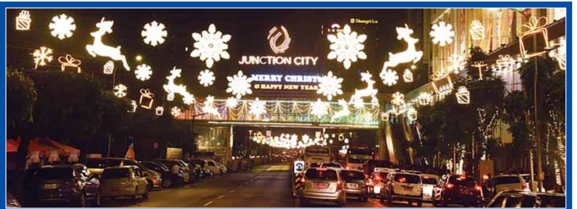
ဒီဇင်ဘာ ၂၂ ရက် ညပိုင်းတွင် ရန်ကုန်မြို့၊ ဗိုလ်ချုပ်အောင်ဆန်းလမ်း၊ ဗိုလ်ချုပ်ဈေးရေ၌ ခရစ္စမတ်နှင့် နှစ်သစ်ကူးကြိုဆိုသောအားဖြင့် ရောင်စုံမီးများထွန်းထားသည်ကို တွေ့ရစဉ်။