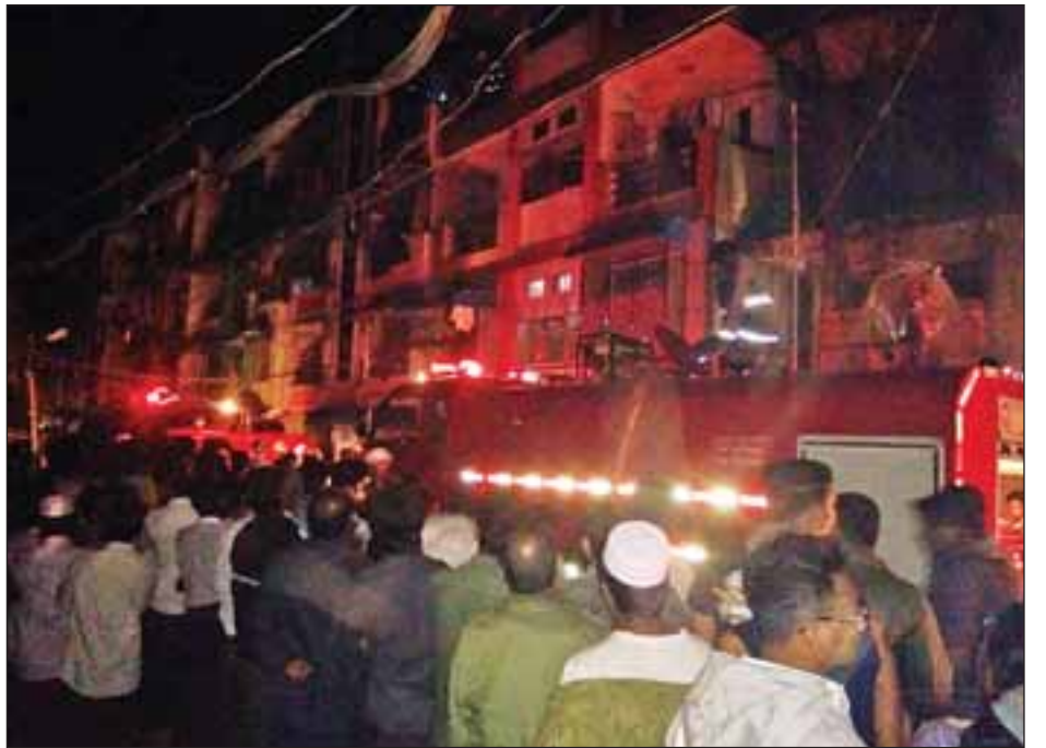
ဒေါပုံမြို့နယ်မီးလောင်မှုကို ငြိမ်းသတ်နေစဉ်။