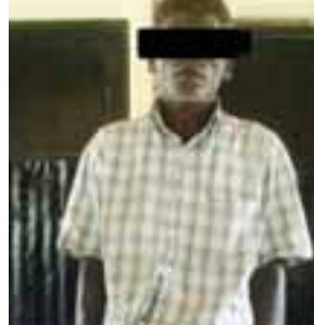
နာဂိုတာချေ

ယူဆရသည့် ရှာဖွေမှုများ(ခ) ဘင်္ဂလားနှင့် အဒူရှင်ရိုးတို့အား လည်းကောင်း ဖမ်းဆီးရမိခဲ့ခြင်းဖြစ်သည်။ အလားတူ ဒီဇင်ဘာ ၁၈ ရက် ည ၉ နာရီတွင် ရေတွင်းကျွန်းကျေးရွာ မြောက်ဘက် ဦးရှည်ကျချောင်း အတွင်း မသင်္ကာဖွယ် လောင်းလှေ