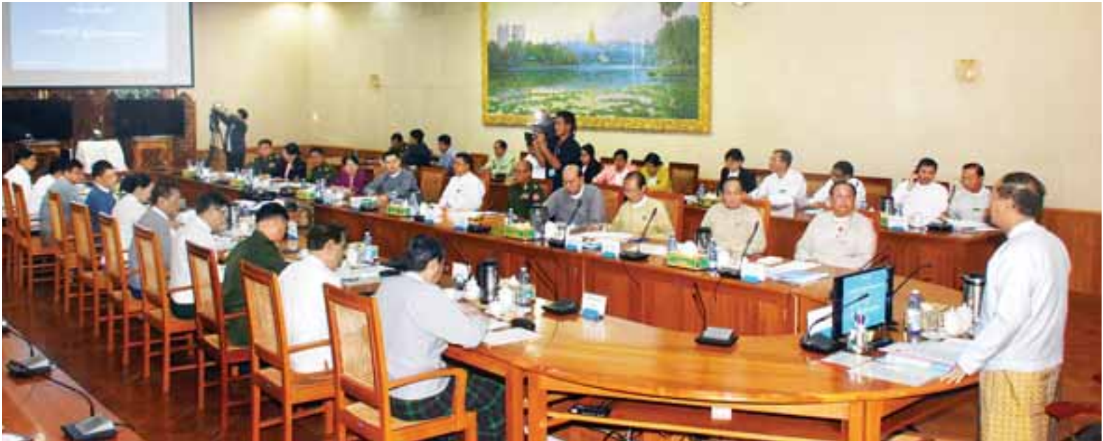
၂၀၁၈ ခုနှစ် (၇၁) နှစ်မြောက် ပြည်ထောင်စုနေ့ကျင်းပရေး ညှိနှိုင်းအစည်းအဝေးတွင် ဒုတိယသမ္မတ ဦးမြင့်ဆွေ အမှာစကားပြောကြားစဉ်။

★ ကွဲပြားခြားနားသည့်မှ ၉၅/၂၀၁၇ ဖြင့် ဥက္ကဋ္ဌအဖြစ် ဒုတိယ သမ္မတအပါအဝင် အဖွဲ့ဝင် ၁၄ ဦး ဖြင့် ဖွဲ့စည်းဆောင်ရွက်ခဲ့ပြီး အခမ်း အနားကို အမျိုးသားရေးဦးတည်ချက် များနှင့်အညီ အောင်မြင်စွာ အကောင် အထည်ဖော် ဆောင်ရွက်နိုင်ရန် အတွက် စီမံခန့်ခွဲမှုကော်မတီနှင့် ဆက်ဆံရေးဦးစီးဌာနတို့နှင့် ဆက်ဆံရေးအဖွဲ့တို့ကို ဖွဲ့စည်းခဲ့ပြီး ဖြစ်ပါကြောင်း။