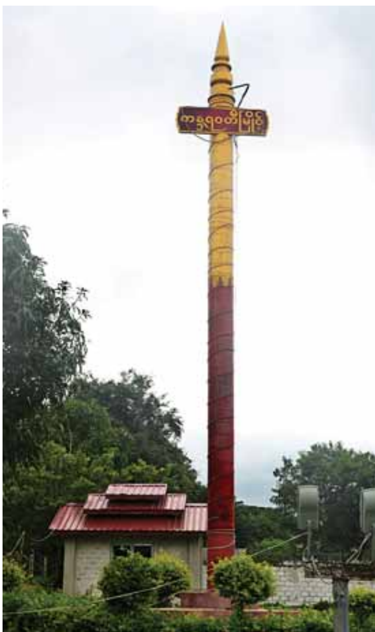
လှိုင်ကော်မြို့ မင်းစုရပ်ကွက်တွင် စိုက်ထူထားသော ကန္တရဝတီမြို့ဝင် မော်ကွန်းတိုင်။

အဆိုပါဆရာတော်သည် မင်္ဂလာ ဟော်ကြီးကျောင်းတိုက်၌ သီတင်းသုံးရင်း မြန်မာဘာသာ၊ ကယားဘာသာ၊ ရှမ်းဘာသာ၊ ပအိုဝ်းဘာသာစကားတို့ဖြင့် တရားရေအေး အမြိုက်ဆေးကို ကန္တရဝတီပြည်သူများအား တိုက်ကျွေးရင်းဖြင့် အနာဂတ်သာသနာ စည်ပင်ဖွံ့ဖြိုးရေးမြှော်တွေးလျက် သာသနာပြု လုပ်ငန်းတာဝန်များကို ထမ်းဆောင်လျက်ရှိ သည်။ ကယားစော်ဘွားတစ်ဦးမှအစပြု၍ သာသနာပြုမှုကို လက်ခံအစပျိုးတည်ထောင်ခဲ့ ရာမှ ပွင့်လန်းလာသော သာသနာအကျိုး သည် ကယားပြည်နယ်တွင် ရွှန်းလက် တောက်ပလျက်ရှိနေပါသည်။