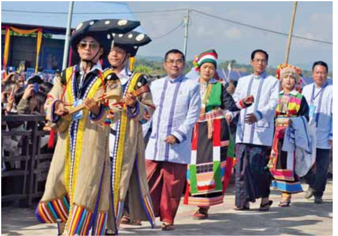
မြစ်ကြီးနား၌ လီဆူစာပေ နှစ် ၁၀၀ ပြည့် ဂျပန်ပွဲတော်ကြီးကို စည်ကားသိုက်မြိုက်စွာ ကျင်းပစဉ်။

(ဂ) ဗုဒ္ဓဘာသာကိုးကွယ်ခြင်း လီဆူတို့တွင် ဗုဒ္ဓဘာသာကိုးကွယ်သူများ လည်း ရှိကြသည်။ ဗုဒ္ဓဘာသာလီဆူများကို မိုးကုတ်နယ်၊ ရှမ်းပြည်နယ်တောင်ပိုင်းနှင့် ကချင်ပြည်နယ်ရှိ အချို့ဒေသများတွင် တွေ့ရ သည်။ အချို့မှာ ရဟန်းဘောင်သို့ဝင်နေသော လီဆူ များလည်းရှိသည်။ ဗုဒ္ဓဘာသာလီဆူတို့ သည် ဗုဒ္ဓဘာသာကို သက်ဝင်ယုံကြည်ကြ၍ ဂေါတမမြတ်ဗုဒ္ဓ၏ အဆုံးအမကို ကိုးကွယ် ယုံကြည်ကြသူများဖြစ်သည်။