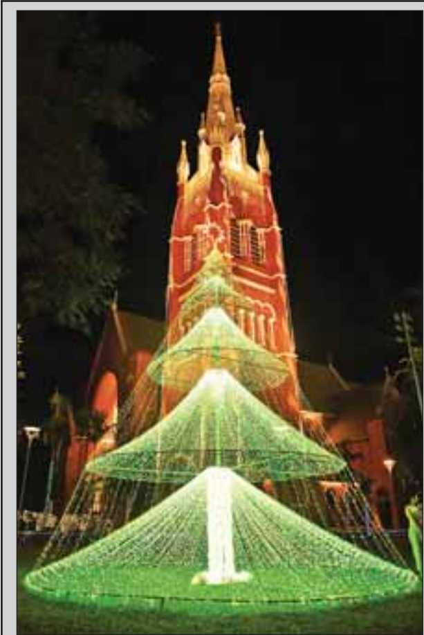
ရန်ကုန်မြို့၊ ဗိုလ်ချုပ်အောင်ဆန်းလမ်းနှင့် ရွှေတိဂုံဘုရားလမ်းထောင့်ရှိ သန့်ရှင်းသော ကြိုနှုတ်ကသီခြယ်ဘုရားကျောင်း၌ ဒီဇင်ဘာ ၂၂ ရက် ညပိုင်းတွင် ခရစ္စမတ်အကြို ရောင်စုံမီးများ ထွန်းထားသည်ကို တွေ့ရစဉ်။ မောင်မောင်ဇော်