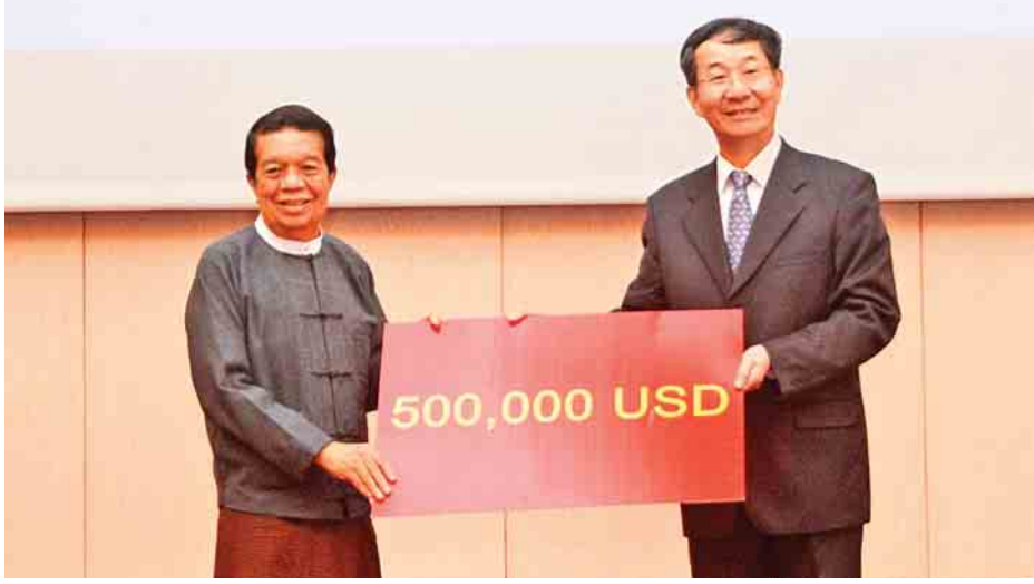
ငြိမ်းချမ်းရေးကော်မရှင်ဥက္ကဋ္ဌ ဒေါက်တာတင်မျိုးဝင်းထံ တရုတ်ပြည်သူ့သမ္မတနိုင်ငံ နိုင်ငံခြားရေးဝန်ကြီးဌာန အာရှရေးရာအထူးကိုယ်စားလှယ် H.E. Mr. Sun Guoxiang က အမေရိကန်ဒေါ်လာ ငါးသိန်း ပေးအပ်လှူဒါန်းစဉ်။

နေပြည်တော် ဒီဇင်ဘာ ၁၇ ငြိမ်းချမ်းရေးလုပ်ငန်းစဉ်များ ဖွံ့ဖြိုးတိုးတက်စေရန်အတွက် တရုတ်ပြည်သူ့သမ္မတနိုင်ငံက အမျိုးသားပြန်လည်သင့်မြတ် ရေးနှင့် ငြိမ်းချမ်းရေးပဟိဌာနသို့ အလှူငွေပေးအပ်ပွဲ အခမ်းအနားကို ယနေ့ မွန်းလွဲ ၂ နာရီခွဲတွင် နေပြည်တော် ရှိ အမျိုးသားပြန်လည်သင့်မြတ်ရေးနှင့် ငြိမ်းချမ်းရေး ပဟိဌာန၌ ကျင်းပသည်။ အလှူငွေပေးအပ်ပွဲတွင် တရုတ်ပြည်သူ့သမ္မတနိုင်ငံ နိုင်ငံခြားရေးဝန်ကြီးဌာန အာရှရေးရာ အထူးကိုယ်စားလှယ် H.E. Mr. Sun Guoxiang က မြန်မာနိုင်ငံ၏ ငြိမ်းချမ်းရေး လုပ်ငန်းစဉ်ကို တရုတ်နိုင်ငံက ထောက်ခံပါကြောင်း၊ တရုတ်နိုင်ငံက မြန်မာနိုင်ငံ၏ ငြိမ်းချမ်းရေးလုပ်ငန်းစဉ် အတွက် စုစုပေါင်း အမေရိကန်ဒေါ်လာ သုံးသန်း လှူဒါန်း မည်ဖြစ်ပါကြောင်း၊ လာမည့်နှစ်တွင် ကျန်သည့် အမေရိကန်ဒေါ်လာ တစ်သန်း ထပ်မံလှူဒါန်းမည်ဖြစ်ပါ ကြောင်း၊ တရုတ်နိုင်ငံက မြန်မာနိုင်ငံ၏ မိတ်ဆွေကောင်း ဖြစ်ပါကြောင်း၊ လှူဒါန်းမှုမှာ ပမာဏအားဖြင့် မကြီးမား သော်လည်း စေတနာကိုဖော်ပြရာ ရောက်ပါကြောင်း၊