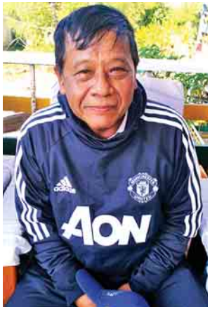
မန္တလေးတိုင်းဒေသကြီးဝန်ကြီးချုပ် ဒေါက်တာဇော်မြင့်မောင်

မန္တလေးတိုင်းဒေသကြီး ဝန်ကြီးချုပ် ဒေါက်တာဇော်မြင့်မောင် ဒီကို ရောက်လာရတဲ့အကြောင်းရင်းက ဝန်ကြီးချုပ်တွေကို နိုင်ငံတော်၏ အတိုင်ပင်ခံပုဂ္ဂိုလ်က ခေါ်တွေ့ပါတယ်။ ရခိုင်ပြည်နယ်မှာဖြစ်ခဲ့တဲ့ ပြဿနာ တွေမှာ ကိုယ့်တိုင်းရင်းသားတွေကို လူသားချင်းစာနာမှု အထောက်အပံ့ပေးရ မယ်။ ပြန်လည်ထူထောင်ရေး အပါအဝင် တိုင်းဒေသကြီးနဲ့ ပြည်နယ်အစိုးရ တွေက ပါဝင်ကူညီရမယ်လို့ လမ်းညွှန်ပေးခဲ့တယ်။ ဒါကြောင့် ကျွန်တော်တို့ အလှူငွေ ကောက်ခံခဲ့ပါတယ်။ ရလာတာကို လူသားချင်းစာနာမှုအတွက် ထောက်ပံ့ဖို့ရယ်၊ ပြန်လည်ထူထောင်ဖို့ရယ်ပါ။ ကျွန်တော်တို့ တိုင်းဒေသကြီးက အိမ်အလုံး ၆၀ တည်ဆောက်ပေးသွားမှာ ဖြစ်ပါတယ်။ ပုံစံတူလေးတွေပါ။ ကျောင်း၊ ဆေးပေးခန်း၊ ရေ မီး စသဖြင့် စနစ်ကျအောင် တည်ဆောက်ပေးသွားမှာ ဖြစ်ပါတယ်။ အလှူခံရငွေက သိန်းပေါင်း တစ်သောင်းကျော်လောက် ရပါတယ်။ အခု တည်ဆောက်တဲ့အပိုင်းက ခုနစ်ထောင်ကျော်လောက် ကုန်မှာဖြစ်ပါတယ်။ ကျွန်တော်တို့က မြန်မာပြည်အရေး၊ ကိုယ့်ဆွေမျိုးသားချင်းအရေးကို ပြည်တွင်း အားကိုးယူပြီး ပြန်လည်ထူထောင်ရေး လုပ်ပေးတာပါ။ ဒါက အနှစ်သာရပါပဲ။ ကိုယ်တိုင်လုပ်တာ၊ ကိုယ်တိုင်ပံ့ပိုးတာရယ်။ လိုအပ်တာတွေကြည့်ပြီး ထောက်ပံ့မယ်။ ပြည်တွင်းအားဟာ ပြည်တွင်းမှာပဲရှိတယ်ဆိုတာကိုလည်း ပြုချင်တာဖြစ်ပါတယ်။ ဒီတစ်ခါတည်းနဲ့ မပြီးပါဘူး။ ပြန်လည်ထူထောင်ဖို့ ဆက်လက်လုပ်သွားကြရမှာပါ။