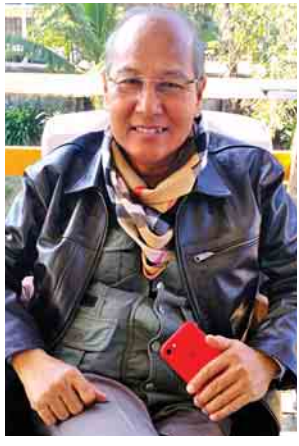
မကွေးတိုင်းဒေသကြီးဝန်ကြီးချုပ် ဒေါက်တာအောင်မိုးညို