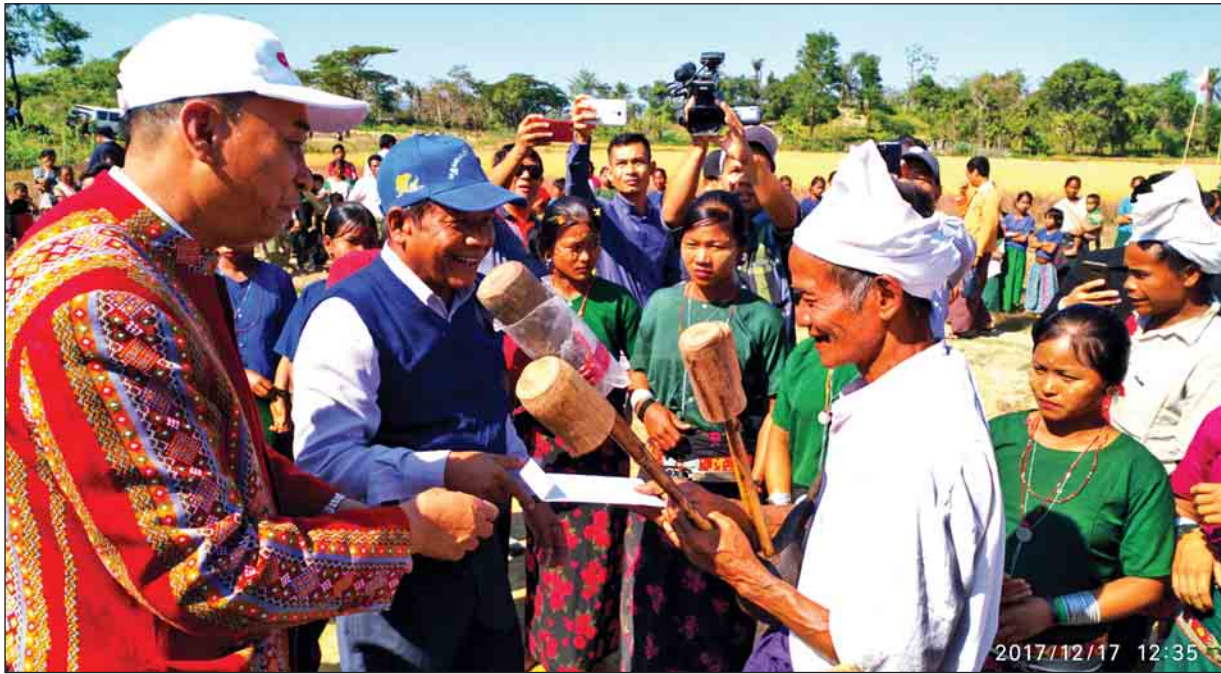
တိုင်းဒေသကြီးနှင့် ပြည်နယ် ဝန်ကြီးချုပ်များက ရိုးရာအတီးအမှုတ်များဖြင့် ကပြဖော်ပြေခဲ့ကြသည့် တိုင်းရင်းသားများအား ဂုဏ်ပြုငွေ ချီးမြှင့်စဉ်။