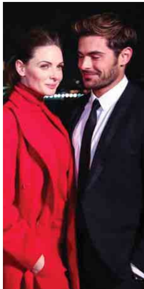
တွေဖြစ်နေကြောင်း ဝေဖန်ခဲ့ကြပြီး သက်သေပြနိုင်ဖို့ကိုလည်း ရှာဖွေနေကြတယ်လို့လည်း သိရပါတယ်။

ဒီလိုနှစ်ဦးသားအတူ ရိုက်ကူးထားတဲ့ ဓာတ်ပုံတွေကို လူမှုကွန်ရက် မီဒီယာတွေပေါ်မှာ ဖော်ပြခဲ့တာကြောင့် ပရိသတ်တွေက ဇက်အက်ဖ်ရွန်နဲ့ ရေပက်ကာဟာဂူဆန်တို့ ချစ်သူ