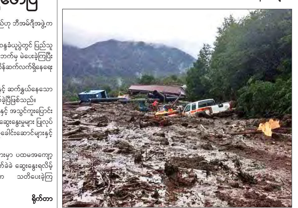
အင်န်အိတ်ချီကော

ဆန်တီယာဂို ဒီဇင်ဘာ ၁၇ ချီလီနိုင်ငံတောင်ဘက်ပိုင်းရှိ ကျေးရွာတစ်ရွာတွင် မြေပြိုကျမှုဖြစ်ပွားခဲ့ရာ လူ ငါးဦးသေဆုံးခဲ့ပြီး ၁၅ ဦး ပျောက်ဆုံးလျက်ရှိကြောင်း ယနေ့သတင်းများအရသိရသည်။ ဒီဇင်ဘာ ၁၇ ရက် နံနက်ပိုင်းတွင် ချီလီနိုင်ငံမြို့တော် ဆန်တီယာဂိုတောင်ဘက် ကီလိုမီတာ ၁၂၀၀ ခန့်အကွာအဝေးတွင်ရှိသော ဆန်တာလူဆီယာကျေးရွာတွင် မြေပြိုကျမှုဖြစ်ပွားခဲ့ရာ ယင်းကျေးရွာရှိ စာသင်ကျောင်းနှင့် လူနေအိမ်အများအပြား မြေများဖုံးလွှမ်းသွားခဲ့ကြောင်း သိရသည်။ ရဲအရာရှိများ၏ မှတ်တမ်းဓာတ်ပုံတစ်ခုတွင် လူနေအိမ်များအား မြေကြီးများဖုံးလွှမ်းနေသည့်မြင်ကွင်းကို ကောင်းကင်ယံမှ တွေ့ရှိရသည်။ မြေပြိုကျမှုကြောင့် အိုးမဲ့အိမ်မဲ့ ဖြစ်သွားသော ဒုက္ခသည်များအား ကူညီထောက်ပံ့မှုများ ပေးမည်ဖြစ်ကြောင်း၊ ထို့ပြင် မြေပြိုကျခဲ့သော နေရာကို ဘေးအန္တရာယ် ကျရောက်သည့် နေရာအဖြစ် သတ်မှတ်မည်ဖြစ်ကြောင်း သမ္မတ ဘာချီလက်က မီဒီယာသို့ ပြောကြားခဲ့သည်။ ကယ်ဆယ်ရေးလုပ်သားများက မြေပြိုကျရာနေရာသို့ သွားရောက်ကာ ကယ်ဆယ်ရေးလုပ်ငန်းများ ဆောင်ရွက်လျက်ရှိသည်။ အဆိုပါ ဆန်တာလူဆီယာကျေးရွာတွင် မြေပြိုကျမှုဖြစ်ပွားမီ မိုးများသည်ထန်စွာရွာသွန်းခဲ့ကြောင်း ဒေသန္တရသတင်းဌာနများက ဆိုသည်။