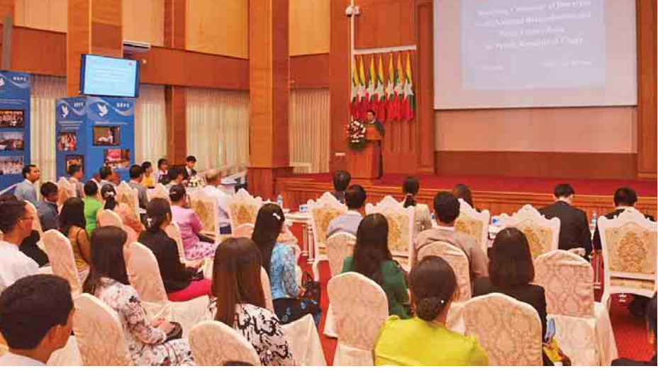
ငြိမ်းချမ်းရေးလုပ်ငန်းစဉ်များ ဖွံ့ဖြိုးတိုးတက်စေရန်အတွက် တရုတ်ပြည်သူ့သမ္မတနိုင်ငံက အမျိုးသားပြန်လည် သင့်မြတ်ရေးနှင့် ငြိမ်းချမ်းရေးပဟိဌာနသို့ အလှူငွေပေးအပ်ပွဲ ကျင်းပစဉ်။