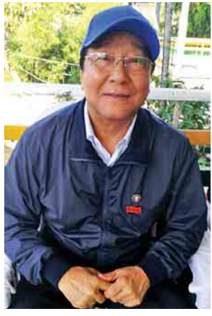
ကချင်ပြည်နယ်ဝန်ကြီးချုပ် ဒေါက်တာခင်အောင်

စစ်ကိုင်းတိုင်းဒေသကြီး ဝန်ကြီးချုပ် ဒေါက်တာမြင့်နိုင် တိုင်းဒေသကြီးအနေနဲ့က မြို့နယ်တွေရော၊ ကုမ္ပဏီတွေရော အလှူခံ လိုက်တာ သိန်းပေါင်း ၃၅၀၀ လောက်ရတယ်။ မင်းကြီးရွာမှာ အိမ် ၄၅ လုံးကို တည်ဆောက်ပေးသွားမယ်။ ကုန်ကျငွေအတွက်လည်း ဘဏ်က ငွေလွှဲထား ပြီးပါပြီ။ ကျန်တဲ့ငွေကိုလည်း လိုအပ်တဲ့နေရာတွေမှာ ထပ်ကူညီသွားမှာပါ။ တို့တွေဟာ ဥမကွဲ သိုက်မပျက်နေထိုင်လာကြတာဖြစ်တဲ့အတွက် လိုအပ်တာ တွေ ကူညီပေးသွားဦးမှာပါ။