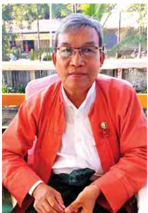
ရခိုင်ပြည်နယ်ဝန်ကြီးချုပ် ဦးညိုပု