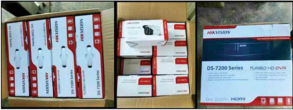
တရားဝင်စာရွက်စာတမ်း အထောက်အထား တစ်စုံတစ်ရာတင်ပြနိုင်ခြင်းမရှိသည့် Turbo, HD DVR, Turbo HD In/Out Door Exir Bullet Camera ရေပူအမြဲတမ်းစစ်ဆေးရေးစခန်းက တားဆီးမှုခန့်ခွဲမှု (ခန့်မှန်းတန်ဖိုး ငွေကျပ် ၃၆ ဒသမ ၉၈၇ သန်းခန့်) ကို သိမ်းဆည်းရမိခဲ့ပြီး ထူးခြားဖမ်းဆီးမှုအနေဖြင့် ဒီဇင်ဘာ ၁၆ ရက်တွင် မန္တလေးမြို့သို့ သွားရောက်မည့် Canter ၂၂ ဘီးယာဉ်တစ်စီးကို ရေပူအမြဲတမ်း စစ်ဆေးရေးစခန်း ပူးပေါင်းစစ်ဆေးရေးအဖွဲ့က စစ်ဆေးခဲ့ရာ တရားဝင်စာရွက်စာတမ်း အထောက်အထား တစ်စုံတစ်ရာ တင်ပြနိုင်ခြင်းမရှိသည့် Turbo HD DVR (1x8)(25)Pkgs, (1x4)(8) Pkgs, Turbo HD In/Out Door Exir Bullet Camera(1x30)(2) Pkgs, (1x32)(4)Pkgs, (1x36)(1) Pkgs ခန့်မှန်းတန်ဖိုးငွေကျပ် ၁၀ ဒသမ ၂၈၀ သန်းခန့်ကို စစ်ဆေးတွေ့ရှိ၍ သိမ်းဆည်းခဲ့ကြောင်း သိရသည်။ သတင်းစဉ်

နေပြည်တော် ဒီဇင်ဘာ ၁၇ တရားမဝင်ကုန်စည်များ တားဆီးထိန်းချုပ်ရေးအတွက် ရေပူနှင့် မရမ်းချောင်း အမြဲတမ်းစစ်ဆေးရေးစခန်းတို့ကို ဌာနဆိုင်ရာ ပူးပေါင်းအဖွဲ့များဖြင့် ဖွဲ့စည်းစစ်ဆေးဆောင်ရွက်လျက်ရှိရာ ဒီဇင်ဘာ ၁၆ ရက်တွင် မန္တလေး-မူဆယ် ပြည်ထောင်စုလမ်းမကြီးတစ်လျှောက် ကုန်သွယ်မှု ယာဉ် ပို့ကုန် ၉၈၆ စီး၊ သွင်းကုန် ၁၀၀၅ စီး၊ ရန်ကုန်-မြဝတီလမ်းမကြီး တစ်လျှောက် ကုန်သွယ်မှုယာဉ် ပို့ကုန် ၅၂ စီး၊ သွင်းကုန် ၁၅၅ စီး ကုန်စည်များ သယ်ယူပို့ဆောင်လျက်ရှိသည်။ အဆိုပါ စစ်ဆေးရေးစခန်းများက တင်သွင်း/တင်ပို့သော ကုန်ပစ္စည်းများကို စစ်ဆေးမှုပြုလုပ်ဆောင်ရွက်လျက်ရှိရာ ဒီဇင်ဘာ ၁၆ ရက်တွင်