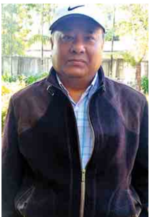
ရှမ်းပြည်နယ်ဝန်ကြီးချုပ် ဒေါက်တာလင်းထွဋ်