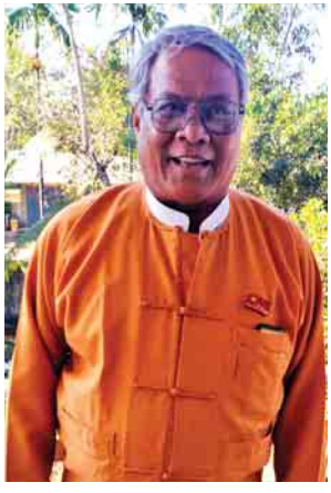
စစ်ကိုင်းတိုင်းဒေသကြီးဝန်ကြီးချုပ် ဒေါက်တာမြင့်နိုင်