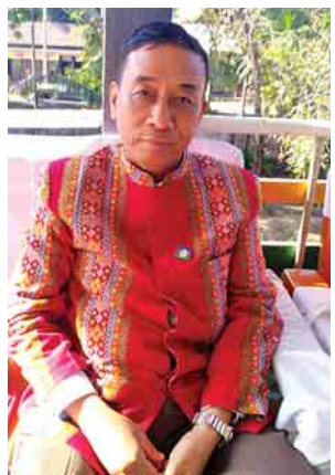
ချင်းပြည်နယ်ဝန်ကြီးချုပ် ဦးဆလိုင်းလျန်လွယ်

ကျွန်တော်တို့က မြန်မာပြည်အရေး၊ ကိုယ့်ဆွေမျိုး သားချင်းအရေးကို ပြည်တွင်းအားကိုးယူပြီး ပြန်လည်ထူထောင်ရေး လုပ်ပေးတာပါ