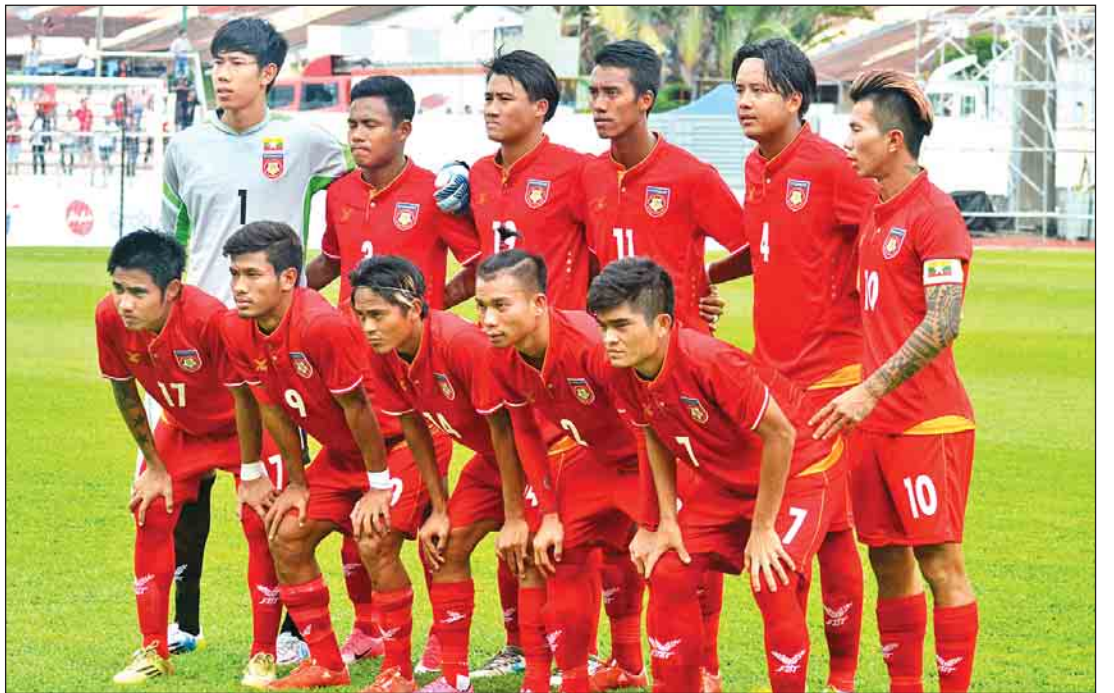
(၂၉) ကြိမ်မြောက် ဆီးရီးပြိုင်ပွဲ ယှဉ်ပြိုင်ခဲ့သည့် မြန်မာ ယူ-၂၂ အမျိုးသားအသင်း။