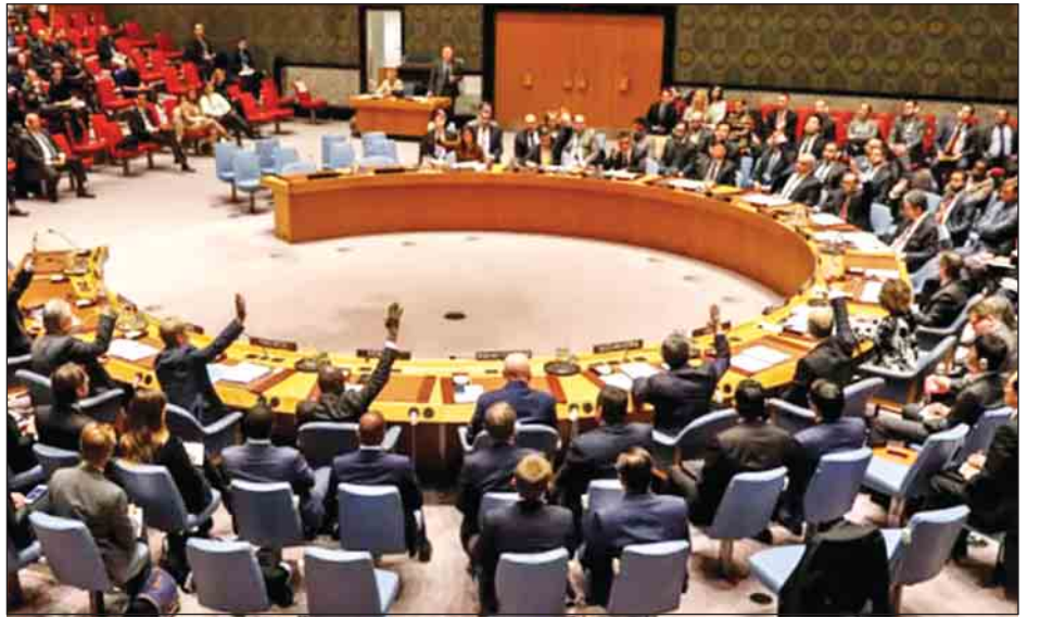
မျှော်လင့်ရကြောင်း၊ ဆုံးဖြတ်ချက်မူကြမ်းကို အတည်ပြုနိုင် ဗီတိုအာဏာသုံး၍ ပယ်ချခြင်းမရှိရန် လိုအပ်ကြောင်း ရေးအတွက် ထောက်ခံမဲကိုးမဲရရှိရန်လိုအပ်ပြီး အမေ သံတမန်များက ပြောကြားကြသည်။ ရိုက်တာ

ပြန်လည်ရုပ်သိမ်းလာစေရန်လည်းကောင်း လုံခြုံရေးကောင်စီ၏ ဆုံးဖြတ်ချက်တစ်ရပ် ပေါ်ထွက်လာသင့်သည် ဆို၏။ ကုလသမဂ္ဂလုံခြုံရေးကောင်စီ အဖွဲ့ဝင် ၁၅ နိုင်ငံထံသို့ ဖြန့်ဝေထားသော ဆုံးဖြတ်ချက်မူကြမ်းတစ်ရပ်တွင် အမေရိကန်ပြည်ထောင်စုနှင့် သမ္မတထရန်တို့ကို အတိအကျ ရည်ညွှန်းဖော်ပြထားခြင်းမရှိကြောင်း၊ အီလစ်နိုင်ငံက တင်သွင်းထားသော စာမျက်နှာ တစ်မျက်နှာပါ ဆုံးဖြတ်ချက် မူကြမ်းနှင့် ပတ်သက်၍ ကျယ်ကျယ်ပြန့်ပြန့် ထောက်ခံမှုရရှိနိုင်သော်လည်း အမေရိကန်အစိုးရအဖွဲ့က ဗီတိုအာဏာဖြင့် ပယ်ချဖယ်ရှားကြောင်း သံတမန်များက ပြောကြားကြသည်။ အဆိုပါ ဆုံးဖြတ်ချက်မူကြမ်းနှင့် ပတ်သက်၍ ယခု ရက်သတ္တပတ်တွင် လုံခြုံရေးကောင်စီက မဲပေးမည်ဟု