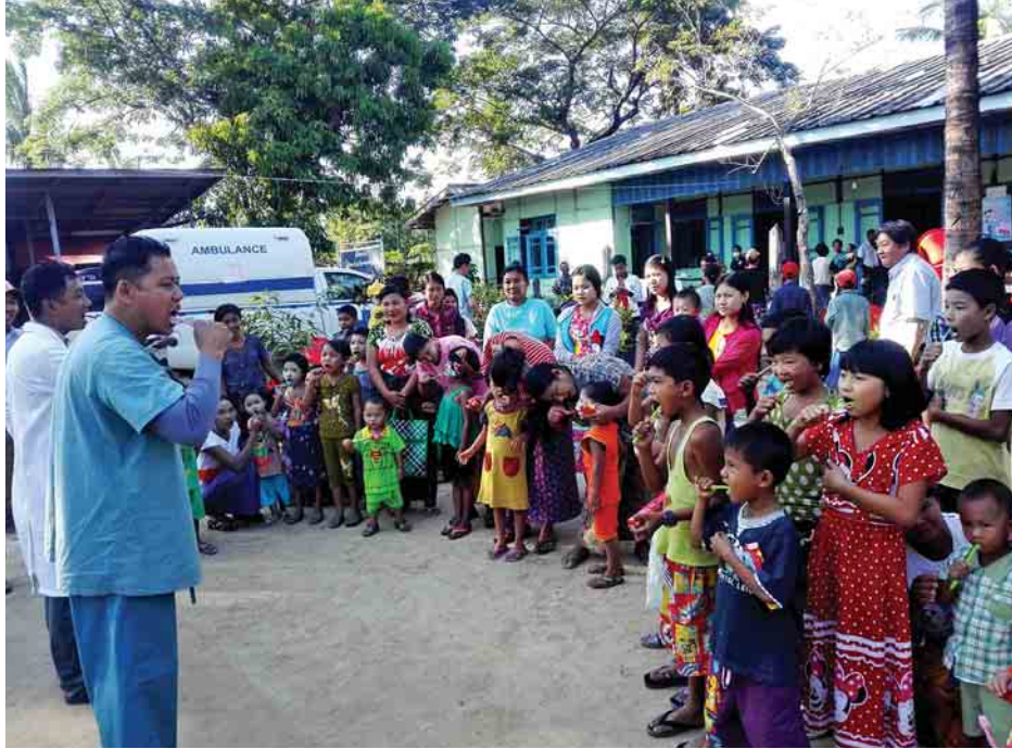
တယ်၊ သွားပိုးစား ရောဂါတွေ၊ သွားဖုံးရောင် ရောဂါတွေ ဖြစ်ရတဲ့ အဓိကအကြောင်းအရင်းက နည်းစနစ်မှန်တဲ့ သွားတိုက်နည်းမသိလို့ပါ။ တချို့ဆိုရင် လုံးဝသွားမတိုက်ကြ

အဆိုပါ ဆရာဝန်အဖွဲ့တွင် ကျန်းမာရေးနှင့် အားကစားဝန်ကြီးဌာနမှ ဆရာဝန်များ၊ မြန်မာနိုင်ငံ သွားနှင့်ခံတွင်း ဆေးကောင်စီမှ ပြင်ပဆရာဝန်များ၊ ရခိုင်ပြည်နယ် ပြည်သူ့ကျန်းမာရေးဦးစီးဌာနမှ ဆရာဝန် များ စုစုပေါင်းဆရာဝန် ၁၂ ဦး ပါဝင်ကြောင်း သိရသည်။ “ကုသတာနဲ့စာရင် ကာကွယ်တာကို ဦးစားပေးလိုပါ