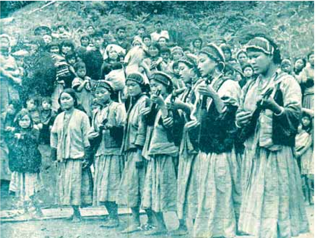
ကြည့်ဖွဲ့ခေါ် ဗျပ်စောင်းကိုယ်စီတီးမှုတ်ရင်း ဝက်ကီအကကို ကခုန်နေကြသော လီဆူလုံမပျိုတစ်စု။

လီဆူအမျိုးသားတို့အဝတ်အစားမှာ ဘောင်းဘီနှင့် အပေါ် ကုတ်အင်္ကျီကဲ့သို့ အဝတ်အစားကို ဝတ်လေ့ရှိသည်။ ထိုအဝတ်အစားပေါ်မှ အင်္ကျီရှည်ဖားဖား ထပ်ဝတ်သေးသည်။ ခါးတွင် ခါးပတ်တစ်မျိုးမျိုး ပတ်ထားသည်။ ဦးခေါင်းတွင် အပြာနက်ရောင် ခေါင်းပေါင်းပေါင်း၍ အချို့ သားရေခွံကို ဦးထုပ်လုပ်ဆောင်းတတ်သည်။ လီဆူ အမျိုးသား များတွင် ဆောင်းလေ့ရှိသောအရာမှာ သစ်သားစားလွယ်အိမ်ဖြင့် အရှည် လေးပေခန့်ရှိသည့် ဓားတစ်ချောင်း၊ ဒူးလေးတစ်လက်နှင့် ဝါးဖြင့်ပြုလုပ် ထားသော မြားတံအိမ်တို့ဖြစ်သည်။ အထူးကဏ္ဍ [ ၀ ] သို့ >>>