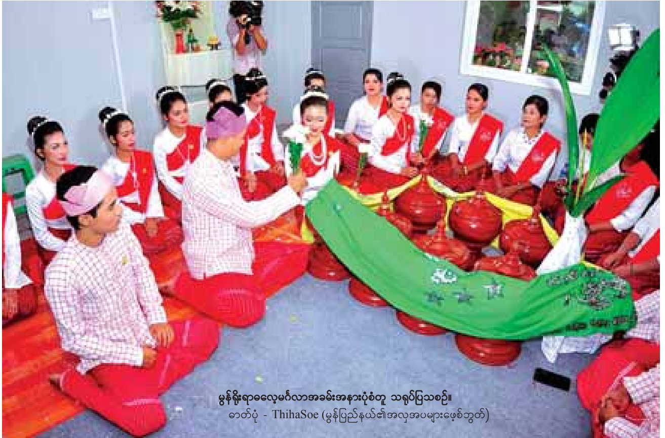
မွန်ရိုးရာဓလေ့မင်္ဂလာအခမ်းအနားပုံစံတူ သရုပ်ပြသစဉ်။

မွန်ယောက်ျားပျိုများသည် မွန်အချောအလှမလေးများ၏ ဘဝ ကြင်ဖော်မြစ်နိုင်ရန် ကြိုးစားကြရာဝယ် သမီးရှင်မိဘတို့၏ စမ်းသပ်မှု ခံယူရမည်ကို သဘောပေါက်နားလည်ပြီးသားဖြစ်သည်။ ပြင်လည်း ပြင်ဆင်ထားကြသည်သာပင်။ အထူးကဏ္ဍ [ ၁ ] သို့ >>>