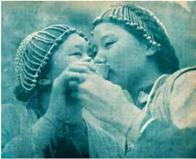
တစ်ဦးနှင့်တစ်ဦး ချစ်ခင်ရင်းနှီးသည့်သဘောဖြင့် ပါးစပ်ချင်းတောက်ကာ ခွက်တစ်ခွက်တည်း နှင့် ခေါင်ရည်အတူသောက်သော လီဆူတိုင်းရင်းသားတို့၏လေ့ထုံးစံ။ ဓာတ်ပုံ - ယိမ်းနွဲ့ပါး

လက်ထပ်သောအချိန်တွင် သတို့သမီး အား သတို့သားဘက်မှ အမျိုးသမီးဆွေမျိုး များ ခြံရံ၍ သတို့သားအိမ်သို့ ခေါ်ဆောင်လာရ သည်။ လက်ထပ်ပြီးသော နောက်တစ်နေ့ တွင် ဆွေမျိုးမိတ်သင်္ဂဟတို့ကို ဖိတ်၍ကျွေးမွေး ရသည်။ ရက်အနည်းငယ်ကြာသောအခါ ညားခါစလင်မယားသည် မိန်းကလေး၏ မိဘများအိမ်သို့ အလည်သွားကာ ကျွေးမွေး ဧည့်ခံရပြန်သည်။ ထို့ကြောင့် လီဆူတို့၏ မင်္ဂလာပွဲသည် အကုန်အကျများသည်ဟု ဆိုနိုင်သည်။ မိန်းကလေးသည် သူ၏ အမျိုးသားအိမ်တွင် သားဦးမွေးဖွားသည်အထိ နေရသည်။ သားဦးမွေးဖွားပြီးမှ အိမ်သစ် ဆောက်၍ အိုးခွဲရသည်။ ရှေးအခါက မိဘ များ သဘောတူမှ လက်ထပ်နိုင်ကြပြီး