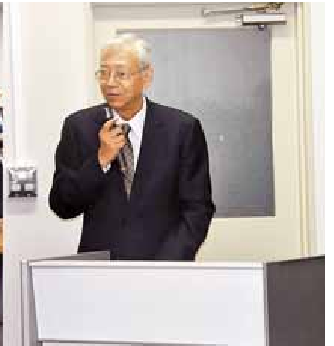
အိုဆာကာတက္ကသိုလ်၌ ကျင်းပသည့် မြန်မာစာပေဆု ဆရာ ဆရာမများ၊ ကျောင်းသား ကျောင်းသူများနှင့် တွေ့ဆုံပွဲအခမ်းအနားတွင် နိုင်ငံတော်သမ္မတ ဦးထင်ကျော် လမ်းညွှန်အမှာစကားပြောကြားစဉ်။

ရွှေဖုံးမှ ပါမောက္ခများသည် အမှတ်တရလက်ဆောင်ပစ္စည်းများ အပြန်အလှန်ပေးအပ်ကြသည်။ ဆက်လက်၍ အဆိုပါတက္ကသိုလ်၌ ကျင်းပသည့် အိုဆာကာတက္ကသိုလ် မြန်မာစာပေဆု ဆရာ ဆရာမများ၊ ကျောင်းသား ကျောင်းသူများ၊ မြန်မာနိုင်ငံမှ ပညာတော် သင် ကျောင်းသား ကျောင်းသူများနှင့် တွေ့ဆုံပွဲအခမ်း အနားသို့ တက်ရောက်သည်။