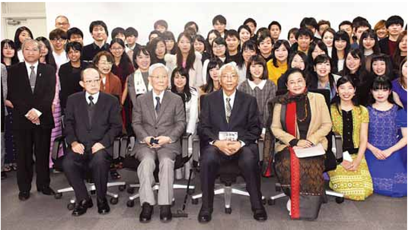
နိုင်ငံတော်သမ္မတ ဦးထင်ကျော်နှင့် ဇနီးတို့ အိုဆာကာ တက္ကသိုလ်မှ ပါမောက္ခများ၊ မြန်မာစာဌာနမှ ဆရာ ဆရာမများ၊ ကျောင်းသား ကျောင်းသူများနှင့်အတူ မှတ်တမ်းတင်ဓာတ်ပုံရိုက်ကြစဉ်။