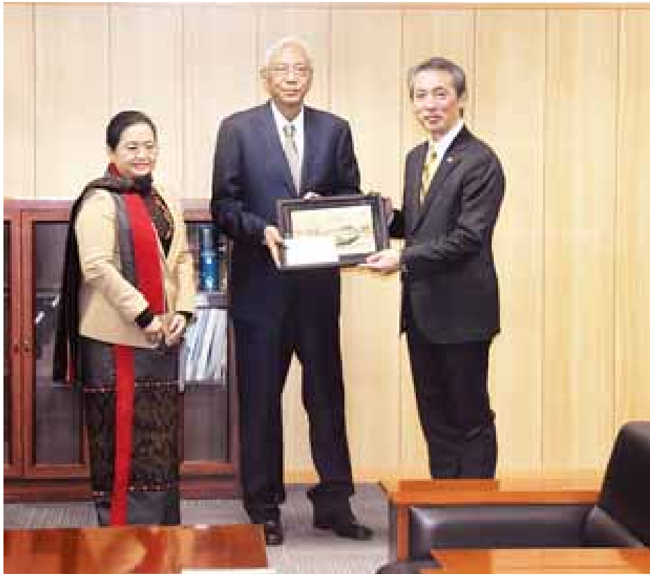
နိုင်ငံတော်သမ္မတ ဦးထင်ကျော်နှင့် အိုဆာကာတက္ကသိုလ်မှ ပါမောက္ခတစ်ဦးတို့ အမှတ်တရလက်ဆောင်များ အပြန်အလှန်ပေးအပ်ကြစဉ်။

လုပ်ငန်းများကို နေ့စဉ်ဆောင်ရွက်လျက်ရှိကြောင်း၊ ၁၉၉၄ ခုနှစ်၌ ကမ္ဘာ့ရှေးဟောင်းအမွေအနှစ်တွင် စာရင်းသွင်း အသိအမှတ်ပြုခြင်း ခံခဲ့ရကြောင်း သိရသည်။ ညနေပိုင်းတွင် နိုင်ငံတော်သမ္မတနှင့် ဇနီးတို့သည် ခေတ္တတည်းခိုမည့် Kyoto State Guest House သို့ ရောက်ရှိကြသည်။ ညပိုင်းတွင် နိုင်ငံတော်သမ္မတနှင့် ဇနီးတို့သည် Wisteria Flower Room သို့ရောက်ရှိ၍ Governor Mr.Keiji Yomada, Mayor of Kyoto Prefecture and member of Kyoto Chamber of Commerce