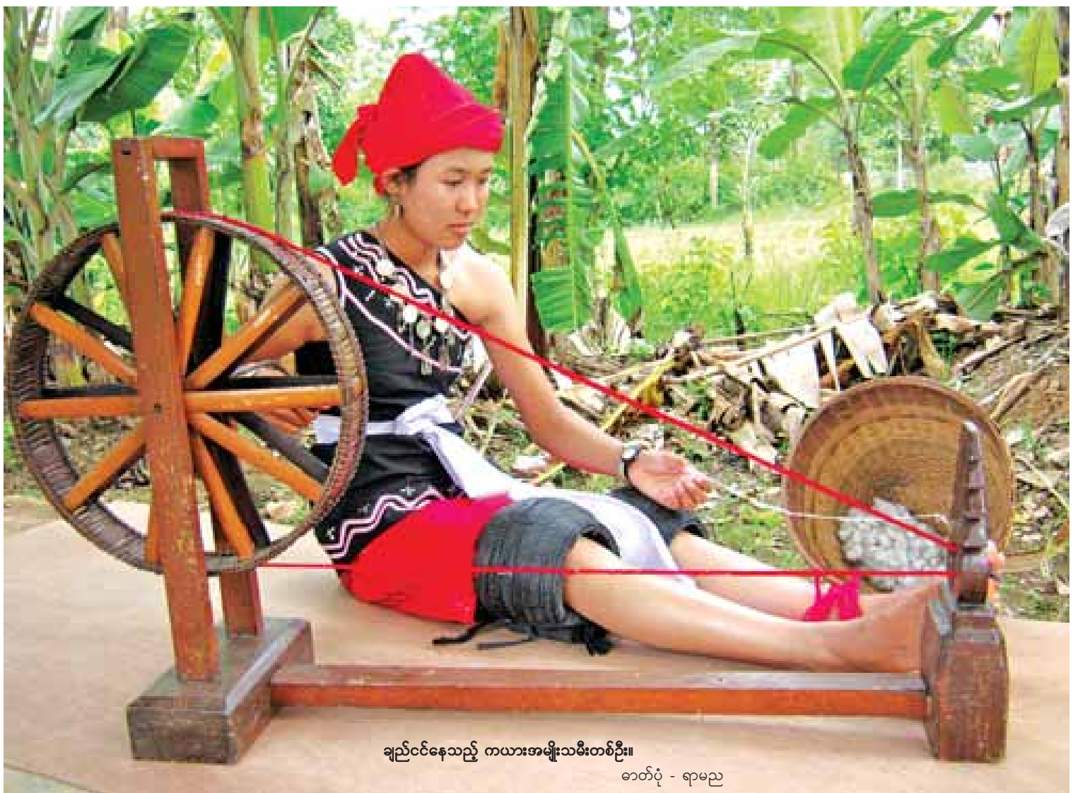
ချည်ငင်နေသည့် ကယားအမျိုးသမီးတစ်ဦး။