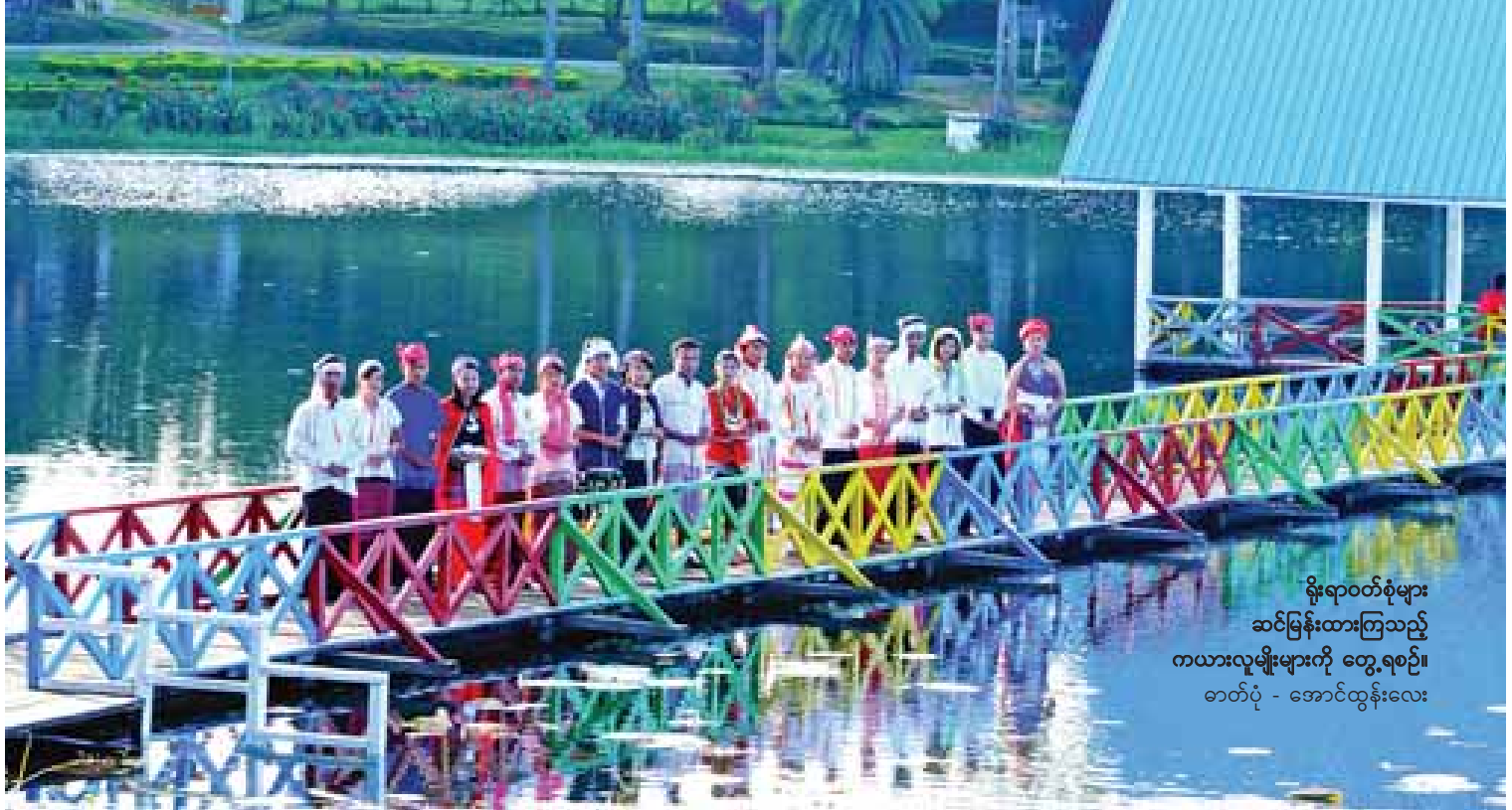
ရိုးရာဝတ်စုံများ ဆင်ခြန်းထားကြသည့် ကယားလူမျိုးများကို တွေ့ရစဉ်။

ယနေ့ခေတ်တွင် ကယားအမျိုးသမီး များသည် ကန့်လန့်စင်းအဆင့်လုံ့ချည်ကို အရောင်အမျိုးမျိုး ရက်လုပ်ဝတ်ဆင်လာကြ သည်ကို တွေ့ရသည်။ ထာဝီအရောင်နှင့် လိုက်ဖက်မှုရှိသည့် အင်္ကျီ၊ ခါးစည်းနှင့် ခြုံထည်များကို ဘော်ကြယ်များဖြင့် အလှဆင် တီထွင်ချုပ်လုပ်ဝတ်ဆင်ကြသည်။ ။