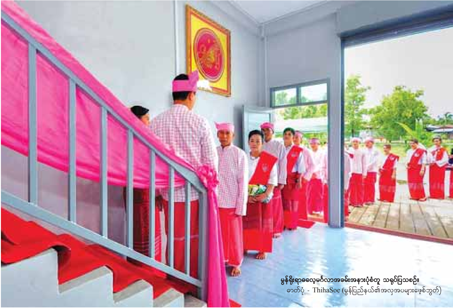
မွန်ရိုးရာလေ့ထုံးစံအရ အခမ်းအနားပွဲတို့ သရုပ်ပြသစဉ် (မွန်ပြည်နယ်၏အလှအပများဖော်စဉ်)