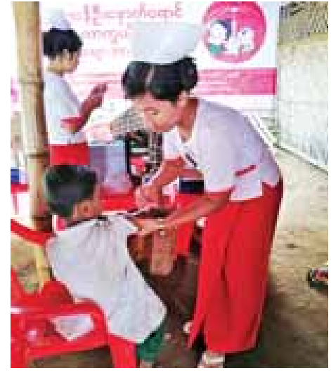
မြင့်မောင်၊ ဝေဇယျာ

ဘူးသီးတောင်ဒေသတွင် နယ်မြေအခြေအနေကြောင့် ကျေးရွာများအရောက် ကာကွယ်ဆေးထိုးပေးရန် အခက်အခဲများစွာရှိခဲ့သော်လည်း ကျန်းမာရေးဝန်ထမ်းများ၏ ရဲဝံ့စွန့်စားမှု၊ ဝိုင်းဝန်းကြိုးပမ်းမှုတို့ကြောင့် ကာကွယ်ဆေးထိုးလုပ်ငန်းကို ထိရောက်စွာ ဆောင်ရွက်နိုင်ခဲ့ကြောင်း သိရသည်။