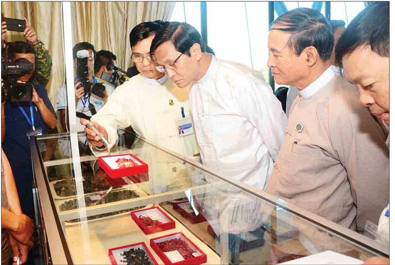
ဒုတိယသမ္မတ ဦးဟင်နရီဗန်ထီးယူ မြန်မာ့ကျောက်မျက်ရတနာပြပွဲအတွင်း ခင်းကျင်းပြသထားသည့် ကျောက်မျက်ရတနာ ပြခန်းများနှင့် ကျောက်မျက်ရတနာ အရောင်းဆိုင်များကို လှည့်လည်ကြည့်ရှုစဉ်။

တတိယအကြိမ် အာရှ-ပစိဖိတ် ရေညီလာခံ အောင်မြင်စွာ ကျင်းပပြီးစီး စာမျက်နှာ - ၃