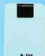
A-Jax Power Bank 10,400 mAh