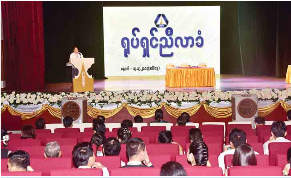
ပြည်ထောင်စုဝန်ကြီး ဒေါက်တာဖေမြင့် ရုပ်ရှင်ညီလာခံဖွင့်ပွဲအခမ်းအနားတွင် အမှာစကားပြောကြားစဉ်။

ရုပ်ရှင်အနုပညာသည် လူအများ၏ စိတ်ကို နည်းလမ်းပေါင်းစုံဖြင့် ဆွဲဆောင်နိုင်သည့် အနုပညာတစ်ရပ်ဖြစ်ပါကြောင်း၊ လူ၏နှလုံးသားကို တိုက်ရိုက် ထိမှန်စေသည့် အားကောင်းသည့် အနုပညာဖြစ်သည့် အလျောက် ပရိသတ်အပေါ် သက်ရောက်မှု အလွန်ကြီးမားပါကြောင်း၊ ၂၀၁၇ ခုနှစ် မတ် ၁၈ ရက်က ကျင်းပခဲ့သည့် ၂၀၁၆ ခုနှစ်အတွက် မြန်မာ့ရုပ်ရှင်ထူးချွန်ဆုချီးမြှင့်ပွဲ အခမ်းအနားသို့ ပေးပို့ခဲ့သည့် နိုင်ငံတော်၏အတိုင်ပင်ခံ ပုဂ္ဂိုလ် ဒေါ်အောင်ဆန်းစုကြည်၏ သဝဏ်လွှာတွင် ရုပ်ရှင်ဇာတ်ကားများက လူ့အဖွဲ့အစည်းကို အထူးသဖြင့် လူငယ်လူရွယ်များအပေါ် အင်မတန် ဩဇာကြီးသောကြောင့် ရုပ်ရှင်လောကသားများ၏ တာဝန်သည် အလွန်ကြီးမားသည်ကို သုံးသပ်ပြောဆိုခဲ့ခြင်းများ ရှိပါကြောင်း၊ ရုပ်ရှင်လောကသားများအနေဖြင့် မြန်မာ့လူ့ဘောင်အဖွဲ့အစည်းကို မြှင့်တင်ပေးနိုင်မည့် အနုပညာရှင်များဖြစ်အောင် စွမ်းဆောင်ကြရန် တိုက်တွန်းသွားသည်ကို တွေ့ရပါကြောင်း။