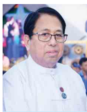
ပြည်ထောင်စုဝန်ကြီး ဒေါက်တာဖေမြင့်

စာပေညီလာခံ (၂၀၁၇) ကျင်းပရေးကော်မတီဥက္ကဋ္ဌ စာပေညီလာခံ ကျင်းပတဲ့အခါမှာ အနယ်နယ်အရပ်ရပ်က စာရေးဆရာကြီးတွေ၊ စာပေပညာရှင်တွေ ပါတယ်။ စာပေစကားပိုင်း ၅၅ ဖွဲ့နဲ့ ကျွန်တော်တို့ ဆွေးနွေးကြတယ်။ အဲဒီကနေ ကျွန်တော်တို့ ဆွေးနွေးကြတဲ့