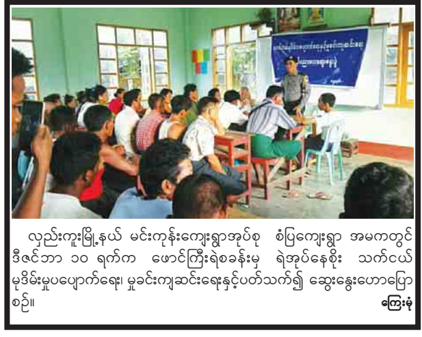
လှည်းကူးမြို့နယ် မင်းကုန်းကျေးရွာအုပ်စု စံပြကျေးရွာ အမတ်တွင် ဒီဇင်ဘာ ၁၀ ရက်က ဖောင်ကြီးရဲစခန်းမှ ရဲအုပ်နေစိုး သက်ငယ် မုဒိမ်းမှုပျောက်ရေး၊ မှုခင်းကုဆင်းရေးနှင့်ပတ်သက်၍ ဆွေးနွေးဟောပြောစဉ်။