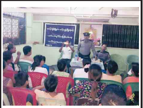
ရန်ကုန်တိုင်းဒေသကြီး သယံဇာတနှင့်သိုလှေရေးဦးစီးဌာနမှ ရုံးတွင် မှုခင်းအသိပညာပေးဟောပြောပွဲကိုဒီဇင်ဘာ ၈ ရက်က ပြုလုပ်ရာ မြို့နယ်ရဲတပ်ဖွဲ့မှူး၊ ရဲမှူးကိုဦးက အသိပညာပေးဟောပြောစဉ်။