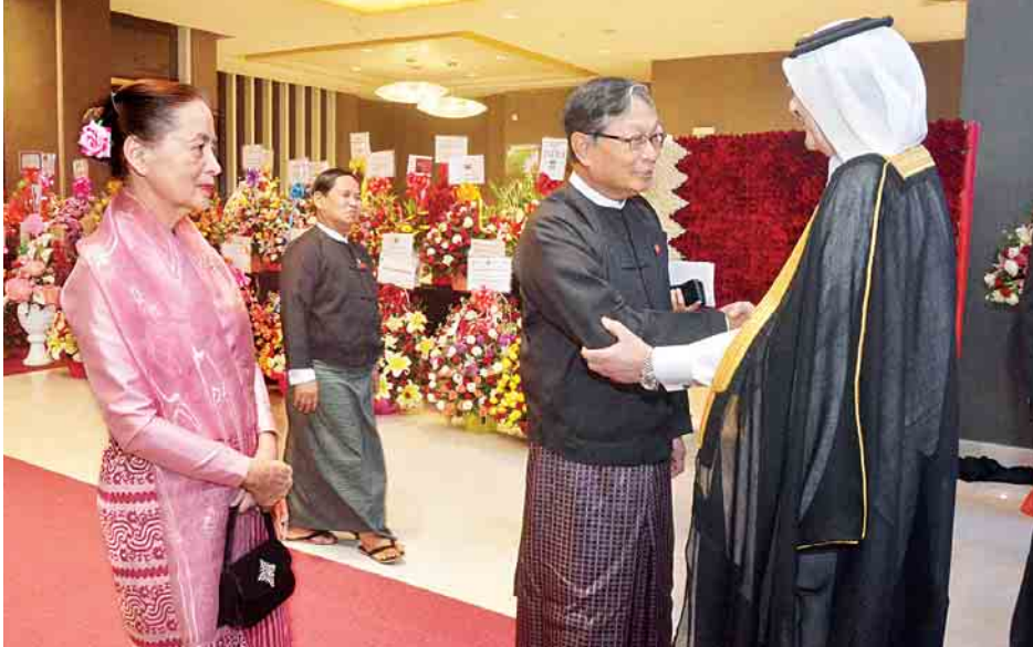
ရွက်ရေးဝန်ကြီးဌာန ပြည်ထောင်စု ဝန်ကြီး ဦးကျော်တင်၊ ရန်ကုန်တိုင်း ဒေသကြီးဝန်ကြီးချုပ် ဦးဖြိုးမင်းသိန်း တော်များ တက်ရောက်ကြသည်။

ရန်ကုန် ဒီဇင်ဘာ ၁၂ ကာတာနိုင်ငံ၏ အမျိုးသားနေ့ အထိမ်းအမှတ် ညွှန်ပုံအခမ်းအနား ကို ယနေ့ ည ၇ နာရီတွင် ရန်ကုန်မြို့ နိုင်ငံတော်တော်ဝင် နေရာတွင် ကျင်းပသည်။ ညွှန်ပုံအခမ်းအနား အတွက် နိုင်ငံတော်အတွင်းပင် ခံရုံးဝန်ကြီးဌာန ပြည်ထောင်စုဝန်ကြီး ဦးကျော်တင်ဆွေနှင့် ဇနီး ဒေါ်မေယဉ် ထွန်းတို့ တက်ရောက်ကြရာ မြန်မာနိုင်ငံဆိုင်ရာ ကာတာနိုင်ငံ သံအမတ်ကြီး H.E.Mr. Hassan Bin Mohamed Rafei AL Emadi က ကြိုဆိုနှုတ်ဆက်သည်။ ကာတာနိုင်ငံ အမျိုးသားနေ့အထိမ်း အမှတ် ညွှန်ပုံအခမ်းအနားတွင် ပြည်ထောင်စု မြန်မာနိုင်ငံတော်သီချင်း နှင့် ကာတာနိုင်ငံတော်သီချင်းတို့ဖြင့် အခမ်းအနားကို စတင်ဖွင့်လှစ်သည်။ အဆိုပါ အခမ်းအနားသို့ အပြည်ပြည်ဆိုင်ရာ ပူးပေါင်းဆောင်