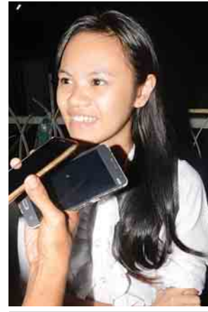
မဖူးဝေစိုး

တွေကိုလည်း နားထောင်စေချင်တယ်။ စာပေဟောပြောပွဲတွေ လာနားထောင်တဲ့အတွက်လည်း ကိုယ်မသိတာတွေ တစ်လုံးမှတ်မိမှတ်မိပေါ့။ ငါးညဟောပြောရင် ငါးလုံး မှတ်မိမယ်။ အဲဒီလိုစိတ်မျိုးလေးနဲ့ လာနားထောင်စေချင်ပါတယ်။ MCC ခန်းမမှာလုပ်မယ့် စာပေညီလာခံဆွေးနွေးပွဲမှာလည်း စာပေသမားကလည်း စာပေဘက်ကသိသလို စာဖတ်သူတွေဘက်ကလည်း စာဖတ်သူတွေအနေနဲ့ သိတဲ့အသိ အဲဒါတွေကို ဆွေးနွေးခွင့်ပေးမယ်ဆိုတာ သိရတော့ အလွန်