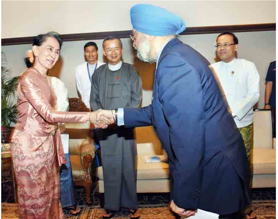
နိုင်ငံတော်၏အတိုင်ပင်ခံပုဂ္ဂိုလ် ဒေါ်အောင်ဆန်းစုကြည် အိန္ဒိယသမ္မတနိုင်ငံမှ Minister of state and Housing and Urban Affairs H.E. Hardeep Singh Puri အား တွေ့ဆုံနှုတ်ဆက်စဉ်။