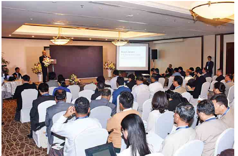
တတိယအကြိမ် အာရှ-ပစိဖိတ် ရေညီလာခံတွင် အခန်းကဏ္ဍအလိုက် ဆွေးနွေးပွဲများ ကျင်းပစဉ်။