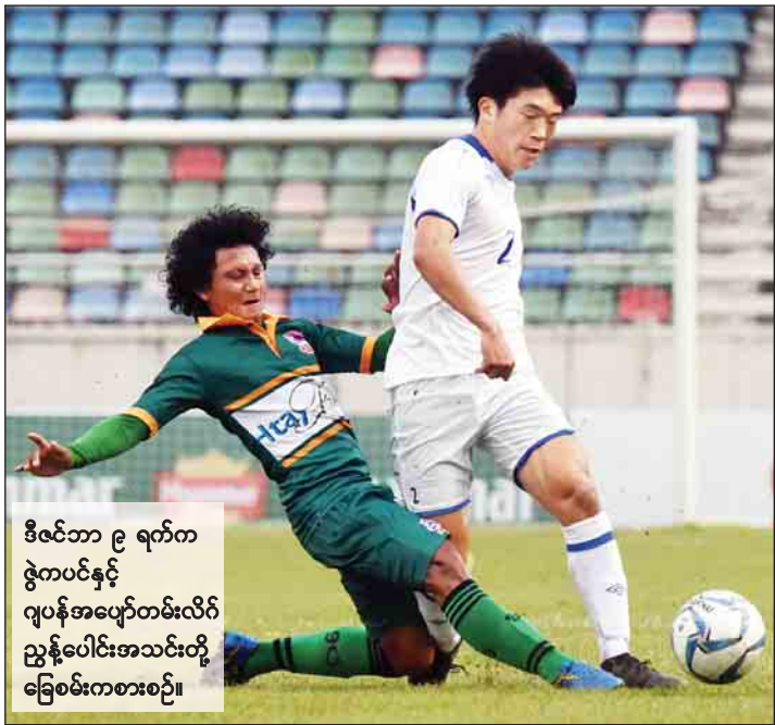
ဒီဇင်ဘာ ၉ ရက်က ဇွဲကပင်နှင့် ဂျပန်အပျော်တမ်းလိဂ် ညွှန်ပေါင်းအသင်းတို့ ခြေစမ်းကစားစဉ်။

ရန်ကုန် ဒီဇင်ဘာ ၁၁ မြန်မာနိုင်ငံတွင် ခြေစမ်းပွဲများ ယှဉ်ပြိုင်ကစားရန် ရောက်ရှိ နေသည့် ဂျပန်အပျော်တမ်းလိဂ် ညွှန်ပေါင်းအသင်းသည် ခြေစမ်းပွဲဒုတိယပွဲအဖြစ် ဒီဇင်ဘာ ၁၂ ရက်(ယနေ့) ညနေ ၃ နာရီခွဲတွင် MNL ကလပ် မကွေးအသင်းနှင့် ယှဉ်ပြိုင်ကစားမည် ဖြစ်သည်။ ဂျပန်အပျော်တမ်းလိဂ် ညွှန်ပေါင်းအသင်းသည် မြန်မာ နိုင်ငံတွင် ခြေစမ်းပွဲ သုံးပွဲ လာရောက်ကစားခြင်းဖြစ်ပြီး ဒီဇင်ဘာ ၉ ရက်တွင် ကစားခဲ့သည့် ပထမခြေစမ်းပွဲတွင် MNL ကလပ် ဇွဲကပင်အသင်းကို စာမျက်နှာ ၁၁ ကော်လံ ၅ သို့ ○