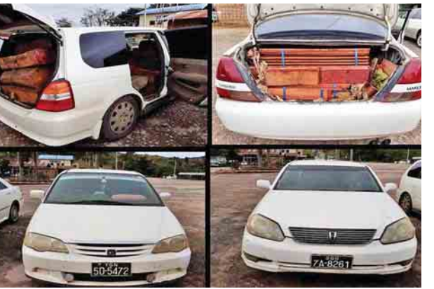
တရားမဝင်စာရွက်စာတမ်း အထောက်အထား တစ်စုံတစ်ရာ တင်ပြ နိုင်ခြင်းမရှိသည့် ပိတောက်ဓားရွှေသစ်နှင့် ပစ္စည်းသယ်ဆောင်သည့်ယာဉ်များ။