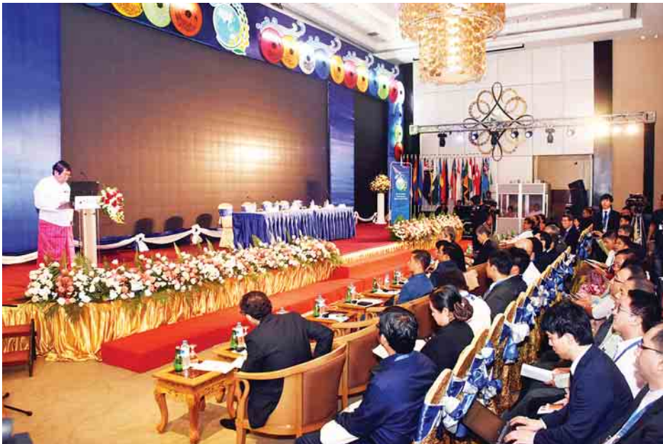
တတိယအကြိမ် အာရှ-ပစိဖိတ် ရေညီလာခံတွင် အခန်းကဏ္ဍအလိုက် ဆွေးနွေးပွဲများ ကျင်းပစဉ်။