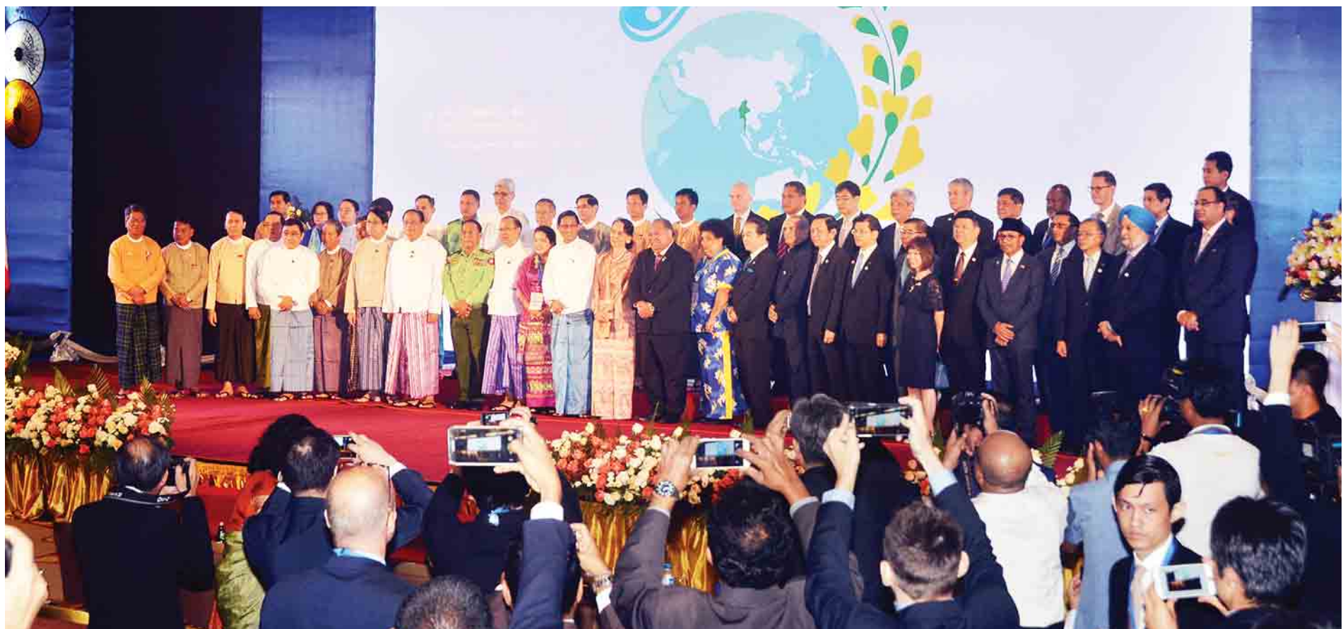
နိုင်ငံတော်၏အတိုင်ပင်ခံပုဂ္ဂိုလ် ဒေါ်အောင်ဆန်းစုကြည်နှင့် ညီလာခံသို့တက်ရောက်လာကြသည့် အာရှ-ပစိဖိတ်ဒေသတွင်း ၄၈ နိုင်ငံမှ ကိုယ်စားလှယ်များ စုပေါင်းမှတ်တမ်းတင်ဓာတ်ပုံရိုက်ကြစဉ်။

★ ရှေ့ဖူးမှ ကောင်းမွန်သည့် အတွေ့အကြုံများဖလှယ်ခြင်း၊ ဘက်စုံ ရေစီမံခန့်ခွဲမှုအတွက် အကြံဉာဏ်ကောင်းများ ဖော်ထုတ်ခြင်းတို့အတွက် အခွင့်အရေးကောင်းတစ်ခု ဖြစ်ပါကြောင်း။