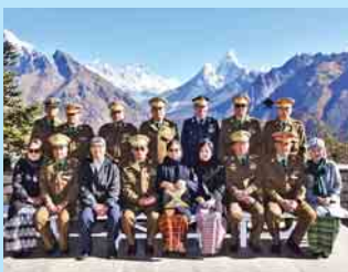
စာမျက်နှာ >> ၇

တပ်မတော်ကာကွယ်ရေးဦးစီးချုပ် ဗိုလ်ချုပ်မှူးကြီး မင်းအောင်လှိုင် ဝေရက်တောင်ထိပ်နှင့် ဟိမဝန္တာတောင်တန်းများအား ကြည့်ရှုလေ့လာ