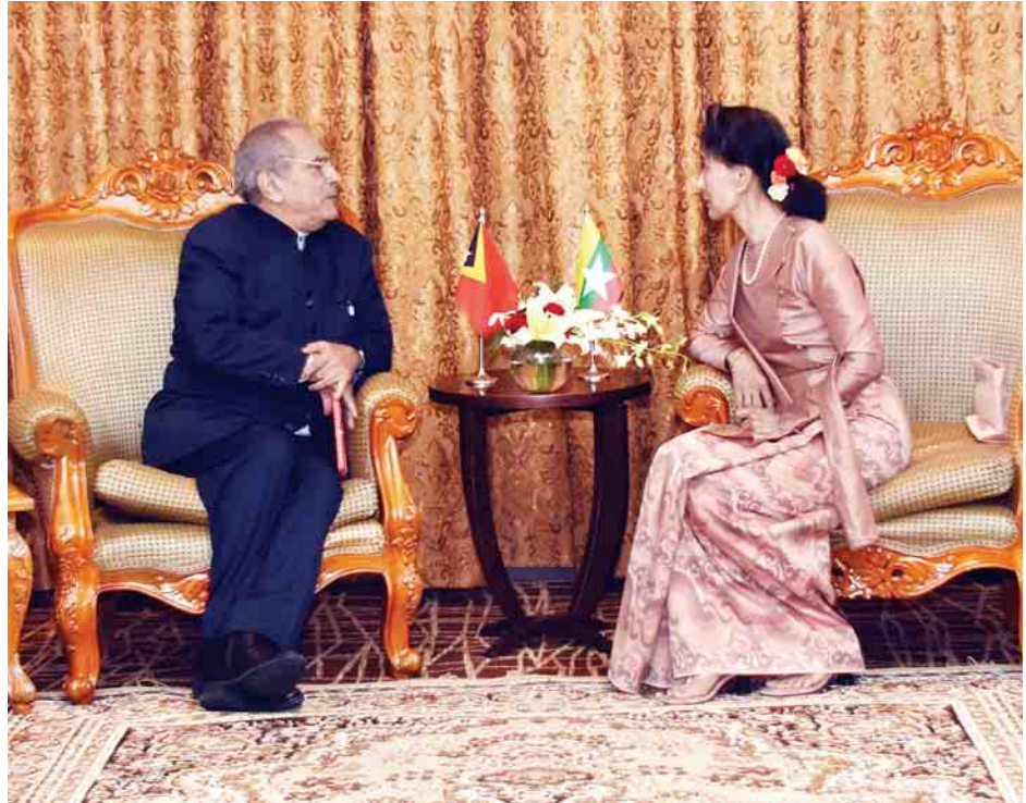
နိုင်ငံတော်၏အတိုင်ပင်ခံပုဂ္ဂိုလ် ဒေါ်အောင်ဆန်းစုကြည် တီမောလက်စ်တေ ဒီမိုကရက်တစ် သမ္မတနိုင်ငံမှ Senior Minister and National Security Advisor, Former President H.E. Mr. Jose Ramos - Horta အား ဆီဒိုးနားဟိုတယ်၌ လက်ခံတွေ့ဆုံစဉ်။