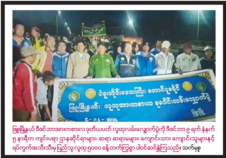
မြို့မမြို့နယ် ဒီဇင်ဘာအားကစားလူ့ဝန်ထမ်းလှူဒါန်းပွဲကို ဒီဇင်ဘာ ၉ ရက် နံနက် ၅ နာရီက ကျင်းပရာ ဌာနဆိုင်ရာများ၊ ဆရာ ဆရာမများ၊ ကျောင်းသား ကျောင်းသူများနှင့် ရပ်ကွက်အသီးသီးမှ ပြည်သူ လူထု ၅၀၀၀ ခန့် တက်ကြွစွာ ပါဝင်ဆင်နွှဲကြသည်။ သက်မှူး