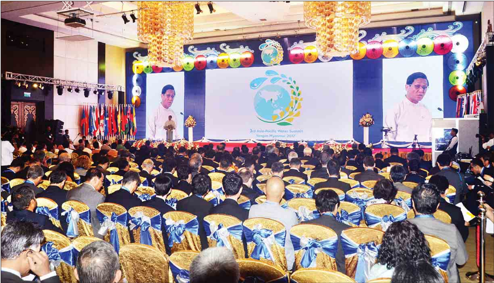
တတိယအကြိမ် အာရှ-ပစိဖိတ်ရေညီလာခံတွင် အမျိုးသားအဆင့် ရေအရင်းအမြစ်ကော်မတီဥက္ကဋ္ဌ ဒုတိယသမ္မတ ဦးဟင်နရီဗန်ထီးယူ တက်ရောက်အမှာစကားပြောကြားစဉ်။

ရန်ကုန် ဒီဇင်ဘာ ၁၁ မြန်မာနိုင်ငံက အိမ်ရှင်အဖြစ် လက်ခံကျင်းပသည့် တတိယအကြိမ် အာရှ-ပစိဖိတ်ရေညီလာခံ (The 3 rd Asia-Pacific Water Summit-3 rd APWS) ကို ယနေ့နံနက် ၁၁ နာရီက ရန်ကုန်မြို့ ဆီဒိုးနားဟိုတယ်၌ ကျင်းပသည်။ ရှေးဦးစွာ အမျိုးသားအဆင့် ရေအရင်းအမြစ် ကော်မတီဥက္ကဋ္ဌ၊ ဒုတိယသမ္မတ ဦးဟင်နရီဗန်ထီးယူ က အမှာစကားပြောကြားရာတွင် ရေသည် အသက်ရှင်သန်မှုနှင့် ဂုဏ်သိက္ခာအပြင် အစားအစာ ထုတ်လုပ်ရေး၊ ရေကြောင်းဆက်သွယ်ရေး၊ ရေအားလျှပ်စစ်ထုတ်လုပ်ရေး၊ စက်ရုံသုံး အိမ်သုံးများအတွက် လည်းကောင်း၊ ငါးဖမ်းလုပ်ငန်းများ အတွက်လည်းကောင်း၊ ခရီးသွား လုပ်ငန်းများ အစရှိသည့် စီးပွားရေး လုပ်ငန်းအမျိုးမျိုးအတွက် အသွင် အမျိုးမျိုးဖြင့် ဝင်ငွေရနိုင်စေသည့် အရင်းအမြစ်တစ်ခု ဖြစ်ကြောင်း၊ မိမိတို့၏ အသက်ရှင်ဖြစ်တည်မှု၊ ယဉ်ကျေးမှုနှင့် သဘာဝပတ်ဝန်းကျင် ၏ အခြေခံကျသော အစိတ် အပိုင်းတစ်ခုလည်း ဖြစ်ပါကြောင်း၊ စာမျက်နှာ ၉ ကော်လံ ၁ သို့ *