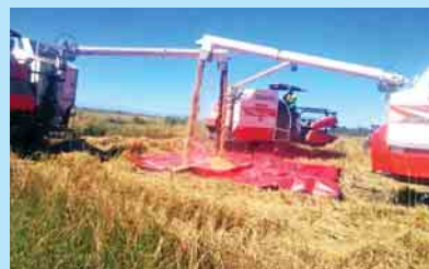
စာမျက်နှာ >> ၁၀

စက်မှုလယ်ယာဦးစီးဌာနက ရခိုင်ပြည်နယ်အတွင်း မိုးစပါးရိတ်သိမ်းခြွေလှေ့ခြင်း လုပ်ငန်းဆောင်ရွက်လျက်ရှိ