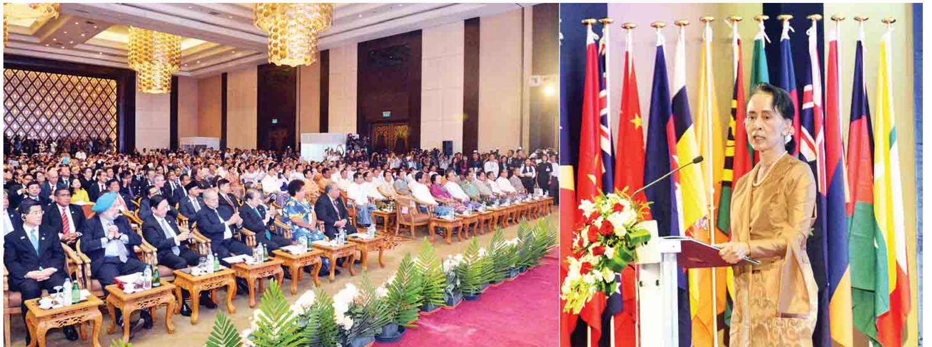
နိုင်ငံတော်၏အတိုင်ပင်ခံပုဂ္ဂိုလ် ဒေါ်အောင်ဆန်းစုကြည် တတိယအကြိမ် အာရှ-ပစိဖိတ် ရေညီလာခံဖွင့်ပွဲအခမ်းအနားတွင် အမှာစကားပြောကြားစဉ်။

ယခု ညီလာခံသည် ရေနှင့်ဆက်နွယ်သည့် လုပ်ငန်းများမှ ရရှိခဲ့သော စာမျက်နှာ ၃ ကော်လံ ၁ သို့