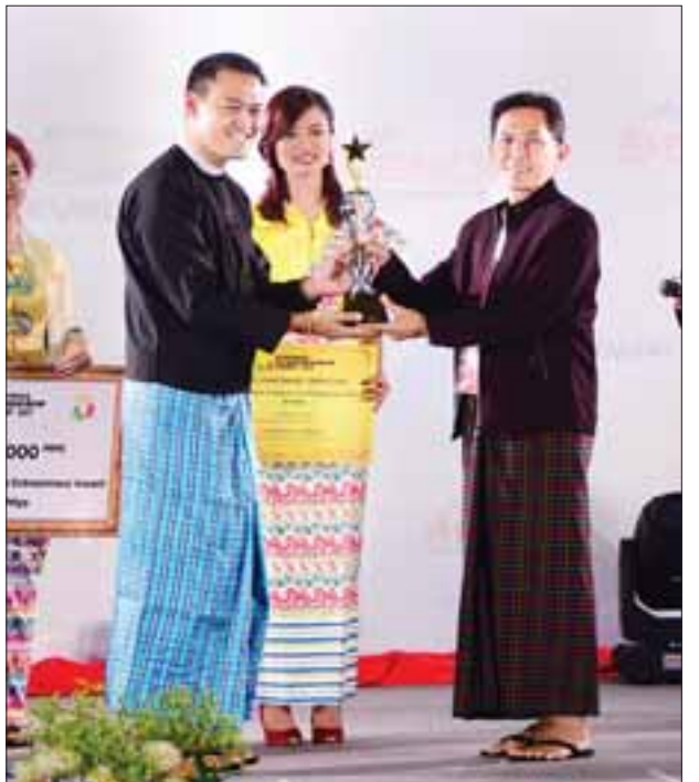
The Myanmar Young Social Entrepreneur Award ရရှိသူ တစ်ဦးအား တာဝန်ရှိသူမှ ဆုချီးမြှင့်စဉ်။