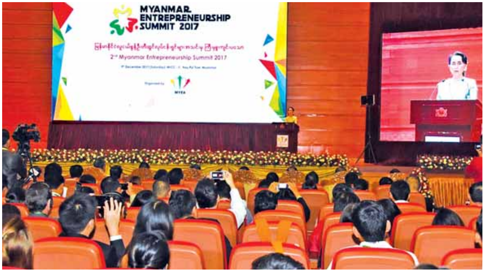
ဒုတိယအကြိမ် မြန်မာနိုင်ငံ လူငယ်စွန့်ဦးတီထွင်လုပ်ငန်းရှင်များ၏ ထိပ်သီးညီလာခံ ၂၀၁၇ ဖွင့်ပွဲအခမ်းအနား ကျင်းပစဉ်။

မြန်မာနိုင်ငံလူငယ်စွန့်ဦးတီထွင်လုပ်ငန်းရှင်များအသင်းက ကြီးမှူးကျင်းပသည့် ဒုတိယအကြိမ် မြန်မာနိုင်ငံ လူငယ်စွန့်ဦးတီထွင်လုပ်ငန်းရှင်များ၏ထိပ်သီးညီလာခံ ၂၀၁၇ ဖွင့်ပွဲအခမ်းအနားကို ယနေ့နံနက် ၉နာရီတွင် နေပြည်တော်ရှိ မြန်မာအပြည်ပြည်ဆိုင်ရာ ကွန်ဗင်းရှင်းဗဟိုဌာန-၂ (MICC-II)၌ ကျင်းပရာ နိုင်ငံတော်၏အတိုင်ပင်ခံပုဂ္ဂိုလ် ဒေါ်အောင်ဆန်းစုကြည် တက်ရောက်လမ်းညွှန်အမှာစကားပြောကြားသည်။