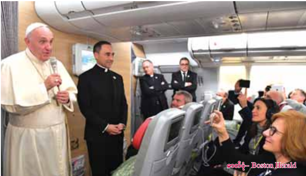
ဓမ္မိတုံ

ရန်ကုန်မြို့သို့ ကြွရောက်လာသော ပုပ်ရဟန်းမင်းကြီး လေယာဉ်ပေါ်တွင် သတင်းထောက်များနှင့် တွေ့ဆုံစဉ်။