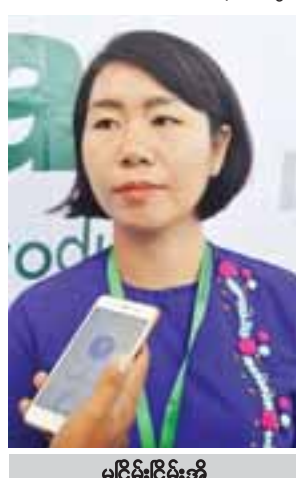
မငြိမ်းငြိမ်းအိ

သဘာဝပစ္စည်း နှစ်မျိုး သုံးမျိုးနဲ့ ပေါင်းစပ်ပြီးတော့ အလှကုန်ပစ္စည်းတွေ ထုတ်လုပ်ပေးပါတယ်။