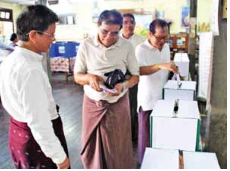
ရန်ကုန်မြို့ တာမွေမြို့နယ် ကျားကွက်သစ်ရပ်ကွက် ရပ်ကွက်အုပ်ချုပ်ရေးမှူး ပြန်လည် ရွေးချယ်ရေးအတွက် ဆယ်အိမ်စုမှ ရွေးချယ်ပွဲကို ဒီဇင်ဘာ ၉ ရက်က ကျားကွက်သစ်ရပ်ကွက် ဓမ္မဝိဟာရလမ်းရှိ သာသနာ့တဝိဇ္ဇာရုံကြီး၌ ကျင်းပရာ ရပ်ကွက်နေပြည်သူများက ဆန္ဒပြုပေးနေသည်ကို တွေ့ရစဉ်။

ဖျော်ဖြေမှုများတွင် Project -K , NYM Dancer တို့၏ အကဖျော်ဖြေမှုများလည်း ပါဝင် မည်ဖြစ်ပြီး Cake အလှဆင် ပြိုင်ပွဲများ၊ မိတ်ကပ်လိမ်းခြယ် မှုပြိုင်ပွဲ၊ အခြား Game အစီ အစဉ်များလည်း ပါဝင်မည်ဖြစ် ကြောင်း သိရသည်။