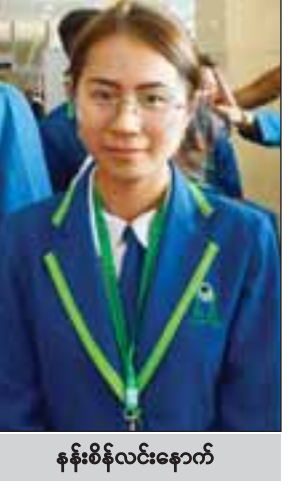
နန်းစိန်လင်းနောက်

တွေ့ဆုံမေးမြန်းခင်ရတနာ၊ ဓာတ်ပုံ-ဟိန်းထက်ဇော်