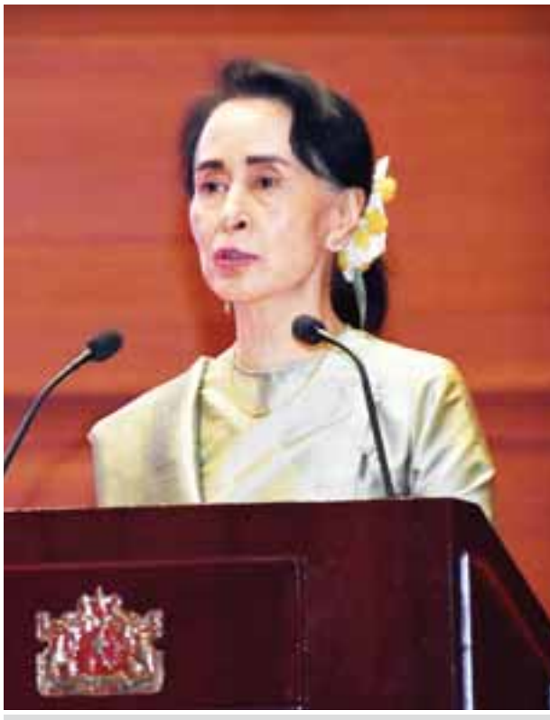
နိုင်ငံတော်၏အတိုင်ပင်ခံပုဂ္ဂိုလ် ဒေါ်အောင်ဆန်းစုကြည် လမ်းညွှန်အမှာစကား ပြောကြားနေစဉ်။

ကျွန်မတို့နိုင်ငံဟာ ပထဝီဝင်အနေအထားအရ မဟာဗျူဟာကျတဲ့ နိုင်ငံတစ်နိုင်ငံဖြစ်ပါတယ်။ ဒါတွေ အားလုံးသိပြီးသားပါ။ လူဦးရေအများဆုံး နိုင်ငံတွေဖြစ်ပြီး စီးပွားရေးအရ အရှိန်အဟုန်နဲ့ တိုးတက်နေတဲ့ တရုတ်နိုင်ငံနဲ့ အိန္ဒိယနိုင်ငံတို့အကြားမှာ တည်ရှိနေပါတယ်။ ဒါဟာ အားသာချက်တွေ အများကြီးရှိသလို စိန်ခေါ်မှုတွေလည်း အများကြီးရှိနေပါတယ်။ စိန်ခေါ်မှု တွေကို ကျော်လွှားနိုင်အောင် ကြိုးစားရမှာဖြစ်သလို အားသာချက်တွေကို လည်း အခွင့်အလမ်းတစ်ရပ်အဖြစ် အသုံးချသွားနိုင်ဖို့ ကြိုးစားကြရမှာ