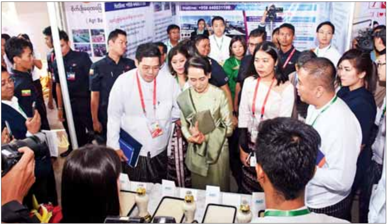
နိုင်ငံတော်၏ အတိုင်ပင်ခံပုဂ္ဂိုလ် ဒေါ်အောင်ဆန်းစုကြည် ခင်းကျင်းပြသထားသော အသေးစား၊ အလတ်စားလုပ်ငန်း ပြခန်းများအား ကြည့်ရှုအားပေးစဉ်။

ယင်းနောက် “မြန်မာနိုင်ငံတွင် စွန့်ဦးတီထွင်မှု ပြောင်းလဲလာပုံ” “ကိုယ်ပိုင်စီးပွားရေးလုပ်ငန်းများ ပိုမိုအောင်မြင်လာစေရန် ဆောင်ရွက်ခြင်း” “ဈေးကွက် ပြေရင်းမှုများဖြင့် လူမှုရေးပြဿနာများကို အဖြေရှာခြင်း” နှင့် “စွန့်ဦးတီထွင်လုပ်ငန်းရှင်များအတွက် မဟာဗျူဟာထွက်ပေါက်” ခေါင်းစဉ်များဖြင့် ဆွေးနွေးခြင်းများ ပြုလုပ်ခဲ့ကြသည်။