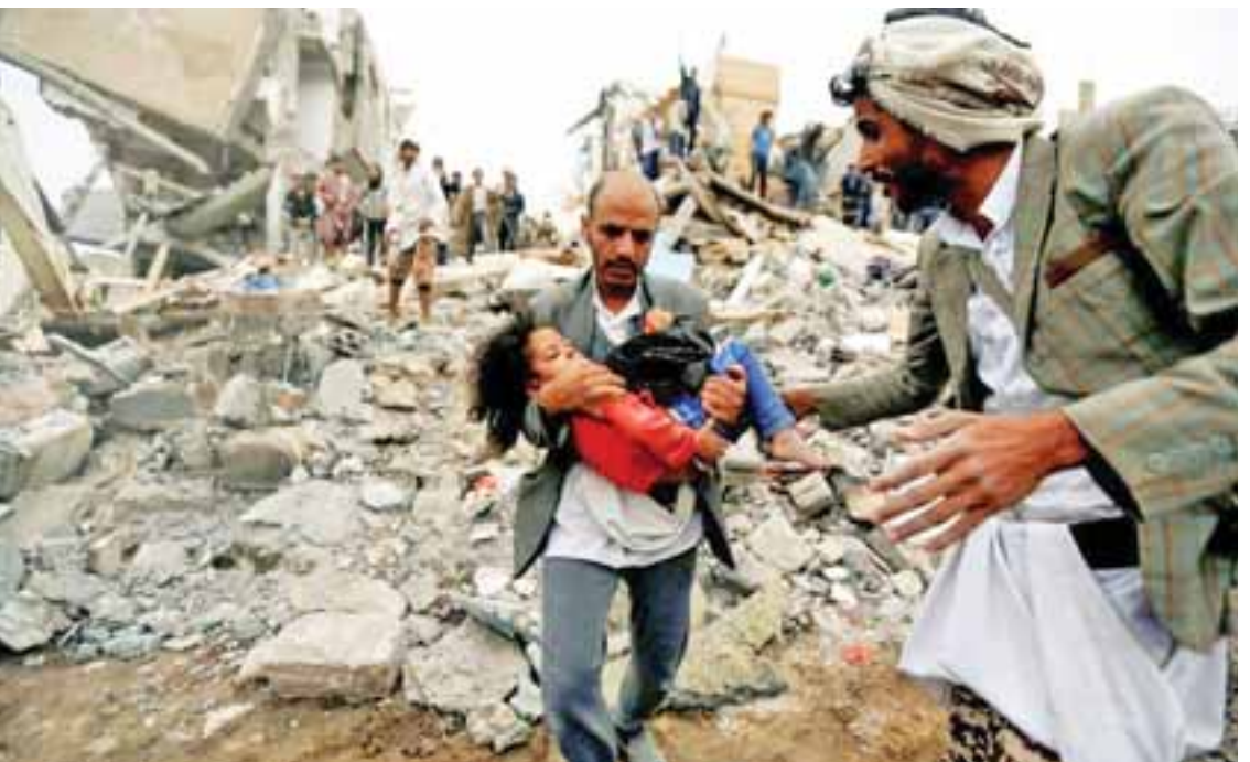
စစ်အတွင်း လူဦးရေ ၁၀၀၀၀ ကျော် သေဆုံးခဲ့ရပြီး ၎င်းတို့အထဲတွင် အရပ်သားများမှာ အများစု ဖြစ်သည်။ တိုက်ပွဲများအတွင်း နေရပ်စွန့်ခွာပြောင်းရွှေ့ထွက်ပြေးရသည့် ပြည်သူဦးရေမှာ သုံးသန်းခန့်ရှိကြောင်း ကုလသမဂ္ဂအေဂျင်စီများက ပြောကြားသည်။ ဆင်ဟွာ

ယီမင်နိုင်ငံတွင် ဖြစ်ပွားခဲ့သော ပြည်တွင်း