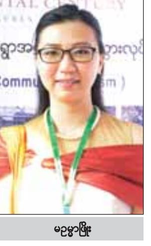
မဇုဗွားဖြိုး

လားပြီး ရင်းနှီးမြှုပ်နှံလိုသူတွေရှိပါ တယ်။ ကျွန်မတို့ အသင်းကနေ ပြည်တွင်းစွန့်ခွာပြီးလူငယ်တွေနဲ့ ချိတ် ဆက်ပေးပြီး သင့်တော်ကောင်းမွန်တဲ့ အလုပ်အကိုင် အခွင့်အလမ်းတွေ၊ စီးပွားရေးလုပ်ငန်းတွေကို ရနိုင်လာ မှာပါ။ ကျွန်မတို့အသင်းက ရန်ကုန် မြို့ မင်းရဲကျော်စွာလမ်းက UMFCFI အသင်းချုပ် ၁၁ လွှာမှာ ရှိပါတယ်။