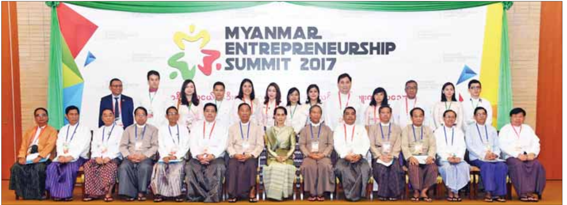
နိုင်ငံတော်၏ အတိုင်ပင်ခံပုဂ္ဂိုလ် ဒေါ်အောင်ဆန်းစုကြည်နှင့် တာဝန်ရှိသူများ၊ လူငယ်စွန့်ဦးတီထွင်လုပ်ငန်းရှင်များ စုပေါင်းမှတ်တမ်းတင်ဓာတ်ပုံရိုက်စဉ်။