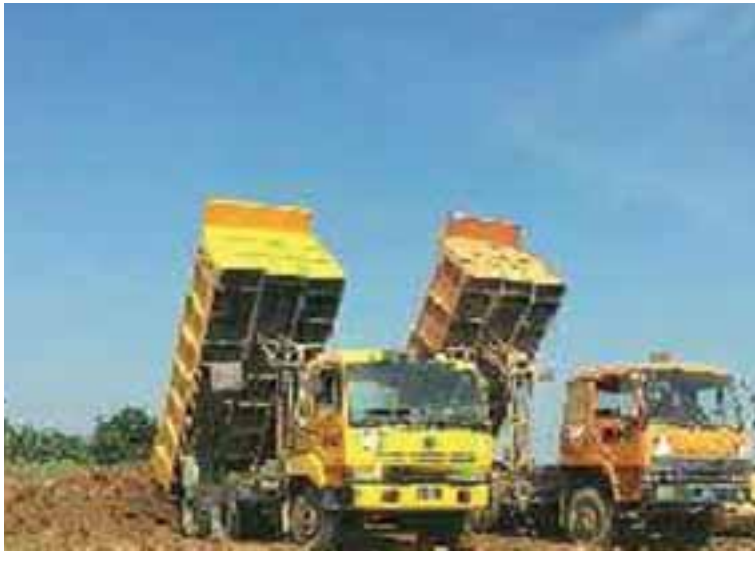
တင်နိုး(ပဲခူး)

မြေများ ရေပေးဝေရေးအတွက် အဓိကကျသောကြောင့် အထူးအလေးထား ဆောင်ရွက်ရန်နှင့် အခြားဆက်စပ်ရေးမြောင်းများ ကြိုတင်ရှင်းလင်းခြင်း၊ ရေပေးတူးမြောင်း အဆောက်အအုံများ ကြိုတင်ရေးအတွက် ကြိုတင်စစ်ဆေးခြင်းများ ဆောင်ရွက်ရန်၊ မိမိဌာနဝန်ထမ်းများအနေဖြင့် နွေစပါးရေပေး ရာသီအတွင်း မိမိတို့ သက်ဆိုင်ရာကွင်းအတွင်း အချိန်ပြည့်ရှိနေပြီး တောင်သူများနှင့်အတူ နွေစပါး အောင်မြင်သည်အထိ ကူညီဆောင်ရွက် တာဝန်ထမ်းဆောင်ကြရန် ညွှန်ကြားရေးမှူးက မှာကြားခဲ့ကြောင်း သိရသည်။ အဆိုပါ စစ်ပင်ဆိပ်ချောင်းပိတ်တံတံသည် နှစ်စဉ်ဆောင်ရွက်ရသော လုပ်ငန်းဖြစ်ပြီး ချောင်းပိတ်တံဆောင်ရွက်ပြီးမှသာ ပဲခူးမြစ် ရေအား ဘောနတ်ကြီးကျေးရွာအနီးရှိ ဇောင်းတူ ရေလွှဲဆည်မှတစ်ဆင့် ရေပေးမြောင်းအတိုင်း ပဲခူးမြို့နယ်၊ ဝေါမြို့နယ်အတွင်းရှိ လယ်မြေများ စိုက်ပျိုးရေးပေးဝေရခြင်းဖြစ်ပြီး ရေလွှဲဆည် အထက်ဘက်ရှိ ကိုဌာကွဲ၊ စလူ၊ ရွှေလောင်းရေ လှောင်တံခံများမှ သို့လှောင်ရေများကို ဇောင်းတူ ရေလွှဲဆည်မှ မိုးယွန်းကြီးရေလှောင်ကန်နှင့် ပဲခူး-စစ်တောင်းတူးမြောင်းအတွင်းသို့ ရေဖြည့်သွင်း၍ ပဲခူးတိုင်းဒေသကြီးအတွင်းရှိ ဝေါမြို့နယ်၊ သနပ်ပင်မြို့နယ်၊ ကဝဲမြို့နယ်နှင့် ရန်ကင်းတိုင်းဒေသကြီး ခရမ်းမြို့နယ်အထိ နွေစပါးစိုက်ကေ ၄၀၀၀၀ ကျော်အား ရေပေးဝေနိုင်မည်ဖြစ်သည်။