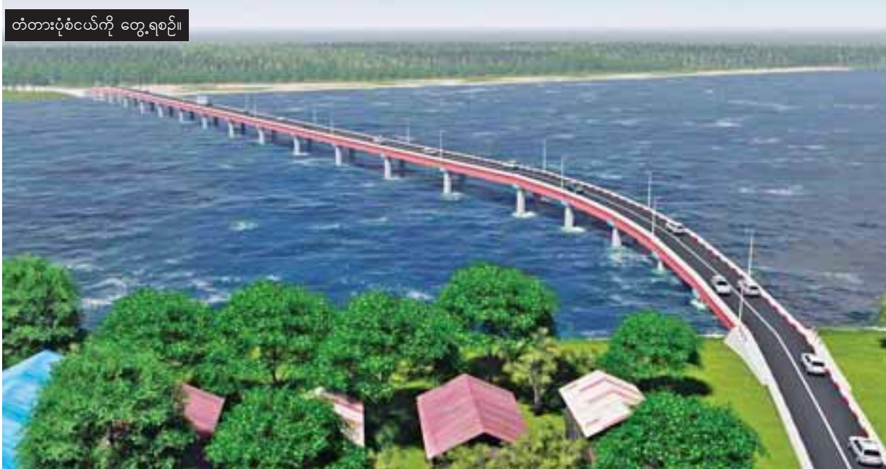
တံတားပုံစံငယ်ကို တွေ့ရစဉ်။