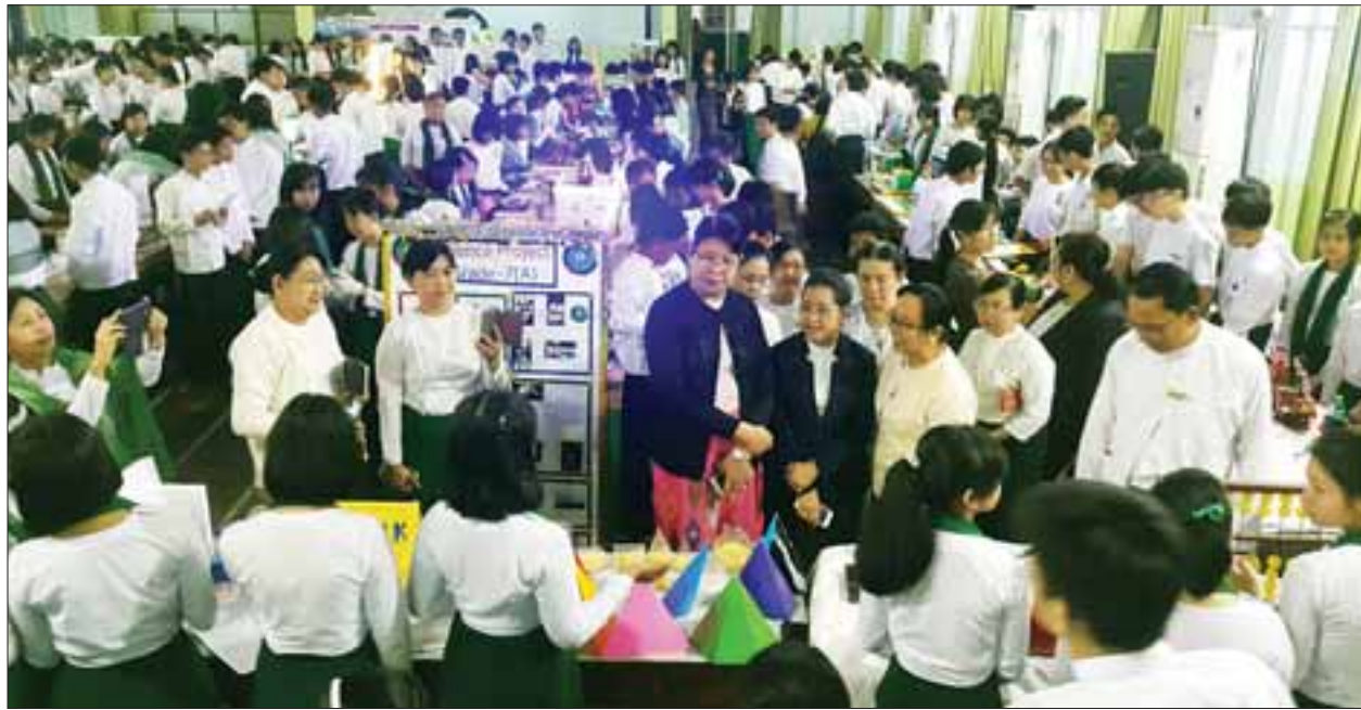
ပထမဆုံး သိပ္ပံကျောင်းသားပွဲတော်ကို ရန်ကုန်မြို့၊ အလံပြဘုရားလမ်း အထက (၁)ဒဂုံရှိ ဒဂုံသီရိခန်းမ၌ ကျင်းပစဉ်။