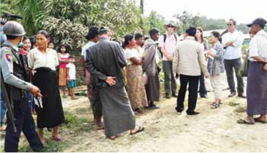
အမေရိကန်သံရုံးမှ ပထမအတွင်းဝန်နှင့်အဖွဲ့ မောင်တောဒေသသို့ လိုက်လံကြည့်ရှုစဉ်။