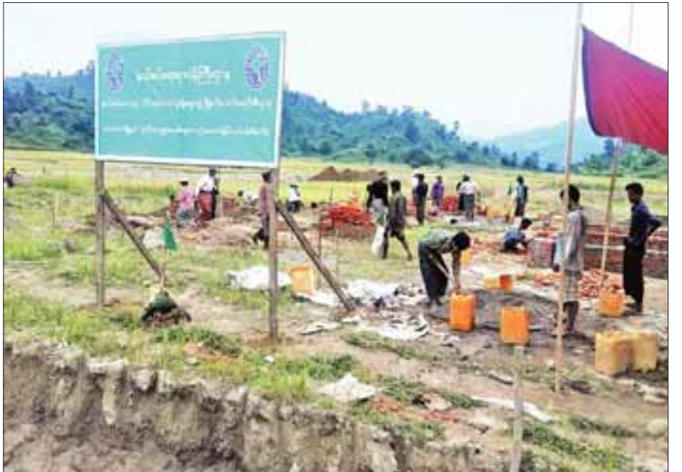
ခုံတိုင်(မြို့) ကျေးရွာသစ် တည်ဆောက်နေမှုကို တွေ့ရစဉ်။

နှစ်အလိုက် လုပ်ဆောင်ပေးခဲ့ပါတယ်။ အခုလိုနိုင်ငံရဲ့ နယ်စပ် အစွန်အဖျားတွေမှာ လမ်းတွေရှိနေရမယ်။ မီး အတွက်လည်း ဆိုလာလိုအပ်တဲ့နေရာ ဆိုလာ၊ အိမ်ရာ ဆောက်ပေးသင့်တဲ့ ကျေးရွာတွေမှာအိမ်ရာ အလှူငွေသင့် သလို ကူညီထောက်ပံ့ပေးမှုတွေ ရှိပါတယ်။ “တိုင်းရင်းသားကလေးတွေအတွက် လူငယ်သင်တန်း ကျောင်းတွေဖွင့်ပေးသလို ပညာတော်ရင်တော်သလို ဒီဂရီ ကောလိပ်တွေအထိ တက်ရောက်နိုင်အောင် ကူညီ ထောက်ပံ့ပေးတဲ့ လုပ်ငန်းစဉ်တွေ လုပ်ဆောင်ပေးနေပါ တယ်။ သီးခြားကဏ္ဍ တစ်ခုအနေနဲ့ အခုမောင်တောမှာ လမ်းပိုင်းဆိုင်ရာကအစ ရေတို၊ ရေလတ်နဲ့ ရေရှည်စီမံခန့် ခွဲမှုအကောင်အထည်ဖော် ဆောင်ရွက်လျက်ရှိပါ တယ်” ဟု နယ်စပ်ရေးရာဝန်ကြီးဌာန နယ်စပ်ဒေသနှင့် တိုင်းရင်းသားလူမျိုးများ ဖွံ့ဖြိုးတိုးတက်ရေးဦးစီးဌာန မောင်တောခရိုင် စာမျက်နှာ ၁၁ ကော်လံ ၁ သို့ ○