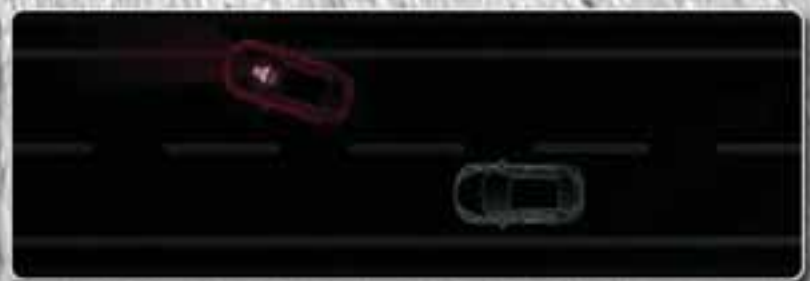
LANE DEPARTURE WARNING SYSTEM

Distributed by Automobile Alliance Co., Ltd. and Serviced by Cycle & Carriage Automobile Myanmar Co., Ltd. Yangon - No. 96 Kabar Aye Pagoda Road, Sayar San Quarter, Bahan Township. Hotline : 01 554633, 09 260259991 Mandalay - No. 10(A), The Corner of 77 th & 35 th street, Maharaungmyay Township. Hotline: 09 456 1111 04, 09 456 1111 05