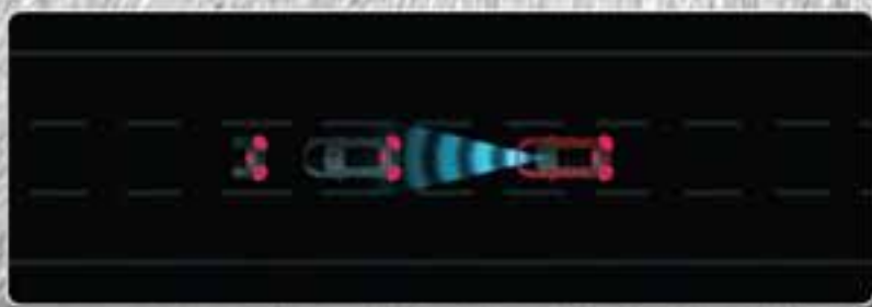
SMART CITY BRAKE