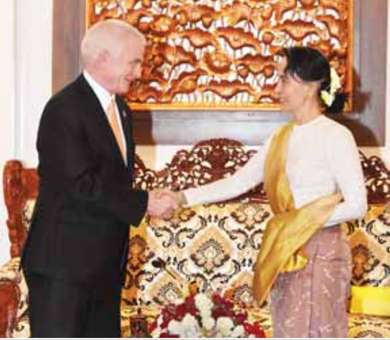
နိုင်ငံတော်၏အတိုင်ပင်ခံပုဂ္ဂိုလ် ဒေါ်အောင်ဆန်းစုကြည် မြန်မာနိုင်ငံဆိုင်ရာ ကုလသမဂ္ဂ ယာယီဌာနနေည့်နှိုင်းရေးမှူးနှင့် ကုလသမဂ္ဂဖွံ့ဖြိုးမှုအစီအစဉ် ယာယီဌာနကိုယ်စားလှယ် Mr. Knut Ostby အား ရင်းရင်းနှီးနှီးနှုတ်ဆက်စဉ်။ သတင်း-ရှေ့ဖို့

မဲ၊ ကန့်ကွက်မဲ(၃)မဲ၊ ကြားနေမဲ (၉)မဲဖြင့် အတည်ပြုခဲ့သည်။ လူ့အခွင့်အရေးကောင်စီအဖွဲ့ဝင် (၂) နိုင်ငံမှ ပါဝင်မဲပေးခြင်း မပြုခဲ့ပါ။ ကန့်ကွက်မဲပေးသည့်နိုင်ငံများမှာ မဲခွဲရန် တောင်းဆိုပေးသည့် တရုတ်နိုင်ငံ၊ ၂၀၁၇ ခုနှစ်အတွက် အာဆီယံဥက္ကဋ္ဌ တာဝန်ယူထားသည့် ဖိလစ်ပိုင်နိုင်ငံနှင့် ဘူရူဒီနိုင်ငံတို့ ဖြစ်ကြသည်။ မြန်မာနိုင်ငံအစိုးရအနေဖြင့် ရခိုင်ပြည်နယ်အရေးကိစ္စကို ပြည်တွင်းတွင် ဖြေရှင်းဆောင်ရွက်နေသကဲ့သို့ ဘင်္ဂလားဒေ့ရှ်နိုင်ငံနှင့်လည်း နှစ်နိုင်ငံညှိနှိုင်းဖြေရှင်းလျက်ရှိသည်။ ဤအခြေအနေတွင် အဆိုမူကြမ်းချမှတ်ခြင်းသည် မြေပြင်အခြေအနေကို အထောက်အကူမဖြစ်စေဘဲ ပိုမိုရှုပ်ထွေးလာစေနိုင်သည့် အချက်ကို ထောက်ပြ၍ တရုတ်နိုင်ငံကိုယ်စားလှယ်အဖွဲ့အနေဖြင့် မဲခွဲရန် တောင်းဆိုခဲ့ခြင်းဖြစ်သည်။ လူ့အခွင့်အရေးကောင်စီအဖွဲ့ဝင် (၄၇)နိုင်ငံရှိသည့်အနက် (၁၄)နိုင်ငံက ထောက်ခံခြင်း မပြုခဲ့ကြသဖြင့် အဆိုမူကြမ်းမှာ တူညီဆန္ဒဖြင့် အတည်ပြုနိုင်ခဲ့ခြင်း မရှိပါ။ ရခိုင်ပြည်နယ်ကိစ္စနှင့်ပတ်သက်၍ ဘက်ပေါင်းစုံမှ ဖိအားပေးနေသည့်ကြားမှ မဲခွဲရန်တောင်းဆိုပေးခြင်း၊ အဆိုမူကြမ်းကို ကန့်ကွက်မဲပေးခြင်း (သို့မဟုတ်) ကြားနေမဲပေးခြင်း (သို့မဟုတ်) မဲပေးမှုတွင် မပါဝင်ခြင်းဖြင့် မြန်မာနိုင်ငံအပေါ် နားလည်မှုပြသခဲ့ကြသည့် လူ့အခွင့်အရေးကောင်စီအဖွဲ့ဝင်နိုင်ငံများကို နိုင်ငံခြားရေးဝန်ကြီးဌာနမှ ကျေးဇူးတင်ရှိကြောင်း ဖော်ပြခဲ့သည်ဟု သတင်းရရှိသည်။