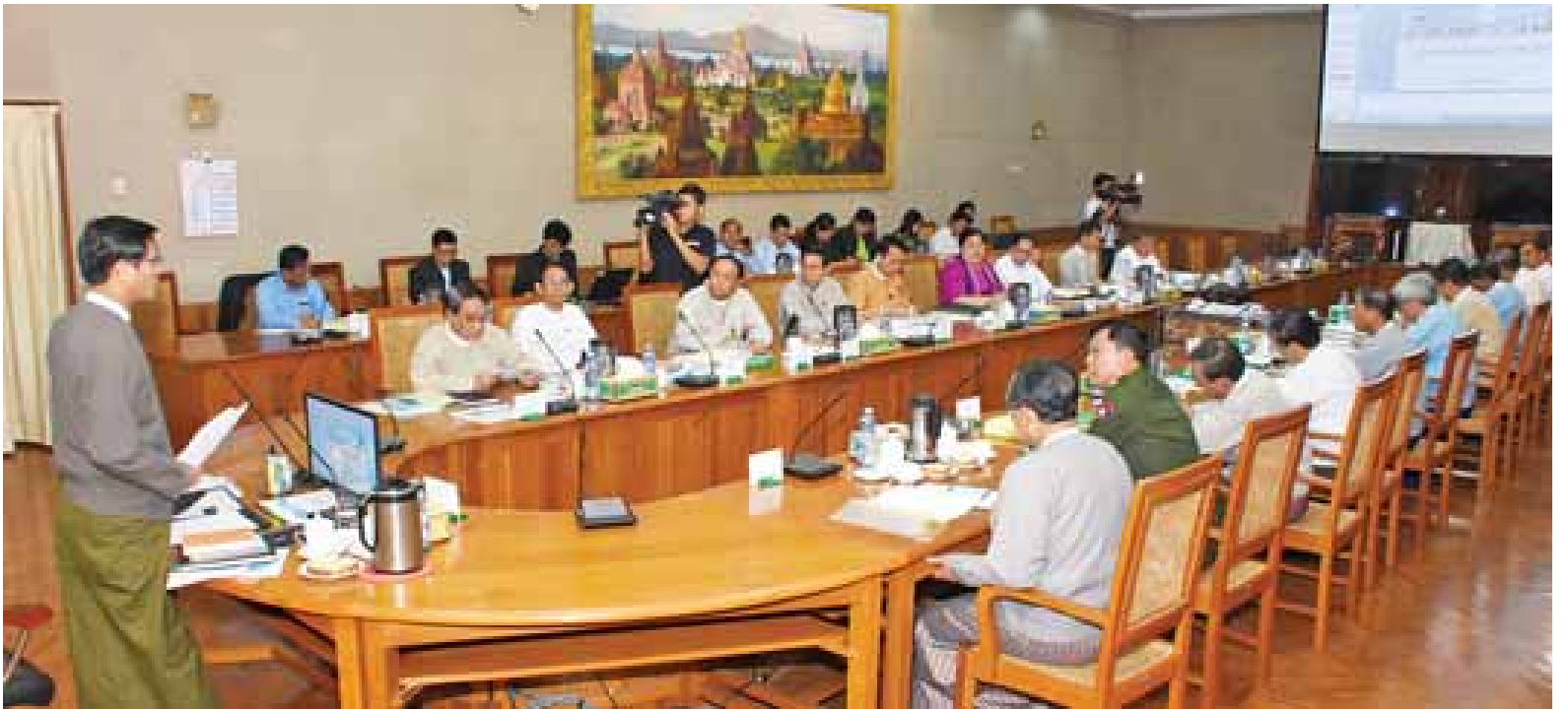
မြန်မာအထူးစီးပွားရေးဇုန်ဆိုင်ရာပဟိုအဖွဲ့ (၂/၂၀၁၇) လုပ်ငန်းညှိနှိုင်းအစည်းအဝေးတွင် ဒုတိယသမ္မတ ဦးဟင်နရီဗန်ထီးယူ အမှာစကား ပြောကြားစဉ်။

နေပြည်တော် ဒီဇင်ဘာ ၅ မြန်မာအထူးစီးပွားရေးဇုန်ဆိုင်ရာ ပဟိုအဖွဲ့ (၂/၂၀၁၇) လုပ်ငန်းညှိနှိုင်း အစည်းအဝေးကို ယနေ့နံနက် ၁၀ နာရီတွင် နေပြည်တော်ရှိ နိုင်ငံတော် သမ္မတရုံး အစည်းအဝေးခန်းမ၌ ကျင်းပရာ မြန်မာအထူးစီးပွားရေး ဇုန်ဆိုင်ရာပဟိုအဖွဲ့ ဥက္ကဋ္ဌ ဒုတိယ သမ္မတ ဦးဟင်နရီဗန်ထီးယူ တက်ရောက်အမှာစကား ပြောကြား သည်။