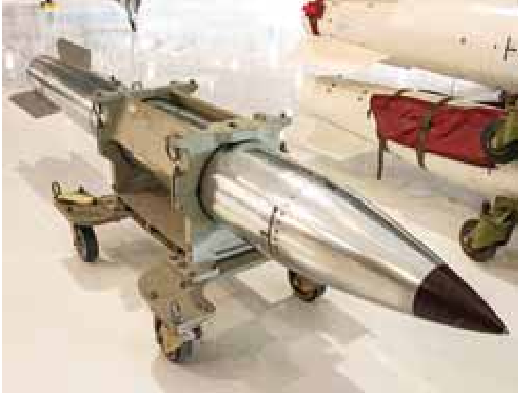
အမေရိကန်လက်နက်တိုက်ရိုက် ဘီ-၆၀ သာမိုဇူကလီးယားဗုံးများကို တွေ့ရစဉ်။