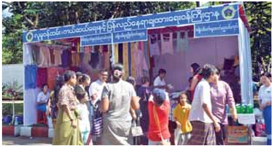
လူငယ်ဘက်စုံဖွံ့ဖြိုးရေးပွဲတော်တွင် လူမှုဝန်ထမ်း၊ ကယ်ဆယ်ရေးနှင့် ပြန်လည်နေရာချထားရေးဝန်ကြီးဌာန ပြခန်းကို တွေ့ရစဉ်။

ဗြဟ္မစိုရ်တရားလေးပါး ထွန်းကားရာ မြန်မာနိုင်ငံတွင် ထိုကဲ့သို့ မွေးကင်းစကလေးစွန့်ပစ်မှုများနှင့် သက်ငယ် မုဒိမ်းမှုများ လျော့နည်းပပျောက်စေရေးအတွက် အရှက် အကြောက်တရားနှင့်အတူ ထိန်းသိမ်းရန် လိုအပ်လှပါ ကြောင်း . . . .