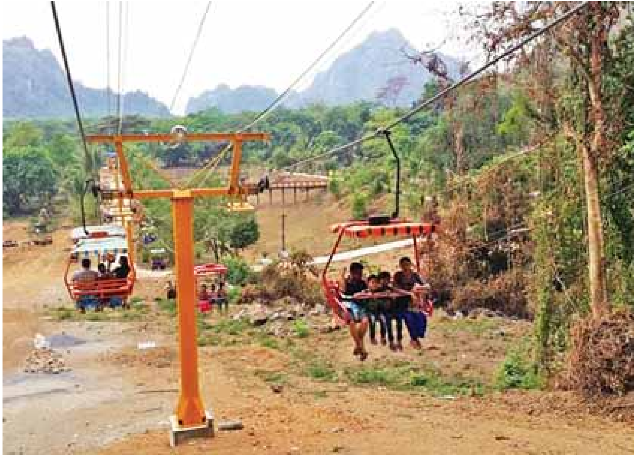
ဘားအံ ဒီဇင်ဘာ ၅

ကရင်ပြည်နယ် ဘားအံမြို့နယ် တော်ပုံကျေးရွာ ဇွဲကပင်တောင်ခြေ လူမွန်ဥယျာဉ်တွင် တည်ဆောက်ဖွင့်လှစ်ထားသော ကေဘယ်လ်ချဲ(Cable Chair) သည် ဆံတော်ရှင်စေတီသို့လာရောက်သည့် ပြည်တွင်း၊ ပြည်ပဘုရားဖူးများနှင့် နိုင်ငံခြားသားခရီးသွားလေ့လာသူများအတွက် စိတ်ဝင်စားဖွယ်ဆွဲဆောင်မှုကောင်း သည့်နေရာတစ်ခုဖြစ်လာ၍ ပွင့်လင်းရာသီရုံးပိတ်ရက်များတွင် လာရောက် လည်ပတ်သူဦးရေ များပြားလာကြောင်း သိရသည်။