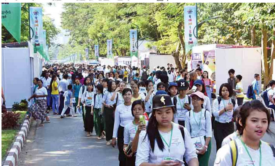
လူငယ်ဘက်စုံပွဲ ဖြိုးရေးပွဲတော်လာရောက်လေ့လာကြသည့် ကျောင်းသူများ။

မည်သို့ပင်ဆိုစေ ကျောင်းသား ကျောင်းသူ လူငယ်များ ကိုယ်တိုင်ပါဝင်ဆင်နွှဲနေသည့် လူငယ်ဘက်စုံပွဲ ဖြိုးရေးပွဲတော်တွင် ပါဝင်လှုပ်ရှားနေသည့် လူငယ်များ၏ တက်ကြွသည့် အားမာန်၊ ထက်သန်သည့် စိတ်နှလုံးသားကို အထင်အရှားတွေ့မြင်နေရလေပြီ။ စာရေးသူတို့ ပြန်လာချိန်တွင် နေရောင်ခြည်ပင် အတော်ကလေးကျသွားပြီဖြစ်၏။ အဓိပတိလမ်းမကြီးတစ်လျှောက် ရေတမာနံ့ ခရေ့တို့ကား သင်းရနံ့လှိုင်၍ နေချေပြီ။ သစ်ပင်ပင်ကြီးကား ခန့်ခန့်တည်တည်၊ လူငယ်ထု၏ တက်တက်ကြွကြွ အားမာန်အလှများကို ကျေနပ်နေသည့်ဟန်၊ ထင်ဟပ်နေသည့်သဏ္ဍာန်ပင် ဖြစ်ပေတော့သည်။ ။