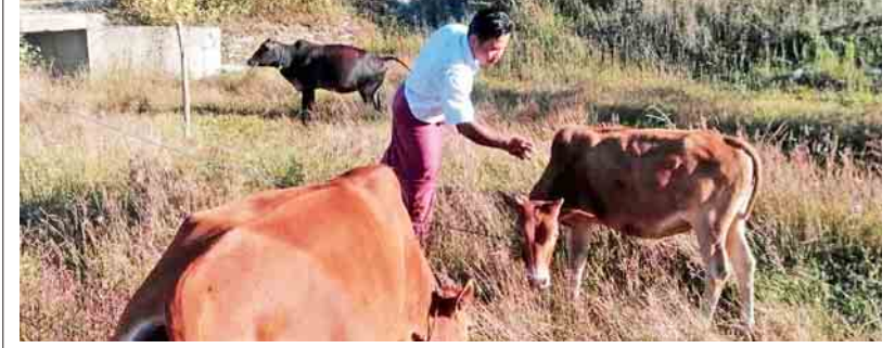
မောင်တောမြို့နယ်ရှိ တိရစ္ဆာန်ထိန်းသိမ်းစောင့်ရှောက်မှု ဆောင်ရွက်လျက်ရှိ

ရှစ်ခန်းတွဲ အဆောင်လေးလုံး၊ အလျား ၁၅ ပေ၊ အနံ ရှစ်ပေ၊ အမြင့် လေးပေရှိ Ground Tank တစ်လုံး၊ ရေ ၁၂၀၀ ဂါလန်ဆုံ Overhead Tank နှစ်လုံး၊ အလျား ပေ ၆၀၊ အနံ ပေ ၃၀ ၊ အမြင့် ၁၁ ပေရှိသော ထမင်းချက်၊ ထမင်းစားဆောင် တစ်လုံး၊ စက်ရေတွင်း နှစ်တွင်းနှင့် အဆောက်အအုံများရေရရှိ လမ်းများ ကျောက်ခင်းခြင်းကို အသစ်ထပ်မံဆောင်ရွက်သွားမည်ဖြစ်ကြောင်း သိရသည်။ ထို့ပြင် ပြန်လည်လက်ခံရေးလုပ်ငန်းစဉ်များတွင် တာဝန်ထမ်းဆောင်ကြမည့် ဝန်ထမ်းများရုံးခန်းအဖြစ် အသုံးပြုရန် Modular House ၃၁ လုံး၊ ဝန်ထမ်းများ နေထိုင်နိုင်ရန် Modular House ရှစ်လုံးနှင့် တစ်ဖက်နိုင်ငံမှ ပြန်လည်ဝင်ရောက်လာမည့် သူများအား ခေတ္တထားရိပ်ရန် Modular House ၄၁ လုံး စုစုပေါင်း Modular House အလုံး ၈၀ အား ဆောက်လုပ်ရေးဝန်ကြီးဌာနက ဆောက်လုပ်ပေးသွားမည်ဖြစ်ကြောင်း သိရသည်။ လက်ရှိတွင် ဆောက်လုပ်ရေးနှင့် အခြေခံအဆောက်အအုံ တည်ဆောက်ရေးလုပ်ငန်းအဖွဲ့က အလျား ပေ ၁၂၀၊ အနံ ပေ ၃၀ ရှိ ဘားတိုက် နှစ်လုံးပြုပြင်ခြင်းနှင့် ဆောက်လုပ်ရေးဝန်ကြီးဌာနက Modular House များ တည်ဆောက်နိုင်ရေးအတွက် ပစ္စည်းစုပုံခြင်း၊ မြေကြီးလုပ်ငန်းများ စတင်ပြုလုပ်လျက်ရှိကြောင်း သိရသည်။ သတင်းစဉ်