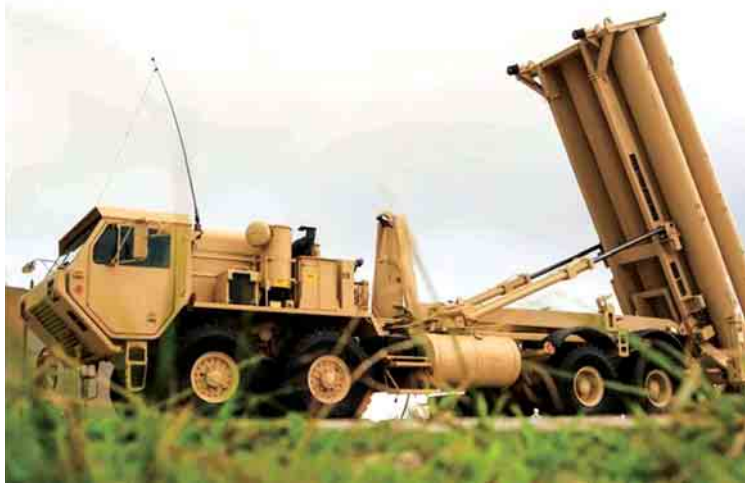
ဂူအမ်ကျွန်းရှိ အင်ဒါဆန် လေတပ်စခန်း၌ ဖြန့်ကြက်ထားသော THAAD ခုံးခွင်းခုံး စနစ်ကို တွေ့ရစဉ်။