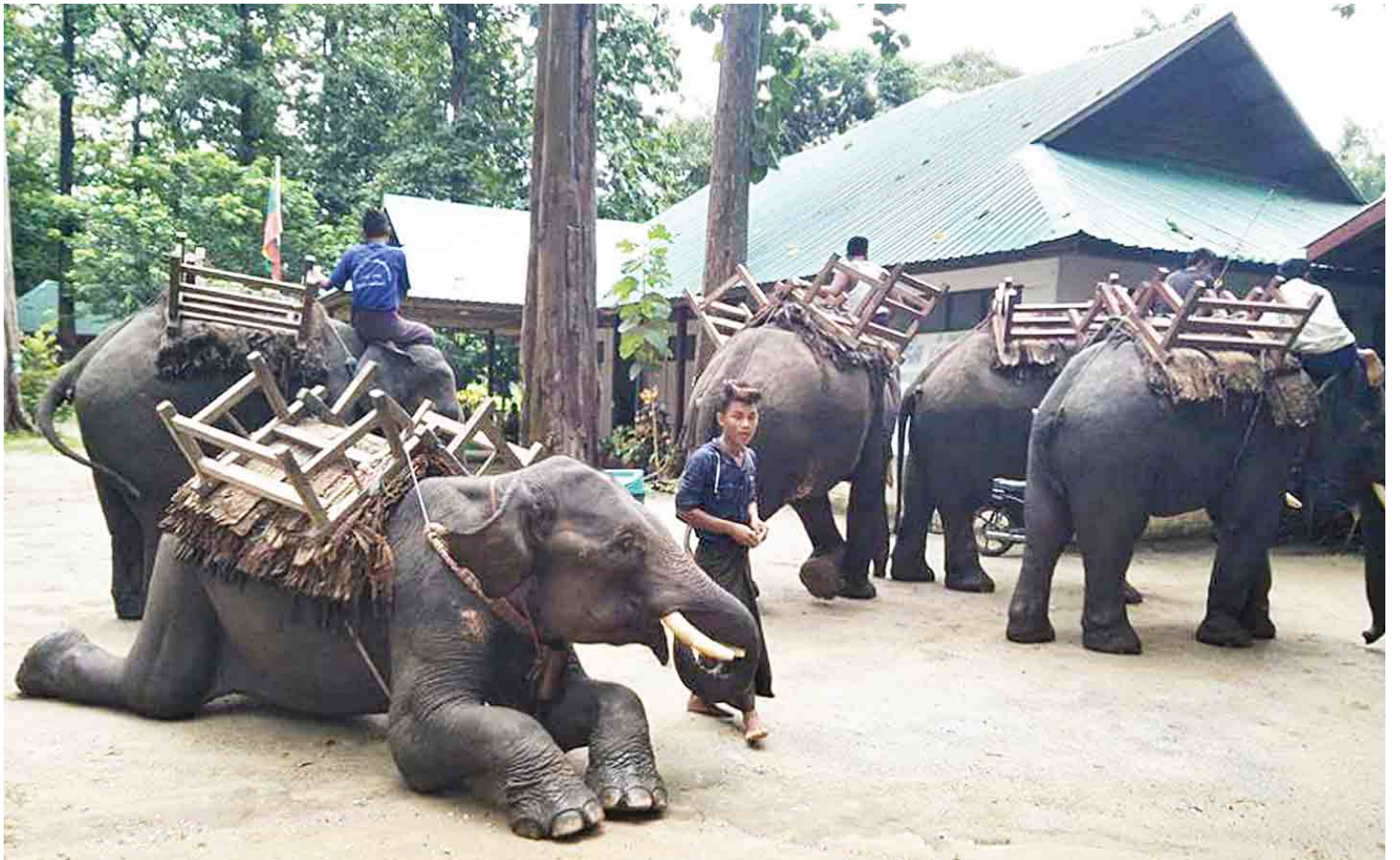
ပဲခူးတိုင်းဒေသကြီး သာဂရမြို့အနောက်ဘက် ၁၀ မိုင်ခန့်အကွာတွင် တည်ရှိသည့် ဖိုးကျားဆင်စခန်းကို တွေ့ရစဉ်။

“ဆင်တွေက စဉ့်ကူးကနီးတဲ့အတွက် စဉ့်ကူးကနေ ရွှေတာပြီးသွားပါပြီ။ ဆင်တွေနဲ့ စာမျက်နှာ ၅ ကော်လံ ၁ သို့ *