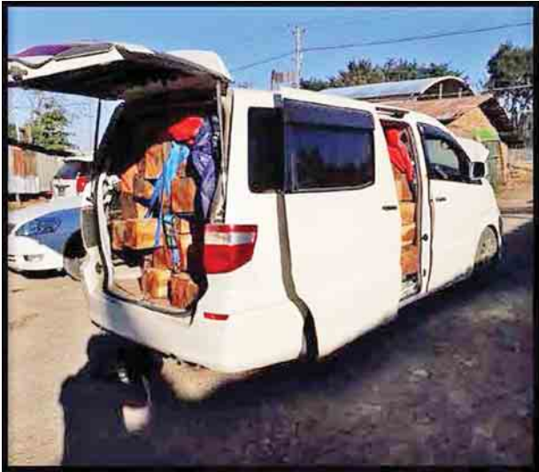
ဒီဇင်ဘာ ၃ ရက်က မန္တလေး-မုဆယ် ပြည်ထောင်စုလမ်းမကြီး တစ်လျှောက် ကုန်သွယ်မှုယာဉ် ပို့ကုန် ၁၀၀၅ စီး၊ သွင်းကုန် ၉၉၅ စီး၊ ရန်ကုန်-မြဝတီ လမ်းမကြီးတစ်လျှောက် ကုန်သွယ်မှုယာဉ် ပို့ကုန် ၅၅ စီး၊ သွင်းကုန် ၁၂၃ စီး ကုန်စည်များ သယ်ယူပို့ဆောင်လျက်ရှိကြောင်း အကောက်ခွန်ဦးစီးဌာနမှ သိရသည်။

အဆိုပါ စစ်ဆေးရေးစခန်းများက တင်သွင်း၊ တင်ပို့သော ကုန်ပစ္စည်း များအား စစ်ဆေးမှုများ ပြုလုပ်ဆောင်ရွက်လျက်ရှိရာ ဒီဇင်ဘာ ၃ ရက်က ရေပူအမြဲတမ်းစစ်ဆေးရေးစခန်းက တားဆီးမှုကိုးမူ (ခန့်မှန်းတန်ဖိုးငွေကျပ် ၂၁ ဒသမ ၄၂၂ သန်းခန့်)၊ မရမ်းချောင်းအမြဲတမ်းစစ်ဆေးရေးစခန်းက တားဆီးမှု ခြောက်မူ (ခန့်မှန်းတန်ဖိုးငွေကျပ် ၈ ဒသမ ၂၀၅ သန်းခန့်)စုစုပေါင်း တားဆီးမှု ၁၅ မူ (ခန့်မှန်းတန်ဖိုးငွေကျပ် ၂၉ ဒသမ ၆၂၇ သန်းခန့်) သိမ်းဆည်းရမိခဲ့ကြောင်း သိရသည်။