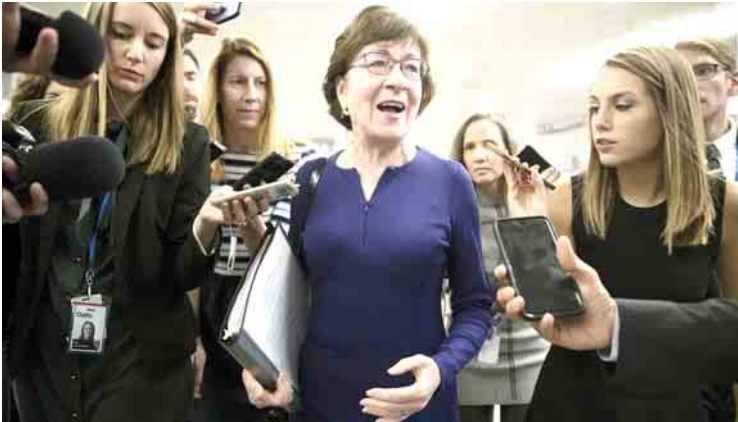
အခွန်ဆိုင်ရာ ဥပဒေမူကြမ်း အတည်ပြုခြင်းနှင့် ပတ်သက်၍ အထက်လွှတ်တော်အမတ်တစ်ဦးအား သတင်းထောက်များက မေးမြန်းကြစဉ်။

အခွန်ဆိုင်ရာ ဥပဒေသစ်နှင့် ပတ်သက်၍ အထက်လွှတ်တော်နှင့် အောက်လွှတ်တော် နှစ်ရပ်အကြား စေ့စပ်ညှိနှိုင်းမှုများ ပြုလုပ် ပြီးစီးသည်နှင့် တစ်ပြိုင်နက်တည်းကုမ္ပဏီများ