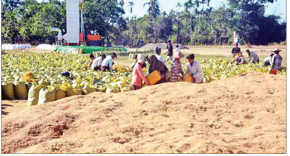
မောင်တောဒေသတွင် ရိတ်သိမ်းခြေလှေ့ပြီး မိုးစပါးများ အခြောက်ခံသိမ်းဆည်းနေမှုမြင်ကွင်း။

ဖြေ- လက်ရှိအခြေအနေမှာ ဘူးသီးတောင်နဲ့ မောင်တော ကို မီးစက်နဲ့ပေးနေပါတယ်။ ၂၀၁၆ ခုနှစ် အောက်တိုဘာလ ၉ ရက်နေ့ဖြစ်စဉ်နောက်ပိုင်း ည ၆ နာရီကနေ နံနက် ၆ နာရီအထိ တစ်ညလုံးမီးပေးနေတာ အခုချိန်ထိဖြစ်ပါတယ်။ နိုင်ငံတော်ကစီစဉ်နေတဲ့ မဟာဓာတ်အားလိုင်းကတော့ လာမယ့် ၂၀၁၈ ခုနှစ်မတ်လမှာ ရသေ့တောင်၊ ဇွန်လပိုင်း လောက်မှာ ဘူးသီးတောင်နဲ့ ဒီဇင်ဘာလမှာ မောင်တော ရမယ်လို့သိရပါတယ်။ လျှပ်စစ်ကဏ္ဍတိုးတက်လာမှာ ဖြစ်သလို ဆက်သွယ်ရေးလမ်းပိုင်းအနေနဲ့ မနှစ်ကဖွင့်လှစ် ပေးနိုင်ခဲ့တဲ့ ဘူးသီးတောင်-ပန်ဇင်းချောင်းတံတား၊ လတ်တလော အကောင်အထည်ဖော်နေတဲ့ စိုင်းဒင်တံတား၊ ရသေ့တောင်တံတားတွေဟာ ဒီဘတ်ဂျက်မှာ သက်ဆိုင်ရာ ဌာနတွေက တွန်းအားပေးဆောင်ရွက်နေတာဖြစ်တဲ့အတွက် လာမယ့် ၂၀၁၈ ခုနှစ်မှာရန်ကုန်ကနေ မောင်တောအထိ နေချင်းပေါက်နိုင်တဲ့ လမ်းကြောင်းဖြစ်သွားမှာ ဖြစ်တဲ့ အတွက် ဆက်သွယ်ရေးအရသော်လည်းကောင်း၊ လျှပ်စစ် ကဏ္ဍအရသော်လည်းကောင်း အခြေခံလိုအပ်ချက်နှစ်ရပ်လုံး ပြည့်စုံပြီဆိုရင် ဒီမောင်တောနယ်စပ်ဒေသတစ်ခုလုံးဟာ မျှော်လင့်ထားတာထက် ပိုမိုဖွံ့ဖြိုးတိုးတက်လာမယ့်လို့ ယုံကြည်ပါတယ်။