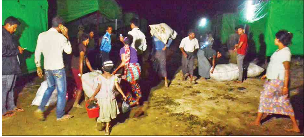
စစ်တွေမြို့ ဓညဝတီ အားကစားကွင်း ကယ်ဆယ်ရေးစခန်းမှ ဟိန္ဒူဘာသာဝင်များ မောင်တောခရိုင် အုပ်ချုပ်ရေးမှူး ရုံးဘေးရှိ ယာယီ တန်းလျားသို့ ဒီဇင်ဘာ ၃ ရက် ည ၉ နာရီက ရောက်ရှိလာစဉ်။

တင်ထွန်း(ပြန်/ဆက်)နှင့် သတင်းအဖွဲ့၊ ဓာတ်ပုံ- ဖိုးထောင်