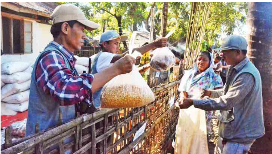
UEHRD စေတနာ့ဝန်ထမ်းလူငယ်များ ငါးခုရကျေးရွာရှိ ဟိန္ဒူဘာသာဝင်များအား ထောက်ပံ့ပစ္စည်းများ ပေးအပ်စဉ်။

နည်းနေတယ်။ အခု UEHRD လူငယ်တွေက ဆီ၊ ဆန်၊ ဆား၊ ငရုတ်၊ အာလူး၊ ပဲ စတာတွေကို လာပေးပါတယ်။ အဲဒါလေးတွေနဲ့ စားနေရတယ်။ အခု အလုပ်မရှိပါဘူး။ အရင်တုန်းက ဈေးဆိုင်တွေ ဘာတွေရောင်းတယ်။ ခုတော့ မရှိတော့ပါဘူး။ အကြမ်းဖက်ဖြစ်စဉ်တုန်းက သူတို့ ARSA တွေက ခေါင်းစွပ်အမည်းတွေစွပ်ပြီး စခန်းက သူတွေနဲ့ အပြန်အလှန်လာပြီးတော့ ပစ်ကြတယ်။ အဲဒီတုန်းက ကျွန်မတို့ ညဘက် ၁၁ နာရီလောက်မှာ ဒီစခန်းထဲကို ဝင်ပြီးတော့ ပြေးကြရပါတယ်။ ဒီရွာမှာက ဟိန္ဒူ၊ ဘင်္ဂါလီ၊ ရခိုင် သုံးစုနေကြပါတယ်။ အရင်တုန်းက ဘာသာချင်း မတူလည်း အေးအေးချမ်းချမ်းရှိပါတယ်။ တစ်ယောက်နဲ့ တစ်ယောက် အပြန်အလှန် ရှိကြပါတယ်။ သူတို့မှာ မရှိရင်လည်း တောင်းတယ်။ ချေးငှားပါတယ်။ သူတို့ကလည်း အပြန်အလှန် ကူညီပါတယ်။ အခု ဒီမှာ ထွက်မပြေးဘဲ