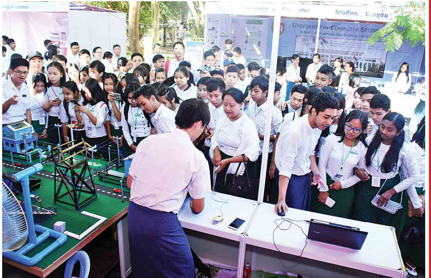
လူငယ်ဘက်စုံပွဲ ဖြိုးရေးပွဲတော်တွင် ကျောင်းသား ကျောင်းသူ လူငယ်များ နည်းပညာဆိုင်ရာ ပြခန်းတွင် စိတ်ဝင်တစား လေ့လာနေကြစဉ်။

ဦးစွာ ရန်ကုန်တက္ကသိုလ် အဓိပတိလမ်း တစ်ဖက်တစ်ချက်တွင် ဘာသာရပ်ဆိုင်ရာ ပြခန်းကလေးများကို တွေ့ရသည်။ ရန်ကုန်နှင့် ပဲခူးကဲ့သို့ တိုင်းဒေသကြီးအတွင်း အခြေခံပညာ အထက်တန်းကျောင်းအချို့မှ ပြခန်းများကိုလည်း တွေ့ရ၏။ ပြခန်းတစ်ခုသို့ ဝင်လိုက်သည်နှင့် ကျောင်းသား ကျောင်းသူအသီးသီးတို့သည် မိမိတို့ကျောင်းမှပြသထားသည့် သိပ္ပံဆိုင်ရာ တီထွင်မှုများကို တစ်ခုစီ စိတ်ရှည်လက်ရှည် ရှင်းပြကြသည်ကို