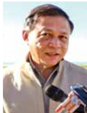
ဦးသိန်းဇော်

နဲ့အညီ နှစ်နိုင်ငံ သဘောတူညီချက်အပေါ် မူတည်ပြီး သေချာစိစစ်မှာ ဖြစ်ပါတယ်။ စိစစ်တဲ့အခါမှာလည်း ဌာနဆိုင်ရာအသီးသီးက ဝန်ထမ်းတွေ ပါလာမယ်။ ပါလာတဲ့ ဝန်ထမ်းတွေရဲ့ နေထိုင်ရေး၊ ရုံးခန်း၊ ဒီအပိုင်းတွေကို ရက်ရှည်လများ လုပ်ရမှာဖြစ်တဲ့အတွက် ခုတော့ ဆောက်လုပ်ရေးလုပ်ငန်းတွေ စတင်နေပါပြီ။ တောင်ပြိုလက်ဝဲမှာ Modular House နေရာတွေလည်း လျာထားပြီး ဒါတွေအားလုံးကို ဒီဇင်ဘာလကုန်မှာ အပြီးဆောင်ရွက်နိုင်မှာ ဖြစ်ပါတယ်။ တောင်ပြိုလက်ဝဲမှာဆို Modular House ၁၆ လုံး၊ အခန်း ၈၀ ပါ ဝန်ထမ်းရုံးခန်းတွေ၊ အဆောက်အအုံတွေကိုလည်း ပြန်လည်ပြုပြင်တာတွေ လုပ်နေပါပြီ။ ပြင်တဲ့အခါမှာလည်း ပုဂ္ဂလိကလုပ်ငန်းအဖွဲ့အောက်မှာရှိတဲ့ အခြေခံအဆောက်အအုံတွေနဲ့ ဆောက်လုပ်ရေးဆိုင်ရာလုပ်ငန်းအဖွဲ့ကနေ ပြန်လည်ပြုပြင်ဆောင်ရွက်ပေးနေပါတယ်။ ဆောက်လုပ်ရေးဝန်ကြီးဌာနအဖွဲ့ကတော့ ဒီ Modular House တွေကို ပြန်ပြီး