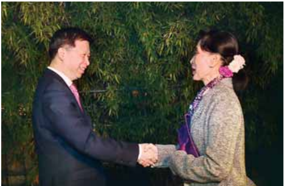
ညစာစားပွဲတက်ရောက်ရန် ရောက်ရှိလာသော နိုင်ငံတော်၏အတိုင်ပင်ခံပုဂ္ဂိုလ် ဒေါ်အောင်ဆန်းစုကြည်အား တရုတ်ကွန်မြူနစ်ပါတီ နိုင်ငံတကာဆက်ဆံရေးဝန်ကြီး Mr. Song Tao က ကြိုဆိုနှုတ်ဆက်စဉ်။

ထို့နောက် နိုင်ငံတော်၏အတိုင်ပင်ခံပုဂ္ဂိုလ်နှင့်အဖွဲ့ဝင်များသည် ယူနန်ပြည်နယ် ကွန်မြူနစ်ပါတီအတွင်းရေးမှူး Mr. Chen Hao က တည်ခင်းဧည့်ခံသည့် နေ့လယ်စာစားပွဲသို့ တက်ရောက်သည်။ ဆက်လက်၍ နိုင်ငံတော်၏အတိုင်ပင်ခံပုဂ္ဂိုလ် ဒေါ်အောင်ဆန်းစုကြည်နှင့်အဖွဲ့သည် တရုတ်ပြည်သူ့သမ္မတနိုင်ငံဆိုင်ရာ မြန်မာသံအမတ်ကြီးနှင့်အတူ ကူမင်းဟိုတယ်အထူးလေယာဉ်ဖြင့် ထွက်ခွာပြီး ဒေသစံတော်ချိန်ညှိ ၅ နာရီတွင် ပေးပို့ပေးအပ်ပြည်ဆိုင်ရာလေဆိပ်သို့ ရောက်ရှိသည်။ နိုင်ငံတော်၏အတိုင်ပင်ခံပုဂ္ဂိုလ်နှင့်အဖွဲ့အား တရုတ်ကွန်မြူနစ်ပါတီ နိုင်ငံတကာဆက်ဆံရေးဌာန ဒုတိယဝန်ကြီး မစ္စတာ ကောရဲ့ကျိုး၊ စစ်သံမျိုး၊ ဗိုလ်မှူးချုပ်တင်ဆန်း၊ မြန်မာသံရုံးနှင့် စစ်သံရုံးဝန်ထမ်းများနှင့် တာဝန်ရှိသူများက ပေးပို့ပေးအပ်ပြည်ဆိုင်ရာလေဆိပ်၌ ကြိုဆိုနှုတ်ဆက်ကြသည်။ ထို့နောက် နိုင်ငံတော်၏အတိုင်ပင်ခံပုဂ္ဂိုလ်နှင့်အဖွဲ့သည် မော်တော်ယာဉ်များဖြင့် ခေတ္တတည်းခိုမည့် ပေးပို့ပေးခြင်းဖြင့် ကျောက်ယုထိုင် နိုင်ငံတော်ဧည့်ဂေဟာသို့ ရောက်ရှိသည်။ ယင်းနောက် ဒေသစံတော်ချိန် ည ၇ နာရီတွင် နိုင်ငံတော်၏အတိုင်ပင်ခံပုဂ္ဂိုလ် ဒေါ်အောင်ဆန်းစုကြည်သည် တရုတ်ကွန်မြူနစ်ပါတီ နိုင်ငံတကာဆက်ဆံရေးဝန်ကြီး Mr. Song Tao က တည်ခင်းဧည့်ခံသည့် ညစာစားပွဲသို့ တက်ရောက်သည်။ သတင်းစဉ်