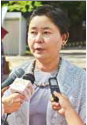
ဒေါက်တာ မြမြခင်