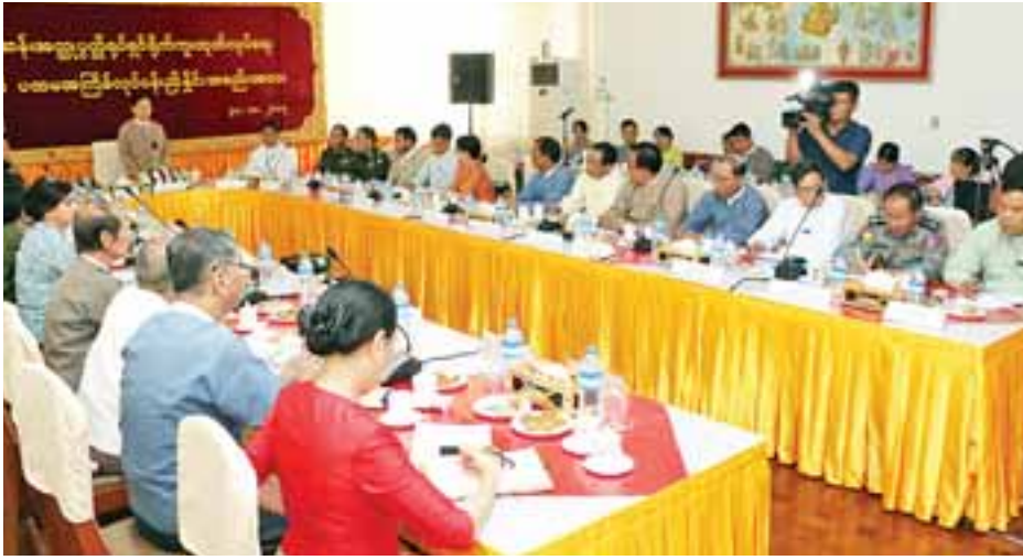
ဗိုလ်ချုပ်အောင်ဆန်းအတ္ထုပ္ပတ္တိရုပ်ရှင် ရိုက်ကူးထုတ်လုပ်ရေးလုပ်ငန်းကော်မတီဥက္ကဋ္ဌ သာသနာရေးနှင့် ယဉ်ကျေးမှု ဝန်ကြီးဌာန ပြည်ထောင်စုဝန်ကြီး သူရဦးအောင်ကို ပထမအကြိမ် လုပ်ငန်းညှိနှိုင်းအစည်းအဝေးတွင် အမှာစကား ပြောကြားစဉ်။

အစည်းအဝေးတွင် ဗိုလ်ချုပ် အောင်ဆန်းအတ္ထုပ္ပတ္တိရုပ်ရှင်ရိုက်ကူး ထုတ်လုပ်ရေးလုပ်ငန်းကော်မတီဥက္ကဋ္ဌ သာသနာရေးနှင့် ယဉ်ကျေးမှုဝန်ကြီး ဌာန ပြည်ထောင်စုဝန်ကြီး သူရ ဦးအောင်ကိုက အမှာစကားပြောကြား ရာတွင် ယခုဆောင်ရွက်မည့် အမျိုးသား ခေါင်းဆောင်ကြီး ဗိုလ်ချုပ်အောင်ဆန်း အတ္ထုပ္ပတ္တိရုပ်ရှင်ရိုက်ကူးရေးတာဝန် သည် ယနေ့အခမ်းအနားသို့ တက်ရောက်လာကြသည့် ကော်မတီ အသီးသီးမှ ပုဂ္ဂိုလ်များအားလုံး၏ ပခုံးထက်တွင် ထိုက်ထိုက်တန်တန် ရောက်ရှိနေပြီဖြစ်ကြောင်း၊ ကမ္ဘာ့ နိုင်ငံအသီးသီးတွင်လည်း ၎င်းတို့၏ အမျိုးသားခေါင်းဆောင်ကြီးများကို ဂန္ထဝင်မြောက်သည့် ရုပ်ရှင်ဇာတ်ကား ကြီးများအဖြစ် ရိုက်ကူးထုတ်လုပ်ပြသ ခဲ့သည်များ ရှိခဲ့ပါကြောင်း၊ မြန်မာနိုင်ငံ တွင်လည်း အမျိုးသားခေါင်းဆောင် ကြီး ဗိုလ်ချုပ်အောင်ဆန်းအတ္ထုပ္ပတ္တိ ကို ရုပ်ရှင်အဖြစ် ရိုက်ကူးနိုင်ရန် ၂၀၁၂ ခုနှစ် ဖေဖော်ဝါရီ ၁၃ ရက်က