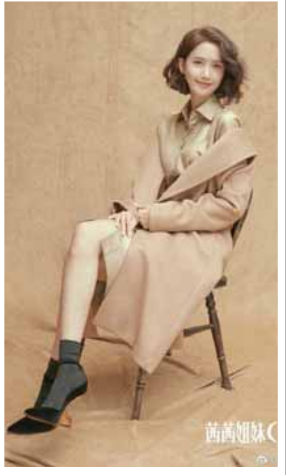
အေးပြည့် ရေးသားသည်

ယွန်နရဲ့ "CeCi China" မဂ္ဂဇင်းမှ မျက်နှာဖုံးဓာတ်ပုံတွေကို ထုတ်ဖော်ပြသခဲ့ပြီး သူ့ရဲ့ အားလပ်ရက်အတွင်း ရိုက်ကူးထားတဲ့ ဓာတ်ပုံတွေကိုလည်း ယွန်နက သူ့ရဲ့ လူမှုကွန်ရက်စာမျက်နှာပေါ်မှာ ဖော်ပြခဲ့တာဖြစ်ပါတယ်။ ဒါ့အပြင် ယွန်နဟာ တောင်ကိုရီးယားနိုင်ငံထုတ် "Marie Claire" မဂ္ဂဇင်းကြီးရဲ့ ဒီဇင်ဘာလထုတ် မဂ္ဂဇင်းမှာလည်း မျက်နှာဖုံးရှင်အဖြစ် ဖော်ပြခံခဲ့ရပါတယ်။ အဆိုပါမဂ္ဂဇင်းနှစ်ခုလုံးရဲ့ မျက်နှာဖုံးဓာတ်ပုံတွေကို ရိုက်ကူးရာမှာတော့ ရွှေရောင်အပြင်အဆင် တွေနဲ့ ဖန်တီးရိုက်ကူးထားတာကိုလည်း တွေ့ရပါတယ်။