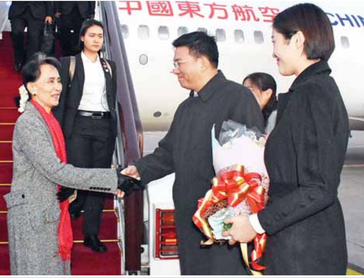
နိုင်ငံတော်၏အတိုင်ပင်ခံပုဂ္ဂိုလ် ဒေါ်အောင်ဆန်းစုကြည် ပေကျင်းလေဆိပ်သို့ ရောက်ရှိရာ တရုတ်ကွန်မြူနစ်ပါတီ နိုင်ငံတကာဆက်ဆံရေးဌာန ဒုတိယဝန်ကြီး မစ္စတာ ကောရဲ့ကျိုးနှင့် တာဝန်ရှိသူများက ကြိုဆိုနှုတ်ဆက်စဉ်။

ပေကျင်း နိုဝင်ဘာ ၃၀ နိုင်ငံတော်၏အတိုင်ပင်ခံပုဂ္ဂိုလ် ဒေါ်အောင်ဆန်းစုကြည်သည် အဖွဲ့ဝင် များနှင့်အတူ ယနေ့ နံနက်ပိုင်းတွင် နေပြည်တော်မှ အထူးလေယာဉ်ဖြင့် ထွက်ခွာရာ ဒေသစံတော်ချိန် နံနက် ၁၁ နာရီတွင် တရုတ်ပြည်သူ့သမ္မတ နိုင်ငံ ယူနန်ပြည်နယ် ကူမင်းမြို့သို့ ရောက်ရှိသည်။ နိုင်ငံတော်၏အတိုင်ပင်ခံပုဂ္ဂိုလ်နှင့် အဖွဲ့အား ယူနန်ပြည်နယ် ကွန်မြူနစ် ပါတီ အမြဲတမ်းကော်မတီအဖွဲ့ဝင်နှင့် အထွေထွေအတွင်းရေးမှူး Mr. Liu Huiyan၊ တရုတ်ပြည်သူ့သမ္မတ နိုင်ငံဆိုင်ရာ မြန်မာသံအမတ်ကြီး ဦးသစ်လင်းအုန်း၊ မြန်မာနိုင်ငံ ဆိုင်ရာ တရုတ်ပြည်သူ့သမ္မတနိုင်ငံ သံအမတ်ကြီး မစ္စတာ ဟွန်လျန်၊ မြန်မာကောင်စစ်ဝန်ချုပ် ဦးစိုးပိုင်၊ မြန်မာသံရုံးဝန်ထမ်းများနှင့် တာဝန် ရှိသူများက ကူမင်းအပြည်ပြည်ဆိုင်ရာ လေဆိပ်၌ ကြိုဆိုကြသည်။ ထို့နောက် နိုင်ငံတော်၏ အတိုင်ပင်ခံပုဂ္ဂိုလ်သည် မော်တော် ယာဉ်များဖြင့် ခေတ္တနားနေမည့် ကူမင်းမြို့ Hai Geng Garden Hotel သို့ ရောက်ရှိရာ ယူနန်ပြည်နယ် ကွန်မြူနစ်ပါတီ အတွင်းရေးမှူး စာမျက်နှာ ၃ ကော်လံ ၃ သို့