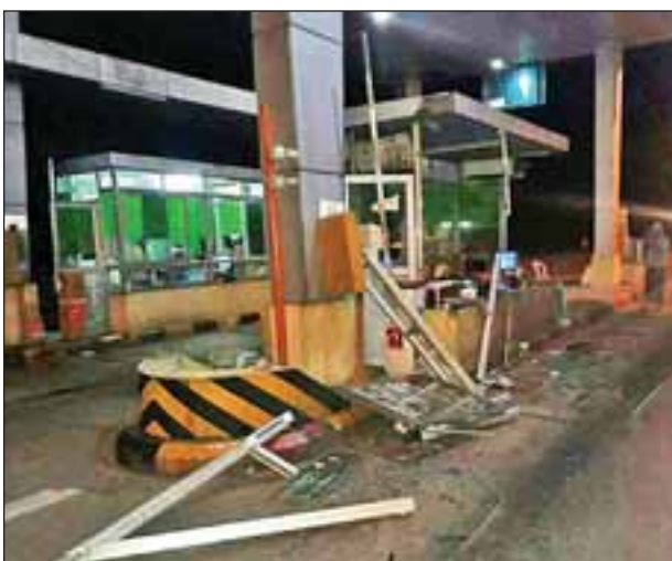
(၁၁၅) မိုင် ပြူးတိုးဂိတ်နှင့် စကားအင်းတိုးဂိတ်တို့ကို ခရီးသည်တင် Express ယာဉ်များ ဝင်တိုက်

နေပြည်တော် နိုဝင်ဘာ ၃၀ ရန်ကုန်- မန္တလေးအမြန်လမ်းမကြီး မိုင်တိုင် (၁၁၅/၀) ရှိ ပြူး လမ်း အသုံးပြုခကောက်ခံရေးစခန်း တိုးဂိတ်အား နေပြည်တော်မှ ရန်ကုန်သို့ ယာဉ်မောင်း ရောင်း မောင်းနှင်လာသည့် Express ခရီးသည်တင်ယာဉ်က ယနေ့နံနက် ၁ နာရီခန့်က ဝင်တိုက်မိခဲ့သည်။ အလားတူ ယမန်နေ့ ၉ နာရီခွဲကလည်း မိုင်တိုင် (၃၅၂/၁)ရှိ စကားအင်း လမ်းအသုံးပြုခကောက်ခံရေး တိုးဂိတ်အား မန္တလေးမှ နေပြည်တော်သို့ ယာဉ်မောင်း စောအယ်ထူး မောင်းနှင်လာသော ခိုင်မန္တလေး ခရီးသည်တင်ယာဉ်က ဝင်တိုက်မိခဲ့သည်။ ဖြစ်စဉ်များကြောင့် Express ခရီးသည်တင်ယာဉ်များပေါ် လိုက်ပါလာ သည့် ခရီးသည်များနှင့် တိုးဂိတ် ငွေကောက်ခံရေးစခန်းများမှ ဝန်ထမ်းများ ထိခိုက်မှုမရှိကြောင်း သိရသည်။ ဖြစ်စဉ်နှင့်စပ်လျဉ်း၍ ယာဉ် မဆင်မခြင် မောင်းနှင်သော ခရီးသည်တင် ယာဉ်မောင်းများအား သက်ဆိုင်ရာက အမှုဖွင့်ထားကြောင်း သိရ သည်။ သန်းဦး(လေးမျက်နှာ) ဓာတ်ပုံ(အမြန်လမ်းရဲတပ်ဖွဲ့)