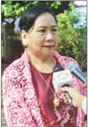
ဒေါက်တာ နဲ့.နဲ့.ရီ