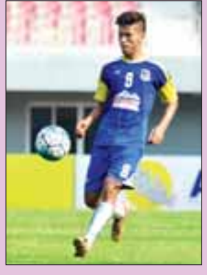
ရှင်းထက်ဇော်