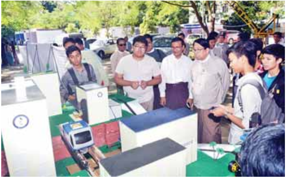
ညနေပိုင်းတွင် ပြည်ထောင်စုဝန်ကြီးသည် ရန်ကုန် တက္ကသိုလ်၌ ကျင်းပမည့် လူငယ်ဘက်စုံဖွံ့ဖြိုးရေးပွဲတော် တွင် လူမှုဝန်ထမ်း၊ ကယ်ဆယ်ရေးနှင့် ပြန်လည်နေရာ ချထားရေးဝန်ကြီးဌာနက ခင်းကျင်းပြသထားသည့် ပြခန်း များ၊ ရန်ကုန်မြို့တော် စည်ပင်သာယာရေးကော်မတီမှ ဆောင်ရွက်လျက်ရှိသည့် သန့်ရှင်းရေးလုပ်ငန်းဆိုင်ရာများ နှင့် ပြခန်းများ ပြင်ဆင်နေမှုများကို လှည့်လည်ကြည့်ရှု သတင်းစဉ်