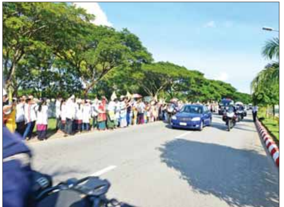
မြန်မာနိုင်ငံ၌ တရားဝင်ချစ်ကြည်ရေးခရီး ရောက်ရှိနေသော ပုပ်ရဟန်းမင်းကြီး ဖရန်စစ် နေပြည်တော်သို့ ရောက်ရှိလာရာ လမ်းဘေး ဝဲ၊ ယာမှ ကြိုဆိုနှုတ်ဆက်နေကြသူများကို တွေ့ရစဉ်။