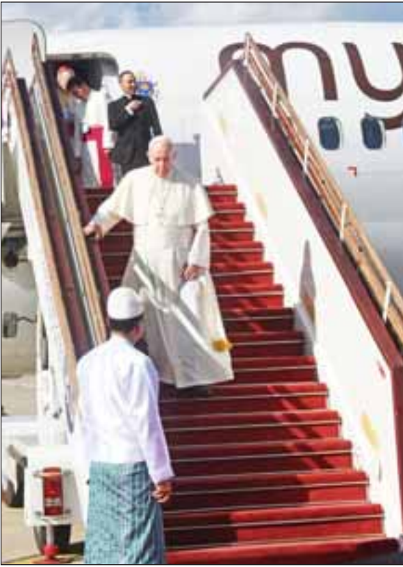
မြန်မာနိုင်ငံ၌ တရားဝင်ချစ်ကြည်ရေးခရီး ရောက်ရှိနေသော ပုပ်ရဟန်းမင်းကြီး ဖရန်စစ် နေပြည်တော်လေဆိပ်သို့ ရောက်ရှိလာစဉ်။