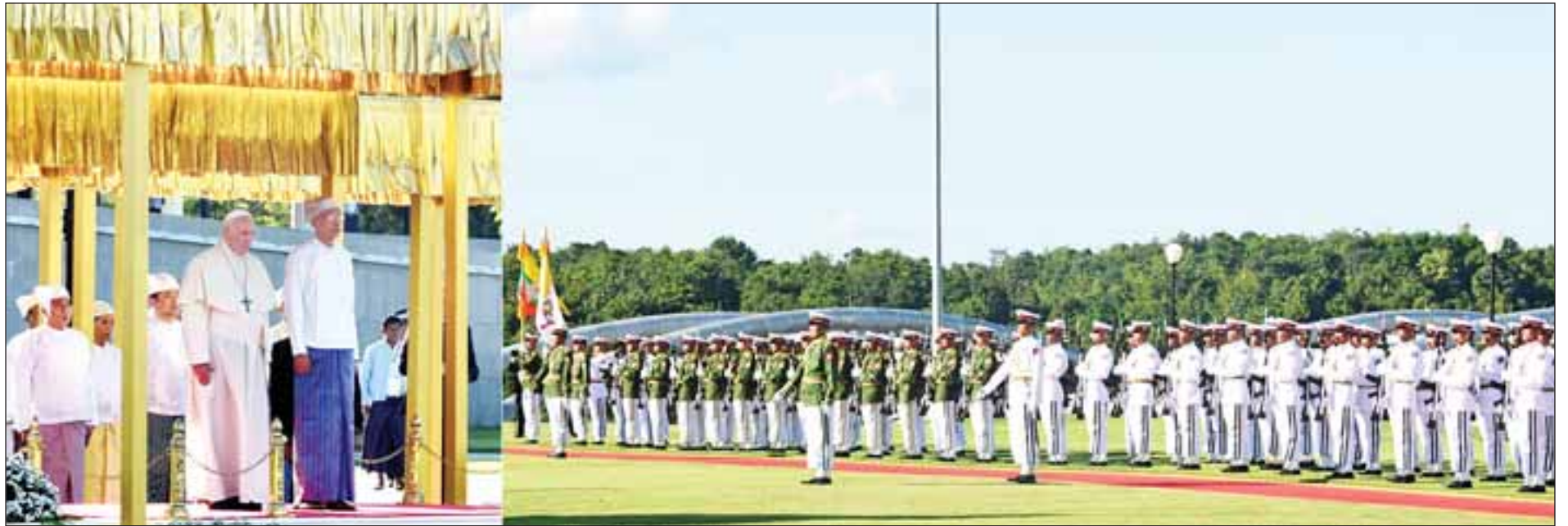
နိုင်ငံတော်သမ္မတ ဦးထင်ကျော် ပုပ်ရဟန်းမင်းကြီး ဖရန်စစ်အား နေပြည်တော်ရှိ နိုင်ငံတော်သမ္မတအိမ်တော်၌ ဂုဏ်ပြုအခမ်းအနားဖြင့် ကြိုဆိုစဉ်။