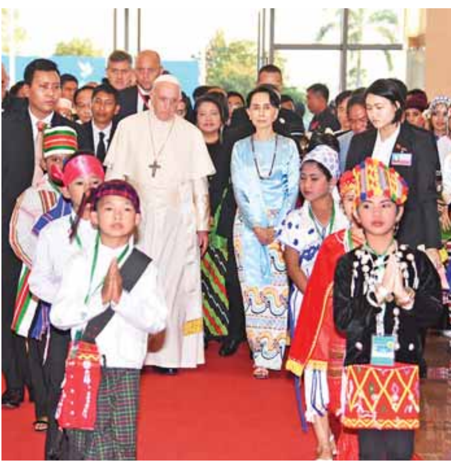
နိုင်ငံတော်၏အတိုင်ပင်ခံပုဂ္ဂိုလ် ဒေါ်အောင်ဆန်းစုကြည်၊ ပုပ်ရဟန်းမင်းကြီး ဖရန်စစ်နှင့် အခမ်းအနားသို့ တက်ရောက်လာသူများကို အတူတကွ တွေ့ရစဉ်။

ပုပ်ရဟန်းမင်းကြီး ဖရန်စစ်သည် နိုဝင်ဘာ ၂၉ ရက်တွင် ရန်ကုန်မြို့ ကျိုက္ကဆံကွင်းတွင် လူထုပရိသတ်နှင့် မစ္စားပူဇော်ဝတ်ပြုဆုတောင်းခြင်း၊ ကမ္ဘာအေး သံယာဗဟိုဌာန၌ နိုင်ငံတော် သံယာဗဟာနာယကအဖွဲ့နှင့် သွား ရောက်တွေ့ဆုံခြင်း၊ စိန့်မေရီဘုရား ကျောင်းတွင် မြန်မာနိုင်ငံကက်သလစ် ဆရာတော်ကြီးများနှင့် တွေ့ဆုံ ခြင်းများ ဆောင်ရွက်ပြီး နိုဝင်ဘာ ၃၀ ရက်တွင် ဘင်္ဂလားဒေ့ရှ်နိုင်ငံသို့ ဆက်လက်သွားရောက်မည် ဖြစ် ကြောင်း သိရသည်။ သတင်းစဉ်