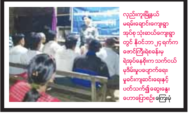
လည်းကူးမြို့နယ် မရမ်းခေရင်းကျေးရွာ အုပ်စု သုံးဆယ်ကျေးရွာ တွင် နိုဝင်ဘာ ၂၄ ရက်က ဖောင်ကြီးရဲစခန်းမှ ရဲအုပ်နေဦးက သက်ဝယ် မုဒိမ်းမှုပပျောက်ရေး၊ မှုခင်းကျဆင်းရေးနှင့် ပတ်သက်၍ ဆွေးနွေးဟောပြောစဉ် ကြေးမုံ

ရှိ အကျကျကျေးရွာ၊ အိမ်ထောင်စု ၁၀၀၊ လူဦးရေ ၆၇၂ ဦးရှိ နန်ကျင်ကျေးရွာနှင့် အိမ်ထောင်စု ၆၂ စုမှ လူဦးရေ ၅၁၃ ဦးရှိ သင်္ဃန်းကျင် ကျေးရွာတို့အား မြစ်စိမ်းရောင်ကျေးရွာစီမံကိန်းလုပ်ငန်းအကောင်အထည်ဖော်ဆောင်ရွက်သည့် အခြေအနေများ၊ ကျေးရွာစာသင်ကျောင်းများတွင် ရေတိုက်ပြင်ဆင်ပြီးစီးမှုနှင့် ကျေးရွာကုန်ထုတ်လမ်းသစ်ဖောက်လုပ်မည့် အခြေအနေများအား ကွင်းဆင်းစစ်ဆေးခဲ့ရာ မြို့နယ်ဦးစီးမှူးဦးဝင်းတင့်နှင့် ဝန်ထမ်းများ၊ မြစ်စိမ်းရောင်ကျေးရွာစီမံကိန်းကော်မတီဝင်များက ရှင်းလင်းတင်ပြခဲ့ကြောင်း သိရသည်။ ဦးလေးကြီး