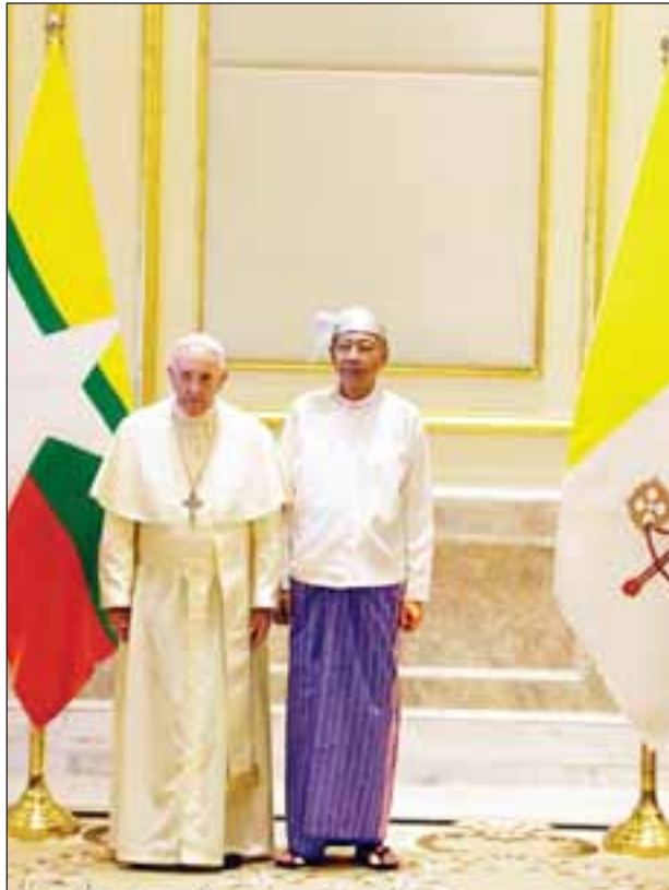
နိုင်ငံတော်သမ္မတ ဦးထင်ကျော်နှင့် ပုပ်ရဟန်းမင်းကြီး ဖရန်စစ်တို့ သမ္မတအိမ်တော်တွင် မှတ်တမ်းတင်ဓာတ်ပုံရိုက်စဉ်။