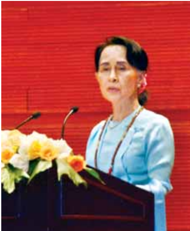
နိုင်ငံတော်၏အတိုင်ပင်ခံပုဂ္ဂိုလ် ဒေါ်အောင်ဆန်းစုကြည် ကြိုဆိုနှုတ်ခွန်းဆက်စကား ပြောကြားစဉ်။

မြန်မာနိုင်ငံဟာ စိန်ခေါ်မှုတွေအများအပြားနဲ့ဆိုင်နေရပြီး စိန်ခေါ်မှု တစ်ခုချင်းစီတိုင်းအတွက် ခွန်အား၊ စိတ်ရှည်သည်းခံမှုနဲ့ရဲရင့်မှုတွေလိုအပ်ပါတယ်။ ကျွန်ုပ်တို့နိုင်ငံဟာ သဘာဝသယံဇာတပေါကြွယ်ဝမှုတွေနဲ့ ပြည့်စုံနေတဲ့နောက်ခံ အလှတရားကိုအခြေပြုပြီး မတူကွဲပြားတဲ့ ပြည်သူတွေ၊ ဘာသာစကားတွေနဲ့ ကိုးကွယ်ယုံကြည်မှုတွေ အမျိုးမျိုးရောယှက်နေတဲ့ ပိတ်ကားထက်ကပ်နန်းချိကား တစ်ချပ်နဲ့ တူညီပါတယ်။ ပြည်သူတွေရဲ့ အခွင့်အရေးတွေကို ကာကွယ်ခြင်း၊ စိတ်ရှည်သည်းခံမှုကိုမျှော်မှန်းခြင်းနဲ့အားလုံးအတွက် လုံခြုံမှုကို အာမခံပေးနိုင်ခြင်းဖြင့် မတူကွဲပြားမှုတွေရဲ့ ပေါင်းစပ်အလှတရားကိုဖော်ဆောင်ဖို့ တာဝန်ဟာ ကျွန်ုပ်တို့အစိုးရရဲ့ ရည်မှန်းချက်ပုံဖြစ်ပါတယ်။ ကျွန်ုပ်တို့ရဲ့ တန်ဖိုးအထားဆုံး ကြိုးပမ်းအားထုတ်မှုတစ်ခုကတော့ အရင်အစိုးရကအပြုပေးခဲ့တဲ့ တစ်နိုင်ငံလုံး