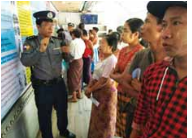
ရန်ကင်း(မြန်/ဆက်)

ပြိုင်ပွဲကို မူလတန်း၊ အလယ်တန်းအဆင့်ကျောင်းသား ကျောင်းသူ ၃၈ ဦး ဝင်ရောက်ယှဉ်ပြိုင်ခဲ့ကြပြီး ပထမ၊ ဒုတိယ၊ တတိယနှင့် နှစ်သိမ့်ဆုများအား တာဝန်ရှိသူများက ဆုများအသီးသီးပေးအပ်ခဲ့ကြပြီး ဆုရမများ ကျောင်းသား ကျောင်းသူများနှင့် မိဘများ ၅၀ ခန့် တက်ရောက်ခဲ့ကြသည်။