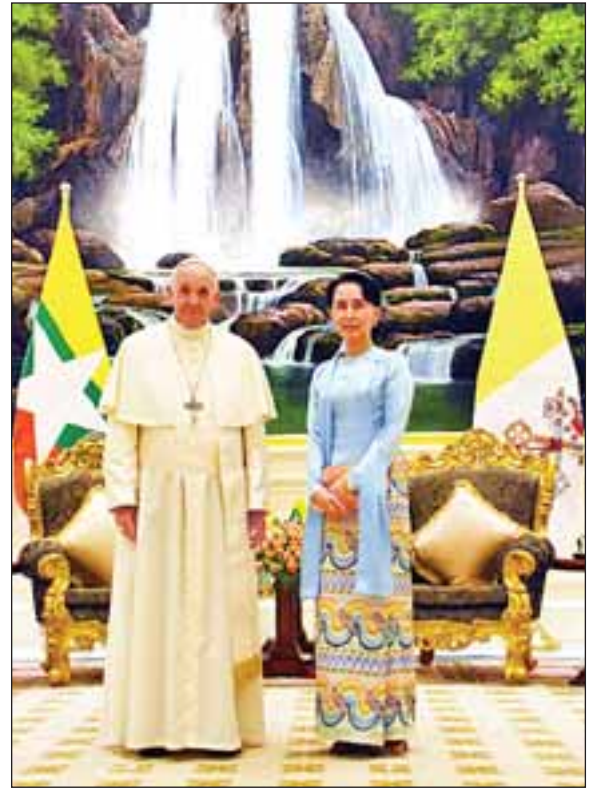
နိုင်ငံတော်၏အတိုင်ပင်ခံပုဂ္ဂိုလ် ဒေါ်အောင်ဆန်းစုကြည်နှင့် ပုပ်ရဟန်းမင်းကြီး ဖရန်စစ်တို့ သမ္မတအိမ်တော် သံတမန်ဆောင်ရွက်ခန်းမတွင် မှတ်တမ်းတင်ဓာတ်ပုံရိုက်စဉ်။