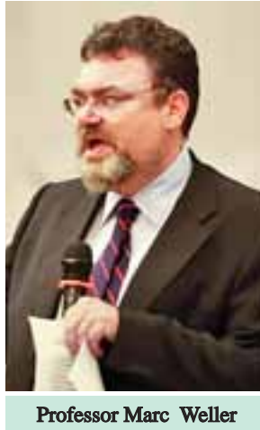
Professor Marc Weller

တိုင်း ဖွံ့ဖြိုးတိုးတက်မှုအတွက် သယံ ဇာတ(Resources)က အဓိကဖြစ်ပါတယ်။ သယံဇာတကို ခွဲဝေ အသုံးပြု တဲ့အခါမှာ သက်ဆိုင်ရာ ဒေသမှာရှိတဲ့ ဦးဆောင်သူတွေက မိမိဒေသဖွံ့ဖြိုး တိုးတက်မှုမှာ အလိုအပ်ဆုံးဖြစ်တဲ့ လိုအပ်ချက်တွေအပေါ် မူတည်ပြီး ဦးစားပေး အစီအစဉ်တွေ ချမှတ်ကာ ဒေသထွက် သယံဇာတတွေနဲ့ စနစ် တကျ ခွဲဝေအသုံးပြုရမှာဖြစ်ပါတယ်။ မိမိဒေသမှာ လမ်းပန်းဆက်သွယ် ရေး၊ တံတား၊ ရေ၊ မီး၊ လျှပ်စစ်တွေနဲ့ ပတ်သက်ပြီး ပါဝင်ဆောင်ရွက်မှုတွေ မှာ ဒေသကနေဦးဆောင်ပြီး စီမံကိန်း တွေရေးဆွဲတဲ့အခါမှာ ဒေသန္တရ စီမံကိန်းဆိုတာ အရေးကြီးပါတယ်။ ဒီစီမံကိန်းတွေက သူတို့ချမှတ်တဲ့ စီမံကိန်း၊ အတည်ပြုတဲ့ စီမံကိန်း၊ ဒေသဆိုင်ရာဖွံ့ဖြိုးမှုအတွက် လိုအပ် နေတဲ့ စီမံကိန်းတွေကို ownership ရယူရမှာဖြစ်ပါတယ်။ ownership ရယူမှုသာလျှင် သက်ဆိုင်ရာ ပါဝင် ပတ်သက်သူတွေ ဖွံ့ဖြိုးမှုမှာ ပိုပြီးတော့ ပါဝင်လာမှာ ဖြစ်ပါတယ်။