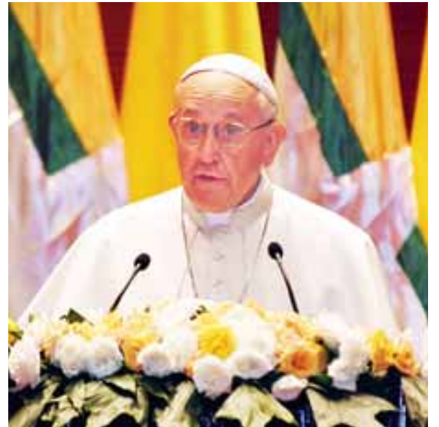
ပုပ်ရဟန်းမင်းကြီး ဖရန်စစ် မိန့်ခွန်းပြောကြားစဉ်။

ယနေ့ ခေတ်ကာလတွင်ပင် အနာဂတ်သည် နိုင်ငံ၏ လူငယ်များလက်ထဲတွင် ရှိနေပါသည်။ လူငယ်များဟူသည်မှာ အမြတ်တနိုးထားပြီး မြေတောင်မြောက်ပေးရမည့် လက်ဆောင်မွန်တစ်ခု၊ အလုပ်အကိုင်အခွင့်အလမ်းနှင့် အရည်အသွေးရှိသော ပညာရေးကို မှန်ကန်စွာ ဖန်တီးပေးလျှင် ကြီးမားစွာ အကျိုးဖြစ်ထွန်းစေမည့် ရင်းနှီးမြုပ်နှံမှုတစ်ခု ဖြစ်ပါသည်။ ၎င်းသည် သားစဉ်မြေးဆက်များအကြား တရားမျှတမှုအတွက် အရေးပေါ်လိုအပ်ချက်တစ်ခု