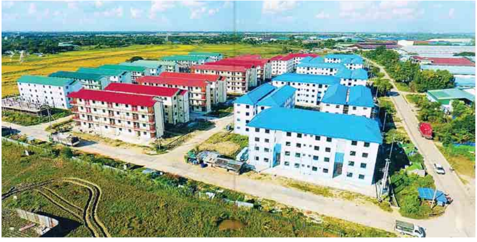
ဒဂုံမြို့သစ်(ဆိပ်ကမ်း) မြို့နယ် ကနောင်တန်ဖိုးနည်းအိမ်ရာ စီမံကိန်းမှ တိုက်ခန်းများကို တွေ့ရစဉ်။