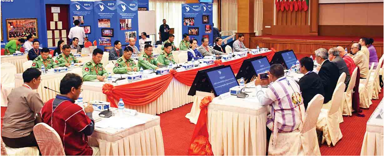
(၆)ကြိမ်မြောက် တစ်နိုင်ငံလုံးပစ်ခတ်တိုက်ခိုက်မှုရပ်စဲရေး သဘောတူစာချုပ် အကောင်အထည်ဖော် ဆောင်ရွက်နိုင်မှုဆိုင်ရာ ညှိနှိုင်းအစည်းအဝေး ကျင်းပစဉ်။

အစည်းအဝေးသို့ ဒုတိယ တပ်မတော်ကာကွယ်ရေးဦးစီးချုပ် ကာကွယ်ရေးဦးစီးချုပ် (ကြည်း) ဒုတိယဗိုလ်ချုပ်မှူးကြီး စိုးဝင်း၊ နိုင်ငံတော်အတိုင်ပင်ခံရုံးဝန်ကြီးဌာန ပြည်ထောင်စုဝန်ကြီး ဦးကျော်တင့် ဆွေ၊ ပြည်ထောင်စုရှေ့နေချုပ် ဦးထွန်းထွန်းဦး၊ ငြိမ်းချမ်းရေး ကော်မရှင်ဥက္ကဋ္ဌ ဒေါက်တာတင်မျိုးဝင်း၊ လွှတ်တော်ကိုယ်စားလှယ်များ၊ တပ်မတော်အရာရှိကြီးများ၊ ဒုတိယ ဝန်ကြီးများနှင့် NCA လက်မှတ်ရေး ထိုးထားသည့် တိုင်းရင်းသား လက်နက်ကိုင်အဖွဲ့ ရှစ်ဖွဲ့မှ ခေါင်းဆောင်များ၊ JICM ကိုယ်စား လှယ်များနှင့် ဖိတ်ကြားထားသူများ တက်ရောက်ကြသည်။