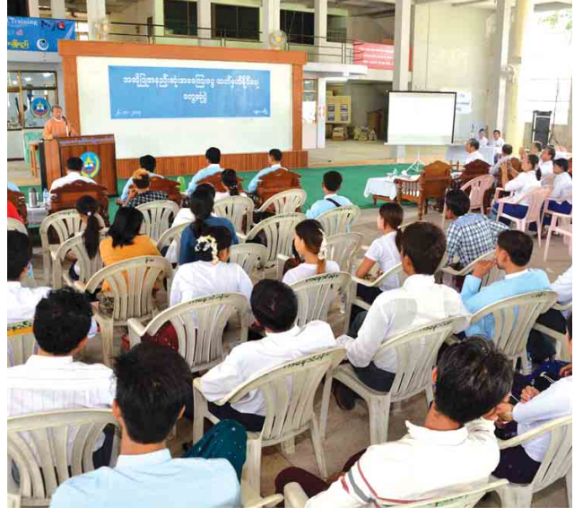
ရုံများမှ အလုပ်သမားကိုယ်စားလှယ် မိဒီယာသမားများ တက်ရောက်ခဲ့ များ၊ အလုပ်ရှင်ကိုယ်စားလှယ်များ၊ ကြောင်း သိရသည်။ ဖိတ်ကြားထားသူများနှင့် သတင်း သန်းစော်မင်း(ပြန်/ဆက်)

ပြည်ကြီးတံခွန် နိုဝင်ဘာ ၂၇ အဆိုပြု အနည်းဆုံးအခကြေးငွေ သတ်မှတ်နိုင်ရေး တွေ့ဆုံဆွေးနွေးပွဲကို မန္တလေးမြို့ ပြည်ကြီးတံခွန်မြို့နယ် စက်မှုဇုန်ရုံ ကနောင်ခန်းမ၌ နိုဝင်ဘာ ၂၆ ရက် နံနက် ၉ နာရီက ကျင်းပသည်။ မန္တလေးတိုင်းဒေသကြီး အနည်းဆုံးအခကြေးငွေ သတ်မှတ်ရေးဆိုင်ရာ ကော်မတီဥက္ကဋ္ဌ မန္တလေးတိုင်းဒေသကြီး သယံဇာတနှင့် သဘာဝပတ်ဝန်းကျင်ထိန်းသိမ်းရေးဝန်ကြီး ဦးမျိုးသစ်က အမှာစကားပြောကြားသည်။ ထို့နောက် အနည်းဆုံးအခကြေးငွေ သတ်မှတ်နိုင်ရေးဆိုင်ရာ ကော်မတီအတွင်းရေးမှူး အလုပ်သမားညွှန်ကြားမှုဦးစီးဌာန ညွှန်ကြားရေးမှူး ဦးဝင်းရှိန်က အနည်းဆုံးအခကြေးငွေ သတ်မှတ်နိုင်ရေးနှင့်ပတ်သက်၍ ရှင်းလင်းဆွေးနွေးရာ တက်ရောက်လာသော စက်ရုံ၊ အလုပ်ရုံအလုပ်သမား ကိုယ်စားလှယ်များက အနည်းဆုံးအခကြေးငွေ