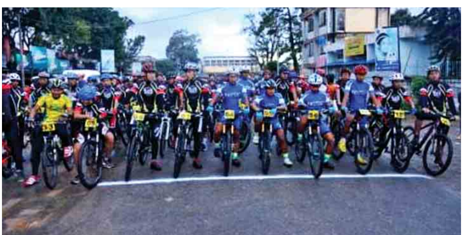
ရွှေသို့ ပြန်လည်တာဝန်ပေးသည်။ အသက်(၃၅) နှစ်မှ (၄၅) နှစ်အတွင်း ဖြိုင်ပွဲဝင်မှ အသက် (၂၅) နှစ် (အနီရောင်)၊ အသက် (၄၅)နှစ် အောက် (အဝါရောင်)အသက် (၂၅) အထက် (အဖြူရောင်)ဟူ၍ အရောင် နှစ်မှ (၃၅) နှစ်(အစိမ်းရောင်)၊ ဖျားသတ်မှတ်ကာ ဝင်ရောက် ယှဉ်ပြိုင်ကျင်းပခဲ့ပြီး အပျော်တမ်း စက်ဘီးစီး အားကစားသမားစုစုပေါင်း ၃၀၆ ဦးဖြစ်ကြောင်း သိရသည်။

ရွှေဘုန်းပွင့်မှ ဆေးတက္ကသိုလ်ကျောင်း၊ ဆေးတက္ကသိုလ်မှ ဗိုလ်ချုပ်အောင်ဆန်းလမ်း၊ ဗိုလ်ချုပ်အောင်ဆန်းလမ်းမှ အရှေ့မြို့ပတ်လမ်း၊ အရှေ့မြို့ပတ်လမ်းမှ လေ့ကျင့်ရေး အားကစားရုံသို့ ပြန်လည်ပန်းဝင်ခဲ့သည်။ အမျိုးသား အမျိုးသမီး အပျော်တမ်းစက်ဘီးစီးအဖွဲ့သည် ပြည်နယ်အားကစား လေ့ကျင့်ရေးမှ စတင်၍ ဗိုလ်ချုပ်အောင်ဆန်း လမ်းတစ်လျှောက်မှ စစ်စံထွန်း ပြည်သူ့ဆေးရုံထိ၊ စစ်စံထွန်းပြည်သူ့ဆေးရုံမှ ဗိုလ်ချုပ်အောင်ဆန်းလမ်းတစ်လျှောက်အတိုင်း အပျော်စက်ဘီးစီး အားကစားသမားများက ပြည်နယ်အားကစားလေ့ကျင့်ရုံ