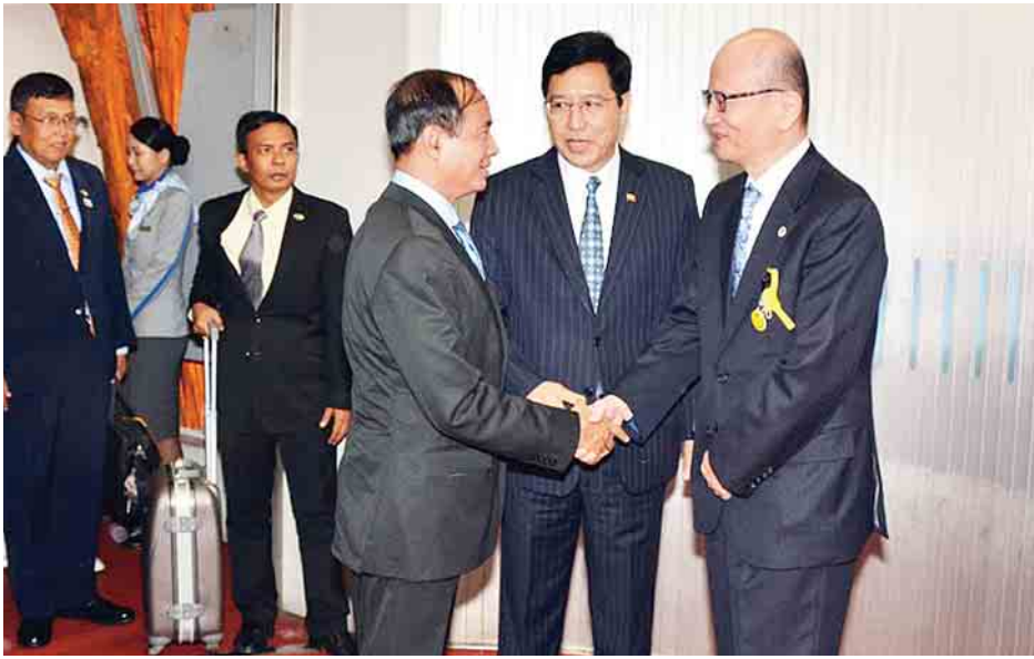
ပြည်သူ့လွှတ်တော်ဥက္ကဋ္ဌ ဦးဝင်းမြင့်နှင့်အဖွဲ့အား ဂျပန်နိုင်ငံ အောက်လွှတ်တော်မှ တာဝန်ရှိပုဂ္ဂိုလ်များနှင့် မြန်မာသံရုံး တာဝန်ရှိသူများက Narita အပြည်ပြည်ဆိုင်ရာလေဆိပ်၌ ကြိုဆိုနှုတ်ဆက်ကြစဉ်။