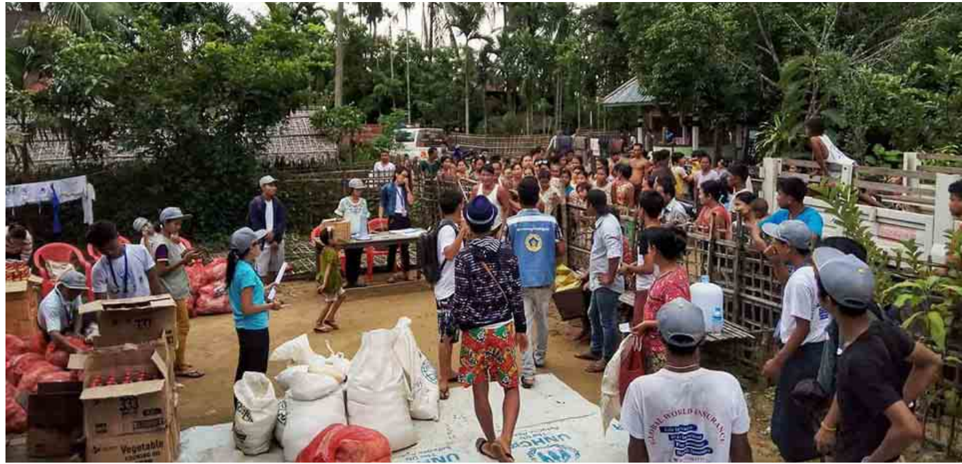
'ပြည်သူ့အတွက် လူငယ် ရက် ၂၀' စေတနာ့ဝန်ထမ်းလူငယ်များ လုပ်အားပေး အစီအစဉ် ပထမအသုတ် အဖြစ် နိုဝင်ဘာ ၁၃ ရက်မှ ၂၀ ရက်အထိ ဘူးသီးတောင်နှင့် မောင်တောမြို့များရှိ ကျေးရွာများသို့ ကွင်းဆင်းပြီး လူမှုကူညီရေးလုပ်ငန်းများ ဆောင်ရွက်နေမှုကို တွေ့ရစဉ်။

လူငယ်မူဝါဒနှင့်အတူ လူငယ်များအတွက် လုပ်ငန်းအစီအစဉ်များ ချမှတ်ဆောင်ရွက်ခြင်းဖြင့် ယနေ့လူငယ်များသည် အနာဂတ်ကလေးလူငယ်များ၏ ရှေ့ဆောင်လမ်းပြကောင်းများအဖြစ် ဦးဆောင်လမ်းပြနိုင် မည်လည်း ဖြစ်ပါသည်။ ထို့ကြောင့် လူငယ်မူဝါဒ ပေါ်ထွက်လာပြီး နောက်ပိုင်း လူငယ်များ ဖွံ့ဖြိုးတိုးတက် ရေးအတွက် ဆောင်ရွက်သွားမည့် မဟာဗျူဟာလုပ်ငန်း စဉ်များတွင် မိမိတို့၏အနာဂတ်မျိုးဆက်သစ်လူငယ် များအတွက် အစိုးရ၊ လူငယ်များနှင့်အတူ ပြည်သူ့လူထု တစ်ရပ်လုံး တက်တက်ကြွကြွနှင့် ပူးပေါင်းပါဝင် ဆောင် ရွက်ပေးကြပါရန် တိုက်တွန်းနှိုးဆော်အပ်ပါသည်။ ။