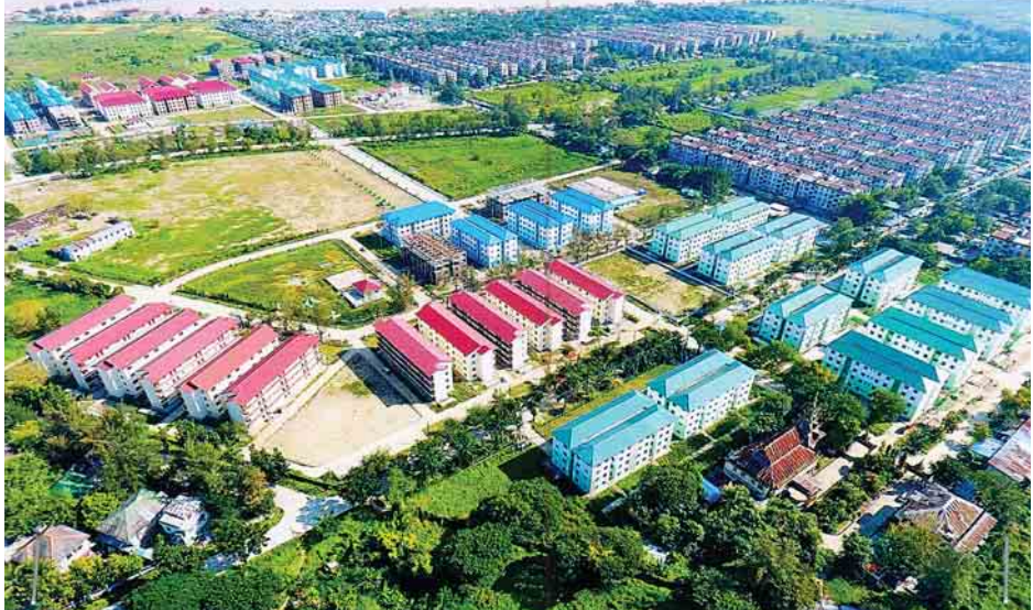
ယုဇန တန်ဖိုးနည်းအိမ်ရာစီမံကိန်း အပိုင်း(၁)မှ တိုက်များကို တွေ့ရစဉ်။

ရွှေလင်ပန်းစက်မှုဇုန်အနီးမှ ရွှေလင်ပန်းတန်ဖိုးနည်း အိမ်ရာစီမံကိန်းအပိုင်း(၁)ကို ၂၀၁၂-၂၀၁၃ ဘဏ္ဍာနှစ်တွင် ကြမ်းခင်းဧရိယာအကျယ် ၄၆၈ ဧက ပေးရရှိသော ခြောက်ခန်းတွဲ လေးထပ်အဆောက်အအုံ ၃၂ လုံး စတင် တည်ဆောက်ပြီး အခန်းပေါင်း ၇၆၈ ခန်းကို ရန်ကုန်တိုင်းဒေသကြီး အစိုးရအဖွဲ့အစီအစဉ်ဖြင့် ရောင်းချနိုင်ရန် လွှဲပြောင်းပေးခဲ့သည်။ တန်ဖိုးနည်းအိမ်ရာများကို ဝင်ငွေနည်းပြည်သူများ ပိုမိုဝယ်ယူနိုင်ရန်အတွက် ဘဏ်ချေးငွေကုလအား လေးနှစ်မှ ရှစ်နှစ်သို့ တိုးမြှင့်ပေးခဲ့ပြီး ဘဏ်အတိုးနှုန်းမှာ ၁၂ ရာခိုင်နှုန်းဖြစ်ကာ ဘဏ်ချေးငွေရယူမည်ဆိုပါက အခန်းတန်ဖိုး၏ ၃၀ ရာခိုင်နှုန်းအား ဆောက်လုပ်ရေးနှင့် အိမ်ရာဖွံ့ဖြိုးရေးဘဏ် (CHD Bank) တွင် လက်ငင်းပေးချေရမည့်ငွေ (Down Payment) အဖြစ် ပေးသွင်းရသည်။ ရွှေလင်ပန်း တန်ဖိုးနည်းအိမ်ရာစီမံကိန်း အပိုင်း(၁) စတင်ဆောင်ရွက်ခဲ့မှုအပေါ် ပြည်သူများစိတ်ဝင်စားမှုနှင့် ဝယ်ယူအားများလာသဖြင့် ရွှေလင်ပန်းတန်ဖိုးနည်းအိမ်ရာစီမံကိန်း အပိုင်း(၂)ကို ရှစ်ခန်းတွဲ လေးထပ်တိုက် ၁၆ လုံး၊ အပိုင်း(၃)ကို ခြောက်ခန်းတွဲ လေးထပ်တိုက်အလုံး ၂၀ စုစုပေါင်း အပိုင်း(၂)နှင့် (၃)တို့မှ အခန်းပေါင်း ၁၀၀၀ နှင့် ကျန်စစ်မင်းတန်ဖိုးနည်းအိမ်ရာ အပိုင်း(၁)မှ အခန်းပေါင်း ၃၀၀၀ တို့ကို တည်ဆောက်လျက်ရှိသည်။ တန်ဖိုးနည်းအိမ်ရာများကို ဦးစားပေးရောင်းချလျက်ရှိရာ ပြည်သူများဘက်မှ အထူးယုံ