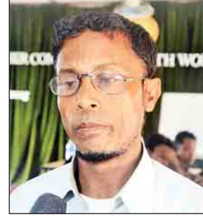
ဟာဘဲလ်ဆာမတ်

အခုသင်တန်းက လူထုကျန်းမာရေးလုပ်သား သင်တန်းဖြစ်ပါတယ်။ ဒီသင်တန်းမှာ ကျွန်တော်အပါအဝင် မြို့နယ်မှာရှိတဲ့ ကျန်းမာရေးဝန်ထမ်း သင်တန်းဆရာ ခုနစ်ယောက်နဲ့ စုစည်းပြီး သင်ကြားပေးသွားမှာ ဖြစ်ပါတယ်။ ကျွန်တော်သင်ပြပေးရတဲ့အပိုင်းက ကျန်းမာရေးလုပ်သား တစ်ယောက်မှာရှိသင့်တဲ့ အရည်အချင်းတွေ၊ တာဝန်ဝတ္တရားတွေ၊ ကျေးရွာတွေရောက်သွားရင် သူတို့ လုပ်ကိုင်ရမယ့် တာဝန်တွေကို သင်ပါတယ်။ ရပ်ရွာတွေမှာ ဖြစ်လေ့ဖြစ်ထ ရှိတဲ့ ရောဂါတွေအကြောင်း၊ နာတာရှည်၊ ဆီးချို၊ သွေးချို၊ သွေးတိုး၊