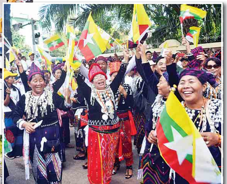
ပုပ်ရဟန်းမင်းကြီး ဖရန်စစ် မြန်မာနိုင်ငံသို့ ရောက်ရှိလာရာ ကက်သလစ်ဘာသာဝင်များ၊ ပြည်သူများက လမ်းဘေး ဝဲ၊ ယာ တစ်လျှောက် သောင်းသောင်းဖြဖြ ကြိုဆိုနေကြသည့် မှတ်တမ်းဓာတ်ပုံများ