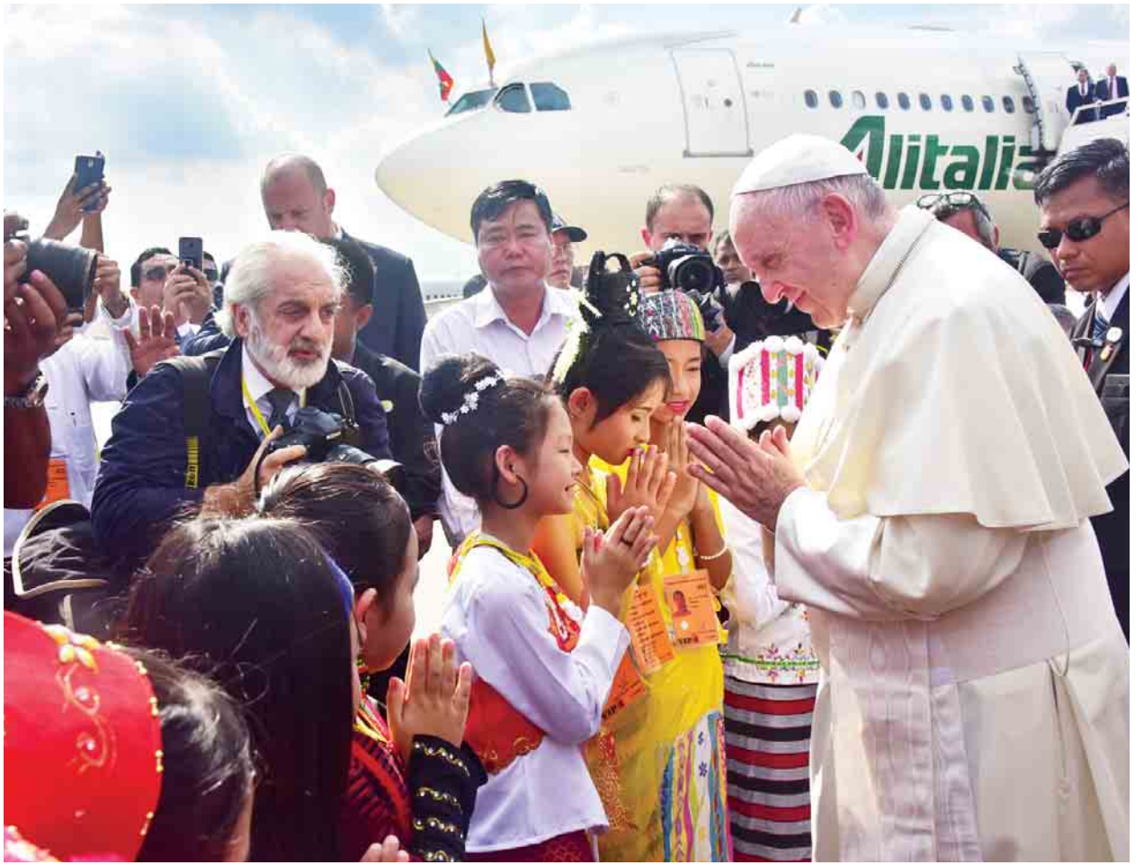
ပုပ်ရဟန်းမင်းကြီး ဖရန်စစ်အား ရန်ကုန်အပြည်ပြည်ဆိုင်ရာလေဆိပ်တွင် တာဝန်ရှိသူများနှင့် သာသနာပြုကလေးငယ်များက ကြိုဆိုနှုတ်ဆက်ကြစဉ်။

နိုင်ငံတော်၏အတိုင်ပင်ခံပုဂ္ဂိုလ် ဒေါ်အောင်ဆန်းစုကြည် (၆) ကြိမ်မြောက် တစ်နိုင်ငံလုံး ပစ်ခတ်တိုက်ခိုက်မှုရပ်စဲရေး သဘောတူစာချုပ် အကောင်အထည်ဖော်ဆောင်ရွက်နိုင်မှုဆိုင်ရာ ညှိနှိုင်းအစည်းအဝေး တက်ရောက် သတင်း စာမျက်နှာ - ၈