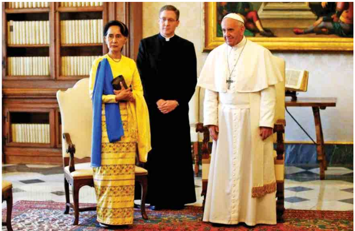
ပုပ်ရဟန်းမင်းကြီး ဖရန်စစ်နှင့် နိုင်ငံတော်၏အတိုင်ပင်ခံပုဂ္ဂိုလ် ဒေါ်အောင်ဆန်းစုကြည်တို့ ၂၀၁၇ ခုနှစ် မေလ ၄ ရက်က ဗာတီကန်၌ တွေ့ဆုံကြစဉ်။

ရဟန်းမင်းကြီးသည် သံတမန်ရေးအရ ပေါင်းကူးတံတားခင်းမှု လုပ်ငန်းများကိုလည်း အင်တိုက်အားတိုက် ဆောင်ရွက်လျက်ရှိပြီး ကျူးဘားနှင့် အမေရိကန်တို့ကို ရန်ဘက်အဖြစ်မှ မိတ်ဖက်အဖြစ်သို့ ကူးပြောင်းစေရန် သံတမန်ရေးအရ ကြိုးပမ်းခဲ့မှုကို သာဓကဆောင်နိုင်သည်။ မည်သည့် နိုင်ငံရေးဝါဒဘက်မှ ဘက်လိုက်ခြင်းမရှိသူ ရဟန်းမင်းကြီးသည် ငြိမ်းချမ်းရေး၏ တမန်တော်အဖြစ် တရားဓမ္မနှင့်အညီ ရပ်တည်နေသူအဖြစ် ကမ္ဘာက ရှုမြင်ကြရာ ကျွန်ုပ်တို့ မြန်မာနိုင်ငံသို့ နိုင်ငံသားများကလည်း ရဟန်းမင်းကြီး၏ခရီးစဉ်ကို ငြိမ်းချမ်းရေးအတွက် အတိတ်ကောင်း၊ နိမိတ်ကောင်းအဖြစ် ရှုမြင်ကြလိမ့်မည်ဟု တွေးတောမိရင်း "ပုပ်ရဟန်းမင်းကြီး ရောက်ရှိလာ ပြည်မြန်မာ သူငါ့ခပင်း ငြိမ်းချမ်းခြင်း" ဟု ကျွန်ုပ်တို့ရေးရင်မိပါသတည်း။ ။