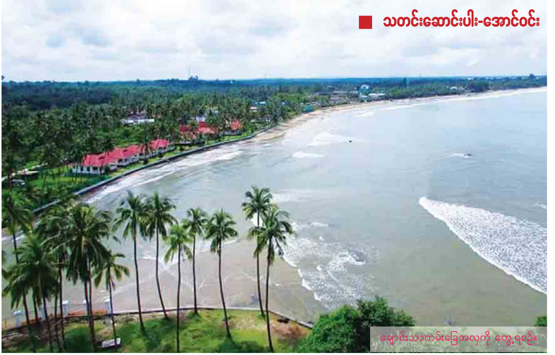
■ သတင်းဆောင်းပါး-အောင်ဝင်း

များ၊ ဈေးသည်များနှင့် ဈေးဝယ်သူတို့ အများ အပြား တွေ့ရမြင်ရသည်။ ထူးခြားသည်မှာ ပြည်တွင်း ပြည်ပခရီး သွားများအား ငွေဆောင်ကမ်းခြေမှ ချောင်းသာကမ်းခြေ အပန်းဖြေစခန်းနှင့် အခြားကျွန်းများသို့ နေ့ချင်းပြန် လည်ပတ်နိုင် သော အပျော်စီးအမြန်ရေယာဉ်ဝန်ဆောင်မှု လုပ်ငန်းအား ရေယာဉ် ၂၀ စင်းဖြင့် ဆောင်ရွက် ပေးလျက်ရှိပြီး အပန်းဖြေသူများ စိတ်ဝင်စား ချစ်စားသွားလျက်ရှိကြောင်း ဒေသခံ တစ်ဦးကပြောသည်။ ထို့အပြင်ငွေဆောင်ကမ်းခြေတွင်ရေငုပ် သည့်ဝန်ဆောင်မှု၊ ငါးဖမ်းလိုသူများ ငါးဖမ်း ရန် ဆောင်ရွက်ပေးမှုနှင့် သန္တာကျောက်တန်း တွေ ကြည့်ရှုနိုင်အောင် စီစဉ်ပေးထားတာ တွေ့ခဲ့ရပြီး လာရောက်အပန်းဖြေသူများ စိတ်ဝင်စားကြောင်းသိရသည်။ ငွေဆောင်နှင့် ချောင်းသာ ကမ်းခြေ အပန်းဖြေစခန်းတွေက ပုသိမ်ကနေ ချောင်းသာကိုပဲ သွားသွား၊ ငွေဆောင်ကိုပဲ သွားသွား နေ့ချင်းပြန် လည်ပတ်သွားလာ နိုင်သည့် နေရာများဖြစ်သည်။ ငွေဆောင်နှင့် ချောင်းသာမှအပြန် ရန်ကုန်ရောက်ရန် ၃၅ မိုင်အလိုမှာ ဧရာ ဝတီတိုင်းဒေသကြီး အတွင်းက ညောင်တုန်း မြို့နယ်နှင့် မနီးမဝေးတွင် ညောင်တုန်းမြစ် သည် မိုးတွင်းကာလက ရေပြည့်လျှံနေသော် လည်း ပွင့်လင်းရာသီတွင် သဲသောင်ပြင်ကျယ် များ ဖြစ်ပေါ်လျက် ဖြစ်၏ဖြစ်ရစီးဆင်းမှု၊ ရေ၏ကြည်လင်သန့်ရှင်းမှုနှင့် သဲသောင်ပြင် များကျယ်ပြန့်ဖြူးဖြူးပြီး သန့်ရှင်းမှုတို့ကြောင့် ၂၀၁၃ ခုနှစ်က စပြီး “ညောင်ချောင်းသာကမ်း