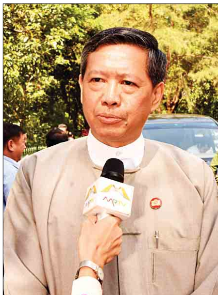
ပြည်ထောင်စုဝန်ကြီး ဒေါက်တာမျိုးသိမ်းကြီး

ပြီးခဲ့တဲ့တစ်ပတ်က ကျင်းပပြီးစီးခဲ့တဲ့ 8th model ASEM ရဲ့ အတွေ့အကြုံအရဆိုရင် အာရှ-ဥရောပက