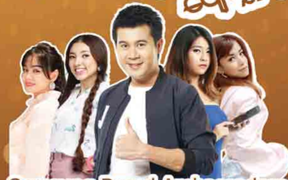
Samsung Brand Ambassadors

ကျပ်သိန်း ၂၅၀ကျော် စာနိမ့်ဖိုးရို ဆုပေးပေးခြင်းများစွာ