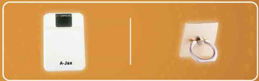
Power Bank 10,400 mAh