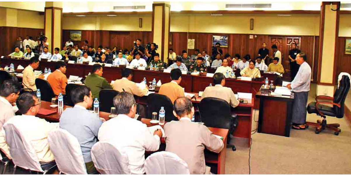
လူငယ်ဘက်စုံဖွံ့ဖြိုးရေးပွဲတော် ကျင်းပရေးဦးစီးကော်မတီနာယက ဒုတိယသမ္မတ ဦးမြင့်ဆွေ လူငယ်ဘက်စုံဖွံ့ဖြိုးရေးပွဲတော် ကျင်းပရေးဦးစီးကော်မတီ လုပ်ငန်းညှိနှိုင်းအစည်းအဝေးတွင် အဖွင့်အမှာစကားပြောကြားစဉ်။

ပုပ်ရဟန်းမင်းကြီး ဖရန်စစ်သည် အသက် (၇၆)နှစ်အရွယ် ၂၀၁၃ ခုနှစ် မတ်လ ၁၃ ရက်တွင် ရိုမန်ကက်သလစ်သာသနာတော်၏ ၂၆၆ ယောက်မြောက် ပုပ်ရဟန်းမင်းကြီး ဖြစ်လာခဲ့သည်။ အရှင်သူမြတ် ဖရန် စစ်သည် ဥရောပဒေသမှ မဟုတ်ဘဲ ပုပ်ရဟန်းမင်းကြီးဖြစ်လာသည့် ပထမ ဦးဆုံး ယေဇူး၏မိတ်ဆွေများ အသင်းဝင် ဘုန်းတော်ကြီးဖြစ်သည်။