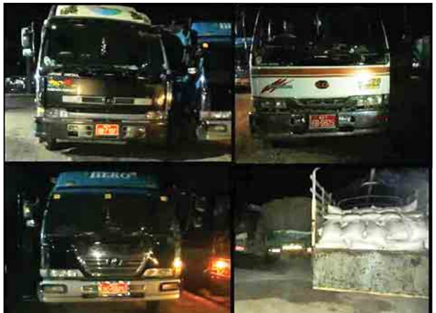
စာရွက်စာတမ်း အထောက်အထား တစ်စုံတစ်ရာ တင်ပြနိုင်ခြင်းမရှိသည့် အမိန့်ယမ်းနီကထရိုက်ဟု ယူဆရသော အဖြူရောင်အစေ့များနှင့် ပစ္စည်း သယ်ဆောင်သည့်ယာဉ်။

နေပြည်တော် နိုဝင်ဘာ ၂၆ တရားမဝင်ကုန်စည်များ တားဆီး ထိန်းချုပ်ရေးအတွက် ရေပူနှင့် မရမ်းချောင်း အမြဲတမ်းစစ်ဆေးရေး စခန်းတို့ကို ငွာနုဆိုင်ရာ ပူးပေါင်းအဖွဲ့ များဖြင့် ဖွဲ့စည်းစစ်ဆေးဆောင်ရွက် လျက်ရှိရာ နိုဝင်ဘာ ၂၅ ရက်တွင် မန္တလေး-မူဆယ် ပြည်ထောင်စု လမ်းမကြီးတစ်လျှောက် ကုန်သွယ်မှု ယာဉ် ပို့ကုန် ၉၁၈ စီး၊ သွင်းကုန် ၉၃၇ စီး၊ ရန်ကုန်-မြဝတီလမ်းမကြီး တစ်လျှောက် ကုန်သွယ်မှုယာဉ် ပို့ကုန် ၄၅ စီး၊ သွင်းကုန် ၁၂၆ စီး ကုန်စည် များ သယ်ယူပို့ဆောင်လျက်ရှိသည်။ အဆိုပါ စစ်ဆေးရေးစခန်းများက တင်သွင်း/တင်ပို့သော ကုန်ပစ္စည်း များကို စစ်ဆေးမှုပြုလုပ်ဆောင်ရွက် လျက်ရှိရာ နိုဝင်ဘာ ၂၅ ရက်တွင် ရေပူအမြဲတမ်းစစ်ဆေးရေးစခန်းက တားဆီးမှု ၁၃ မှု(ခန့်)မှန်းတန်ဖိုးကျပ် ၁၆၀ ဒသမ ၇၄၈ သန်းခန့်)သိမ်းဆည်း ရမိခဲ့ပြီး ထူးခြားသိမ်းဆည်းမှုအနေဖြင့် နိုဝင်ဘာ ၂၅ ရက်တွင် မန္တလေးမြို့နှင့် မူဆယ်မြို့များသို့ သွားရောက်မည့် ယာဉ်များကို ရေပူအမြဲတမ်းစစ်ဆေး