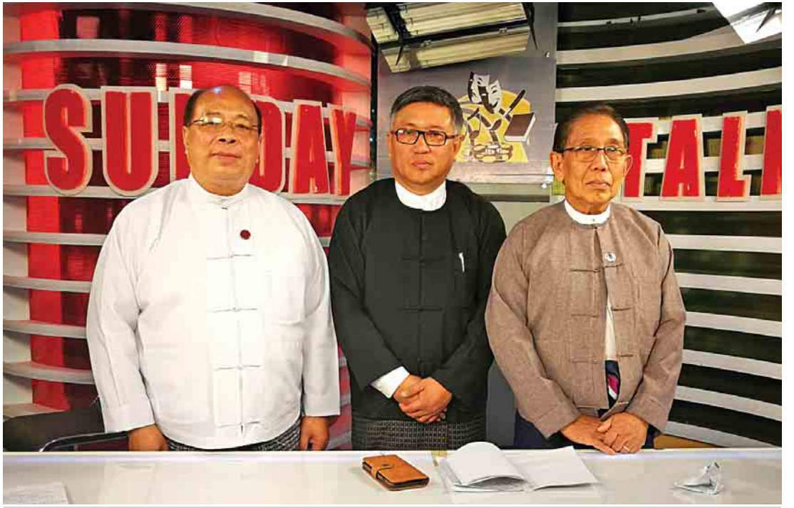
ပြည်ထောင်စုဝန်ကြီး ဦးသောင်းထွန်း၊ ကိုကို(စက်မှုတက္ကသိုလ်)၊ ဒေါက်တာအောင်ထွန်းသက် (ဝဲ မှ ယာ)။

မင်္ဂလာပါခင်ဗျာ။ ကျွန်တော်တို့နိုင်ငံက ရခိုင်ပြည်နယ်အခြေအနေကို ပြည်တွင်း၊ ပြည်ပအားလုံး စိတ်ဝင်စား လျက်ရှိပါတယ်။ ဒါနဲ့ပတ်သက်ပြီး ပြီးခဲ့တဲ့လပိုင်းအတွင်းနဲ့ ဒီရက်ပိုင်းအတွင်းမှာ မြန်မာနဲ့ ဘင်္ဂလားဒေ့ရှ် နှစ်နိုင်ငံကြားမှာ Bilateral ပူးပေါင်းဆောင်ရွက်မှုကို ဆောင်ရွက်ခဲ့ပါတယ်။ ပြီးခဲ့တဲ့လထဲမှာ ဘင်္ဂလားဒေ့ရှ်က ပြည်ထဲရေးဝန်ကြီး လာရောက်ခဲ့ပါတယ်။ ဒီရက်ပိုင်းမှာ ဘင်္ဂလားဒေ့ရှ် နိုင်ငံခြားရေးဝန်ကြီး လာခဲ့ပါတယ်။ ဘင်္ဂလားဒေ့ရှ်ကို ရောက်ရှိနေတဲ့သူတွေကို ပြန်လည်လက်ခံရေးကိစ္စတွေကို ညှိနှိုင်းကြတယ်။ ဆွေးနွေးပြီး သဘောတူလက်မှတ်ရေးထိုးခဲ့ပါတယ်။ ဘင်္ဂလားဒေ့ရှ်ရောက်ရှိနေတဲ့ နေရပ်စွန့်ခွာသူတွေကို စာမျက်နှာ ၈ ကော်လံ ၁ သို့ □