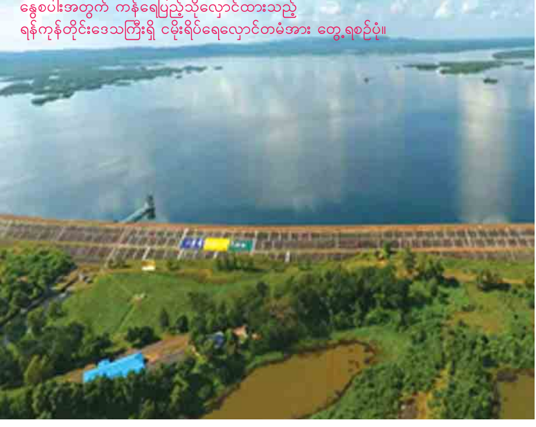
နွေစပါးအတွက် ကန်ရေပြည့်သို့လျှောင့်ထားသည့် ရန်ကုန်တိုင်းဒေသကြီးရှိ ငမိုးရိပ်ရေလျှောင်တံခံအား တွေ့ရစဉ်ပုံ။