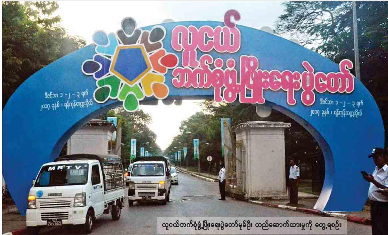
လူငယ်ဘက်စုံဖွံ့ဖြိုးရေးပွဲတော်မုခ်ဦး တည်ဆောက်ထားမှုကို တွေ့ရစဉ်။