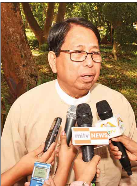
ပြည်ထောင်စုဝန်ကြီး ဒေါက်တာဖေမြင့်

ဒါကြောင့်မို့ လူငယ်တွေအရည်အချင်းတိုးတက်ဖို့အတွက်ဆိုရင် ကျွမ်းကျင်သင့်တဲ့ သိသင့်သိထိုက်တဲ့ အကြောင်းအရာတွေ၊ အထူးသဖြင့် ၂၁ ရာစု နည်းပညာခေတ်သစ်မှာ လူငယ်တွေစိတ်ဝင်စားပြီး လေ့လာသင့်တဲ့ အကြောင်းအရာတွေကို ဒီပွဲမှာတွေ့ထိပြီး လေ့လာဆည်းပူးနိုင်အောင်၊ ကိုယ့်ကိုယ်ကိုယ် ဖွံ့ဖြိုးတိုးတက်နိုင်အောင်