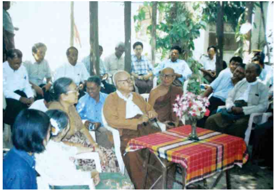
တောင်လေးလုံးမှာ ကျင်းပတဲ့ ဆရာကြီးရဲ့မွေးနေ့ပွဲ

လေးမိုးတိုင် မန္တလေးတက္ကသိုလ်မှာ နေခဲ့ပြီး ဆရာနှင့် နှုတ်တွေ့ နူးတွေ့ တွေ့ဖူးသည်က တစ်ကြိမ်တစ်ခါပဲ ဖြစ်သည်။ ပုံရွာမှရသော အုတ်ခွက်ဘုရားတစ်ဆူကို ဆရာထံပေးပို့ကာ ခေတ်ကာလ အခြေအနေ မေးမြန်း စူးစမ်းခြင်း ဖြစ်သည်။ ဆရာရဲ့ခန်းထဲမှာက အဲလို အုတ်ခွက်ဘုရားတွေက အများအပြား အပုံအပင်။