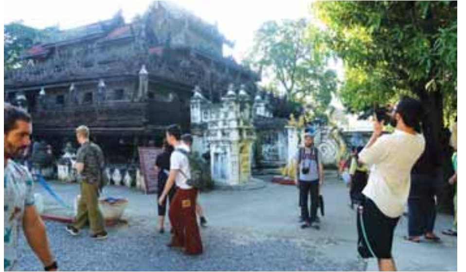
အခြေတွင် ဇာတ်ကြီးဆယ်ဘွဲ့၊တောထွက်ခန်း၊ မဟာပဒုမ မြောက်စွာ အနုပညာတပ်ဆင်ထားကြောင်းမှတ်တမ်းများ ဇာတ်၊ ဥတေနဇာတ်တော်များကို စိတ်ဝင်စားဖွယ် လက်ရာ အရ သိရသည်။ သန်းစော်မင်း(ပြန်/ဆက်)

ရွှေကျောင်းဟု လူသိများသော ရွှေနန်းတော်ကျောင်းသည် နှစ်ပေါင်း ၁၃၀ ကျော် သက်တမ်းရှိပြီး ကုန်းဘောင်ခေတ် ၁၉ ရာစု မြန်မာအနုပညာဗိသုကာ လက်ရာစံပြုကျောင်းကြီးဖြစ်သည်။ ရွှေနန်းတော်ကြီးမှာ အမိုးသုံးဆင့်၊ လယ်ပေါ်နှစ်ထပ်၊ စမြင်ပါသောဇေတဝန်ဆောင်ဖြစ်သည်။ ကျောင်းကြီး တစ်ဆောင်လုံးတွင် အရှေ့အနောက်တိုင် ၁၅ လုံးတန်းနှင့် တောင်မြောင် ၁၀ လုံးတန်းရှိခြင်းကြောင့် တိုင်ပေါင်း ၁၅၀၊ နယားရုပ်ထောက်တိုင်ပေါင်း ၅၄ တိုင်နှင့် သရက်ကင်းအုတ်လှေကားငါးစင်းဖြင့် တည်ဆောက်ထားသည်။ ကျောင်းကြီးတစ်ခုလုံးတွင် မြန်မာမှု သစ်သားပန်းပု အခြေခံခြူးပန်း၊ ခြူးနွယ်အပြောက်အမွှမ်းများ၊ ရုပ်လုံးရုပ်ကြွများ၊ ကျေးငှက်တိရစ္ဆာန်ရုပ်များ၊ နံရံကပ်ရုပ်ကြွများနှင့် အတွင်းမာရဘင် အရှေ့ပိုင်ကွန်းစင်တိုင်