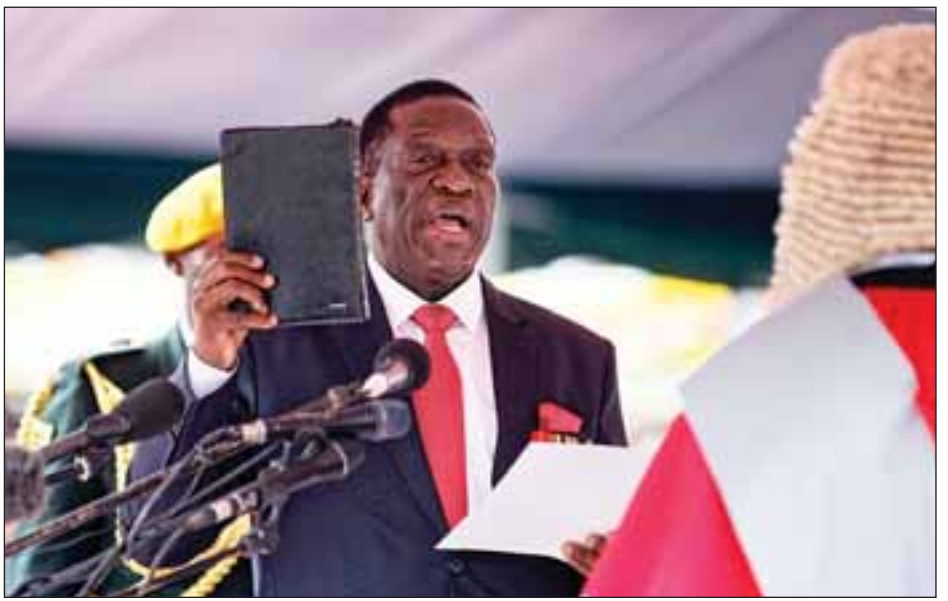
သို့ရာတွင် တပ်မတော်က နိုဝင်ဘာ ၁၅ ရက်တွင် နိုင်ငံရေး အကျပ်အတည်းကို ကြားဝင်ဖြေရှင်းပေးနိုင်ရန် သမ္မတအဖြစ် တာဝန်ထမ်းဆောင်စေခဲ့သည်။ ရိုက်တာ

အိမ်နန်ဂါဂွါက ပြောကြားသည်။ သို့ရာတွင် မူဂါဘီအား ဆယ်စုနှစ်ပေါင်းများစွာ သစ္စာခံ၍ လုပ်ကိုင်ပေးလာခဲ့သူ အိမ်နန်ဂါဂွါသည် အစိုးရအဖွဲ့ အပြောင်းအလဲများကို ကြီးကြီးမားမား လုပ်ဆောင်နိုင်ဖွယ်မရှိဟု ဝေဖန်မှုများ လည်း ရှိနေသည်။ မူဂါဘီလက်ထက် အစိုးရအဖွဲ့သည် လူ့အခွင့်အရေး ချိုးဖောက်မှုများရှိပြီး မှားယွင်းသော စီးပွားရေးမူဝါဒများကို ကျင့်သုံးခဲ့သည်ဟုလည်း ဝေဖန်ခံခဲ့ ရသည်။ အိမ်နန်ဂါဂွါသည် နိုဝင်ဘာ ၆ ရက်က ဒုတိယ သမ္မတရာထူးနေရာမှ ဖြုတ်ချခံခဲ့ရပြီးနောက် ၎င်း၏ အသက်အန္တရာယ်ကို ခြိမ်းခြောက်မှုများရှိခဲ့ရာ နိုင်ငံမှ ထွက်ပြေးသွားခဲ့သည်။ အိမ်နန်ဂါဂွါသည် မူဂါဘီထံမှ အာဏာသိမ်းယူနိုင်ရန် ကြံစည်နေသည်ဟု မူဂါဘီက ၎င်းအား စွပ်စွဲခဲ့သည်။ အာဏာရ ဇနူးပီအက်မ်ပါတီသည် အိမ်နန်ဂါဂွါအား ပါတီမှ ဖယ်ရှားခဲ့ရာ သမ္မတကတော် ဂရေစ်မှာ မူဂါဘီ၏ အရိုက်အရာကို ဆက်ခံရန် လမ်းပွင့်သွားခဲ့သည်။