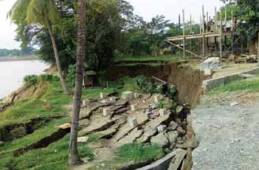
မြေကျကျမှုမှာ ပေ ၁၀၀ ပတ်လည်ခန့်ရှိပြီး ၂၀၁၅ခုနှစ် ရေဘေးကာလက မြေအမြင့်ဆုံး ရောက်ခဲ့သည့် အမှတ်များကို နေ့စွဲများဖြင့် မှတ်သားထားပေးသော အမှတ်အသားပါ အုန်းပင်ကြီးမှာလည်း မြေကျကျပါ သွားကြောင်း သိရသည်။