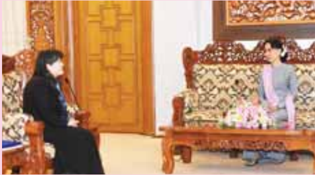
စာမျက်နှာ >> ၃

နိုင်ငံတော်၏အတိုင်ပင်ခံပုဂ္ဂိုလ် ဒေါ်အောင်ဆန်းစုကြည်ထံ UNICEF ၏ မြန်မာနိုင်ငံဆိုင်ရာ ဌာနကိုယ်စားလှယ်က ၎င်း၏ ခန့်အပ်လွှာပေးအပ်