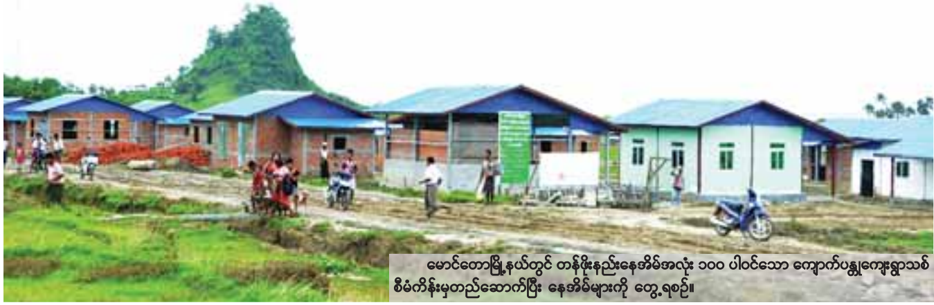
မောင်တောမြို့နယ်တွင် တန်ဖိုးနည်းနေအိမ်အလုံး ၁၀၀ ပါဝင်သော ကျောက်ပန္နက်ကျေးရွာသစ် စီမံကိန်းမှတည်ဆောက်ပြီး နေအိမ်များကို တွေ့ရစဉ်။

နယ်စပ်ရေးရာဝန်ကြီးဌာန နယ်စပ်ဒေသနှင့် တိုင်းရင်းသားလူမျိုးများဖွံ့ဖြိုးတိုးတက်ရေးဦးစီးဌာနက နယ်စပ်ဒေသဖွံ့ဖြိုးရေးရန်ပုံငွေဖြင့် ရခိုင်ပြည်နယ် မောင်တောခရိုင်တောင်ပိုင်း မောင်တောမြို့နယ်တွင် တန်ဖိုးနည်းနေအိမ် အလုံး ၁၀၀ ပါဝင်သော ကျောက်ပန္နက်ကျေးရွာသစ်တည်ဆောက်မှုကို အကောင်အထည်ဖော် တည်ဆောက်လျက်ရှိရာ လက်တလောတွင် ၅၀ ရာခိုင်နှုန်း ပြီးစီးနေပြီဖြစ်ကြောင်းနှင့် ယခုတက်ရောက်ရန်ကုန်တွင် ရာနှုန်းပြည့်ပြီးစီးမည်ဖြစ်ကြောင်း နယ်စပ်ဒေသနှင့် တိုင်းရင်းသားလူမျိုးများဖွံ့ဖြိုးတိုးတက်ရေးဦးစီးဌာနမှ သိရသည်။ စာမျက်နှာ ၈ ကော်လံ ၁ သို့ *