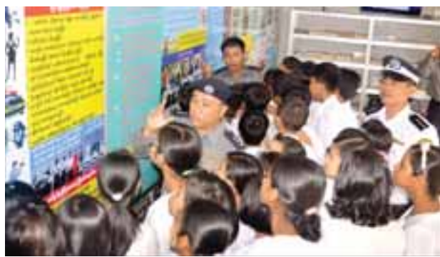
မြို့နယ်(မြန်/ဆက်)

ရန်ကုန် နိုဝင်ဘာ ၂၄ ရန်ကုန်တိုင်းဒေသကြီး ဒဂုံမြို့နယ် ကျန်းမာရေးဦးစီးဌာနအနေဖြင့် ကျောင်း အခြေပြုဂျပန်ဦးဆောင်ရောဂါကာကွယ်ဆေးထိုးနှံခြင်းကို နိုဝင်ဘာ ၁၅ မှ ၂၃ ရက်ထိ ဆေးထိုးအဖွဲ့ ခြောက်ဖွဲ့ဖြင့် ကွင်းဆင်းထိုးနှံပေးခဲ့ကာ ပညာရေး ဌာန၏ ပူးပေါင်းကူညီမှုဖြင့် အခြေခံပညာကျောင်းများနှင့် ကိုယ်ပိုင်ကျောင်း များရှိ ကျောင်းသား ကျောင်းသူ ၁၁၆၃၇ ဦးအနက် ၁၁၁၂၇ ဦးကို ကာကွယ် ဆေးထိုးနှံပေးနိုင်ခဲ့ပြီး ကျောင်းအခြေပြုအနေဖြင့် ၉၆ ရာခိုင်နှုန်း ထိုးနှံ ပေးနိုင်ခဲ့ကြောင်း ဒဂုံမြို့နယ်ကျန်းမာရေးဦးစီးဌာနမှ သိရသည်။