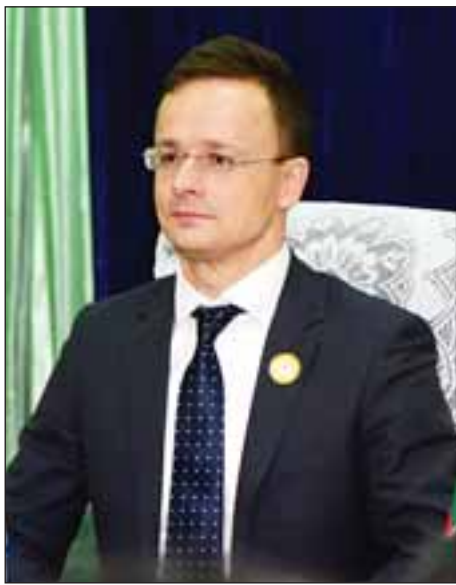
ဟန်ဂေရီနိုင်ငံခြားရေးဝန်ကြီး Mr. Peter Szijjarto

ဖြေ။ ဟန်ဂေရီနဲ့ မြန်မာနိုင်ငံဟာ ပထဝီအနေအထားအရ အလွန်ဝေးကွာစွာ တည်ရှိပါတယ်။ ဒါကြောင့် မို့လို့ ပထမဆုံးအနေနဲ့ ပြည်သူ့အချင်းချင်း ထိတွေ့ဆက်ဆံမှုရရှိဖို့ လိုအပ်ပါတယ်။ ပြည်သူ့တွေအကြား ကျယ်ကျယ်ပြန့်ပြန့် ထိတွေ့ဆက်ဆံဖို့အတွက် မြန်မာကျောင်းသားတွေကို ဟန်ဂေရီမှာ လာရောက်ပညာသင်ကြားနိုင်ဖို့ ပညာတော် သင်ဆုကို ပေးအပ်ထားပါတယ်။ အစိုးရကထောက်ပံ့တဲ့ ပညာတော်သင်ဆုဖြစ်ပါတယ်။ အခုလို ပညာတော်သင်ဆု ပေးခြင်းအားဖြင့် နှစ်နိုင်ငံကျောင်းသားလူငယ်တွေအနေ နဲ့ ဆက်ဆံရေးမြှင့်တင်နိုင်မှာ ဖြစ်ပါတယ်။ ဟန်ဂေရီနိုင်ငံ အနေနဲ့ မြန်မာနိုင်ငံရဲ့ ဒီမိုကရေစီပြုပြင်ရေးကို အစဉ်အမြဲ အားပေးထောက်ခံလျက်ရှိပါတယ်။ ကမ္ဘာကြီးဟာ တဖြည်း ဖြည်းသေးငယ်လာတဲ့အတွက် ကမ္ဘာရဲ့တစ်ဖက်ခြမ်းက ဖြစ်ရပ်တွေဟာ အခြားကမ္ဘာတစ်ဖက်ခြမ်းမှာ တိုက်ရိုက် အကျိုးသက်ရောက်မှုရှိမှာဖြစ်ပါတယ်။ ဒါကြောင့် မြန်မာ နိုင်ငံရဲ့အချုပ်အခြာအာဏာပိုင်ဆိုင်မှု၊ ငြိမ်းချမ်းရေးနဲ့ စီးပွားရေး ဖွံ့ဖြိုးတိုးတက်မှုဟာ ကျွန်တော်တို့ဟန်ဂေရီ အတွက် အရေးပါနေပါတယ်။