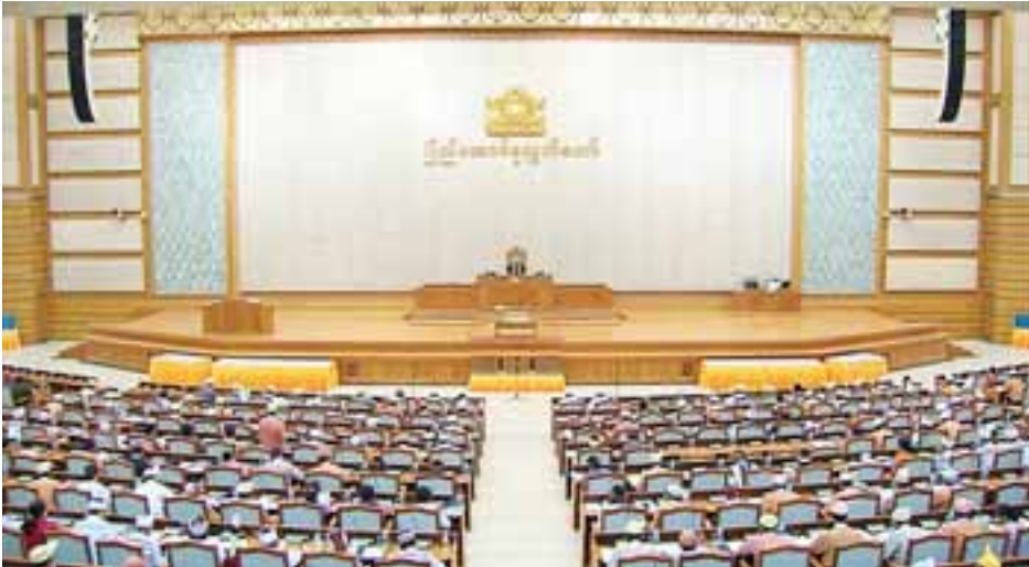
ဒုတိယအကြိမ် ပြည်ထောင်စုလွှတ်တော် ဆွဲပုံမှန်အစည်းအဝေး ကျင်းပစဉ်။

အုပ်ချုပ်ရေးကဏ္ဍ၏ ပြည်ထောင်စုအဆင့်ဌာန၊ အဖွဲ့အစည်းများက သက်ဆိုင်ရာ ဥပဒေ၊ နည်းဥပဒေများနှင့်အညီ လွှတ်တော်သို့တင်ပြလာသည့် မြန်မာနိုင်ငံတော် ဗဟိုဘဏ်၏ ၂၀၁၅-၂၀၁၆ ဘဏ္ဍာနှစ် ငွေကြေးမူဝါဒ အကောင်အထည်ဖော် ဆောင်ရွက်မှုနှင့် ငွေရေးကြေးရေးစနစ် တည်ငြိမ်မှု အခြေအနေအစီရင်ခံစာ၊ မြန်မာနိုင်ငံရင်းနှီးမြုပ်နှံမှုကော်မရှင်၏ (၂၀၁၆ ခုနှစ် ဧပြီလ ၁ ရက်မှ ၂၀၁၇ ခုနှစ် မတ်လ ၃၁ ရက်ထိ) တစ်နှစ်တာလုပ်ငန်းဆောင်ရွက်မှု အစီရင်ခံစာ၊ အမျိုးသားပညာရေးမူဝါဒကော်မရှင်၏ (၂၀၁၇ ခုနှစ် ဧပြီလမှ အောက်တိုဘာလထိ) ခြောက်လတာကာလအတွင်း လုပ်ငန်းဆောင်ရွက်မှု အစီရင်ခံစာ၊ ၂၀၁၇-၂၀၁၈ ဘဏ္ဍာနှစ် ပထမ ခြောက်လပတ် အမျိုးသားစီမံကိန်း အကောင်အထည်ဖော် ဆောင်ရွက်မှုနှင့် ပြည်ထောင်စုဘဏ္ဍာငွေ အရအသုံးဆိုင်ရာ အစီရင်ခံစာ