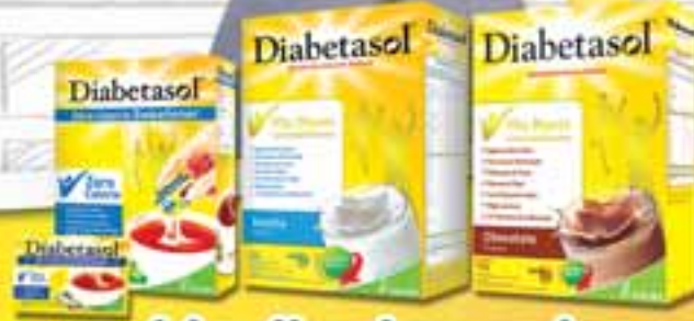
ဆီးချို သွေးချိုရှိသူများ၏ အာဟာရအတွက် အသင့်တော်ဆုံးရွေးချယ်မှု

Diabetasol is available in : ✓ Zero Calorie Sweetener ✓ Balanced Nutrition for Diabetic (Vanilla, Chocolate, Cappuccino)