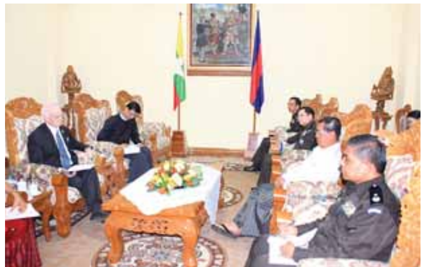
နေပြည်တော် နိုဝင်ဘာ ၂၄ အလုပ်သမား၊ လူဝင်မှုကြီးကြပ်ရေးနှင့် ပြည်သူ့အင်အားဝန်ကြီးဌာန ပြည်ထောင်စုဝန်ကြီး ဦးသိန်းဆွေသည် မြန်မာနိုင်ငံဆိုင်ရာ ကုလသမဂ္ဂ ယာယီဌာနနေညီနှိုင်းရေးမှူး Mr. Knut Ostby အား နိုဝင်ဘာ ၂၂ ရက် ညနေ ၅ နာရီတွင် နေပြည်တော်ရှိ အဆိုပါ ဝန်ကြီးဌာန ပြည်ထောင်စုဝန်ကြီး၏ ဧည့်ခန်းမ၌ တွေ့ဆုံသည်။

အလုပ်သမား၊ လူဝင်မှုကြီးကြပ်ရေးနှင့် ပြည်သူ့အင်အားဝန်ကြီးဌာန ပြည်ထောင်စုဝန်ကြီး ဦးသိန်းဆွေသည် မြန်မာနိုင်ငံဆိုင်ရာ ကုလသမဂ္ဂ ယာယီဌာနနေညီနှိုင်းရေးမှူး Mr. Knut Ostby အား နိုဝင်ဘာ ၂၂ ရက် ညနေ ၅ နာရီတွင် နေပြည်တော်ရှိ အဆိုပါ ဝန်ကြီးဌာန ပြည်ထောင်စုဝန်ကြီး၏ ဧည့်ခန်းမ၌ တွေ့ဆုံသည်။