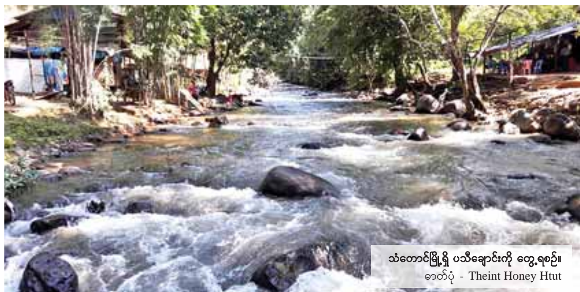
သံတောင်မြို့ရှိ ပသီချောင်းကို တွေ့ရစဉ်။

အင်္ဂါရပ်နှင့်အညီ ဌာနဆိုင်ရာရုံးများ၊ စာသင်ကျောင်းနှင့် ဆေးရုံ၊ ဆေးခန်းများ တွေ့ရသည်။ ထူးခြားချက်ကား ဆူညံသံပေါင်းစုံနှင့် အသားကျနေကြသော မိမိတို့မှာ တိတ်ဆိတ်အေးချမ်းခြင်းသုခကို တအံ့တဩခံစားကြရသည်။ လူသူလေးပါးများ တွေ့မြင်နေရပါလျက် အသံပလံများ မကြားရဘဲ ပတ်ဝန်းကျင်တစ်ခွင်လုံး ဆိတ်ငြိမ်နေခြင်းမှာ ထူးခြားချက်တစ်ရပ်ပါပေ။ မိမိတို့ အလယ်တန်းကျောင်းသားဘဝတွင် မြန်မာစာ စကားပြေ၌ သင်ကြားရသည့် ဆရာကြီး ရွှေဥဒေါင်း၏ “သိုင်းနယ်မှ ကျားသောင်းကျန်း” ဆောင်းပါး၌ ပါဝင်သော တော၏တိတ်ဆိတ်ခြင်း၊ ဝူ၏တိတ်ဆိတ်ခြင်းဆိုသည့် စာကိုသတိရမိရာ ဤသို့တောင်အလုံ၌ တိတ်ဆိတ်နေခြင်းကို မည်သို့စာဖွဲ့ရမည်ကိုကား မသိတော့ပါချေ။ မိမိသည် တောင်ကြီး၊ မေမြို့၊ ကလေး၊ အောင်ပန်း