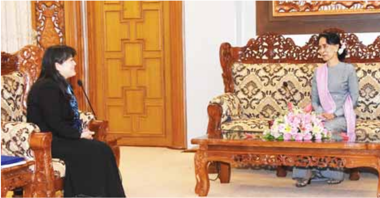
နိုင်ငံတော်၏အတိုင်ပင်ခံပုဂ္ဂိုလ် ဒေါ်အောင်ဆန်းစုကြည် ကုလသမဂ္ဂကလေးသူငယ်များ ရန်ပုံငွေအဖွဲ့ (UNICEF) ၏ မြန်မာနိုင်ငံဆိုင်ရာ ဌာနကိုယ်စားလှယ်အား လက်ခံတွေ့ဆုံစဉ်။