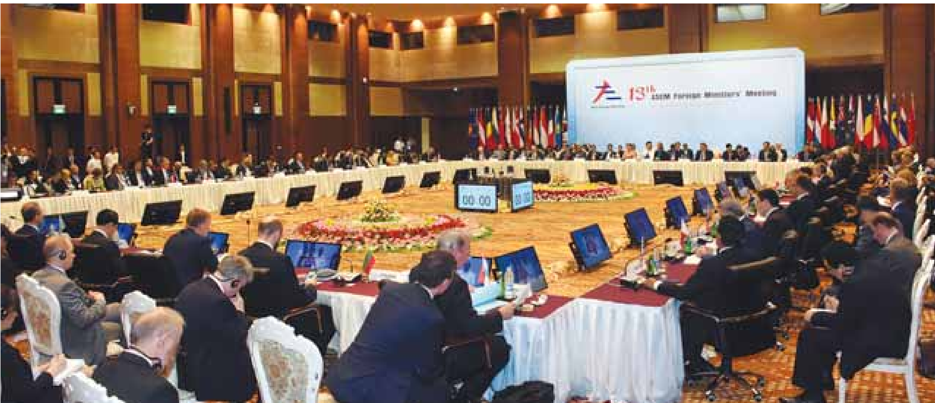
(၁၃) ကြိမ်မြောက် အာရှ-ဥရောပ နိုင်ငံခြားရေးဝန်ကြီးများ အစည်းအဝေး ဖွင့်ပွဲအခမ်းအနားကို နိုဝင်ဘာ ၂၀ ရက်က နေပြည်တော် မြန်မာအပြည်ပြည်ဆိုင်ရာကွန်ပင်းရှင်းဗဟိုဌာန(၁)၌ ကျင်းပစဉ်။ သတင်းစဉ်

(၁၃) ကြိမ်မြောက် အာရှ-ဥရောပ နိုင်ငံခြားရေးဝန်ကြီးများ အစည်းအဝေး ဖွင့်ပွဲအခမ်းအနားကို နိုဝင်ဘာ ၂၀ ရက်က ကျင်းပရာ နေပြည်တော် မြန်မာ အပြည်ပြည်ဆိုင်ရာ ကွန်ပင်းရှင်းဗဟိုဌာန (၁) သို့ ရောက်ရှိလာသော နိုင်ငံတော်၏ အတိုင်ပင်ခံပုဂ္ဂိုလ် ဒေါ်အောင်ဆန်းစုကြည်ကို တွေ့ရစဉ်။ သတင်းစဉ်