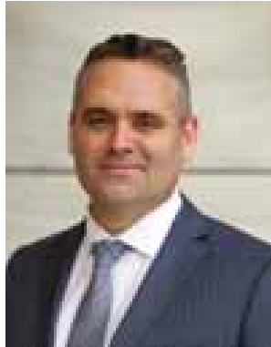
Name - Mr. Fletcher Hoporona Tabuteau Position - Parliamentary Undersecretary to the Minister of Foreign Affairs Organization - Office of Rt Hon Winston Peters, Minister of Foreign Affairs Country - New Zealand