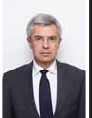
Name - H.E. Ivan Korcok Position - Deputy Foreign Minister of the Slovak Republic Organization - Ministry of Foreign and European Affairs of the Slovak Republic Country - Slovakia