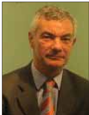
Name - Mr. Dirk Lodewijk Achten Position - Vice Minister Organization - FPS Foreign Affairs, Foreign Trade and Development Cooperation Country - Belgium