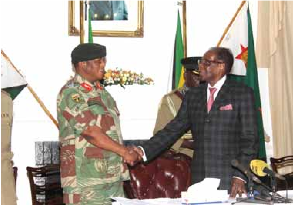
ရုပ်မြင်သံကြားမှတစ်ဆင့် နိုင်ငံတော်သို့ မိန့်ခွန်းပြောကြားမီ ဝိုင်းရံခံရပြီးနောက် ဝါရှင်တန်ရှိ အာဏာရပါတီ အဖွဲ့ဝင်များနှင့် အတူ ရှိနေသည့် ရောဘတ်မူဂါဘီ

လွန်ခဲ့သည့် ရက်သတ္တပတ်အတွင်း ဖြစ်ပေါ်ခဲ့သည့် အခြေအနေသည် နိုင်ငံအကြီးအကဲနှင့် အစိုးရအဖွဲ့အကြီးအကဲအဖြစ် မိမိ၏ အခွင့်အာဏာကို စိန်ခေါ်ခြင်းမဟုတ်