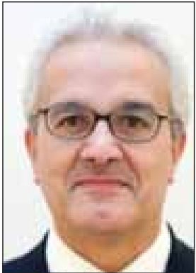
Name - Mr. Ildefonso Castro Position - Secretary of State Organization - Ministry of Foreign Affairs Country - Spain