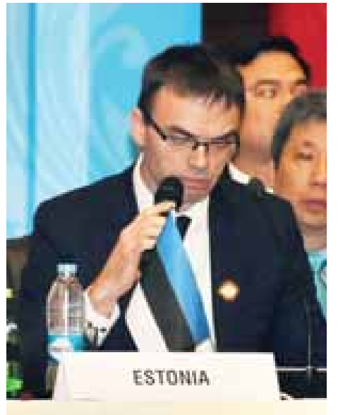
အက်စ်တိုးနီးယားနိုင်ငံမှ H.E. Mr. Sven Mikser