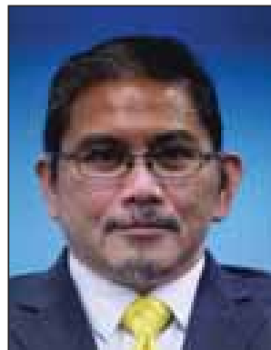
Name - Mr. Dato Seri Paduka Haji Erywan bin Datu Pekerma Jaya Haji Mohd Yusof Position - Deputy Minister of Foreign Affairs Organization - Ministry of Foreign Affairs and Trade Country - Brunei Darussalam