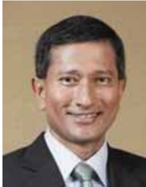
Name - Dr. Vivian Balakrishnan Position - Minister of Foreign Affairs, Singapore Organization - Ministry of Foreign Affairs, Singapore Country - Singapore