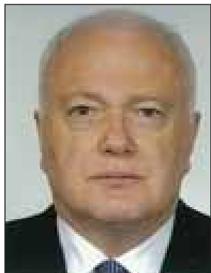
Name - Mr. Gary Quinlan Position - Deputy Secretary/ ASEAN SOM and Former Ambassador to UN Organization - Department of Foreign Affairs and Trade Country - Australia