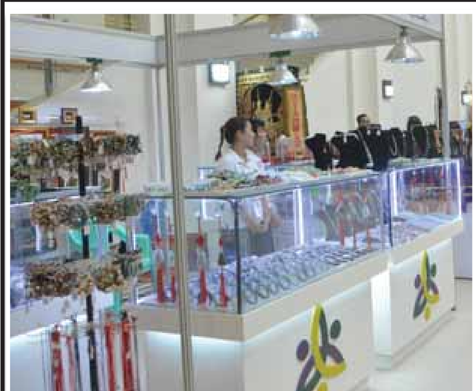
ကျောက်စိမ်းလက်ဝတ်ရတနာ ပြခန်း

(၁၃)ကြိမ်မြောက် အေဆမ်အစည်းအဝေးကျင်းပရာ နေပြည်တော် MICC-I ရှိ မီဒီယာခန်းမ၌ ပြည်တွင်း ပြည်ပ မီဒီယာသမားများ သတင်းရယူနေကြစဉ်။