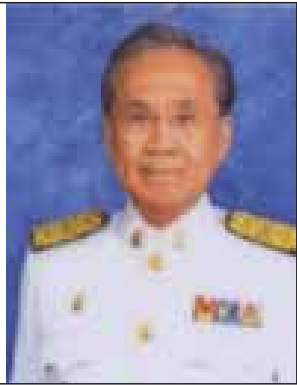
Name - Mr. Don Pramudwinai Position - Minister of Foreign Affairs of Thailand Organization - Ministry of Foreign Affairs Country - Thailand