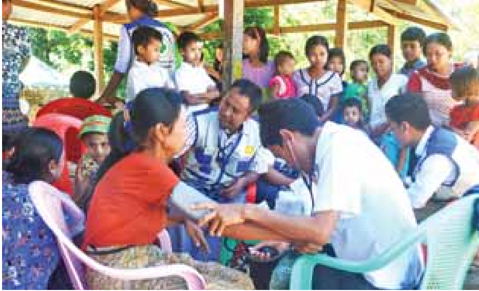
စိုင်းဒင်ပြင်းချောင်းကျေးရွာ၌ ရွေ့လျားဆေးခန်းအဖွဲ့ ဒေသခံပြည်သူများအား ဆေးကုသမှုပေးနေစဉ်။

မောင်တော နိုဝင်ဘာ ၂၀ မောင်တောခရိုင် ဘူးသီးတောင်မြို့နယ်အတွင်း လမ်းပန်းဆက်သွယ်ရေး အခက်အခဲနှင့် နယ်မြေအေးချမ်းမှုရှိမှု အခြေအနေတစ်ရပ်ကြောင့် တစ်နှစ်ကျော်ကြာ ရပ်နားထားခဲ့သော ကျေးလက်ဒေသ ရွေ့လျားဆေးကုသမှု လုပ်ငန်းများကို ယခုအခါ လမ်းပန်းဆက်သွယ်ရေးနှင့် နယ်မြေအေးချမ်းမှုရှိမှုပေါ် မူတည်၍ အဆက်မပြတ် လုပ်ဆောင်ပေးသွားရန် စီစဉ်လျက်ရှိကြောင်း ဘူးသီးတောင်မြို့နယ် ကျန်းမာရေးဦးစီးဌာနမှ သိရသည်။