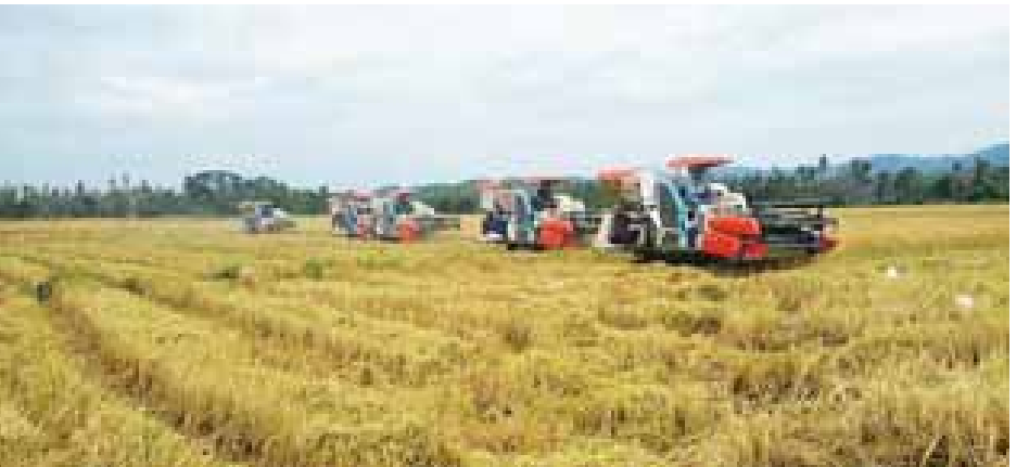
စက်မှုလယ်ယာဦးစီးဌာန ရခိုင်ပြည်နယ်အတွင်း မိုးစပါးရိတ်သိမ်းခြွေလှေ့ခြင်းလုပ်ငန်း ဆောင်ရွက်လျက်ရှိ

(တိုင်းရင်းသား) ကျေးရွာနှင့် မင်္ဂလာညွန့်(တိုင်းရင်းသား) ကျေးရွာ တို့တွင် နွားတစ်ကောင်၊ ဆိတ် နှစ်ကောင်၊ ငါးခူရပတ်ဝန်းကျင်ရှိ ရေမျက်တောင် (တိုင်းရင်းသား) ကျေးရွာ၊ ငါးခူရ(ရောနှော)နှင့် မြို့သစ်(တိုင်းရင်းသား) ကျေးရွာ တို့တွင် နွားနှစ်ကောင်၊ ဆိတ် နှစ်ကောင်တို့ကို ကာကွယ်ကုသ ဆေးများ ထိုးနှံပေးပြီး စုစုပေါင်း စခန်းသုံးခု၏ ပတ်ဝန်းကျင်ကျေးရွာ တို့တွင် နွားခုနှစ်ကောင်ကို ကာကွယ်