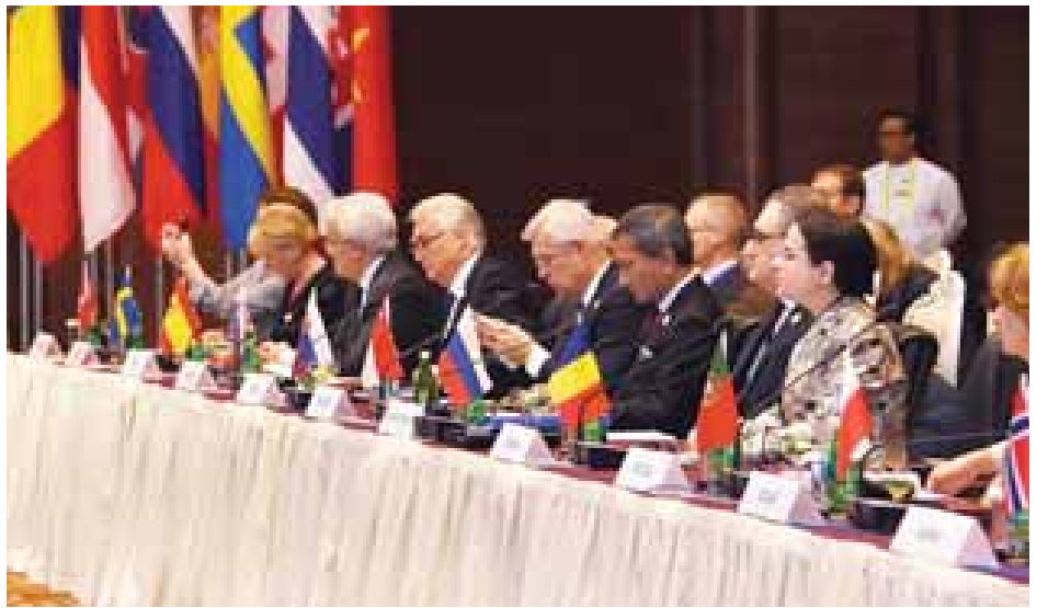
(၁၃)ကြိမ်မြောက် အာရှ-ဥရောပ နိုင်ငံခြားရေးဝန်ကြီးများ အစည်းအဝေးသို့ တက်ရောက်ကြသူများကို တွေ့ရစဉ်။