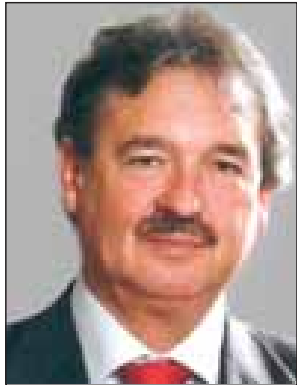
Name - H.E. Jean Asselborn Position - Minister of Foreign and European Affairs of Luxembourg Organization - Ministry of Foreign and European Affairs Country - Luxembourg