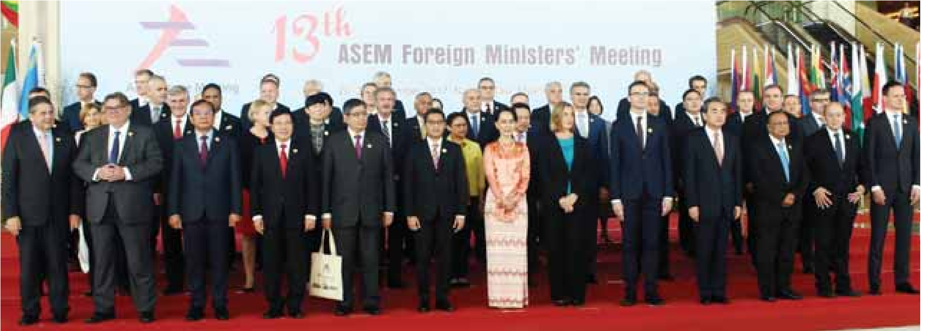
(၁၃) ကြိမ်မြောက် အာရှ - ဥရောပ နိုင်ငံခြားရေးဝန်ကြီးများ အစည်းအဝေးဖွင့်ပွဲအခမ်းအနား မစတင်မီ နိုင်ငံတော်၏ အတိုင်ပင်ခံပုဂ္ဂိုလ် ဒေါ်အောင်ဆန်းစုကြည်အပါအဝင်အစည်းအဝေးတက်ရောက်လာကြသူများ စုပေါင်းမှတ်တမ်းတင်ဓာတ်ပုံရိုက်စဉ်။ သတင်းစဉ်