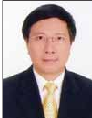
Name - H.E. Pham Binh Minh Position - Deputy Prime Minister, Minister of Foreign Affairs Organization - Viet Nam/ Ministry of Foreign Affairs Country - Vietnam