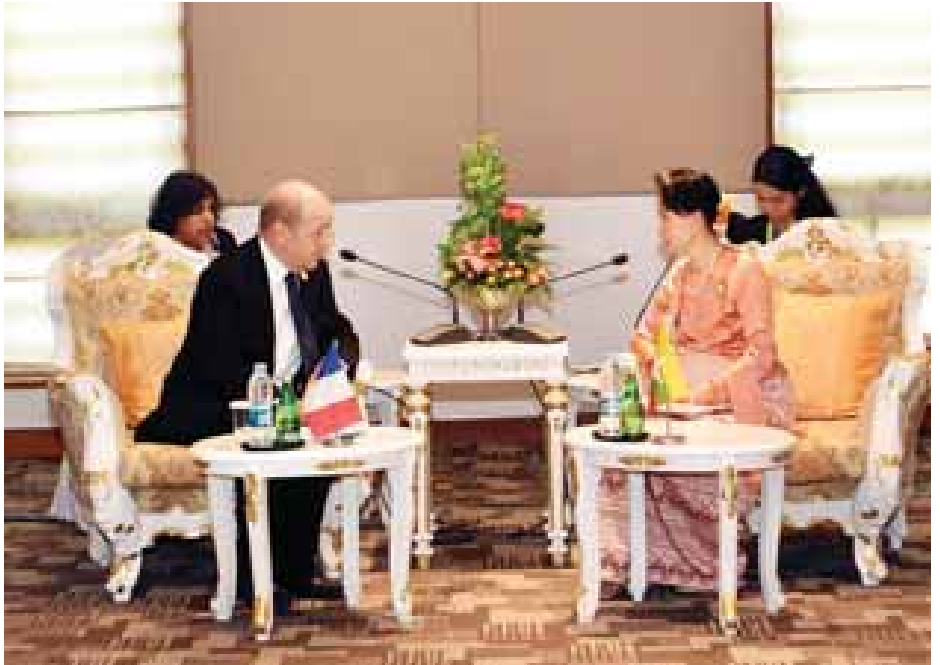
နိုင်ငံတော်၏အတိုင်ပင်ခံပုဂ္ဂိုလ် နိုင်ငံခြားရေးဝန်ကြီးဌာန ပြည်ထောင်စုဝန်ကြီး ဒေါ်အောင်ဆန်းစုကြည် ပြင်သစ်နိုင်ငံခြားရေးနှင့် ဥရောပရေးရာဝန်ကြီးဌာန ဝန်ကြီး H.E. Mr. Jean-Yves Le Drian အား တွေ့ဆုံစဉ်။