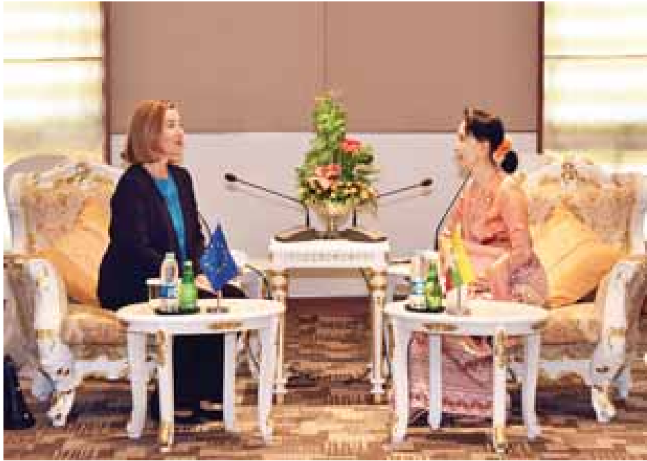
နိုင်ငံတော်၏အတိုင်ပင်ခံပုဂ္ဂိုလ် နိုင်ငံခြားရေးဝန်ကြီးဌာန ပြည်ထောင်စုဝန်ကြီး ဒေါ်အောင်ဆန်းစုကြည် ဥရောပ ကော်မရှင် ဒုတိယဥက္ကဋ္ဌ H.E.Mrs.Federica Mogherini အား လက်ခံတွေ့ဆုံစဉ်။