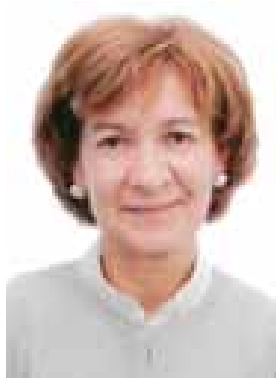
Name - H.E. Maria Teresa Goncalves Ribeiro Position - Secretary of State for Foreign Affairs and Cooperation Organization - Ministry of Foreign Affairs - Portugal Country - Portugal