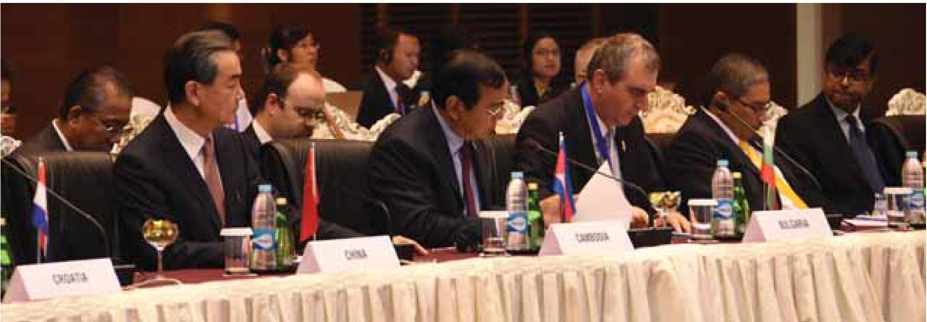
(၁၃) ကြိမ်မြောက် အာရှ - ဥရောပ နိုင်ငံခြားရေးဝန်ကြီးများ အစည်းအဝေး ဖွင့်ပွဲအခမ်းအနားကို နိုဝင်ဘာ ၂၀ ရက်က MICC - I တွင် ကျင်းပရာ အစည်းအဝေး တက်ရောက်လာကြသည့်သူများကို တွေ့ရစဉ်။ သတင်းစဉ်