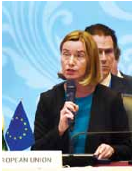
ဥရောပကော်မရှင် ခုတိယဥက္ကဋ္ဌ Mrs. Federica Mogherini