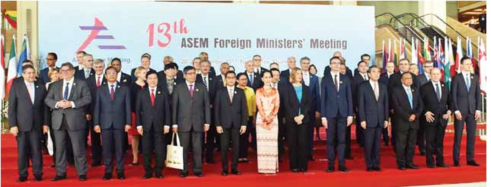
နိုင်ငံတော်၏အတိုင်ပင်ခံပုဂ္ဂိုလ် နိုင်ငံခြားရေးဝန်ကြီးဌာန ပြည်ထောင်စုဝန်ကြီး ဒေါ်အောင်ဆန်းစုကြည်နှင့် (၁၃)ကြိမ်မြောက် အာရှ-ဥရောပ နိုင်ငံခြားရေးဝန်ကြီးများ အစည်းအဝေးသို့ တက်ရောက်လာကြသူများ မှတ်တမ်းတင်ဓာတ်ပုံရိုက်ကြစဉ်။