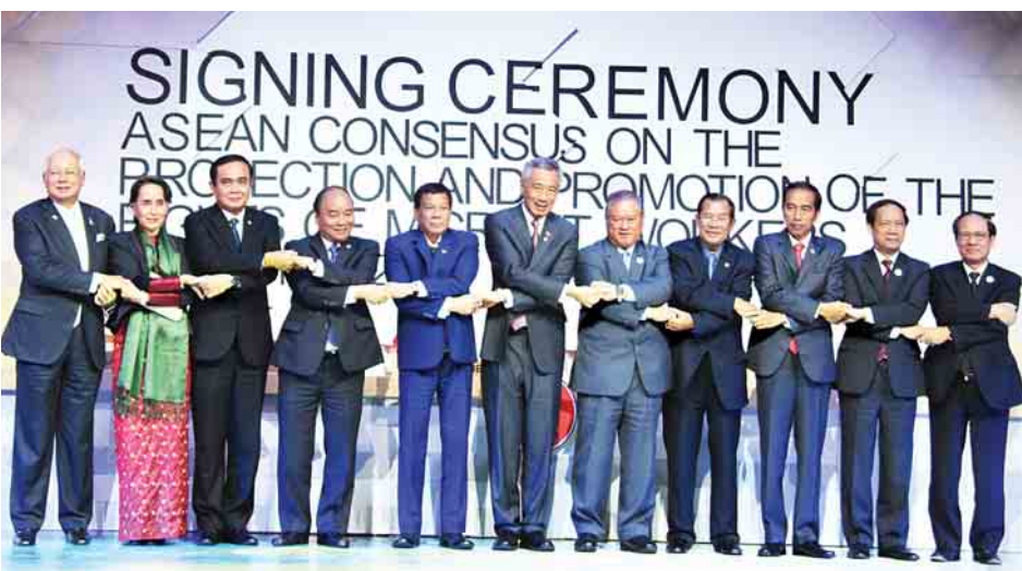
နိုင်ငံတော်၏အတိုင်ပင်ခံပုဂ္ဂိုလ်နှင့် အာဆီယံခေါင်းဆောင်များ အလုပ်သမားများ၏ အခွင့်အရေးကာကွယ်ရေးနှင့် မြှင့်တင်ရေးဆိုင်ရာ ASEAN သဘောတူညီချက်ကို လက်မှတ်ရေးထိုးကြပြီး မှတ်တမ်းတင်ဓာတ်ပုံရိုက်ကြစဉ်။