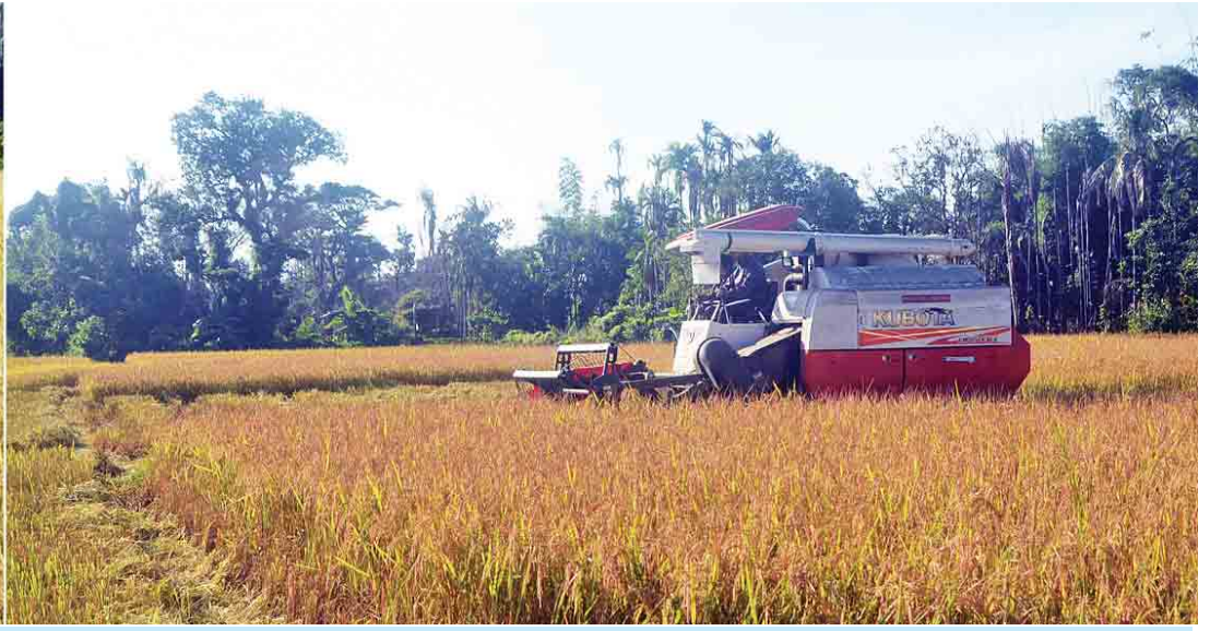
ပြည်ထောင်စုဝန်ကြီး ဒေါက်တာဖေမြင့်၊ ရခိုင်ပြည်နယ်ဝန်ကြီးချုပ် ဦးညီပုနှင့်အဖွဲ့ မြင်းလွတ်မြို့နယ်ခွဲ မောင်တော-အငူမော် လမ်းခန့်ဘေး၌ စက်မှုလယ်ယာဦးစီးဌာနက ရိုက်သိမ်းခြွေလှေ့စက်ကြီးများဖြင့် စပါးရိုက်သိမ်းနေမှုကို ကြည့်ရှုစဉ်။