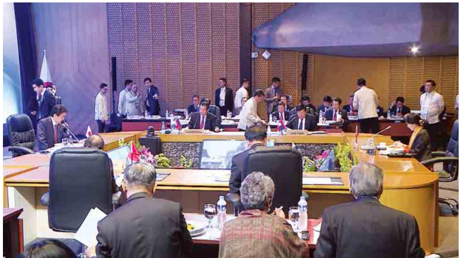
(၉)ကြိမ်မြောက် မဲခေါင်-ဂျပန် ထိပ်သီးအစည်းအဝေး နိုင်ငံတော်၏အတိုင်ပင်ခံပုဂ္ဂိုလ် ဒေါ်အောင်ဆန်းစုကြည် တက်ရောက်စဉ်။