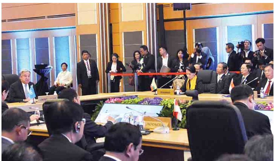
(၉)ကြိမ်မြောက် အာဆီယံ-ဂျပန် ထိပ်သီးအစည်းအဝေး နိုင်ငံတော်၏အတိုင်ပင်ခံပုဂ္ဂိုလ် ဒေါ်အောင်ဆန်းစုကြည် တက်ရောက်စဉ်။