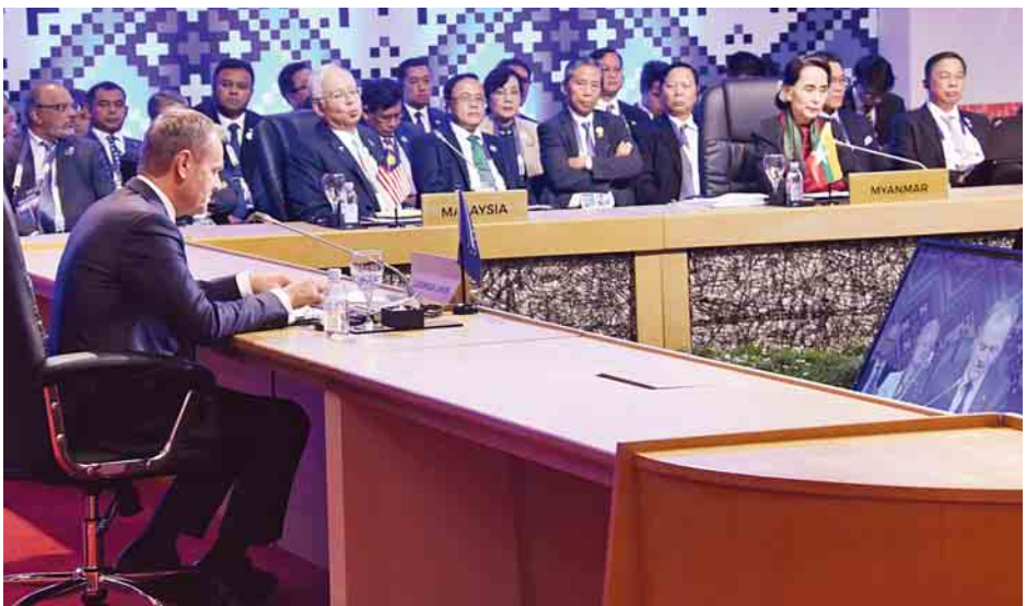
နှစ်(၄၀)ပြည့် အထိမ်းအမှတ် အာဆီယံ-အီးယူ ထိပ်သီးအစည်းအဝေးသို့ နိုင်ငံတော်၏အတိုင်ပင်ခံပုဂ္ဂိုလ် ဒေါ်အောင်ဆန်းစုကြည် တက်ရောက်စဉ်။