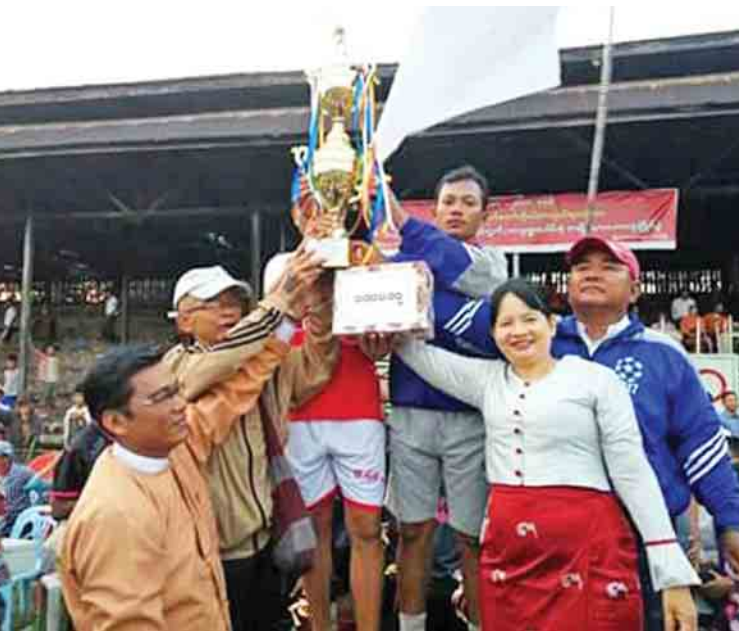
ပဲခူးတိုင်းဒေသကြီး ဒိုက်ဦးမြို့နယ် လွှတ်တော်ကိုယ်စားလှယ်များဖလား အသက် ၂၂ နှစ်အောက် ရပ်ကွက်၊ ကျေးရွာပေါင်းစုံ အမျိုးသားဘောလုံးပြိုင်ပွဲ ဆုချီးမြှင့်ပွဲကို နိုဝင်ဘာ ၁၄ ရက်က ကျင်းပရာ အနိုင်ရရှိသည့်အဖွဲ့အား ကျောင်းစုရပ်ကွက်အသင်းအား ပြည်သူ့လွှတ်တော် ကိုယ်စားလှယ် ဦးဘုန်းမြင့်အောင်မှ ဆုဖလားနှင့် ငွေသား ဆု ချီးမြှင့်အပြီး တွေ့ရစဉ်။