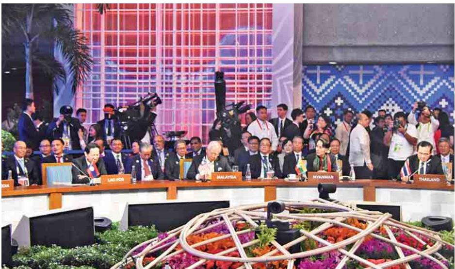
(၁၂)ကြိမ်မြောက် အရှေ့အာရှ ထိပ်သီးအစည်းအဝေးသို့ နိုင်ငံတော်၏အတိုင်ပင်ခံပုဂ္ဂိုလ် ဒေါ်အောင်ဆန်းစုကြည် တက်ရောက်စဉ်။