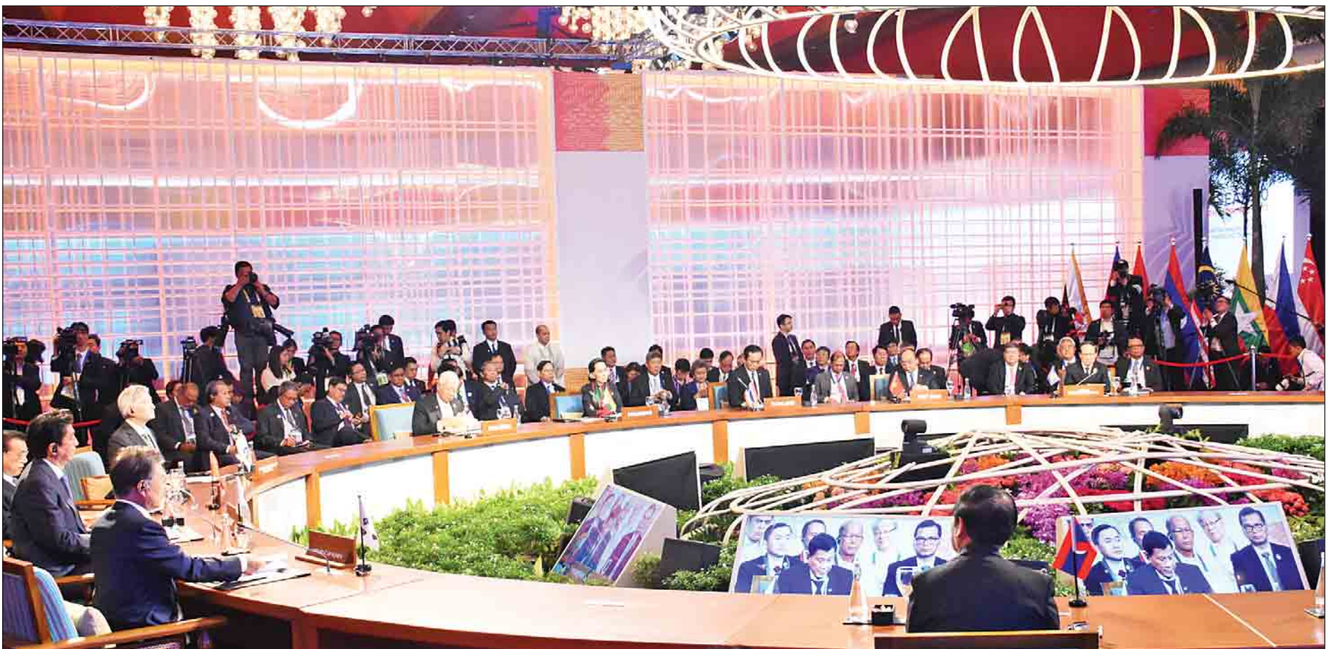
နိုင်ငံတော်၏အတိုင်ပင်ခံပုဂ္ဂိုလ် ဒေါ်အောင်ဆန်းစုကြည် အကြိမ်(၂၀)မြောက် အာဆီယံ + ၃ ထိပ်သီးအစည်းအဝေးသို့ တက်ရောက်စဉ်။