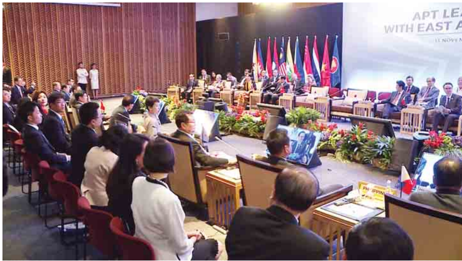
အာဆီယံ+၃ ခေါင်းဆောင်များနှင့် အရှေ့အာရှ စီးပွားရေးကောင်စီ ဖျက်နှာစုံညီတွေ့ဆုံပွဲ နိုင်ငံတော်၏အတိုင်ပင်ခံပုဂ္ဂိုလ် ဒေါ်အောင်ဆန်းစုကြည် တက်ရောက်စဉ်။