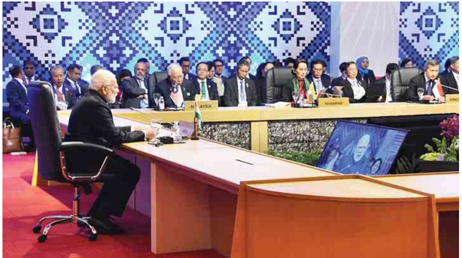
(၁၅)ကြိမ်မြောက် အာဆီယံ-အိန္ဒိယ ထိပ်သီးအစည်းအဝေးသို့ နိုင်ငံတော်၏အတိုင်ပင်ခံပုဂ္ဂိုလ် ဒေါ်အောင်ဆန်းစုကြည် တက်ရောက်စဉ်။

ထို့နောက် ၂၀၁၇ ခုနှစ် အာဆီယံအလှည့်ကျဥက္ကဋ္ဌ ဖိလစ်ပိုင်သမ္မတနိုင်ငံ သမ္မတ မစ္စတာ ရိုဒရီဂို ဒူတာတေးက စာမျက်နှာ ၉ ကော်လံ ၁ သို့ □