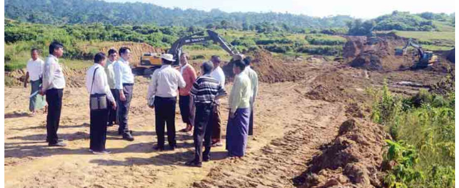
ပြည်ထောင်စုဝန်ကြီး ဒေါက်တာဖေမြင့်၊ ရခိုင်ပြည်နယ်ဝန်ကြီးချုပ် ဦးညီပုနှင့်အဖွဲ့ ကျောက်ပန္နက်- အင်းဒင်- စေတီပြင်တောင်ကျော်လမ်း (မေယုတောင်ကျော်လမ်း) ဖောက်လုပ်နေမှုကို ကြည့်ရှုစဉ်။

ယင်းနောက် ၂၀၁၆ ခုနှစ် အောက်တိုဘာ ၉ ရက်က ARSA အစွန်းရောက် အကြမ်းဖက်သမားများ၏ တိုက်ခိုက်ခြင်းခံခဲ့ရသည့် ရသေ့တောင်မြို့နယ် ကိုးတန်ကောက် နယ်ခြားစောင့် ရဲတပ်ဖွဲ့စခန်းကို သွားရောက်ကြည့်ရှုပြီး အငူမော်မှတစ်ဆင့် အမြန်ရေယာဉ်ဖြင့် စစ်တွေမြို့သို့ ပြန်လည်ရောက်ရှိသည်။