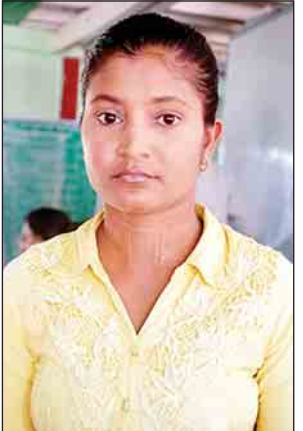
မငွေငွေမြင့်