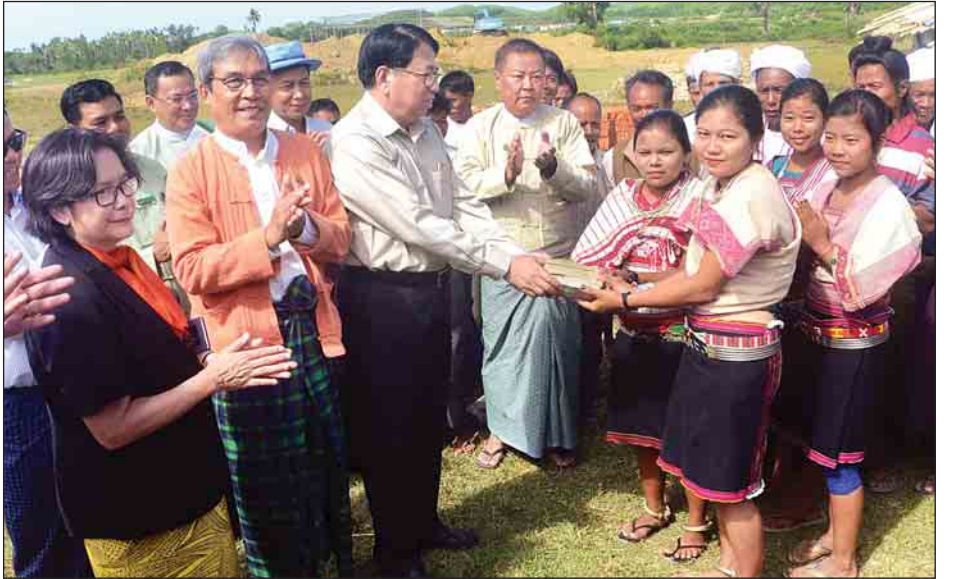
ပြည်ထောင်စုဝန်ကြီး ဒေါက်တာဖေမြင့် မောင်တောမြို့နယ် ကိုင်းကြီး(မြို့)ကျေးရွာမှ မြို့တိုင်းရင်းသားများအား ထောက်ပံ့ငွေ ပေးအပ်စဉ်။