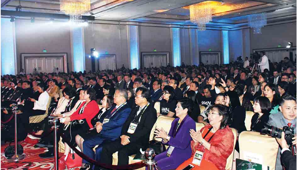
အာဆီယံစီးပွားရေးနှင့် ရင်းနှီးမြှုပ်နှံမှုထိပ်သီးအစည်းအဝေး၌ နိုင်ငံတော်၏အတိုင်ပင်ခံပုဂ္ဂိုလ် ဒေါ်အောင်ဆန်းစုကြည် မိန့်ခွန်းပြောကြားစဉ်။