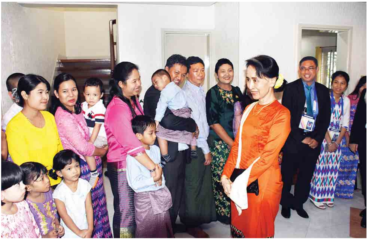
နိုင်ငံတော်၏အတိုင်ပင်ခံပုဂ္ဂိုလ် ဒေါ်အောင်ဆန်းစုကြည် မနီလာမြို့ရှိ မြန်မာနိုင်ငံဆိုင်ရာ သံရုံးဝန်ထမ်းများနှင့် မိသားစုဝင်များအား ရင်းရင်းနှီးနှီး တွေ့ဆုံစဉ်။

စီးပွားရေးနဲ့ လူမှုရေးဖွံ့ဖြိုးတိုးတက်မှုမှာပါဝင်တဲ့ အမျိုးသမီးတွေရဲ့ အရေးပါတဲ့အခန်းကဏ္ဍ၊ တိုင်းပြည်ရဲ့ အသွင်ကူးပြောင်းမှုမှာ အမျိုးသမီးတွေပါဝင်ခဲ့တဲ့ အရေးပါတဲ့အခန်းကဏ္ဍနဲ့ စဉ်ဆက်မပြတ်သော လူမှုရေးအပြောင်းအလဲဖြစ်ပေါ်စေရာမှာ အမျိုးသမီးတွေရဲ့ ရှုထောင့်အမြင် လိုအပ်ချက်ကို အသိအမှတ်ပြုဖို့ မြန်မာနိုင်ငံက ၂၀၁၃ ခုနှစ်မှာ အပြည်ပြည်ဆိုင်ရာ အမျိုးသမီးများ ဖိရိမ်ကို လက်ခံကျင့်ပခဲ့ပါတယ်။ အသွင်ကူးပြောင်းမှုမှာ အမျိုးသမီးလုပ်ငန်းရှင်တွေ ပိုပြီးတော့ အားတက်သရာ ပါဝင်လာခဲ့ပြီး လူမှုရေးသာမက စီးပွားရေး