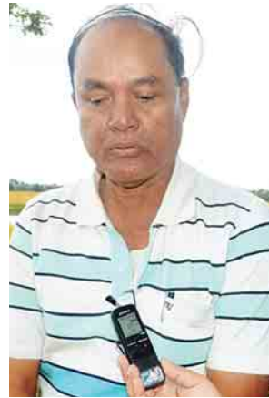
ဦးသိန်းဝေ