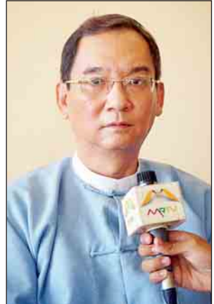
ဒေါက်တာ သိန်းဝင်း

ရခိုင်ပြည်နယ်၌ အဆင့်မြင့်ပညာသင်ကြားနေသည့် ကျောင်းသား ကျောင်းသူများ တိုးပွားလာမှုကြောင့် ရခိုင်ပြည်နယ် ဖွံ့ဖြိုးတိုးတက်ရေးအတွက် စာသင်ဆောင်များ၊ ကျောင်းသား အိမ်ဆောင်များ၊ ဝန်ထမ်းအိမ်ရာများကို လာမည့် ဘဏ္ဍာနှစ်များတွင် တိုးချဲ့တောင်းခံသွားမည်ဖြစ်ကြောင်း အဆင့်မြင့်ပညာဦးစီးဌာနမှ သိရသည်။