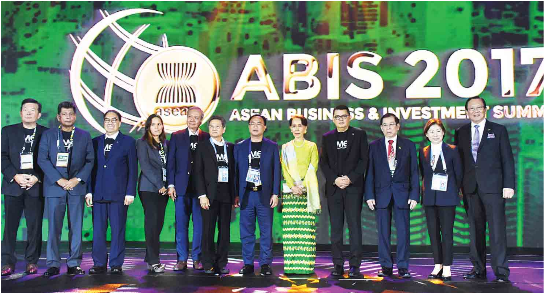
နိုင်ငံတော်၏အတိုင်ပင်ခံပုဂ္ဂိုလ် ဒေါ်အောင်ဆန်းစုကြည် အာဆီယံစီးပွားရေးအကြံပေးကောင်စီမှ ခေါင်းဆောင်များနှင့် စုပေါင်း၍ မှတ်တမ်းတင်ဓာတ်ပုံရိုက်စဉ်။