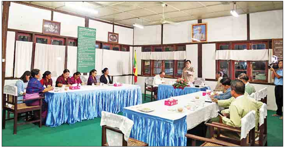
လုပ်ငန်းများဆောင်ရွက်ပေးနိုင်ရေး၊ ဒေသတွင်း အမျိုးသမီးများ၏ ဖွံ့ဖြိုးတိုးတက်ရေးအတွက် ဆက်လက်ဆောင်ရွက်လိုသည့် လုပ်ငန်းများနှင့် ပတ်သက်၍ ညှိနှိုင်းရေး စသည်တို့ကို ဆွေးနွေးခဲ့ကြကြောင်း သိရသည်။

ဆက်လက်၍ ပြည်ထောင်စုဝန်ကြီးနှင့်အဖွဲ့သည် အိမ်တွင်းမူသက်မွေးလုပ်ငန်းပညာသင်ကျောင်း အစည်းအဝေးခန်းမတွင် Htoi Gender Development Foundation (ထွယ်ဖောင်ဒေးရှင်း)နှင့် Kachin State Women Network မှ တာဝန်ရှိသူများနှင့် တွေ့ဆုံ၍ ကချင်ပြည်နယ်အတွင်းရှိ အမျိုးသမီးများ၏ ငြိမ်းချမ်းရေးလုပ်ငန်းစဉ်များတွင် ပါဝင်ရေး၊ အမျိုးသမီးများ၏ လုံခြုံရေးနှင့် အခွင့်အရေးရရှိရေး၊ IDP စခန်းများမှ အမျိုးသမီးများ၏ ကျန်းမာရေး၊ ပညာရေး၊ အသက်မွေးဝမ်းကျောင်း