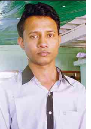
မောင်မောင်လှ