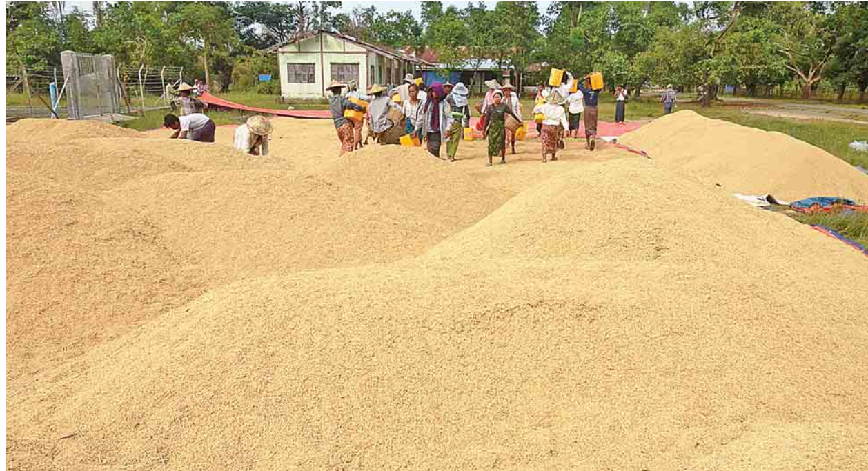
အလယ်သံကျော်ကျေးရွာ၌ ရိတ်သိမ်းပြီးစီးသည့် ရိတ်သိမ်းသူမဲ့ စပါးခင်းများမှ စပါးများအား နေလှန်းရန် ပြင်ဆင်နေစဉ်။

ကျွန်တော်တို့ပြသတဲ့ ရိတ်သိမ်းသူမဲ့ လယ်မြေတွေမှာ စက်မှုလယ်ယာကနေ ရိတ်သိမ်းတယ်၊ ရိတ်သိမ်းပြီးတဲ့ အချိန်မှာ ဦးပိုင်အလိုက် တစ်ကွင်းချင်း၊ တစ်ဦးချင်း စာရင်းတွေပြုစုပြီး အထွက်နှုန်း၊ အထွက်တွေကို စာရင်းပြုစုပေးတယ်။ ကျွန်တော် တို့က မြေခွန်စည်းကြပ်ထားတဲ့အတွက် အမည်ပေါက်စာရင်း တွေရှိတယ်။ အဲဒါတွေကြည့်ပြီး ဘယ်သူက ဘယ်လောက်ပိုင် တယ်ဆိုတဲ့ စာရင်းရှိပါတယ်။ အဲဒီအပေါ်မှာ ရိတ်သိမ်းပြီးတာ နဲ့ မြေကွက်တစ်ကွက်ချင်းအလိုက် ဦးပိုင်အလိုက် မှတ်တမ်းတင် ပါတယ်။