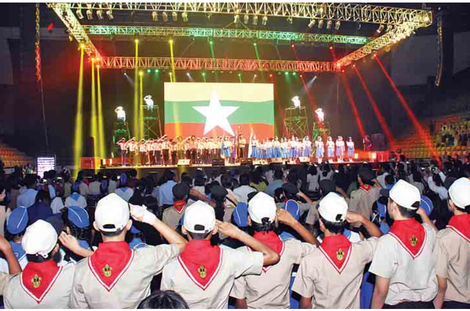
ဆရာမကြီးများနှင့် ဆရာ ဆရာမများ၊ ကျောင်းသား ကျောင်းသူများ၊ ပြည်နယ်နှင့် တိုင်းဒေသကြီးတို့မှ ကင်းထောက် ခေါင်းဆောင်များနှင့် ကင်းထောက်မောင်မယ်များ၊ အနု ပညာရှင်များနှင့် မိဘပြည်သူများ ကြည့်ရှုအားပေးကြသည်။ မြန်မာကင်းထောက်ဂီတပွဲတော်ကို အခြေခံပညာ

မြန်မာကင်းထောက် ရာပြည့်အထိမ်းအမှတ်အခမ်းအနား အောင်မြင်မှုကို ဂီတအနုပညာစွမ်းပကားဖြင့် ထပ်ဆင့် ဂုဏ်ပြုမြှင့်တင်ရန်၊ မွန်မြတ်သောစိတ်စေတနာ ပြည့်ဝ သည့် ကင်းထောက်မောင်မယ်လူငယ်များအပေါ် မိဘ ပြည်သူများက စိတ်ဝင်တစား အားပေးဂုဏ်ပြုချီးမြှင့်လာ စေရန်၊ ကင်းထောက်လူငယ်များအကြား ကင်းထောက် စိတ်ဓာတ်ကို အခြေပြု၍ ဂီတအနုပညာများနှင့် ပူးပေါင်း ကာ မိမိနှင့် မိမိအဖွဲ့အစည်းကို အကျိုးပြုနိုင်သည့်အခန်း ကဏ္ဍကို ပိုမိုမြှင့်တင်နိုင်စေရန် ရည်ရွယ်၍ ကျင်းပခြင်း ဖြစ်သည်။