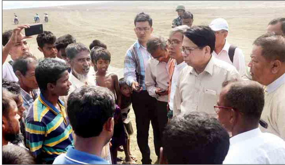
ပြည်ထောင်စုဝန်ကြီး ဒေါက်တာဖေမြင့်နှင့် ပြည်နယ်ဝန်ကြီးချုပ် ဦးညီပုတို့ မောင်တောမြို့နယ် အလယ်သံကျော်ကျေးရွာအနီးရှိ ကမ်းခြေ၌ တစ်ဖက်နိုင်ငံသို့ သွားရောက်ရန် ပြင်ဆင်နေသည့် ဘင်္ဂါလီလူမျိုးများအား တွေ့ဆုံ၍ ၎င်းတို့၏ သဘောဆန္ဒများကို မေးမြန်းဆွေးနွေးစဉ်။