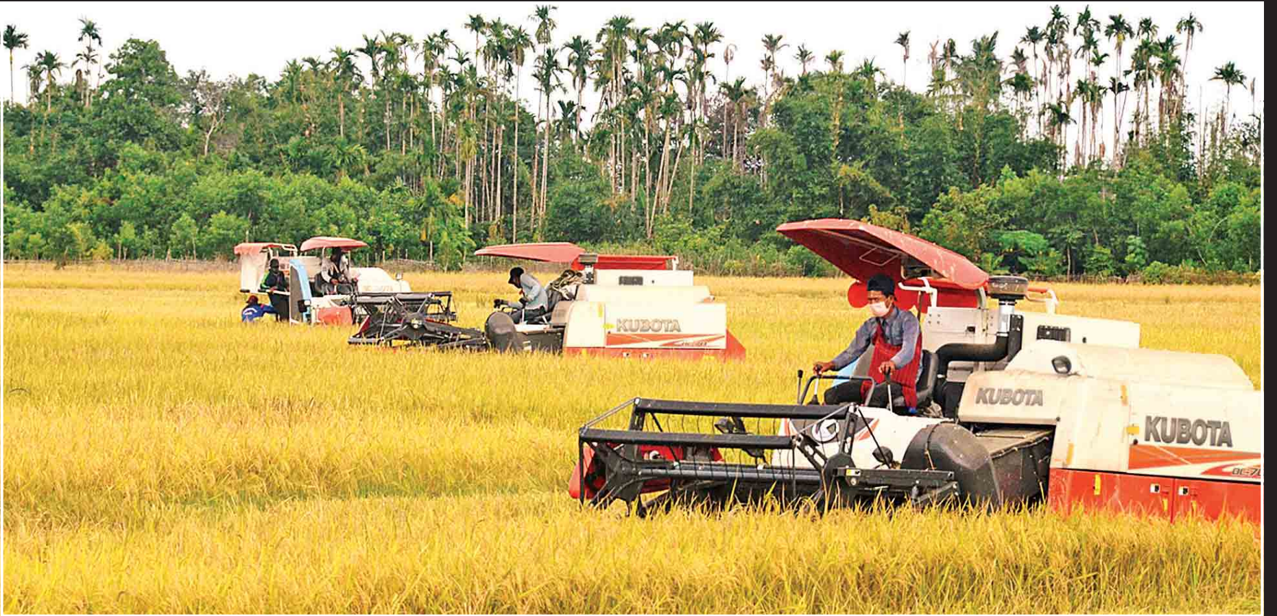
မောင်တောဒေသ၌ ရင့်မှည့်နေသော ရိတ်သိမ်းသူမဲ့ စပါးခင်းများအား စက်မှုလယ်ယာမှ ဝန်ထမ်းများက ရိတ်သိမ်းပေးနေစဉ်။ (သတင်း စာမျက်နှာ - ၁၀)