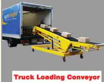
Truck Loading Conveyor