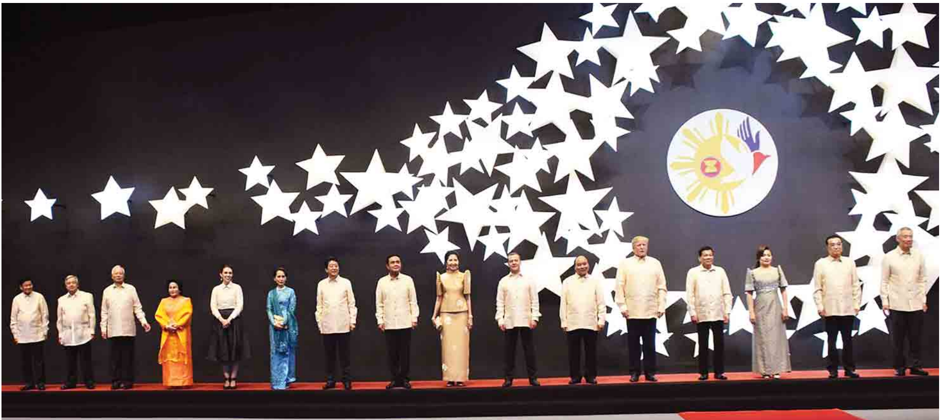
နှစ်(၅၀)ပြည့် အာဆီယံဂုဏ်ပြုညစာစားပွဲတွင် ဖိလစ်ပိုင်သမ္မတနိုင်ငံသမ္မတ မစ္စတာ ရိုဒရီဂို ဒူတာတေး၊ နိုင်ငံတော်၏အတိုင်ပင်ခံပုဂ္ဂိုလ် ဒေါ်အောင်ဆန်းစုကြည်၊ အာဆီယံနိုင်ငံများမှ နိုင်ငံအကြီးအကဲများနှင့် အစိုးရအဖွဲ့အကြီးအကဲများ၊ အာဆီယံနှင့် ဆက်စပ်အစည်းအဝေးများသို့ တက်ရောက်လာကြသည့် နိုင်ငံအကြီးအကဲများ၊ အစိုးရအဖွဲ့အကြီးအကဲများ မှတ်တမ်းတင်ဓာတ်ပုံ ရိုက်ကြစဉ်။