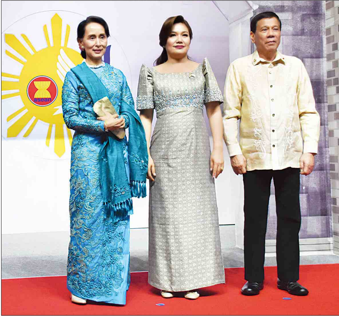
နိုင်ငံတော်၏အတိုင်ပင်ခံပုဂ္ဂိုလ် ဒေါ်အောင်ဆန်းစုကြည် နှစ်(၅၀)ပြည့် အာဆီယံ ဂုဏ်ပြုညစာစားပွဲတွင် ဖိလစ်ပိုင်နိုင်ငံသမ္မတ မစ္စတာ ရိုဒရီဂို ဒူတာတေးနှင့် ဇနီးတို့နှင့်အတူ မှတ်တမ်းဓာတ်ပုံရိုက်ကြစဉ်။

ပို့ကုန်တွေ တင်ပို့ရာမှာ ဂျပန်နိုင်ငံ ၁၉ ရာခိုင်နှုန်း၊ အမေရိကန်နိုင်ငံ ၁၄ ဒသမ ၂ ရာခိုင်နှုန်းနဲ့ တရုတ်နိုင်ငံ ၁၁ ဒသမ ၈ ရာခိုင်နှုန်းတွေကိုပဲ အဓိကတင်ပို့တာပါ။ ဖိလစ်ပိုင်နိုင်ငံရဲ့ တစ်ဦးချင်း ထုတ်ကုန် တန်ဖိုး (per capita GDP)က အမေရိကန် ဒေါ်လာ ၄၇၀၀ ရှိတာမို့ မြန်မာနိုင်ငံထက် တော့ များပါတယ်။ မြန်မာနိုင်ငံရဲ့ တစ်ဦးချင်း ထုတ်ကုန်တန်ဖိုးက အမေရိကန်ဒေါ်လာ ၁၇၀၀ ရှိပါတယ်။ ဖိလစ်ပိုင်နိုင်ငံက အမေရိကန်နိုင်ငံ၊ ဂျပန်နိုင်ငံနဲ့ တရုတ်နိုင်ငံလို ကမ္ဘာ့ဈေးကွက်ကြီးတွေကို