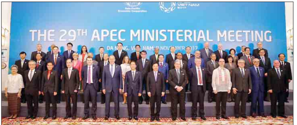
ရိုက်တာ။