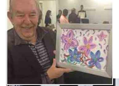
အေးပြည့်

ပန်းရောင် ပန်းပွင့်ပုံရေနဲ့ အပြာရောင်ပန်း ပွင့်နှစ်ပွင့် ပါဝင်နေတာတွေ့ရပါတယ်။ ယင်း ပန်းချီကားဟာ ပေါ့ပ်ကြယ်ပွင့်ရဲ့ ပန်းချီအရည် အချင်းကို လွစ်ဟပြနေတာဖြစ်ပြီး သူ့ရေးဆွဲ ခဲ့တဲ့ ပန်းပွင့်တွေရဲ့ အဓိပ္ပာယ်နဲ့ပတ်သက်ပြီး လည်း မကြာသေးမီက ဗီဒီယိုဖိုင်တစ်ခုကနေ တစ်ဆင့် ဘရစ်တနေစပီးယားစ်က ထုတ်ဖော် ပြောကြားခဲ့ပါတယ်။ သူ့ရဲ့ အဆိုအရ ယင်းပန်းပွင့်တွေဟာ အသစ်ကနေပြန်လည် စတင်ပွင့်လန်းခြင်းကို ရည်ရွယ်ပုံဖော်ထားတာ ဖြစ်တယ်လို့လည်း သိရပါတယ်။ ဘရစ်တနေစပီးယားစ်ရဲ့ ပန်းချီကားကို အနုပညာ သတင်းထောက်တစ်ဦးဖြစ်ပြီး "Lifestyles of the Rich and Famous" ကို စီစဉ်တင်ဆက်သူ တစ်ဦးအဖြစ်လည်း ကျော်ကြားတဲ့ ရော်ဘင်လီချိက အမေရိကန် ဒေါ်လာ တစ်သောင်းနဲ့ ဝယ်ယူခဲ့တာဖြစ်ပါ တယ်။ ဒီလိုအောင်မြင်စွာ ဝယ်ယူနိုင်ခဲ့တဲ့ အပေါ် ရော်ဘင်လီချိက ဂုဏ်ယူနေပြီး ပန်းချီကား နဲ့အတူ ရိုက်ကူးထားတဲ့ သူ့ရဲ့ဇာတ်ပုံကို ဖော်ပြခဲ့တာကိုလည်း တွေ့ရပါတယ်။