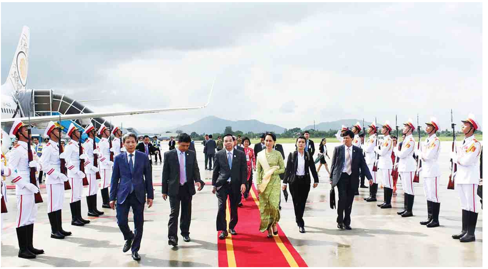
နိုင်ငံတော်၏အတိုင်ပင်ခံပုဂ္ဂိုလ် ဒေါ်အောင်ဆန်းစုကြည်အား ဂုဏ်ပြုတပ်ဖွဲ့နှင့်အတူ ဝိယက်နမ်နိုင်ငံမှ တာဝန်ရှိသူများက ဒါနန်းမြို့ပြည်ပြည်ဆိုင်ရာလေဆိပ်၌ ကြိုဆိုကြစဉ်။

ပြည်ထောင်စုသမ္မတမြန်မာနိုင်ငံတော် နိုင်ငံတော်၏ အတိုင်ပင်ခံပုဂ္ဂိုလ် ဒေါ်အောင် ဆန်းစုကြည် သည် ဝိယက်နမ်ဆိုရှယ်လစ်သမ္မတနိုင်ငံ သမ္မတ မစ္စတာ ထရမ်ဒိုင်ကွမ်၏ ဖိတ်ကြားချက်အရ ဒါနန်းမြို့တွင် ကျင်းပမည့် အာဆီယံနိုင်ငံ ခေါင်းဆောင်များနှင့် အာရှ - ပစိဖိတ် စီးပွားရေး ပူးပေါင်းဆောင်ရွက်မှု (အေပက်)အဖွဲ့ဝင် နိုင်ငံခေါင်းဆောင် များ သီးသန့်တွေ့ဆုံပွဲနှင့် ဖိလစ်ပိုင် သမ္မတနိုင်ငံ သမ္မတ မစ္စတာ ရိုဒရီဂို ဒူတာတေး၏ ဖိတ်ကြားချက်အရ မနီလာမြို့တွင် ကျင်းပမည့် (၃၁) ကြိမ်မြောက် အာဆီယံထိပ်သီး အစည်းအဝေးနှင့် ဆက်စပ်အစည်း အဝေးများ တက်ရောက်ရန် ယနေ့ နံနက်ပိုင်းတွင် နေပြည်တော်မှ မြန်မာ အမျိုးသားလေကြောင်းလိုင်း အထူး လေယာဉ်ဖြင့် ဝိယက်နမ်နိုင်ငံ ဒါနန်း မြို့သို့ ထွက်ခွာသွားသည်။