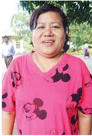
မနှင်းယုရွှေ သင်တန်းသူ