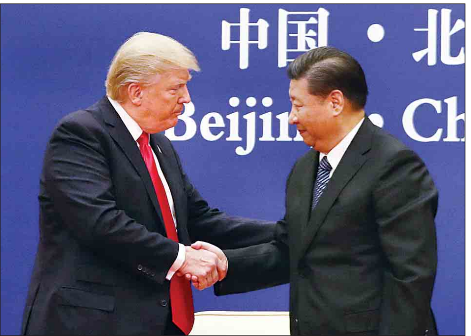
အန်ဒီအိတ်ချ်က

နျူကလီးယားလက်နက်ပျောက်ရေးအတွက် ကတိပြုပါကြောင်းနှင့် နျူကလီးယားလက်နက်ကင်းစင်ရေး ကမ္ဘာတစ်ဝန်းကြိုးပမ်းမှုတွင်လည်း ပါဝင်ကူညီမည်ဖြစ်ကြောင်း သမ္မတရှီက ဆိုသည်။ ထို့ပြင် ကုလသမဂ္ဂဖြေရှင်းချက်များကို ဆက်လက်လိုက်နာရန် လိုအပ်ကြောင်းနှင့် ပြုယမ်း၏ နျူကလီးယားအရေးကို ဆွေးနွေးညှိနှိုင်းခြင်းဖြင့် အဖြေရှာသင့်ကြောင်း သမ္မတရှီက ဆက်လက်ပြောကြားခဲ့သည်။ သမ္မတထရပ်၏ ခရီးစဉ်အတွင်း အမေရိကန်ဒေါ်လာ ၂၅၀ ဘီလီယံတန်ဖိုးရှိ စီးပွားရေးရင်းနှီးမြှုပ်နှံမှုဆိုင်ရာ သဘောတူညီမှုစာချုပ်များကို ချုပ်ဆိုခဲ့သည်။ နှစ်နိုင်ငံကုန်သွယ်ရေးကဏ္ဍနှင့်ပတ်သက်ပြီး အမေရိကန်အနေဖြင့် မျှတပြီး အပြန်အလှန်ဖြစ်သော ကုန်သွယ်မှု ဆက်ဆံရေးကို အလိုရှိပါကြောင်း သမ္မတထရပ်က ပြောကြားခဲ့သည်။ သမ္မတထရပ်သည် နိုဝင်ဘာ ၁၀ ရက်တွင် ပေကျင်း မှတစ်ဆင့် ဝီယက်နမ်နိုင်ငံသို့ ခရီးဆက်မည်ဖြစ်ကြောင်း သိရသည်။