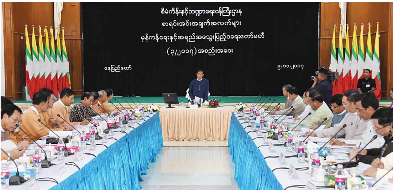
စီမံကိန်းနှင့်ဘဏ္ဍာရေးဝန်ကြီးဌာန စာရင်းအင်းအချက်အလက်များ မှန်ကန်ရေးနှင့်အရည်အသွေးပြည့်ဝရေးကော်မတီ (၃/၂၀၁၇) အစည်းအဝေး