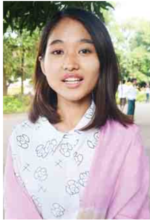
မထူးထက်နိုင် သင်တန်းသူ