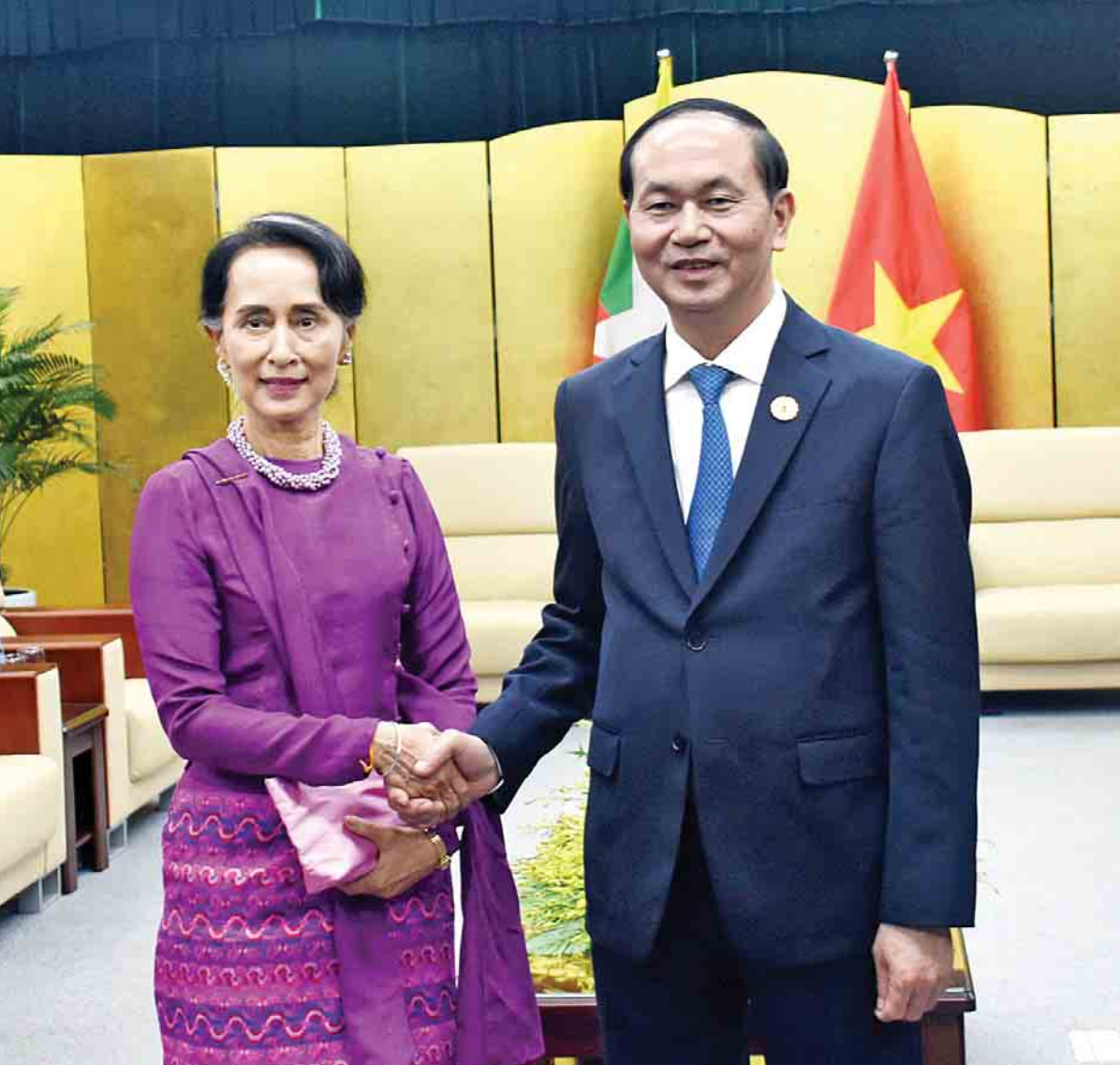
နိုင်ငံတော်၏အတိုင်ပင်ခံပုဂ္ဂိုလ် ဒေါ်အောင်ဆန်းစုကြည်နှင့် ဝိယက်နမ်နိုင်ငံသမ္မတ မစ္စတာ ထရမ်ဒိုင်ကွမ်တို့ ရင်းရင်းနှီးနှီးနှုတ်ဆက်စဉ်။