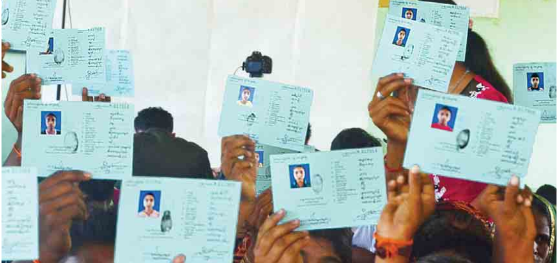
မောင်တောမြို့၌ National Verification Card ရရှိပြီးသူများအား တွေ့ရစဉ်။

မောင်တော နိုဝင်ဘာ ၇ လူဝင်မှုကြီးကြပ်ရေးနှင့် ပြည်သူ့အင်အားဦးစီးဌာန ရခိုင်ပြည်နယ်ဦးစီးမှူး ညွှန်ကြားရေးမှူး ဦးအောင်မင်းဦးစီးသည့်အဖွဲ့သည် ယနေ့နံနက်ပိုင်းက ဘင်္ဂါလီများနေထိုင်သည့် မောင်တောမြို့နယ် ရွှေလေးကျေးရွာအုပ်စု စေတီပြင်သို့ သွားရောက်၍ အစွဲလားတာဝန်များ National Verification Card (NVC) လုပ်ဆောင်နိုင်ရန်နှင့် အမျိုးသားမှတ်ပုံတင်ကိုင်ဆောင်ထားသူများအနေဖြင့် နိုင်ငံသားစိစစ်ရေးလုပ်ငန်းစဉ်အတိုင်း ဆက်လက်လုပ်ဆောင်၍ နိုင်ငံသားစိစစ်ရေးကတ်ပြား (သို့မဟုတ်) နိုင်ငံသားအသိအမှတ်ပြုကတ်ပြား သင့်တော်ရာကတ်တစ်မျိုးမျိုးကို ရရှိနိုင်ရေး ဆက်လက်ဆောင်ရွက်ပေးသွားမည်အကြောင်း သွားရောက်ရှင်းလင်းပြောကြားသည်။ “NVC လုပ်ဆောင်ရာမှာ ခြိမ်းခြောက်မှုတွေနဲ့ပတ်သက်ပြီး တော်တော်ပြင်းပြင်းထန်ထန် လုပ်ထားတယ်၊ အသက်အန္တရာယ်နဲ့ပတ်သက်ပြီး ခြိမ်းခြောက်တယ်၊ ဒါကြောင့် ကြောက်လန့်ပြီး လာမလုပ်ရဲတာလည်း ပါတယ်၊ ကျွန်တော်တို့က ဒီမှာရှိတဲ့သူတွေကို NVC လုပ်ပေးလိုက်ရင် ဒီမှာရှိတဲ့သူနဲ့ မရှိတဲ့သူ ကွဲပြားသွားမယ်၊ အဲဒီလို ကွဲပြားသွားမှာကို တချို့က မလိုလားဘူး၊ ဒါကြောင့် NVC မလုပ်ဖို့ ဝိုင်းပြီးခြိမ်းခြောက်နေတယ်၊ နှောင့်ယှက်နေတယ်၊ အဲဒီလို ခြိမ်းခြောက်နှောင့်ယှက်မှု ထင်ထင်ရှားရှားလုပ်တဲ့သူတွေကို ကျွန်တော်တို့က အမှုဖွင့်အရေးယူထားပါတယ်၊ ဒီကိစ္စနဲ့ပတ်သက်ပြီး ရွှေလေးအနောက်ရွာက လူတစ်ဦးကို ကျွန်တော်တို့ အမှုဖွင့်ထားပါတယ်”ဟု ဦးအောင်မင်းက ပြောသည်။ National Verification Card ပြုလုပ်ရာတွင် ခြိမ်းခြောက်မှုများ ရှိနေပြီး အဆိုပါ ခြိမ်းခြောက်မှုများသည် နိုင်ငံတော်၏ ကောင်းမွန်သည့် ရည်ရွယ်ချက်နှင့် ရည်မှန်းချက်ကို ဖျက်လိုဖျက်ဆီး ပြုလုပ်သည့်သဘောဖြစ်သည်။ ထို့ကြောင့် အဆိုပါခြိမ်းခြောက်မှုများအတွက် အကြမ်းဖက်ဥပဒေပုဒ်မများနှင့် စာမျက်နှာ ၈ ကော်လံ ၃ သို့ □