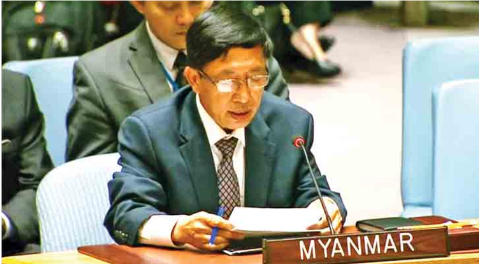
ကုလသမဂ္ဂမြန်မာအမြဲတမ်းကိုယ်စားလှယ် ဦးဟောကိခိုဆွမ်း မိန့်ခွန်းပြောကြားစဉ်။

နေပြည်တော် နိုဝင်ဘာ ၇ ရခိုင်ပြည်နယ် အခြေအနေနှင့်ပတ်သက်၍ ကုလသမဂ္ဂလုံခြုံရေးကောင်စီ ဥက္ကဋ္ဌ၏ ထုတ်ပြန်ချက်(Statement by the President of the Security Council-PRST) တစ်ရပ် ထုတ်ပြန်ရန် လုံခြုံရေးကောင်စီတွင် တံခါးဖွင့်အစည်းအဝေးတစ်ရပ်ကို နိုဝင်ဘာ ၆ ရက် မွန်းလွဲ ၃ နာရီတွင် နယူးယောက်မြို့ ကုလသမဂ္ဂဌာနချုပ်၌ ကျင်းပသည်။ ရခိုင်ပြည်နယ်နှင့် စစ်လျဉ်း၍ လုံခြုံရေးကောင်စီ၌ ဆုံးဖြတ်ချက်တစ်ရပ်ကိုချမှတ်ရန် ကြိုးပမ်းခဲ့သော်လည်း သဘောတူညီမှု မရခဲ့သဖြင့် ဥက္ကဋ္ဌ၏ထုတ်ပြန်ချက်ကို အတည်ပြုချမှတ်ခဲ့ခြင်းဖြစ်သည်။ အဆိုပါအစည်းအဝေးတွင် ယင်းထုတ်ပြန်ချက်နှင့်ပတ်သက်၍ နယူးယောက်မြို့ မြန်မာအမြဲတမ်းကိုယ်စားလှယ် ဦးဟောကိခိုဆွမ်းက သဘောထားရပ်တည်ချက် မိန့်ခွန်းတစ်ရပ်ကို ပြောကြားခဲ့သည်။ ထိုသို့ပြောကြားရာတွင် အောက်ပါအချက်များကို ထည့်သွင်းဖော်ပြခဲ့သည်- - မြန်မာနိုင်ငံ၏ အခြေအနေနှင့်ပတ်သက်၍ PRST ချမှတ်ခဲ့ခြင်းအပေါ် များစွာစိုးရိမ်မကင်းဖြစ်မိပါကြောင်း၊ - ထိုထုတ်ပြန်ချက်သည် ရခိုင်ပြည်နယ်အတွင်း စိန်ခေါ်မှုများအား ဖြေရှင်းရေးအတွက် မြန်မာအစိုးရ၏ ကြိုးပမ်းဆောင်ရွက်ချက်များကို အပြည့်အဝ အသိအမှတ်ပြုနိုင်ခဲ့ခြင်းမရှိခဲ့ကြောင်း၊ စာမျက်နှာ ၉ ကော်လံ ၁ သို့ ❖