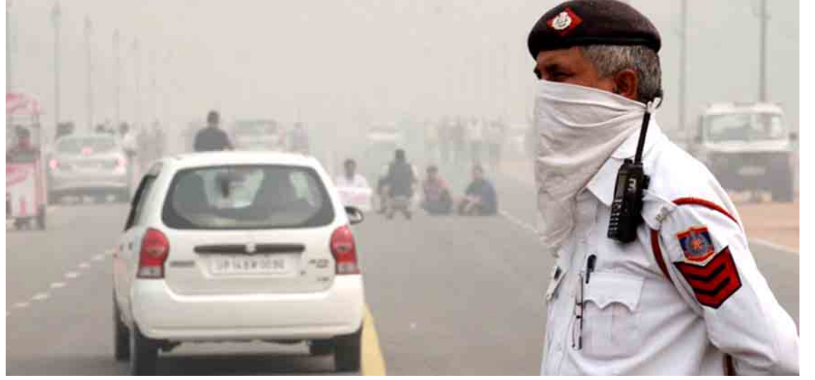
မီးခိုးမြို့လေထုအတွင်း ပါရှိခြင်းကြောင့် အသက်ရှူရပ်ခြင်းနှင့် အဆုတ်တွင် မွန်းကျပ်မှု များဖြစ်ပေါ်နိုင်သည့်အပြင် အမြင်အာရုံဆိုးရွား စွာ သက်ရောက်ခြင်းများဖြစ်ပေါ်နိုင်သည်။ အိန္ဒိယနိုင်ငံ မြို့တော် နယူးဒေလီသည် ကမ္ဘာပေါ်၌ လေထုညစ်ညမ်းမှု အဆိုးရွားဆုံး ဖြစ်ဖွယ်ရှိပြီး ဓာတ်ငွေ့ လျှောက်ကန်ကြီးနှင့် တူညီနေသည်ဟု ဒေလီမြို့တော် တရားရုံးချုပ် က ယမန်နှစ်က ပြောကြားခဲ့သည်။ ဆင်ယွာ

ဆိုင်ရာ လေဆိပ်အာဏာပိုင်များက မြို့ခိုများ ပိတ်ဖုံးနေမှုကြောင့် လေယာဉ်ပြေးလမ်းများကို ပိတ်ထားရပြီး လေကြောင်းခရီးစဉ် ၂၀ ကျော် ကို ရွှေ့ဆိုင်းထားခဲ့ရသည်။ မီးခိုးမြို့များ ကျဆင်းနေခြင်းကြောင့် စာသင်ကျောင်းများ၏ အဆောက်အအုံ ပြင်ပ လှုပ်ရှားမှုများနှင့် အားကစား လှုပ်ရှားမှုများကို နံနက်ပိုင်းတွင် ရပ်ဆိုင်းထားရေးအတွက် ဒေလီမြို့တော် အုပ်ချုပ်ရေးအဖွဲ့အား အိန္ဒိယ ဆေးဘက်ဆိုင်ရာ အဖွဲ့အစည်း(အိုင်အမ်အေ) က အကြံပြုထားသည်ဟု သတင်းများ၌ ဖော်ပြ သည်။ မြင့်တက် မြို့တော်ဒေလီ၏ လေထုညစ်ညမ်းမှု အဆင့်သည် ခွင့်ပြုနိုင်ဖွယ် အဆင့်၏ ၁၂ မှ ၁၉ ဆအထိ မြင့်တက်နေခြင်းကြောင့် ယင်းသတိ ပေးချက်ကို ထုတ်ပြန်ရခြင်းဖြစ်ကြောင်း ဆေးဘက်ဆိုင်ရာ အဖွဲ့အစည်းမှ တာဝန်ရှိသူ က ပြောကြားသည်။