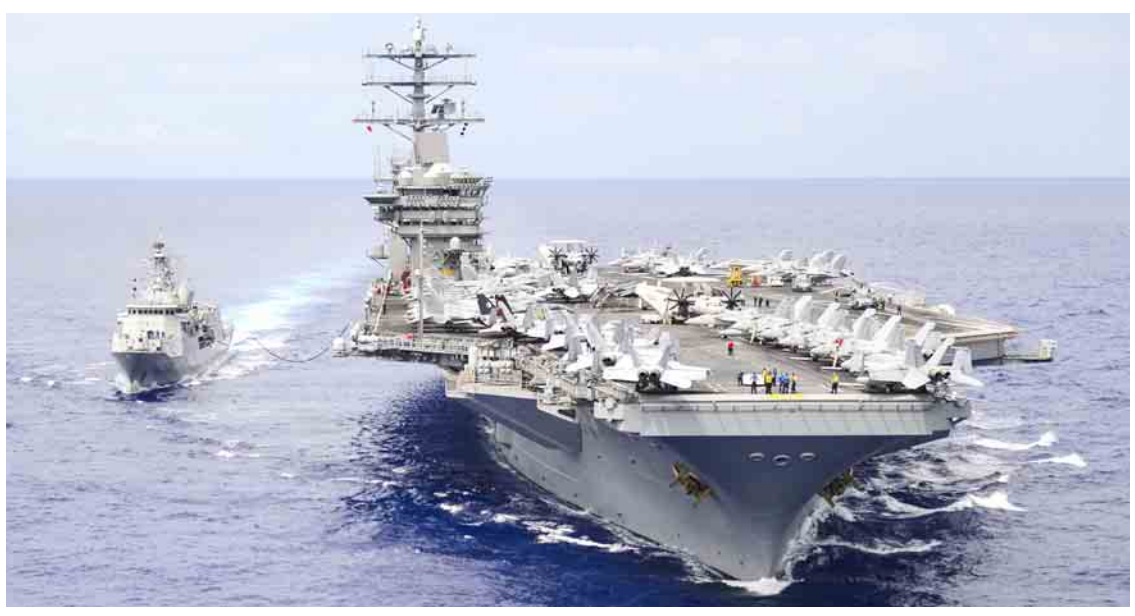
အင်နာဇူးမားဖျက်သင်္ဘောသည် ဂျပန် ပင်လယ်ပြင်အတွင်း အမေရိကန် လေယာဉ် တင်သင်္ဘောကြီး ရော်နယ်ရေဂင်နှင့် အိန္ဒိယ စစ်သင်္ဘောနှစ်စင်းတို့နှင့်အတူ သုံးရက်ကြာ စစ်ရေးလေ့ကျင့်ခဲ့ပြီးနောက် အမေရိကန် လေယာဉ်တင်သင်္ဘောကြီး သုံးစင်းနှင့်အတူ ပူးတွဲစစ်ရေး လေ့ကျင့်မှုတွင် ပါဝင်မည်ဖြစ် ကြောင်း ဂျပန်တာဝန်ရှိသူများက ပြောကြား ကြသည်။ အာရှနိုင်ငံများသို့ သမ္မတ ဒေါ်နယ် ထရန့် ခရီးလှည့်လည်နေချိန်အတွင်း အမေ ရိကန် လေယာဉ်တင်သင်္ဘော တိုက်ခိုက်ရေး အုပ်စု သုံးခုက စစ်ရေးလေ့ကျင့်ခြင်းသည် မြောက်ကိုရီးယားနှင့် တင်းမာမှု ဖြစ်ပေါ်နေမှု ကို တုံ့ပြန်လျက် အမေရိကန်က ကြိုတောင့် ကြိုခဲစစ်အင်အားပြသခြင်းဖြစ်သည်။

ဝါရှင်တန် နိုဝင်ဘာ ၇ သမ္မတ ဒေါ်နယ်ထရန့် အာရှတစ်ခွင် ခရီးလှည့်လည်နေချိန်အတွင်း အမေရိကန် လေယာဉ်တင်သင်္ဘော တိုက်ခိုက်ရေးအုပ်စု သုံးခုမှ လေယာဉ်တင်သင်္ဘောသုံးစင်းသည် ပစိဖိတ်သမုဒ္ဒရာ အနောက်ပိုင်း၌ လာမည့် ရက်အနည်းငယ်အတွင်းပူးတွဲစစ်ရေးလေ့ကျင့် ကြရန် စီစဉ်ထားကြောင်း အမေရိကန်အစိုးရ တာဝန်ရှိသူများက နိုဝင်ဘာ ၇ ရက်တွင် ပြောကြားကြသည်။ ပူးတွဲစစ်ရေးလေ့ကျင့်မှုတွင် ယူအက်စ် အက်စ်နီမစ်(ယာပုံ)ရော်နယ်ရေဂင်၊ သီအိုဒိုရိုဗွဲ အမည်ရှိလေယာဉ်တင်သင်္ဘောသုံးစင်း၊ ယင်း သင်္ဘောများ၏ အခြေအရံ စစ်သင်္ဘောများ ပါဝင်ကြမည်ဖြစ်ကြောင်း၊ဆယ်စုနှစ်တစ်စုတာ ကာလအတွင်း ပစိဖိတ်သမုဒ္ဒရာ အနောက်ပိုင်း ၌ လေယာဉ်တင်သင်္ဘောသုံးစင်း ပူးတွဲစစ်ရေး လေ့ကျင့်ကြခြင်းမှာ ပထမဆုံးအကြိမ်ဖြစ် ကြောင်း အမေရိကန် တာဝန်ရှိသူများက ပြော ကြားကြသည်။ ယင်းစစ်ရေးလေ့ကျင့်မှုတွင် ဂျပန်နိုင်ငံမှ အင်နာဇူးမား အမည်ရှိ ဖျက်သင်္ဘောတစ်စင်း ပါဝင်မည်ဖြစ်ကြောင်း ဂျပန်အစိုးရ တာဝန်ရှိ သူများက ပြောကြားကြသည်။