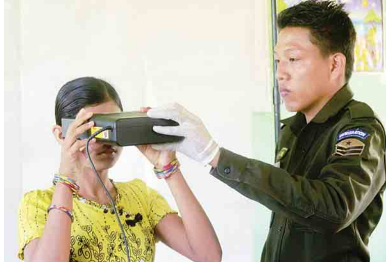
ရွှေလေးကျေးရွာ အခြေခံပညာမူလတန်းလွန်ကျောင်း၌ National Verification Card များ ပြုလုပ်ပေးနေစဉ်။