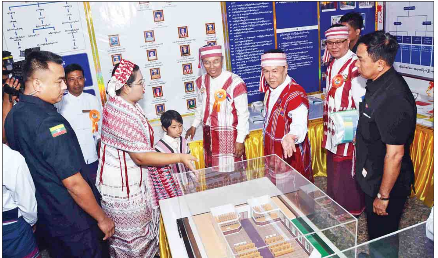
(၆၂) နှစ်မြောက် ကရင်ပြည်နယ်နေ့ အခမ်းအနား၌ ခင်းကျင်းပြသထားသည့် ပြခန်းများကို ဒုတိယသမ္မတ ဦးမြင့်ဆွေ လှည့်လည်ကြည့်ရှုစဉ်။