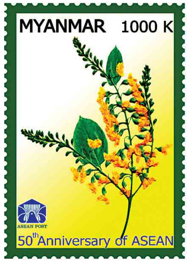
အလျား 30 mm အနံ 42 mm

အထူးအစီအစဉ်တစ်ရပ်အနေဖြင့် နေပြည်တော်ဗဟိုစာပို့တိုက်ကြီး၊ ရန်ကုန်စာပို့တိုက်ကြီးနှင့် မန္တလေးစာပို့တိုက်ကြီးတို့၌ နိုဝင်ဘာ ၁၁ ရက်တွင် ဝယ်ယူသော စာပို့တံဆိပ်ခေါင်းများပေါ်တွင် နေ့စွဲအမှတ်အသားတံဆိပ် ရိုက်နှိပ်ပေးမည်ဖြစ်ကြောင်း သိရသည်။ သတင်းစဉ်