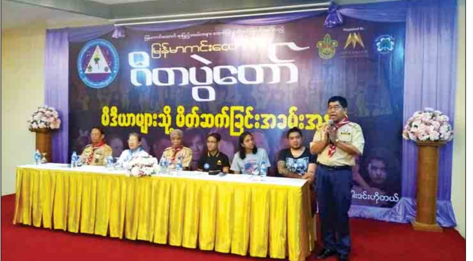
မြန်မာကင်းထောက် ဂီတပွဲတော်နှင့်ပတ်သက်သည့် စာနယ်ဇင်းရှင်းလင်းပွဲကို ရန်ကုန်မြို့ တော်ဝင်ဂါးဒင်း ဟိုတယ်ခန်းမ၌ ကျင်းပစဉ်။

မြန်မာကင်းထောက် ဂီတပွဲတော်ကို နိုဝင်ဘာ ၁၂ ရက် ညနေပိုင်းတွင် ရန်ကုန်မြို့ သုဝဏ္ဏအမျိုးသားအားကစား ပြိုင်ပွဲရုံ(၁)၌ ကျင်းပမည်ဖြစ်ရာ တေးသံရှင် ဟန်ထွန်း၊ အာဇာနည်၊ ဂျီလတ်၊ သအို၊ ဝေလ၊ ဖြိုးပြည့်စုံ၊ သားငယ်၊ နီနီခင်ဇော်၊ ဆိုဖီယာ၊ ဘီလီလမ်းအေး နှင့် တေးသံရှင် များက တေးသံချင်းများ သီဆိုဖျော်ဖြေမည်ဖြစ်ပြီး ငြိမ်းချမ်းရေးကို ဦးတည်သော တေးသံချင်းများ၊ ကင်းထောက် တေးသံချင်းများဖြစ်သည့် “ငြိမ်းချမ်းရေး၏ သံတမန်များ” နှင့် “ကင်းထောက် ဂုဏ်ရည်” တေးသံချင်းများကို တက္ကသိုလ်ကင်းထောက်မောင်မယ်များနှင့် အခြေခံပညာ