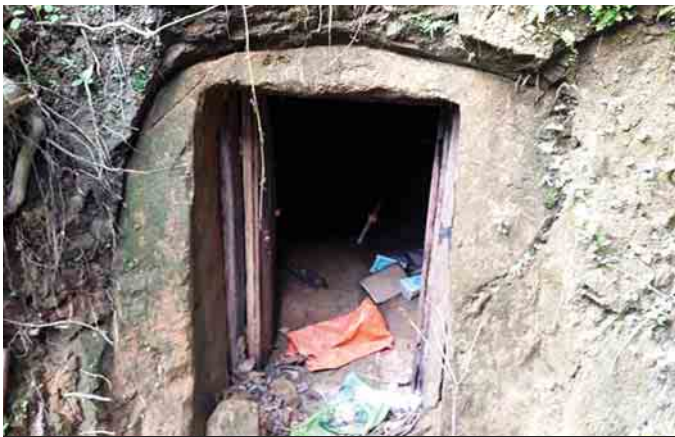
လုံခြုံရေးတပ်ဖွဲ့ဝင်များ ရှာဖွေတွေ့ရှိသည့် လိုက်ဂူတစ်ခုအား တွေ့ရစဉ်။