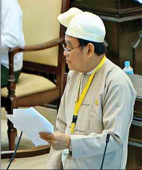
ပြည်ထောင်စုဝန်ကြီး ဒေါက်တာမြင့်ထွေး

ချင်းပြည်နယ် မဲဆန္ဒနယ်အမှတ်(၃)မှ ဦးဘွဲ့ခိန်း၏ ချင်းပြည်နယ် ထန်တလန်မြို့နယ်တွင် စံချိန်စံညွှန်းမီ ဖိုးလုံလေလုံ မြို့နယ်အားကစားရုံကို ၂၀၁၈-၂၀၁၉ ဘဏ္ဍာနှစ်