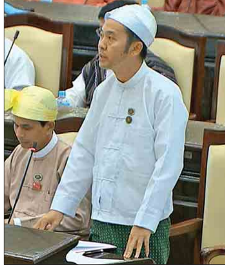
ရှမ်းပြည်နယ် မဲဆန္ဒနယ် အမှတ်(၁၁)မှ ဦးကျော်နီနိုင်

ငွေလုံးငွေရင်း (မူလ) အသုံးစရိတ်တွင် ထည့်သွင်းပေးရန်နှင့် အရှေ့တောင်အာရှ အားကစားပြိုင်ပွဲတွင် နိုင်ငံတော် ကိုယ်စားပြုခဲ့သည့် ချင်းပြည်နယ်မှ အားကစားသမား (၃) ဦးတို့အား ၎င်းတို့နှင့် ထိုက်တန်သည့် အလုပ်ခန့်ထားပေးရန် အစီအစဉ် ရှိ မရှိ မေးခွန်းနှင့်စပ်လျဉ်း၍ ပြည်ထောင်စု ဝန်ကြီး ဒေါက်တာမြင့်ထွေးက စံချိန်စံညွှန်းမီဖိုးလုံလေလုံ အားကစားရုံ (အလျား ပေ ၁၂၀ x အနံ ပေ ၉၀ ) တည်ဆောက်ခြင်းလုပ်ငန်းအတွက် ငွေကျပ် သန်း၃၀၀နှင့် ဖိုးလုံလေလုံ အားကစားရုံခြံစည်းရိုး ကာရံခြင်းအတွက် ငွေကျပ် ၃၆သန်းတို့ကို ၂၀၁၈-၂၀၁၉ ဘဏ္ဍာရေးနှစ် ချင်းပြည်နယ်အစိုးရအဖွဲ့၏ ခွင့်ပြုရန်ပုံငွေစာရင်းတွင် ထည့်သွင်းတင်ပြတောင်းခံထားပြီး ဖြစ်ပါကြောင်း၊ အဆိုပါ မြေနေရာအား ထန်တလန်မြို့နယ် အားကစားနှင့်ကာယ ပညာဦးစီးဌာန အမည်ပေါက်နှင့် ဘတ်ဂျက်ခွင့်ပြုငွေ ရရှိပါက ချက်ချင်းဆောင်ရွက်ပေးသွားမည် ဖြစ်ပါကြောင်း။