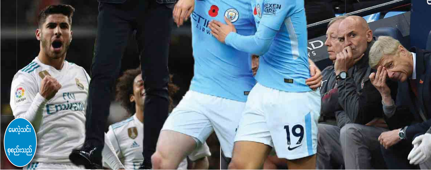
မေလဲ့သင်း စုစည်းသည်

ခုနောက်ဆုံးကစားခဲ့တဲ့ အာဆင်နယ်နဲ့ ပွဲမှာလည်း အာဆင်နယ် နည်းပြ ဝင်းဂါးက စတာလင်း ဒိုင်ဗင်ပစ်ပြီး ပင်နယ်တီ ရယူသွားတယ်လို့ စွပ်စွဲမှုရှိသလို ရိုးဆပ်စ် သွင်းယူခဲ့တဲ့ ပွဲသိမ်းရီးဟာ လူကျံဘော ဖြစ်နေပေမယ့် တစ်ပွဲလုံး အခြေအနေကို ခြုံငုံပြီးသုံးသပ်ရရင်တော့ မန်စီးစီးရဲ့ လက်ရှိအနေအထားကို အာဆင်နယ်မှ