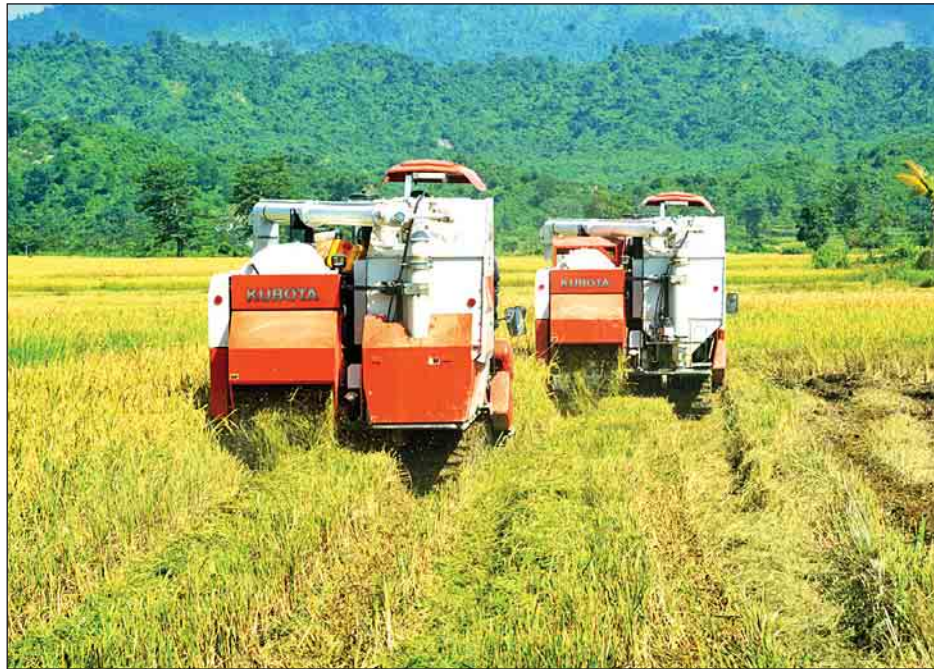
မောင်တော တောင်ပိုင်းဒေသ ကျောင်းတောင်ကျေးရွာ၌ ရင့်မှည့်စပါးများကို ရိတ်သိမ်းပေးနေစဉ်။