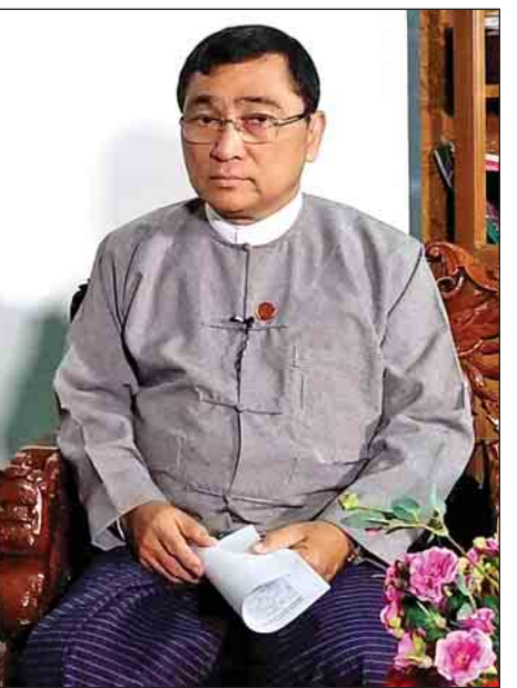
ဒေါက်တာဝင်းမြတ်အေး (ပြည်ထောင်စုဝန်ကြီး)

ပြီးခဲ့တဲ့ အောက်တိုဘာ ၂၈ ရက်နဲ့ ၂၉ ရက်မှာ ဒေါက်တာအောင်ထွန်းသက်နဲ့ ကျွန်တော် ရခိုင်ဒေသကို ရောက်တယ်။ လူမှုအဖွဲ့အစည်းတွေနဲ့ တွေ့ပါတယ်။