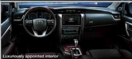
Luxuriously appointed interior