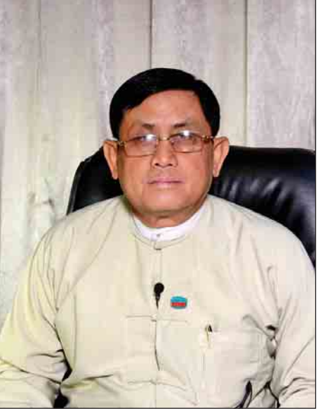
ဦးမောင်မောင်ဝင်း (ဒုတိယဝန်ကြီး၊ စီမံကိန်းနှင့် ဘဏ္ဍာရေးဝန်ကြီးဌာန)

ပြည်တွင်းအင်အားကိုယူပြီး ထုတ်ချေးမယ်ဆိုတာက လည်း မြန်မာ့စီးပွားရေးဘဏ်အနေနဲ့ အပ်ငွေအများ ဆုံးရှိတဲ့ အဖွဲ့အစည်းဖြစ်တဲ့အတွက် ပုံမှန်ချေးနေတဲ့ Commercial Loan လိုခေါ်တဲ့ စီးပွားရေးချေးငွေ ကတော့ တစ်နှစ်ကို အတိုးနှုန်း ၁၃ ရာခိုင်နှုန်းနဲ့ ထုတ်ချေး ပါတယ်။ ဒီစီးပွားရေးချေးငွေမှာ သက်တမ်းက တစ်နှစ်ပဲ ချေးနိုင်တယ်ဆိုတဲ့ အနေအထား၊ အတိုးနှုန်းကလည်း ၁၃