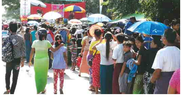
သီဟကိုကို(မန္တလေး)

ညဈေးသို့ လာရောက်သူများ ကြည့်ရှုနားဆင်နိုင်ရန် Acoustic တေးဂီတအဖွဲ့မှလည်း ခေတ်ပေါ်တေးသီချင်းများဖြင့် ဖျော်ဖြေပေးသည်။ တန်ဆောင်တိုင် မီးထွန်းပွဲနှင့်အတူ အမှတ်တရဓာတ်ပုံ ရိုက်ကူးနိုင်စေရန် Photo Boothe စီစဉ်ပေးထားရာ ဓာတ်ပုံရိုက်သူများဖြင့်လည်း စည်ကားလျက်ရှိသည်။ ဘန်ကောက်စတိုင် ညဈေးကို ညနေ ၄ နာရီမှ ည ၁၀ နာရီအထိ ရောင်းချပေးလျက်ရှိကြောင်း သိရသည်။