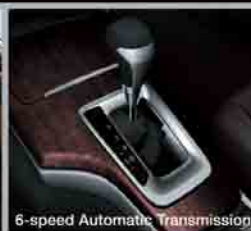
6-speed Automatic Transmission