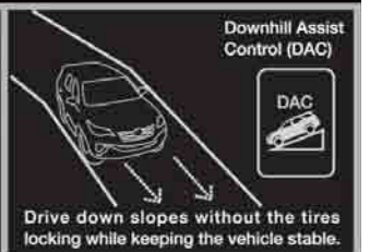
Downhill Assist Control (DAC)