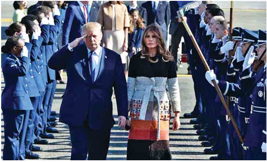
ခေါင်းဆောင်နှစ်ဦးက ဆွေးနွေးမည်ဖြစ်ကြောင်း မျှော်လင့် ရသည်။ ထရန်န့်အစိုးရအဖွဲ့က အမေရိကန်-ဂျပန် ကုန်သွယ်ရေး ဆောင်ရွက်မှုတွင် လိုငွေပြခြင်းနှင့် ပတ်သက်ပြီး စိုးရိမ် ပူပန်လျက်ရှိကြသည်။

ဖမ်းဆီးခေါ်ဆောင်ခြင်းခံခဲ့ရသူ ဂျပန်နိုင်ငံသားများ၏ မိသားစုဝင်များကိုလည်း သမ္မတထရန်န့်က တွေ့ဆုံမည်ဖြစ် သည်။ အဆိုပါတွေ့ဆုံပွဲသို့ ၂၀၀၂ ခုနှစ်က ပြုယမ်းမှု ပြန်လည်လွတ်မြောက်လာခဲ့သော ဖမ်းဆီးခြင်းခံရသူ တစ်ဦးလည်း တက်ရောက်မည်ဖြစ်ကြောင်း သိရသည်။ ယင်းနောက် သမ္မတ ထရန်န့်နှင့် ဝန်ကြီးချုပ် အာဘေး တို့က သတင်းစာရှင်းလင်းပွဲတစ်ရပ် ကျင်းပမည် ဖြစ်သည်။ ခေါင်းဆောင်နှစ်ဦး တွေ့ဆုံဆွေးနွေးပွဲတွင် မြောက်ကိုရီးယား နျူကလီးယားဖွံ့ဖြိုးမှု အစီအစဉ်နှင့် ဒုံးကျည်ပစ်လွှတ်ခြင်းခြောက်မှုဆိုင်ရာကိစ္စရပ်များ ပါဝင် နိုင်ဖွယ်ရှိသည်။ ထို့ပြင် ပြုယမ်းအား ဖိအားထပ်မံပေးရန် တရုတ်နိုင်ငံနှင့် အခြားသောနိုင်ငံများအား အတူတကွ တိုက်တွန်းပြောကြားမည့်အရေးကိစ္စများကိုလည်း ဆွေးနွေး နိုင်ဖွယ်ရှိသည်။ စီးပွားရေးကဏ္ဍနှင့်ပတ်သက်ပြီး စွမ်းအင်ကဏ္ဍ ပူးပေါင်းဆောင်ရွက်မှုကိုလည်း ထပ်မံတိုးချဲ့ဆောင်ရွက်ရန် နှင့် နိုင်ငံရပ်ခြားအခြေခံအဆောက်အအုံ စီမံကိန်းများ ဆိုင်ရာ နှစ်နိုင်ငံပူးပေါင်းဆောင်ရွက်မှုနှင့်ပတ်သက်ပြီး