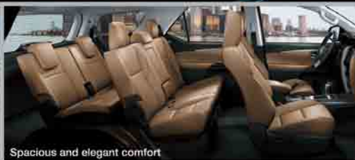
Spacious and elegant comfort