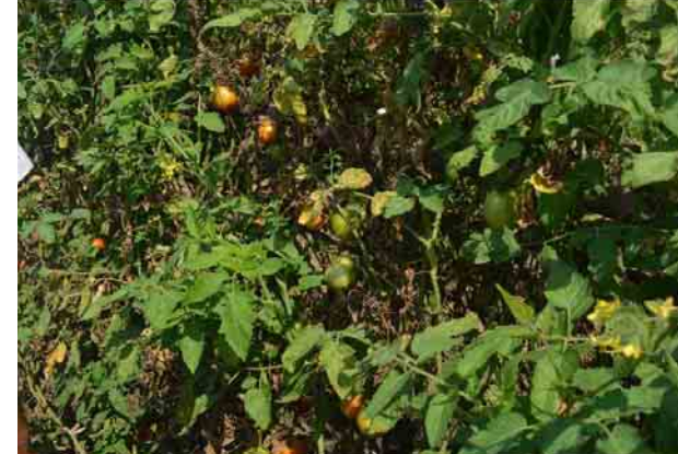
ဝင်းဦး(လျှောက်တိုင်း)

အခင်းတွေကတော့ အတော့်ကိုဈေးကောင်းရမှာပါ။ စိုက်ခင်းတွေကလည်း အများကြီးပျက်စီးခဲ့တဲ့အတွက် ဈေးကွက်ကလည်း လိုသလောက်မရတဲ့အတွက် ဈေးနှုန်းမြင့်တက်သွားတာပါ”ဟု မုံရွာမြို့နယ် ခတ္တကန်တောင်ကျေးရွာမှ ခရမ်း ချဉ်သီးစိုက် တောင်သူတစ်ဦးက ပြောသည်။ မုံရွာမြို့နယ်အတွင်းရှိ အမြင့်ပိုင်းဒေသများဖြစ်သော ခတ္တကန်၊ ကြီးအုပ်၊ ညောင်ပင်သာ၊ ကျောက်ကွဲ၊ ညောင်ပင်ကျေးရွာနှင့် လှည်းတား၊ ဘန်စီကျေးရွာ များတွင် အများဆုံးစိုက်ပျိုးကြပြီး ထွက်ရှိသည့်အသီးများကို မုံရွာမြို့ပွဲရုံများသို့ တင်ပို့ရောင်းချက်လျက်ရှိရာ ယခုနှစ်တွင် အသီးထွက်ရှိမှုနည်းသော်လည်း ဈေးကောင်းရလျက်ရှိကြောင်း သိရသည်။