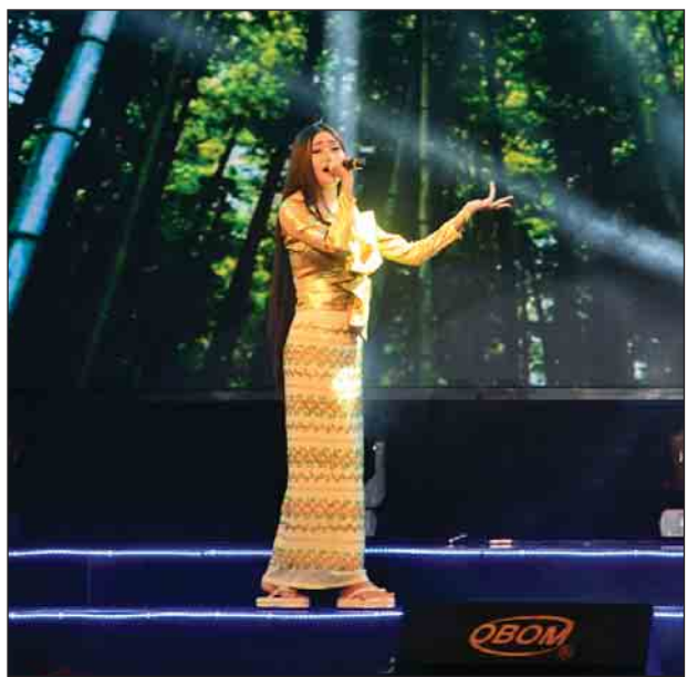
ငြိမ်းချမ်းရေးဂီတပွဲတော်(၂၀၁၇) သီချင်းဆိုပြိုင်ပွဲ Level(3) အဆင့် ပွဲစဉ်(၁) တွင် ပြိုင်ပွဲဝင်နေသူတစ်ဦးကို တွေ့ရစဉ်။