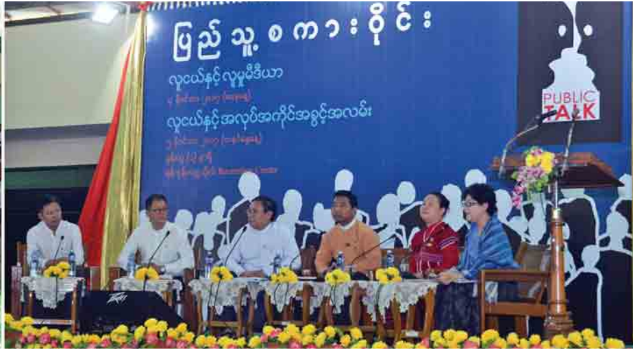
လူငယ်နှင့် အလုပ်အကိုင်အခွင့်အလမ်း ခေါင်းစဉ်ဖြင့် ပြည်သူ့စကားဝိုင်းကို ရန်ကုန်တက္ကသိုလ် Recreation Centre ၌ ကျင်းပစဉ်။