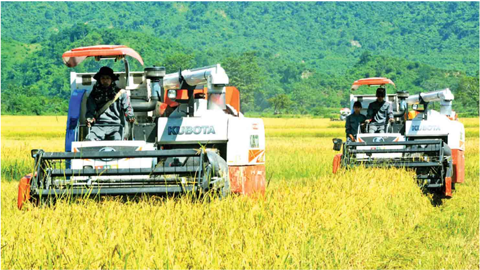
မောင်တောတောင်ပိုင်းဒေသ ကျောင်းတောင်ကျေးရွာ၌ စက်မှုလယ်ယာဦးစီးဌာနမှ ရိတ်သိမ်းခြွေလှေ့စက်ကြီးများဖြင့် ရိတ်သိမ်းပေးနေစဉ်။

လူငယ်နှင့် အလုပ်အကိုင်အခွင့်အလမ်း ခေါင်းစဉ်ဖြင့် ပြည်သူ့စကားဝိုင်းကျင်းပ တိုင်းပြည်မှာ ဒီမိုကရေစီ ပိုမိုပြည့်ဝတဲ့ စနစ်တစ်ခု တည်ဆောက်နိုင်ဖို့လေ့ကျင့်ဆောင်ရွက်နေတာဖြစ် စာမျက်နှာ - ၇