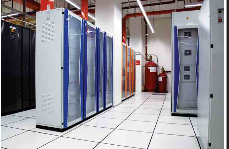
သတင်းအချက်အလက်များကို Data Center များတွင် စုစည်းသိမ်းဆည်းလာကြသည်။

၁၉၉၀ ခုနှစ် ဝန်းကျင်က စီးပွားရေးလုပ်ငန်းများသည် ၎င်းတို့၏ အချက်အလက်များကို သိမ်းဆည်းရန် ကိုယ်ပိုင်ဒေတာစင်တာများ တည်ဆောက်ခဲ့ကြသည်။ မိမိတို့အချက်အလက်များကို မိမိတို့ကိုယ်တိုင်သိမ်းဆည်းခြင်းဖြင့်၊ လုံခြုံစိတ်ချရသည်ဆိုသည့် ယူဆမှုများကြောင့်လည်း ဖြစ်သည်။ နည်းပညာကဏ္ဍဖွံ့ဖြိုးသေးသည့် အချိန်တွင် ကိုယ်ပိုင် Server Room နှင့် ထားခြင်းသည်