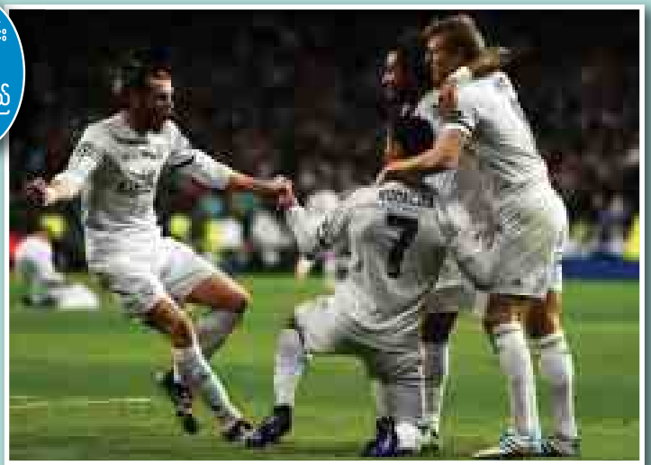
မေလုံသင်း စုစည်းသည်

ကွန်တီ၏ ချယ်လ်ဆီးအသင်းမှာ ပြီးခဲ့သည့် ဘောလုံးရာသီ ယခုလို အချိန်မျိုးတွင် ရလဒ်များ အထူးကောင်းမွန်နေပြီး အားလုံးကို အံ့အားတသင့် စွမ်းဆောင်ပြုနေသော်လည်း ယခုနှစ်တွင် နိုင်တစ်ခါ ရှုံးတစ်လှည့်နှင့် ခြေစွမ်း အတက်အကျအတော်များနေသည်ကို တွေ့ရသည်။ ကွန်တီနှင့် မော်ရင်ဟိုတို့ကြား ကွင်းဘေးစည်း အချေ အတင်ဖြစ်မှုများကို ချယ်လ်ဆီးနှင့် မန်ယူအသင်းတို့ ထိပ်တိုက် ဆုံတွေ့ခဲ့သည့် ပွဲစဉ်တိုင်းလိုလိုတွင် မြင်တွေ့ခဲ့ရသလို ပြီးခဲ့သည့် နွေဈေးကွက် ခေါ်ယူချင်သည့်ကစားသမား ကြိုက်နှစ်သက်မှုတူညီ ခဲ့ရာ တစ်ယောက်တစ်ပြန်ထိုးနှက်မှုများ နွေဈေးကွက်တောက်လျှောက် ဖြစ်ပေါ်ခဲ့သည်။ ချယ်လ်ဆီးက တောက်လျှောက်ချဉ်းကပ်ခဲ့သည့် လူကာကူကို မန်ယူက အရခေါ်ယူနိုင်ခဲ့ပြီးနောက် ချယ်လ်ဆီးက လည်း မန်ယူက ခေါ်ယူရန် ကြိုးပမ်းခဲ့သည့် မိုရာတာကို ကလပ် အသင်း စံချိန်တင်ပြောင်းရွှေ့ကြေးဖြင့် ခေါ်ယူပြခဲ့သည်။