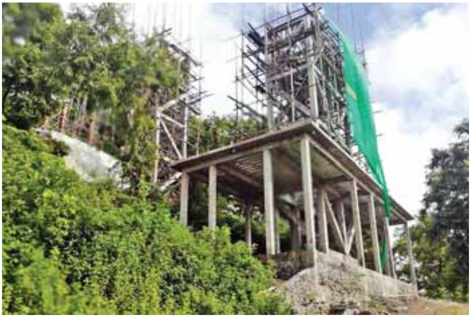
ရခိုင်ဓညဝတီပြည့်ရှင် သူရိယစက္ကမင်းကြီးနှင့် မိဖုရားရှစ်တာတို့သည် ဘုရားရှင်၏ ဦးခွဲတော်ဓာတ် (ဦးရာဇ်ဓာတ်)တော်ကို ဌာပနာပြုလျက် သာသနာသက္ကရာဇ် ၂၂၂ ခုနှစ်တွင် အမြင့် နှားလား ဥသဘတမော့ ခြောက်တောင် လုံးပတ်၊ မင်းလံ ၂၀ ရှိ ဦးရာဇ်တော်ဓာတ်စေတီတော်မြတ်ကြီးကို စတင်တည်ထားကိုးကွယ်ခဲ့ကြောင်း၊ ရခိုင်ဘုရင်မင်း အဆက်ဆက်ကိုးကွယ်၍ မွမ်းမံကုသိုလ်ပြုလာခဲ့ကြကြောင်း သိရသည်။ ဟန်လင်းနိုင်

ဆုတောင်းပြည့်ဗျာဒိတ်တော်ရ စေတီတော်တစ်ဆူအဖြစ်ထင်ရှား၍ နှစ်စဉ်မတ်လတွင် ဘုရားပွဲကို စည်ကားသိုက်မြိုက်စွာ ကျင်းပလေ့ရှိပြီး အနယ်နယ်အရပ်ရပ်မှ ဖူးမြော်ရန်ရောက်ရှိလာသည့် ရဟန်း၊ ရှင်လူ၊ ပြည်သူများဖြင့် စည်ကားသည့် စေတီတော်တစ်ဆူဖြစ်ကြောင်းလည်း သိရသည်။