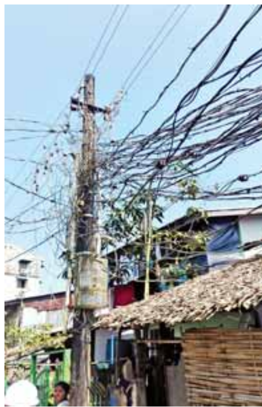
ဌေးကြိုင်

ရန်ကုန် နိုဝင်ဘာ ၄ ရန်ကုန်မြောက်ပိုင်းခရိုင် အင်းစိန်မြို့နယ်အတွင်းရှိ လျှပ်စစ်မီးကြိုးများ ရှုပ်ထွေးခြင်း၊ ဝိုင်းအားနည်းခြင်းကို နိုဝင်ဘာ ၄ ရက် နံနက် ၉ နာရီခွဲက ကြီးကြီးများဖြင့် လဲလှယ်တပ်ဆင်ခဲ့ကြသည်။ ထိုသို့ ဆောင်ရွက်ခဲ့သည့် ရပ်ကွက်များမှာ ကမ်းနားအလယ်ရပ်ကွက် ခေမာတောင် ၂ လမ်းတွင် ၄၀၀ ဝိုင်း ရှုပ်ထွေးလျှပ်စစ် မီးကြိုး ၁၀၀၊ ကမ်းနားအနောက်ရပ်ကွက် နီလာလမ်းတွင် ၄၀၀ ဝိုင်း ရှုပ်ထွေးလျှပ်စစ် မီးကြိုး လေးခန်းတို့ကို မြို့နယ်လျှပ်စစ်မှ လုပ်သား ၁၀ ဦးနှင့် ဓနရာဇာကမ္ဘဏီမှ ခုနစ်ဦးတို့ ပူးပေါင်းပြီး ဆောင်ရွက်ခဲ့သည်။ ကျန်ရှိနေသေးသည့် ရှုပ်ထွေးလျှပ်စစ် မီးကြိုးများကိုလည်း ဆက်လက်ဆောင်ရွက်သွားမည် ဖြစ်ကြောင်း သိရသည်။