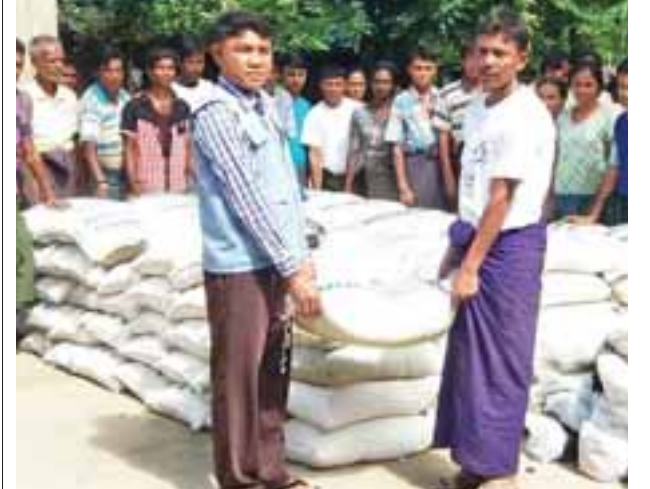
သတင်းအဖွဲ့

မောင်တော နိုဝင်ဘာ ၄ မောင်တောခရိုင် လူမှုဝန်ထမ်း၊ ကယ်ဆယ်ရေးနှင့် ပြန်လည်နေရာချထားရေးဦးစီးဌာနမှ စစ်တွေမြို့မှ ပြန်လည်ရောက်ရှိလာပြီး မောင်တောမြောက်ပိုင်း ကြိမ်ချောင်းဘုန်းကြီးကျောင်းတွင် ခေတ္တခိုလှုံနေကြသည့် လောင်းဒုံကျေးရွာအုပ်စု ဖောက်တောင်ကျေးရွာမှ မာရမကြီးလူမျိုး အိမ်ထောင်စု ၂၄ စု၊ လူဦးရေ ၈၂ ဦး၊ နေရပ်စွန့်ခွာ၍ ပြန်လည်ရောက်ရှိလာကြသည့် ကြိမ်ချောင်းကျေးရွာမှ ရခိုင်တိုင်းရင်းသားအိမ်ထောင်စု ၇၅ စု၊ လူဦးရေ ၃၈၈ ဦး၊ ဟိန္ဒူဘာသာဝင် အိမ်ထောင်စု ၅၅ စု၊ လူဦးရေ ၅၅၀၊ အိမ်ထောင်စု စုစုပေါင်း ၁၅၄ စု တို့အား ယနေ့နံနက်ပိုင်းက ဆန်၊ ဆီ၊ ပဲ၊ ငါးသေတ္တာ၊ ကော်ဖီမစ်၊ ခြင်ထောင်နှင့် ခေါက်ဆွဲခြောက်များအား သွားရောက်ထောက်ပံ့ပေးခဲ့သည်။ စစ်တွေမြို့ပေါ်ရှိ ကယ်ဆယ်ရေးစခန်းများမှ နေရပ်သို့ ပြန်လည်ရောက်ရှိလာသည့် ရခိုင်တိုင်းရင်းသားများနှင့် ဟိန္ဒူဘာသာဝင်များသည် မောင်တောမြို့နယ်မြောက်ပိုင်း ကြိမ်ချောင်းဘုန်းကြီးကျောင်းတွင် ခေတ္တခိုလှုံနေထိုင်ကြခြင်း ဖြစ်ကြောင်း သိရသည်။