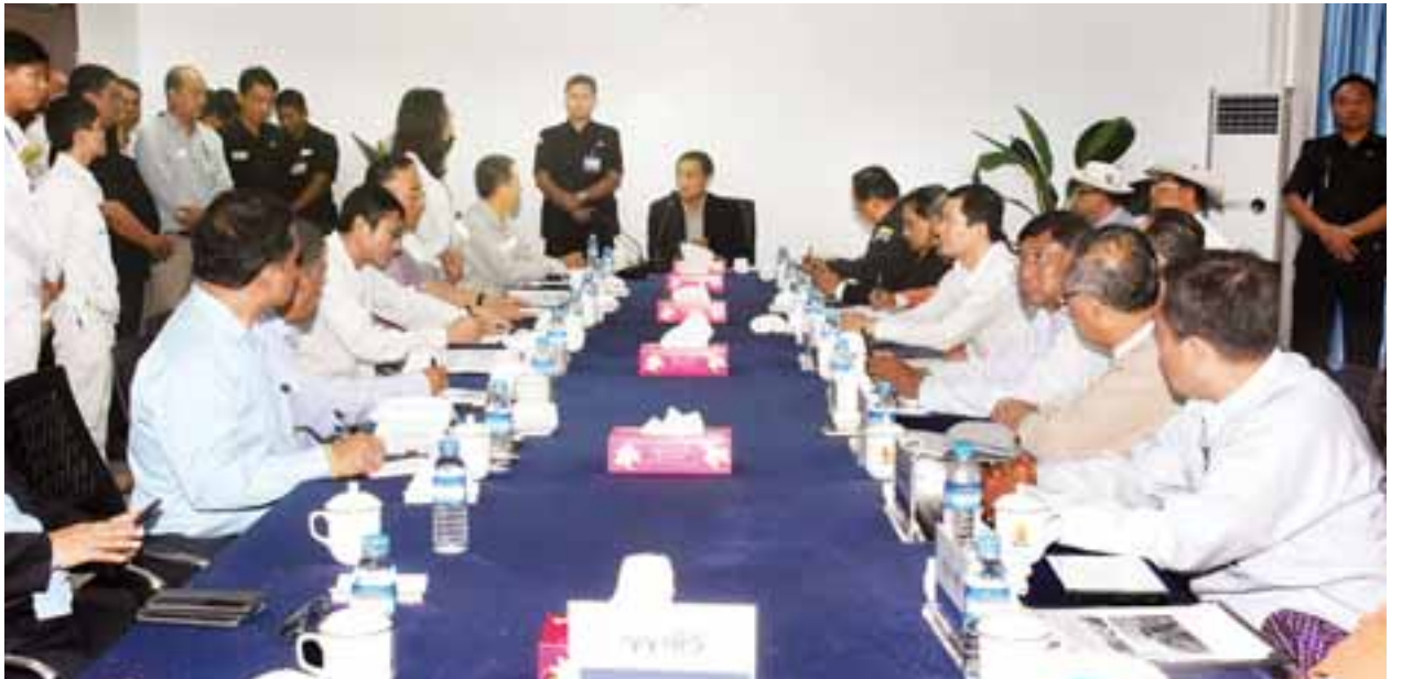
ဒုတိယသမ္မတ ဦးဟင်နရီဗန်ထီးလူ ကျောက်ဖြူမြို့ မဒဲကျွန်းရေနံဆိပ်ကမ်းရှိ တာဝန်ရှိသူများနှင့် တွေ့ဆုံဆွေးနွေးစဉ်။

ရခိုင်ပြည်နယ် ဖွံ့ဖြိုးတိုးတက်ရေးအတွက် အထူးအရေးပါသဖြင့် ကျောက်ဖြူ ဒေသအား အထူးစီးပွားရေးဇုန်အဖြစ် သတ်မှတ်အကောင်အထည်ဖော်ဆောင်ရွက်ရန် နိုင်ငံတော်က ၂၀၁၁ ခုနှစ်တွင် ခွင့်ပြုခဲ့သည်။ ကျောက်ဖြူအထူးစီးပွားရေးဇုန်တွင် စီမံကိန်းများအနေဖြင့် ရေနံဆိပ်ကမ်းစီမံကိန်း၊ စက်မှုဇုန်စီမံကိန်းနှင့် အဆင့်မြင့်အိမ်ရာစီမံကိန်းများ ပါဝင်သည်။