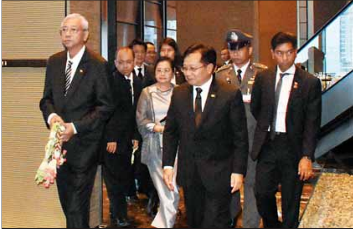
နိုင်ငံတော်သမ္မတ ဦးထင်ကျော်နှင့် ဇနီး ဒေါ်စုစုလွင် ထိုင်းနိုင်ငံ ပန်ကောက်မြို့၊ ဒွန်မောင်းအပြည်ပြည်ဆိုင်ရာလေဆိပ်သို့ ရောက်ရှိစဉ်။

နိုင်ငံတော်သမ္မတ ဦးထင်ကျော်နှင့် ဇနီးနှင့်အဖွဲ့ဝင်များသည် ဒေသစံတော်ချိန် ညနေ ၄ နာရီ ၅ မိနစ်တွင် ထိုင်းနိုင်ငံ ပန်ကောက်မြို့ စာမျက်နှာ ၃ ကော်လံ ၁ သို့ ✪