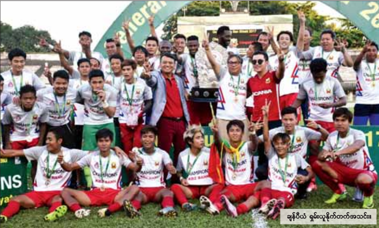
ချန်ပီယံ ရှမ်းယူနိုက်တက်အသင်း။