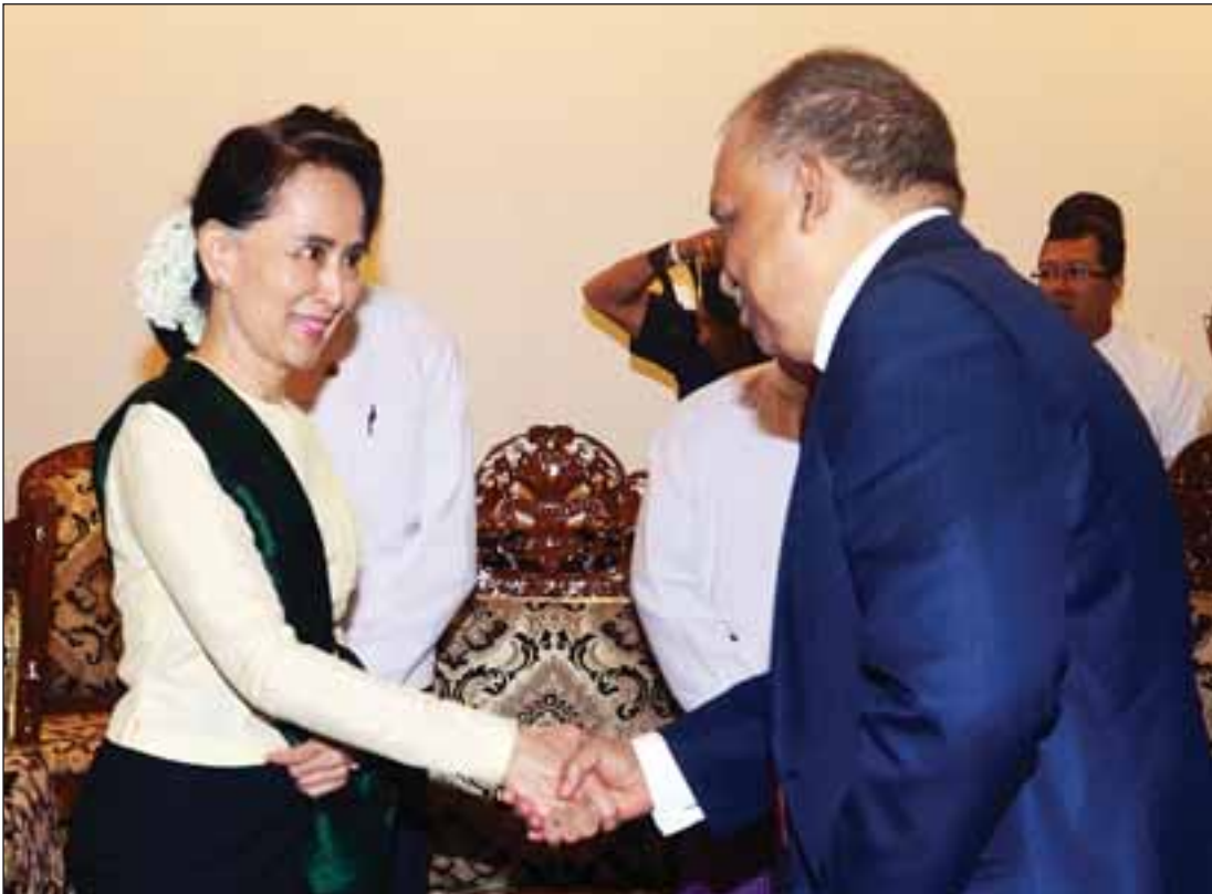
နိုင်ငံတော်၏အတိုင်ပင်ခံပုဂ္ဂိုလ်နှင့် ဘင်္ဂလားဒေ့ရှ် ပြည်ထဲရေးဝန်ကြီးတို့ ရင်းရင်းနှီးနှီးနှုတ်ဆက်စဉ်။