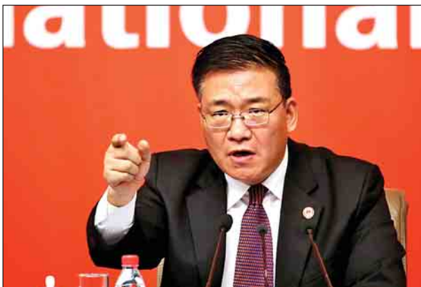
တရုတ်ကွန်မြူနစ်ပါတီနိုင်ငံတကာရေးရာဌာနမှ ဒုတိယအကြီးအကဲ Gou Yezhou ။ (ဓာတ်ပုံ-ရှိုက်တာ)

တရုတ်နိုင်ငံနှင့်မြန်မာနိုင်ငံတို့သည် ကာလရှည်ကြာခိုင်မြဲသည့်ချစ်ကြည်ရင်းနှီးမှုရှိခဲ့ကြောင်း၊ မြန်မာနိုင်ငံအနေဖြင့် ၎င်း၏ပြဿနာကို ကိုယ့်နည်းကိုယ့်ဟန်ဖြင့် ဖြေရှင်းနိုင်မည်ဟု ယုံကြည်သည်ဟု Gou က ထပ်လောင်းပြောကြားခဲ့ကြောင်း ရိုက်တာသတင်းအရ သိရသည်။ ရခိုင်ပြည်နယ်အကျပ်အတည်းနှင့်ပတ်သက်ပြီး တရုတ်နိုင်ငံ၏ချဉ်းကပ်မှုမှာ အနောက်နိုင်ငံများနှင့် ဘာကြောင့်ကွဲလွဲနေရသလဲဆိုသော မေးခွန်းကို ဖြေကြားရာတွင် Gou က တရုတ်နိုင်ငံ၏အခြေခံမူဝါဒမှာ အခြားသောနိုင်ငံ၏ ပြည်တွင်းရေးတွင် ဝင်ရောက်စွက်ပက်ရဟူသည့်အချက်များ ပါဝင်ကြောင်း၊ အတွေ့အကြုံများအရ နိုင်ငံတစ်နိုင်ငံက အခြားနိုင်ငံတစ်နိုင်ငံ၏ပြည်တွင်းရေးကို ဝင်ရောက်စွက်ပက်သည့်အခါ ဖြစ်ပေါ်လာတတ်သည့် အကျိုးဆက်များနှင့်ပတ်သက်၍ မကြာသေးမီက တွေ့ရှိကြရမှာဖြစ်ကြောင်း၊ ထို့ကြောင့် မိမိတို့အနေဖြင့် တစ်ပါးနိုင်ငံ၏ ပြည်တွင်းရေးကို ဝင်ရောက်စွက်ပက်ခြင်းလုံးဝမလုပ်ကြောင်း၊ တရုတ်နှင့်မြန်မာတို့သည် ရှည်လျားသော နယ်နိမိတ်ထိစပ်လျက်ရှိရာ မြန်မာနိုင်ငံတွင်း