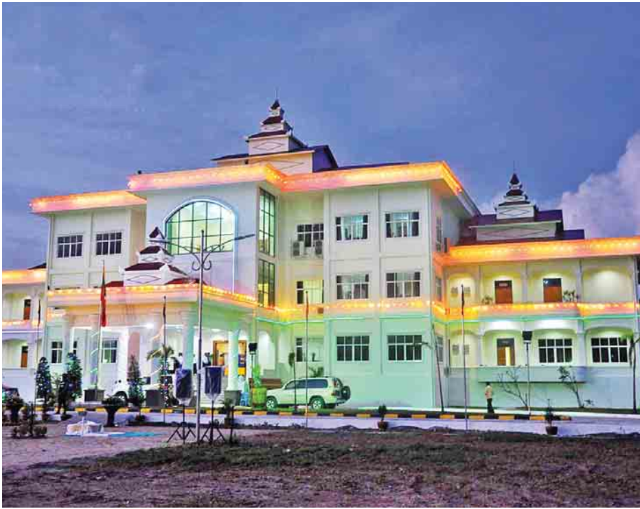
တနင်္သာရီတိုင်းဒေသကြီးလွှတ်တော်အဆောက်အအုံသစ်ကို တွေ့ရစဉ်။