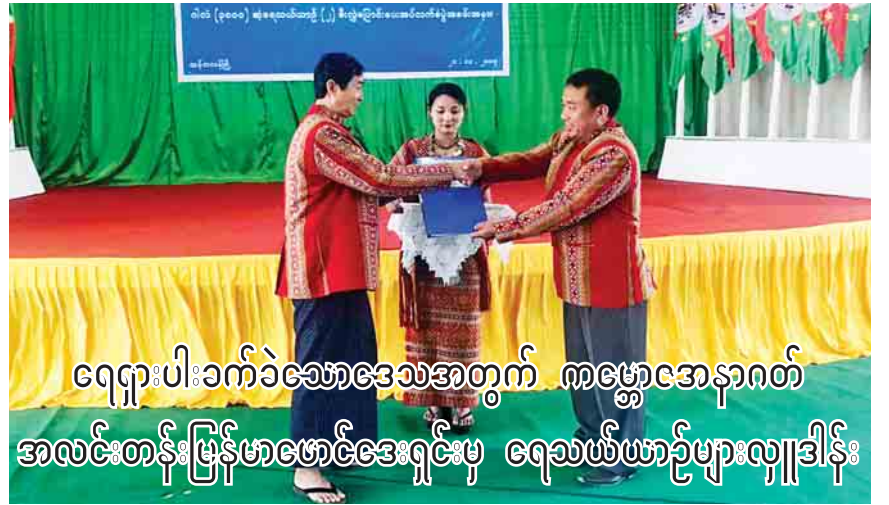
ရေရှားပါးခဲသောဒေသအတွက် ကမ္ဘောဇအနာဂတ် အလင်းတန်းမြန်မာဖောင်ဒေးရှင်းမှ ရေသယ်ယာဉ်များလှူဒါန်း