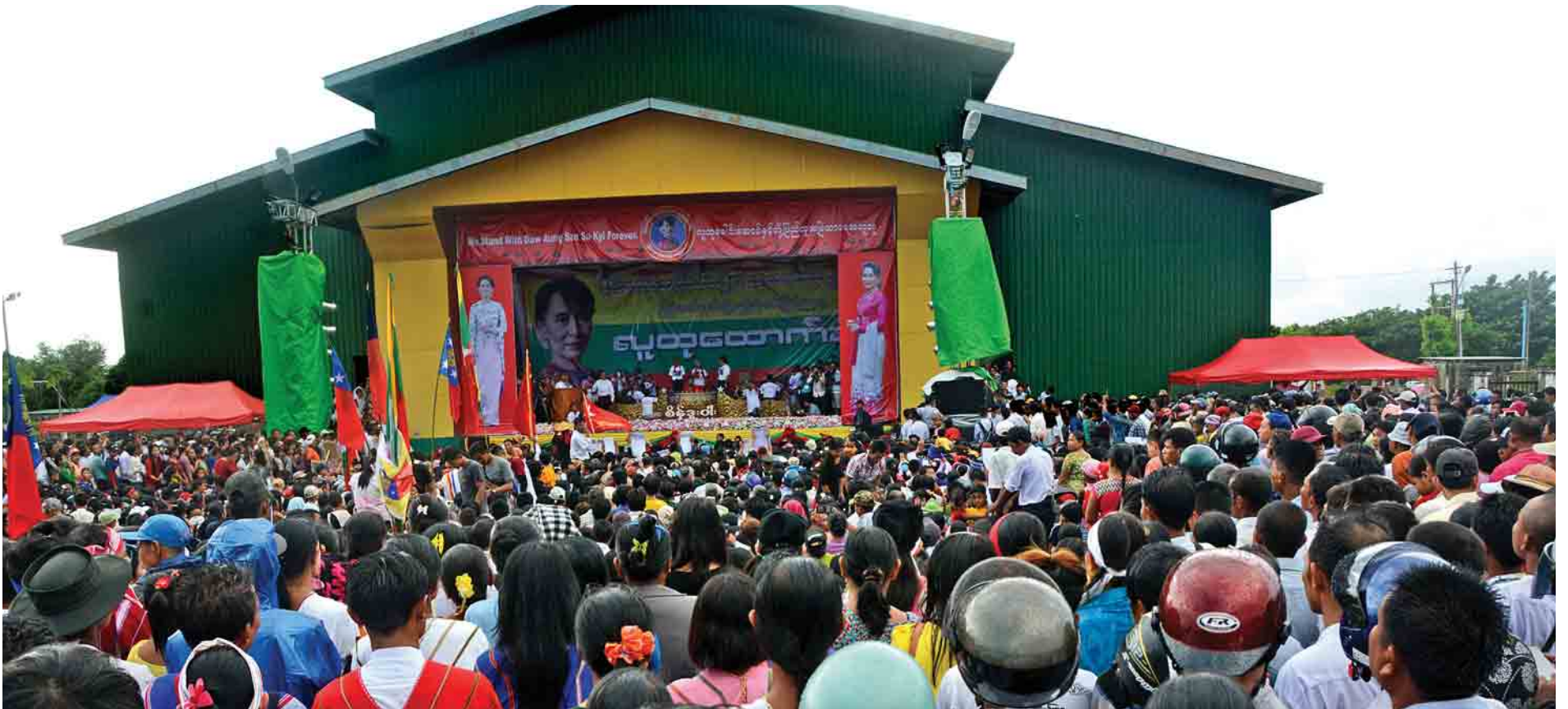
နေပြည်တော် အောက်တိုဘာ ၂၂

နိုင်ငံတော်၏အတိုင်ပင်ခံပုဂ္ဂိုလ် ဒေါ်အောင်ဆန်းစုကြည်အား နေပြည်တော်ပြည်ထောင်စုနယ်မြေ ပြည်သူများက ထောက်ခံပွဲအခမ်းအနားကို ယနေ့ညနေ ၃ နာရီတွင် နေပြည်တော်ရှိ ဥပ္ပါတသန္တီစေတီတော်ဘုရားကွင်း၌ ကျင်းပသည်။ (အပေါ်ပုံ)