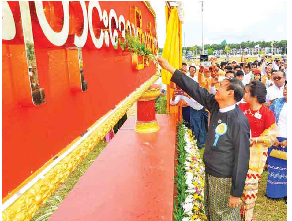
တနင်္သာရီတိုင်းဒေသကြီး လွှတ်တော်ရုံးဆိုင်းဘုတ်ကို ပြည်သူ့လွှတ်တော်ဥက္ကဋ္ဌ ဦးဝင်းမြင့် အမွှေးနံ့သာရည်ဖြင့် ပက်ဖျန်းပေးစဉ်။