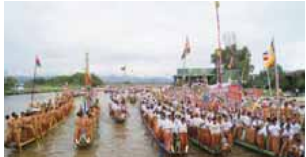
စာမျက်နှာ » ၃