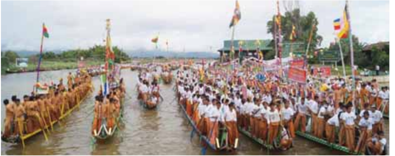
ခရီးသွားလာရေးဝန်ကြီးဌာန ပြည်ထောင်စုဝန်ကြီး ဦးအုန်းမောင်၊ ရှမ်းပြည်နယ် ဝန်ကြီးချုပ်နှင့် ပြည်နယ်ဝန်ကြီးများ၊ လွှတ်တော်အသီးသီးမှ ကိုယ်စားလှယ်များ၊ တိုင်းရင်းသားစာပေ၊ ယဉ်ကျေးမှုအဖွဲ့များ၊ လူမှုရေးအသင်းအဖွဲ့များနှင့် ဒေသခံ အင်းသား အင်းသူများ တက်ရောက်ကြကြောင်း သတင်းရရှိသည်။ (သတင်းစဉ်)

အခမ်းအနားသို့ အမျိုးသားလွှတ်တော် ဒုတိယဥက္ကဋ္ဌနှင့်အတူ တိုင်းရင်းသားရေးရာဝန်ကြီးဌာန ပြည်ထောင်စုဝန်ကြီး နိုင်သက်လွင်၊ ဟိုတယ်နှင့်