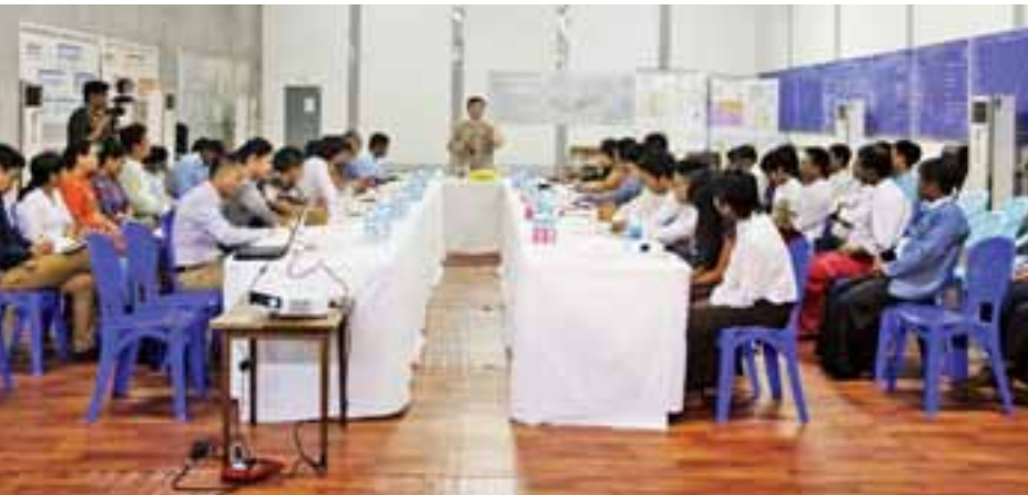
လူမှုသဟဇာတဖြစ်စွာနေထိုင်နိုင်ရေး ဆောင်ရွက်ရမည်ဖြစ်ကြောင်း၊ အထက်ပါလုပ်ငန်းစဉ်များကို အကောင်အထည်ဖော်ရာတွင် လူငယ်များ၏အင်အားကို ရယူဆောင်ရွက်ခြင်းဖြင့် ပိုမိုအောင်မြင်မည်ဖြစ်ကြောင်း၊ လူသားချင်း စာနာထောက်ထားမှု အကူအညီပေးရေး ဆောင်ရွက်ပေးရာတွင် စိတ်ပိုင်းဆိုင်ရာခံစားမှုများကို ဖြေလျှော့ပေးရန် အားပေးကူညီမှုများလိုအပ်ကြောင်း၊ လူ့အဖွဲ့အစည်းများအတွင်း အေးချမ်းသာယာရေးအတွက် ဆောင်ရွက်လျက်ရှိကြောင်း၊ လုပ်ငန်းများဆောင်ရွက်နိုင်ရန် ကျေးရွာများ၏ အချက်အလက်များကို ကောက်ယူရန်လိုအပ်ကြောင်း ပြောကြားပြီး ဝန်ကြီးဌာနက ဆောင်ရွက်ထားရှိသည့် လူသားချင်းစာနာထောက်ထားမှု အကူအညီပစ္စည်းများ ဖြန့်ဝေရေးစီစဉ်ဆောင်ရွက်ထားရှိမှုကို ရှင်းလင်းပြောကြားသည်။ ယင်းနောက် လူသားချင်းစာနာထောက်ထားမှုဆိုင်ရာ

သက်ဆိုင်ပါကြောင်း၊ ကမ္ဘာ့နိုင်ငံများက မြင်သည့်အမြင်များသည် မိမိတို့နိုင်ငံအတွက် နစ်နာမှုများ ရှိပါကြောင်း၊ နိုင်ငံတကာအမြင်နှင့် ဖြစ်ပွားသည့် အဖြစ်အပျက်အရင်းအမြစ်ကို သေသေချာချာသိရှိဖို့လိုကြောင်း၊ ထို့ကြောင့် မိမိတို့အစိုးရအနေဖြင့် ရခိုင်ပြည်နယ်ဆိုင်ရာ အကြံပေးကော်မရှင်ကို ဖွဲ့စည်းဆောင်ရွက်ပြီး ထိုကော်မရှင်၏အကြံပြုချက်များကို အကောင်အထည်ဖော် ဆောင်ရွက်လျက်ရှိပါကြောင်း၊ လက်ရှိရခိုင်ပြည်နယ် ပဋိပက္ခနှင့်ပတ်သက်၍ တစ်နိုင်ငံလုံးရှိ ပြည်သူများပါဝင်သော ပြည်ထောင်စုစီမံကိန်း(UEHRD)ကို အကောင်အထည်ဖော်လျက်ရှိပါကြောင်း၊ UEHRD တွင် အချက်သုံးချက်ပါဝင်ရာ လူသားချင်းစာနာမှု အကူအညီပေးရေးနှင့်ပတ်သက်၍ ပြည်တွင်းအင်အားဖြင့် ဆောင်ရွက်သွားမည်ဖြစ်ကြောင်း၊ ပြန်လည်နေရာချထားရေးကိုလည်း နိုင်ငံတော်အစိုးရက စနစ်တကျဆောင်ရွက်သွားမည်ဖြစ်ကြောင်း၊ ဖွံ့ဖြိုးတိုးတက်ရေးနှင့် နောင်တိုက်သည့် ပဋိပက္ခများမဖြစ်ပွားစေရေး၊ ဥပဒေနှင့်အညီ နည်းလမ်းမှန်ကန်စွာဖြင့် နိုင်ငံတော်အစိုးရက စနစ်တကျဆောင်ရွက်သွားမည်ဖြစ်ကြောင်း၊ ဤလုပ်ငန်းစဉ်များတွင် လူငယ်များ၏ အခန်းကဏ္ဍသည် အရေးကြီးပါကြောင်း၊ လူမှုအသိုက်အဝန်းနှစ်ရပ်အကြား