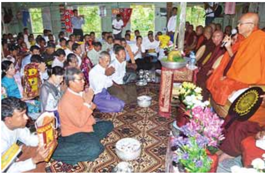
သုမြတ်တို့အား ကထိန်လှူသင်္ကန်း နှင့်အတူ လှူဖွယ်ဝတ္ထုအစုစုတို့ကို ဆက်ကပ်လှူဒါန်းကြသည်။ ယင်းနောက် ပြည်နယ်သံဃမဟာ နာယကအဖွဲ့ဥက္ကဋ္ဌ စစ်တွေမြို့ ဓမ္မသုခ လှူဒါန်းမှုအစုစုတို့အတွက် ရေစက်

ထို့နောက် ပဓာန နာယကဆရာ တော် ဘဒ္ဒန္တသောမအမှူးပြုသည့် ဆရာတော် သံဃာတော်အရှင်