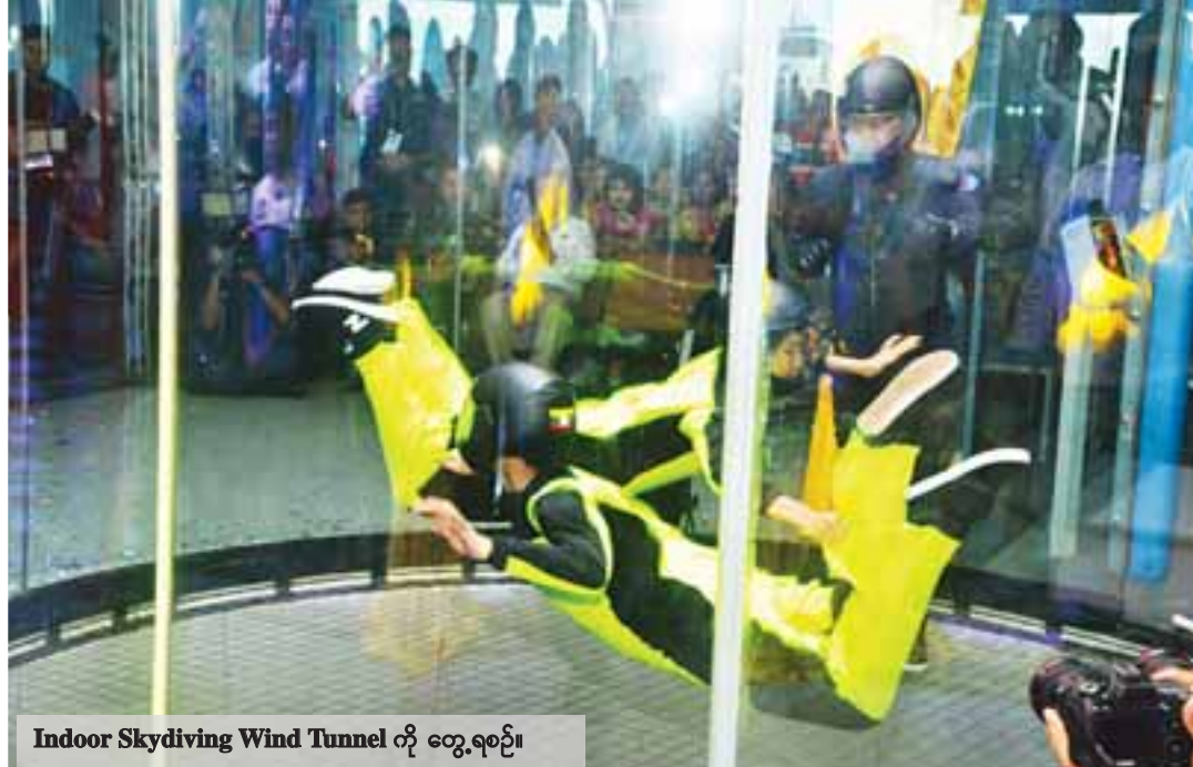
Indoor Skydiving Wind Tunnel ကို တွေ့ရစဉ်။

မဒေါက်တန်ဆောင်တိုင်မီးမျှောပွဲတော်ကို စစ်တောင်းမြစ်အတွင်း၌ ယမန်နှစ်က ကျင်းပစဉ်။