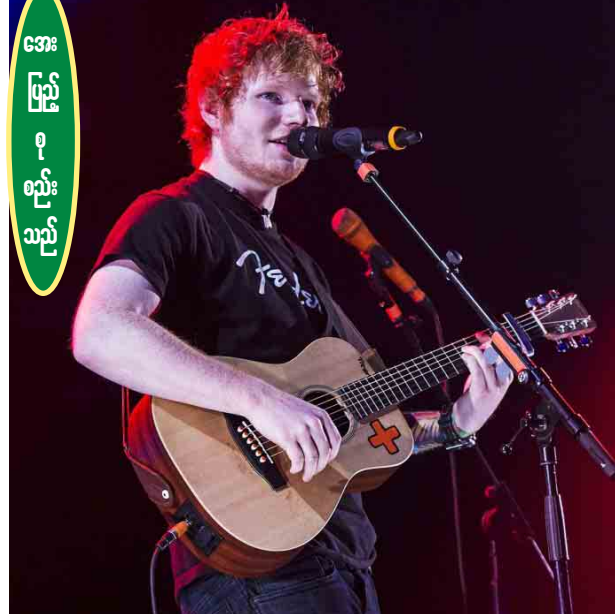
အေးပြည့်စုစဉ်းသည့်

စာမျက်နှာပေါ်မှာ ကျောက်ပတ်တီးစီးထားရတဲ့ သူ့ရဲ့ဓာတ်ပုံကို ဖော်ပြခဲ့ပြီး ဒဏ်ရာရခဲ့ကြောင်း ပရိသတ်တွေကို အသိပေးခဲ့တာဖြစ်ပါတယ်။ အွန်လိုင်းမီဒီယာပေါ်မှာ ပရိသတ် ၁၅ သန်းကျော် ပိုင်ဆိုင်ထားတဲ့ အက်ဒီရီရန်က ဒီလိုထိခိုက်ဒဏ်ရာရခဲ့တာကြောင့် သူ့ရဲ့နယ်လှည့် ဖျော်ဖြေရေးအစီအစဉ်တွေအနက် မကြာမီမှာ ကျင်းပသွားဖို့ရည်ရွယ်ထားတဲ့ ပွဲတွေကို ဖျက်ရန်နိုင်ဖွယ်ရှိကြောင်းနဲ့ ပရိသတ်တွေကို အချိန်နဲ့တစ်ပြေးညီ အသိပေးသွားမှာဖြစ်တဲ့အတွက် သတင်းတွေကို နားစွင့်နေစေလိုကြောင်း တစ်ပါတည်း ရေးသား ဖော်ပြခဲ့တာတွေ့ရပါတယ်။