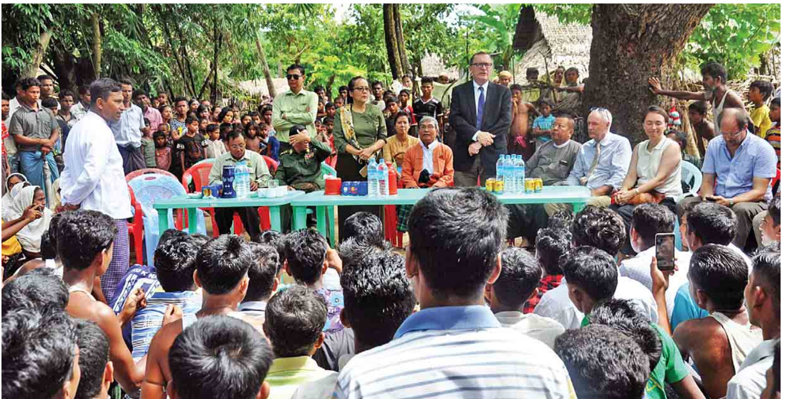
ကုလသမဂ္ဂ ဒုတိယအတွင်းရေးမှူးချုပ် ဦးဆောင်သော ကိုယ်စားလှယ်အဖွဲ့ ရသေ့တောင်မြို့နယ် အနောက်ပြင်ကျေးရွာ၌ ကျေးရွာသူ ကျေးရွာသားများနှင့် တွေ့ဆုံစဉ်။

မွန်လွဲပိုင်းတွင် ကုလသမဂ္ဂနိုင်ငံရေးရာဌာနအကြီးအကဲ ဒုတိယအတွင်းရေးမှူးချုပ် ဦးဆောင်သော ကိုယ်စားလှယ်အဖွဲ့သည် ပြည်နယ်ဝန်ကြီးချုပ် စာမျက်နှာ ၉ ကော်လံ ၁ သို့