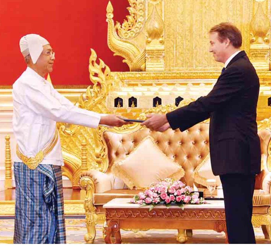
နိုင်ငံတော်သမ္မတ ဦးထင်ကျော်ထံ ဥရောပသမဂ္ဂ သံအမတ်ကြီး မစ္စတာ ခရာရှ် ယန် စမစ်ချ် ခန့်အပ်လွှာပေးအပ်စဉ်။

နေပြည်တော် အောက်တိုဘာ ၁၇ ပြည်ထောင်စုသမ္မတ မြန်မာနိုင်ငံ တော် နိုင်ငံတော်သမ္မတ ဦးထင်ကျော် ထံ မြန်မာနိုင်ငံဆိုင်ရာ ဖင်လန်နိုင်ငံ သံအမတ်ကြီးအဖြစ် ခန့်အပ်ရန် သဘောတူညီပြီးဖြစ်သော သံအမတ် ကြီး မစ္စတာ လာတူသည် ယနေ့ ညနေ ၃ နာရီတွင် နေပြည်တော်ရှိ သမ္မတအိမ်တော်၌ ၎င်း၏ သံအမတ် ခန့်အပ်လွှာကို ပေးအပ်သည်။