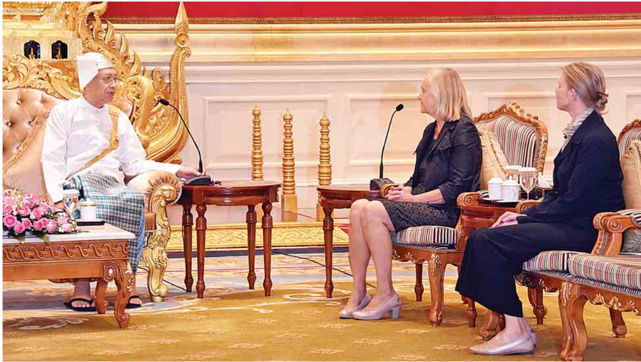
နိုင်ငံတော်သမ္မတ ဦးထင်ကျော် မြန်မာနိုင်ငံဆိုင်ရာ ဖင်လန်နိုင်ငံသံအမတ်ကြီး မစ္စ ရီကာ လာတူအား လက်ခံတွေ့ဆုံစဉ်။ (သတင်း-ရှေ့ဖုံး)