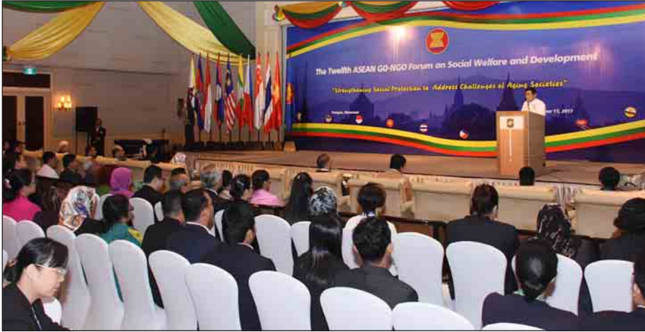
အဖွင့်အမှာစကားပြောကြားသည်။ ဆောင်ရွက်နေမှုများ၊ ယင်းသို့ အစည်းအဝေး ဖွင့်ပွဲတွင် ပြည်ထောင်စုဝန်ကြီးက မိမိတို့နိုင်ငံ၏ အစိုးရဝန်ကြီးဌာနများနှင့် အစိုးရမဟုတ်သော အဖွဲ့အစည်းများ၊ ဆောင်ရွက်ရာတွင် နိုင်ငံအတွင်းရှိ အစိုးရဝန်ကြီးဌာနများနှင့် အစိုးရမဟုတ်သော အဖွဲ့အစည်းများ၊ ဒေသကဏ္ဍအလိုက် တွေ့ဆုံဆွေးနွေးမှုများ ပြုလုပ်လျက်ရှိပါကြောင်း၊ အလားတူ

ရန်ကုန် အောက်တိုဘာ ၁၇ အာဆီယံ Blue Print ပါ အသိုက်အဝန်းကြီး (၃)ရပ်အနက်မှ အာဆီယံ လူမှုအသိုက်အဝန်းအကြား လူမှုကာကွယ်စောင့်ရှောက်ရေးလုပ်ငန်းများ၊ အပြန်အလှန်ဆက်သွယ်မှု ကူညီဆောင်ရွက်မှုများ အားကောင်းခိုင်မာစေရေးနှင့် ဖွံ့ဖြိုးတိုးတက်ရေးအတွက် မြန်မာနိုင်ငံမှ အိမ်ရှင်အဖြစ် လက်ခံကျင်းပမည့် 12 th ASEAN GO-NGO Forum on Social Welfare and Development အစည်းအဝေးနှင့် ASEAN အဆင့်မြင့်အရာရှိကြီးများ ဆက်စပ်အစည်းအဝေးများကို ရန်ကုန်မြို့ရှိ ဆူလေရန်ဂရီလာဟိုတယ်တွင် ယနေ့နံနက်ပိုင်းက ကျင်းပရာ ပြည်ထောင်စုဝန်ကြီး ဒေါက်တာဝင်းမြတ်အေးက တက်ရောက်၍