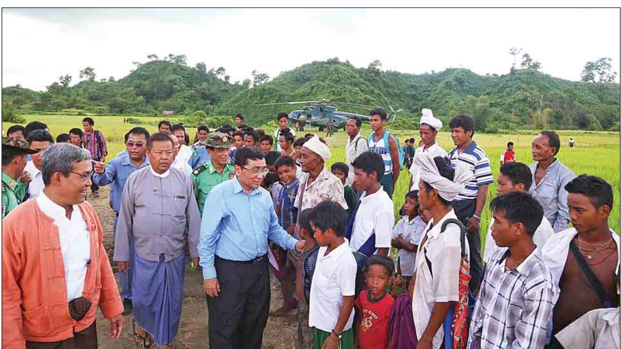
လူနည်းစု တိုင်းရင်းသားများ၏ ကျန်းမာရေးနှင့် ပညာရေးကဏ္ဍများ အပါအဝင် လူမှုဘဝဖွံ့ဖြိုးတိုးတက်အောင် ဆောင်ရွက်ပေးမည်ဖြစ်ကြောင်း၊ အစိုးရအနေဖြင့် ပြည်ထောင်စုစီမံကိန်းတွင် လုပ်ငန်းကဏ္ဍသုံးခု ချမှတ်ဆောင်ရွက်ရန်ရှိကြောင်း၊ အဆိုပါကဏ္ဍသုံးရပ်တွင် စားနပ်ရိက္ခာထောက်ပံ့ရေး၊ ပြန်လည်နေရာချထားရေးနှင့် ဖွံ့ဖြိုးတိုးတက်ရေးကဏ္ဍများပါဝင်ကြောင်း၊ ယင်းစီမံကိန်းလုပ်ငန်းများ ဆောင်ရွက်ရာတွင် ဒေသနေပြည်သူများက ပိုင်းဝန်းပါဝင်ဆောင်ရွက်ပေးစေလိုကြောင်း ပြောကြားသည်။ ထို့နောက် ပြည်ထောင်စုဝန်ကြီးနှင့် အဖွဲ့သည် ဒေသခံ မြို့တိုင်းရင်းသားများအတွက် ဆန်အိတ် ၂၉၀၊ ဆီ ၉၇ ပုံ၊ ပဲ ၁၈ အိတ်၊ ဆား ခုနစ်အိတ်၊ ကြက်သွန်နီ ၄၈ အိတ်၊ အာလူး ၄၈ အိတ်၊ ငရုတ်သီးခြောက် ငါးအိတ်၊ နို့မှုန့်ထုပ်များကို ထောက်ပံ့ပေးအပ်သည်။ ယင်းနောက် ပြည်ထောင်စုဝန်ကြီးနှင့်အဖွဲ့သည် ခုံတိုင်ကျေးရွာနေ မြို့နယ်တွင် ရခိုင်ပြည်နယ် အစိုးရအဖွဲ့အစည်းများနှင့် တွေ့ဆုံဆွေးနွေးခဲ့သည်။ (သတင်းစဉ်)

ပြည်ထောင်စုဝန်ကြီးက မိမိတို့ ပြည်ထောင်စုအစိုးရနှင့် ပြည်နယ်အစိုးရအဖွဲ့တို့သည် တိုင်းရင်းသားများအတွက် စားနပ်ရိက္ခာများ လာရောက် ထောက်ပံ့ခြင်းဖြစ်ကြောင်း၊ လိုအပ်သည့်နေရာများတွင် နေအိမ်များတည်ဆောက်၍ ပြန်လည်နေရာချထားပေးရန်ဖြစ်ကြောင်း။