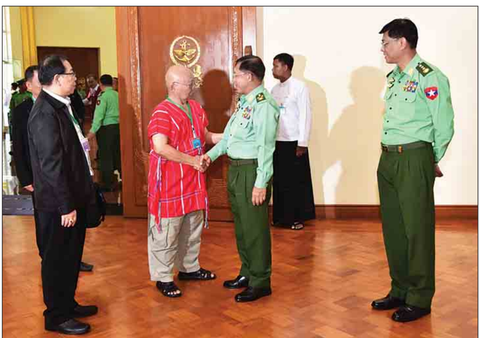
ဖြစ်ကြောင်း၊ ထို့အတူ မြန်မာနိုင်ငံတွင် မှီတင်းနေထိုင်ကြသည့် နိုင်ငံသားများကိုလည်း ကာကွယ်စောင့်ရှောက်သွားမည်ဖြစ်ကြောင်းပြောကြား၍ အဖွဲ့တစ်ဖွဲ့ချင်း၏ ဆွေးနွေးမှုများအပေါ် ပြန်လည်ရှင်းလင်းဆွေးနွေးသည်။ (သတင်းစဉ်)

တပ်မတော်ကာကွယ်ရေးဦးစီးချုပ်က တစ်နိုင်ငံလုံး အတိုင်းအတာဖြင့် အားလုံးပါဝင်လာရေးနှင့်ပတ်သက်၍ ငြိမ်းချမ်းရေးကို အမှန်တကယ်လိုလားမှုရှိရန်လိုကြောင်း၊ လက်မှတ်ရေးထိုးခြင်းမပြုသည့် အဖွဲ့များအား ငြိမ်းချမ်းရေးအတွက် ပထမဆုံးခြေလှမ်းကို စတင်လှမ်းပြီး NCA ကို လက်မှတ်ရေးထိုးကြရန်လိုသည်ဟု NCA နှစ်နှစ်ပြည့် အခမ်းအနားတွင် တိုက်တွန်းပြောကြားခဲ့ခြင်းဖြစ်ကြောင်း၊ NCA လမ်းကြောင်းသည် ငြိမ်းချမ်းရေးအတွက် အဓိက လုပ်ဆောင်ခြင်းဖြစ်ပြီး နိုင်ငံရေးကို ဦးတည်လုပ်ဆောင်ခြင်း မဟုတ်ကြောင်း၊ NCA ပါ အကြောင်းအရာများကို အမြန်အကောင်အထည်ဖော်ဆောင်ရွက်ရေးအတွက် တပ်မတော်အနေဖြင့် အထူးလိုလားကြောင်း၊ အသင့်လည်း ရှိပါကြောင်း၊ တပ်မတော်ပိုင်းဆိုင်ရာ လုပ်ဆောင်နိုင်သည်များကို အချိန်မဆိုင်းဘဲ လုပ်ဆောင်သွားမည်ဖြစ်ကြောင်း၊ တပ်မတော်အနေဖြင့် တိုင်းရင်းသားများ၏ လုံခြုံရေးနှင့် အကျိုးစီးပွားကို ဦးစားပေးကာကွယ်စောင့်ရှောက်ရမည်