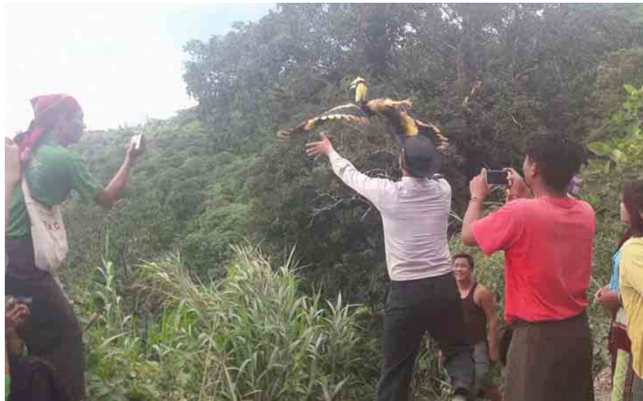
စစ်ဆေးဖော်ထုတ်ချက်အရ ပိုင်ရှင်ဆိုသူနှစ်ဦးကို မင်းတုန်းမြို့မရဲစခန်း၌ အမှုဖွင့် အရေးယူဆောင်ရွက်လျက်ရှိကြောင်း သိရသည်။

အောက်တိုဘာ ၈ ရက် ည ၇ နာရီခွဲခန့်က မင်းတုန်းမြို့နယ်မှ ပြည်မြို့ဘက်သို့ပို့ဆောင်ရန် နီးခြင်းများ ဖြင့် ထည့်ယူလာသော အောက်ချင်းငှက်ကိုးကောင်ကို သယ်ဆောင်လာသူနှင့်အတူ ဖမ်းဆီးရမိခဲ့ခြင်းဖြစ်ပြီး