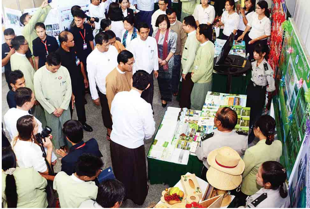
၂၀၁၇ ခုနှစ် ကမ္ဘာ့စားနပ်ရိက္ခာနေ့ အထိမ်းအမှတ်ပြခန်းများကို ဒုတိယသမ္မတ ဦးဟင်နရီဗန်ထီးယူ ကြည့်ရှုစဉ်။