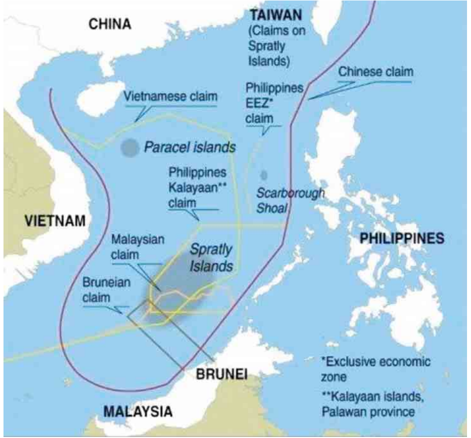
တောင်တရုတ်ပင်လယ်အတွင်းနယ်မြေပိုင်ဆိုင်မှု အငြင်းပွားမှု အခြေအနေပြမြေပုံ

၂၀၁၇ ခုနှစ်အတွင်း RCEP ဆွေးနွေးပွဲမှာ သဘော တူညီချက်တွေ ရရှိခဲ့မယ်ဆိုရင် အာဆီယံအဖွဲ့ကြီးရဲ့ ဂုဏ်သိက္ခာကို မြင့်မားလာစေမှာဖြစ်သလို အာဆီယံ အဖွဲ့ကြီးရဲ့ အရေးပါမှုကိုလည်း ဆက်လက် အာမခံနိုင် မှာဖြစ်ပါတယ်။ သို့သော်လည်း အာဆီယံအဖွဲ့ကြီးနဲ့ RCEP ဆွေးနွေးပွဲကို ဦးဆောင်နေတဲ့ အင်ဒိုနီးရှား နိုင်ငံအနေနဲ့ ဆွေးနွေးပွဲတွေမှာ အယူအဆသစ်တွေ ပေါ်ထွက်လာစေရေးနဲ့ ဆွေးနွေးပွဲတွေကို ဆက်လက် ဦးဆောင်ဖို့နဲ့ သဘောတူညီချက်တွေရရှိဖို့ လိုအပ်တဲ့ ခေါင်းဆောင်မှုစွမ်းရည်တွေ ရှိလာနိုင်မလားဆိုတာ သေချာရေရာမပြောနိုင်သေးတဲ့ အခြေအနေမှာရှိပါတယ်။ အင်ဒိုနီးရှားသမ္မတဟာ နိုင်ငံရဲ့ စီးပွားရေးဖွံ့ဖြိုးတိုးတက် ရေးကို အလေးထားဆောင်ရွက်လျက်ရှိရာမှာ RCEP လို