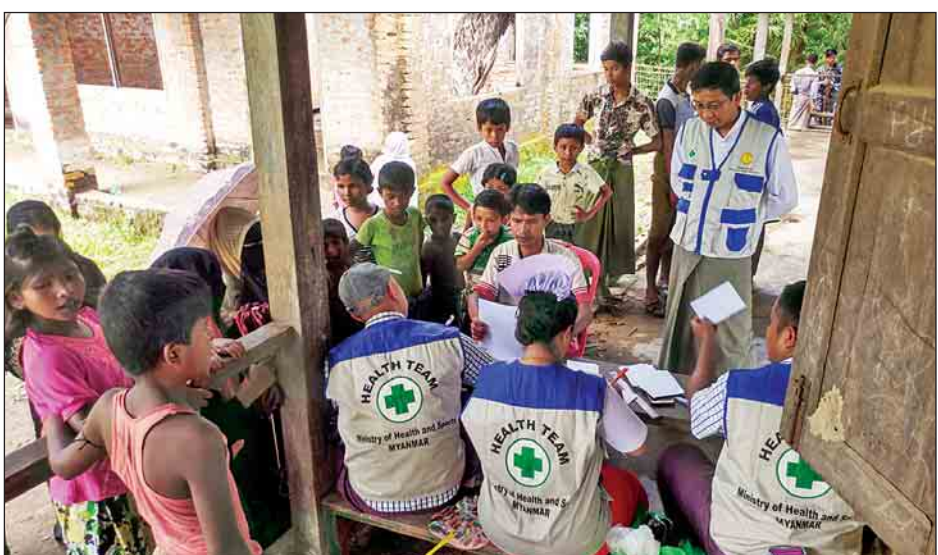
ယနေ့တွင်လည်း ရွေ့လျားကျန်းမာရေးအဖွဲ့သည် မောင်တောမြို့နယ်အတွင်းရှိ လောင်းဒုံကျေးရွာနှင့် ပန်းတောပြင်ကျေးရွာတို့သို့ သွားရောက်ဆေးဝါးကုသပေးခဲ့ပြီး ကျန်ရှိသည့်ကျေးရွာများတွင်လည်း ကျန်းမာရေးစောင့်ရှောက်မှုများ ဆက်လက်ဆောင်ရွက်ပေးသွားမည် ဖြစ်ကြောင်း သိရသည်။ (နိုင်ငံရေးကြည့်၊ သန့်ဝင်း)

ရွေ့လျားကျန်းမာရေးအဖွဲ့သည် မောင်တောမြို့နယ်နှင့် ဘူးသီးတောင်မြို့နယ်အပါအဝင် ရခိုင်ပြည်နယ်၏ အခြားသောမြို့များတွင်လည်း ရွေ့လျားဆေးကုသရေးအစီအစဉ်ဖြင့် ဆေးဝါးကုသမှုများ ဆောင်ရွက်လျက်ရှိပြီး မြို့ပေါ်နှင့်ကျေးရွာများရှိ ကယ်ဆယ်ရေးစခန်းများသို့ သွားရောက်ကာ ရွေ့လျားဆေးဝါးကုသမှု အစီအစဉ်ကို ဆောင်ရွက်ခဲ့ကြောင်းနှင့် ရွာပေါင်း ၁၀၀ ခန့်အား ရွေ့လျားဆေးအဖွဲ့ ၅၀ ကျော်ဖြင့် အရေးပေါ်ကျန်းမာရေးစောင့်ရှောက်မှုလုပ်ငန်းများ ဆောင်ရွက်ပေးလျက်ရှိကြောင်း သိရသည်။