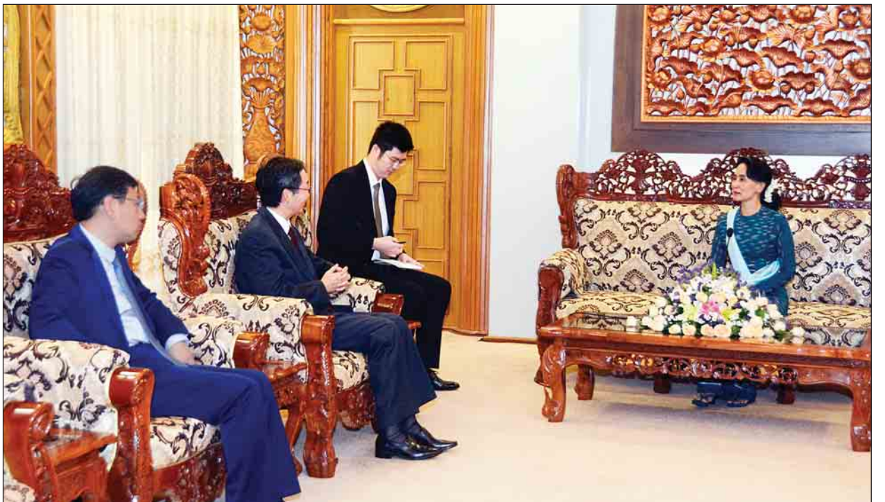
နိုင်ငံတော်၏အတိုင်ပင်ခံပုဂ္ဂိုလ် ဒေါ်အောင်ဆန်းစုကြည် တရုတ်ပြည်သူ့သမ္မတနိုင်ငံ နိုင်ငံခြားရေးဝန်ကြီးဌာန၏ အာရှရေးရာအထူးကိုယ်စားလှယ် မစ္စတာ စွန်းဂေါ်ရှန်းအား လက်ခံတွေ့ဆုံစဉ်။