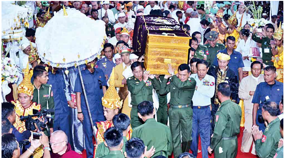
ယင်းနောက် နဂါးနှစ်ကောင်ကျောင်းတိုက် ဈာပန တေဇောဓာတ်ဖြင့် စတင်မီးပူဇော်ပြီး ရောင်စုံမီးရှူး ဆရာတော် အဘိဇေအဂ္ဂမဟာ သဒ္ဓမ္မဇောတိက အဂ္ဂ မဟာပဏ္ဍိတ ဘဒ္ဒန္တဓမ္မသီရိနှင့် တပ်မတော်ကာကွယ်ရေး ဦးစီးချုပ် ဗိုလ်ချုပ်မှူးကြီး မင်းအောင်လှိုင်တို့က အန္တိမ ရရှိသည်။ (သတင်းစဉ်)

ထို့နောက် တပ်မတော်ကာကွယ်ရေးဦးစီးချုပ်နှင့် တပ်မတော်အရာရှိကြီးများ၊ ရှမ်းပြည်နယ်လွှတ်တော် ဥက္ကဋ္ဌနှင့် ပြည်နယ်အစိုးရအဖွဲ့ဝင်များက ပုံသကူသင်္ကန်း များအား ဆက်ကပ်လှူဒါန်းကြသည်။