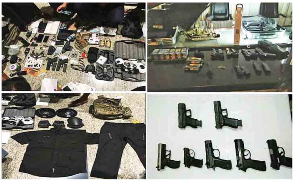
လောလောဆယ်တော့ ကျွန်တော်တို့ စစ်ဆေးနေပါတယ်။ ဥပဒေနဲ့အညီ အရေးယူသွားမှာဖြစ်ပါတယ်”ဟု ရဲမှူးကြီး ဇော်ခင်အောင်က ပြောသည်။ သတင်း-ကိုမင်း

“လောလောဆယ် စစ်နေတုန်းပဲ ရှိပါသေးတယ်။ စစ်ဆေးနေတုန်းမို့ ကျွန်တော်တို့အသေးစိတ်တော့ ပြောလို့ မရသေးပါဘူး။ နေပြည်တော်ကို လက်နက်တွေ ဘယ်လို သယ်လာတာလဲဆိုတာကတော့ ကျွန်တော်တို့လည်း ပြောလို့မရသေးပါဘူး။ တခြားအဖွဲ့အစည်းတွေနဲ့ ပတ်သက်ဆက်သွယ်မှုရှိသလား၊ မရှိဘူးလားဆိုတာကိုလည်း မသိသေးပါဘူး။ စစ်နေတုန်းမို့ပါ။ စစ်ဆေးချက် အသေးစိတ်ပေါ်ပေါက်မှ အကြောင်းစုံကို သိရမှာပါ။