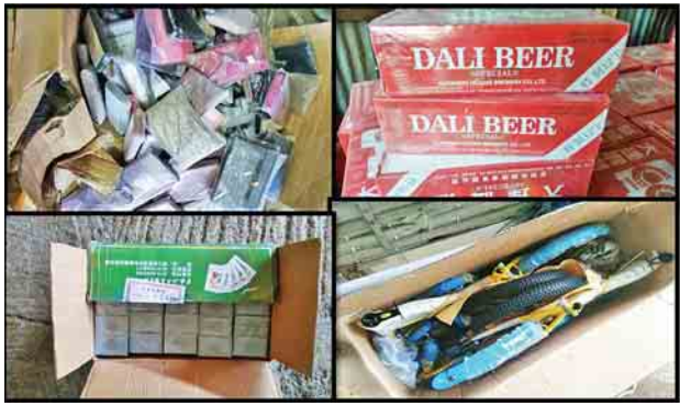
တရားဝင်စာရွက်စာတမ်း အထောက်အထား တစ်စုံတစ်ရာတင်ပြနိုင်ခြင်း မရှိသည့် လူသုံးကုန်ပစ္စည်းနှင့် ကန့်သတ်ကုန်ပစ္စည်းဖြစ်သည့် Dali Beer

ထူးခြားသိမ်းဆည်းမှုအနေဖြင့် အောက်တိုဘာ ၁၅ ရက်တွင် မန္တလေးသို့ သွားရောက်မည့် Canter ခြောက်ဘီးယာဉ် နှစ်စီးနှင့် Light Truck ယာဉ် တစ်စီးအား ရေပူအမြဲတမ်းစစ်ဆေးရေးစခန်း ပူးပေါင်းစစ်ဆေးရေးအဖွဲ့က