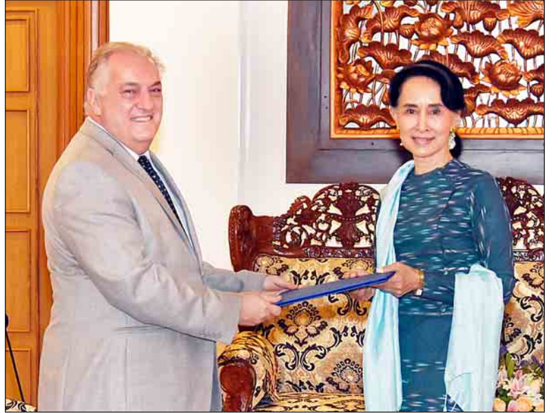
နိုင်ငံတော်၏အတိုင်ပင်ခံပုဂ္ဂိုလ် ဒေါ်အောင်ဆန်းစုကြည် ကုလသမဂ္ဂနိုင်ငံရေးရာဌာနအကြီးအကဲ ဒုတိယအတွင်းရေးမှူးချုပ် မစ္စတာ ဂျက်ဖရီ ဖဲလ်မန်အား လက်ခံတွေ့ဆုံစဉ်။