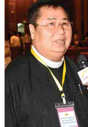
ဦးခင်ရွှေ (ဇေကျွန်ကုမ္ပဏီ)