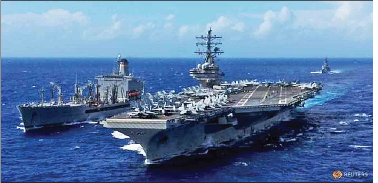
ထရန်က မိမိအား ညွှန်ကြားထားကြောင်း အမေရိကန်နိုင်ငံခြားရေးဝန်ကြီး သံတမန်ရေးအရာ လုပ်ကိုင်သွားမည်ဟု အမေရိကန်သမ္မတက ပြောကြားကြောင်း ရက်စံတေလာဆန်က အောက်တိုဘာ ၁၅ ရက်တွင် ပြောသည်။ နိုင်ငံခြားရေးဝန်ကြီး တေလာဆန်က ပြောကြားသည်။ မြောက်ကိုရီးယားနိုင်ငံအပေါ် ပထမဆုံး ဗုံးတစ်လုံးမကြေချမီအချိန်အထိ ဆင်ဟွာ။

မြောက်ကိုရီးယားနိုင်ငံနှင့် တင်းမာမှုမြင့်တက်လာမှုများအပေါ် သံတမန်ရေးနည်းလမ်းများဖြင့် ကြိုးပမ်းဖြေရှင်းရန် အမေရိကန်သမ္မတ ဒေါ်နယ်လ်