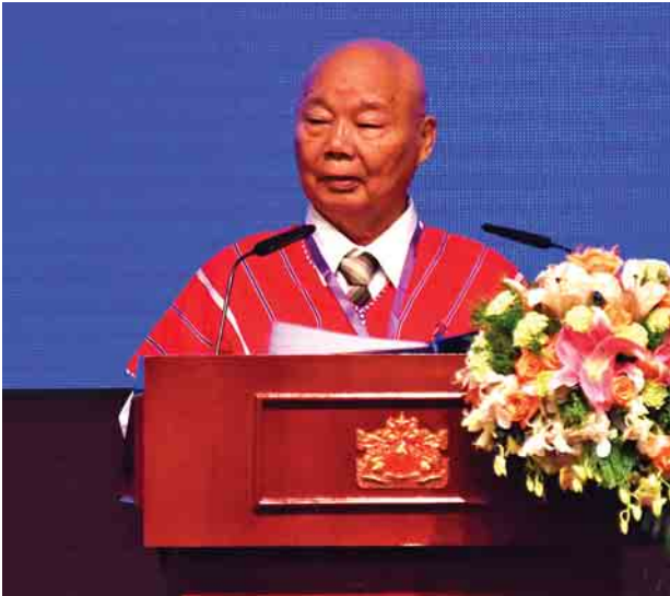
ကေအင်န်ယူ ကရင်အမျိုးသားအစည်းအရုံးဥက္ကဋ္ဌ ဗိုလ်ချုပ်ကြီး စောမူတူးဝေးဖိုး။

ဒါကြောင့် ကျွန်တော်တို့ တိုင်းရင်းသားလူမျိုးများရဲ့အမြင်မှာ ယနေ့တိုင် ဖြစ်ပွားနေတဲ့ပြည်တွင်းစစ်ကြီးဟာ ပင်လုံစာချုပ်ကို အပြည့်အဝ အကောင်