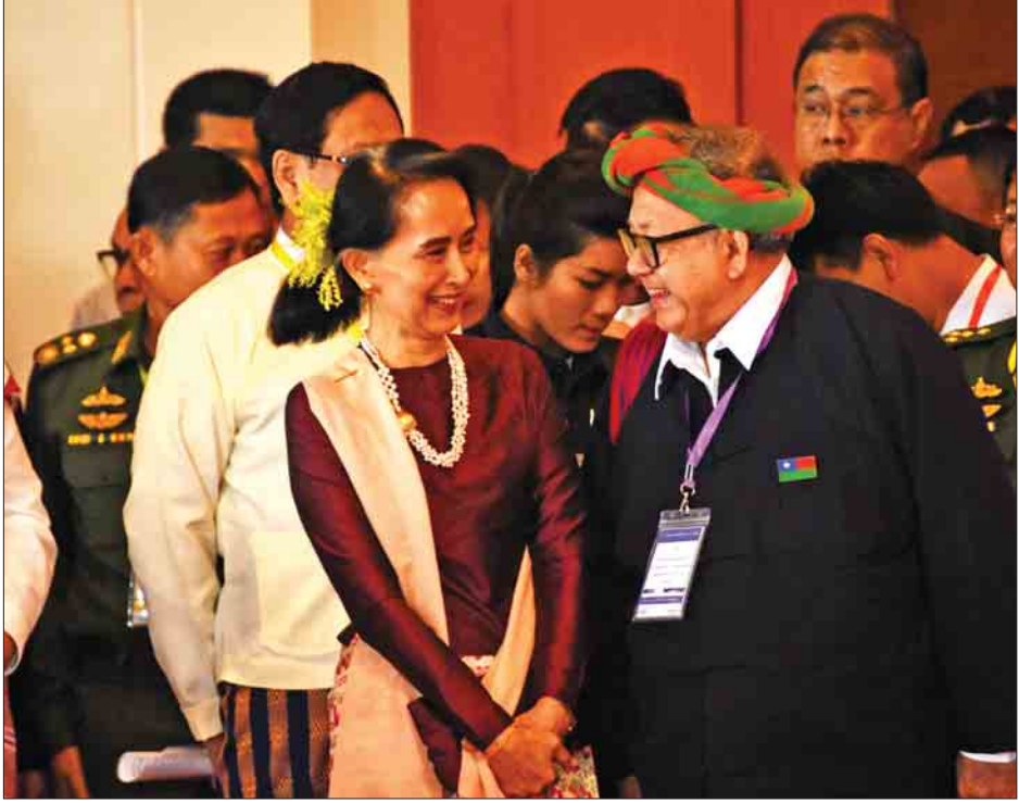
နိုင်ငံတော်၏အတိုင်ပင်ခံပုဂ္ဂိုလ် ဒေါ်အောင်ဆန်းစုကြည် တက်ရောက်လာကြသူများအား ရင်းရင်းနှီးနှီးနှုတ်ဆက်စဉ်။

သဘောထားများ ရေးဆွဲချမှတ်နိုင်ခဲ့ပါကြောင်း။ ပြည်ထောင်စုငြိမ်းချမ်းရေးညီလာခံ-(၂၁)ရာစုပင်လုံ ဒုတိယအစည်းအဝေးတွင် အားလုံးလက်ခံနိုင်သော အခြေခံမူဝါဒများ ဖော်ထုတ်နိုင်ရေးဦးတည်ပြီး ဦးစားပေး ဆွေးနွေးရမည့်ခေါင်းစဉ်များအဖြစ် နိုင်ငံရေးကဏ္ဍတွင် ဖက်ဒရယ်စနစ်၌ အခြေခံရမည့်မူများ၊ စီးပွားရေးကဏ္ဍ တွင် ဖက်ဒရယ်စနစ်စီးပွားရေးဆိုင်ရာ အခြေခံရမည့်မူ များနှင့် ဒေသန္တရဖွံ့ဖြိုးရေးဆိုင်ရာ အခြေခံမူများ၊ လူမှုရေး ကဏ္ဍတွင် ပြန်လည်နေရာချထားရေး၊ ပြန်လည်ထူထောင် ရေးနှင့် လူမှုဖွံ့ဖြိုးရေးဆိုင်ရာ အခြေခံမူများ၊ မြေယာနှင့် သဘာဝပတ်ဝန်းကျင်ကဏ္ဍတွင် ဖက်ဒရယ်စနစ်ကို အခြေခံ သော မြေယာမူဝါဒ၏ အခြေခံမူများကို သတ်မှတ်ခဲ့ပါ ကြောင်း။