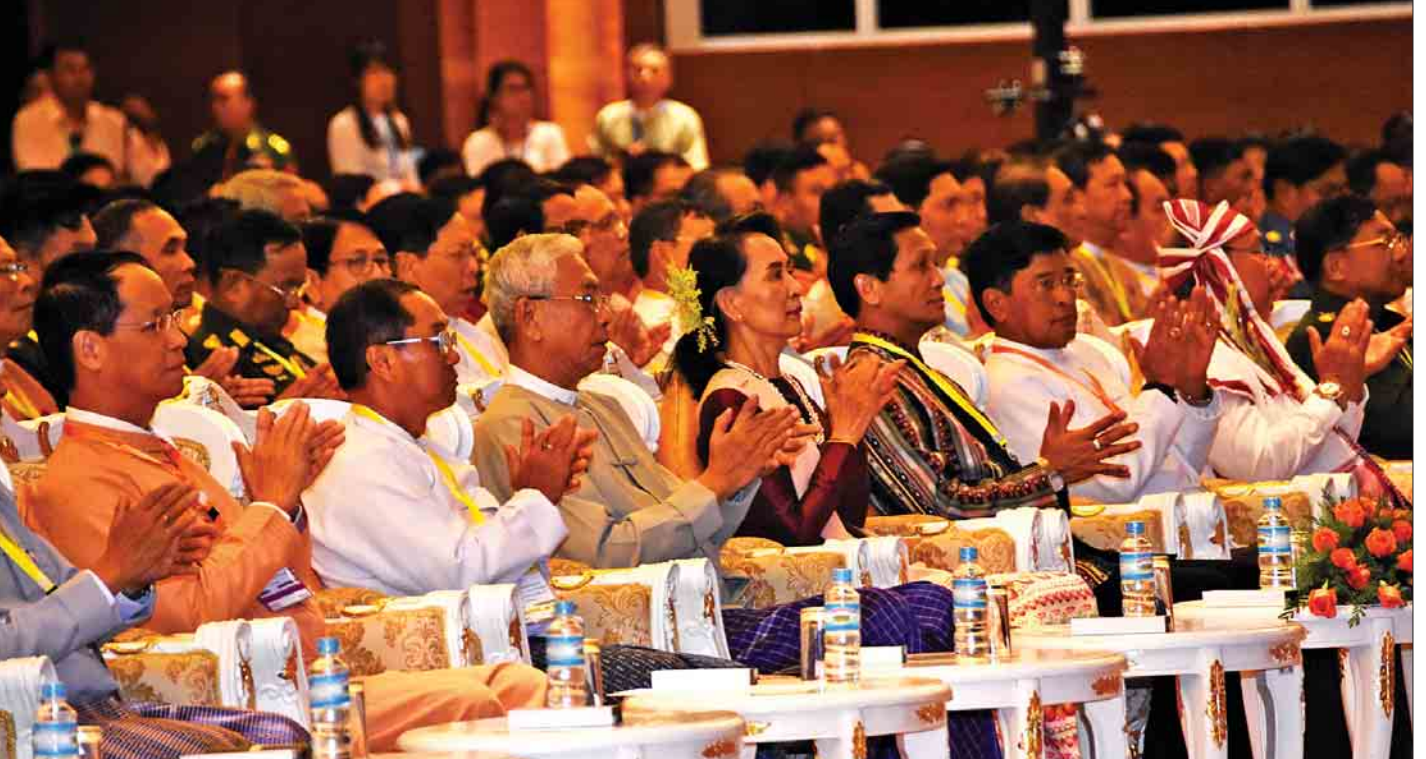
တစ်နိုင်ငံလုံး ပစ်ခတ်တိုက်ခိုက်မှုရပ်စဲရေး သဘောတူစာချုပ် လက်မှတ်ရေးထိုးခြင်း (၂)နှစ်မြောက် နှစ်ပတ်လည်နေ့ အထိမ်းအမှတ်အခမ်းအနားသို့ နိုင်ငံတော်သမ္မတ ဦးထင်ကျော်၊ နိုင်ငံတော်၏အတိုင်ပင်ခံပုဂ္ဂိုလ် ဒေါ်အောင်ဆန်းစုကြည်နှင့် တက်ရောက်လာကြသူများအား တွေ့ရစဉ်။

နိုင်ငံတော်ဖွဲ့စည်းပုံအခြေခံဥပဒေခုံရုံးဥက္ကဋ္ဌ ဦးမျိုးညွန့်၊ ပြည်ထောင်စုရွေးကောက်ပွဲကော်မရှင်ဥက္ကဋ္ဌ ဦးလှသိန်း၊ ဒုတိယတပ်မတော် ကာကွယ်ရေးဦးစီးချုပ် ကာကွယ်ရေး ဦးစီးချုပ်(ကြည်း)ဒုတိယဗိုလ်ချုပ်မှူးကြီးစိုးဝင်း၊ အမျိုးသား လွှတ်တော် ဒုတိယဥက္ကဋ္ဌ၊ ပြည်ထောင်စုလွှတ်တော် ဥပဒေရေးရာနှင့် အထူးကိစ္စရပ်များ လေ့လာဆန်းစစ် သုံးသပ်ရေး ကော်မရှင်ဥက္ကဋ္ဌ၊ ပြည်ထောင်စုဝန်ကြီးများ၊ ပြည်ထောင်စုရှေ့နေချုပ်၊ ပြည်ထောင်စုရာထူးဝန်အဖွဲ့ ဥက္ကဋ္ဌ၊ နေပြည်တော်ကောင်စီဥက္ကဋ္ဌ၊ အမျိုးသား လူ့အခွင့် အရေးကော်မရှင်ဥက္ကဋ္ဌ၊ အဂတိလိုက်စားမှုတိုက်ဖျက်ရေး ကော်မရှင်ဥက္ကဋ္ဌ၊ တိုင်းဒေသကြီးနှင့် ပြည်နယ်ဝန်ကြီးချုပ်များ၊ ညှိနှိုင်းကွပ်ကဲရေးမှူးကြီး(ကြည်း၊ ရေ၊ လေ)၊ ကာကွယ်ရေး ဦးစီးချုပ်(ကြည်း)မှ တပ်မတော်အရာရှိကြီးများ၊ လွှတ်တော်ရေးရာကော်မတီဥက္ကဋ္ဌများ၊ တိုင်းမှူးများ၊ ဒုတိယဝန်ကြီးများ၊ နိုင်ငံရေးပါတီများမှ ကိုယ်စားလှယ်များ၊ NCA လက်မှတ်ရေးထိုးရာတွင် ပါဝင်ခဲ့ကြသည့် အသိ သက်သေများ၊ ပြည်ထောင်စု ငြိမ်းချမ်းရေးဆွေးနွေးမှု ပူးတွဲကော်မတီ(UPDJC) အဖွဲ့ဝင်များ၊ ပစ်ခတ်တိုက်ခိုက်မှု ရပ်စဲရေး ပူးတွဲစောင့်ကြည့်ရေးကော်မတီ(JMC-U) ကော်မတီဝင်များ၊ တစ်နိုင်ငံလုံး ပစ်ခတ်တိုက်ခိုက်မှု ရပ်စဲရေးသဘောတူစာချုပ် လက်မှတ်ရေးထိုးထားသော တိုင်းရင်းသားလက်နက်ကိုင်အဖွဲ့အစည်းများ၊ နိုင်ငံခြား သံရုံးများမှ သံတမန်များနှင့် နိုင်ငံတကာအဖွဲ့အစည်းများမှ ကိုယ်စားလှယ်များ၊ စီးပွားရေးလုပ်ငန်းရှင်များ၊ ဖိတ်ကြား ထားသော ဧည့်သည်တော်များ တက်ရောက်ကြသည်။ အခမ်းအနားတွင် အမျိုးသားပြန်လည်သင့်မြတ်ရေး နှင့် ငြိမ်းချမ်းရေးဗဟိုဌာနဥက္ကဋ္ဌ နိုင်ငံတော်၏ အတိုင်ပင်ခံ ပုဂ္ဂိုလ် ဒေါ်အောင်ဆန်းစုကြည်က အဖွင့်အမှာစကား ပြောကြားသည်။