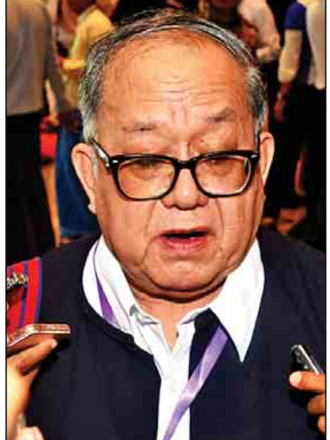
ခွန်ဋ္ဌာ (ပအိုဝ်းအမျိုးသား လွတ်မြောက်ရေး အဖွဲ့ချုပ်)

ကျွန်တော်တို့ ငြိမ်းချမ်းရေးလုပ်ငန်းစဉ်က စိတ်ပျက်နေလို့ရတဲ့ကိစ္စမျိုး မဟုတ်ပါဘူး။ အမြဲတမ်းအားထုတ်ပြီး မပြစ်မနေလုပ်မယ်လို့ သန့်ဋ္ဌာန်စိတ်မျိုးနဲ့လုပ်နိုင်မှ အောင်မြင်မှုရနိုင်မယ်လို့ ယူဆပါတယ်။ ကျွန်တော်တို့ မျှော်လင့်တဲ့ ငြိမ်းချမ်းရေးက အပြုသဘော ဆောင်တဲ့ ငြိမ်းချမ်းရေးပါ။ အနာဂတ်ကာလမှာ တိုင်းပြည်တစ်ပြည်လုံး အေးအေးချမ်းချမ်းနဲ့ အကြမ်းနည်းနဲ့အရေးယူ ဆောင်ရွက်မှုတွေ မရှိဘဲနဲ့ အားလုံးကတန်းတူညီမျှ အနေအထား မျိုးနဲ့ အတူတကွ ယှဉ်တွဲပြီးတော့ နေထိုင် သွားနိုင်တဲ့ ငြိမ်းချမ်းရေးကို ဆောင်ရွက် နေတာဖြစ်ပါတယ်။ ကျွန်တော်တို့ရဲ့ ငြိမ်းချမ်းရေးက နှုတ်သဘောဆောင်တဲ့ငြိမ်း ချမ်းရေးအတွက်တော့ အကောင်အထည်ဖော် ရတာလွယ်ပါတယ်။ အပြုသဘောဆောင်တဲ့ ငြိမ်းချမ်းရေးအတွက်ကျတော့ ရည်မှန်းချက် ကလည်းကြီးတယ်။ လုပ်ငန်းစဉ်ကလည်း တာရှည်ပါတယ်။ ဒါကြောင့် အချိန်ယူပြီး စိတ်ရှည်လက်ရှည်နဲ့ ဆောင်ရွက်သွားဖို့ လိုအပ်ပါတယ်။