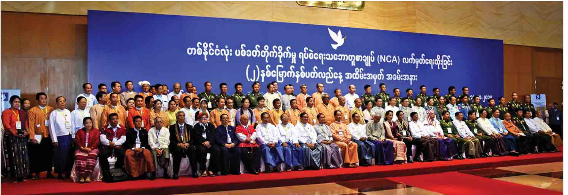
နိုင်ငံတော်သမ္မတ ဦးထင်ကျော်၊ နိုင်ငံတော်၏အတိုင်ပင်ခံပုဂ္ဂိုလ် ဒေါ်အောင်ဆန်းစုကြည်နှင့်အဖွဲ့ အစိုးရ လွှတ်တော်၊ တပ်မတော်ကိုယ်စားလှယ်များနှင့် မှတ်တမ်းတင်ဓာတ်ပုံရိုက်စဉ်။