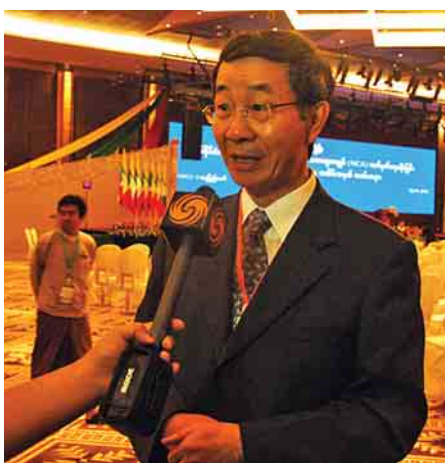
တရုတ်ပြည်သူ့သမ္မတနိုင်ငံမှ အာရှရေးရာ အထူးသံတမန် မစ္စတာ ဆွန်း ကော်ရှန်။

မေး - အစိုးရက ငြိမ်းချမ်းရေးဖြစ်စဉ်ကို အကောင်အထည်ဖော်ဆောင်ရာမှာ အဓိကကျတဲ့ အခက်အခဲတွေက ဘာတွေဖြစ်မလဲဆိုတဲ့ တရုတ်နိုင်ငံရဲ့အမြင်ကို သိလိုပါတယ်။ ဘာဖြစ်လို့လဲဆိုတော့ NCA ကို လက်မှတ်ရေးထိုးသေးတဲ့ တိုင်းရင်းသားလက်နက်ကိုင်အဖွဲ့တွေလည်း ရှိနေပါသေးတယ်။