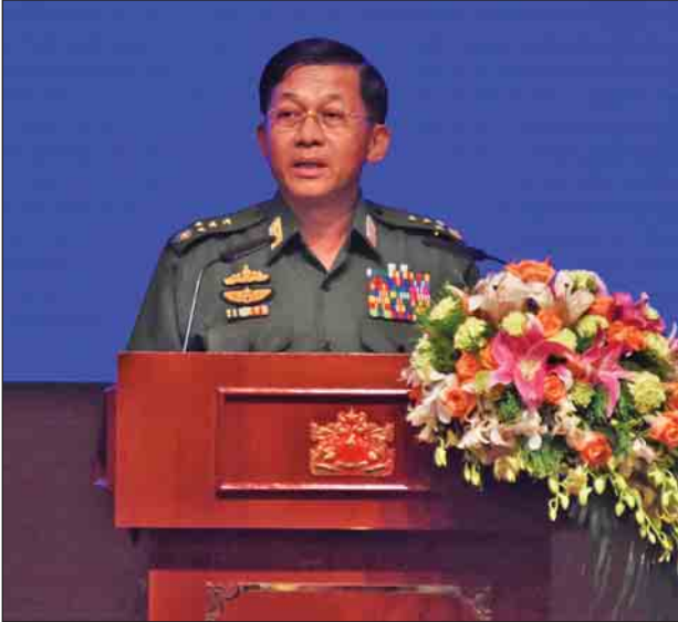
တပ်မတော်ကာကွယ်ရေးဦးစီးချုပ် ဗိုလ်ချုပ်မှူးကြီး မင်းအောင်လှိုင် အမှာစကားပြောကြားစဉ်။

ဒီကနေ့ ပြုလုပ်တဲ့ အခမ်းအနားကို ငြိမ်းချမ်းရေးအတွက် တူညီသော ဆန္ဒများ၊ ပူးတွဲကြည့်မှုများနဲ့ တက်ရောက်လာကြတဲ့ နိုင်ငံတော်မှ တာဝန်ရှိပုဂ္ဂိုလ်များ၊ တိုင်းရင်းသားလက်နက်ကိုင် အဖွဲ့အစည်းအသီးသီးမှ ပုဂ္ဂိုလ်များ၊ ပြည်တွင်းပြည်ပ အဖွဲ့အစည်းများမှ နည်းသည်တော်များနဲ့ ပြည်ထောင်စုဖွား တိုင်းရင်းသား ညီအစ်ကိုမောင်နှမများအားလုံး နှလုံးစိတ်ဝမ်း အေးချမ်းကြပါစေကြောင်း ဦးစွာဆုမွန်ကောင်းတောင်း နှုတ်ခွန်းဆက်အပ်ပါတယ်။ ဒီနေ့ဟာ ပစ်ခတ်တိုက်ခိုက်မှုရပ်စဲရေး (Ceasefire) လို့ အမည်တပ်ထားပေမယ့် ပစ်ခတ်တိုက်ခိုက်မှုရပ်စဲရေး ရည်မှန်းချက်ထက် ပိုမိုကျယ်ပြန့်မြင့်မားတဲ့ ရည်ရွယ်ချက်တွေ၊ တိုင်းရင်းသားပြည်သူလူထုအားလုံးရဲ့ လိုလားချက်တွေကို လက်တွေ့ကျကျ ဖော်ဆောင်ပေးမယ့် တစ်နိုင်ငံလုံးပစ်ခတ်တိုက်ခိုက်မှုရပ်စဲရေး သဘောတူစာချုပ် (Nationwide Ceasefire Agreement-NCA) ကို လက်မှတ်ရေးထိုးချုပ်ဆိုခဲ့တာ (၂)နှစ်ပြည့်မြောက်တဲ့နေ့ပဲ ဖြစ်ပါတယ်။