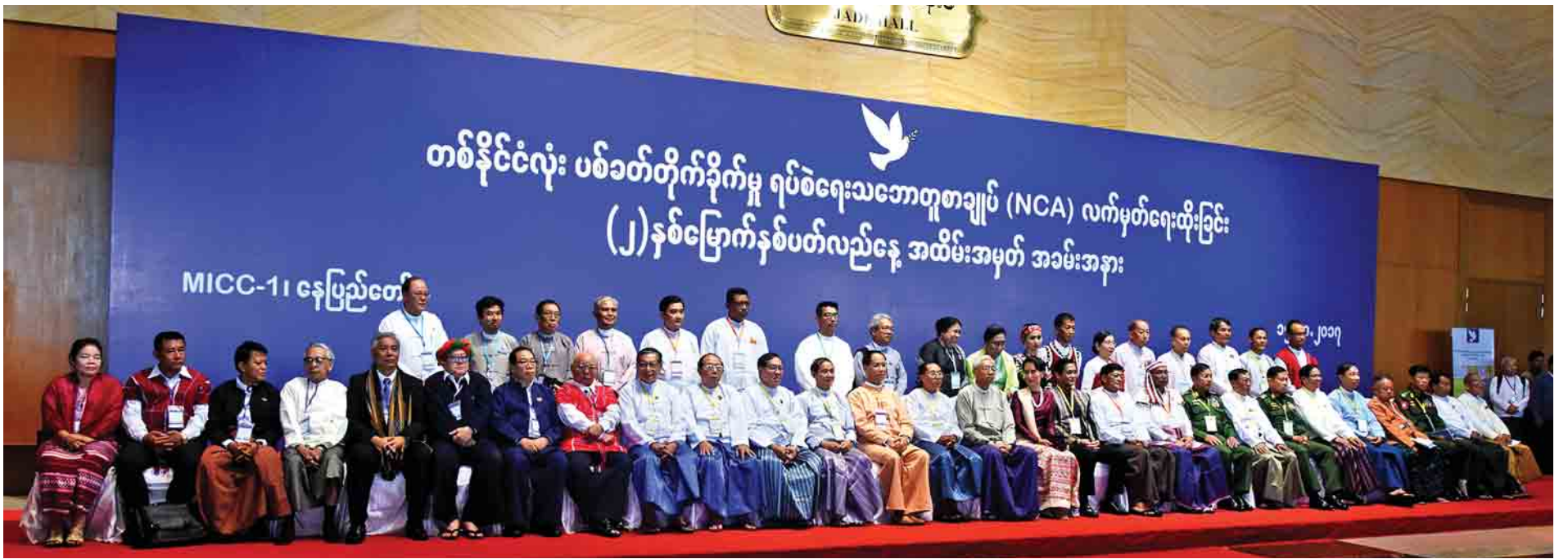
နိုင်ငံတော်သမ္မတ ဦးထင်ကျော်၊ နိုင်ငံတော်၏အတိုင်ပင်ခံပုဂ္ဂိုလ် ဒေါ်အောင်ဆန်းစုကြည်နှင့်အဖွဲ့၊ နိုင်ငံရေးပါတီ၊ ယခင် UPWC ၊ ယခင် MPC နှင့် အသိသက်သေများနှင့်အတူ မှတ်တမ်းတင်ဓာတ်ပုံရိုက်စဉ်။