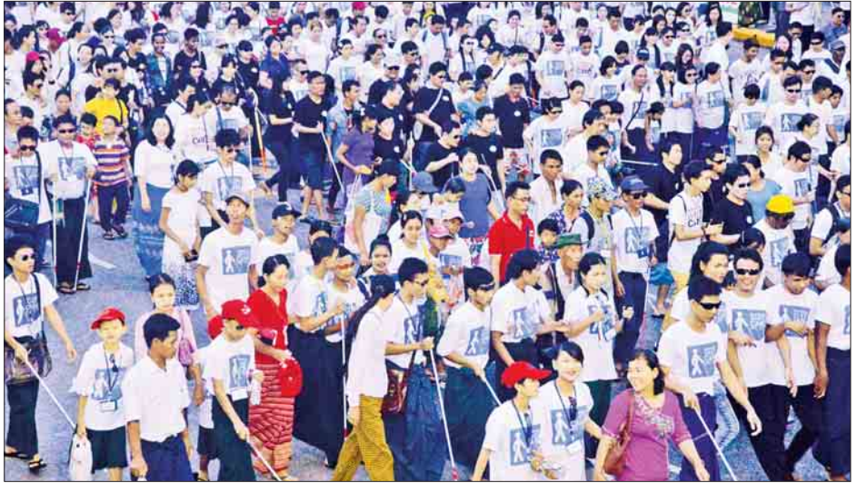
နိုင်ငံတကာမျက်မမြင် လမ်းလျှောက်ပွဲအထိမ်းအမှတ် ရန်ကုန်မြို့တော်ဝန်ဖလား(၂၆)ကြိမ်မြောက် မျက်မမြင်လမ်းလျှောက်ပွဲကို အောက်တိုဘာ ၁၅ ရက်က မြို့တော်ခန်းမရှေ့၌ စတင်တာလွှတ်စဉ်။

မျက်မမြင်လမ်းလျှောက်ပွဲတွင် ရန်ကုန်မြို့တော်ဝန်က ရန်ကုန်မြို့တော်ခန်းမရှေ့ မဟာဗန္ဓုလလမ်းရှိ စင်မြင့်ထက်မှ သေနတ်ပစ်ဖောက် တာလွှတ်ပေးသည်နှင့် တစ်ပြိုင်နက် လမ်းလျှောက်ပွဲတွင် ပါဝင်ဆင်နွှဲလမ်းလျှောက်ကြသည့် မျက်မမြင်ကျောင်းနှင့် အလုပ်ရုံများမှ မျက်မမြင်များသည် ရန်ကုန်မြို့တော်ခန်းမရှေ့ မဟာဗန္ဓုလလမ်းမှ စတင်၍ လမ်းလျှောက်ကြရာ ရန်ကုန်မြို့တော်ဝန်နှင့် တာဝန်ရှိသူများက မျက်မမြင်များနှင့်အတူ လိုက်ပါအားပေးလမ်းလျှောက်ကြသည်။ မျက်မမြင်လမ်းလျှောက်ရာ တစ်လျှောက်ရှိ ကျောက်တံတား၊ ပန်းဘဲတန်း၊ လသာနှင့် လမ်းမတော်