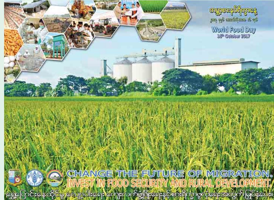
ရွှေ့ပြောင်းနေထိုင်မှုလျော့ပါးရေး ကျေးလက်ပွံ့ဖြိုးရေးနှင့် စားနပ်ရိက္ခာဖူလုံရေးအတွက် မြှုပ်နှံပေး

ကျေးလက်ဒေသဖွံ့ဖြိုးရေးကို ယခင်အစိုးရအဆက်ဆက်ကလည်း နည်းလမ်းအမျိုးမျိုးဖြင့် ကြိုးပမ်းဖော်ဆောင်ခဲ့ကြသည်။ ကျေးလက်ဒေသ စဉ်ဆက်မပြတ်ဖွံ့ဖြိုးရန်အတွက် ဖွံ့ဖြိုးရေးမိတ်ဖက်အဖွဲ့အစည်းများ၊ ကုလသမဂ္ဂအဖွဲ့အစည်းများ၊ ပြည်တွင်း ပြည်ပ NGO အဖွဲ့များ၊ ကျွမ်းကျင်ပညာရှင်များ၊ အရပ်ဘက်လူမှုအဖွဲ့အစည်းများအားလုံး ပါဝင်ဆွေးနွေး တိုင်ပင်ဆွေးနွေးခဲ့သည့် ကျေးလက်ဒေသဖွံ့ဖြိုးရေး မဟာဗျူဟာမူဘောင်ကို ၂၀၁၃ ခုနှစ် နိုဝင်ဘာလတွင် ရေးဆွဲအတည်ပြုနိုင်ခဲ့သည်။ ယင်းမူဘောင်နှင့်အညီ လက်တွေ့အကောင်အထည်ဖော်ဆောင်ရွက်နိုင်မည့် ပြည်သူ့ကိုပဏိဋ္ဌာန်သည် လုပ်ငန်းအစီအစဉ်များကို ရေးဆွဲကာ ကျေးလက်ပြည်သူများ၏ စွမ်းဆောင်ရည်မြှင့်တင်ရေး၊ အသက်မွေးဝမ်းကျောင်းနှင့် မိသားစုဝင်ငွေတိုးပွားရေး လုပ်ငန်းများကို ကြိုးပမ်းဆောင်ရွက်ပေးလျက်ရှိသည်။