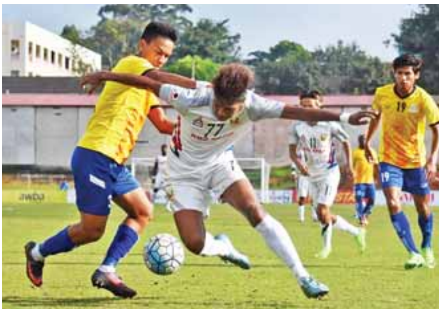
ရှမ်းယူနိုက်တက် အသင်းနှင့် မကွေးအသင်း အကြိတ်အနယ် ယှဉ်ပြိုင်နေစဉ်။