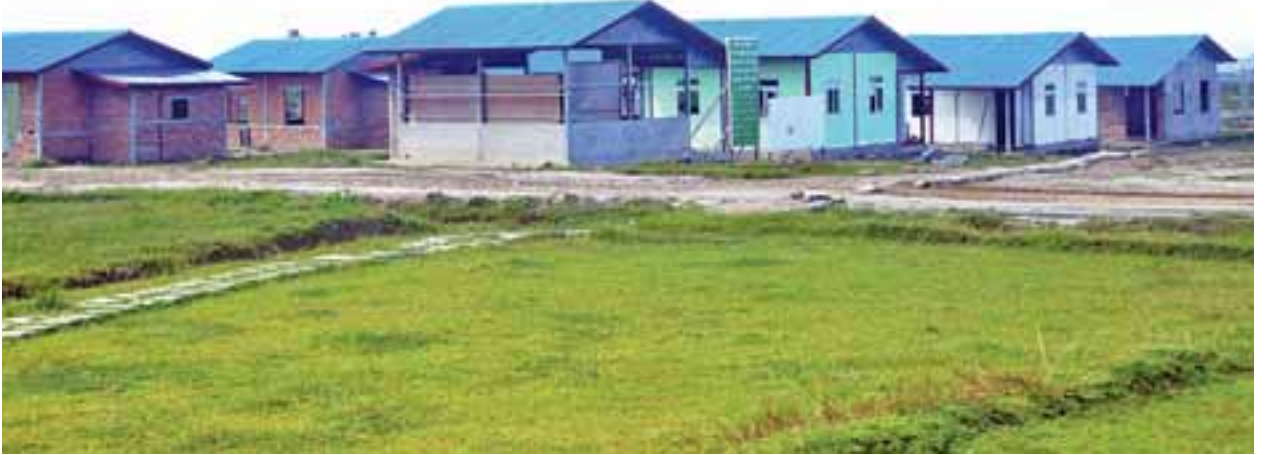
ကျောက်ပန္နက်ကျေးရွာတွင် တည်ဆောက်လျက်ရှိသော အိမ်ရာများအား တွေ့ရစဉ်။

လက်ရှိတွင် ကျောက်ပန္နက်ကျေးရွာ၌ နေအိမ်အလုံး ၁၀၀ မှာ တည်ဆောက် ဆဲဖြစ်ပြီး တည်ဆောက်ပြီးခဲ့သည့် အိမ်ရာများမှာ မောင်တောမြို့နယ် ကိုင်းကြီး ကျေးရွာတွင် ၃၆ လုံး၊ ရွှေပဟိုလ်ကျေးရွာတွင် အလုံး ၅၀၊ တောင်ပြုလက်ဝဲ မြို့တွင် ၇၄ လုံး၊ အထက်ပြုမကျေးရွာတွင် အလုံး ၃၀၊ သရေကုန်းဘောင်ကျေးရွာ တွင် ၁၂ လုံး၊ သုခမြိုင်ကျေးရွာတွင် ၃၅ လုံး၊ နန်းရာကိုင်းကျေးရွာတွင် အလုံး ၅၀၊ မြို့သစ်ကျေးရွာတွင် ၂၅ လုံး၊ စာမျက်နှာ ၈ ကော်လံ ၄ သို့ ◆