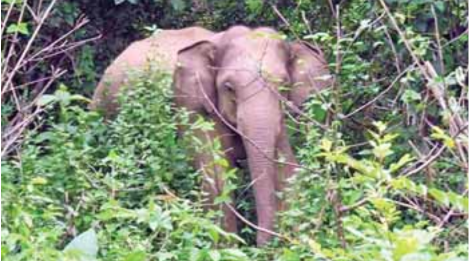
ထွန်းလှိုင်(မြိုင်)

ဆင်ဦးစီးတစ်ဦးက ပြောသည်။ “ဆင်နဲ့တွေ့တဲ့အခါ မေတ္တာထားဖို့လိုတယ်။ ကျွန်မတို့တောထဲနေတာကြာပြီ၊ ဆင်နဲ့မကြာခဏတွေ့ပါတယ်။ အမြဲပဲမေတ္တာပို့တယ်။ တစ်ရက်မှာ ကျွန်မတို့လှမ်းထားတဲ့ စပါးတွေကို ဆင်လာစားတယ်။ ကျွန်မက သားကြီးစပါးတွေ အကုန်စားနဲ့ ငါတို့စားဖို့ ချန်ဦးလို့ပြောတော့ မော့ကြည့်ပြီး ပြန်ထွက်သွားတယ်။ သူတို့လာရင် လူတွေက စက်ဘီးတာယာတွေကို မီးရှို့ပြီးပစ်တယ်။ မီးတုတ်တွေနဲ့ ပစ်တယ်။ လေးခွနဲ့ချောင်းပစ်တယ်။ သူတို့က မှတ်ထားတာ ရန်သူဖြစ်သွားတာပေါ့။ ဆင်တွေဟာ အမှတ်အသားကြီးတယ်။ အကင်းပါးတယ်” ဟု ချောင်းဆောက် ရွာထဲတိုက်တွင်နေသူ အသက် (၆၅)နှစ်ရှိ အဘွားက ပြောသည်။