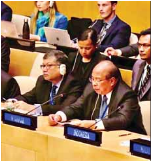
သတင်းယူခွင့်မပြုသည့်အပြင် မှတ်တမ်းပြုစုခြင်းလည်းမရှိကြောင်း သိရှိရ သည်။ (သတင်းစဉ်)

Arria-Formula ဆိုသည်မှာ ဗင်နီဇွဲလားနိုင်ငံသည် ၁၉၉၂-၁၉၉၃ ခုနှစ် သက်တမ်းအတွက် ကုလသမဂ္ဂလုံခြုံရေးကောင်စီ၏ အမြဲတမ်းမဟုတ် သည့် အဖွဲ့ဝင်နိုင်ငံအဖြစ် အရွေးချယ်ခံရစဉ်က တာဝန်ထမ်းဆောင်ခဲ့သည့် သံအမတ်ကြီး Mr. Diego Arria မှ ၁၉၉၂ ခုနှစ်တွင် စတင်အကြံပြု ကျင့်သုံး ခဲ့သည့် ကျင့်ထုံးတမ်းတစ်ရပ်ဖြစ်သည်။ ယင်းသို့သော အစည်းအဝေးမှာ လုံခြုံရေးကောင်စီအဖွဲ့ဝင်နိုင်ငံများနှင့် သက်ဆိုင်ရာ ဖိတ်ကြားခံရသည့် နိုင်ငံများ၊ အဖွဲ့အစည်းများနှင့် လူပုဂ္ဂိုလ်များအကြား ကိစ္စရပ်တစ်ခုအပေါ် လွတ်လပ်ပွင့်လင်းစွာဖြင့် သီးသန့်ဆွေးနွေး အမြင်ချင်းဖလှယ်နိုင်ရေးအတွက် အလွတ်သဘော ကျင်းပသည့် ပုံစံတစ်ရပ်ဖြစ်သည်။ သတင်းမီဒီယာများ