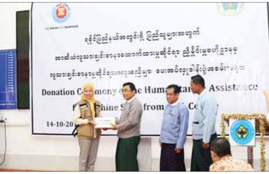
မည်သည့်အဖွဲ့ဝင်နိုင်ငံ၏ အခက်အခဲကိုမဆို တစ်သားတည်း ရပ်တည်ကာ စုပေါင်းဖြေရှင်းကြမည်ဟု ယုံကြည်ပါ ကြောင်း၊ ယခုကဲ့သို့ လာရောက်ကူညီထောက်ပံ့ခြင်းသည် လည်း ယင်းအချက်ကို သက်သေပြရာရောက်ကြောင်း။ ယနေ့ကူညီထောက်ပံ့သော လူသားချင်းစာနာ

ရန်ကုန် အောက်တိုဘာ ၁၄ ရခိုင်ပြည်နယ်အတွင်းရှိပြည်သူများအတွက် အာဆီယံ လူသားချင်းစာနာထောက်ထားမှုဆိုင်ရာ ညှိနှိုင်းရေး ဗဟိုဌာန(AHA Centre)မှ လူသားချင်းစာနာမှုဆိုင်ရာ အကူအညီများ ထောက်ပံ့ပေးအပ်ပွဲအခမ်းအနားကို ယနေ့ နံနက်ပိုင်းက ရန်ကုန်မြို့ရှိ သဘာဝဘေးအန္တရာယ်ဆိုင်ရာ စီမံခန့်ခွဲမှုဗဟိုဌာန(ရန်ကုန်ရုံးခွဲ)တွင် ကျင်းပသည်။ အခမ်းအနားတွင် အာဆီယံလူသားချင်းစာနာ ထောက်ထားမှုဆိုင်ရာ ညှိနှိုင်းရေးဗဟိုဌာန၏ အမှုဆောင် ညွှန်ကြားရေးမှူး Ms. Adelina Kanal က လှူဒါန်းခြင်း အကြောင်းကို ရှင်းလင်းတင်ပြသည်။ ထို့နောက် လူမှုဝန်ထမ်း၊ ကယ်ဆယ်ရေးနှင့် ပြန်လည် နေရာချထားရေးဝန်ကြီးဌာန ပြည်ထောင်စုဝန်ကြီး ဒေါက်တာဝင်းမြတ်အေးက ကျေးဇူးတင်စကား ပြန်လည် ပြောကြားရာတွင် ဤထောက်ပံ့ပေးအပ်ပွဲအခမ်းအနားသည် အာဆီယံဒေသတွင်း နိုင်ငံအချင်းချင်း နားလည်မှု၊ အပြန် အလှန်ယုံကြည်မှု၊ ခိုင်မြဲသောလက်တွဲမှုနှင့် ညီညွတ် ပေါင်းစည်းမှုကို ပြသခြင်းဖြစ်သည်ဟု ယုံကြည်ပါကြောင်း။ ဒုက္ခခံစားရသောပြည်သူများ မျှတစွာခံစားရရှိစေရန် ကြက်ခြေနီလှုပ်ရှားမှုကို စက်တင်ဘာ ပထမပတ်တွင် စတင်ခဲ့ပါကြောင်း၊ အာဆီယံနိုင်ငံများသည် မိသားစုတစ်ခု ဖြစ်သည်ဟုယူဆ၍ သွေးသားရင်းချာနိုင်ငံများကဲ့သို့