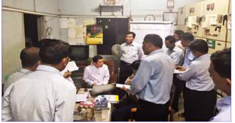
ကေပီ ၂၂၁၀ အမ်ပီအေ ထရပ်စဖော် ဆောင်ရွက်နိုင်သည့် (Voltage မြောင်းလဲဆောင်ရွက်ရေး စီစဉ်ဆောင် မာကို ဗို့အားအတက်အကျ ထိန်းညှိ Tapping) ကို လက်ရှိအခြေအနေမှ ရွက်ခဲ့သည်။ (ကြေးမုံ)

မန္တလေးတိုင်းဒေသကြီးအတွင်း လျှပ် စစ်ဓာတ်အား ပြည့်ဝစွာရရှိရေး၊ ဗို့အားကျဆင်းမှုမရှိစေရေးနှင့် ဓာတ် အားပျောက်ဆုံးမှု လျော့ချနိုင်ရေး အတွက် လျှပ်စစ်နှင့် စွမ်းအင်ဝန်ကြီး ဌာန ဒုတိယဝန်ကြီး ဒေါက်တာ ထွန်းနိုင်သည် တာဝန်ရှိသူများနှင့်အတူ အောက်တိုဘာ ၁၃ ရက်တွင် မန္တလေး မြို့၊ ချမ်းမြသာစည်မြို့နယ် ၃၃/၁၁ ကေပီ ၂၂၁၀ အမ်ပီအေ (၆၅)လမ်း ခွဲရုံသို့ ရောက်ရှိခဲ့သည်။