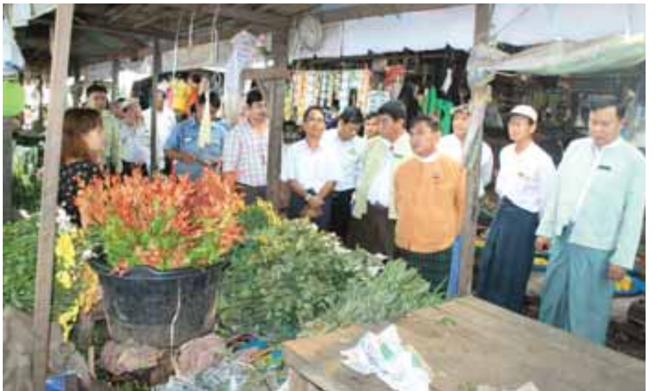
တင်စိုး(ပဲခူး)

ဝန်ကြီးချုပ်နှင့်အဖွဲ့သည် ဘုရားဈေးသစ်ပြန်လည်တည်ဆောက်ခြင်းမပြုမီ ဈေးရောင်းချနေမှုနှင့် ဈေးအခြေအနေအား ဝင်ရောက်ကြည့်ရှုပြီး(ယာဉ်) ဈေးသစ်ပြန်လည်တည်ဆောက်မည့်ကိစ္စရပ်အတွက် ဆန္ဒကိုမေးမြန်းခြင်းများအပြင် တာဝန်ရှိသူများအား ဈေးအတွင်း၊ အပြင်အမြင်အရင်းအနှီးပြုလုပ်ကြရန် မှာကြားခဲ့သည်။ ဘုရားဈေးသစ်အား ဈေးသည်များ၏သဘောဆန္ဒကိုခံယူပြီး အများဆန္ဒအတိုင်း စည်ပင်သာယာရေးအဖွဲ့မှ ပြန်လည်ဆောက်လုပ်ပေးသွားမည်ဖြစ်ကြောင်း သိရသည်။