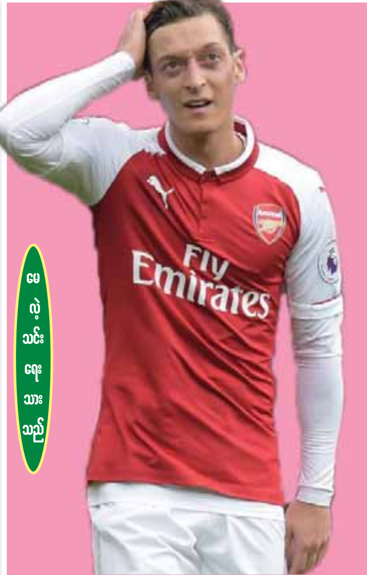
မေလဲ့သင်းရေးသားသည်