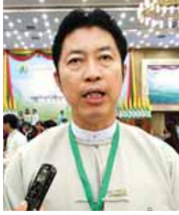
ဦးကျော်မင်းထင်

ဒီနေ့အခမ်းအနားကနေ ကျွန်တော်တို့ နိုင်ငံမှာရှိတဲ့ အစိုးရနဲ့ ပုဂ္ဂလိကကဏ္ဍ နှစ်ခု ကြား ဆက်ဆံရေးကို ပိုမိုနီးကပ်အောင် ဆောင် ရွက်ပေးနိုင်တယ်လို့ ယုံကြည်ပါတယ်။ ကျွန်တော်တို့နိုင်ငံက ဖွံ့ဖြိုးဆဲနိုင်ငံတစ်နိုင်ငံ ဖြစ်ပါတယ်။ ပြီးတော့ အစိုးရနဲ့ ပုဂ္ဂလိကကြား ဆက်ဆံရေးက အားနည်းနေသေးတဲ့အတွက် ဒီနေ့အခမ်းအနားတွေကနေ တွန်းအားပေးနိုင် ပါတယ်။ ကျွန်တော်တို့ရဲ့ ခရီးသွားကဏ္ဍ ဖွံ့ဖြိုးတိုးတက်ဖို့အတွက် နိုင်ငံတကာက သိရှိ အောင် ဆောင်ရွက်ဖို့ လိုအပ်နေပါသေးတယ်။ ခရီးသွားတွေ ပိုမိုဝင်ရောက်အောင် ဆောင် ရွက်ရဦးမှာ ဖြစ်ပါတယ်။ ကျွန်တော်တို့ အိမ်နီး ချင်း ထိုင်းနိုင်ငံကို တစ်နှစ်မှာ ခရီးသွား ၂၈ သန်းလောက် ဝင်ရောက်တယ်။ ကျွန်တော်တို့ နိုင်ငံကျတော့ ၁ ဒသမ ၂ သန်းလောက်ပဲ ဝင်ရောက်တော့ သူတို့နဲ့နှိုင်းယှဉ်ရင် နည်းနေ သေးတယ်။ ဒါကြောင့် ခရီးသွားကဏ္ဍကို ပိုမိုမြှင့်တင်ဖို့၊ ခရီးသွားတွေ ပိုမိုဝင်ရောက်ဖို့ ကြိုးစားရဦးမှာ ဖြစ်ပါတယ်။ ဒီအပိုင်းမှာ အားနည်းနေတာ ဖြစ်ပါတယ်။ နိုင်ငံတော်ရဲ့ ကူညီပံ့ပိုးမှုနဲ့ လုပ်ဆောင်မယ့်ဆိုရင် အားနည်း