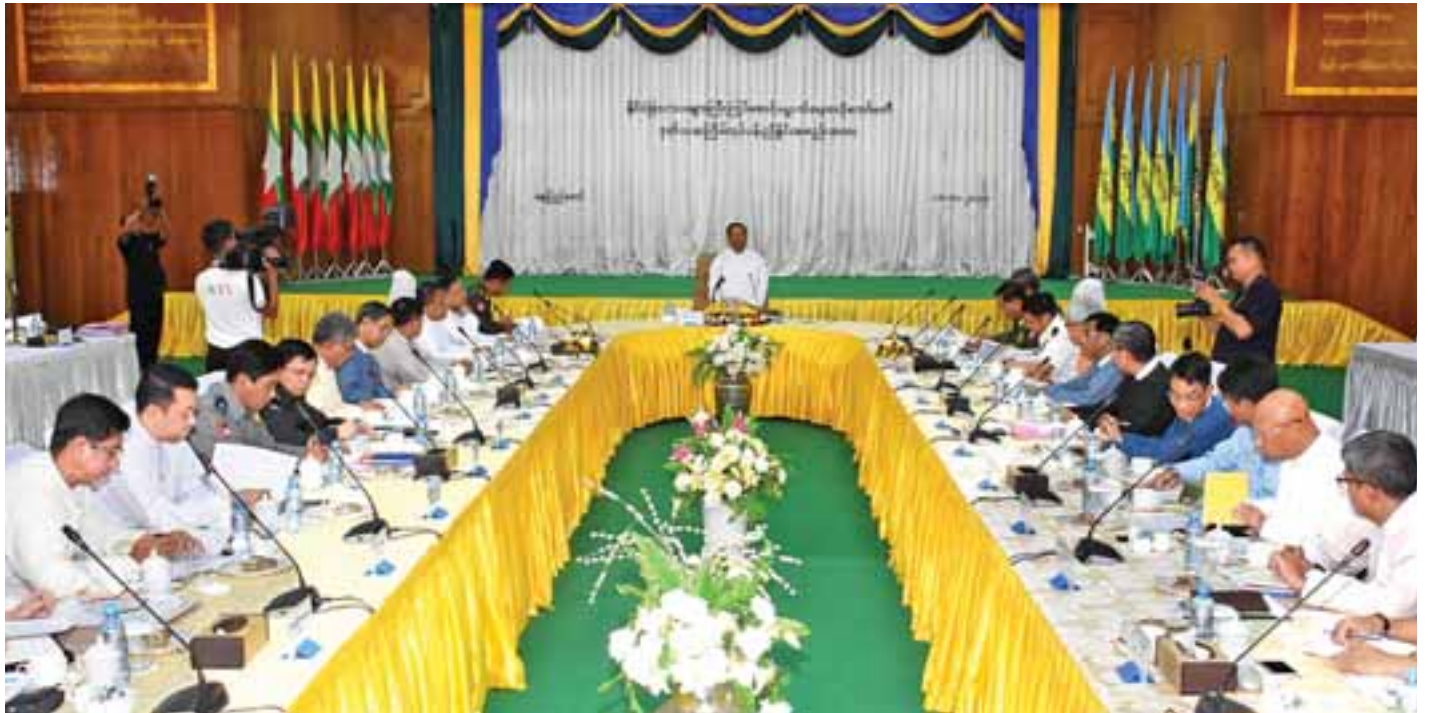
ဒုတိယသမ္မတဦးမြင့်ဆွေ နိုင်ငံခြားသားများ ကြီးကြပ်စောင့်ရှောက်ရေးဗဟိုကော်မတီ ဒုတိယအကြိမ်လုပ်ငန်းညှိနှိုင်းအစည်းအဝေးတွင် အမှာစကားပြောကြားစဉ်။

အပြည်ပြည်ဆိုင်ရာ ဝင်၊ ထွက် ဂိတ်များအနေဖြင့် ရန်ကုန်အပြည်ပြည်ဆိုင်ရာ လေဆိပ်၊ မန္တလေးအပြည်ပြည်ဆိုင်ရာလေဆိပ်၊ နေပြည်တော်အပြည်ပြည်ဆိုင်ရာ လေဆိပ်နှင့် ရန်ကုန်အပြည်ပြည်ဆိုင်ရာ ဆိပ်ကမ်း (သီလဝါ)စသည့် ဂိတ်လေးခု သတ်မှတ်ထားပါကြောင်း။