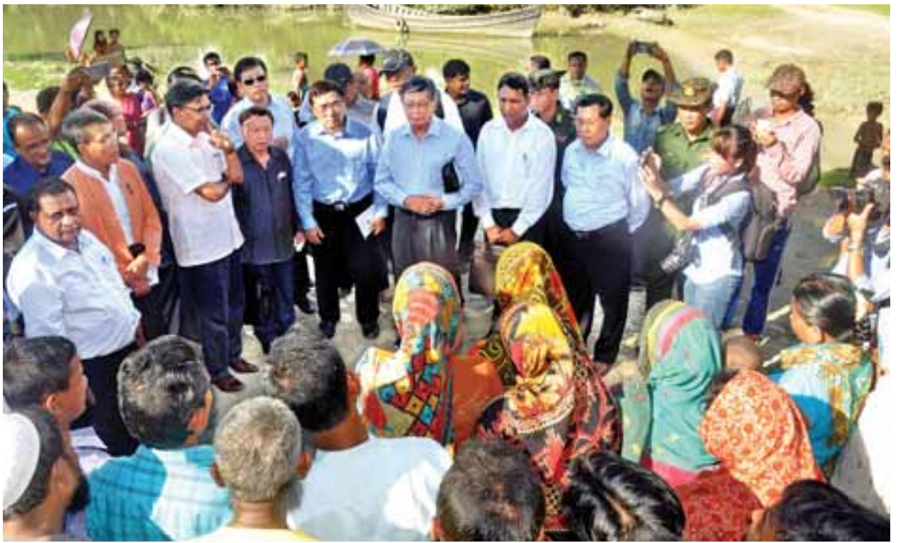
ပြည်ထောင်စုဝန်ကြီးများ၊ သံအမတ်ကြီးများနှင့် သံတမန်များ မောင်တောမြို့နယ် ငါးခူကျေးရွာမှ ကျေးရွာသူ ကျေးရွာသားများနှင့် ရင်းရင်းနှီးနှီးတွေ့ဆုံစဉ်။

အဆိုပါ ဘင်္ဂလားဒေ့ရှ်နိုင်ငံသို့ သွားရောက်ရန် စုဝေးရောက်ရှိနေသည့် အစွလားဘာသာဝင်များနှင့် တွေ့ဆုံစဉ် ပြည်ထောင်စုဝန်ကြီး ဦးကျော်တင့်ဆွေ က စက်တင်ဘာ ၅ ရက်မှစတင်၍ နယ်မြေရှင်းလင်းရေးလုပ်ငန်းများကို တပ်မတော်မှ ဆောင်ရွက်ခြင်း လုံးဝမရှိပါကြောင်း၊ သို့ရာတွင် တစ်ဖက်နိုင်ငံ သို့ ယခုအချိန်ထိ သွားရောက်နေသော သတင်းများကြားသိရ၍ ယခုကဲ့သို့ လာရောက်တွေ့ဆုံခြင်းဖြစ်ကြောင်း၊ အစွလားဘာသာဝင်များအနေဖြင့် မိမိတို့ ကျေးရွာ၊ မိမိတို့ နေရာများတွင်ပင် ပြန်လည်နေထိုင်ကြစေလိုကြောင်း၊ လိုအပ်သည့် စားနပ်ရိက္ခာနှင့် လူသားချင်း စာနာထောက်ထားမှုအကူအညီများ ပေးအပ်ဖြည့်ဆည်းဆောင်ရွက်သွားမည်ဖြစ်သလို ဘေးကင်းလုံခြုံစိတ်အေး