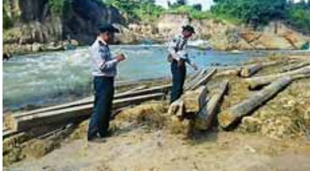
တန် စုစုပေါင်း (၄ ဒသမ ၀၅၉) ဒေသခံတစ်ဦးက ပြောသည်။ တန်အား သိမ်းဆည်းရမိခဲ့သည်။ ထိုအတူ ယင်းနေ့နံနက် ၇ နာရီ ခန့်က သာဂရ-ကိုးပင်ရိုးမမြတ်ကျော် ကားလမ်း မိုင်တိုင်အမှတ် ခြောက်မိုင် သုံးဖာလုံအနီး၌ တရားမဝင်ကျွန်းသစ် ခွဲသား ၁၅ ချောင်း (သုည ဒသမ ၃၇၆) တန် တင်ဆောင်လာသော ဆိုင်ကယ်နှစ်စီးအား သိမ်းဆည်းရမိ ခဲ့ကြောင်း သိရသည်။ ကိုလွင်(ဆွာ)

ချောင်းအတွင်း တွေ့ရှိရသည့် သစ်ဖောင်အား ရှာဖွေစစ်ဆေးခဲ့ရာ ကျွန်းသစ်ခွဲသားဆိုင်စုံ ၆၁ ချောင်း(၂ ဒသမ ၉၉၉၆)တန်၊ အရှည် ကိုးပေရှိ ကျွန်းသစ် ၁၉ လုံး(၁ ဒသမ ၀၅၉၄)