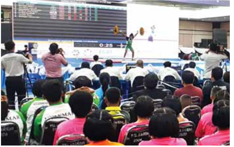
ပထမအကြိမ် ထိုင်းဘုရင့်ဖလား နိုင်ငံတကာအလေးမပြိုင်ပွဲ ယှဉ်ပြိုင်နေမှုကို တွေ့ရစဉ်။