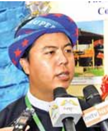
ဦးကျော်မင်းထင်

အိမ်သာစနစ်တွေ စသည်ဖြင့် လိုအပ်နေတာတွေ ရှိနေပါသေးတယ်။ ဒီလို လိုအပ်ချက်တွေကို ဒီနေ့လို အခမ်း အနားတွေမှာ တင်ပြခွင့်ရတဲ့အတွက် ကျေးဇူး တင်ပါတယ်။ ခရီးသွားကဏ္ဍတိုးတက်ဖို့ အတွက် နိုင်ငံတကာဈေးကွက်နဲ့ ယှဉ်ပြိုင် နိုင်စွမ်းရှိအောင် ကျွန်မတို့နိုင်ငံက ကြိုးစား ရဦးမှာဖြစ်ပါတယ်။ ခရီးသွားကဏ္ဍက နိုင်ငံသား အားလုံးနဲ့ သက်ဆိုင်ပါတယ်။ နိုင်ငံတော်ရဲ့ ပံ့ပိုးမှုနဲ့အတူ ရှေ့ဆက်ပြီး တိုးတက်အောင် ဆောင်ရွက်သွားကြရမှာ ဖြစ်ပါတယ်။