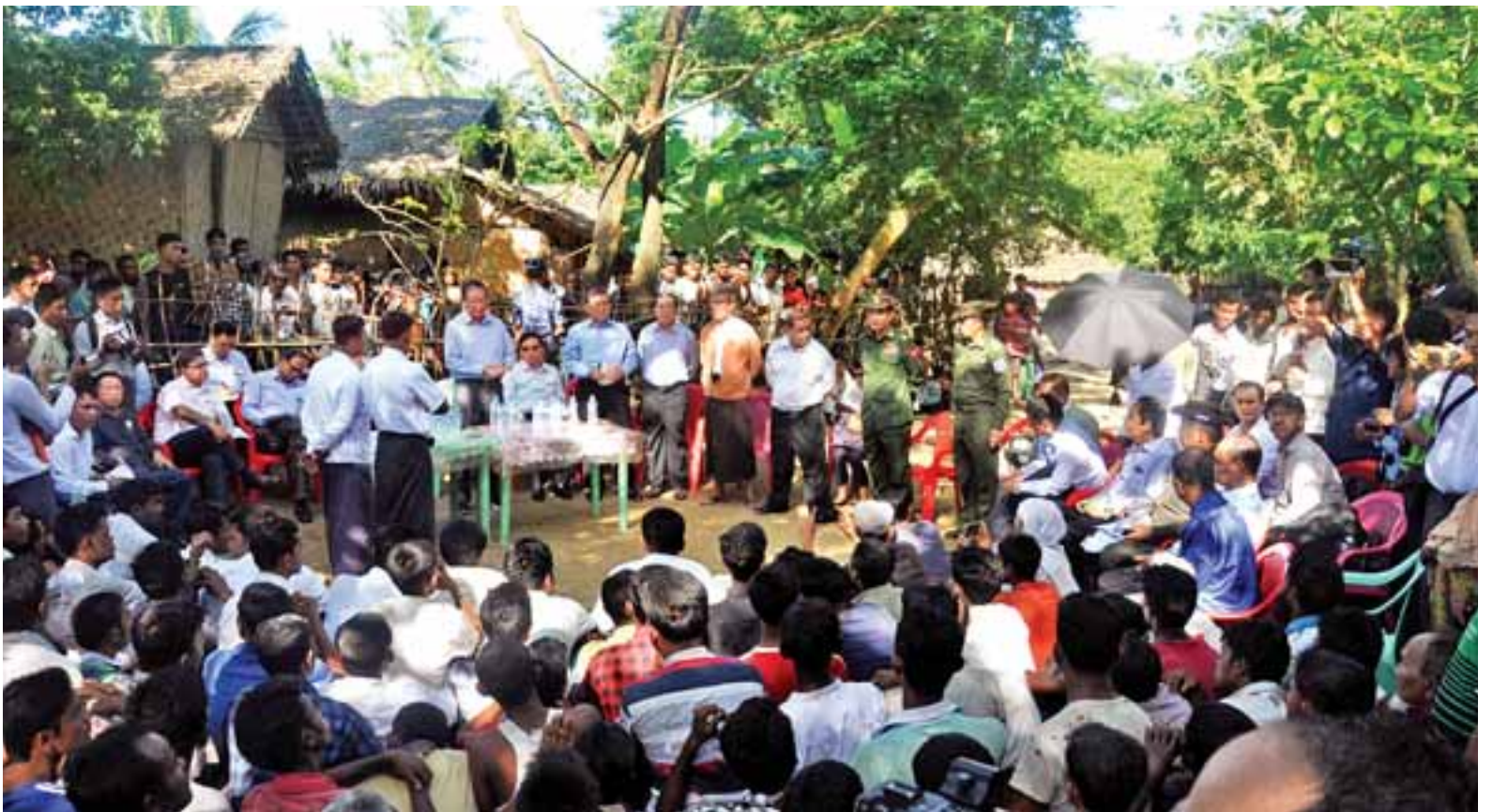
ပြည်ထောင်စုဝန်ကြီးများနှင့်အဖွဲ့ ရသေ့တောင်မြို့နယ် အနောက်ပြင်ကျေးရွာမှ ကျေးရွာသူ ကျေးရွာသားများနှင့် ရင်းရင်းနှီးနှီးတွေ့ဆုံစဉ်။