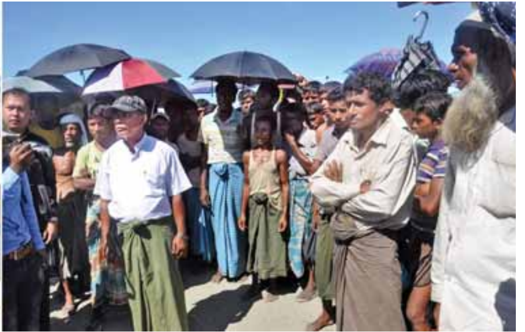
ပြည်ထောင်စုဝန်ကြီးများ၊ သံအမတ်ကြီးများနှင့် သံတမန်များ မောင်တောမြို့နယ် လေယာဉ်ပျံကွင်းကျေးရွာမှ အစွလားဘာသာဝင်များနှင့် ရင်းရင်းနှီးနှီးတွေ့ဆုံစဉ်။