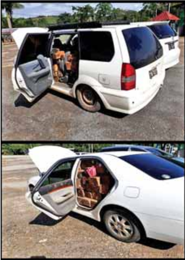
တရားမဝင်စာရွက်စာတမ်း အထောက်အထားတစ်စုံတစ်ရာတင်ပြနိုင် ခြင်းမရှိသည့် ပိတောက်ဓားရွှေသစ်နှင့် ပစ္စည်းသယ်ဆောင်သည့်ယာဉ်။