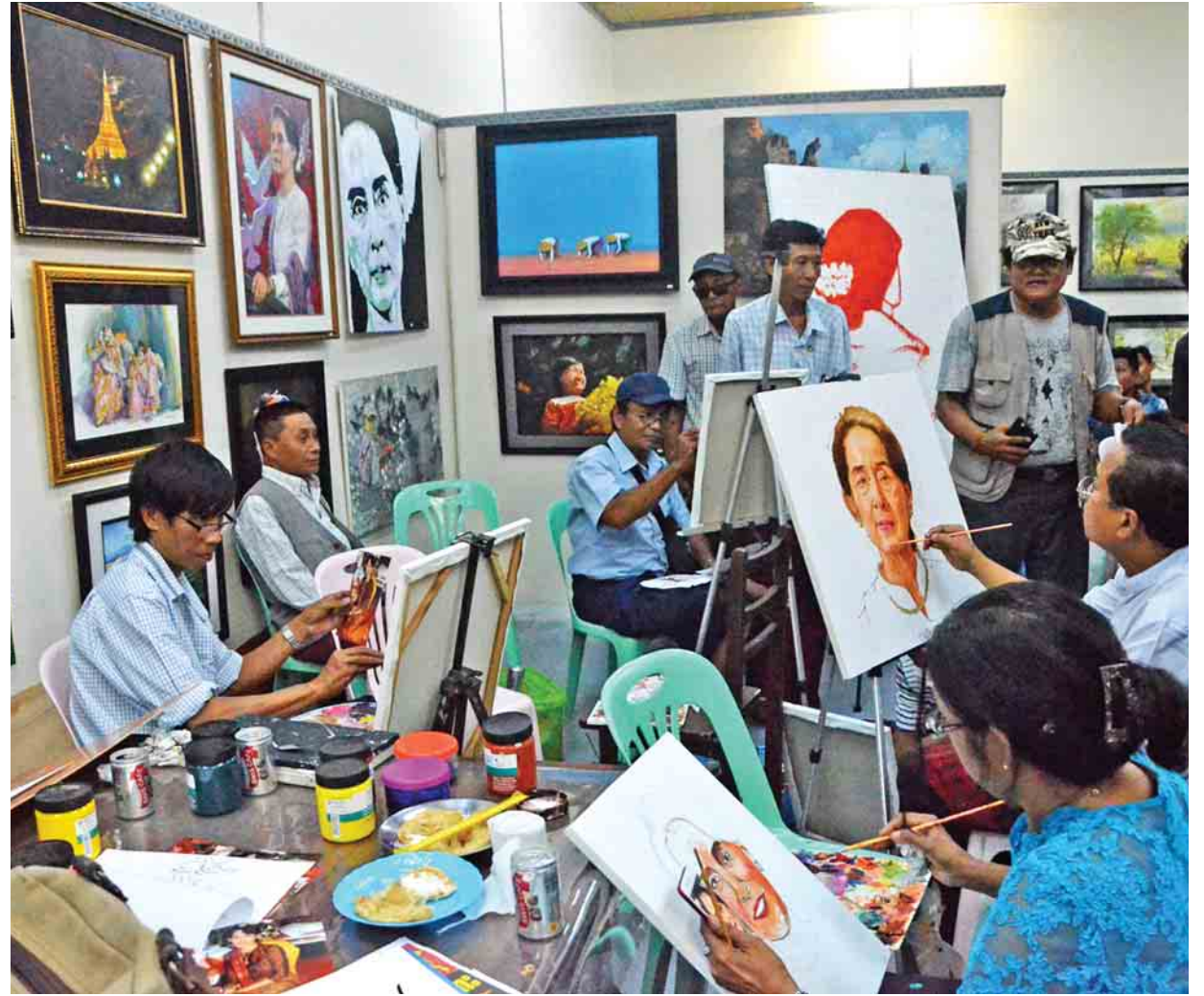
နိုင်ငံတော်၏အတိုင်ပင်ခံပုဂ္ဂိုလ်၏ ပုံတူပန်းချီကားများကို ပန်းချီ၊ ပန်းပုပညာရှင်များက အမှတ်တရရေးဆွဲကြစဉ်။

ရန်ကုန် အောက်တိုဘာ ၈ နိုင်ငံတော်၏ အတိုင်ပင်ခံပုဂ္ဂိုလ် ဒေါ်အောင်ဆန်းစုကြည်၏ ငြိမ်းချမ်းရေးလုပ်ငန်းစဉ်များ ဖော်ဆောင်နေမှုအပေါ် ထောက်ခံကြိုဆိုသည့်အနေဖြင့် ယနေ့နံနက်ပိုင်းက ရန်ကုန်မြို့ ပန်းဘဲတန်းမြို့နယ် ဗိုလ်ချုပ်အောင်ဆန်းဈေးရှိ မြန်မာနိုင်ငံ ပန်းချီ၊ ပန်းပု အစည်းအရုံး(ဗဟို) ပြခန်း၌ ပန်းချီ၊ ပန်းပုပညာရှင်များက နိုင်ငံတော်၏ အတိုင်ပင်ခံပုဂ္ဂိုလ်၏ ပုံတူပန်းချီကားများကို အမှတ်တရရေးဆွဲကြသည်။ “အမေ ဒေါ်အောင်ဆန်းစုကြည် လျှောက်လှမ်းနေတဲ့ ငြိမ်းချမ်းရေးခရီးစဉ်ကို ကြိုဆိုထောက်ခံတယ်။ နောက်တစ်ချက်ကတော့ အောက်စဖို့ဒ်တက္ကသိုလ်မှာရှိတဲ့ အမေရိကန်အဖွဲ့ကို ဖယ်ရှားခံရတယ်။ ဒီလိုဖယ်ရှားခံရတာဟာ ကျွန်တော်တို့လို ပန်းချီအနုပညာရှင်တွေအနေနဲ့ တိုက်ရိုက်ပတ်သက်တယ်လို့ ယူဆတယ်။ ကျွန်တော်တို့ ရင်ထဲမှာရှိတဲ့ အမေအပေါ် ယုံကြည်မှုကိုတော့ ဖယ်ရှားလို့မရပါဘူး။ အမေ ဒေါ်အောင်ဆန်းစုကြည်နဲ့ ပတ်သက်ပြီး တစ်ပြည်လုံးမှာလည်း ထောက်ခံပွဲတွေလုပ်နေကြတယ်။ ဒါ့ကြောင့် ကျွန်တော်တို့တွေကလည်း အမေကိုထောက်ခံတဲ့အနေနဲ့ အမေနဲ့ အတူရှိနေတယ်ဆိုတာကို ပြသချင်လို့ အခုလို လုပ်ဖြစ်ခဲ့တာပါ”ဟု မြန်မာနိုင်ငံ ပန်းချီ၊ ပန်းပု အစည်းအရုံး(ဗဟို)မှ ဘဏ္ဍာရေးမှူး ဦးနေအောင်ရှုက ပြောသည်။ အဆိုပါပွဲကို မြန်မာနိုင်ငံ ပန်းချီ၊ ပန်းပု အစည်းအရုံး(ဗဟို)က ကြီးမှူး၍ အနုပညာလှုပ်ရှားမှုအနေဖြင့် ကျင်းပခြင်းဖြစ်သည်။ နိုင်ငံတော်၏ အတိုင်ပင်ခံပုဂ္ဂိုလ် ဒေါ်အောင်ဆန်းစုကြည်၏ ပုံတူပန်းချီကားများကို ပန်းချီ၊ ပန်းပု ပညာရှင် ၁၀၀ ခန့်က နံနက် ၁၀ နာရီမှ စာမျက်နှာ ၁၂ ကော်လံ ၁ သို့ *