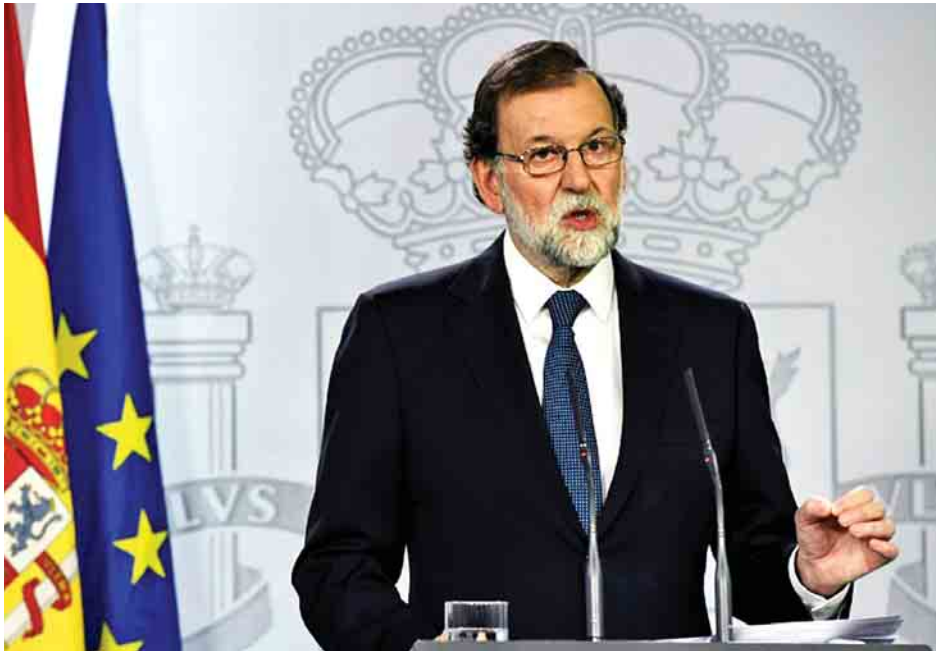
စပိန်ဝန်ကြီးချုပ် မာရီယာနိုရေဂွီယေး။

ကာတာလိုနီးယားဒေသအရေးနှင့် ပတ်သက်၍ ဖွဲ့စည်းပုံအခြေခံဥပဒေပါ လုပ်ပိုင်ခွင့်အာဏာများကို ကျင့်သုံးနိုင်ဖွယ် ရှိ မရှိ သတင်းထောက်က မေးမြန်းရာတွင် ဝန်ကြီးချုပ် ရေဂွီယေးက ယင်းသို့ပြောကြားခြင်းဖြစ်သည်။ အောက်တိုဘာ ၁ ရက်တွင် ကာတာလိုနီးယားပြည်သူ့ဆန္ဒခံယူပွဲကျင်းပခဲ့ချိန်နောက်ပိုင်း ဝန်ကြီးချုပ် ရေဂွီယေးက ပထမဆုံးအကြိမ်အထင်ကရသတင်းစာကြီး တစ်စောင်၏ လူတွေ့မေးမြန်းခန်းတွင် ထုတ်ဖော်ပြောကြားခြင်းဖြစ်သည်။ ကာတာလိုနီးယားဒေသသည် လွတ်လပ်ရေးကြေညာရန် ဦးတည်လှုပ်ရှားရာမှ ဖြစ်ပေါ်လာရသည့် နိုင်ငံရေးအကျပ်အတည်းကို စေ့စပ်ဆွေးနွေးဖြေရှင်းရန် တောင်းဆိုမှုများ ပေါ်ထွက်လာခဲ့ပြီး ဘာစီလိုနာနှင့် မက်ဒရစ်မြို့များ၌ ခွဲထွက်မှုကို ဆန့်ကျင်သော ဆန္ဒပြပွဲများဖြစ်ပွားခဲ့သည်။ တစ်ဖက်သတ်လွတ်လပ်ရေးကြေညာခြင်းကို ပြန်လည်ရုပ်သိမ်းရန် အချိန်ရှိနေဆဲဖြစ်ကြောင်း၊ မက်ဒရစ်ရှိ ဗဟိုအစိုးရအဖွဲ့၏ ပြင်းထန်သောတုံ့ပြန်မှုဖြစ်ပေါ်လာခြင်း မရှိစေရန် ကာတာလိုနီးယားခေါင်းဆောင်များက ရှောင်ရှားကြစေလိုကြောင်း လူတွေ့မေးမြန်းခန်းတွင် ဝန်ကြီးချုပ်