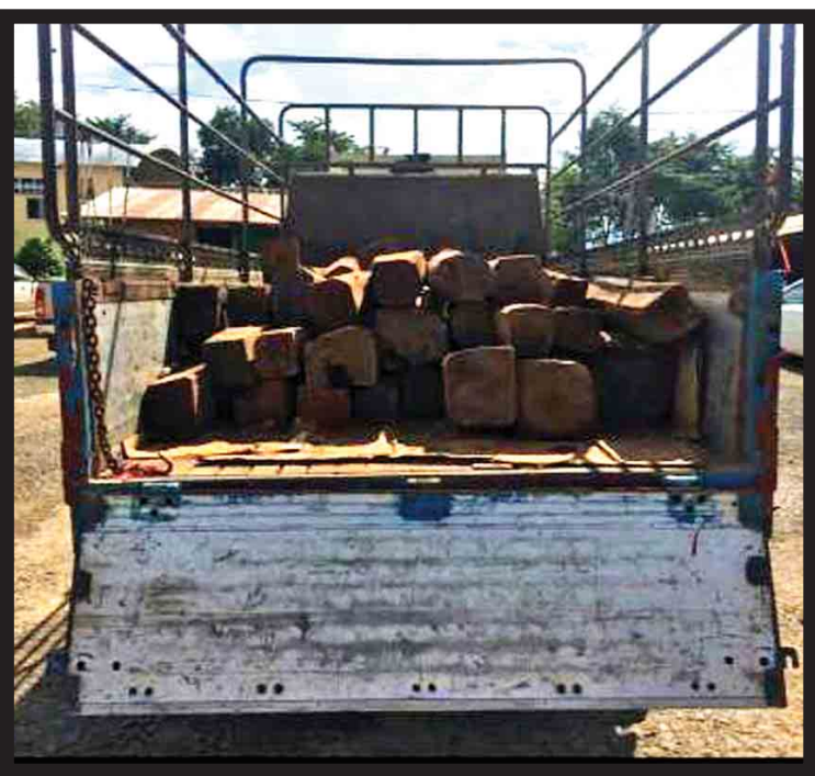
တရားဝင်စာရွက်စာတမ်း အထောက်အထားတစ်စုံတစ်ရာ တင်ပြနိုင်ခြင်းမရှိသည့် ရင်းတိုက်သစ်နှင့် ပစ္စည်းသယ်ဆောင်သည့်ယာဉ်။

နေပြည်တော် အောက်တိုဘာ ၈ တရားမဝင်ကုန်စည်များ တားဆီးထိန်းချုပ် ရေးအတွက် ရေပူနှင့် မရမ်းချောင်း အမြဲ တမ်းစစ်ဆေးရေးစခန်းတို့ကို ဌာနဆိုင်ရာ ပူးပေါင်းအဖွဲ့များဖြင့် မတ် ၁ ရက်တွင် စတင် ဖွင့်လှစ်ဆောင်ရွက်ခဲ့ပြီး အောက်တိုဘာ ၇ ရက်တွင် မန္တလေး-မုဆယ် ပြည်ထောင်စု လမ်းမကြီးတစ်လျှောက် ကုန်သွယ်မှုယာဉ် ပို့ကုန် ၃၆၇ စီး၊ သွင်းကုန် ၃၇၅ စီး၊ ရန်ကုန်- မြဝတီလမ်းမကြီးတစ်လျှောက် ကုန်သွယ်မှု ယာဉ် ပို့ကုန် ၄၅ စီး၊ သွင်းကုန် ၁၂၈စီး ကုန်စည်များ သယ်ယူပို့ဆောင်လျက်ရှိသည်။ အဆိုပါ စစ်ဆေးရေးစခန်းများက တင်သွင်း/တင်ပို့သော ကုန်ပစ္စည်းများကို စစ်ဆေးမှုပြုလုပ် ဆောင်ရွက်လျက်ရှိရာ အောက်တိုဘာ ၇ ရက်တွင် ရေပူအမြဲတမ်း စစ်ဆေးရေးစခန်းက တားဆီးမှု လေးမှု (ခန့်မှန်းတန်ဖိုးငွေကျပ် ၂၆ ဒသမ ၃၃၈ သန်း ခန့်)၊ မရမ်းချောင်းအမြဲတမ်းစစ်ဆေးရေးစခန်း က တားဆီးမှု သုံးမှု (ခန့်မှန်းတန်ဖိုးငွေကျပ် ၁ ဒသမ ၇၂၁ သန်းခန့်) စုစုပေါင်းတားဆီးမှု ခန့်မှန်းတန်ဖိုးငွေကျပ် ၂၈ ဒသမ ၀၅၀ သန်းခန့်) သိမ်းဆည်းရမိကြောင်း သိရ သည်။ ထူးခြားသိမ်းဆည်းမှုအနေဖြင့် အောက်တို ဘာ ၇ ရက်တွင် သတင်းအရ မုဆယ်သို့ သွားရောက်မည့်ယာဉ်များကို ရေပူအမြဲတမ်း စစ်ဆေးရေးစခန်း ပူးပေါင်းစစ်ဆေးရေးအဖွဲ့က