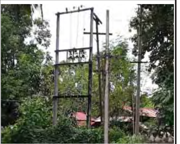
မော်လမြိုင်မြို့ တောင်ပိုင်းရပ်ကွက် ကုသိနာရုံဘုရားဝင်းအတွင်းရှိ အများပြည်သူသုံး ထရန်စဖော်မာတစ်လုံးတွင် ချွန်နယ်ပိတ်ပေါင်းများ ဖုံးအုပ်လျက်ရှိသည်ကို အောက်တိုဘာ ၃ ရက်က မြင်တွေ့ရစဉ်။

မြစ်ရေအခြေအနေ ဧရာဝတီမြစ်ရေသည် အောက်တိုဘာလ ဒုတိယ ၁၀ ရက်ပတ်အတွင်း မြစ်ကြီးနားမြို့၊ ဇနီးမော်မြို့၊ ရွှေကျမြို့၊ ကသာမြို့၊ သပိတ်ကျင်းမြို့၊ မန္တလေးမြို့၊ စစ်ကိုင်းမြို့၊ မြင်းမူမြို့၊ ပခုက္ကူမြို့နှင့် ညောင်ဦးမြို့တို့တွင် တစ်ပေမှ သုံးပေခန့်