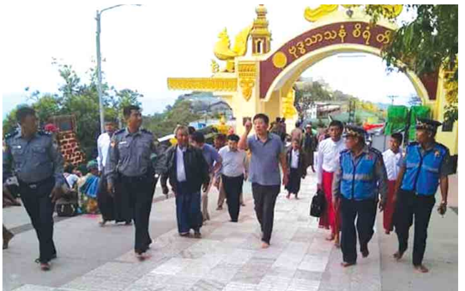
မြန်မာနိုင်ငံဆိုင်ရာ တရုတ်သံအမတ်ကြီးနှင့် သံရုံးမိသားစုဝင်များ ကျိုက်ထီးရိုးစေတီတော်မြတ်ကြီးအား ဖူးမြော်ကြည်ညိုကာ အလှူငွေများပေးအပ်လှူဒါန်း