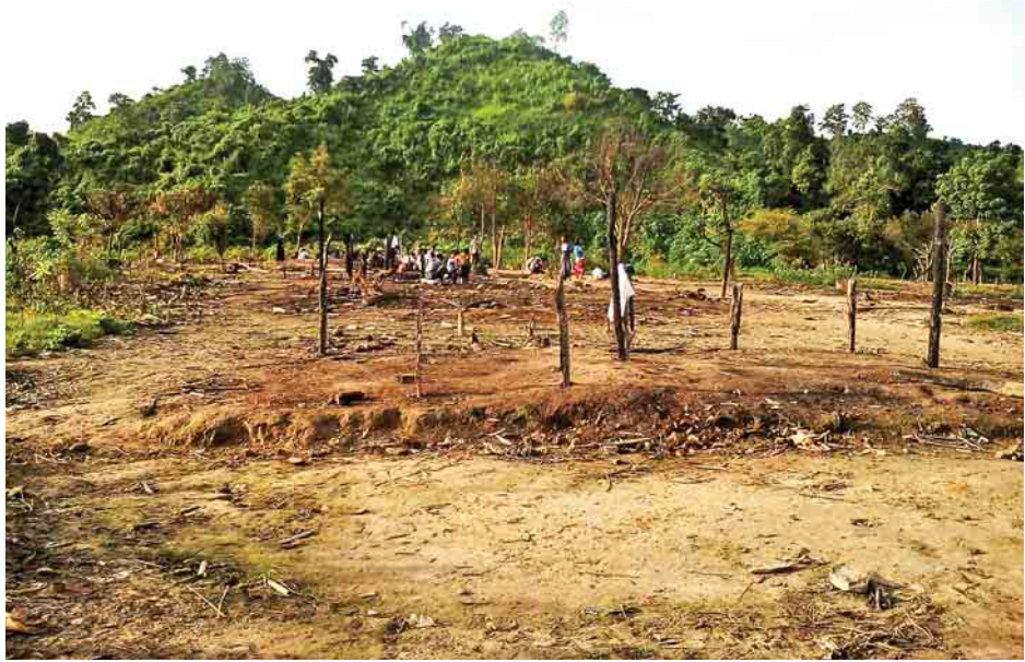
ARSA အစွန်းရောက်အကြမ်းဖက်သမားများ၏ မီးရှို့ဖျက်ဆီးခံရသည့် ခုံတိုင်ကျေးရွာ။

(သတင်းအောင်းပါး - သီသီမင်း၊ မင်းသစ်(MNA))