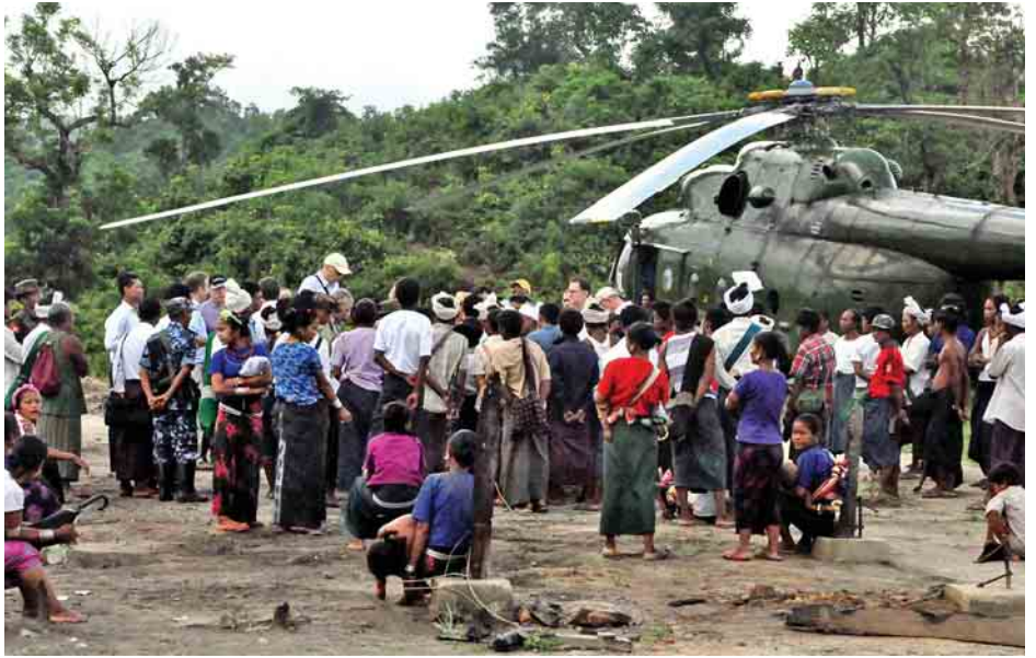
သံတမန်များ၊ UNRC၊ UNHCR၊ WFP၊ World Bank(Myanmar)၊ UNODC မှ တာဝန်ရှိသူများက ခုံတိုင်ကျေးရွာမှ ရွာသူ ရွာသားများနှင့် အောက်တိုဘာ ၂ ရက်က တွေ့ဆုံမေးမြန်းစဉ်။

ပန်စေ(မြို့)ရွာမှာ ရက်ပေါင်း ၂၀ ခန့် ပုန်းခိုနေထိုင်ခဲ့ ရပြီး စက်တင်ဘာ ၁၇ ရက်မှ မောင်တောမြို့နယ် ကြိမ်ချောင်းကျေးရွာအုပ်စု လောင်းခုံကျေးရွာကို ရောက်ရှိ