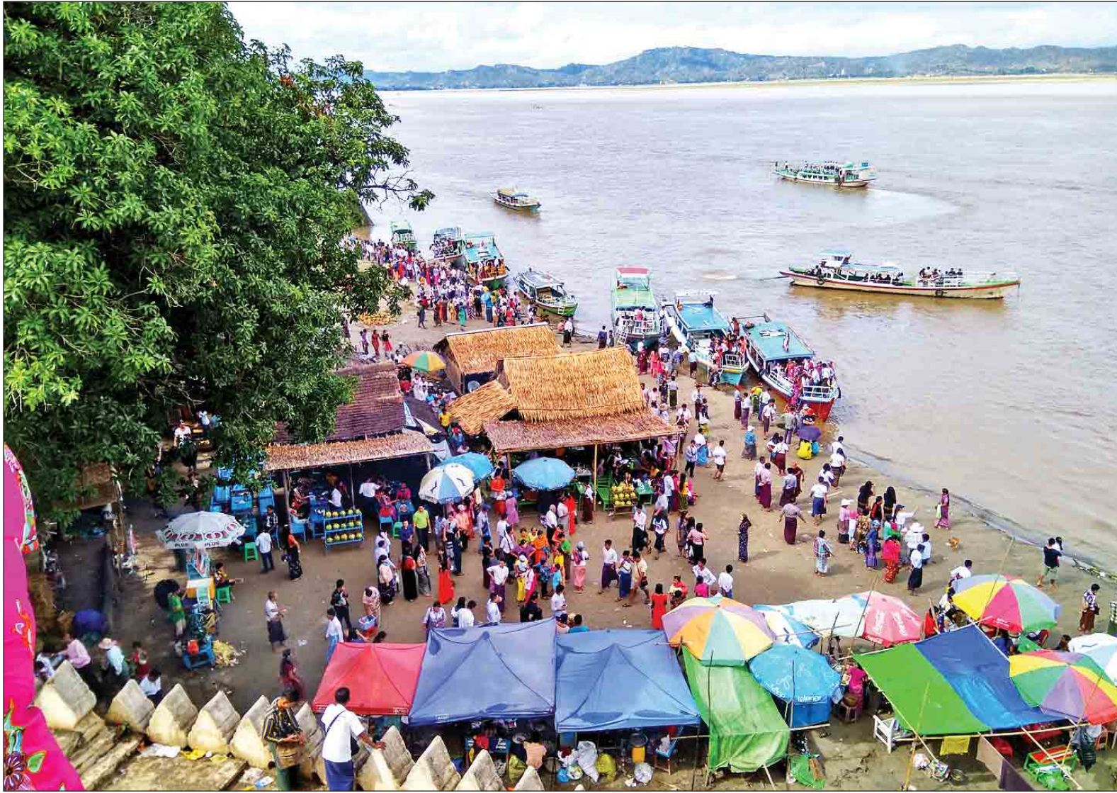
ဗူးဘုရားလှေဆိပ်မြင်ကွင်းကို တွေ့ရစဉ်။

ညောင်ဦး အောက်တိုဘာ ၈ ယခုနှစ် သီတင်းကျွတ်ပိတ်ရက် ငါးရက်တာကာလတွင် ပုဂံရှေးဟောင်းယဉ်ကျေးမှုနယ်မြေရှိ စွယ်တော်လေးဆူနှင့် ဘုရားပုထိုးများတွင် ပြည်တွင်းဘုရားပူဇော်များဖြင့် အထူးစည်ကားများပြားခဲ့ပြီး ယခင်နှစ်များထက် စံချိန်တင်များပြားခဲ့ကြောင်း ဟိုတယ်နှင့် ခရီးသွားဝန်ဆောင်မှုလုပ်ငန်းများမှ တာဝန်ရှိသူများနှင့် ပုဂံဒေသခံများက ပြောသည်။ သီတင်းကျွတ်ကာလသည် နှစ်စဉ် ဘုရားပူဇော်များပြုလေ့ရှိသည့် ကာလဖြစ်သော်လည်း ယခုနှစ်တွင် တရားဝင်ရုံးပိတ်ရက် သုံးရက်နှင့် စနေ၊ တနင်္ဂနွေဆက်၍ စုစုပေါင်း ငါးရက်တာရရှိခဲ့ခြင်းနှင့်အတူ ပုဂံဒေသသို့ လာရောက်ခဲ့သည့် ပြည်တွင်းခရီးသွားအရေအတွက်မှာ စံချိန်တင်များပြား ခဲ့ခြင်းဖြစ်ကြောင်း ဒေသခံလုပ်ငန်းရှင်များက ပြောသည်။ “အခုနှစ်ကတော့ စံချိန်တင်ပဲပျံ။ ဟိုတယ်တွေ၊ တည်းခိုခန်းတွေ ပြည့်ရုံတင်မဟုတ်ဘူး။ ဘုန်းကြီးကျောင်းတွေလည်း အပြည့်ပဲ။ အခုက ပြည်တွင်းခရီးသွား တအားများတယ်။ နေရာတိုင်း ကားတွေ ပြည့်ကျပ်တဲ့အထိ ဖြစ်နေတယ်။ ဘုရားပူဇော် တအားများတော့ ယာဉ်ကြော်ပိတ်တာကို သေချာလေး စီမံနိုင်ရင် ပိုကောင်းမယ်။ နောက်ပြီး အမှိုက်စွန့်ပစ်မှုတွေ ရောပေါ့။ လူများပြီး အမှိုက်တွေ ပစ်ထားကြတော့ နိုင်ငံခြားသားတွေ စာမျက်နှာ ၁၄ ကော်လံ ၁ သို့ ❖