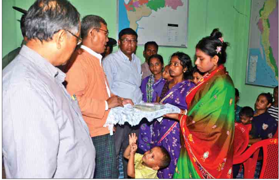
တစ်ဖက်နိုင်ငံသို့ ဖမ်းဆီးခေါ်ဆောင်ခြင်းခံခဲ့ရသည့် ဟိန္ဒူဘာသာဝင် မိသားစုများအတွက် ရခိုင်ပြည်နယ်ဝန်ကြီးချုပ် ဦးညီပု ထောက်ပံ့ငွေများ ပေးအပ်စဉ်။