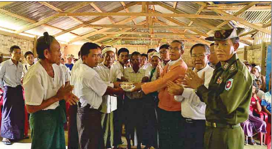
ရခိုင်ပြည်နယ်ဝန်ကြီးချုပ် ဦးညီပုနှင့် ပြည်နယ်အစိုးရအဖွဲ့ဝင်များ မောင်တောဒေသ ဘက်စုံဖွံ့ဖြိုးရေးကွင်းဆင်းခရီးစဉ်အတွင်း ကျေးရွာများမှ မိသားစုဝင်များအတွက် ထောက်ပံ့ငွေများပေးအပ်စဉ်။

ထို့နောက် ရခိုင်ပြည်နယ်ဝန်ကြီးချုပ် ဦးညီပုနှင့် ပြည်နယ်အစိုးရ အဖွဲ့ဝင်များသည် မောင်တောဒေသ ဘက်စုံဖွံ့ဖြိုးရေး၊ စီးပွားရေးအခွင့်အလမ်းများနှင့် ပတ်သက်၍ ယနေ့တွင် တောင်ဘဇာနှင့် ခမောင်းဆိပ် ကျေးရွာများမှ ဒေသခံများအား တွေ့ဆုံအားပေးစကား ပြောကြားရာ နိုင်ငံတော်အစိုးရက ဆောင်ရွက်နေသည့် ကိစ္စရပ်များနှင့် ပတ်သက်၍ ရှင်းလင်းပြောကြားသည်။