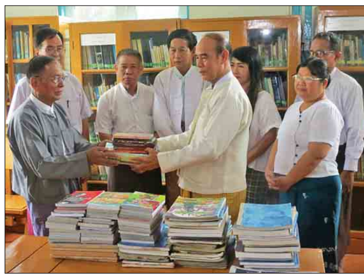
ရွှေပြည်သာ ရွှေရတနာ စာကြည့်တိုက်အတွက် စာအုပ်များလှူဒါန်းနေကြပုံ