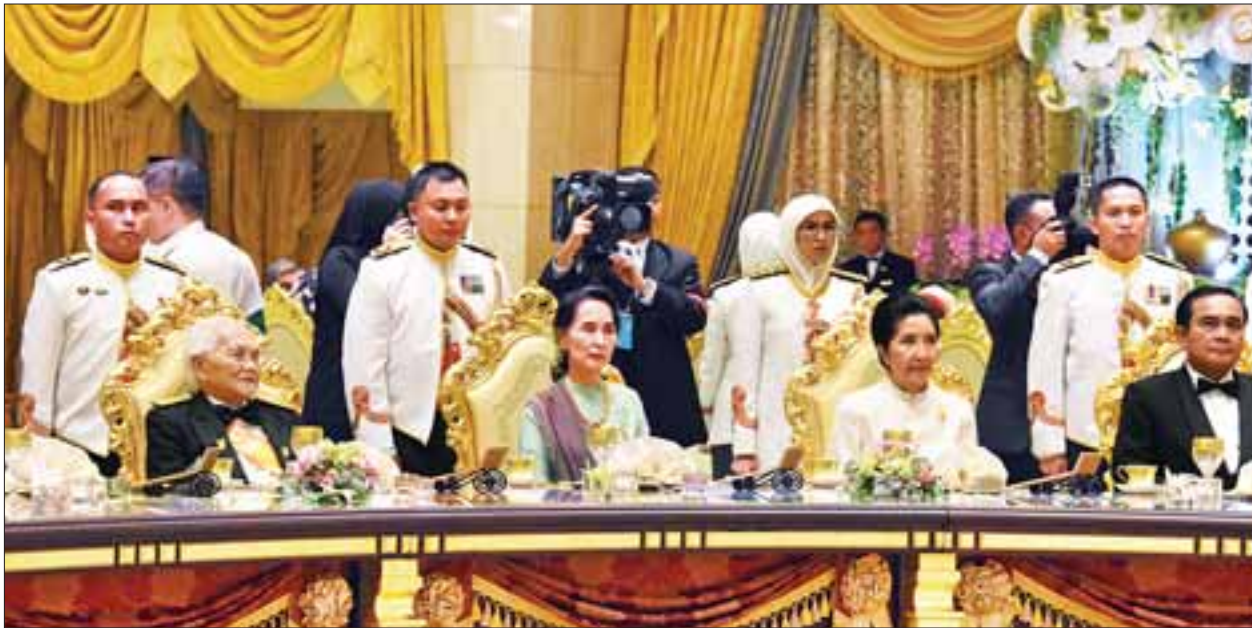
ဘရူနိုင်းဘုရင်မင်းမြတ်၏ နန်းမွေဆက်ခံသည့် နှစ်(၅၀)ပြည့် ရွှေရတုအထိမ်းအမှတ် ဂုဏ်ပြုညစာစားပွဲ အခမ်းအနားသို့ နိုင်ငံတော်၏အတိုင်ပင်ခံပုဂ္ဂိုလ် ဒေါ်အောင်ဆန်းစုကြည် တက်ရောက်စဉ်။