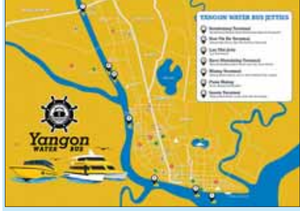
Yangon Water Bus ဆိပ်ခံတံတားများပြ မြေပုံကို တွေ့ရစဉ်။