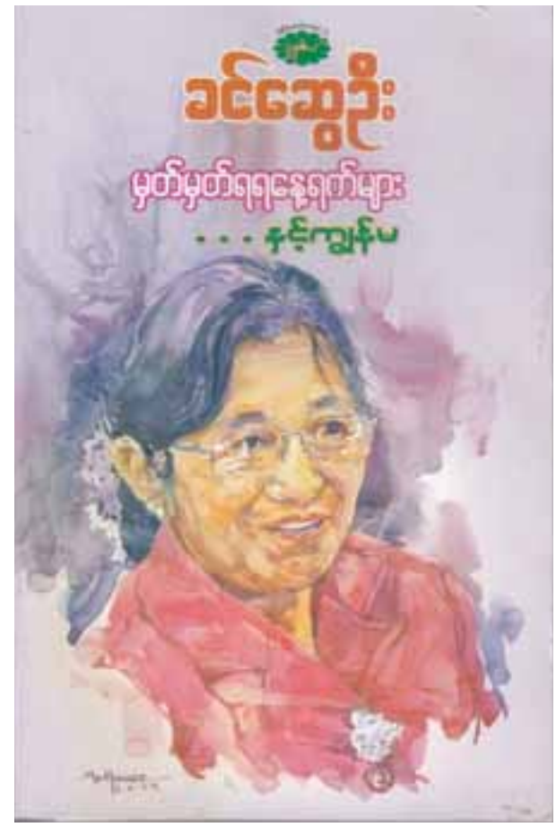
လိုက်တာပါပဲ။ (စာ-၁၅၃)

အသားဖြူဖြူ ထောင်ထောင်မောင်းမောင်း၊ မျက်လုံးမျက်ဖန် ကောင်း ကောင်းနဲ့ လူပုံချောချောနဲ့ ဦးလေးလှဟာ ဦးလေးလှနဲ့ ဂျပန်ဘာသာပြန်ဆိုတဲ့ နှဲ့နဲ့စစ်သား၊ ပန်းနဲ့ စစ်သား၊ ပင်လယ်နဲ့စစ်သား ဝတ္ထုတွေဖတ်ပြီး စာရေးဆရာမ ဖြစ်လာမယ့်သူဆိုတော့ ဘယ်သိဦးမှာလဲ။ ဒီစာတွေဟာ “တို့တိုင်းဌာနီ” ဆိုတဲ့ ဝတ္ထုကို ရင်ထဲမျိုးစေ့ချပေးလိုက်တယ်ဆိုတာ အချိန်ကာလ တစ်ခုမှာ ဆုံးဖြတ်