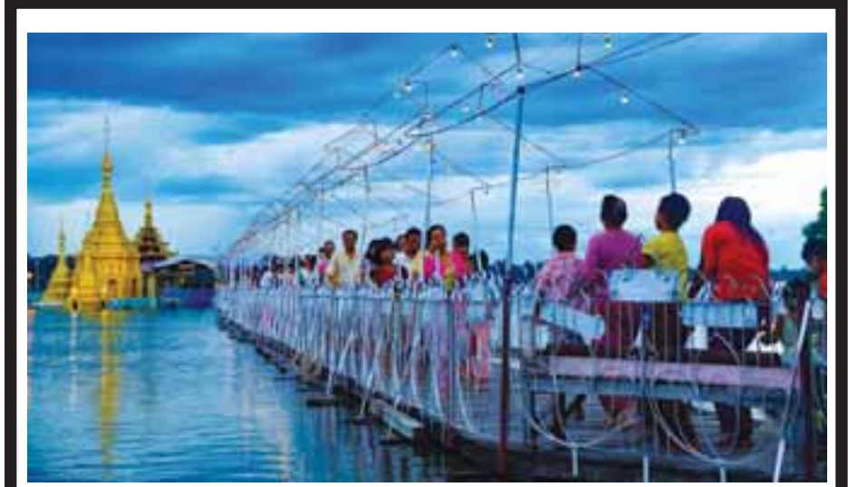
မြန်မာတို့၏ ကောင်းမှုကုသိုလ်ပြုရာ နေ့ထူးနေ့မြတ်ဖြစ်သည့် အောက်တိုဘာ ၅ ရက် (သီတင်းကျွတ်လပြည့်နေ့) က မိတ္ထီလာမြို့ မိုးကောင်းအန္တကုရေလယ်ဘုရားတွင် ဒေသသံဘုရားဖူးလာရောက်သူများဖြင့် စည်ကားခဲ့သည်။

သတင်း-ဓမ္မဗျာ(မကျေး)