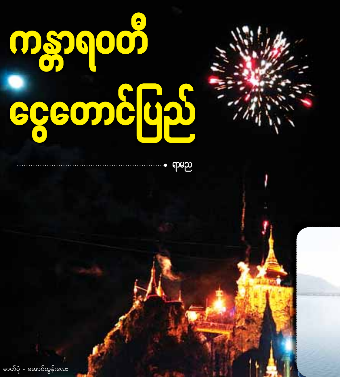
ဓာတ်ပုံ - အောင်ထွန်းလေး

ကန္တာရဝတီ သို့မဟုတ် ဒဏ္ဍာရီထဲမှ ငွေတောင်ပြည်ကြီးရှိရာ ကယားပြည်နယ်သည် ဆန်းကြယ်လှပသည့် ဆင်ယင်ထုံးစံများ၊ ရိုးရှင်းလှသည့် ရိုးရာယဉ်ကျေးမှုဓလေ့များ၊ ထူးခြားသည့် သဘာဝလိုဏ်ဂူ၊ ရေကန်များနှင့် ဒဏ္ဍာရီဖြစ်ရပ်များတည်ရှိရာ အထင်ကရနေရာများကြောင့် ပြည်တွင်းသာမက ကမ္ဘာလှည့်ခရီးသည်များ၏ စိတ်အာရုံကိုဖမ်းစားနေသော စိတ်ဝင်စားစရာဒေသတစ်ခုအဖြစ် ပိုမိုထင်ရှားလာနေပေသည်။