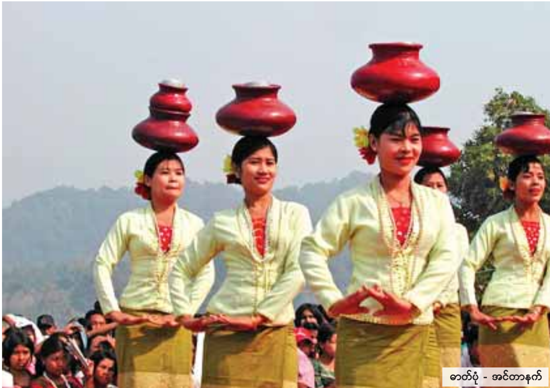
ဓာတ်ပုံ - အင်တာနက်

ထားဝယ်ဒေသရဲ့ ရိုးရာယဉ်ကျေးမှုတွေအနက်က ကျွန်တော်နဲ့ နှစ်ပေါင်းများစွာကတည်းက ရင်းနှီးကျွမ်းဝင်ခဲ့တဲ့ ရိုးရာအကတွေက အခုခရီးစဉ်မှာ ကျွန်တော့်ရဲ့စိတ်အစဉ်ကို လှုပ်ခတ်နှိုးဆွပေးနေတယ်။ စိတ်