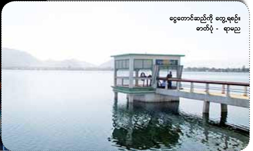
ငွေတောင်ဆည်ကို တွေ့ရစဉ်။