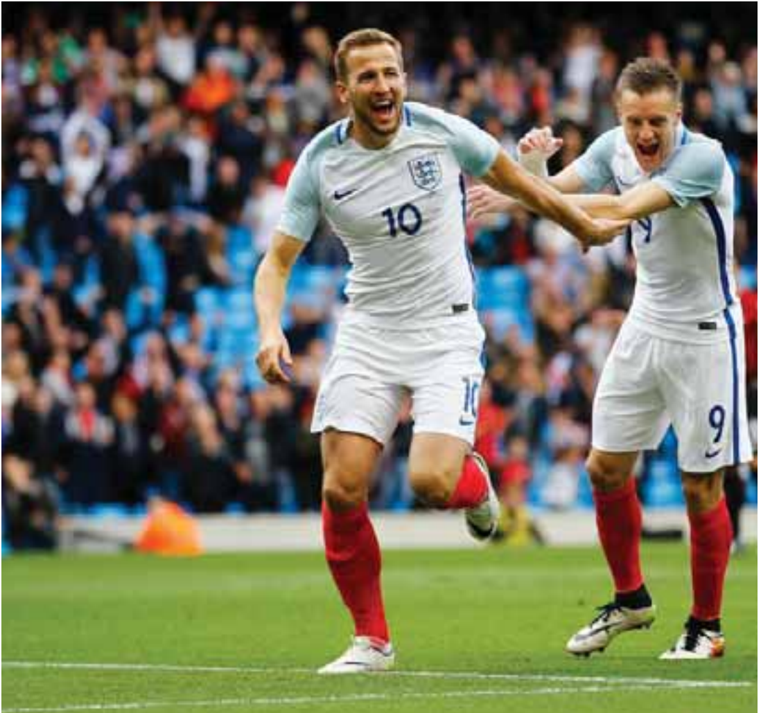
အင်္ဂလန်နှင့် ဆလိုဗေးနီးယား အသင်းပွဲစဉ်တွင် အသင်းခေါင်းဆောင်လက်ပတ်ကို ဆင်မြန်းခွင့် ရခဲ့သလို တစ်လုံးတည်းသော အနိုင်ဂိုးကို သွင်းယူပေးခဲ့ပြီးနောက် သူ၏ငယ်ဘဝ အိပ်မက်များ အကောင်အထည်ပေါ်လာခြင်းပင် ဖြစ်ကြောင်း ဆိုခဲ့သည်။

အင်္ဂလန်အသင်းသည် ဆလိုဗေးနီးယားအသင်းကို တစ်ဂိုး-ဂိုးမရှိဖြင့် အနိုင်ရရှိပြီးနောက် ၂၀၁၈ ကမ္ဘာ့ ဖလားခြေစစ်ပွဲ အောင်မြင်ခဲ့သည်။ လာမည့်နှစ်ဝင်ဘာလအတွင်း ဘရာဇီး၊ ဂျာမနီအသင်းတို့နှင့် ခြေစမ်းသွားမည် ဖြစ်သည်။ အင်္ဂလန်အသင်းသည် ၂၀၁၈ ကမ္ဘာ့ဖလားအတွက် ပြင်ဆင် သည့်အနေဖြင့် ဂျာမနီအသင်းနှင့် နိုဝင်ဘာ ၁၀ ရက်၊ ဘရာဇီးအသင်း နှင့် နိုဝင်ဘာ ၁၄ ရက်တွင် ခြေစမ်း သွားမည်ဖြစ်ကြောင်း အက်ဖ်အေ (အင်္ဂလန်ဘောလုံးအဖွဲ့ချုပ်) က ကြေညာခဲ့သည်။ ဂျာမနီအသင်းသည် မြောက်အိုင် ယာလန်အသင်းကို သုံးဂိုး-တစ်ဂိုးဖြင့် အရေးကွင်းတွင် အနိုင်ရပြီးနောက် ကမ္ဘာ့ဖလားခြေစစ်ပွဲ အောင်မြင်ခဲ့ သလို ဘရာဇီးအသင်းမှာလည်း ၂၀၁၈ ကမ္ဘာ့ဖလားကို အစောဆုံး ခြေစစ်ပွဲအောင်မြင်ထားသည့်အသင်း ဖြစ်သည်။ အင်္ဂလန်နှင့် ဂျာမနီတို့သည် မကြာခင် ခြေစမ်းလေ့ရှိပြီး ယခု ခြေစမ်းပွဲသည် လပေါင်း ၂၀ အတွင်း တတိယအကြိမ် ယှဉ်ပြိုင်မှုလည်း ဖြစ်သည်။ အက်ဖ်အေအနေဖြင့် ၂၀၁၈ ခုနှစ် မတ်လအတွင်း ဟော်လန်အသင်းနှင့် ခြေစမ်းပွဲ ထပ်မံကစားရန် အစီအစဉ်ရှိနေပြီး ကမ္ဘာ့ဖလားမတိုင်မီ ခြေစမ်းပွဲများ တောက်လျှောက် ယှဉ်ပြိုင်သွားမည် ဖြစ်သည်။ တိုက်စစ်မှူး ဟယ်ရီကန်းက