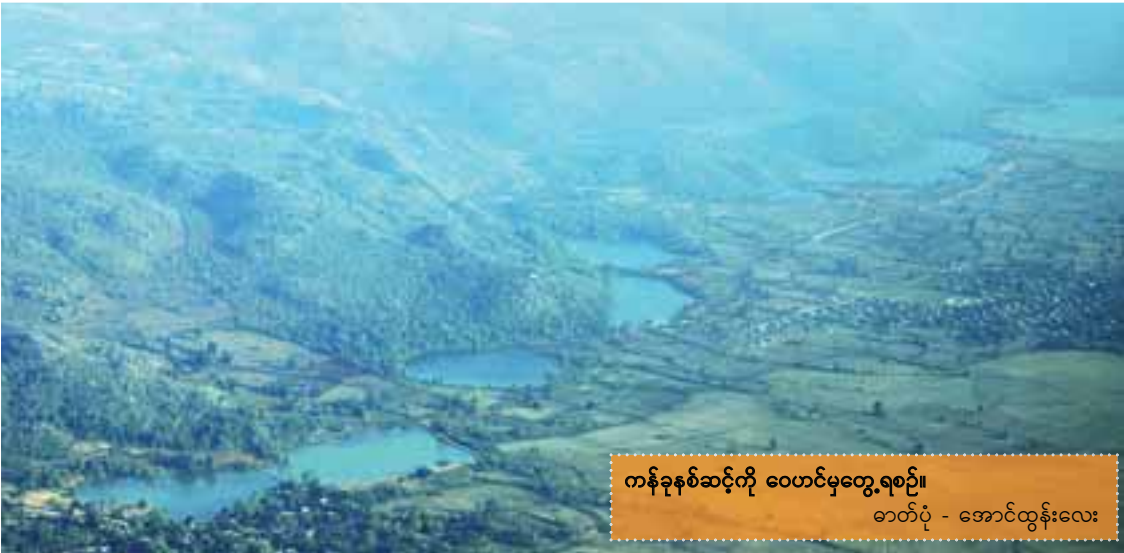
ကန်ခနစ်ဆင့်ကို ဝေဟင်မှတွေ့ရစဉ်။

တာတို့ ဘာတို့ မရှိပါဘူး။ ပုံမှန်ရေအိုးအလုံး အတိုင်းပါပဲ။ ကတဲ့ရေအိုးဆိုပြီး သီးသန့်လုပ် တာလည်း မရှိပါဘူး။ ရေအိုးရွက်ကမယ်သူ တွေဟာ အပျိုဖြစ်ရပါတယ်။ ရေအိုးကို ကြီးစဉ်ငယ်လိုက် ငါးလုံးအထိရွက်ပြီး ကနိုင် တဲ့ သူတွေလည်းရှိခဲ့ပါတယ်။ အခုအခါ သရက်ချောင်းမြို့နယ်မှာ ရေအိုးရွက်ကတဲ့ မိန်းကလေးတွေ အယောက် ၂၀ လောက် ရှိပြီး လက်ရှိကတော့ ၁၅ ဦးနဲ့ ကနေပါတယ်။ အကအဖွဲ့ကတော့ ကျွန်မတို့ရဲ့အဖွဲ့တစ်ဖွဲ့ တည်း ရှိပါတယ်”ဟု ရှင်းပြသည်။ မြန်မာပြည်တောင်ဘက်စွန်းဒေသလေး ဖြစ်သည့် တနင်္သာရီဒေသက ထားဝယ် တိုင်းရင်းသားများ၏ ထူးခြားစိတ်ဝင်စားဖွယ် ရာ ကောင်းသော ရိုးရာအက၊ ရိုးရာအလှတစ်ခု ဖြစ်သည့် သရက်ချောင်းမြို့နယ် ရေအိုးရွက် အကလေးမှာ မျိုးဆက်တစ်ဆက်မှတစ်ဆက် သို့တိုင် လက်ဆင့်ကမ်းသယ်ဆောင်သွား ကြရင်း ရိုးရာအမွေကို ထိန်းသိမ်းကာ ဆက်လက်ရှင်သန်နေဦးမည်ဟု မျှော်လင့် ရင်းဖြင့်... ■