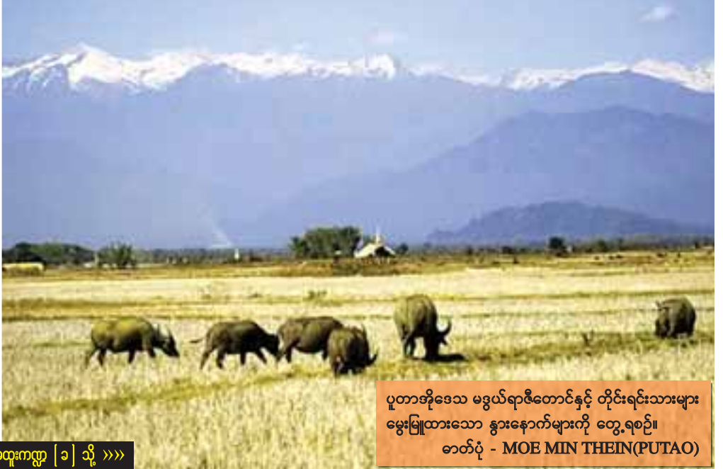
ပူတာအိုဒေသ မဒွယ်ရာဇီတောင်နှင့် တိုင်းရင်းသားများ မွေးမြူထားသော နွားနောက်များကို တွေ့ရစဉ်။

ရဝမ်အိမ်ပုံစံများမှာ ဂျင်းဖော၊ မရူ စသည့်လူမျိုးများကဲ့သို့ အိမ်ရှည်များဖြစ်ပြီး နောက်တစ်မျိုးမှာ တီထွင် ဆန်းသစ်လာသော လေးထောင့်ပုံစံအိမ်ဖြစ်သည်။ ရဝမ်အိမ်များကို မြေပြင်မှ လေးငါးပေမြင့်ထားပြီး အိမ်ရှေ့တွင် ကပြင်ထုတ်ထားသည်။ အိမ်တွင်း၌ အခန်းဖွဲ့ထားပြီး အခန်းတိုင်း၌ မီးဖိုထားသည်။ မီးဖိုတွင်ချက်ပြုတ် စားသောက်ကြပြီး ဧည့်သည်လာလျှင် မီးဖိုဘေး၌ပင် ဧည့်ခံကျွေးမွေး၍ စကားပြောသည်။ ပြတင်းပေါက်မရှိ၍ အိမ်အတွင်း ကျပ်ခိုးများဖြင့် မည်းပြောင်နေသည်။ အိမ်သို့ဝင်လျှင်ဝင်ချင်း ပထမဆုံးအခန်းကို ဧည့်ခန်းအဖြစ် ထားသည်။ ဝင်ပေါက်ကို နေထွက်သောအရှေ့ဘက်သို့သာ မျက်နှာမူသည်။ ရဝမ်အိမ်တိုင်း၌ ဆန်စပါးရိက္ခာများ သိုလှောင်ရန် စပါးကျိတ်များ မနီးမဝေး၌ရှိသည်။ အိမ်တွင် ဝင်းထရဲခတ်ထားသော စိုက်ခင်းလေးများရှိသည်။