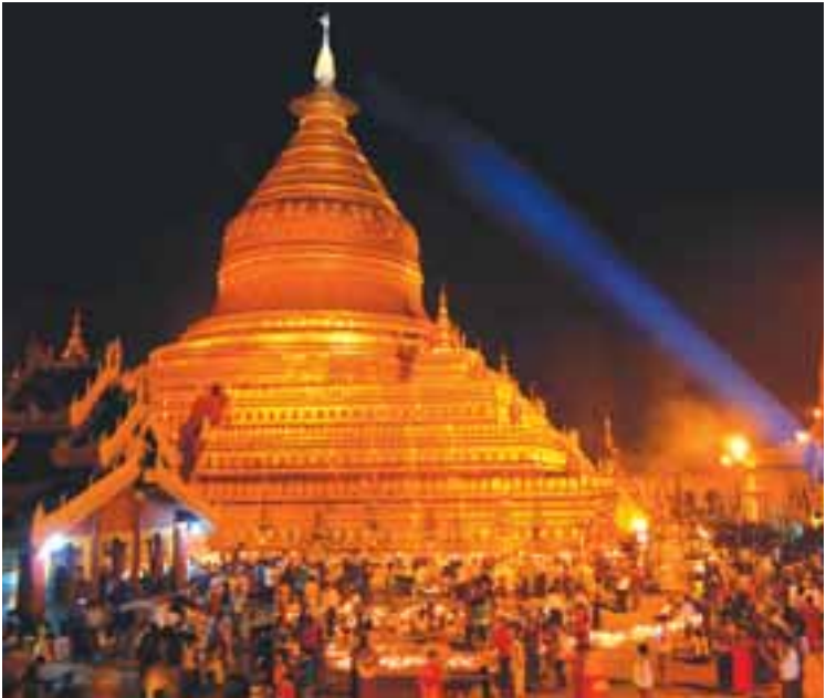
ညောင်ဦးအောင်(ညောင်ဦး) သည့်ဘုရားဖူးတွင် ပြည်တွင်းပြည်ပ ဘုရားဖူးညွှတ်သည့်များ၊ ဒေသခံပြည်သူများ၊ လူမှုရေးအသင်းအဖွဲ့ များက ဆီးမီးများထွန်း ညှို့ပူဇော်လျက်ရှိရာ အထူးစည်ကားနေ ကြောင်း သိရသည်။ ရဲဘူးရောင်(ညောင်ဦး)

ကားပေါ်မှာအိပ်လို့ရတယ်။ ကျွန်ုပ်တို့ မိန်း ကလေးတွေကျတော့ မသင့်တော်ဘူးလေ။ ပုဂံမှာဘုရားဖူးရတာတော့ စိတ်ထဲမှာကြည့်နူး ပျော်ရွှင်မိတယ်။ ဒါကျွန်ုပ်တို့အတွက် အမြတ် ပါပဲ”ဟု ရန်ကုန်မြို့မှ ဘုရားဖူးလာရောက် သည့် နေည်သည်တစ်ဦးက အခက်အခဲကို ပြောပြသည်။ ယင်းသို့ ပြည်တွင်းပြည်ပညွှတ်သည့်အများ အပြားလာရောက်မှုကြောင့် ညောင်ဦးနှင့် ပုဂံမြို့ပေါ်ရှိ စားသောက်ဆိုင်များ၊ မြန်မာမှု အနုပညာလက်ရာပစ္စည်းရောင်းချသူများ၊ အမှတ်တရပစ္စည်းရောင်းချသူဆိုင်များ၊ ရိုးရာအဝတ်အထည်ဆိုင်များ ရောင်းအား ကောင်းလျက်ရှိပြီး ဒေသတွင်းခရီးသွားအဖွဲ့ ယာဉ် အမြန်ယာဉ် ဝန်ဆောင်မှုလုပ်ငန်းလုပ် ကိုင်သူများ၊ စက်ဘီးနှင့် လျှပ်စစ်စက်ဘီး ငှားရမ်းကြသူများ လုပ်ငန်းတွင်ကျယ်လျက်ရှိ