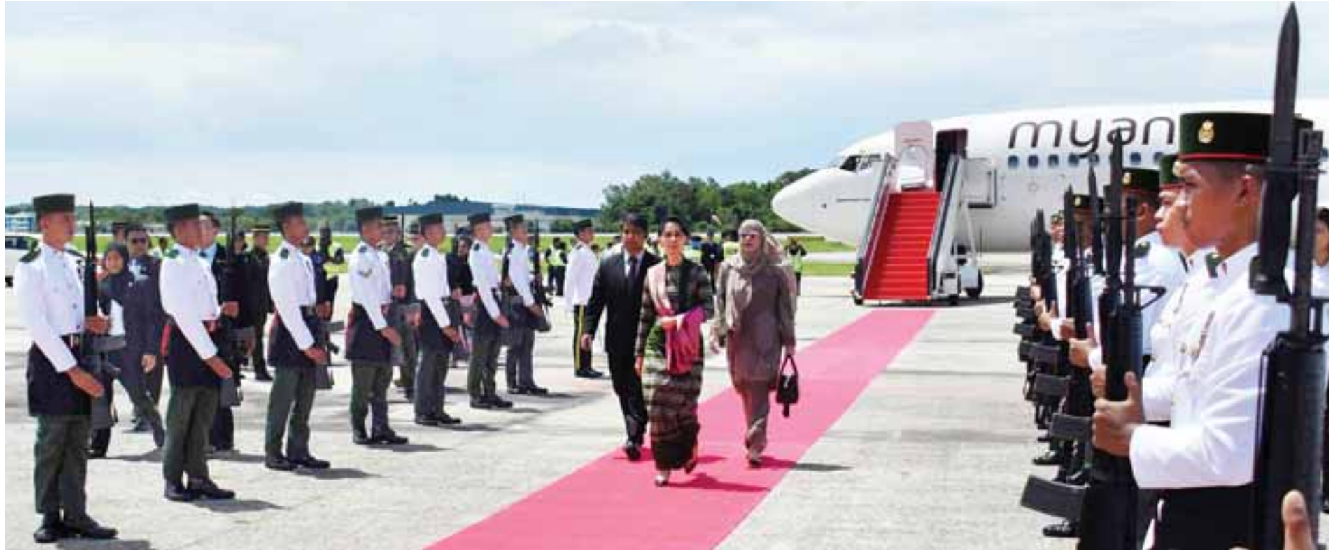
ဘန်ဒါဆရီဘီဂါဝန် အောက်တိုဘာ ၆

ပြည်ထောင်စုသမ္မတမြန်မာနိုင်ငံတော် နိုင်ငံတော်၏အတိုင်ပင်ခံပုဂ္ဂိုလ် ဒေါ်အောင်ဆန်းစုကြည် ဦးဆောင်သည့် မြန်မာကိုယ်စားလှယ်အဖွဲ့သည် ဘရူနိုင်းဒါရူဆလမ်နိုင်ငံ ဘုရင်မင်းမြတ် ဆူလ်တန် ဟာဂျီ ဟာဆာနယ်လ်ဘိုလ်ကီးယား မှအစ ဇာဒင် ဝါဒူလာ၏ နန်းမွေဆက်ခံသည့် နှစ်(၅၀)ပြည့် ရွှေရတုအထိမ်းအမှတ်အခမ်းအနားသို့တက်ရောက်ရန် ယနေ့နံနက် ၈ နာရီတွင် နေပြည်တော်မှ အထူးလေယာဉ်ဖြင့်ထွက်ခွာခဲ့ရာ ဒေသစံတော်ချိန် မွန်းလွဲ ၁ နာရီ ၁၅ မိနစ် တွင် ဘရူနိုင်းဒါရူဆလမ်နိုင်ငံ ဘန်ဒါဆရီဘီဂါဝန်မြို့ အပြည်ပြည်ဆိုင်ရာလေဆိပ်သို့ ရောက်ရှိကြသည်။ (အပေါ်ပုံ) စာမျက်နှာ ၃ ကော်လံ ၅ သို့ *