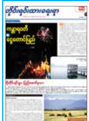
တိုင်းရင်းသားရေးရာအထူးကဏ္ဍ အချုပ်ပို ၄ မျက်နှာ ပါရှိ

ပြည်ထောင်စုသမ္မတမြန်မာနိုင်ငံတော် နိုင်ငံတော်၏အတိုင်ပင်ခံပုဂ္ဂိုလ် ဒေါ်အောင်ဆန်းစုကြည် ဦးဆောင်သည့် မြန်မာကိုယ်စားလှယ်အဖွဲ့သည် ဘရူနိုင်းဒါရူဆလမ်နိုင်ငံ ဘုရင်မင်းမြတ် ဆူလ်တန် ဟာဂျီ ဟာဆာနယ်လ်ဘိုလ်ကီးယား မှအစ ဇာဒင် ဝါဒူလာ၏ နန်းမွေဆက်ခံသည့် နှစ်(၅၀)ပြည့် ရွှေရတုအထိမ်းအမှတ်အခမ်းအနားသို့တက်ရောက်ရန် ယနေ့နံနက် ၈ နာရီတွင် နေပြည်တော်မှ အထူးလေယာဉ်ဖြင့်ထွက်ခွာခဲ့ရာ ဒေသစံတော်ချိန် မွန်းလွဲ ၁ နာရီ ၁၅ မိနစ် တွင် ဘရူနိုင်းဒါရူဆလမ်နိုင်ငံ ဘန်ဒါဆရီဘီဂါဝန်မြို့ အပြည်ပြည်ဆိုင်ရာလေဆိပ်သို့ ရောက်ရှိကြသည်။ (အပေါ်ပုံ) စာမျက်နှာ ၃ ကော်လံ ၅ သို့ *