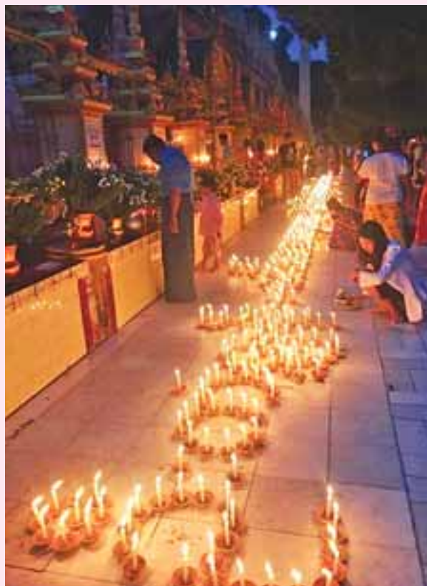
ရန်ကင်းမြို့နယ်ရှိ ဘုရားတော်များကို အလှူအတန်းများ ပြုလုပ်ရာတွင် ဝါဆိုလပြည့်နေ့တွင် ဝါဆိုလပြည့်နေ့တွင် ဝါဆိုလပြည့်နေ့တွင် ဝါဆိုလပြည့်နေ့တွင်