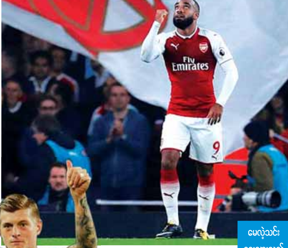
မေလဲ့သင်း ရေးသားသည်

တိုက်စစ်မှူး ပြစ်လားခြင်းအကြောင်းကို ဖွင့်ဟလိုက်တဲ့ လာကာဇက် အာဆင်နယ်တိုက်စစ်မှူး လာကာဇက်က သူဟာ သူ့မိခင်ရဲ့ ဆန္ဒအရ ဂိုးသမားမဖြစ်လာခဲ့ဘဲ တိုက်စစ်မှူး ဖြစ်လာရတာလို့ ဖွင့်ချလိုက်ပါတယ်။ လာကာဇက်က သူဟာ ငယ်ငယ်က ဂိုးသမားအဖြစ် ကစားရတာကို ကြိုက်နှစ်သက်သူဖြစ်ပေမယ့် မိခင်ဖြစ်သူက ဂိုးသမားတစ်ဦးဟာ အန္တရာယ်များတယ်လို့ ယူဆတာကြောင့် တိုက်စစ်( ဒါမှမဟုတ်) အခြားနေရာမှာ ကစားရဖို့ တိုက်တွန်းခဲ့တယ်လို့ ဆိုပါတယ်။ လာကာဇက်က ပြီးခဲ့တဲ့ ဘောလုံးရာသီအတွင်း လိုင်ယွန်အတွက် ပြိုင်ပွဲစုံ ၃၇ ဂိုး သွင်းယူနိုင်ခဲ့ပြီး ဒီလိုမျိုး အလားတူ လုပ်ဆောင်ပြနိုင်ဖို့ အာဆင်နယ် ပရိသတ်တွေက မျှော်လင့်နေကြတာပါ။ လာကာဇက် က ပရီမီယာလိဂ်ဟာ ကြံ့ခိုင်မှု အသားပေးတဲ့လိဂ်ဖြစ်ပြီး အခုအချိန်မှာ ပရီမီယာလိဂ်မှာ ဘယ်လိုကစား ရမယ်ဆိုတာ ပိုပြီး နားလည်လာရပြီလို့ ဆိုပါတယ်။ ဒါ့အပြင် လာကာဇက်က ပြီးခဲ့တဲ့နှစ်ရာသီအတွင်း ပီအက်စ်ဂျီအသင်းနဲ့ ဆွေးနွေးမှုတွေ လုပ်ခဲ့ပေမယ့် ပြင်သစ်လိဂ်မှာ လိုင်ယွန်ကလွဲပြီး ကျန်တဲ့အသင်း အတွက် ကစားပေးဖို့ဆန္ဒမရှိတာကြောင့် အာဆင်နယ်ကိုသာ ရွေးချယ်ခဲ့တာလို့ ဖွင့်ဟခဲ့ပါတယ်။