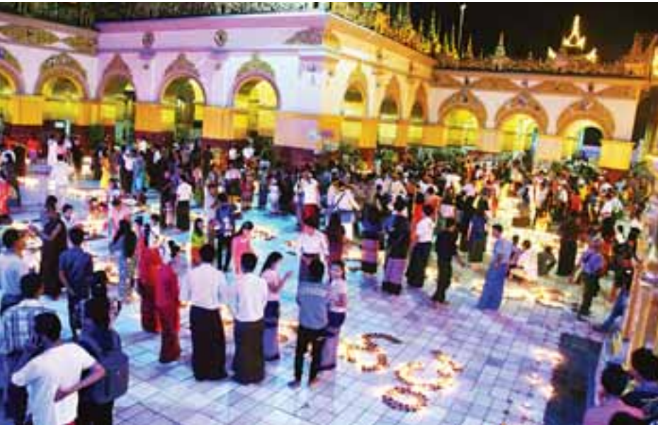
အလှူဒါနပြုသူများနှင့် ပူဇော်ခြင်း၊ ဖယောင်းဆီမီးပူဇော်ခြင်း စသည့် ဒါနကုသိုလ်ပြုသူများဖြင့် ကြက်ပုံမကျစည်ကားလျက်ရှိသည်။ (အပေါ်ပုံ)

ယနေ့သည် ဗုဒ္ဓဘာသာနယ်ဝင် တိုင်းရင်းသား တိုင်းရင်းသူများ၏ နေ့ထူးနေ့မြတ်ဖြစ်သော သီတင်းကျွတ်လပြည့် (အဘိဓမ္မာအခါတော်နေ့)ဖြစ်သည်နှင့်အညီ မန္တလေးမြို့တော်တွင် သီတင်းကျွတ်မီးထွန်းပွဲတော်ကြီးကို ဆီမီးများ ထွန်းညှိဆင်နွှဲ၍ မန္တလေးမြို့အတွင်းရှိ အထင်ကရ တန်ခိုးကြီးဘုရားများ၊ မြို့နယ်/ရပ်ကွက်အသီးသီးရှိ ဘုရားပုထိုးစေတီ၊ ဓမ္မာရုံ၊ ဘုန်းတော်ကြီးကျောင်းများတွင် ဝါတွင်းဆွမ်းသိမ်းသီလခံယူပွဲများ၊ အဘိဓမ္မာအခါတော်နေ့ပူဇော်ပွဲများ၊ သံဃာတော်များ၏ ပဝါရဏာပွဲများ၊ ပူဇော်ကန်တော့ပွဲများကို ကုသိုလ်ပြု ကျင်းပကြပြီး ဓမ္မစကြာဝတ်အသင်းများ၊ ဘုရားဖူးလာပြည်သူများ၊ ဘာသာရေး၊ လူမှုရေးအသင်းအဖွဲ့များမှ ပန်း၊ ဆီမီး၊ ရေချမ်း၊ ရွှေသင်္ကန်းများ လာရောက်ကပ်လှူပူဇော်ကြသည့် အလှူဒါနပြုသူများ၊ တရားဘာဝနာအားထုတ်ကြသူများဖြင့် အထူးစည်ကားလျက်ရှိသည်။