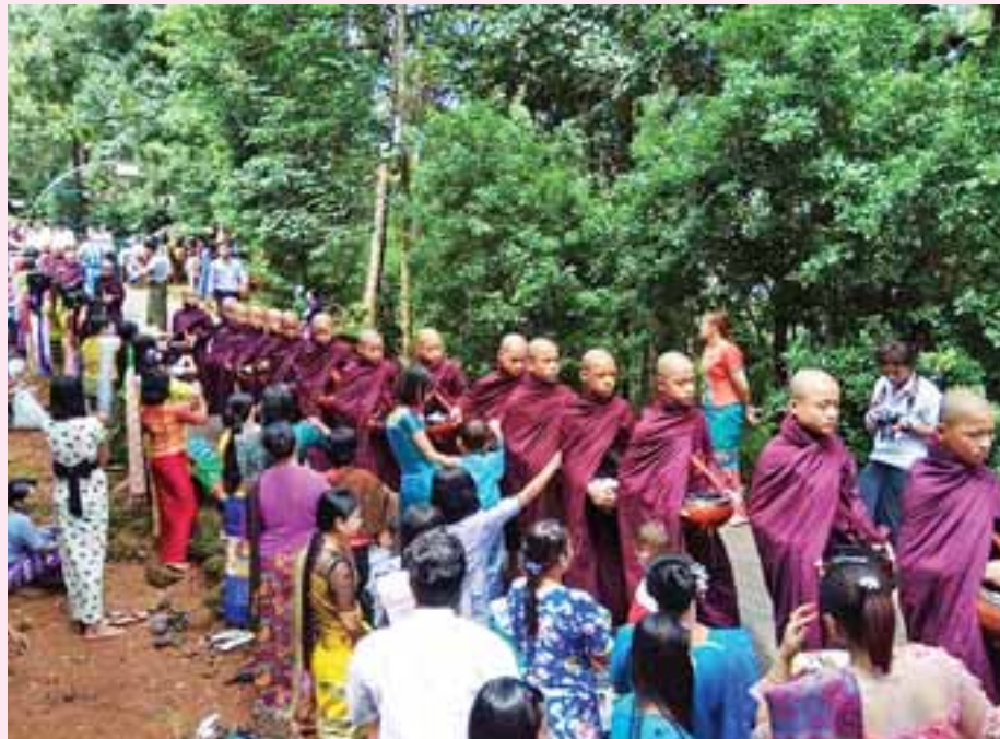
ရန်ကင်းမြို့နယ်ရှိ ဘုရားတော်များကို အလှူအတန်းများ ပြုလုပ်ရာတွင် ဝါဆိုလပြည့်နေ့တွင် ဝါဆိုလပြည့်နေ့တွင် ဝါဆိုလပြည့်နေ့တွင်