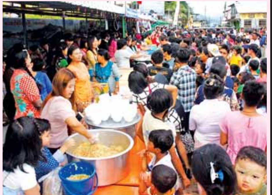
ရန်ကင်းမြို့နယ်ရှိ ဘုရားတော်များကို အလှူအတန်းများ ပြုလုပ်ရာတွင် ဝါဆိုလပြည့်နေ့တွင် ဝါဆိုလပြည့်နေ့တွင် ဝါဆိုလပြည့်နေ့တွင်