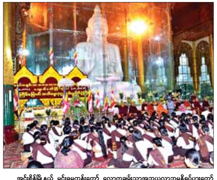
အင်းစိန်မြို့နယ် မင်းဓမ္မကုန်းတော် လောကချမ်းသာအာယုဇာတိဗုဒ္ဓကုန်းပွားတော် မြတ်ကြီးတည်ရှိရာ ဂန္ဓကုဋ်ကျောင်းတော်ကြီးတွင် သီတင်းကျွတ်လပြည့် (အဘိဓမ္မာအခါတော်နေ့) နံနက် ၈ နာရီက(၂၂)ကြိမ်မြောက် နေ့ညအသံမစဲအဘိဓမ္မာ(၇)ကျမ်းတော်မြတ် ကိုးရက်တိုင်တိုင် ရွတ်ဖတ်ပူဇော်ပွဲအောင်ပွဲ ကျင်းပစဉ်။ ဆုလှူငှါ(IPRD)