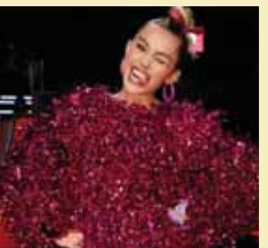
အေးပြည့် ရေးသား သည်

မိုင်လီဆိုင်ရပ်စ်ဟာ လက်ရှိမှာ သူ့ရဲ့တေးအယ်လ် ဘမ်သစ် "Younger Now" ကို စတင်ထုတ်လွှင့်နေပြီ ဖြစ်ရာ တေးသီချင်းတွေကို တစ်ပုဒ်ချင်းစီ သီးခြားထုတ် လွှင့်ပေးနေတာလည်း ဖြစ်ပါတယ်။ လက်ရှိအချိန်အထိ တေးအယ်လ်ဘမ်သစ်မှာပါဝင်မယ့် တေးသီချင်း ငါးပုဒ် ထုတ်လွှင့်ခဲ့ပြီးဖြစ်ပေမယ့် ပြီးခဲ့တဲ့ဖျော်ဖြေပွဲမှာတော့ တေးအယ်လ်ဘမ်သစ်မှာပါဝင်တဲ့ တေးသီချင်းတွေနဲ့ သီဆိုဖျော်ဖြေခဲ့ခြင်းမရှိဘဲ ဝမ်းနည်းမှုတွေကို ဖော်ပြဖို့ အတွက် "The Climb" ကို ပြန်လည်သီဆိုဖျော်ဖြေ ပေးခဲ့တာလည်း ဖြစ်ပါတယ်။