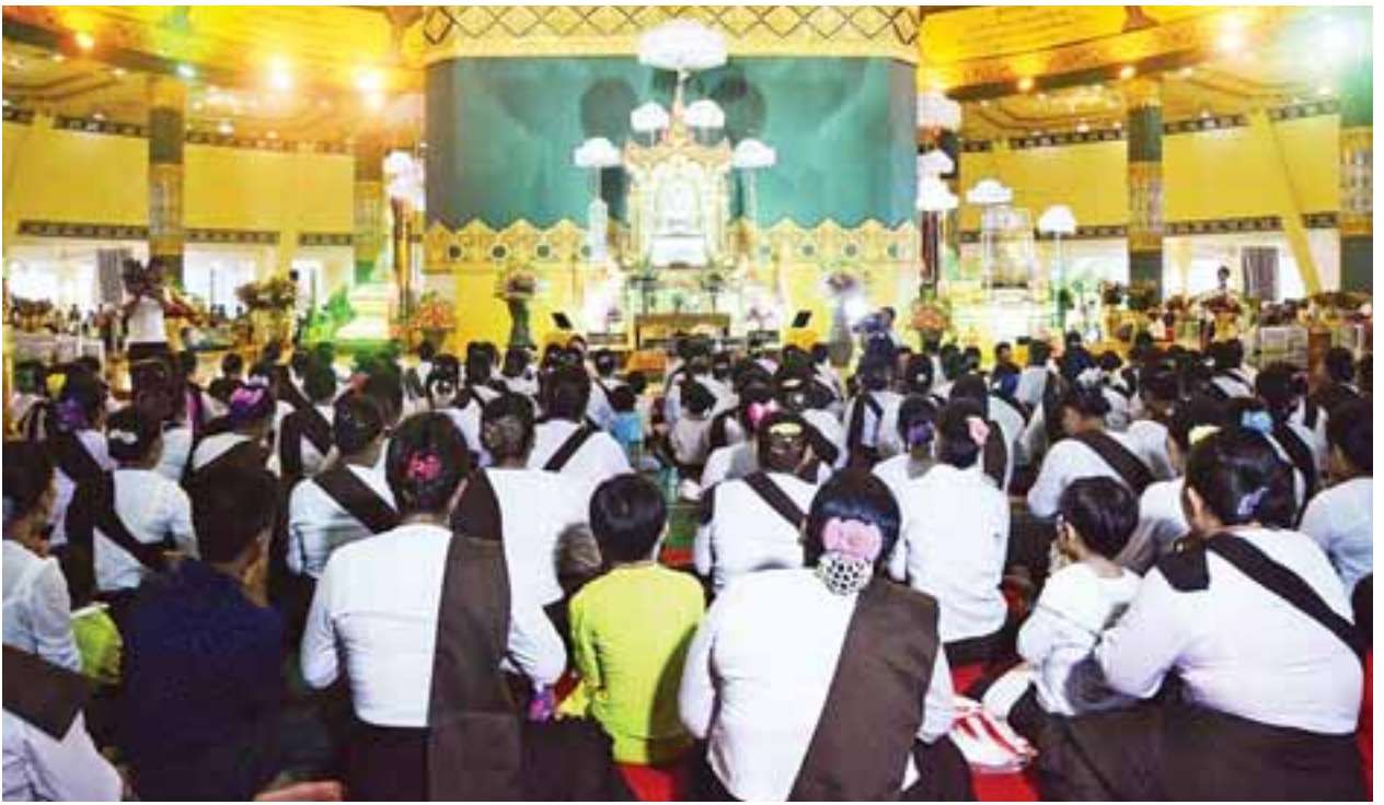
ကြသည်။ ထို့ပြင် နေပြည်တော် ဥပ္ပါတသန္တီစေတီတော်မြတ်ကြီး၌ ညနေ ၄ နာရီခွဲတွင် ဝတ်ရွတ်ပူဇော်ပွဲကိုလည်းကောင်း(အပေါ်ပုံ) ညနေ ၆ နာရီတွင် ဆီမီးထွန်းညှိပူဇော်ပွဲကိုလည်းကောင်း စည်ကားသိုက်မြိုက်စွာ ကျင်းပခဲ့သည်။ အလားတူ နေပြည်တော် ဒက္ခိဏသီရိမြို့နယ်ရှိ ရန်အောင်မြင်ရွှေလက်လှ

ထိုသို့ ကုသိုလ်ပွားများကြရာတွင် နေပြည်တော် ဥပ္ပါတသန္တီစေတီတော်မြတ်ကြီး၏ နဝမအကြိမ်မြောက် သီတင်းကျွတ်လပြည့်(အဘိဓမ္မာအခါတော်နေ့) အခမ်းအနားနှင့် (၉၄)ကြိမ်မြောက် အသံမစ်မဟာပဌာန်းရွတ်ဖတ်ပူဇော်ပွဲ အောင်ပွဲ မင်္ဂလာအခမ်းအနားကို ယနေ့နံနက် ၁၀ နာရီတွင် အဆိုပါစေတီတော်၌ကျင်းပရာ စေတီတော်ဂေါပကအဖွဲ့၏ ဩဝါဒါစရိယ ပျဉ်းမနားမြို့ မဟာဝိသုတာရာမ ဈေးကုန်းကျောင်းတိုက် ပဓာနနာယက အဘိဓမ္မမဟာဌဌပုရ ဘဒ္ဒန္တကဝိသာရထံမှ ဧည့်ပရိသတ်များက ကိုးပါးသီလခံယူဆောင်တည်ကြပြီး ဆရာတော်သံဃာတော်များ ရွတ်ပွားတော်မူသည့် မေတ္တာသုတ်ပရိတ်တရားတော်ကို နာယူကြည်ညို