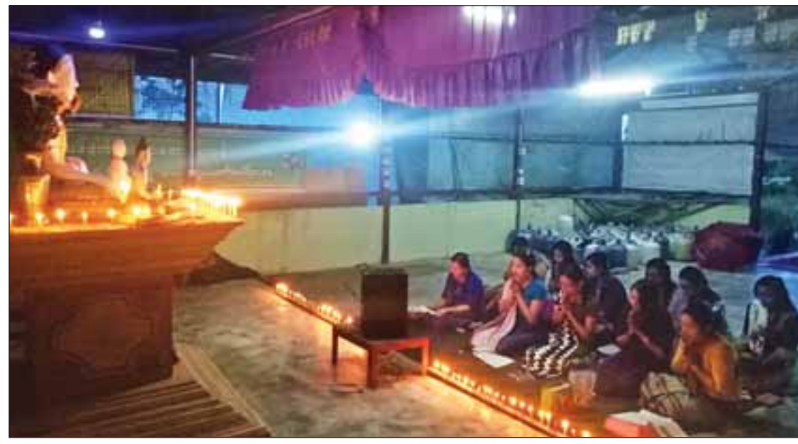
သီတင်းကျွတ်လပြည့် (အဘိဓမ္မာအခါတော်နေ့)တွင် သတင်းနှင့်စာနယ်ဇင်းလုပ်ငန်း ကြေးမုံသတင်းစာတိုက်မှဝန်ထမ်းများ နေပြည်တော်ဇေယျာသီရိမြို့နယ် စက်ကုန်းကျေးရွာရှိ အလိုတော်ပြည့်ဘုရား၌ ဓမ္မစကြာတရားဒေသနာတော်များ ရွတ်ဖတ်ပူဇော်ကြစဉ်။ (နန္ဒ)