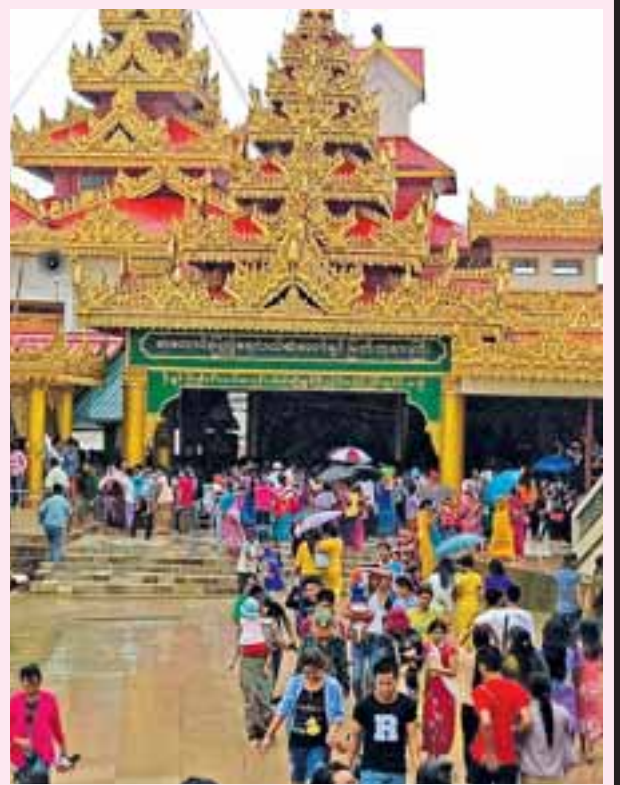
ဝါဆိုလပြည့်နေ့တွင် ရန်ကင်းမြို့နယ်ရှိ ဘုရားတော်များကို အလှူအတန်းများ ပြုလုပ်ရာတွင် ဝါဆိုလပြည့်နေ့တွင် ဝါဆိုလပြည့်နေ့တွင် ဝါဆိုလပြည့်နေ့တွင်