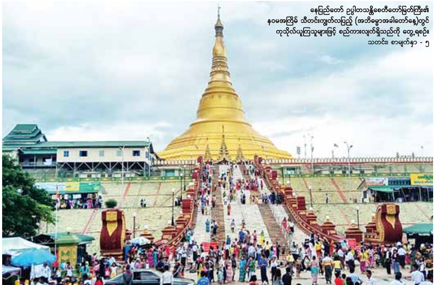
နေပြည်တော် ဥပ္ပါတသန္တိစေတီတော်မြတ်ကြီး၏ နဝမအကြိမ် သီတင်းကျွတ်လပြည့် (အဘိဓမ္မာအခါတော်နေ့)တွင် ကုသိုလ်ယူကြသူများဖြင့် စည်ကားလျက်ရှိသည်ကို တွေ့ရစဉ်။ သတင်း၊ စာမျက်နှာ - ၅