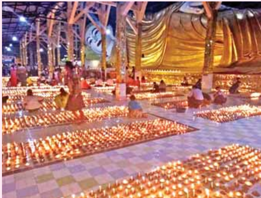
ရန်ကင်းမြို့နယ်ရှိ ဘုရားတော်များကို အလှူအတန်းများ ပြုလုပ်ရာတွင် ဝါဆိုလပြည့်နေ့တွင် ဝါဆိုလပြည့်နေ့တွင် ဝါဆိုလပြည့်နေ့တွင်