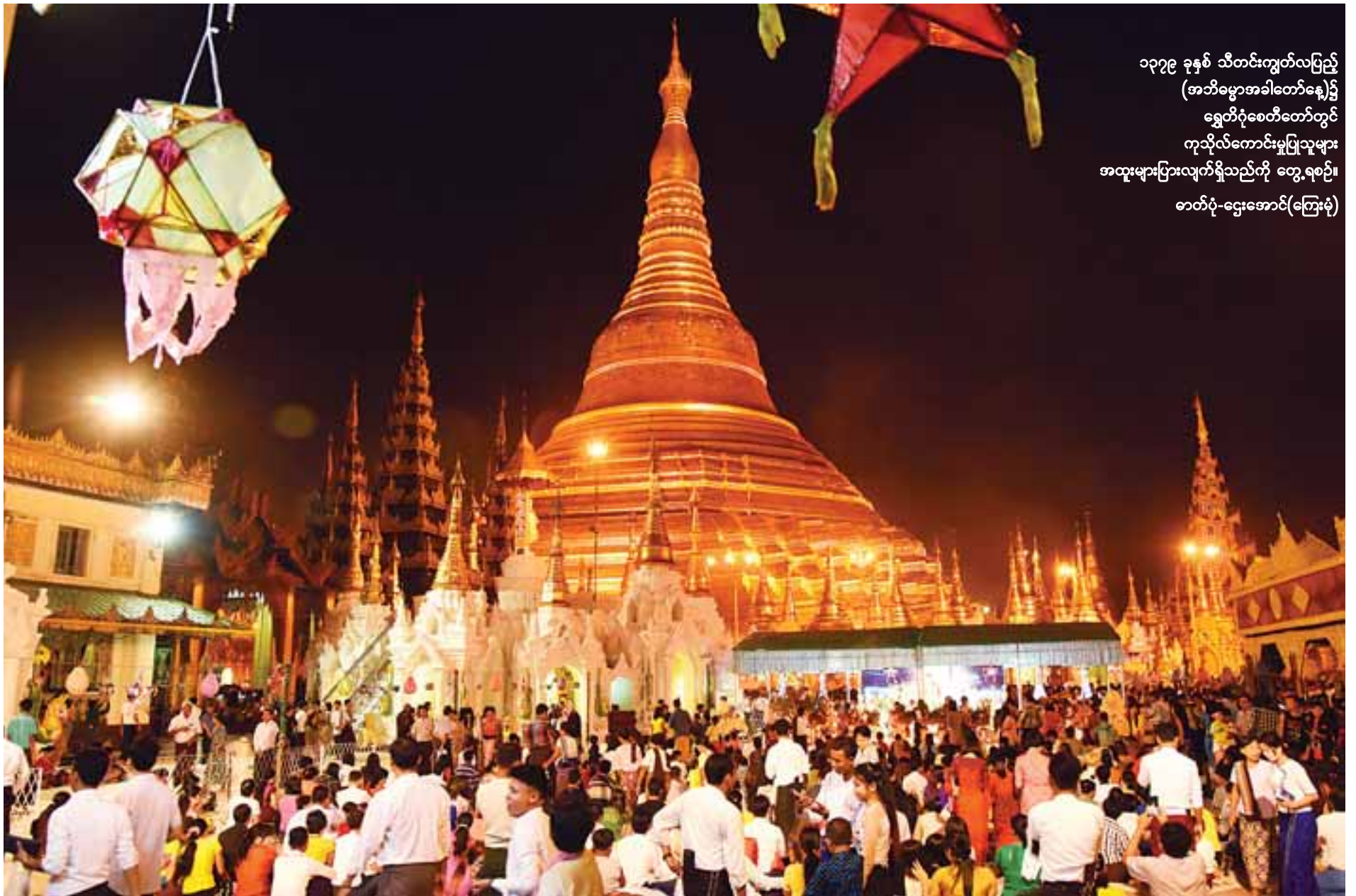
၁၃၇၉ ခုနှစ် သီတင်းကျွတ်လပြည့် (အဘိဓမ္မာအခါတော်နေ့)၌ ရွှေတိဂုံစေတီတော်တွင် ကုသိုလ်ကောင်းမှုပြုသူများ အထူးများပြားလျက်ရှိသည်ကို တွေ့ရစဉ်။