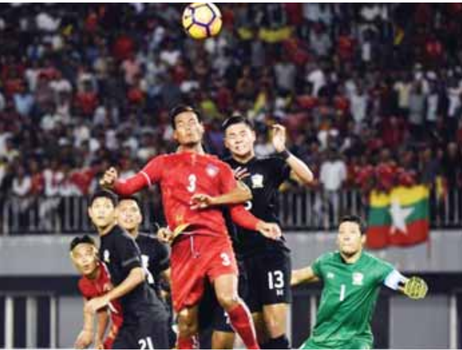
မြန်မာအသင်းနှင့် ထိုင်းအသင်းတို့ ယှဉ်ပြိုင်နေစဉ်။

နေပြည်တော် အောက်တိုဘာ ၅ ဘူးသီးတောင်မြို့နယ်အတွင်းရှိ ကျေးရွာများမှ ဘင်္ဂါလီများသည် စားဝတ်နေရေးနှင့် ကျန်းမာရေး အခက်အခဲကြောင့် လည်းကောင်း၊ ကျေးရွာတွင် လုံခြုံမှုမရှိဟု ယူဆ၍ လည်းကောင်း၊ ဘင်္ဂါလားဒေ့ရှ်နိုင်ငံသို့ ရောက်ရှိနေသည့် ဘင်္ဂါလီများက ထွက်ခွာလာရန် ဆက်သွယ်ပြောဆိုခြင်းများကြောင့် လည်းကောင်း၊ ၎င်းတို့အနေဖြင့် လူနည်းစုဖြစ်မည်ကိုစိုးရိမ်ပြီး တစ်ဖက်နိုင်ငံရှိ ၎င်းတို့မျိုးနွယ်စုများထံ သွားရောက်လိုခြင်းကြောင့် လည်းကောင်း တစ်ဖက်နိုင်ငံသို့ စာမျက်နှာ ၁၄ ကော်လံ ၅ သို့ ❖