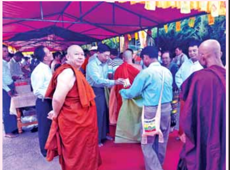
ရန်ကင်းမြို့နယ်ရှိ ဘုရားတော်များကို အလှူအတန်းများ ပြုလုပ်ရာတွင် ဝါဆိုလပြည့်နေ့တွင် ဝါဆိုလပြည့်နေ့တွင် ဝါဆိုလပြည့်နေ့တွင်