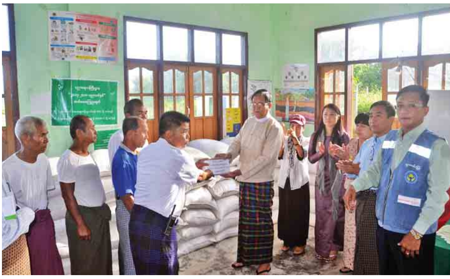
ရေးဝန်ကြီးဌာန ပြည်နယ်ဦးစီးမှူး၊ ဦးကျော်မင်း၊ ပြည်နယ် ဒုတိယပညာရေးမှူး ဦးမောင်ထွန်းဝင်းနှင့် တာဝန်ရှိသူများ လိုက်ပါခဲ့ကြောင်း သိရသည်။ (သန့်ဇင်ဝင်း၊ နိုင်လင်းကြည်)

ကျေးရွာပေါင်း ၂၇ ရွာမှ အိမ်ထောင်စု ၂၃၀၅ စုအတွက် ငွေကျပ် ၂၃၀၅၀၀၀၀ အား ထောက်ပံ့ပေးအပ်ရာ သက်ဆိုင်ရာ အုပ်ချုပ်ရေးမှူးများက လက်ခံရယူကြ သည်။ ဆက်လက်၍ အမျိုးသားလွှတ်တော် ဒုတိယဥက္ကဋ္ဌ ဦးအေးသာအောင်နှင့် အလှူရှင်များသည် မောင်တော မြို့နယ် အထွေထွေအုပ်ချုပ်ရေးဦးစီးဌာနခန်းမတွင် အုပ်ချုပ်ရေးအဖွဲ့အစည်းအသီးသီးမှ တာဝန်ရှိသူများနှင့် တွေ့ဆုံ၍ လက်ရှိတွေ့ကြုံနေရသည့် အခက်အခဲများကို မေးမြန်းဆွေးနွေးပြီး အုပ်ချုပ်ရေးအဖွဲ့များအား အလှူငွေ များ ထောက်ပံ့ပေးအပ်သည်။ ထို့နောက် ဒေသခံများ၏ လိုခြံရေး၊ အုပ်ချုပ်ရေး၊ ပညာရေး၊ စိုက်ပျိုးရေး၊ ကျန်းမာ ရေး၊ လူမှုရေးဆိုင်ရာကိစ္စရပ်များနှင့်ပတ်သက်၍ ရခိုင် ပြည်နယ်အစိုးရအဖွဲ့ဝင်များက ပူးပေါင်းကူညီဆောင်ရွက် ပေးသွားမည်ဖြစ်ကြောင်း ပြောကြားခဲ့သည်။ ထိုသို့ သွားရောက်လှူဒါန်းရာတွင် ရခိုင်ပြည်နယ် စိုက်ပျိုးရေး၊ မွေးမြူရေး၊ သစ်တောနှင့် သတ္တုထွင်းဝန်ကြီး ဦးကျော်လွင်၊ မောင်တောခရိုင် အုပ်ချုပ်ရေးမှူး ဦးရဲထွန်း၊ လှူငွေပေးအပ်ပေးသူ မောင်တောခရိုင် အုပ်ချုပ်ရေးမှူး ဦးကျော်လွင်၊ မောင်တောခရိုင် အုပ်ချုပ်ရေးမှူး ဦးရဲထွန်း၊ ကယ်ဆယ်ရေးနှင့် ပြန်လည်နေရာချထားရေးဦးစီးဌာနမှူး ဦးကျော်မင်း၊ ပြည်နယ် ဒုတိယပညာရေးမှူး ဦးမောင်ထွန်းဝင်းနှင့် တာဝန်ရှိသူများ