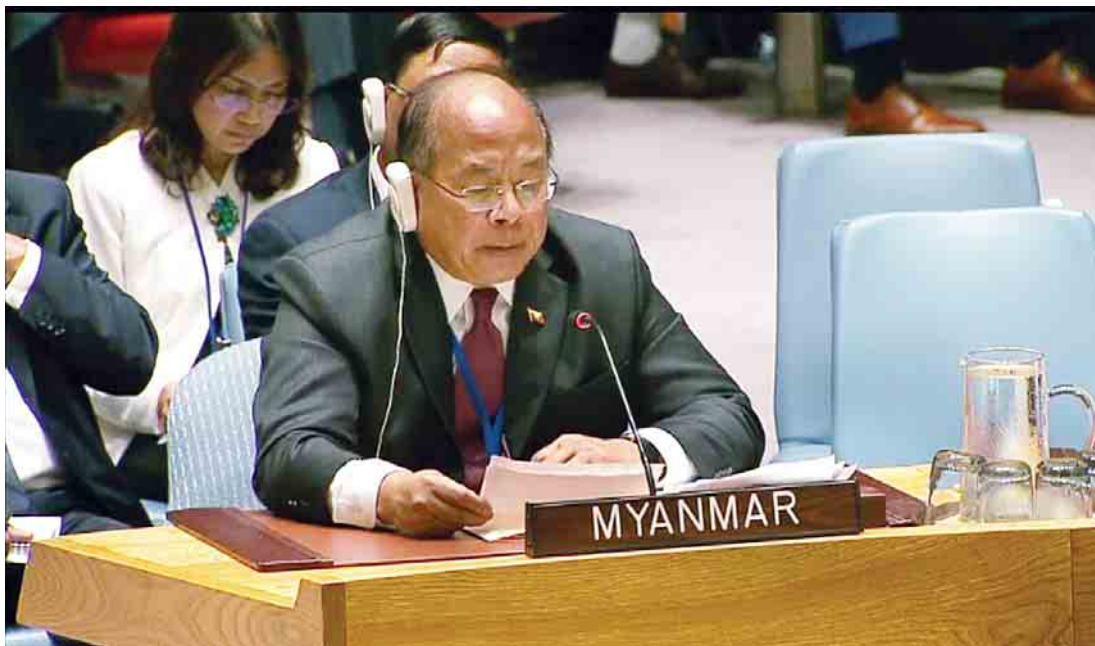
နေပြည်တော် အောက်တိုဘာ ၃

ပြည်ထောင်စုအစိုးရအဖွဲ့၏ အမျိုးသားလုံခြုံရေးဆိုင်ရာ အကြံပေးပုဂ္ဂိုလ် ဦးသောင်းထွန်းက ကုလသမဂ္ဂလုံခြုံရေးကောင်စီတွင် ရခိုင်ပြည်နယ်အရေးကိစ္စနှင့်ပတ်သက်သည့် အစည်းအဝေး၌ တုံ့ပြန်ပြောကြားခဲ့