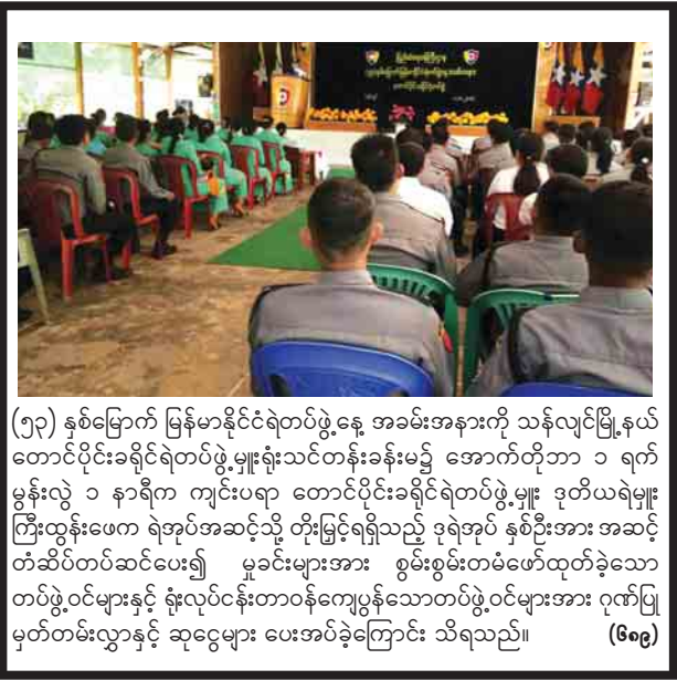
(၅၃) နှစ်မြောက် မြန်မာနိုင်ငံရဲတပ်ဖွဲ့နေ့ အခမ်းအနားကို သန့်လျင်မြို့နယ် တောင်ပိုင်းခရိုင်ရဲတပ်ဖွဲ့မှူးရုံးသင်တန်းခန်းမ၌ အောက်တိုဘာ ၁ ရက် မွန်းလွဲ ၁ နာရီက ကျင်းပရာ...