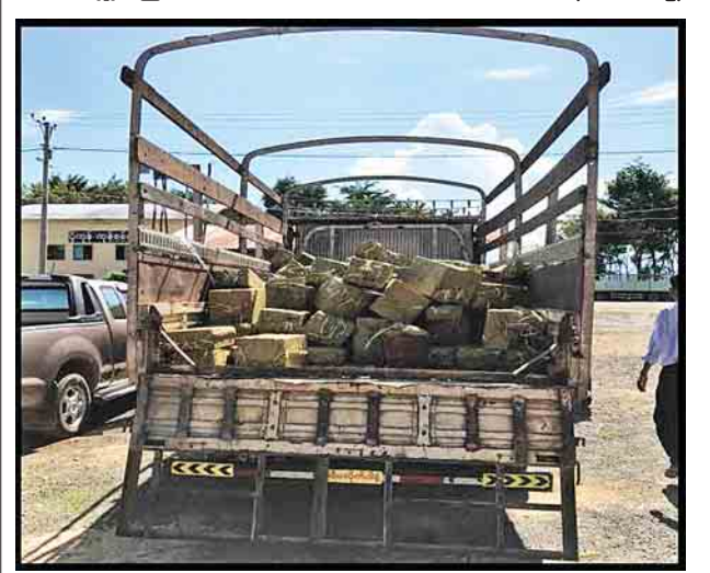
(သတင်းစဉ်)

အဆိုပါ စစ်ဆေးရေးစခန်းများက တင်သွင်း/တင်ပို့သော ကုန်ပစ္စည်းများကို စစ်ဆေးမှုပြုလုပ်ဆောင်ရွက်လျက်ရှိရာ အောက်တိုဘာ ၂ ရက်တွင် ရေပူအမြဲတမ်းစစ်ဆေးရေးစခန်းကတားဆီးမူငါးမူ (ခန့်မှန်းတန်ဖိုးငွေကျပ် ၂၆ ဒသမ ၂၅၆ သန်းခန့်)၊ မရမ်းချောင့်အမြဲတမ်းစစ်ဆေးရေးစခန်းကတားဆီးမှုတစ်မူ (ခန့်မှန်းတန်ဖိုးငွေကျပ် ၁၁၅ ဒသမ ၉၆၆ သန်းခန့်) စုစုပေါင်းတားဆီးမှုကြောင့်မူ (ခန့်မှန်းတန်ဖိုးငွေကျပ် ၂၆ ဒသမ ၆၂၂ သန်းခန့်)ကို သိမ်းဆည်းရမိခဲ့ကြောင်း သိရသည်။