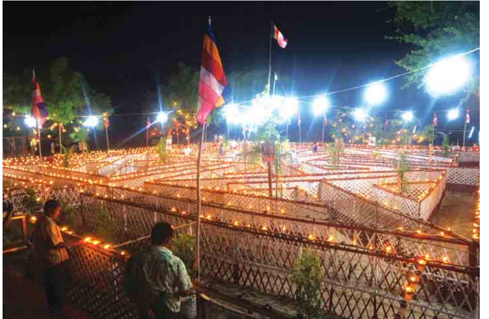
ဘာ ၁ ရက် မှ ၆ ရက်အထိ နေ့စဉ် ညနေ ၅ နာရီခွဲမှ အနေဖြင့် မိမိတို့ ဆီမီးများ ထွန်းညှိပူဇော်နိုင်ကြောင်း စတင်၍ ထွန်းညှိပူဇော်သွားမည်ဖြစ်ပြီး ပြည်သူများ သိရသည်။ သန်းစော်မင်း(ပြန်/ဆက်)

စွယ်တော်မြတ်စေတီတော်(မန္တလေး)၏ ၁၆ ပြည်ထောင်ဆီမီး(၉၀၀၀) မီးဝက်ပါ ထွန်းညှိပူဇော်ပွဲကြီးကို အောက်တို