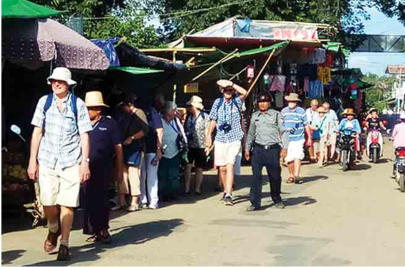
ဝင်းစိုလ်(ပြန်/ဆက်)