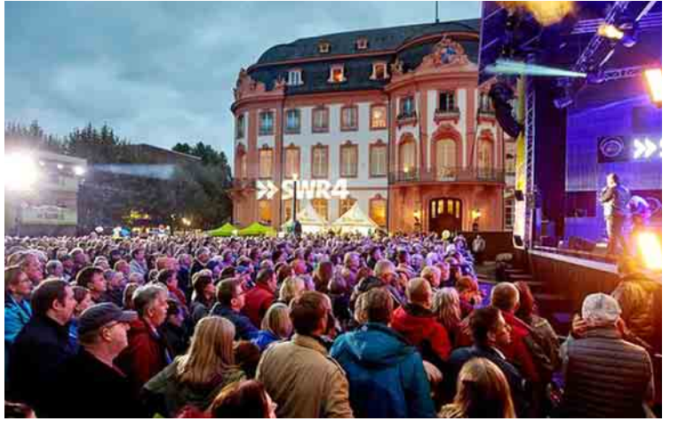
ကာလအတွင်း ပထမဆုံးအကြိမ် ပါလီမန် အတွင်းသို့ ဝင်ရောက်လာနိုင်ခဲ့သည်။ ရွေးကောက်ပွဲ၌ ထောက်ခံမဲအပြတ် အသတ်မရရှိသဖြင့် ဝန်ကြီးချုပ်မာကယ်လ်မှာ

ရေးဝါဒပြန်လည်ခေါင်းထောင်လာခြင်းမရှိ စေရေးအတွက် ဒီမိုကရေစီလိုလားသော အမတ်များက လက်တွဲကြိုးပမ်းဆောင်ရွက် ကြရန် မိမိတို့ကတိုင်းကြောင်း သမ္မတစတီန်းမိုင်ယာက နိုင်ငံအနောက်ပိုင်း မိန့်ခွန်းပြောကြားရာတွင် ဖော်ပြသည်။ အဆိုပါရွေးကောက်ပွဲသည် အိန်ဂျလာ မာကယ်လ်အတွက် စတုတ္ထမြောက်ဝန်ကြီး ချုပ်ရာထူးသက်တမ်းတွင် ဆက်လက်တာဝန် ထမ်းဆောင်နိုင်ရန်လမ်းပွင့်ပေးခဲ့သည်။ သို့ရာတွင် ရွေးကောက်ပွဲရလဒ်အရ လက်ယာစွန်း ရောက် ပါတီတစ်ပါတီမှာ နှစ်ပေါင်း ၅၀ကျော်