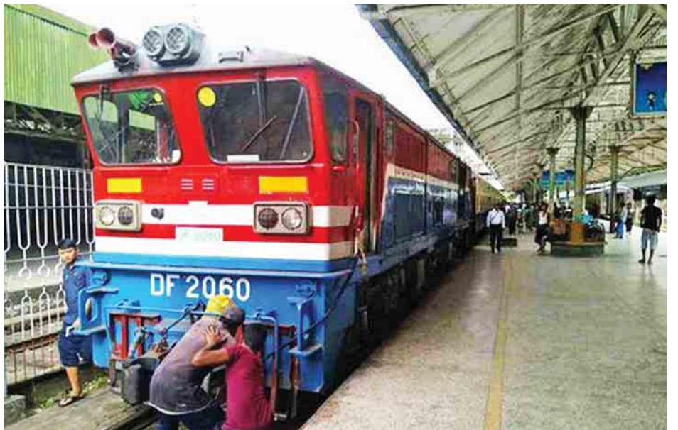
ရန်ကုန်မှ မန္တလေးသို့ ထွက်ခွာမည့် လေအိတ်ရထားကို အောက်တိုဘာ ၃ ရက် ညနေပိုင်းက ရန်ကုန်ဘူတာကြီး၌ တွေ့ရစဉ်။

သီတင်းကျွတ်ကာလ ရုံးပိတ်ရက် ငါးရက်တွင် ခရီးသွားပြည်သူများ အဆင်ပြေစေရန် အထူးရထားလေးစင်း ပြေးဆွဲသွားမည်ဖြစ်ကာ ရထားလက်မှတ်များကို ယခင်သတ်မှတ် နှုန်းထားအတိုင်း သုံးရက်ကြိုတင်၊ တစ်ရက်ကြိုတင် ရောင်းချသွားမည်ဖြစ် . . .