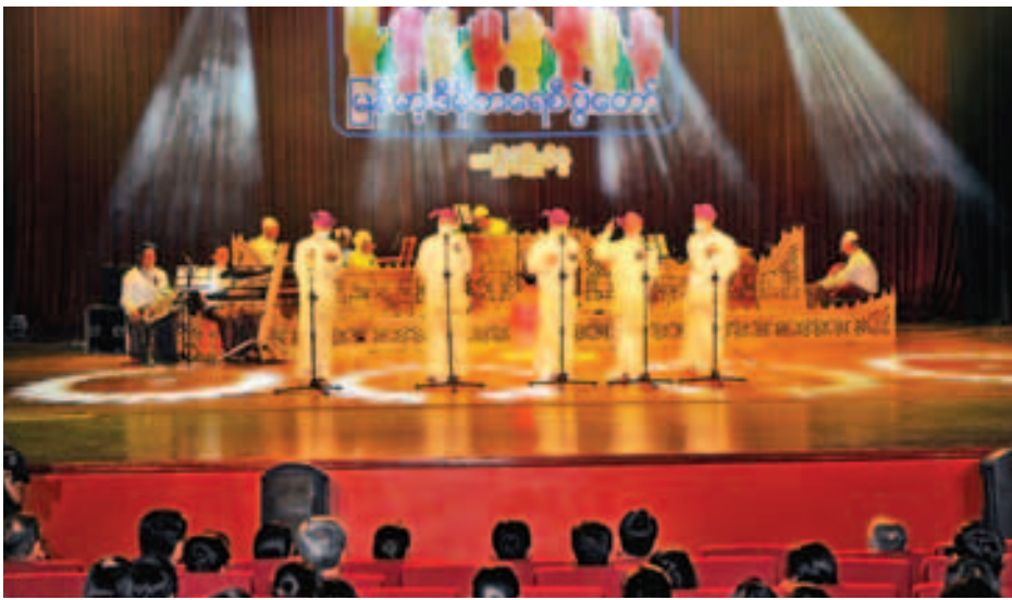
ယနေ့တင်ဆက်ပြိုင်ပွဲဝင်ကြမည့် အငြိမ်းပွဲအနုပညာသည်များသည်လည်း ဒီမိုကရေစီအနုပညာများဖြင့် အငြိမ်းပွဲအား ရသပညာများကို ပေါင်းစပ်ပြီး စိတ်ဝင်စားဖွယ်တင်ဆက်ပြသသွားနိုင်ကြပါရန် ဆုမွန်ကောင်း တောင်းပါကြောင်း ပြောကြားသည်။ ထို့နောက် ရန်ကုန်တိုင်းဒေသကြီးဝန်ကြီးချုပ်

ရန်ကုန် ဩဂုတ် ၂၇ ပြန်ကြားရေးဝန်ကြီးဌာန၏ လမ်းညွှန်မှုနှင့် Forever Group ၏ ပံ့ပိုးမှုဖြင့် ကျင်းပသည့် မြန်မာ့ဒီမိုကရေစီ ပွဲတော်အငြိမ်းပွဲ ပဏာမအဆင့်ပြိုင်ပွဲ(ရန်ကုန်)ကို ယနေ့ညပိုင်းက ရန်ကုန်မြို့ ဒဂုံမြို့နယ် မြို့မကျောင်းလမ်းရှိ အမျိုးသားဇာတ်ရုံ၌ ကျင်းပသည်။