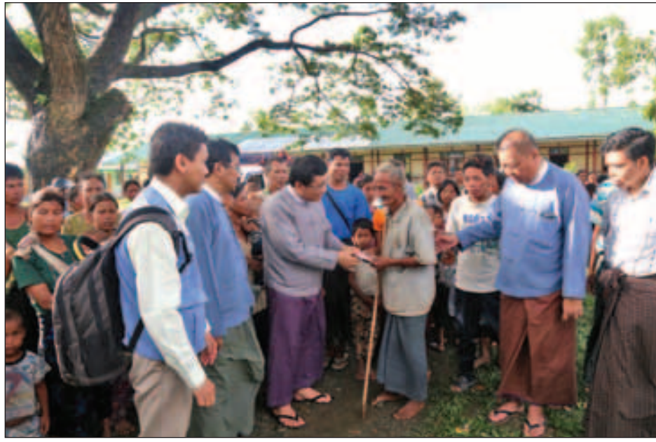
ဆက်လက်၍ ပြည်ထောင်စုဝန်ကြီးနှင့်အဖွဲ့သည် မောင်တောမြို့ (၄)မိုင် အခြေခံပညာအထက်တန်းကျောင်းတွင် ခေတ္တခိုလှုံ့နေထိုင်လျက်ရှိသော တိုင်းရင်းသားပြည်သူများထံရောက်ရှိကြပြီး ကြည့်ရှုအားပေး နှစ်သိမ့်စကားပြောကြားကာ လတ်တလောစားသုံးရန် ခေါက်ဆွဲခြောက်များနှင့် ဆေးဝါးများ၊ လူမှုရေးထောက်ပံ့မှု ပေးအပ်ရန်လိုအပ်သော သက်ကြီးရွယ်အိုများ၊ ကိုယ်ဝန်ဆောင်များနှင့် မီးဖွားပြီးစ အမျိုးသမီးများအား ငွေကြေးထောက်ပံ့ခြင်းများကိုလည်း ဆောင်ရွက်ခဲ့သည်။ ထို့နောက် မောင်တောမြို့အတွင်း လုံခြုံရေးဆောင်ရွက်ထားရှိမှုအခြေအနေနှင့် ပြည်သူလူထု ပုံမှန်လှုပ်ရှားသွားလာနေထိုင်မှုအခြေအနေများကို လှည့်လည်ကြည့်ရှုခဲ့ကြကြောင်း သတင်းရရှိသည်။ (သတင်းစဉ်)

ထို့နောက် ဘူးသီးတောင်မြို့နယ် ပြည်သူ့ဆေးရုံနှင့် အေးစေတီဘုန်းတော်ကြီးကျောင်းများသို့ ရောက်ရှိကြပြီး လတ်တလောဖြစ်စဉ်တွင် အကြမ်းဖက်သမားများ၏ လက်ချက်ဖြင့် ဆေးရုံတက်ရောက်ကုသလျက်ရှိသော ပြည်သူများကို အားပေးကြည့်ရှုခြင်း၊ ကျန်းမာရေးစောင့်ရှောက်မှုဆိုင်ရာ လိုအပ်ချက်များ ဖြည့်ဆည်းပေးခြင်း၊ ဘေးလွတ်ရာသို့ ခေတ္တပြောင်းရွှေ့နေထိုင်လျက်ရှိသော ပြည်သူများကို နှစ်သိမ့်အားပေးခြင်း၊ လတ်တလော အသုံးပြုရန် စားသောက်ဖွယ်ရာနှင့် ဆေးဝါးများထောက်ပံ့ပေးခြင်း၊ ငွေကြေးထောက်ပံ့ခြင်းများကို ဆောင်ရွက်ခဲ့သည်။