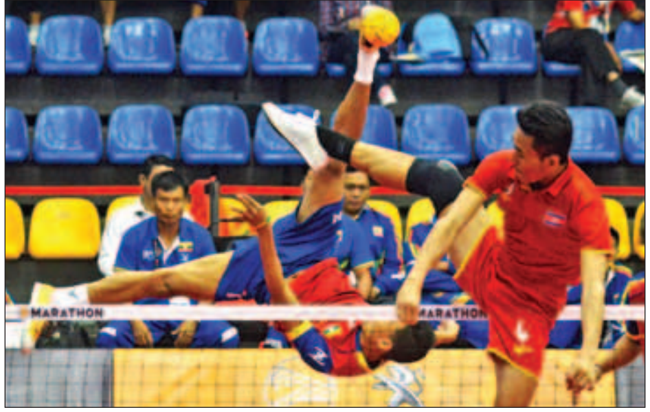
မြန်မာနှင့် ကမ္ဘောဒီးယားယှဉ်ပြိုင်နေစဉ်။

ကွာလာလမ်ပူ ဩဂုတ် ၂၇ (၂၉)ကြိမ်မြောက် ဆီးရီးမီးဒိုပိုက်ကျော်ခြင်းပြိုင်ပွဲ၏ နှစ်ယောက်တွဲ အမျိုးသားအုပ်စု နောက်ဆုံးပွဲနှင့် အမျိုးသမီးပြိုင်ပွဲ ဆီမီးဖိုင်နယ်နှင့် ဗိုလ်လုပွဲကို ယနေ့နံနက်ပိုင်းမှစ၍ ကျင်းပရာ မြန်မာပိုက်ကျော်ခြင်းအသင်းက ရွှေတံဆိပ်ကြေးတစ်ခု ထပ်မံဆွတ်ခူးရရှိခဲ့သည်။ မြန်မာအမျိုးသားပိုက်ကျော်ခြင်းအသင်းသည် အုပ်စုနောက်ဆုံးပွဲတွင် ကမ္ဘောဒီးယားအသင်းကို နှစ်ပွဲပြတ် အနိုင်ရခဲ့ပြီး အုပ်စုပွဲစဉ်အားလုံးအနိုင်ရကာ ရွှေတံဆိပ်ရယူနိုင်ခဲ့သည်။ နှစ်ယောက်တွဲအမျိုးသားပြိုင်ပွဲတွင် မြန်မာအသင်းသည် အုပ်စုပွဲစဉ်များ၌ ဖိလစ်ပိုင်အသင်းကို နှစ်ပွဲ-တစ်ပွဲ၊ လာအိုအသင်းကို နှစ်ပွဲပြတ်၊ အိမ်ရှင် မလေးရှားကို နှစ်ပွဲပြတ်၊ ကမ္ဘောဒီးယားကို နှစ်ပွဲပြတ်တို့ဖြင့် အနိုင်ရကာ ရွှေတံဆိပ်ရယူနိုင်ခဲ့ခြင်းဖြစ်သည်။ အမျိုးသမီးပြိုင်ပွဲတွင် မြန်မာအမျိုးသမီးအသင်းသည် အုပ်စုပထမဖြင့် ဆီမီးဖိုင်နယ်တက်ရောက်နိုင်ခဲ့သော်လည်း ဗီယက်နမ်ကို မထင်မှတ်ဘဲ ရှုံးနိမ့်ကာ ဗိုလ်လုပွဲနှင့် လွဲချော်ပြီး ပူးတွဲကြေးဆုဖြင့်သာ ကျေနပ်ခဲ့ရသည်။ မြန်မာအမျိုးသမီးအသင်းသည် ဗီယက်နမ်အသင်းကို (၂၁-၁၉) မှတ်၊ (၂၁-၁၉) မှတ်ဖြင့် နှစ်ပွဲပြတ်ရှုံးနိမ့်ခဲ့ခြင်းဖြစ်သည်။ မြန်မာပိုက်ကျော်ခြင်းအသင်းဝင်ရောက်ယှဉ်ပြိုင်သည့် ပွဲစဉ်များပြီးဆုံးခဲ့ပြီဖြစ်ပြီး ရွှေတံဆိပ်၊ ငွေတံဆိပ်၊ ကြေးတံဆိပ် ဆွတ်ခူးရရှိခဲ့သည်။ မြန်မာပိုက်ကျော်ခြင်းအသင်းအတွက် ရွှေဆုကို အမျိုးသမီးလေးယောက်တွဲ ပြိုင်ပွဲတွင် တစ်ခု၊ အမျိုးသားနှစ်ယောက်တွဲပြိုင်ပွဲတွင် တစ်ခုတို့ ရယူပေးခဲ့ခြင်းဖြစ်သည်။ သတင်း - ညိုမြတ်သော်တာ