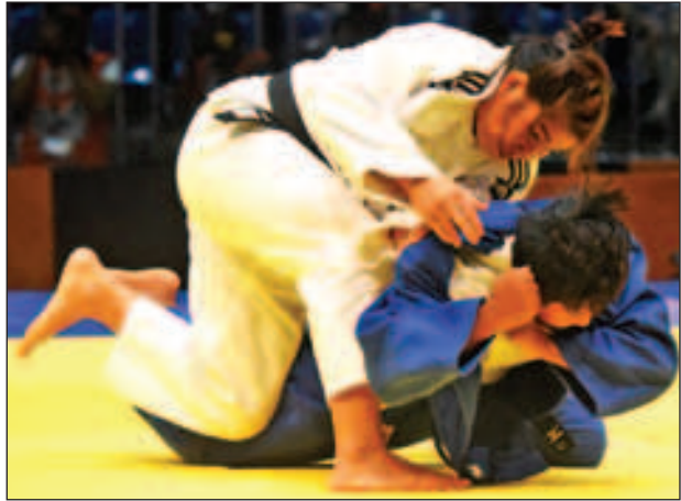
အေးအေးအောင်နှင့် ဗီယက်နမ်ကစားသမားတို့ ယှဉ်ပြိုင်နေစဉ်။

ပြုစုချောင်းဝ ကင်းစခန်းသို့ ပြန်လည်ရောက်ရှိခဲ့ကြောင်း။ ထိုအချိန်တွင် ကျွန်းပေါက်ပြုစုအုပ်စုဖက်လိပ်ပြင်ကျေးရွာ၊ ဇီးပင်ချောင်းမြောက်ရွာများဘက်မှ အစွန်းရောက် ဘင်္ဂါလီအကြမ်းဖက်သမား ၃၀၀ ခန့်က ကင်းစခန်းအနီး ကိုက် ၅၀၀ ခန့်အကွာအထိ ချဉ်းကပ်လာသဖြင့် လုံခြုံရေးတပ်ဖွဲ့ဝင်များက အနားမကပ်နိုင်အောင် ပစ်ခတ်တားဆီးခဲ့ပြီး တပ်မတော်ရေမှ လုံခြုံရေးတပ်ဖွဲ့ဝင်များက ကျွန်းပေါက်ပြုစုချောင်းဝကင်းစခန်းသို့ လာရောက်