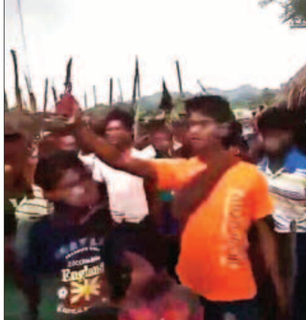
တုတ်၊ ဓား၊ လက်နက်များကို အင်အားသော အစွန်းရောက် ဘင်္ဂါလီအကြမ်းဖက်သမားများကို တွေ့ရစဉ်။