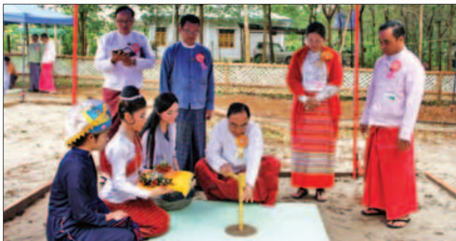
(၁၃)က တာဝန်ယူ တည်ဆောက်မည် ဖြစ်သည်။ ကရင်ပြည်နယ်၊ ကယားပြည်နယ်၊

နိုင်သက်လွင်၊ မွန်ပြည်နယ်ဝန်ကြီး ချုပ် ဒေါက်တာအေးဇံနှင့် ပြည်နယ် အစိုးရအဖွဲ့ဝင်ဝန်ကြီးများ၊ ပြည်နယ် အဆင့်ဌာနဆိုင်ရာ ပုဂ္ဂိုလ်များ တက်ရောက်ကြသည်။ အခမ်းအနားတွင် တိုင်းရင်းသား လူမျိုးရေးရာဝန်ကြီးဌာန ဒုတိယ အမြဲတမ်းအတွင်းဝန် ဦးမင်းအေး ကိုက မွန်ပြည်နယ်ညွှန်ကြားရေးမှူး ရုံးနှင့် ပတ်သက်၍ ရှင်းလင်းတင်ပြပြီး ပြည်ထောင်စုဝန်ကြီး၊ မွန်ပြည်နယ် ဝန်ကြီးချုပ်၊ ပြည်နယ်တိုင်းရင်းသား