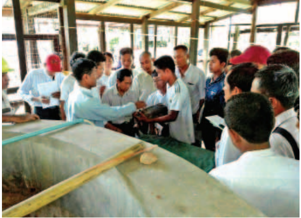
ပြည်သူ မင်းလှမြို့မှ ၁၇ ဦး၊ အုတ်ဖိုမြို့ မှ ၁၄ ဦး စုစုပေါင်း ၃၁ ဦးတက်ရောက် ကြောင်း၊ သင်တန်းကို ဩဂုတ် ၂၇