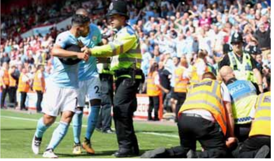
မေလွဲသင်း-ခုစည်းသည်

ဘယ်သူ့ကိုမှ ရိုက်ခဲ့တာမျိုးမရှိပါဘူး။ ဒီစွပ်စွဲချက်က မှားယွင်းပါတယ်။ ရုပ်သံက ပုံရိပ်တွေက ဒီအချက်ကို သက်သေခံနိုင်ပါတယ်” ဟု သူ့ရဲ့ တွစ်တာစာမျက်နှာပေါ်ကနေ ရှင်းချက် ပေးသွားပါတယ်။ မန်စီးစီးက အဲဒီ ပွဲမှာ ရုန်းကန်ခဲ့ရပြီး ဘုန်းမောက် အသင်းရဲ့ ဦးဆောင်ရုံးကြောင့် နောက်ကလိုက်ကစားခဲ့ရတာ ချေပွဲပိုင်း နဲ့အနိုင်ရုံးတွေသွင်းယူပြီး အနိုင်ယူ ခဲ့တာ ဖြစ်ပါတယ်။