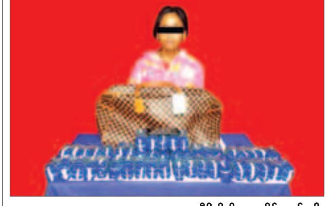
သီရိကိုကိုအား သိမ်းဆည်းရမိ စိတ်ကြွေးသွပ်ဆေးပြားများနှင့်အတူ တွေ့ရစဉ်။