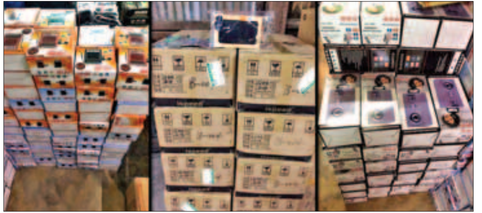
တစ်စုံတစ်ရာ တင်ပြနိုင်ခြင်းမရှိသည့် TV (19") (1x5) တန်ဖိုးငွေကျပ် ၁၇ ဒသမ ၀၀၅ သန်းခန့်ကို တွေ့ရှိ၍ (19) Pkgs, (17") (1x5) (21) Pkgs၊ မိုဘိုင်းဆက်စပ်ပစ္စည်း သိမ်းဆည်းခဲ့ကြောင်း သတင်းရရှိသည်။ လေးမျိုးနှင့် လူသုံးကုန်ပစ္စည်းလေးမျိုး(စုစုပေါင်း ခန့်မှန်း (သတင်းစဉ်)

လျက်ရှိရာ ဩဂုတ် ၂၆ ရက်တွင် ရေပူအမြဲတမ်းစစ်ဆေးရေး စခန်းက တားဆီးမှု ခုနစ်မူ(ခန့်)မှန်းတန်ဖိုးငွေကျပ် ၄၄ ဒသမ ၁၂၀ သန်းခန့်၊ မရမ်းချောင်း အမြဲတမ်းစစ်ဆေးရေး စခန်းက တားဆီးမှု ၁၀ မူ(ခန့်)မှန်းတန်ဖိုး ငွေကျပ် ၂၁ ဒသမ ၁၁၂ သန်းခန့်၊ စုစုပေါင်းတားဆီးမှု ၁၇ မူ(ခန့်)မှန်း တန်ဖိုး ငွေကျပ် ၆၅ ဒသမ ၂၃၃ သန်းခန့်ကို သိမ်းဆည်း ရမိခဲ့ကြောင်း သတင်းရရှိသည်။ ထူးခြားသိမ်းဆည်းမှုအနေဖြင့် ဩဂုတ် ၂၆ ရက်တွင် မန္တလေးသို့ သွားရောက်မည့် တိုယိုတာမတ်တူး တစ်စီး၊ လိုက်ထရပ်ယာဉ် တစ်စီး၊ ကင်တာ ခြောက်ဘီးယာဉ် တစ်စီးတို့ကို ရေပူအမြဲတမ်း စစ်ဆေးရေးစခန်းက တားဆီး စစ်ဆေးခဲ့ရာ တရားဝင်စာရွက်စာတမ်း အထောက်အထား