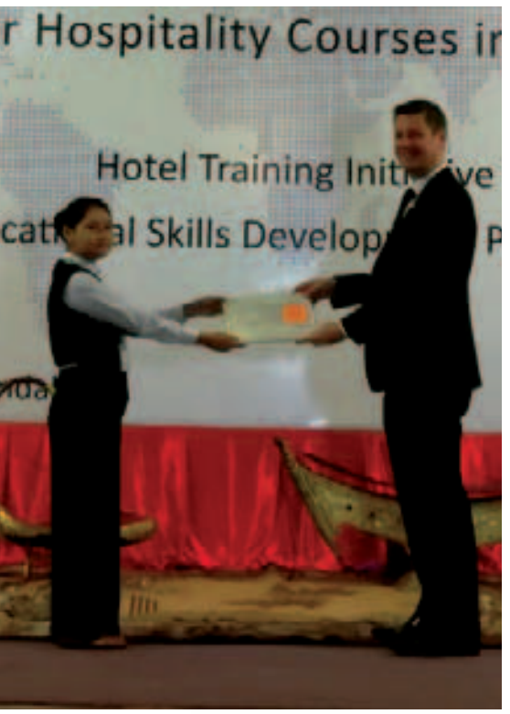
မောင်မြည့်သူ

de las Cuevas က သင်တန်းဆင်းလက်မှတ်များ ပေးအပ်ခဲ့သည်။ ဆွစ်နည်းပညာပူးပေါင်းဆောင်ရွက်ရေးဖောင်ဒေးရှင်းအနေဖြင့်အလုပ်အကိုင်ရှားပါးမှုပြဿနာ ဖြေရှင်းပေးရန်၊ ကျွမ်းကျင်လုပ်သားများ မွေးထုတ်ပေးရန်၊ ကျွမ်းကျင်မှုရလာသည့်သင်တန်းသားများကို ဟိုတယ်များနှင့် ချိတ်ဆက်ပေးရန် ရည်ရွယ်ချက်ဖြင့် မန္တလေးမြို့ရှိ ဟိုတယ်ကြီးများနှင့်ပူးပေါင်း၍ အိတ်ခန်းဆောင်ထိန်းသိမ်းရေး၊ အစားအသောက် တည်ဆောက်ရေး၊ ခရီးဦးကြိုသူစသည်အလုပ်အကိုင် သုံးမျိုးကိုသင်ကြားလေ့ကျင့်ပေးခဲ့သည်။