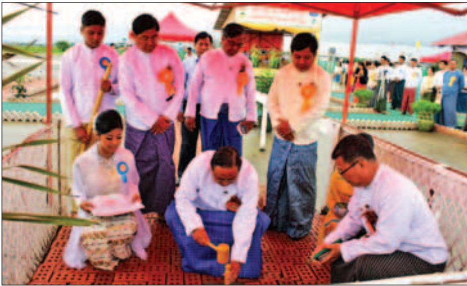
တယ်။ ဒါကြောင့် Phase 1 ကတော့ ကိုးလ၊ တစ်နှစ်မကျော် ပါဘူး”ဟု Yangon Metropolitan Development Public ကုမ္ပဏီ ဒုတိယဥက္ကဋ္ဌ ဦးသာဌေးက ပြောသည်။ မြေဧက ၁၈၃ ဒသမ ၅၃ ဧကရှိ မြေပေါ်တွင် အကောင်အထည်ဖော်တည်ဆောက်မည့် အဆိုပါစီမံကိန်း တွင် အကျယ်အဝန်းအားဖြင့် စတုရန်းပေ ၃၀၀၊ စတုရန်း ပေ ၆၀၀၊ စတုရန်း ပေ ၉၀၀၊ စတုရန်း ပေ ၁၂၀၀ ရှိ အိမ်ခန်းပေါင်း ၄၀၀၀ နီးပါး ပါဝင်သည့် ၁၂ ခန်းတွဲ ခြောက်ထပ်၊ ရှစ်ခန်းတွဲ ခြောက်ထပ်၊ လေးခန်းတွဲ ခြောက်ထပ်ရှိ အဆောက်အအုံများဆောက်လုပ်ရန် လျာထားကြောင်းနှင့် ဈေးဆိုင်ခန်းများ၊ ရုံးခန်းများ၊

ကြိုးစားလုပ်ဆောင်နေတာဖြစ်ပါတယ်။ ဒီစီမံကိန်းကို သုံးနှစ်လျာထားချက်အနေနဲ့ ကြိုးစားနေပါတယ်။ သုံးနှစ် အတွင်းမှာ ပင်စင်ယူမယ့် ပင်စင်စားတွေကို စာရင်းပြုစု ထားတာဖြစ်တဲ့အတွက် သုံးနှစ်အတွင်းမှာ ပင်စင်ယူပြီး ရန်ကုန်မှာနေမယ့် နိုင်ငံ့ဝန်ထမ်းက တစ်သောင်းခန့်ရှိပါ တယ်။ ဒီအခြေအနေတွေကို ရည်မှန်းပြီး ဆောက်လုပ်တာ ဖြစ်ပါတယ်”ဟု ရန်ကုန်တိုင်းဒေသကြီး ဝန်ကြီးချုပ် ဦးမြိုးမင်းသိန်းက ပြောသည်။