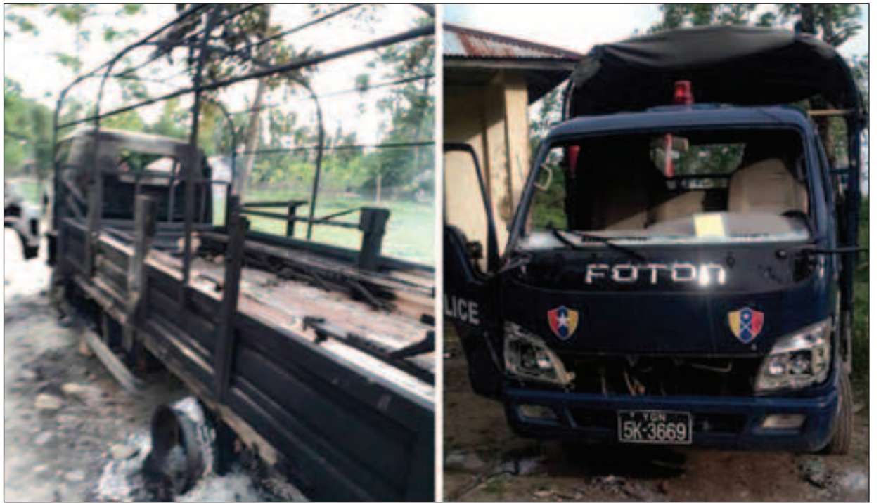
အစွန်းရောက် ဘင်္ဂါလီအကြမ်းဖက်သမားများ၏ လက်ချက်ကြောင့် ပျက်စီးသွားသည့်မော်တော်ယာဉ်အား တွေ့ရစဉ်။