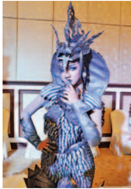
အကောင်းဆုံးဝတ်စုံဆု ရရှိခဲ့သည့် အလှမယ် အိမ်သက်မျိုး (မင်းဘူး)

အတွက် မယ်စကြဝဠာမြန်မာ နောက်ဆုံးပြိုင်ပွဲကြီးကို Gandamar Wholesale ၌ ကျင်းပသွားမည်ဖြစ်ပြီး နိုင်ငံကိုယ်စားပြု အလှမယ်တစ်ဦးကို ရွေးချယ်ပေးတော့မည်ဖြစ်သည်။ သတင်း-ခင်ဇာလီ၊ ဓာတ်ပုံ-အေးမင်းသူ