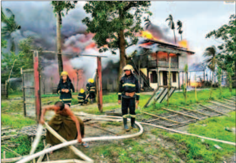
အစွန်းရောက် ဘင်္ဂါလီအကြမ်းဖက်သမားများ မီးရှို့ဖျက်ဆီးထားမှုအား မီးသတ်တပ်ဖွဲ့ဝင်များက မီးငြိမ်းသတ်နေစဉ်။

အစွန်းရောက် ဘင်္ဂါလီအကြမ်းဖက်သမားများသည် မောင်တောမြို့အား ဖျက်ဆီးရန် တစ်ချိန်တည်း တစ်ပြိုင်တည်း မီးရှို့ခြင်း၊ လက်လုပ်ပုံးများ ဖောက်ခွဲခြင်း၊ သေနတ်များဖြင့် ပစ်ခတ်ခြင်းများဖြင့် အကြမ်းဖက်လုပ်ရပ်များ ဆက်လက်လုပ်ဆောင်လျက်ရှိကြောင်း နိုင်ငံတော်အတိုင်ပင်ခံရုံး သတင်းထုတ်ပြန်ရေးကော်မတီ၏ ယနေ့ ည ၈ နာရီထုတ်ပြန်ချက်အရ သိရသည်။