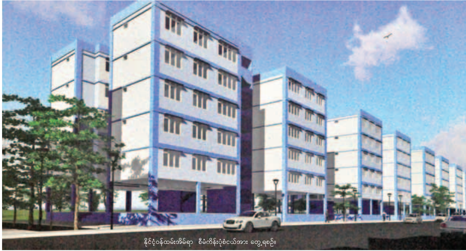
နိုင်ငံ့ဝန်ထမ်းအိမ်ရာ စီမံကိန်းပုံစံငယ်အား တွေ့ရစဉ်။

ရန်ကုန်၊ ဩဂုတ် ၂၇ နိုင်ငံ့ဝန်ထမ်းများ အငြိမ်းစား ယူသည့်အခါတွင် ဘဝနေထိုင်ရေး စိတ်အေးစေရန်အတွက် ရန်ကုန်တိုင်း ဒေသကြီးအစိုးရက အကောင်အထည် ဖော်တည်ဆောက်မည့် နိုင်ငံ့ဝန်ထမ်း အိမ်ရာ စီမံကိန်းကို သုံးနှစ်အတွင်း အကောင်အထည်ဖော်ဆောင်ရွက် သွားမည်ဖြစ်ကြောင်း ယနေ့နံနက် ၈ နာရီက စီမံကိန်းတည်ရှိရာ ရန်ကုန်မြို့ ဒဂုံ(ဆိပ်ကမ်း)မြို့နယ် (၇၃)ရပ်ကွက် ရွှေလီလမ်းနှင့် မြန်မာ့ လမ်းထောင့်တွင် ကျင်းပသည့် နိုင်ငံ့ဝန်ထမ်းအိမ်ရာစီမံကိန်း ပန္နက် တော်တင် မင်္ဂလာအခမ်းအနားမှ သိရသည်။ “အဓိကရည်ရွယ်ချက်က နိုင်ငံ့ တာဝန်ထမ်းဆောင်ခဲ့တဲ့ ဝန်ထမ်း တွေကို တစ်ဘဝလုံး တိုင်းပြည် တာဝန်ထမ်းဆောင်ခဲ့ပြီး အနားယူ တဲ့အချိန်မှာ သူတို့အတွက် နေရာ ပေါ့။ အဲဒီနေရာကလည်း နေပျော်တဲ့ နေရာမျိုးဖြစ်အောင် ဖန်တီးပေးဖို့ စာမျက်နှာ ၃ ကော်လံ ၁ သို့”