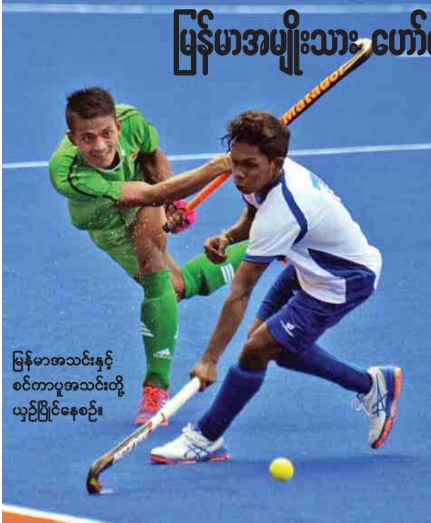
မြန်မာအသင်းနှင့် စင်ကာပူအသင်းတို့ ယှဉ်ပြိုင်နေစဉ်။

သတင်း-ရဲရင့်ရှိုင်း၊ ဓာတ်ပုံ-စိုးညွန့်(ခေတ္တ-မလေးရှား)