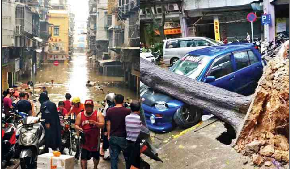
ခေတ္တပိတ်ထားခဲ့ရသည်။ လေကြောင်းဌာနများက သယ်ယူပို့ဆောင်ရေးလုပ်ငန်းများ ရပ်ဆိုင်းသွားခဲ့ကြောင်း လေကြောင်းခရီးစဉ် ၄၅၀ အထိ ဖျက်သိမ်းခဲ့ရပြီး သတင်းတွင် ဖော်ပြသည်။ ဆင်ယာ။

၂၃ ရက် ညပိုင်းတွင် အပူပိုင်းမုန်တိုင်းအဖြစ် ရောက်ရှိကာ တဖြည်းဖြည်း အားပျော့ပျက်ပြယ်မည်ဖြစ်ကြောင်း မိုးလေဝသဌာနက ပြောကြားသည်။ ကွမ်တုံ၊ ကွမ်ရှီနှင့် တိုင်နန် ကမ်းရိုးတန်းဒေသများ၌ မုန်တိုင်းဒဏ်ကို တွေ့ကြုံခံစားခဲ့ကြရသည်။ မုန်တိုင်း တိုက်ခတ်မှုနှင့်အတူ မိုးသည်းထန်စွာ ရွာသွန်းခဲ့သည်။ ကွမ်တုံနှင့် ကွမ်ရှီတို့တွင် မိုးရေချိန် ၂၅၀ မှ ၃၀၀ မီလီမီတာ အထိရှိကြောင်း မိုးလေဝသဌာနက ပြောကြားသည်။ မုန်တိုင်းတိုက်ခတ်မှုကြောင့် လူနှစ်ဦးပျောက်ဆုံး လျက်ရှိကြောင်း မကာအို ဒေသန္တရအစိုးရအဖွဲ့ ပြန်ကြား ရေးပျူရီက ပြောကြားသည်။ မုန်တိုင်းတိုက်ခတ်ခြင်း မရှိမီတွင် ပင်လယ်ကမ်းရိုး တန်းဒေသ၌ နေထိုင်ကြသော ပြည်သူထောင်ပေါင်းများစွာ ကို ဘေးလွတ်ရာသို့ ရွှေ့ပြောင်းပေးခဲ့သည်။ တရုတ်နိုင်ငံ၏ ဘဏ္ဍာရေး အချက်အချာတည်ရာ ဟောင်ကောင်၌ စီးပွားရေးလုပ်ငန်းများ၊ စတော့ရှယ်ယာ ဈေးကွက်၊ အစိုးရရုံးများနှင့် စာသင်ကျောင်းများကို