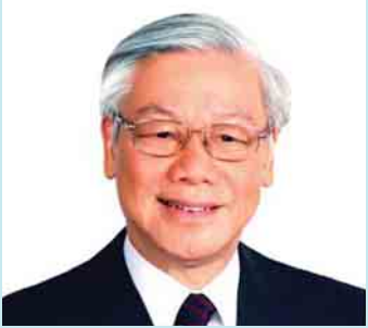
စာမျက်နှာ >> ၃

ပီယက်နမ်ဆိုရှယ်လစ်သမ္မတနိုင်ငံ ကွန်မြူနစ်ပါတီ ဗဟိုကော်မတီ အထွေထွေအတွင်းရေးမှူး၊ မစ္စတာ ငုယင်ဖူးကျောင့်၏ ကိုယ်ရေးအကျဉ်း