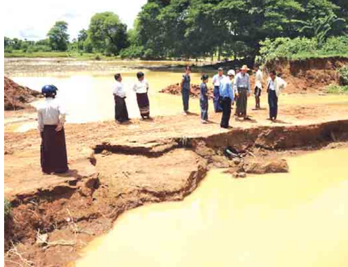
မောင်မြည်သူ(မန္တလေး)

အခမ်းအနားတွင် မန္တလေးတိုင်းဒေသကြီး ဝန်ကြီးချုပ်ခေါက်တာဇော်မြင့်မောင်၊ မြို့တော်ဝန် ခေါက်တာရဲလွင်နှင့် အစိုးရအဖွဲ့အစည်းဝင်များ၊ တိုင်းဒေသကြီး လွှတ်တော်ကိုယ်စားလှယ်များ၊ တိုင်း ဒေသကြီးအဆင့်ဌာနဆိုင်ရာများ၊ တိုင်းဒေသကြီး ငါးလုပ်ငန်းဦးစီးဌာနမှူးနှင့် ဝန်ထမ်းများ၊ သဘာဝ ပတ်ဝန်းကျင်ထိန်းသိမ်းရေးအဖွဲ့များသည် ရေပေါ်