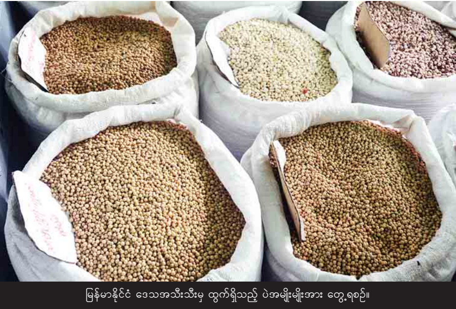
မြန်မာနိုင်ငံ ဒေသအသီးသီးမှ ထွက်ရှိသည့် ပဲအမျိုးမျိုးအား တွေ့ရစဉ်။

နေပြည်တော် ဩဂုတ် ၂၃ ပြည်ထောင်စုသမ္မတ မြန်မာနိုင်ငံတော် နိုင်ငံတော်သမ္မတ ဦးထင်ကျော်သည် ရခိုင်ပြည်နယ်ဆိုင်ရာ အကြံပေးကော်မရှင်ဥက္ကဋ္ဌ ဒေါက်တာကိုဖီအာနန် ဦးဆောင်သည့် ကော်မရှင်အဖွဲ့ဝင်များအား ယနေ့နံနက် ၁၀ နာရီခွဲတွင် နေပြည်တော်ရှိ နိုင်ငံတော်သမ္မတအိမ်တော် သံတမန်ဆောင်စဉ်ခန်းမ၌ လက်ခံတွေ့ဆုံသည်။ တွေ့ဆုံစဉ် ရခိုင်ပြည်နယ်ဆိုင်ရာ အကြံပေးကော်မရှင်၏ ကြားဖြတ်အစီရင်ခံစာပါ အကြံပြုချက်များအပေါ် မြန်မာနိုင်ငံ၏ ရေရှည်အမျိုးသားအကျိုးစီးပွားကို မျှော်မှန်းလျက် နိုင်ငံတော်၏ ဥပဒေ၊ မူဝါဒများနှင့်အညီ အကောင်အထည်ဖော်လျက်ရှိသည့် အခြေအနေများ၊ ရခိုင်ပြည်နယ်အတွင်း နိုင်ငံခြားရင်းနှီးမြှုပ်နှံမှု တိုးတက်ရရှိရေးအပါအဝင် စာမျက်နှာ ၃ ကော်လံ ၅ သို့ □ နိုင်ငံတော်သမ္မတ ဦးထင်ကျော်ထံ ရခိုင်ပြည်နယ်ဆိုင်ရာ အကြံပေးကော်မရှင်ဥက္ကဋ္ဌ ဒေါက်တာကိုဖီအာနန် ရခိုင်ပြည်နယ်ဆိုင်ရာ အကြံပေးကော်မရှင်၏ အပြီးသတ်အစီရင်ခံစာပေးအပ်စဉ်။