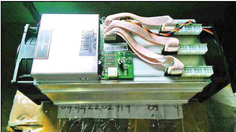
၁၂ ဒသမ ၈၂၇ သန်းခန့်) သိမ်းဆည်း ရမိခဲ့ပြီး ထူးခြားဖမ်းဆီးမှုအနေဖြင့် ဩဂုတ် ၂၂ ရက်တွင် ရန်ကုန်သို့ သွားရောက်မည့် မှန်လုံယာဉ်ကို မရမ်းချောင်း အမြဲတမ်းစစ်ဆေးရေး စခန်း ပူးပေါင်းစစ်ဆေးရေးအဖွဲ့က တားဆီးစစ်ဆေးခဲ့ရာ တရားဝင် စာရွက်စာတမ်း အထောက်အထား တစ်စုံတစ်ရာ တင်ပြနိုင်ခြင်းမရှိသည့် Computer Spare Parts ANT (သတင်းစဉ်)

နေပြည်တော် ဩဂုတ် ၂၃ တရားမဝင်ကုန်စည်များ တားဆီးထိန်းချုပ်ရေးအတွက် ရေပူနှင့်မရမ်းချောင်း အမြဲတမ်းစစ်ဆေးရေး စခန်းတို့ကို ဌာနဆိုင်ရာ ပူးပေါင်းအဖွဲ့များဖြင့် ဖွဲ့စည်းစစ်ဆေး ဆောင်ရွက်လျက်ရှိရာ ဩဂုတ် ၂၂ ရက်တွင် မန္တလေး-မူဆယ် ပြည်ထောင်စုလမ်းမကြီး တစ်လျှောက် ကုန်သွယ်မှုယာဉ်ပို့ကုန် ၄၄၆ စီး၊ သွင်းကုန် ၄၁၄ စီး၊ ရန်ကုန်-မြဝတီ လမ်းမကြီးတစ်လျှောက် ကုန်သွယ်မှု ယာဉ် ပို့ကုန် ၄၅ စီး၊ သွင်းကုန် ၁၆၈ စီး ကုန်စည်များသယ်ယူပို့ဆောင် လျက်ရှိသည်။