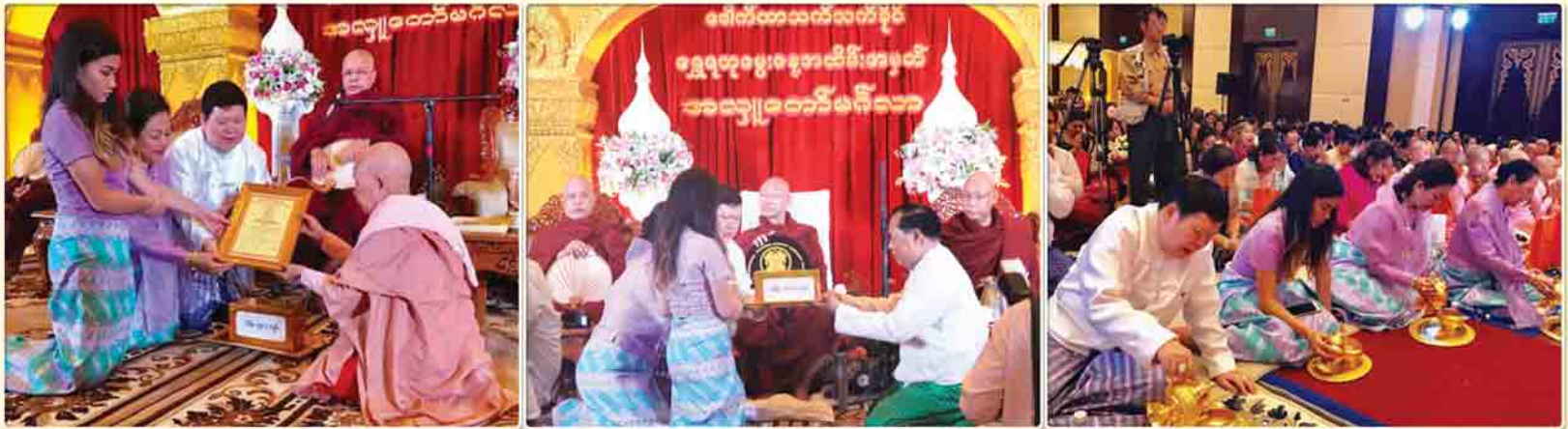
၁၉-၈-၂၀၁၇ (စနေနေ့) Sedona Hotel တွင်ကျင်းပပြုလုပ်ခဲ့သော