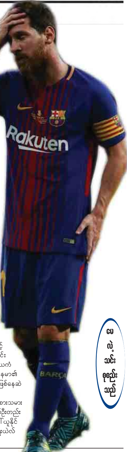
မေလဲသင်းစုစည်းသည်

ဘာစီလိုနာအသင်းသည် နေမာနေရာ အစားထိုးနိုင်မည့် ကစားသမားကို ယခုထိ ခေါ်ယူနိုင်ခြင်းမရှိဘဲ တိုက်စစ်ပိုင်းအတွက် ဒီလီယူတစ်ဦးတည်း