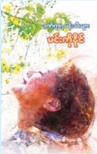
အနေကို စာရေးဆရာက ပုံဖော်ဖန်တီးထားခြင်းဖြစ်သည်။ မေနှင်းဆီ

ယင်းဝတ္ထုသည် စာရေးဆရာ မင်းကိုနိုင် အကျဉ်းကျနေစဉ် ထောင်ထဲတွင် ရေးသားထားသည့် လုံးချင်းဝတ္ထုဖြစ်ပြီး သူ့နေစဉ်မြင်တွေ့နေရသည့် ဘဝများကို အခြေခံကာ ရေးသားထားခြင်းဖြစ်သည်။ မိသားစုတစ်စု စီးပွားရေးမပြေလည်သည့်အခါ စားဝတ်နေရေးအတွက် ရုန်းကန်လှုပ်ရှားရင်း ထောင်ကျသွားရသည့် ဘဝအခြေ