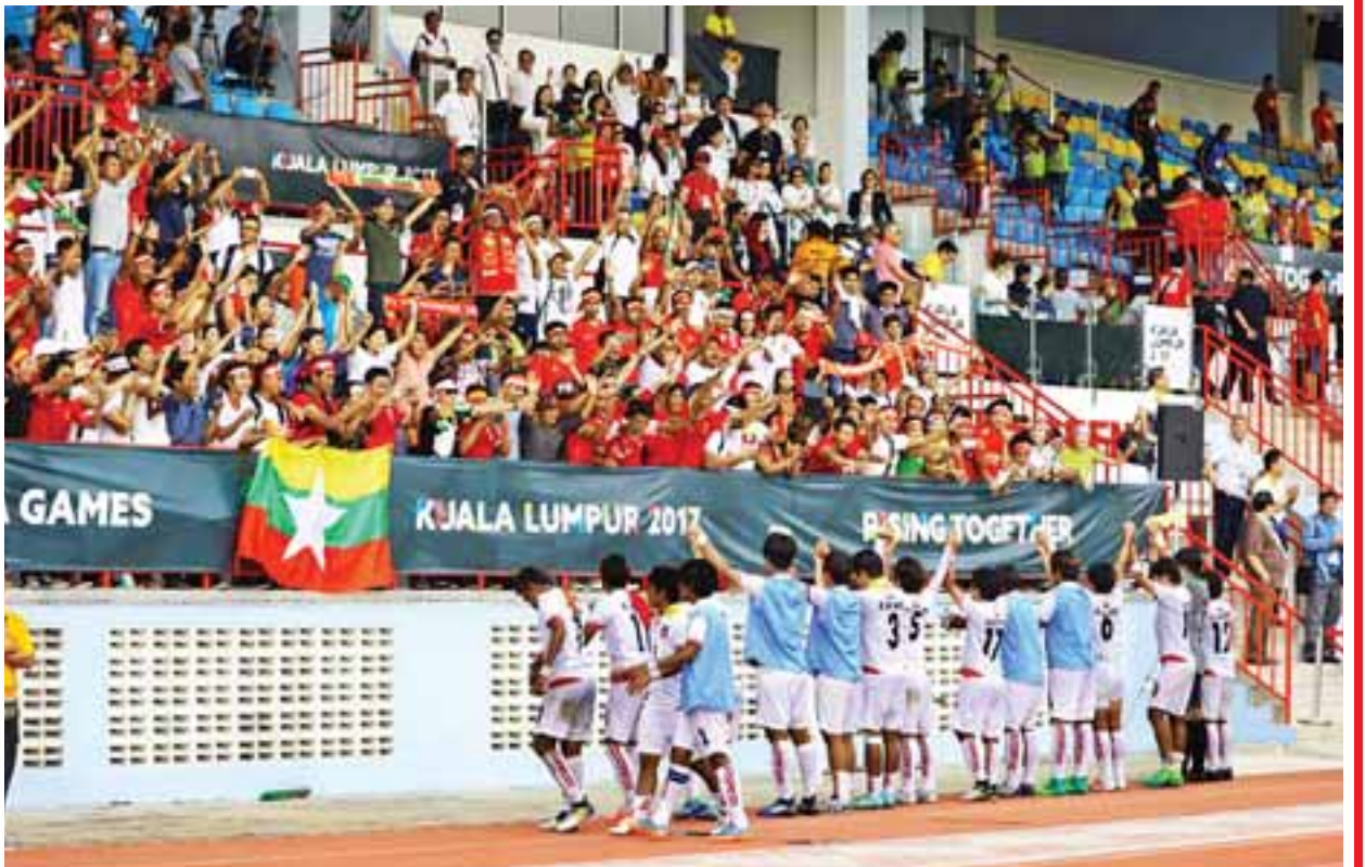
(၂၉)ကြိမ်မြောက် အရှေ့တောင်အာရှအားကစားပြိုင်ပွဲ အမျိုးသမီးဘောလုံးပြိုင်ပွဲတွင် ဖိလစ်ပိုင်အသင်းကို မြောက်-ဝိုးမရှိဖြင့် အနိုင်ရရှိခဲ့ပြီး ကြေးတံဆိပ်ဆု ရရှိရန်သေချာနေသော မြန်မာအမျိုးသမီးလက်ရွေးစင်ဘောလုံးအသင်း လာရောက်အားပေးကြသည့် မလေးရှားနိုင်ငံရောက် မြန်မာပရိသတ်များအား ဝါရပ်ပြုနှုတ်ဆက်စဉ်။

မြန်မာ U-22 အမျိုးသားဘောလုံးအသင်းဟာ ဩဂုတ်လ ၂၁ ရက်နေ့ အုပ်စုနောက်ဆုံးပွဲစဉ်မှာ အိမ်ရှင်အသင်းကို ရှုံးခဲ့ပေမယ့်လည်း အကြိုဗိုလ်လုပွဲကို ဆက်လက်