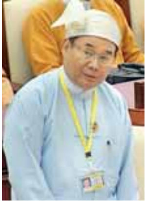
ပြည်ထောင်စုဝန်ကြီး ဦးအုန်းဝင်း