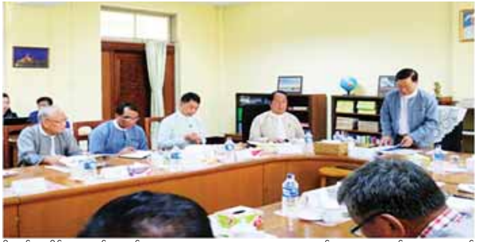
ရှိသည့် သမိုင်းအနာဂတ်အတွက် Human Resource သုတေသနစာစောင်များ ထုတ်ဝေမှုများအတွက် များ မပျောက်ပျက်ရန် အရှည်ရှည်သန်နေရန်နှင့် စွမ်းရည် ဆောင်ရွက်ထားရှိမှုများအပေါ် အားရကျေနပ်မိပါကြောင်း မြှင့်တင်ရန်အတွက် သင်တန်းများ စဉ်ဆက်မပြတ် ပြောကြားသည်။ ဖွင့်လှစ်နေမှုနှင့် သုတေသနလုပ်ငန်းများ ဆောင်ရွက်နေမှု။ (သတင်းစဉ်)

ဖြစ်သော ဗိုလ်ချုပ်အောင်ဆန်း အတ္ထုပ္ပတ္တိစာအုပ်ကို ပြန်လည်စိစစ်ပြီး ထုတ်ဝေနိုင်ရန် စီစဉ် ဆောင်ရွက်ထားရှိ မှု တစ်ဆက်တစ်စပ်တည်းသော မြန်မာသမိုင်းကြောင်းကို ဖော်ထုတ်ရေးသားရန်အတွက် လုပ်ငန်းစီမံချက်များ ချမှတ် အကောင်အထည်ဖော်ဆောင်ရွက်နေမှု၊ သုတေသန လုပ်ငန်းများနှင့်သုတေသနစာတမ်းများ ရေးသားရန် လိုအပ်သည်များကိုလည်း ဆွေးနွေးခဲ့ကြသည်။ ဆွေးနွေး ချက်များအပေါ် ခေတ္တညွှန်ကြားရေးမှူးချုပ် ဦးအောင်မြင့် က ဌာနကဆောင်ရွက်ဖြည့်ဆည်းပေးမည့် အစီအစဉ်များ၊ ဆောင်ရွက်လျက်ရှိသော လုပ်ငန်းများကို ရှင်းလင်းတင်ပြ သည်။ ထို့နောက် ပြည်ထောင်စုဝန်ကြီးက နိဂုံးချုပ်အမှာ စကားပြောကြားရာတွင် သမိုင်းသုတေသနနှင့် အမျိုးသား စာကြည့်တိုက်ဦးစီးဌာနက တာဝန်ယူဆောင်ရွက်လျက်