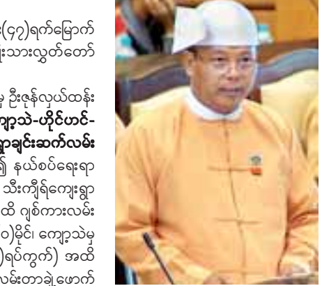
မန္တလေးတိုင်းဒေသကြီး မဲဆန္ဒနယ် အမှတ်(၇)မှ ဦးကျော်တုတ်

မန္တလေးတိုင်းဒေသကြီး မဲဆန္ဒနယ်အမှတ်(၇)မှ ဦးကျော်တုတ်၏ ညောင်ဦးခရိုင်အတွင်း ငါသရောက်မြို့-ဂျမ်းလီး-ကျောက်ပန်းတောင်းမြို့-ပွေးကျစ် ဆက်သွယ်ထားသော ကျောက်ခင်းလမ်းကို ကတ္တရာလမ်းအဖြစ် ဘဏ္ဍာနှစ်အလိုက်ပိုင်းခြားပြီး အဆင့်တိုးမြှင့်ပေးရန် အစီအစဉ် ရှိ မရှိ မေးခွန်းနှင့်စပ်လျဉ်း၍ ဆောက်လုပ်ရေးဝန်ကြီးဌာန ဒုတိယဝန်ကြီး ဦးကျော်လင်းက ငါသရောက်-ဂျမ်းလီး-ကျောက်ပန်းတောင်းလမ်းပိုင်းသည် ၂၀ မိုင် ၇ ဒသမ ၅ ဖာလုံရှိပါကြောင်း၊ ကျောက်ပန်းတောင်း-ဂျမ်းလီးလမ်းအပိုင်းသည် ၁၀ မိုင် ၁ ဖာလုံအရှည်ရှိပြီး လမ်းအခြေအနေမှာ ကတ္တရာလမ်း ၂ ဖာလုံ၊ ကျောက်လမ်း ၈ မိုင် သည် ဒသမ ၄ ဖာလုံ၊ ဂဝံလမ်း ၃ ဖာလုံရှိပြီး မြေသားလမ်း ၁ မိုင် ၃ ဒသမ ၆ ဖာလုံဖြစ်ပါကြောင်း၊ ယင်းမြေသားလမ်း ၁ မိုင် ၃ ဒသမ ၆ ဖာလုံအား ၂၀၁၇-၂၀၁၈ ဘဏ္ဍာနှစ်အတွင်း ကျောက်ချောလမ်းအဖြစ် ဆောင်ရွက်သွားမည်ဖြစ်ပါကြောင်း။