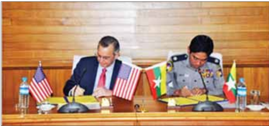
နေပြည်တော်၊ ဩဂုတ် ၂၂ ရက်နေ့တွင် မြန်မာနိုင်ငံရဲတပ်ဖွဲ့ ခေတ္တရဲချုပ် ရဲမှူးချုပ် အောင်ဝင်းဦးနှင့် အရာရှိကြီးများ၊ မြန်မာနိုင်ငံဆိုင်ရာ အမေရိကန်သံအမတ်ကြီး မစ္စတာစကော့အလန် မာစီရယ်လ်တို့က မြန်မာနိုင်ငံနှင့် အမေရိကန်နိုင်ငံ နှစ်နိုင်ငံအကြား မူးယစ်ဆေးဝါးတိုက်ဖျက်ရေးနှင့် တရားဥပဒေစိုးမိုးရေးဆိုင်ရာ သဘောတူညီချက်စာလွှာ ပြင်ဆင်ချက် (ALoA) (၂၀၁၇ ခုနှစ်)ကို လက်မှတ်ရေးထိုးခဲ့ကြောင်း သတင်းရရှိသည်။

နေပြည်တော် ဩဂုတ် ၂၂ မြန်မာနိုင်ငံနှင့် အမေရိကန်နိုင်ငံ နှစ်နိုင်ငံအကြား မူးယစ်ဆေးဝါးတိုက်ဖျက်ရေးနှင့် တရားဥပဒေစိုးမိုးရေးဆိုင်ရာ သဘောတူညီချက်စာလွှာ ပြင်ဆင်ချက် (ALoA) (၂၀၁၇ ခုနှစ်) လက်မှတ်ရေးထိုးပွဲ အခမ်းအနားကို ပြည်ထောင်စုဝန်ကြီးဌာန မြန်မာနိုင်ငံရဲတပ်ဖွဲ့ဌာနချုပ် အစည်းအဝေးခန်းမ (၁)၌ ယနေ့နံနက် ၁၂ နာရီ ၂၅ မိနစ်တွင် ကျင်းပခဲ့ရာ မူးယစ်ဆေးဝါးနှင့် စိတ်ကိုပြောင်းလဲစေသော ဆေးဝါးများအန္တရာယ် တားဆီးကာကွယ်ရေးဗဟိုအဖွဲ့ အတွင်းရေးမှူး မြန်မာနိုင်ငံရဲတပ်ဖွဲ့ ခေတ္တရဲချုပ် ရဲမှူးချုပ် အောင်ဝင်းဦးနှင့် အရာရှိကြီးများ၊ မြန်မာနိုင်ငံဆိုင်ရာ အမေရိကန်သံအမတ်ကြီး မစ္စတာစကော့အလန် မာစီရယ်လ်နှင့် ဧည့်သည်တော်များ တက်ရောက်ခဲ့ကြသည်။