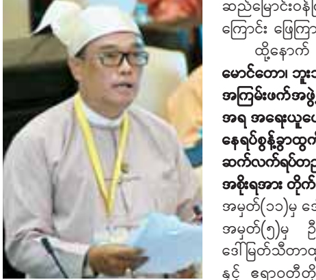
ဆောက်လုပ်ရေးဝန်ကြီးဌာန ဒုတိယဝန်ကြီး ဦးကျော်လင်း

ထို့ပြင် မေးခွန်းပါ ငါသရောက်-ဂျမ်းလီးလမ်းပိုင်းသည် ၁၀ မိုင် ၆ ဒသမ ၅ ဖာလုံရှိပြီး လမ်းအခြေအနေမှာ ကျောက်ချောလမ်း ၆ မိုင် ၆ ဒသမ ၅ ဖာလုံ၊ မြေသားလမ်း ၅ မိုင်ဖြစ်ပြီး ၂၀၁၈-၂၀၁၉ ဘဏ္ဍာနှစ်အတွင်း မြေသားလမ်းအား ကျောက်ချောလမ်းအဖြစ် အကောင်အထည်ဖော်ဆောင်ရွက်သွားမည်ဖြစ်ပါကြောင်း ဖြေကြားသည်။