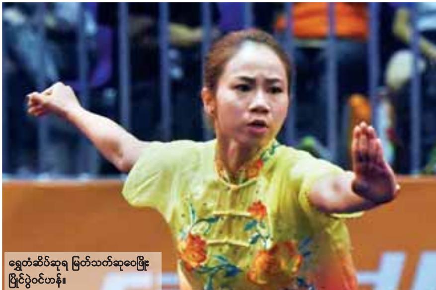
ရွှေတံဆိပ်ဆုရ မြတ်သက်ဆုဝေဖြိုး ပြိုင်ပွဲဝင်ဟန်။

ကွာလာလမ်ပူ ဩဂုတ် ၂၂ (၂၉) ကြိမ်မြောက် ဆီးဂိမ်းပွဲပြိုင်ပွဲ နောက်ဆုံးနေ့ကို ယနေ့နံနက်ပိုင်းမှစ၍ ကျင်းပရာ မြန်မာဂူရှူးအဖွဲ့က ရွှေတံဆိပ် ငွေတံဆိပ်၊ ကြေးတံဆိပ် ထပ်မံဆွတ်ခူးရရှိခဲ့ သည်။ မြန်မာဂူရှူးအဖွဲ့သည် ပြိုင်ပွဲအပြီး တွင် ရွှေတံဆိပ်၊ ငွေတံဆိပ်၊ ကြေးတံဆိပ် ဆွတ်ခူး ရရှိခဲ့သည်။