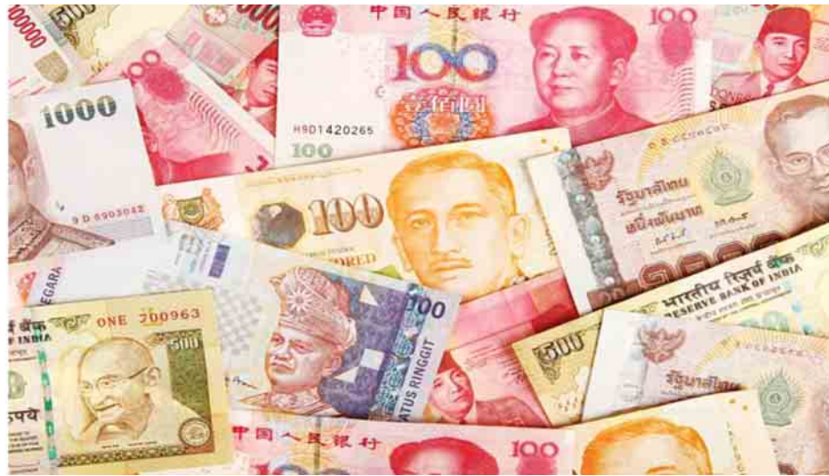
1997 ခုနှစ်က အာဆီယံအဖွဲ့ဝင်နိုင်ငံများ၏ ငွေကြေးများ

(၈) အာဆီယံပေါင်းစည်းရေးလုပ်ငန်းစဉ်များ အာဆီယံကို စတင်ဖွဲ့စည်းပြီး ဆယ်စုနှစ် နှစ်ခုလောက် အထိ အသင်းကြီးဟာ စီးပွားရေး၊ နိုင်ငံရေး၊ လုံခြုံရေး ကိစ္စရပ်တွေမှာ ပူးပေါင်းဆောင်ရွက်မှု မရှိခဲ့ဘဲ အဖွဲ့ဝင် နိုင်ငံ တွေရဲ့ ပြည်တွင်းရေးမှာ ဝင်ရောက်မထွက်ဖက်ရေးကို သာ အလေးပေးခဲ့ကြပါတယ်။