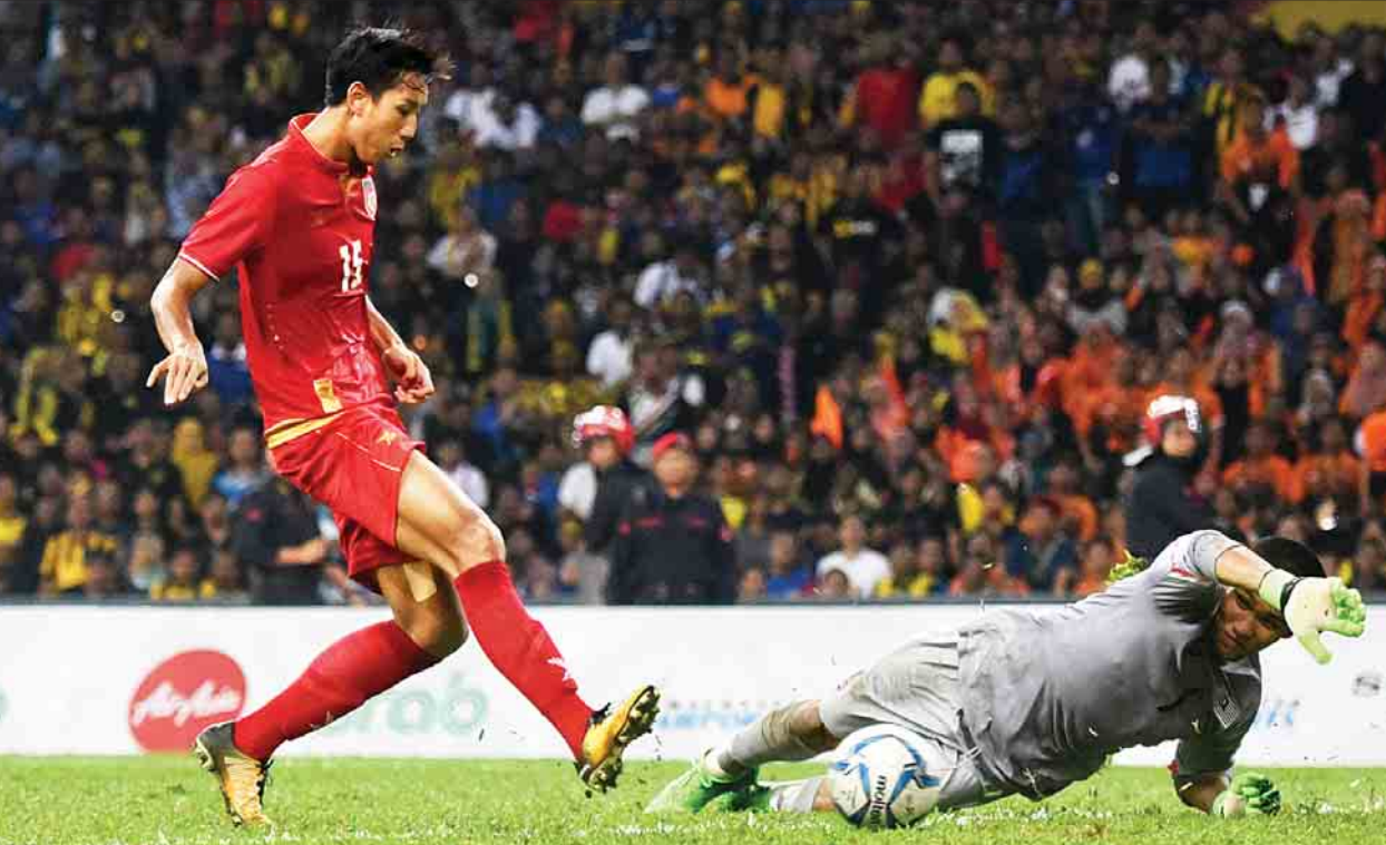
မြန်မာအသင်းအတွက် တစ်လုံးတည်းသော ချေပပိုင်းကို သန်းပိုင် သွင်းယူစဉ်။