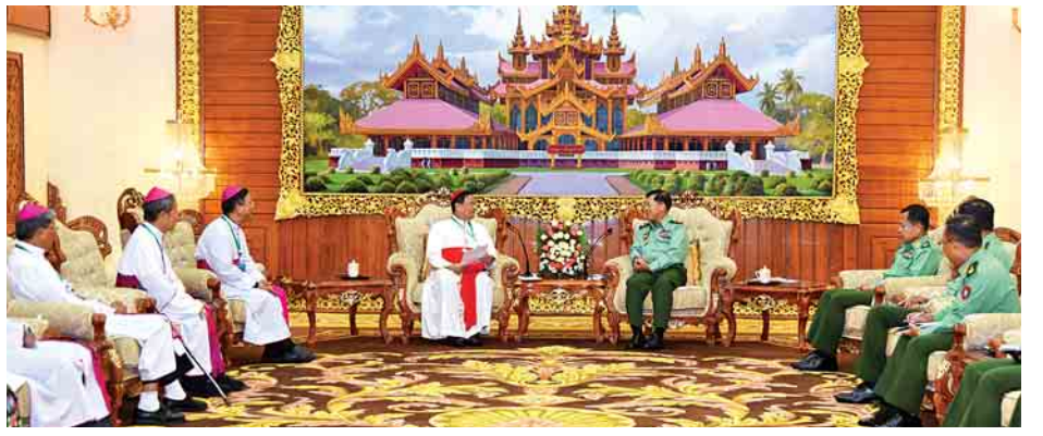
ကြောင်းနှင့် မြန်မာနိုင်ငံရေး ပြောင်းလဲမှု၊ ငြိမ်းချမ်းရေး၊ စပ်လျဉ်း၍ ရှင်းလင်းဆွေးနွေးသည်။ တိုင်းပြည်ဖွံ့ဖြိုးတိုးတက်ရေး၊ တိုင်းရင်းသား အရေးတို့နှင့် (သတင်းစဉ်)

ယုံကြည်မှုတည်ဆောက်ကာ ဖြေရှင်းနိုင်ကြောင်း၊ ဆွေးနွေး ညှိနှိုင်းသော စားပွဲပိုင်းသို့ ပြန်လည်စုရုံးကြရန် တောင်းပန် ဆန္ဒပြုကြောင်း၊ ယခုမှတ်တမ်းတင်ဆောင်ကြရာတွင် နေပြည် တော်ရှိ ပြင်းချမ်းသော ခံယူချက် နည်းဟန်များ နှင့်ဖြေရှင်းနိုင်ရန် အမိန့်ခံတော်နှင့်တကွ နိုင်ငံ ခေါင်းဆောင်များ၊ တပ်မတော်နှင့်တကွ အခြားသော အဖွဲ့ အစည်းအားလုံးအတွက် မိမိတို့ဆုတောင်းမေတ္တာပို့သ ကြောင်း ဆွေးနွေးပြောကြားသည်။