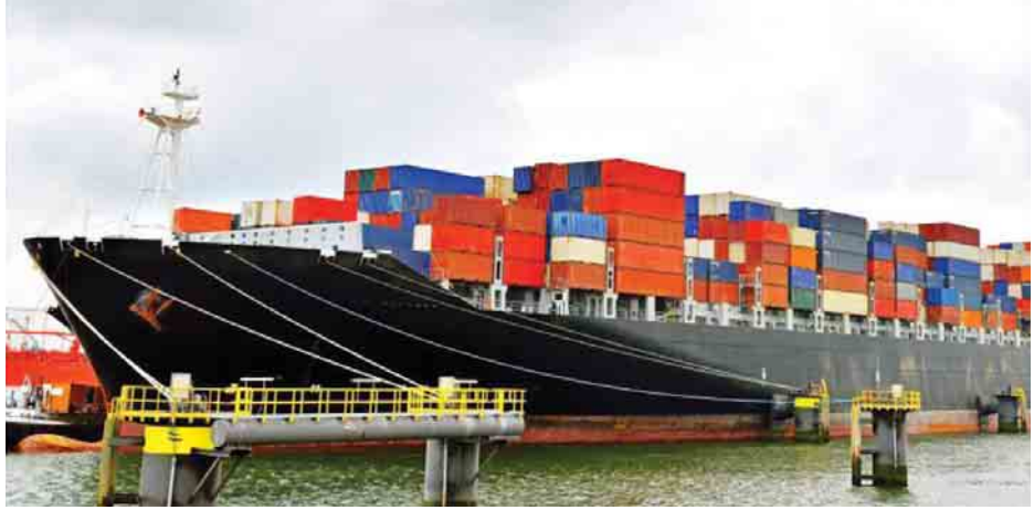
တက္ကသိုလ် ဟန်စိုးဦး

အာဆီယံခေါင်းဆောင်တွေကတော့ အဖွဲ့ဝင်နိုင်ငံတွေ အကြား စီးပွားရေးအရ ပေါင်းစည်းမှု လုပ်ငန်းစဉ်တွေ ဆောင်ရွက်နိုင် ခဲ့ရင် အာဆီယံစီးပွားရေးအသိုက်အဝန်း၊ လွတ်လပ်စွာ ကုန်သွယ်ရေးသဘောတူညီချက်နဲ့ လွတ်လပ်စွာ ရင်းနှီးမြှုပ်နှံမှု ဖန်တီးမှုတွေကတစ်ဆင့် အာဆီယံဟာ စီးပွားရေး သမဂ္ဂတစ်ခုရပ် အသွင် ဖြစ်ပေါ်လာနိုင်မယ်လို့ ယုံကြည်မျှော်လင့် . . .