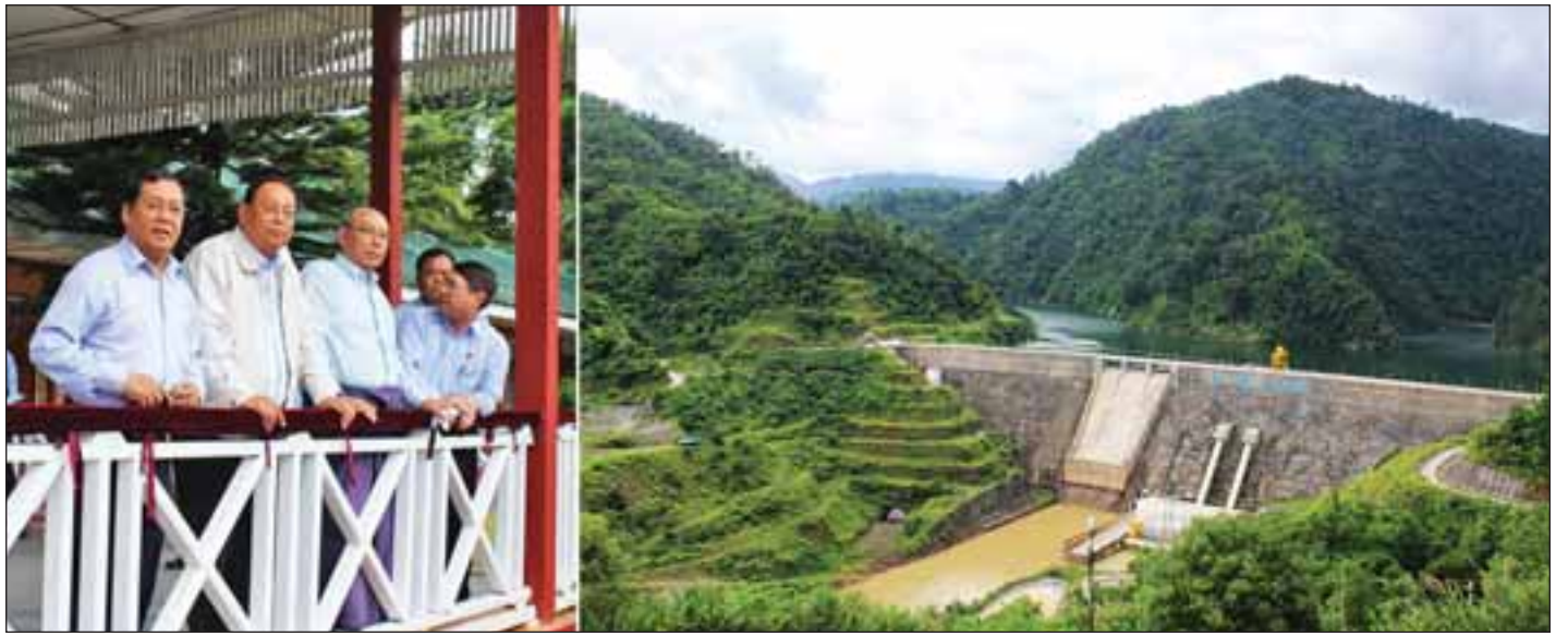
အမျိုးသားလွှတ်တော်ဥက္ကဋ္ဌ မန်းဝင်းခိုင်သန်း အထက်ပေါင်းလောင်း ရေအားလျှပ်စစ်ဓာတ်အားထုတ်လုပ်သည့်ရေလှောင်တံမံမှ ရေသိုလှောင်ထားရှိမှုနှင့် တံမံကြိုင်မှုအခြေအနေတို့ကို ကြည့်ရှုစစ်ဆေးစဉ်။

* ရှေ့ဖူးမှ ဓာတ်အားခွဲစိမ်းကိန်းနှင့် ပတ်သက်၍ လည်းကောင်း၊ လျှပ်စစ်ဓာတ်အားထုတ်လုပ်ရေးလုပ်ငန်း ဦးဆောင်