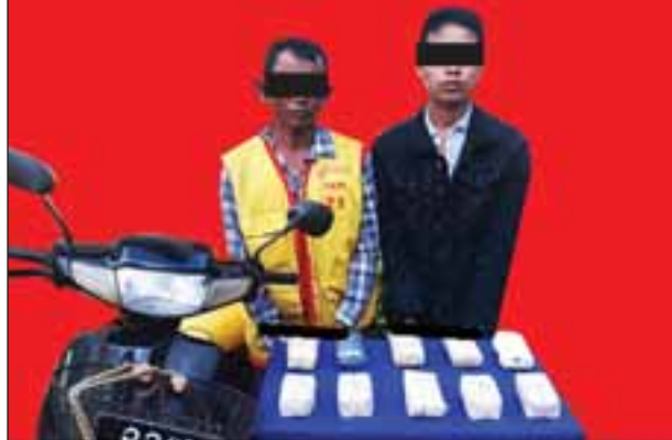
ပဲခူးမြို့နယ် တရားရုံးမှ ရုံးထုတ်ပြီး ပြန်လာသော တရားခံအား ဆိုင်ကယ်ဖြင့်တိုက်လုယူမှုကျူးလွန်ခဲ့သူများကို ဩဂုတ် ၁၉ ရက် မွန်းလွဲပိုင်းတွင် ဖမ်းဆီးရမိခဲ့ကြောင်းသိရသည်။

တိုးဂိတ်အနီး မုဆယ်-မန္တလေး ပြည်ထောင်စုလမ်းတွင် ပြည်မြို့ဆွဲ မောင်းနှင်လာသည့် ဆိုင်ကယ်ကို ရှာဖွေရာ စိတ်ကြွေးသွပ်ဆေးပြား ၃၈၀၀ ကို လည်းကောင်း၊ မူးယစ်တပ်ဖွဲ့(၂၂) မုဆယ်မှ တပ်ဖွဲ့ဝင်များပါဝင်သော ပူးပေါင်းအဖွဲ့သည် မုဆယ်မြို့ မန့်ဝိန်းရပ်ကွက် ပန်လုံ(၁) လမ်းတွင် ကျန်းကြားဝမ် မောင်းနှင်လာသည့် မော်တော်ယာဉ်ကို ရှာဖွေရာ စိတ်ကြွေးသွပ်ဆေးပြား ၃၉၀၀ ကိုလည်းကောင်း၊ မူးယစ်တပ်ဖွဲ့(၂၇)လွိုင်လင်မှ တပ်ဖွဲ့ဝင်များပါဝင်သော ပူးပေါင်းအဖွဲ့သည်