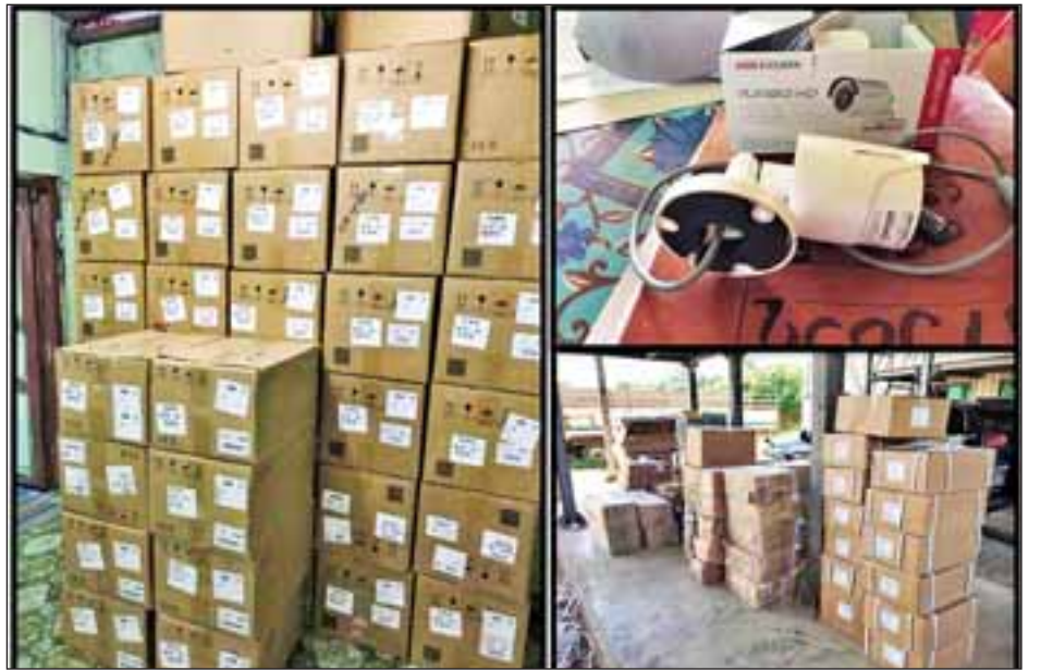
တရားဝင်စာရွက်စာတမ်း အထောက်အထား တစ်စုံတစ်ရာတင်ပြနိုင်ခြင်းမရှိသော CCTV Camera နှင့် Dyed Acrylic Varm