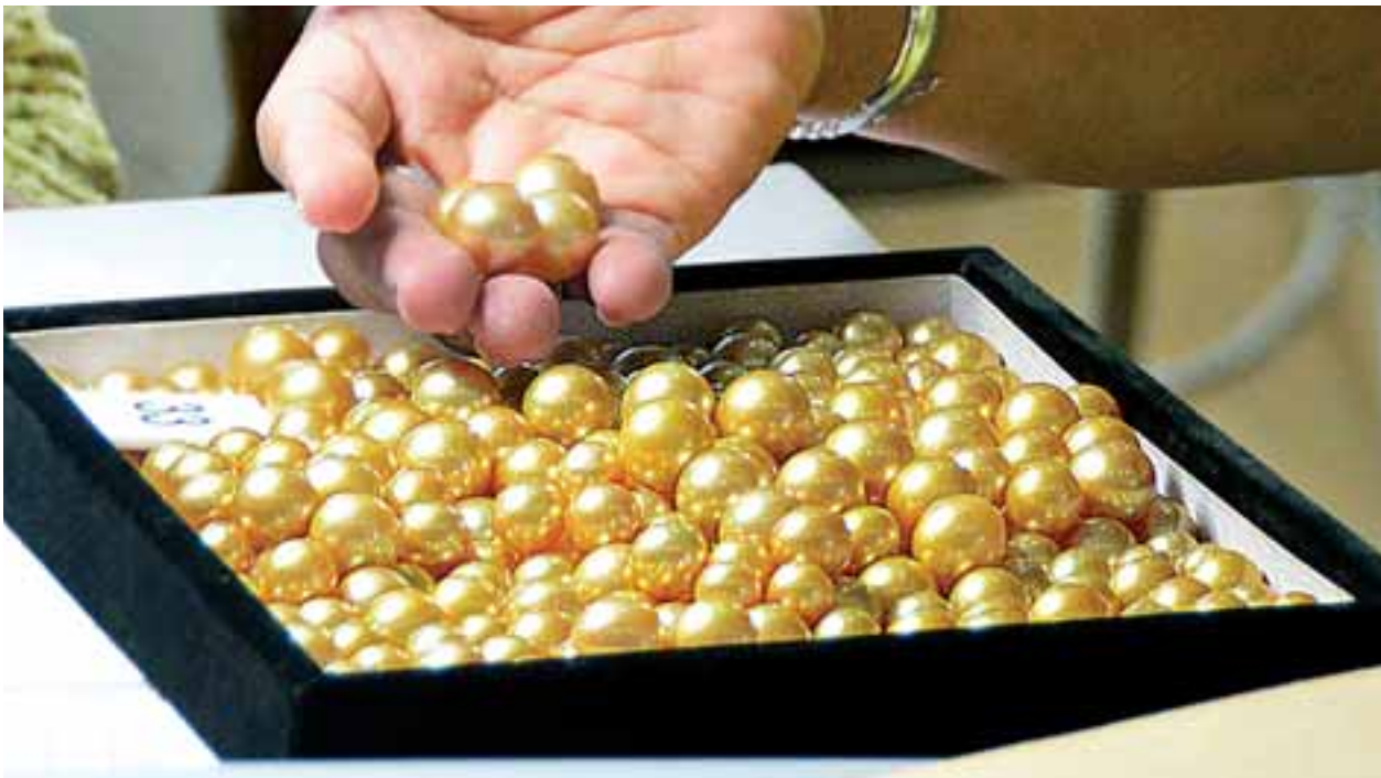
အရောင်အဆင်းလှပပြီး အရည်လည်နေသည့် မြန်မာ့ပုလဲများကို တွေ့ရစဉ်။

သယ်ဇာတနှင့် သဘာဝပတ်ဝန်းကျင်ထိန်းသိမ်းရေးဝန်ကြီးဌာန မြန်မာ့ပုလဲထုတ်လုပ်ရေးနှင့် ရောင်းဝယ်ရေး လုပ်ငန်း၏ Myanmar Pearl Auction (August-2017) ပုလဲရောင်းချပွဲကို မြန်မာ့ကျောက်မျက်ရတနာပြတိုက် ရတနာဈေးထပ်၌ ကျင်းပလျက်ရှိရာ ယနေ့နံနက်ပိုင်းတွင် တင်ဒါအမှတ်(၁)မှ ပုလဲအတွဲ ၉၀ အား အိတ်ဖွင့်တင်ဒါစနစ်ဖြင့် တင်ပြရောင်းချခဲ့ကြောင်း၊ တင်ပြပုလဲအတွဲ ၁၀၀ ရာခိုင်နှုန်း ရောင်းချနိုင်ခဲ့ကြောင်း သိရသည်။ ဆက်လက်၍ ညနေပိုင်းတွင် တင်ဒါအမှတ်(၂)မှ ပုလဲအတွဲ ၉၀ အား ရောင်းချခဲ့ရာ ပုလဲအတွဲ ၈၈ တွဲ ရောင်းချခဲ့ရသဖြင့် တင်ပြပုလဲအတွဲအပေါ်တွင် ၉၈ ရာခိုင်နှုန်း ရောင်းချရရှိခဲ့ကြောင်း သိရသည်။