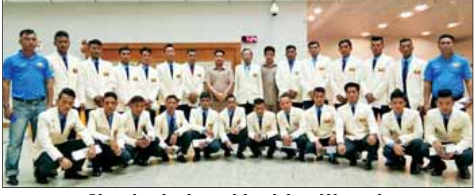
မြန်မာ့လက်ရွေးစင် အမျိုးသားဟော်ကီအသင်းကို လေဆိပ်၌ တွေ့ရစဉ်။