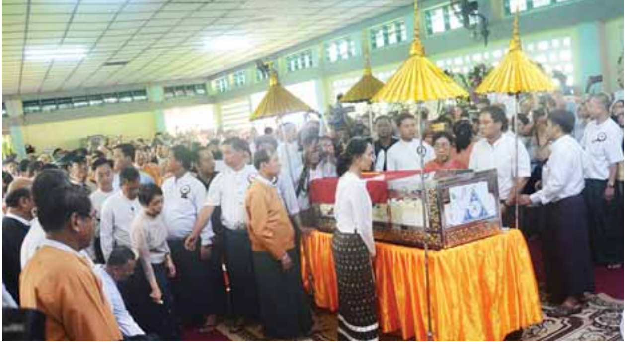
နိုင်ငံတော်၏အတိုင်ပင်ခံပုဂ္ဂိုလ် ဒေါ်အောင်ဆန်းစုကြည်နှင့် ပြည်သူ့လွှတ်တော်ဥက္ကဋ္ဌ ဦးဝင်းမြင့်တို့ အမျိုးသားဒီမိုကရေစီအဖွဲ့ချုပ်ဥက္ကဋ္ဌဟောင်း ဦးအောင်ရွှေ၏ ဈာပနအခမ်းအနားသို့ တက်ရောက်ကြစဉ်။ (သတင်းစဉ်)