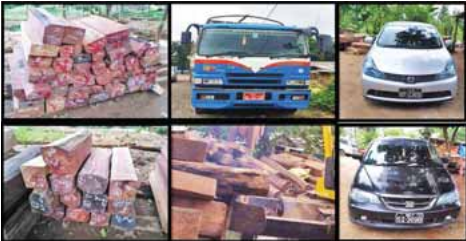
တရားဝင်စာရွက်စာတမ်းအထောက်အထားတစ်စုံတစ်ရာ တင်ပြနိုင်ခြင်းမရှိသော ပိတောက်စားရွှေတုံး၊ ပိတောက်သစ်လုံးနှင့် ပစ္စည်းသယ်ဆောင်သည့်ယာဉ်။

နေပြည်တော် ဩဂုတ် ၁၇ တရားမဝင်ကုန်စည်များ တားဆီး ထိန်းချုပ်ရေးအတွက် ရေပူနှင့်မရမ်းချောင့် အမြဲတမ်းစစ်ဆေးရေးစခန်း တို့ကို ဌာနဆိုင်ရာပူးပေါင်းအဖွဲ့များ ဖြင့် မတ် ၁ ရက်တွင် စတင်ဖွင့်လှစ် ဆောင်ရွက်ခဲ့ပြီး ဩဂုတ် ၁၆ ရက်တွင် မန္တလေး-မုဆယ် ပြည်ထောင်စု လမ်းမကြီးတစ်လျှောက် ကုန်သွယ်မှု ယာဉ် ပို့ကုန် ၄၈၄ စီး၊ သွင်းကုန် ၅၂၂ စီး၊ ရန်ကုန်-မြဝတီလမ်းမကြီး တစ်လျှောက် ကုန်သွယ်မှုယာဉ် ပို့ကုန် ၃၉ စီး၊ သွင်းကုန် ၁၁၈ စီး ကုန်စည် များ သယ်ယူပို့ဆောင်လျက်ရှိသည်။