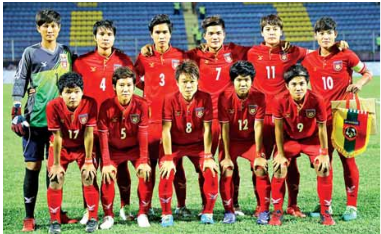
အိမ်ရှင် မလေးရှားအသင်းအား ဂိုးပြတ်အနိုင်သွင်းခဲ့သည့် မြန်မာအမျိုးသမီးဘောလုံးအသင်းကို တွေ့ရစဉ်။

အသားပေးပုံစံဖြင့် ပွဲထွက်ခဲ့သည်။ မြန်မာအသင်း သည် ပွဲအစကတည်းက တိုက်စစ်ဖွင့်ကစားခဲ့ပြီး ကွင်းတစ်ဝက်ဖိကစားနိုင်ခဲ့သည်။ မြန်မာအသင်း သည် တစ်ဖက်သတ်နီးပါး ဖိကစားနိုင်ခဲ့သော် လည်း တိုက်စစ်ကစားပုံ အမှားများခဲ့သည့်အပြင် မလေးရှားအသင်းကလည်း ခံစစ်ဦးစားပေးကစား ခဲ့သောကြောင့် မြန်မာအသင်း ဂိုးရရန် ရုန်းကန် ခဲ့ရသည်။ ပထမပိုင်းတွင် ဂိုးမရခဲ့သည့် မြန်မာ အသင်းသည် စာမျက်နှာ ၉ ကော်လံ ၄ သို့ ○