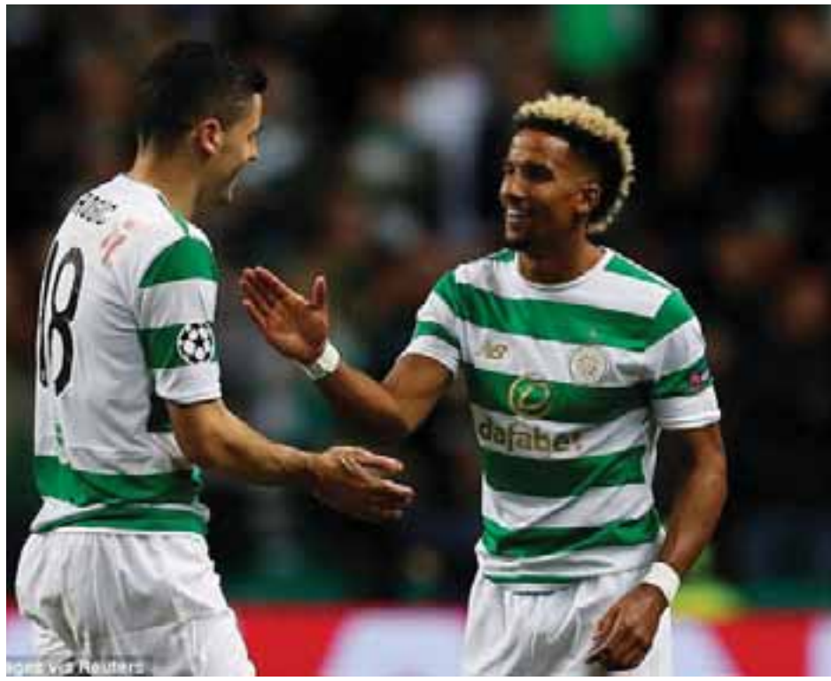
ပရီမီယာလိဂ်ပြိုင်ပွဲတွင် ချန်ပီယံအသင်းအဖြစ် ရပ်တည် ထားနိုင်သည့်အသင်းဖြစ်ပြီး ၂၀၁၄၊ ၂၀၁၅ နှင့် ၂၀၁၆ တို့တွင် ချန်ပီယံအသင်းအဖြစ် သုံးနှစ်ဆက်တိုက် အောင်ပွဲ ခံထားသည့်အသင်းဖြစ်သည်။

ဆဲလ်တစ်အသင်းသည် စကော့တလန်ပရီမီယာရှစ် ပြိုင်ပွဲ၏ လက်ရှိချန်ပီယံအသင်းဖြစ်ပြီး ပြည်တွင်းလိဂ် ပြိုင်ပွဲတွင် ဆုဖလား ၄၈ ကြိမ်အထိဆွတ်ခူးထားနိုင်သည့် အသင်းဖြစ်သည်။ ဆဲလ်တစ်အသင်းသည် ယခုပွဲစဉ်တွင် ငါးဂိုးပြတ်ဖြင့် အနိုင်ရရှိခဲ့ခြင်းကြောင့် ဒုတိယအကျော ပွဲစဉ်မယှဉ်ပြိုင်မီမှာပင် ချန်ပီယံလိဂ်ဝင်ခွင့်ရရှိရန် သေချာ နေပြီလည်းဖြစ်သည်။