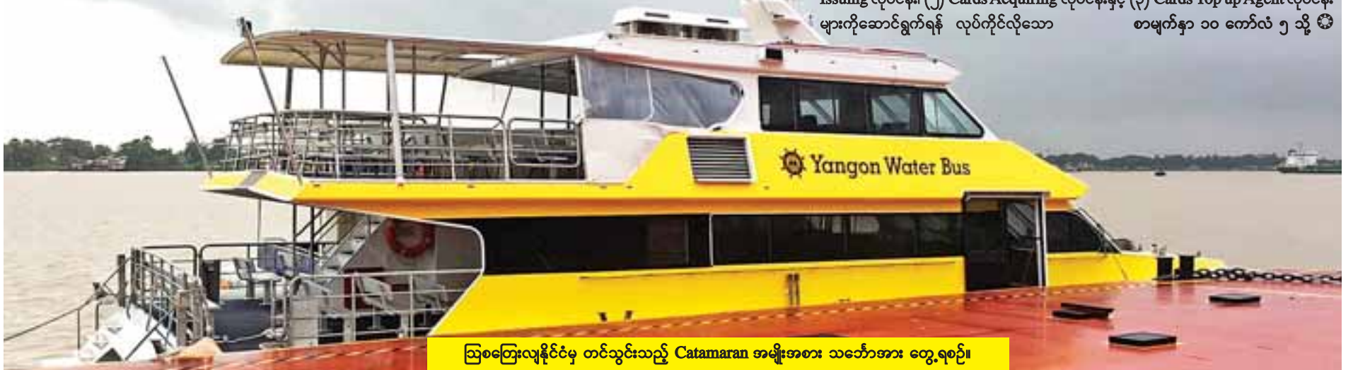
ဩစတြေးလျနိုင်ငံမှ တင်သွင်းသည့် Catamaran အမျိုးအစား သင်္ဘောအား တွေ့ရစဉ်။

ကတ်စနစ် ယာဉ်စီးခပေးချေမှုစနစ်အတွက် တင်ဒါခေါ်ယူမှုကို ရန်ကုန်တိုင်းဒေသကြီး သယ်ယူပို့ဆောင်ရေးကြီးကြပ်ကွပ်ကဲမှုအာဏာပိုင်အဖွဲ့ (YRTA) နှင့် Yangon Payment Services (YPS) ၏ ကတ်စနစ်ဖြင့် ငွေပေးချေမှုလုပ်ငန်းဝန်ဆောင်မှုအတွက် (၁) Cards Issuing လုပ်ငန်း၊ (၂) Cards Acquiring လုပ်ငန်းနှင့် (၃) Cards Top up Agent လုပ်ငန်း များကိုဆောင်ရွက်ရန် လုပ်ကိုင်လိုသော စာမျက်နှာ ၁၀ ကော်လံ ၅ သို့