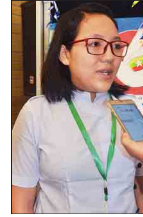
မသိင်္ဂီရွှေ