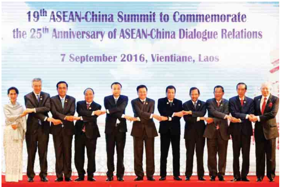
19-လူငါ့ကတိကုပူဖွဲ့ပွဲမီးဖိုဖွဲ့ပွဲပွဲပွဲပွဲပွဲပွဲ ၂၀၁၆ ခုနှစ် ဖြစ်ပွားမှု မှတ်တမ်းဓာတ်ပုံ

အာဆီယံအဖွဲ့ကြီးနဲ့ တရုတ်နိုင်ငံအကြား တောင်တရုတ် ပင်လယ်အတွင်း သက်ဆိုင်တဲ့နိုင်ငံများ လိုက်နာရမယ့် ကျင့်ဝတ်ဆိုင်ရာ ကြေညာချက် (Declaration on the Conducts of Parties in the South China Sea-DOC) ကိုလည်း ၂၀၀၂ ခုနှစ် နိုဝင်ဘာလအတွင်းက ကမ္ဘော ဇီးယားနိုင်ငံ ဖန့်မိုးပင်မြို့မှာ လက်မှတ်ရေးထိုးခဲ့ကြပါတယ်။ DOC ကို အကောင်အထည်ဖော်နိုင်ဖို့ လမ်းညွှန်ချက်တွေ (Guidelines) ကိုလည်း အာဆီယံအဖွဲ့ကြီးနဲ့ တရုတ်နိုင်ငံ အကြား ၂၀၀၁ ခုနှစ် ဇူလိုင်လအတွင်း ဘာလီမြို့မှာ အတည်ပြုနိုင်ခဲ့ပါတယ်။ အာဆီယံ-တရုတ်မိတ်ဖက် ဆက်ဆံမှု (၂၅) နှစ်ပြည့်မြောက်တဲ့ အထိမ်းအမှတ်ထိပ်သီး အစည်းအဝေးမှာ DOC ကို အပြည့်အဝနဲ့ ထိထိ ရောက်ရောက် အကောင်အထည်ဖော်သွားဖို့နဲ့ တောင် တရုတ်ပင်လယ်အတွင်း လိုက်နာရမယ့်ကျင့်ထုံး (Code of Conducts in the South China Sea-COC) တွေကို တူညီဆန္ဒနဲ့ ဆောလျင်စွာ အတည်ပြုသွားနိုင်ဖို့လည်း နှစ်ဖက်ခေါင်းဆောင်တွေအကြား လက်တွဲဆောင်ရွက် သွားကြဖို့ ဖော်ပြခဲ့ကြပါတယ်။ အခုဆိုရင် အာဆီယံနဲ့ တရုတ်နိုင်ငံအကြား COC ရဲ့ အခြေခံမူဘောင် (Framework of COC in the South China Sea) တွေကို ညှိနှိုင်းသဘောတူညီမှု ရရှိခဲ့ပြီးဖြစ်တဲ့အတွက် တိုးတက်မှုတွေ ရရှိလာခဲ့ပြီဖြစ်ပါတယ်။