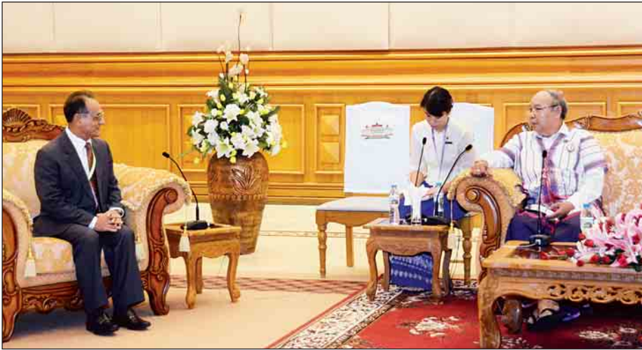
ဆွေးနွေးခဲ့ကြကြောင်း သတင်းရရှိ (သတင်းစဉ်) အမျိုးသားလွှတ်တော်ဥက္ကဋ္ဌ မန်းဝင်းခိုင်သန်း မြန်မာနိုင်ငံဆိုင်ရာ နီပေါသံအမတ်ကြီး H.E. Mr. Bhim K. Udas အား လက်ခံတွေ့ဆုံစဉ်။

နေပြည်တော် ဩဂုတ် ၁၄ အမျိုးသားလွှတ်တော်ဥက္ကဋ္ဌ မန်းဝင်း ခိုင်သန်းသည် မြန်မာနိုင်ငံဆိုင်ရာ နီပေါ သံအမတ်ကြီး H.E. Mr. Bhim K. Udas အား ယနေ့ မွန်းလွဲ ၂ နာရီတွင် နေပြည်တော်ရှိ အမျိုးသားလွှတ်တော် ဧည့်ခန်းမ ဆောင်၌ လက်ခံတွေ့ဆုံသည်။ တွေ့ဆုံစဉ် နှစ်နိုင်ငံ လွှတ်တော် များ ဖွဲ့စည်းမှု၊ မြန်မာနိုင်ငံ၏ ဥပဒေ ပြုရေးဆိုင်ရာ လုပ်ငန်းစဉ်များ၊ ငြိမ်းချမ်းရေးလုပ်ငန်းစဉ်များ၊ မြန်မာ- နီပေါ နှစ်နိုင်ငံချစ်ကြည်ရင်းနှီးမှု တိုးမြှင့်ရေး၊ ပူးပေါင်းဆောင်ရွက်ရေး ဆိုင်ရာ ကိစ္စရပ်များ၊ ခရီးသွားလာရေး၊ ကုန်သွယ်ရေးနှင့် ရင်းနှီးမြှုပ်နှံမှု ဆိုင်ရာ ကိစ္စရပ်များနှင့် စပ်လျဉ်း၍