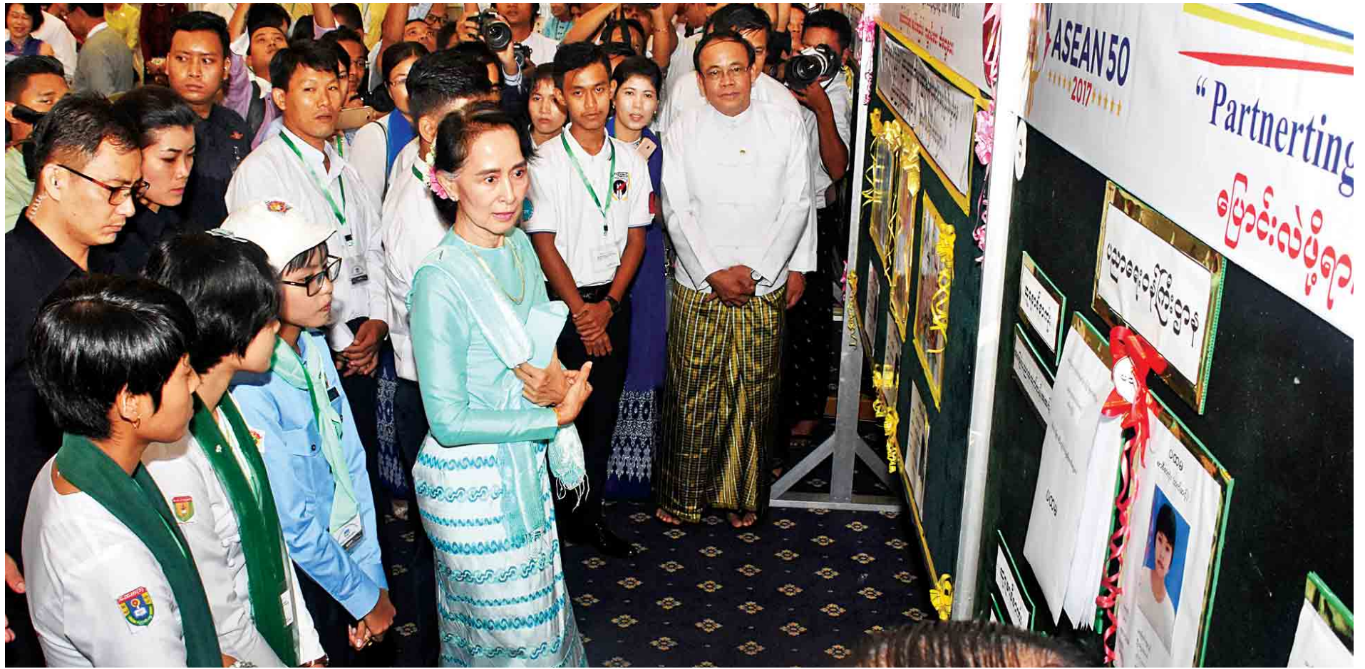
အာဆီယံတည်ထောင်ခြင်း နှစ် (၅၀)ပြည့်အထိမ်းအမှတ် ဓာတ်ပုံပြခန်းကို နိုင်ငံတော်၏အတိုင်ပင်ခံပုဂ္ဂိုလ် ဒေါ်အောင်ဆန်းစုကြည် လှည့်လည်ကြည့်ရှုစဉ်။

အာဆီယံ နှစ်(၅၀)ပြည့် အထိမ်းအမှတ်အခမ်းအနားကို ယနေ့နံနက် ၁၀ နာရီတွင် နေပြည်တော်ရှိ မြန်မာအပြည်ပြည်ဆိုင်ရာ ကွန်ဗင်းရှင်းဗဟိုဌာန(၂)၌ ကျင်းပရာ နိုင်ငံတော်၏အတိုင်ပင်ခံပုဂ္ဂိုလ် ဒေါ်အောင်ဆန်းစုကြည် တက်ရောက်အမှာစကား ပြောကြားသည်။