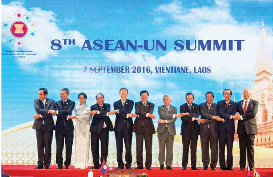
(8)လူငါ့ကတိကုပူဖွဲ့ပွဲမီးဖိုဖွဲ့ပွဲပွဲပွဲပွဲပွဲ ၂၀၁၆ ခုနှစ် ဖြစ်ပွားမှု မှတ်တမ်းဓာတ်ပုံ

အာဆီယံနဲ့ ကုလသမဂ္ဂအကြား စီးပွားရေးနဲ့ ဖွံ့ဖြိုး တိုးတက်ရေးကဏ္ဍ၊ စားနပ်ရိက္ခာနဲ့ စွမ်းအင်လုံခြုံရေး ကဏ္ဍ၊ ကုလသမဂ္ဂထောက်ခံမှုနဲ့ ဖွံ့ဖြိုးတိုးတက်ရေးရည်မှန်း ချက်များရရှိရေးကဏ္ဍ၊ ကျန်းမာရေးစောင့်ရှောက်မှုနဲ့ လူမှု ဖူလုံရေးအပါအဝင် လူသားဘဝမြှင့်တင်ရေးကဏ္ဍ၊ သဘာဝ ပတ်ဝန်းကျင်ထိန်းသိမ်းရေး၊ သဘာဝဘေးအန္တရာယ် စီမံ ခန့်ခွဲရေးကဏ္ဍ၊ ယဉ်ကျေးမှုနဲ့ ပညာရေးကဏ္ဍတွေမှာလည်း ပူးပေါင်းဆောင်ရွက်မှုတွေ ပြုလုပ်လျက်ရှိပါတယ်။ ကုလ သမဂ္ဂအထွေထွေညီလာခံကာလအတွင်း နယူးယောက် မြို့မှာ အာဆီယံနိုင်ငံများမှ နိုင်ငံခြားရေး ဝန်ကြီးများနဲ့ ကုလသမဂ္ဂအတွင်းရေးမှူးချုပ်တို့အကြား ပုံမှန်တွေ့ဆုံ ဆွေးနွေးမှုတွေကိုလည်း ၂၀၁၀ ပြည့်နှစ်ကစပြီး ကျင်းပ လျက်ရှိပါတယ်။ ဆက်လက်ဖော်ပြပါမည်။