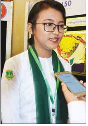
မဆုရည်မြတ်စံ