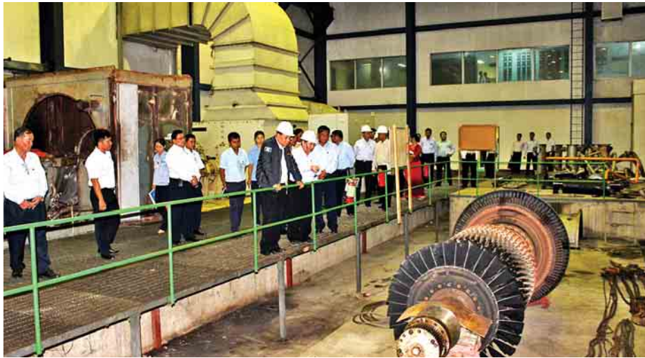
လေးမျက်နှာဘက်ကမ်း ချဲ့ကပ်တံတားလုပ်ငန်းများ ဆောင်ရွက်နေမှု၊ ပင်မတံတားရေလယ်လုပ်ငန်းများ ဆောင်ရွက်နေမှုတို့ကို ကြည့်ရှုစစ်ဆေးပြီး တာဝန်ရှိသူ

လျှပ်စစ်နှင့် စွမ်းအင်ဝန်ကြီးဌာနနှင့် ဆောက်လုပ်ရေး ဝန်ကြီးဌာန ပြည်ထောင်စုဝန်ကြီး ဦးဝင်းခိုင်သည် ဩဂုတ် ၁၂ ရက် နံနက်ပိုင်းက ရန်ကုန်-ပုသိမ်လမ်း ပြုပြင်ထိန်းသိမ်းရေးရုံးရှိ တိုက်ရိုက်လမ်းတစ်လျှောက် ကြည့်ရှုစစ်ဆေးပြီး မိုင်တိုင်အမှတ် (၂၁/၆)၌ ၂၀၁၆ ခုနှစ်က ရေကျော်သည့် နေရာအား ကွန်ကရစ်လမ်းအဖြစ် ပြန်လည်ပြုပြင်ထားရှိမှု တို့ကို ကြည့်ရှုစစ်ဆေးပြီး တာဝန်ရှိသူများအား လုပ်ငန်း လိုအပ်ချက်များ မှာကြားသည်။