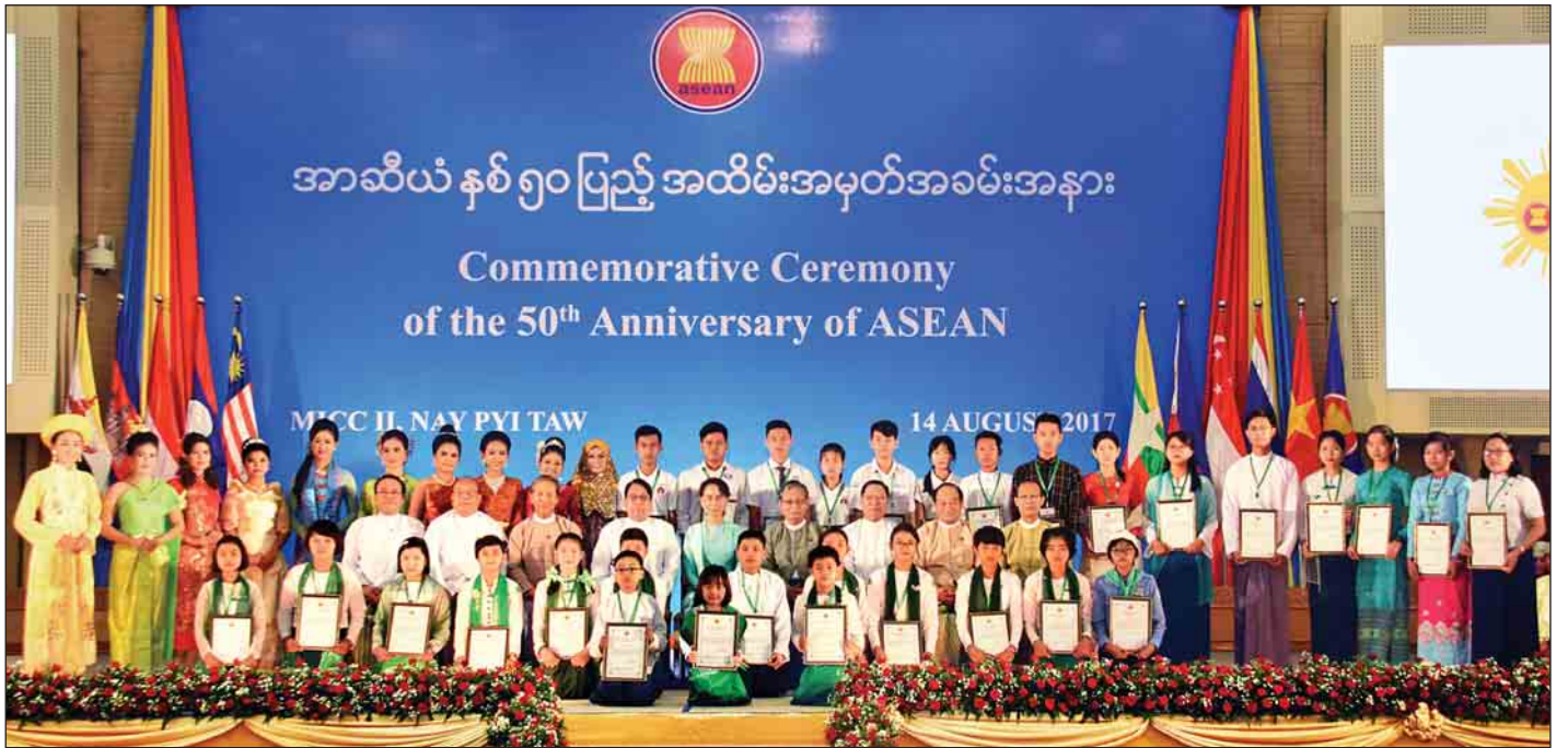
နိုင်ငံတော်၏အတိုင်ပင်ခံပုဂ္ဂိုလ် ဒေါ်အောင်ဆန်းစုကြည်နှင့် အာဆီယံနှစ်(၅၀)ပြည့်အထိမ်းအမှတ်အခမ်းအနားသို့ တက်ရောက်လာကြသူများ မှတ်တမ်းဓာတ်ပုံရိုက်ကြစဉ်။ (သတင်းစဉ်)

“ဒါ့အပြင်အာဆီယံကဦးဆောင်တဲ့ ဒေသဆိုင်ရာ အစီအမံတွေဖြစ်တဲ့ ဆွေးနွေးဖက်နိုင်ငံတွေနဲ့ အာဆီယံ+၁၊ အာဆီယံ+၃၊ အာဆီယံဒေသဆိုင်ရာဖိုရမ်၊ အရှေ့အာရှ ထိပ်သီးအစည်းအဝေးနဲ့ အာဆီယံနဲ့ ဆွေးနွေးဖက်ကာကွယ်ရေးဝန်ကြီးများ အစည်းအဝေးများ အစရှိတဲ့ အာဆီယံဦးဆောင်တဲ့ အစီအစဉ်တွေမှာ အာဆီယံရဲ့ အချက်အချာကူမှုကို ပိုမိုအားပြည့်ပေးနိုင်ခဲ့ပါတယ်။ ဒါ့အပြင်၊ ပိုမိုများပြားလာနေတဲ့ ဆွေးနွေးဖက်နိုင်ငံတွေ၊ ကဏ္ဍအလိုက် ဆွေးနွေးဖက်နိုင်ငံတွေနဲ့ အာဆီယံရဲ့ ဆက်ဆံရေးကို ပိုမိုတိုးမြှင့်ပေးနိုင်ခဲ့ပြီး ဆွေးနွေးဖက်နိုင်ငံ အများစုနဲ့လည်း မဟာဗျူဟာမြောက်ဆက်ဆံရေးကို တည်ဆောက်နိုင်စေခဲ့ပါတယ်။