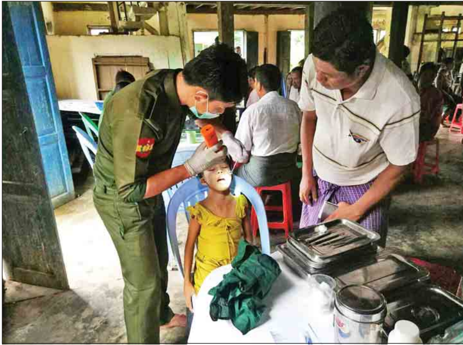
ဗိုက်နာရောဂါ ၉၆ ဦး၊ သွေးတိုးရောဂါ ၆၁ ဦး၊ ဆီးချိုရောဂါ ခုနစ်ဦး စုစုပေါင်း ၃၄၂ ဦးတို့ကို လိုအပ်သည့် များ ဆောင်ရွက်ပေးခဲ့ကြောင်း ကျန်းမာရေးစောင့်ရှောက်မှု လုပ်ငန်း သတင်းရရှိသည်။ (သတင်းစဉ်)

အမ်း ဩဂုတ် ၁၄ အနောက်ပိုင်းတိုင်း စစ်ဌာနချုပ် နယ်မြေခံဆေးတပ်ရင်းမှ နယ်လှည့် ဆေးကုသရေးအဖွဲ့သည် ဆေးကုသမှု လုပ်ငန်းများဆောင်ရွက်လျက်ရှိရာ လတ်တလော အကြမ်းဖက်မှုများ ကြောင့် နီးစပ်ရာကျေးရွာများ၌ ပြောင်းရွှေ့နေထိုင်ရာမှ နေရပ် ပြန်လည်ရောက်ရှိလာသော ဒေသခံ တိုင်းရင်းသား ပြည်သူများအား ဩဂုတ် ၁၂ ရက်တွင် ရသေ့တောင် မြို့နယ် စေတီပြင်ကျေးရွာ၌ လည်းကောင်း၊ ဩဂုတ် ၁၃ ရက်တွင် ချွတ်ပြင်ကျေးရွာ၌ လည်းကောင်း ကျန်းမာရေးစောင့်ရှောက်မှုလုပ်ငန်း များနှင့် ဆေးဝါးကုသမှုများ ဆောင်ရွက်ပေးခဲ့ကြောင်း သိရသည်။ ထိုသို့ဆောင်ရွက်ပေးရာတွင် သွား ရောဂါ ၂၀ ဦး၊ ဝမ်းပျက် ဝမ်းလျှော ရောဂါ ခြောက်ဦး၊ အထွေထွေ အားနည်းရောဂါ ၁၂၂ ဦး၊ နှလုံး အားနည်းရောဂါ ငါးဦး၊ ဗိုက်အောင့်