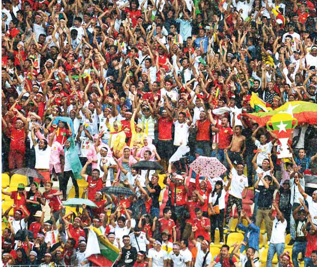
မြန်မာ-စင်ကာပူပွဲစဉ်တွင် လာရောက်အားပေးကြသည့် မလေးရှားနိုင်ငံမှ မြန်မာပရိသတ်များအား တွေ့ရစဉ်။