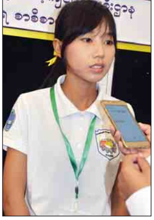
မအေးငြိမ်းသူ