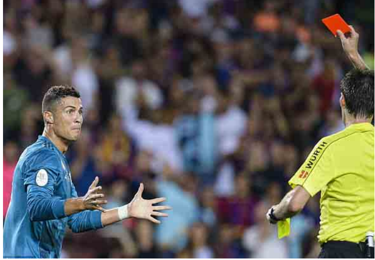
ဧပြီလ - ရေးသားသည်

ချယ်လ်ဆီးအသင်းနှင့် ဘန်လေအသင်းတို့၏ ပွဲစဉ်တွင် ပါဝင်ကစားခွင့်မရရှိခဲ့သည့်အပြင် အသင်း၏ လေ့ကျင့်ရေးအစီအစဉ်များမှာပင် ပါဝင်လေ့ကျင့်ကစားခွင့် မရရှိခဲ့ပေ။ ထို့ကြောင့် တိုက်စစ်မှူး ဒီယေဂိုကော် စတာက မိမိအား အသင်းတွင် ဆက်မရှိလို ပါက အသင်းမှ ထွက်ခွာခွင့်ပြုသင့်ကြောင်း နှင့် အသင်းမှ မည်သည့်အကြောင်းပြချက် ကြောင့် ထွက်ခွာခွင့်မရကြောင်းတို့နှင့် စပ်လျဉ်း၍ မေးခွန်းထုတ်ခဲ့သည်။ တိုက်စစ်မှူး ဒီယေဂိုကော်စတာသည် ၂၀၁၄ ခုနှစ်အတွင်းက စပိန်လာလီဂါကလပ် အက်သလက်တီကိုမက်ဒရစ်အသင်းမှ ပရီမီ ယာလိဂ်ကလပ် ချယ်လ်ဆီးအသင်းသို့ ပြောင်း ရွှေ့လာခဲ့သူဖြစ်ပြီး ချယ်လ်ဆီးအသင်းနှင့်အတူ ပရီမီယာလိဂ်ဖလားနှစ်ကြိမ်နှင့် လိဂ်ဖလား တစ်ကြိမ်တို့ကို ရယူဆွတ်ခူးနိုင်ခဲ့သူဖြစ်သည်။