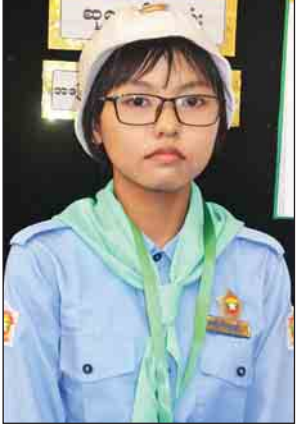
မစုမြတ်ရွှေရည်