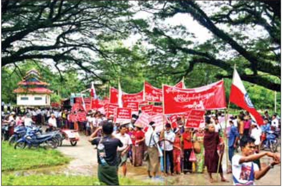
ရခိုင်ပြည်နယ်တွင် ကောင်းမွန်သော လုံခြုံရေးစနစ်ပေါ်ပေါက်ရေး ငြိမ်းချမ်းစွာ ဆန္ဒထုတ်ဖော်