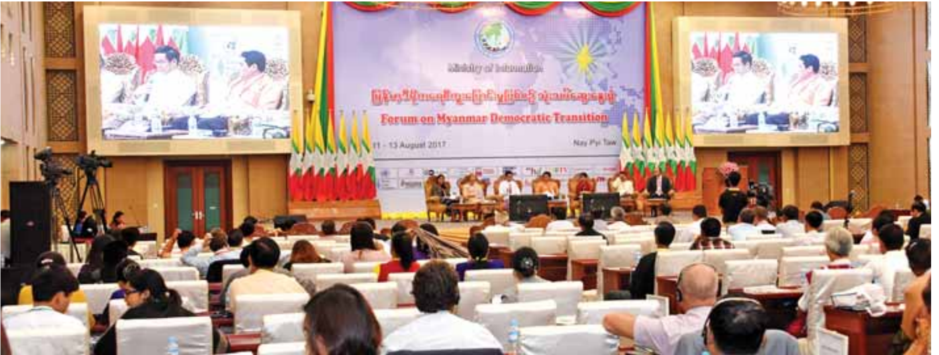
တင်ပြဆွေးနွေးခဲ့သည့် စာတမ်းခေါင်းစဉ် ခြောက်ခုအပေါ် မြန်လည်သုံးသပ်ဆွေးနွေးမှု ကျင်းပစဉ်။

သုံးရက်ကြာကျင်းပခဲ့သည့် မြန်မာ့ဒီမိုကရေစီကူးပြောင်းမှုဖြစ်စဉ် သုံးသပ်ဆွေးနွေးပွဲ(Forum on Myanmar Democratic Transition)တွင် တင်ပြဆွေးနွေးခဲ့သည့် စာတမ်းခေါင်းစဉ် ခြောက်ခုအပေါ် မြန်လည်သုံးသပ်ဆွေးနွေးမှု အစီအစဉ်ကို ယနေ့မနန်းလွဲ ၂ နာရီခွဲတွင် နေပြည်တော်ရှိ မြန်မာအပြည်ပြည်ဆိုင်ရာကွန်ဗင်းရှင်းဗဟိုဌာန-၂ (MICC-II)၌ ကျင်းပသည်။