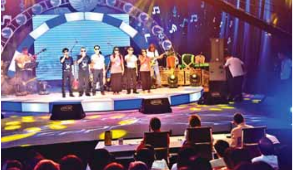
စခန်းများ၊ ပရဟိတလုပ်ငန်းများ ဆောင်ရွက်ရာနေရာ ဌာနများသို့ သွားရောက်၍လည်း ထောက်ပံ့လှူဒါန်း

level -1 အဆင့် ဒေသလက်ရွေးစင်ရွေးချယ်ပွဲစဉ်(၁) တွင် ဝင်ရောက်ယှဉ်ပြိုင်ခဲ့ကြသော ပြိုင်ပွဲစဉ် ၁၀ ဦးထဲမှ ပထမ မေသူကျော်၊ ဒုတိယ မေမာဇင်၊ တတိယ မောရေ တို့ကို ရွေးချယ်ခဲ့သည်။ အဆိုပါပြိုင်ပွဲသို့ ရန်ကုန်တိုင်းဒေသကြီး လူမှုရေး ဝန်ကြီး ဦးနိုင်ငံလင်း၊ ရခိုင်တိုင်းရင်းသားရေးရာဝန်ကြီး ဦးဇော်အေးမောင်၊ မြန်မာ့အသံနှင့် ရုပ်မြင်သံကြား ညွှန်ကြားရေးမှူးချုပ် ဦးမြင့်ထွေးနှင့် တာဝန်ရှိသူများ၊ ဖိတ်ကြားထားသူများ တက်ရောက်အားပေးခဲ့ကြသည်။ ရန်ကုန်မြို့၏ Level-1 ပွဲစဉ်(၂)ကို ဩဂုတ် ၂၀ ရက်တွင် ဆက်လက်ကျင်းပသွားမည်ဖြစ်သည်။ ယခုကဲ့သို့ သတ်မှတ်မြို့များတွင် ငြိမ်းချမ်းရေးဂီတ ပွဲတော်သီချင်းဆိုပြိုင်ပွဲများ ကျင်းပလျက်ရှိသကဲ့သို့ ငြိမ်းချမ်းရေးဂီတပွဲတော်မိသားစုနှင့် စေတနာရှင် အလှူရှင် များသည် ကျင်းပရာမြို့များရှိ တိုက်ပွဲရှောင်(ယာယီ)