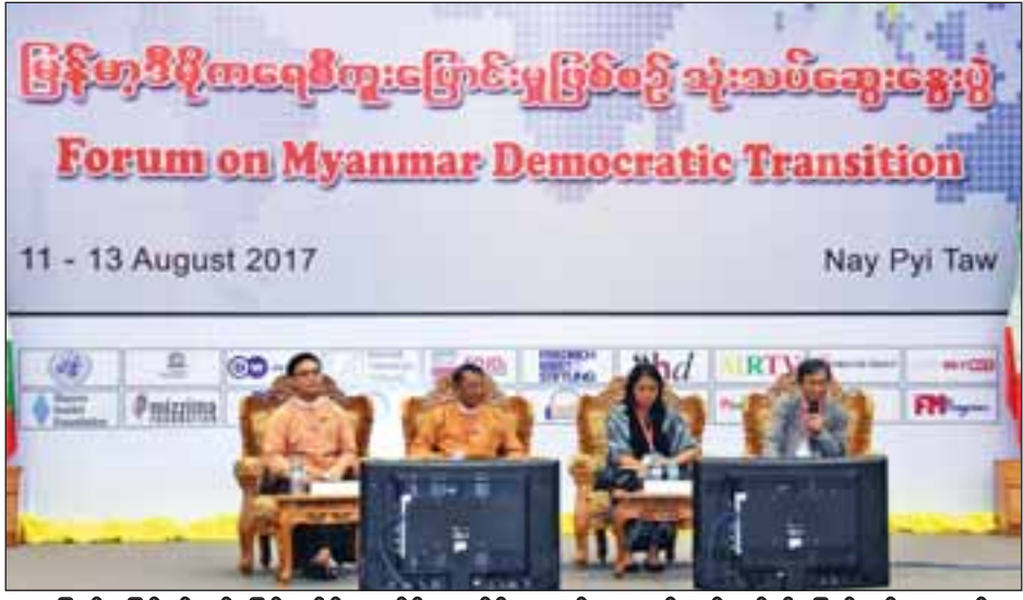
ကူးပြောင်းမှုဖြစ်စဉ်တွင် မြန်မာနိုင်ငံလက်ရှိရောက်ရှိနေသည့်နေရာနှင့် စပ်လျဉ်း၍ ပြည်တွင်းပညာရှင်များ ဆွေးနွေးကြစဉ်။

သီးခြားလွတ်လပ်သည့် နိုင်ငံရေးပါတီ၊ သဘောကွဲလွဲမှုအပေါ်တွင် သည်းခံနိုင်မှု၊ နိုင်ငံရေးအကျဉ်းသား၊ လူ့အခွင့်အရေးတို့နှင့် တိုင်းတာခဲ့ပါကြောင်း၊ အဆိုပါ အချက်များတွင် အားနည်းနေပါကြောင်း၊ အကူးအပြောင်းကို စနစ်တကျကူးပြောင်းနိုင်ရန် ကျယ်ပြန့်စွာစဉ်းစားမဟာဗျူဟာ ချမှတ်ဆောင်ရွက်ရန် လိုအပ်ပါကြောင်း၊ Time-bound Action Plan ချမှတ်၍ ရေးဆွဲရမည်ဖြစ်ပါကြောင်း၊ ထိုအခြေအနေများကို Indicator များဖြင့်တိုင်း