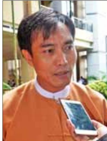
ဦးသိန်းဆွေ

ပြည်ပပညာရှင်တွေရဲ့ အကြံပေးချက်တွေလည်းပါမယ်။ ပြန်ကြားရေးဝန်ကြီးဌာနက ဦးဆောင်ပြီးလုပ်တယ်ဆိုတော့ အစိုးရဝန်ကြီးဌာနတစ်ခုအနေနဲ့လည်း ဒီအပေါ်မှာအလေးထားပြီးလုပ်တယ်။ လူထုရဲ့အသံ၊ ပညာရှင်တွေရဲ့အသံ ဘက်ပေါင်းစုံရဲ့အသံဟာ ကဏ္ဍစုံပေါ်မှာဖြစ်နေတဲ့ အသံတွေကိုနားထောင်ပြီးတော့ ပြန်လည်သုံးသပ်နိုင်မယ့်အနေအထားတွေရဖို့ ရည်ရွယ်ပြီးလုပ်တယ်လို့ထင်ပါတယ်။ အသွင်ကူးပြောင်းရေးဆိုတာက နိုင်ငံရေးအရရှိတယ်၊ စီးပွား ရေးအရရှိတယ်၊ နိုင်ငံရေးအရဆိုရင်တော့ တစ်စုံတစ်ရာ တိုင်းတာမယ်ဆိုရင် အရင်တုန်းကအတိုက်အခံ ပါတိက အများစုအနိုင်ရပြီးတော့ လွှတ်တော်ထဲ ရောက်လာတယ်။ အနိုင်ရတဲ့အခါမှာလည်း အပြောင်းအလဲတစ်ခု ဖြစ်သွားတယ်ဆိုတာတော့ နိုင်ငံရေးပိုင်းအရ ကြည့်မယ်ဆိုရင် ကြီးမားတဲ့ပြောင်းလဲမှုဖြစ်တယ်။ အဲဒီအပေါ်မှာအသုံးပြုပြီးတော့ လူထုကဘယ်လောက် သူတို့ရဲ့ဒီမိုကရေစီအခွင့်အရေးတွေ ဘယ်လောက်ခံစားရလိမ့်ဆိုတဲ့ အပေါ်မှာတော့ အတိုင်းအဆရှိတယ်။ ရွေးကောက်ခံလာတဲ့ အစိုးရအပေါ်မှာလည်း ဘယ်လူထုကမှ ကြောက်မနေကြဘူး။ အုပ်ချုပ်သူနဲ့ အုပ်ချုပ်ခံလူတန်းစားရဲ့ ဆက်ဆံရေးက ပြောင်းသွားတယ်။ အဲဒါဟာ ကောင်းမွန်တဲ့ပြောင်းလဲမှု ရှိတယ်လို့ ပြောလိုရတယ်။ အားမရဖြစ်နေကြတာက တစ်နှစ်ခွဲလောက်အတွင်းမှာ လူတွေရဲ့နေထိုင်ဘဝတွေမှာ သူတို့ရဲ့စားမှုနေမှု အလုပ်အကိုင်အခွင့်အလမ်းတွေနဲ့ပတ်သက်