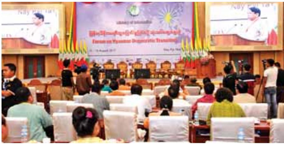
မြန်မာဒီမိုကရေစီကူးပြောင်းမှုဖြစ်စဉ် သုံးသပ်ဆွေးနွေးပွဲ အောင်မြင်စွာကျင်းပနိုင်ခြင်းနှင့်စပ်လျဉ်း၍ ပြည်ထောင်စုဝန်ကြီး ဒေါက်တာဖေမြင့် ကျေးဇူးတင်စကားပြောကြားစဉ်။

အသွင်ကူးပြောင်းသည့် နိုင်ငံတိုင်းတွင် တပ်၏ ထိန်းချုပ်မှုများသည် လုံခြုံရေးကောင်စီရှိပါကြောင်း၊ အခြေအနေများအပေါ်မူတည်၍ ပြည်တွင်းလုံခြုံရေးကိစ္စ များတွင် တပ်မတော်၏ ဩဇာလွှမ်းမိုးမှု ကြီးမားဆဲဟု သုံးသပ်သည်ကိုတွေ့ရပါကြောင်း၊ နောက်တစ်ခုတွေ့ရသည် မှာ အရပ်ဘက်-စစ်ဘက် ပြုပြင်ပြောင်းလဲနေသည့် အချိန် တွင် အရပ်ဘက်အဖွဲ့အစည်းများ အားကောင်းလာသည်နှင့် အမျှ တပ်မတော်၏ နိုင်ငံရေးဩဇာလွှမ်းမိုးမှုများ တဖြည်း