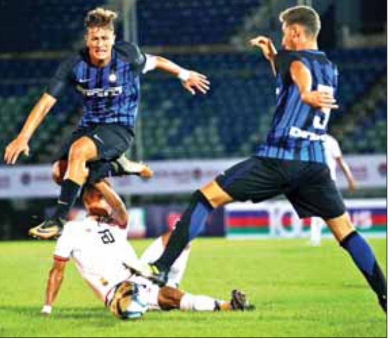
မြန်မာယူ-၁၈ အသင်းနှင့် အင်တာမီလန်ယူ-၁၈ အသင်းတို့ ခြေစမ်းကစားစဉ်။

ရန်ကုန် ဩဂုတ် ၁၃ နိုင်ငံတကာပြိုင်ပွဲများအတွက် လေ့ကျင့်ပြင်ဆင်နေသည့် မြန်မာ ယူ-၁၈ အသင်းနှင့် အင်တာမီလန် ယူ-၁၈ အသင်းတို့၏ ခြေစမ်းပွဲကို ယနေ့ညနေပိုင်းက ရန်ကုန်မြို့ သုဝဏ္ဏကွင်း၌ ကျင်းပရာ နှစ်ရိုးစိ သရေကျခဲ့သည်။ ပထမပွဲတွင် ခြေရည်တူနီးပါးလိုက် ကစားနိုင်သည့် မြန်မာ ယူ-၁၈အသင်းသည် ယခုပွဲတွင် ခြေစွမ်းပြကစားနိုင်ခဲ့ပြီး နှစ်ရိုးစိသရေကစားနိုင်ခဲ့သည်။ မြန်မာ ယူ-၁၈ အသင်းသည် ယခုပွဲတွင်လည်း ခြေစွမ်းပြကစားနိုင်ခဲ့ပြီး ဦးဆောင်ရိုး သွင်းယူနိုင်ခဲ့သလို ဥရောပကလပ် အင်တာမီလန်အသင်းကို သရေကစားနိုင်ခဲ့ခြင်းဖြစ်သည်။ မြန်မာယူ-၁၈ အသင်းသည် ပထမပွဲမှ ကစားသမားအချို့ကို အပြောင်းအလဲလုပ်ခဲ့ပြီး ပွဲစကတည်းက စာမျက်နှာ ၇ ကော်လံ ၁ သို့