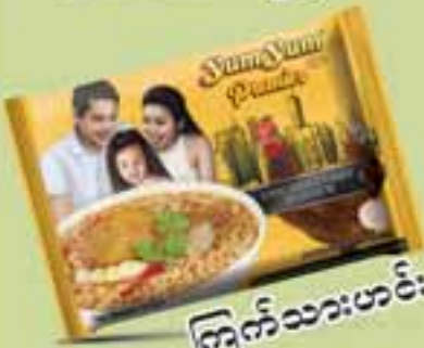
ကြက်သားဟင်း