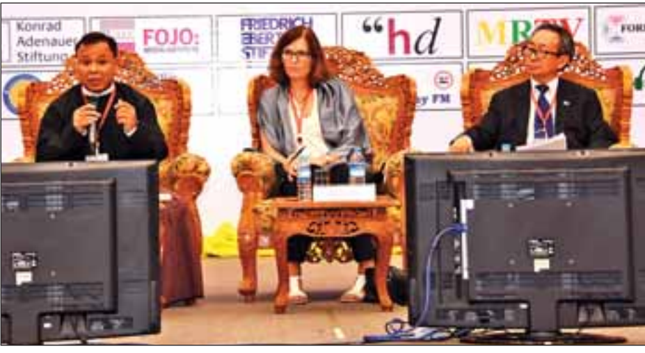
ကူးပြောင်းမှုဖြစ်စဉ်တွင် မြန်မာနိုင်ငံလက်ရှိရောက်နေသည့်နေရာနှင့်စပ်လျဉ်း၍ ဆွေးနွေးကြစဉ်။

၁၈၇၅ ခုနှစ်တွင် ဧည့်သည်လာပါက ရွာလူကြီးကို အသိပေးရမည်ဆိုခဲ့သည့် ဥပဒေပြဋ္ဌာန်းခဲ့။ စတင်ပြဋ္ဌာန်းကတည်းက ပြည်သူကို ဖိနှိပ်ချင်၍ ပြဋ္ဌာန်းထားသည့် ဥပဒေဖြစ်။ တိုင်းတစ်ပါးက အုပ်ချုပ်သည့်အချိန်မှာပင် အဆိုပါဥပဒေသည် တစ်နိုင်ငံလုံးသို့ မသက်ရောက်။ ဘုရင်ခံလက်မှတ်ထိုးသည့် နေရာဒေသတွင်သာ သက်ရောက်မှုရှိ။ ပြိတိသျှအုပ်ချုပ်စဉ်ကာလ၊ ရန်ကုန်အစိုးရဟု ခေါ်ဆိုသောကာလကပင် လွတ်လပ်ခွင့်ရှိခဲ့။ မှားမှန်းသိရက်နှင့် လက်မခံလိုသဖြင့် ပယ်ဖျက်ခြင်းဖြစ်။ ဥပဒေပြဋ္ဌာန်းချက်တွင် ဥပဒေနှင့်မညီသောလုပ်ရပ်များ လုပ်ကိုင်နေသည်ဟု သံသယရှိပါက တာဝန်ရှိသူများ ဝင်ရောက်စစ်ဆေးပိုင်ခွင့်ပေးထား။ ယင်းအချက်များကိုမသိဘဲ ဧည့်စာရင်းဖျက်ခြင်းကိုသာပြောနေကြ။