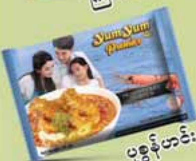
ပုစွန်ဟင်း

၂၀၁၇.၇.၂၀၁၇ ရက်နေ့မှ ၇.၈.၂၀၁၇ ရက်နေ့ထိ တစ်သိန်းဆု ကံထူးသည် နံပါတ်များစာရင်း