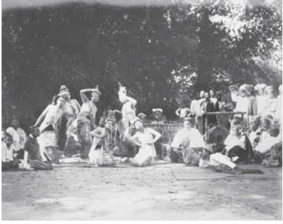
ရှေးမြေပိုင်းဇာတ်။

ဇာတ်ရုံကြီးအတွင်း ဇာတ်ခုံအပြင်အဆင်ကလည်း အပြိုင်အဆိုင်။ ပုဏ္ဏားကွယ်တွေ၊ ကန်လန်ကာတွေ၊ နဖူးစည်းတွေ၊ ပြည်ဖုံးကား ကတ္တီပါကားကြီးတွေ၏ အခဲအညားလည်း ပြိုင်ဆိုင်ကြ၏။ ရုံအတွင်းရှိတိုင်များ