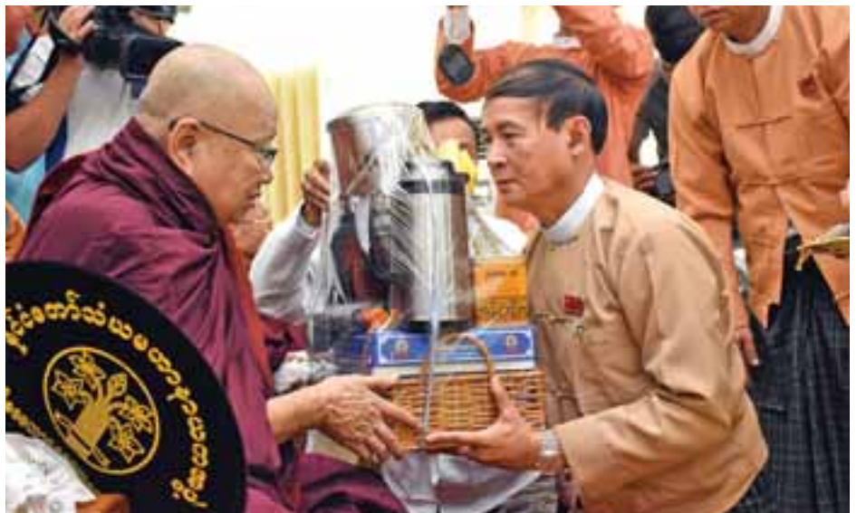
ပြည်သူ့လွှတ်တော်ဥက္ကဋ္ဌ ဦးဝင်းမြင့် ဆရာတော်တစ်ပါးအား ဝါဆိုသင်္ကန်းနှင့် လှူဖွယ်ပစ္စည်းများ ဆက်ကပ်လှူဒါန်းစဉ်။

အခမ်းအနားအပြီးတွင် ဆရာတော်သံဃာတော်များအား နေ့ဆွမ်းဆက်ကပ်လှူဒါန်းကြသည်။ မွန်းလွဲပိုင်းတွင် အမျိုးသားဒီမိုကရေစီအဖွဲ့ချုပ် (ရန်ကုန်တိုင်းဒေသကြီး)နှင့် ပြည်သူများ၊ တိုင်းဒေသကြီး