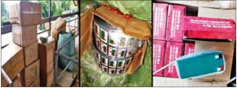
တရားဝင်စာရွက်စာတမ်း အထောက်အထားတစ်စုံတစ်ရာ တင်ပြနိုင်ခြင်းမရှိသည့် Lenovo Le Phone A60 plus၊ Table Fan၊ Battery၊ Rice Cooker၊ အဝတ်အထည်၊ ကျောပိုးအိတ်နှင့် Toys for Air Blow

သိရသည်။ ယနေ့ မွန်းလွဲ ၂ နာရီအထိ အထူးကုဆေးရုံကြီး (ဝေဘာဂီ)တွင် H1N1 ပိုးတွေ့ အတွင်းလူနာ ခုနစ်ဦး၊ အခြားတိုင်းဒေသကြီး/ ပြည်နယ်ဆေးရုံကြီး များတွင် H1N1 ပိုးတွေ့ အတွင်းလူနာ ၆၆ ဦး စုစုပေါင်း ၇၃ ဦး ဆက်လက် ဆေးဝါးကုသမှုခံယူလျက်ရှိပြီး အများစုမှာ သက်သာလျက်ရှိကြောင်း၊ H1N1 ပိုးတွေ့ရှိသော်လည်း ရာသီတုပ်ကွေးရောဂါ၏ နောက်ဆက်တွဲ ဆိုးကျိုးကြောင့် သေဆုံးခြင်းမဟုတ်ဘဲ အခြားရောဂါအခံများကြောင့် ယနေ့အထိ သေဆုံးသူ စုစုပေါင်း ၁၈ ဦးရှိပြီး ယမန်နေ့ကထက် နှစ်ဦးတိုးလာကြောင်း သိရသည်။