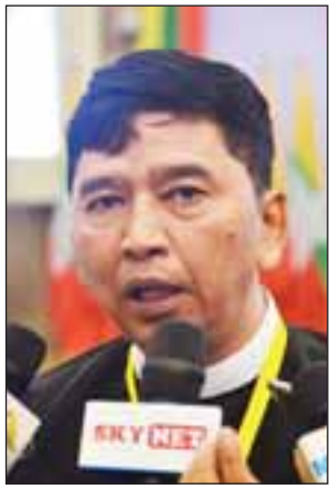
ဦးမင်းကိုနိုင်