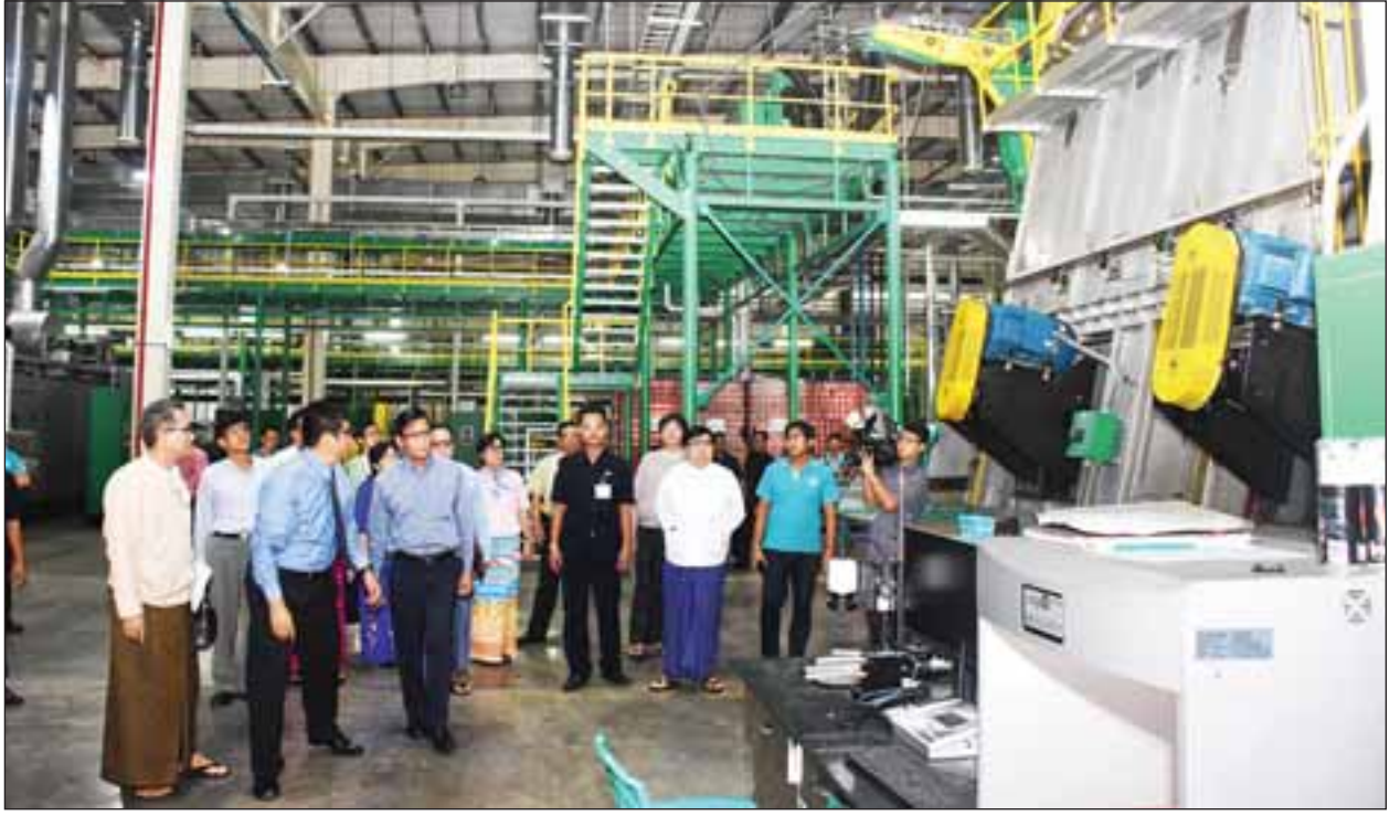
Ball Asia Pacific (Yangon) Metal Container Limited စက်ရုံအတွင်း ဒုတိယသမ္မတ ဦးဟင်နရီပန်ထီးယူ လှည့်လည်ကြည့်ရှုစဉ်။

ထို့နောက် ဒုတိယသမ္မတက မြန်မာနိုင်ငံသည် စီးပွားရေးနှင့်ပတ်သက်ပြီး ပထဝီအနေအထားအရ မဟာဗျူဟာကျသည့်နေရာတွင် ရှိနေကြောင်း၊ မြန်မာ နိုင်ငံတွင် သီလဝါ၊ ထားဝယ်၊ ကျောက်ဖြူ အထူးစီးပွားရေးနှင့် သုံးခုကို အကောင်အထည်ဖော်ဆောင်ရွက်လျက်ရှိရာ သီလဝါအထူးစီးပွားရေးနှင့်အတွင်း အောင်မြင်သည့် အထူးစီးပွားရေးနှင့်တစ်ခုဖြစ်ကြောင်း၊ ၂၀၁၇ ခုနှစ် ဇူလိုင်လ ကုန်အထိ ပြည်တွင်း ပြည်ပရင်းနှီးမြှုပ်နှံမှု အမေရိကန်ဒေါ်လာသန်း ၁၁၄၄ ဒသမ ၆၆ ရှိပြီး ရင်းနှီးမြှုပ်နှံမှုများ ယခင်ကထက် ပိုမိုဝင်ရောက်လာသည်ကို တွေ့ရှိရကြောင်း၊ သီလဝါအထူးစီးပွားရေးနှင့်စီမံကိန်း စံပြစီးပွားရေးနှင့်ပြစ်အောင် ဆက်လက်ကြိုးစား