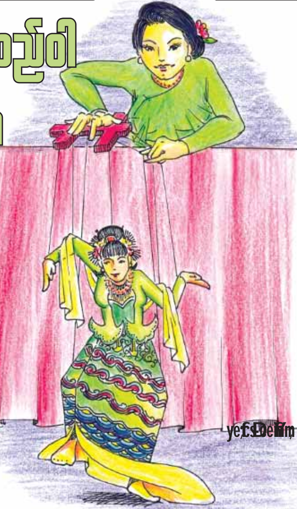
ရသေ့၊ နတ်၊ ဗြဟ္မာ၊ အမယ်အို၊ လူပြက်တို့ ဖြစ်သည်။

မြန်မာ့ရုပ်စုံသဘင်တွင် ရှေးယခင်က အရုပ်ပေါင်း ၃၆ ရုပ်ပါဝင်ခဲ့ပြီး အရုပ် ၄၀ အထိတိုးချဲ့ပြုလုပ်ခဲ့ကြသည်ဟုလည်းဆိုကြသည်။ သို့ရာတွင် သဘင်ဝန်ဦးသော်တီထွင်ခဲ့သည်ဟု ယူဆရသော ရုပ်သေး ၂၈ ရုပ်ကမူ အပိုအလိုမရှိ၊ ပြည့်စုံသည်ဟု ဆိုနိုင်သည်။ ထိုအရုပ်များမှာ နတ်ကတော်၊ မြင်း၊ ဆင်ဖြူ၊ ဆင်မ၊ ကျား၊ မျောက်၊ ကြက်တူရွေး၊ နဂါး၊ ဘီလူး၊ ဇော်ဂျီ၊ ဝန်၊ ရှင်ဘုရင်၊ မင်းသား၊ မင်းသမီး၊ မင်းသားကြီး မျက်နှာဖြူ၊ မင်းသားကြီး မျက်နှာနီ၊ ပုဏ္ဏား၊