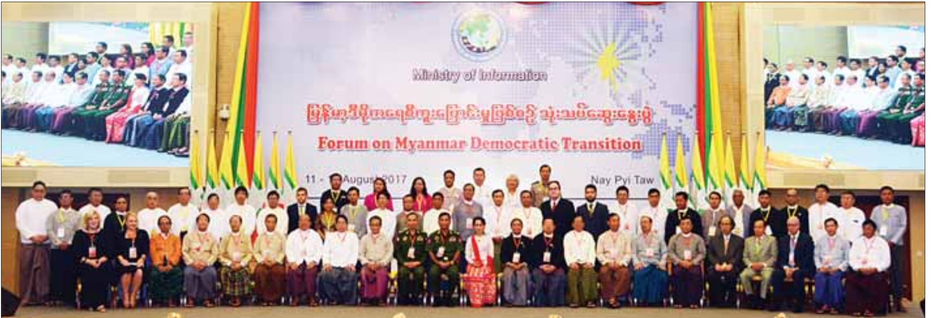
နိုင်ငံတော်၏အတိုင်ပင်ခံပုဂ္ဂိုလ် ဒေါ်အောင်ဆန်းစုကြည်နှင့် ပြည်သူ့လွှတ်တော်ဥက္ကဋ္ဌ၊ လွှတ်တော်ဒုတိယဥက္ကဋ္ဌများ၊ ပြည်ထောင်စုလွှတ်တော် ဥပဒေရေးရာနှင့် အထူးကိစ္စရပ်များ လေ့လာဆန်းစစ်သုံးသပ်ရေးကော်မရှင်ဥက္ကဋ္ဌ၊ ပြည်ထောင်စုဝန်ကြီးများ၊ အမျိုးသားလုံခြုံရေးဆိုင်ရာ အကြံပေးပုဂ္ဂိုလ်၊ နေပြည်တော်ကောင်စီဥက္ကဋ္ဌ၊ ဌာနဆိုင်ရာအကြီးအကဲများ၊ ပြည်တွင်းပြည်ပမိတ်ဖက်အဖွဲ့အစည်းများမှ ကိုယ်စားလှယ်များ၊ အလှူရှင်များ၊ တာဝန်ရှိသူများ စုပေါင်းမှတ်တမ်းတင်ဓာတ်ပုံရိုက်ကြစဉ်။ (သတင်းစဉ်)

❖ ရှေ့ဖူးမှ နိုင်ငံခြားသံရုံးများမှ သံအမတ်ကြီးများ၊ သံတမန်များ၊ ပြည်တွင်းပြည်ပမှပညာရှင်များ၊ စာတမ်းရှင်များ၊ ပါဝင်ဆွေးနွေးသူများ၊ ပြည်တွင်း ပြည်ပအရပ်ဘက်အဖွဲ့အစည်းများမှ ကိုယ်စားလှယ်များ၊ လေ့လာသူများ၊ ဖိတ်ကြားထားသူများနှင့် တာဝန်ရှိသူများ တက်ရောက်ကြသည်။