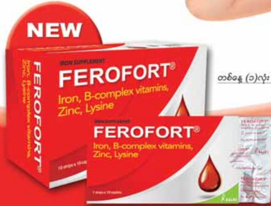
တစ်နေ့ (၁)လုံး သောက်သုံးရန်