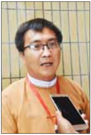
ဦးနေမျိုးကျော်

ဒီမိုကရေစီကို ကူးပြောင်းတဲ့အခါမှာ ယေဘုယျလမ်းကြောင်းတော့ရှိတယ်။ ဒါပေမယ့် ဘယ်နိုင်ငံမှ အဲဒီယေဘုယျလမ်းကြောင်းနဲ့တော့ တစ်ထပ်တည်း မကျဘူး။ ကိုယ့်လမ်းနဲ့ကိုယ်ထင်သွားကြရတာပဲ။ အခုဟာကတော့ အဆင်ပြေဆုံးထင်တဲ့လမ်းကြောင်းကို ရွေးသွားနေတာပဲ။ အခုလမ်းကြောင်းက ဒီမိုကရေစီအသွင်ကူးပြောင်းရေးအတွက် ဖြစ်နိုင်ခြေများပါတယ်။ တကယ့်လက်တွေ့အကောင်အထည်ဖော်နေတဲ့အပိုင်းမှာတော့ အခြားအခက်အခဲတွေ ရှိကောင်း ရှိမယ်။ ဒီမိုကရေစီအသွင်ကူးပြောင်းရေးမှာ လုပ်ရမှာတွေများတယ်။ နိုင်ငံရေး၊ စီးပွားရေး၊ လုံခြုံရေး၊ စစ်ဘက်-အရပ်ဘက်ဆက်ဆံရေး စသဖြင့် ခေါင်းစဉ်တွေတော့ အများကြီးပဲ။ နိုင်ငံတကာအတွေ့အကြုံတွေအရပြောရရင် အပြောင်းအလဲက ခြောက်ဆင့်ရှိတယ်။ အဲဒီအဆင့်တွေထဲမှာ မြန်မာနိုင်ငံက အဆင့်(၄)နေရာလောက်ရောက်နေတယ်။ အဆင့်(၄)ရောက်တယ်ဆိုပေမယ့် အဆင့်(၃)မှာ နည်းနည်းပြဿနာရှိတယ်။ အတိအကျပြောရရင် နံပါတ်(၁)က ဒီမိုကရေစီမရှိတဲ့အခြေအနေ၊ (၂)က အနိမ့်ဆုံးဒီမိုကရေစီ၊ အဲဒီအဆင့်ကျရင်