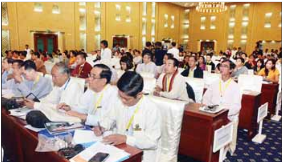
မြန်မာ့ဒီမိုကရေစီကူးပြောင်းမှုဖြစ်စဉ် သုံးသပ်ဆွေးနွေးပွဲ ဖွင့်ပွဲအခမ်းအနားသို့ တက်ရောက်လာသူများကို တွေ့ရစဉ်။ (သတင်းစဉ်)