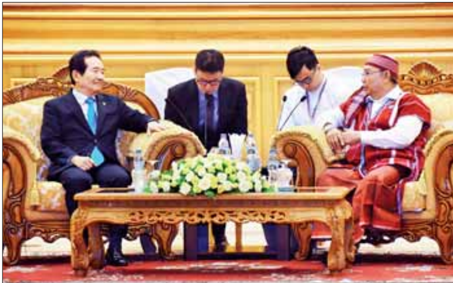
နေပြည်တော်ရှိ လွှတ်တော်အဆောက်အအုံ ထမင်းစား ဥက္ကဋ္ဌနှင့် ကိုရီးယားသမ္မတနိုင်ငံ အမျိုးသားလွှတ်တော် ဥက္ကဋ္ဌတို့သည် မြန်မာ-ကိုရီးယား နှစ်နိုင်ငံ ချစ်ကြည်ရင်းနှီးမှု ပိုမိုတိုးတက်ခိုင်မြဲရေးနှင့် လွှတ်တော်နှစ်ရပ်အကြား ပိုမို

မွန်းလွဲပိုင်းတွင် အမျိုးသားလွှတ်တော်ဥက္ကဋ္ဌသည် ကိုရီးယားသမ္မတနိုင်ငံ အမျိုးသားလွှတ်တော်ဥက္ကဋ္ဌ H.E. Mr. Chung Sye-kyun ဦးဆောင်သောအဖွဲ့အား