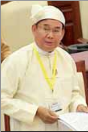
ပြည်ထောင်စုဝန်ကြီး ဦးအုန်းဝင်း

ယင်းအဆိုကို လွှတ်တော်က လက်ခံဆွေးနွေးရန်ဆုံးဖြတ်ပြီး အဆိုနှင့် စပ်လျဉ်း၍ ဆွေးနွေးမည့် လွှတ်တော်ကိုယ်စားလှယ်များအနေဖြင့် အမည် စာရင်းတင်သွင်းကြရန် လွှတ်တော်ဥက္ကဋ္ဌက အသိပေးကြေညာထားသည်။