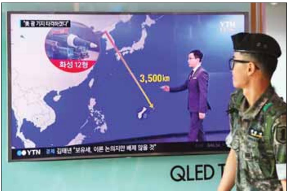
သို့မဟုတ်ပါက ကမ္ဘာပေါ်တွင် မည်သည့်အခါကမျှ မတွေ့့ အမေရိကန်သမ္မတဒေါ်နယ်ထရန်က ခြိမ်းခြောက်ပြောဆိုခဲ့ မြင်ဖူးသည့်တိုက်ခိုက်မှုနှင့် ကြုံတွေ့ရမည်ဖြစ်ကြောင်း သည်။ ဆင်ယွာ။

မည်ဖြစ်ပြီး မိမိတို့က ဆက်သွယ်ရေးပုံစံအမျိုးမျိုးဖြင့် အများပြည်သူအား အသိပေးနှိုးဆော်မည်ဖြစ်ကြောင်း၊ ပြည်သူများအနေဖြင့် ဥဒြာဆွဲသံကြားရပါက ညွှန်ကြားချက်များထပ်မံရရှိနိုင်ရန် ရေဒီယို၊ သတင်းစာ၊ ရုပ်မြင်သံကြားအစရှိသည့် မီဒီယာများကိုဖွင့်ကာ နားစွင့်နေရမည်ဖြစ်ကြောင်း ဂျာနာဂါမင်ဒေးက ပြောကြားသည်။ အန်ဒါဆန်လေတပ်အခြေစိုက်စခန်း၌ ကာကွယ်ရေးဌာနက ဖြန့်ကြက်ထားသည့် ခုံးကျည်ကာကွယ်ရေးစနစ်အရ THAAD နှင့် AN/TPY-2 ရေဒါစနစ်တို့ဖြင့် ဂူအမ်ကျွန်းကို အကာအကွယ်ပေးမည်ဖြစ်ကြောင်း ခုံးကျည် ကာကွယ်ရေးထောက်ခံသူများအဖွဲ့က ပြောကြားသည်။ မြောက်ကိုရီးယားနိုင်ငံသည် ဩဂုတ်လလယ်တွင် အမေရိကန်ပိုင် ဂူအမ်ကျွန်းကို ဦးတည်ကာ တာလတ်ပစ်ခုံးကျည်များဖြင့် တိုက်ခိုက်ရန် စီစဉ်နေသည်ဟု ဩဂုတ် ၁၀ ရက်တွင် ထုတ်ပြန်ကြေညာခဲ့သည်။ မြောက်ကိုရီးယားခေါင်းဆောင် ကင်ဂျုံအန်၏ ဆုံးဖြတ်ချက်ပေါ်မူတည်၍ ခုံးကျည်ပစ်ခတ်မှုဖြစ်ပေါ်လာနိုင်သည်ဆို၏။ မြောက်ကိုရီးယားသည် အမေရိကန်ကို နောက်ထပ်မည်သည့် ခြိမ်းခြောက်မှုမျိုးကိုမျှ မပြုလုပ်သင့်တော့ကြောင်း၊