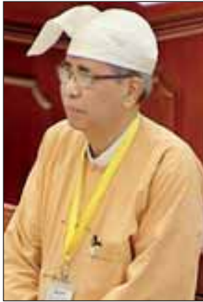
ဒုတိယဝန်ကြီး ဦးကျော်မျိုး

အစည်းအဝေးတွင် ပင်လည်ဘူးမဲဆန္ဒနယ်မှ ဦးမင်းနောင်၏ ပင်လည်ဘူး မြို့နယ် ကြီးပိုင်း/ကြီးပြင် ကာကွယ်စောင့်ရှောက်ရေး ကျရောက်နေသော လယ်ယာ မြေများကို စွန့်လွှတ်ပေးရန် အစီအစဉ် ရှိမရှိ မေးခွန်းနှင့်စပ်လျဉ်း၍ သယံဇာတ နှင့် သဘာဝပတ်ဝန်းကျင်ထိန်းသိမ်းရေးဝန်ကြီးဌာန ပြည်ထောင်စုဝန်ကြီး ဦးအုန်းဝင်းက ရာသီဥတုပြောင်းလဲမှုအတွက် မြန်မာနိုင်ငံအနေဖြင့် နိုင်ငံ ဧရိယာ၏ ၃၀ ရာခိုင်နှုန်းကို ကြီးပိုင်း/ကြီးပြင်ကာကွယ်စောင့်ရှောက် ၁၀ ရာခိုင် နှုန်းကို သဘာဝနယ်မြေဆောင်ရွက်ရန် ကတိပြုထားပါကြောင်း၊ ယခုလောလော ဆယ်တွင် ကြီးပိုင်း/ကြီးပြင်ကာကွယ်စောင့်ရှောက် နိုင်ငံဧရိယာ၏ ၂၄ ဒသမ ၈၃ ရာခိုင်နှုန်းရှိပြီး သဘာဝနယ်မြေမှာ နိုင်ငံဧရိယာ၏ ၅ ဒသမ ၇၉ ရာခိုင်နှုန်းရှိပါကြောင်း၊ ဆက်လက်ဆောင်ရွက်ရန် ကျန်ရှိနေပါကြောင်း၊ ထို့ကြောင့် ကြီးပိုင်း/ကြီးပြင်ကာကွယ်စောင့်ရှောက် ကျရောက်နေသော လယ်ယာမြေများကို လောလောဆယ်ပယ်ဖျက်ပေးနိုင်ခြင်း မရှိသေးပါကြောင်း၊ သင့်လျော်သည့်အချိန်ရောက်သည့်အခါတွင် ပယ်ဖျက်ပေးရန် အမြန်ဆုံးဆောင် ရွက်ပေးမည်ဖြစ်ပါကြောင်း ဖြေကြားသည်။