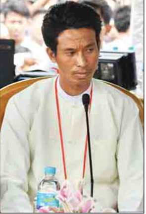
ဦးရဲစိန်

ဘာကြောင့် ခက်ခဲနေရပါသလဲ၊ NCA ကြောင့်လား၊ ခြေခွကြောင့်လား၊ တပ်မတော်က လက်ရှိအစိုးရနဲ့အပြည့်အဝ ပူးပေါင်းပါဝင်မှု မရှိလို့လား၊ တပ်မတော်အပေါ်မှာ လက်နက်ကိုင်တိုင်းရင်းသားတွေ ယုံကြည်မှုမရှိလို့လား၊ ဒါမှမဟုတ် လက်နက်ကိုင်အဖွဲ့အစည်းတွေရဲ့ ခေါင်းဆောင်တွေဟာ တိုင်းရင်းသားအကျိုးစီးပွားထက် ကိုယ့်အကျိုးစီးပွားကိုပဲ ရှေ့တန်းတင်နေလို့လား၊ ငြိမ်းချမ်းရေး အမြန်ဆုံးရချင်ပါပြီ” မေးခွန်း နှင့် “ငြိမ်းချမ်းရေးဖြစ်စဉ် ဒီထက်ပိုမို ထိရောက်အောင် တိုင်းဒေသကြီးနှင့် ပြည်နယ်အသီးသီးမှာ Public Center for Peace ဆိုပြီး လူထုအခြေပြု လုပ်ဆောင်နိုင်အောင် အစိုးရကဦးဆောင်ပြီး လုပ်သင့်၊ မလုပ်သင့်မေးချင်ပါတယ်” မေးခွန်း သုံးခုနှင့် စကားဝိုင်းသို့ တက်ရောက်နားထောင်ကြသည့် ပြည်သူများ၏ ဒေသဖွံ့ဖြိုးရေးလိုအပ်ချက်မေးခွန်းများ