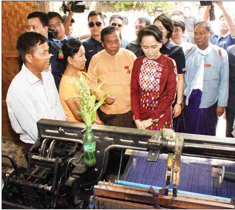
နိုင်ငံတော်၏အတိုင်ပင်ခံပုဂ္ဂိုလ် ဒေါ်အောင်ဆန်းစုကြည် မြေတိုင်ကန်ကျေးရွာရှိ အဘိုးအဘွားများအား ရင်းရင်းနှီးနှီးနှုတ်ဆက်စဉ်။ (ဝဲပုံ) နှင့် အသေးစားစက်မှုလုပ်ငန်း ရက်ကန်းရုံကို လှည့်လည်ကြည့်ရှုစဉ်။ (ယာပုံ)