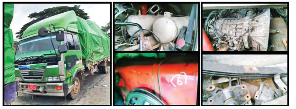
တရားဝင်စာရွက်စာတမ်း အထောက်အထားတစ်စုံတစ်ရာ တင်ပြနိုင်ခြင်းမရှိသော မော်တော်ယာဉ်သုံး ပစ္စည်းများနှင့် ပစ္စည်းသယ်ဆောင်သည့်ယာဉ်။