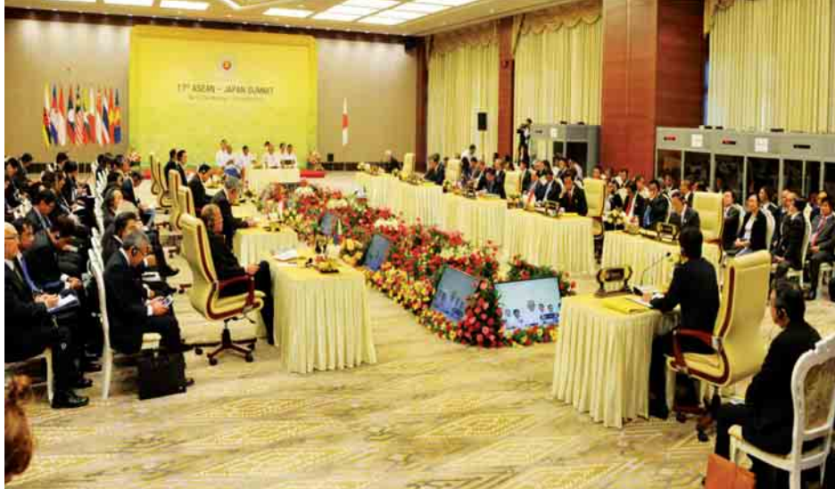
17-လူငါ့ကုန်သွယ်မှုတန်ဖိုးဟာ ၂၀၁၅ ခုနှစ်မှာ ၁၃ ဒသမ ၄ ဘီလီယံဒေါ်လာရှိပါတယ်။ အလားတူ ရုရှားနိုင်ငံရဲ့ အာဆီယံ

အိန္ဒိယနိုင်ငံဟာ အာဆီယံအဖွဲ့ကြီးနဲ့ ကဏ္ဍအလိုက် ဆွေးနွေးမှုတွေကို ၁၉၉၂ ခုနှစ်မှာ စတင်ပြုလုပ်ခဲ့ပြီး ၁၉၉၅ ခုနှစ် ဒီဇင်ဘာလမှာ အာဆီယံအဖွဲ့ကြီးရဲ့ ဆွေးနွေးဘက်နိုင်ငံ အပြည့်အဝ ဖြစ်လာခဲ့ပါတယ်။ အာဆီယံ-အိန္ဒိယ ပထမအကြိမ်ထိပ်သီးအစည်းအဝေးကို ၂၀၀၂ ခုနှစ်အတွင်း ကမ္ဘောဒီးယားနိုင်ငံ၊ ဖနွမ်းပင်မြို့မှာ ပြုလုပ်ခဲ့ပြီးနောက်ပိုင်း အာဆီယံ-အိန္ဒိယ ထိပ်သီးအစည်းအဝေးတွေကို နှစ်စဉ်ပြုလုပ်နိုင်ခဲ့ပါတယ်။ ၂၀၁၅ ခုနှစ် နိုဝင်ဘာလအတွင်း မလေးရှားနိုင်ငံ ကွာလာလမ်ပူမြို့မှာ ကျင်းပပြုလုပ်ခဲ့တဲ့ (၁၃) ကြိမ်မြောက် အာဆီယံ-အိန္ဒိယ ထိပ်သီးအစည်းအဝေးမှာ အာဆီယံခေါင်းဆောင်တွေဟာ အိန္ဒိယနိုင်ငံရဲ့ အရှေ့မျှော်ဝါဒ (Look East Policy) နဲ့ အိန္ဒိယနိုင်ငံတွင်ထုတ်လုပ်သည့် (Make in India) ဆိုတဲ့ အစီအစဉ်တွေကို ကြိုဆိုကြောင်းနဲ့ အဲဒီအစီအစဉ်တွေဟာ အာဆီယံအဖွဲ့ကြီးရဲ့ အသိုက်အဝန်း တည်ထောင်ရေး ကြိုးပမ်းအားထုတ်မှုနဲ့ လိုက်လျောညီထွေမှုရှိကြောင်း ပြောကြားခဲ့ကြပါတယ်။