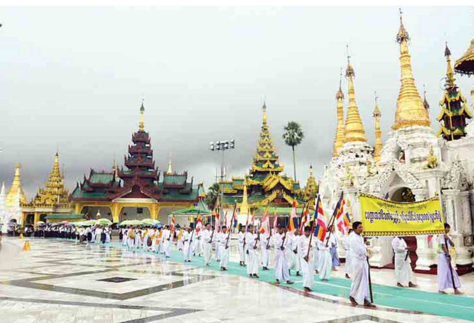
ကို ရှေးဟောင်းဗုဒ္ဓရုပ်ပွားတော်များ တန်ဆောင်း၌ ဆက်ကပ်လှူဒါန်းပေးပြီး နံနက် ၁၀ နာရီခွဲတွင် ရောင်တော်ဖွင့်တန်ဆောင်း၌ ဆရာတော်ကြီးများအား နေ့ဆွမ်းဆက်ကပ်လှူဒါန်းကြသည်။

ယင်းနောက် နံနက် ၉ နာရီခွဲတွင် ဝါတွင်းသီလခံယူပွဲ