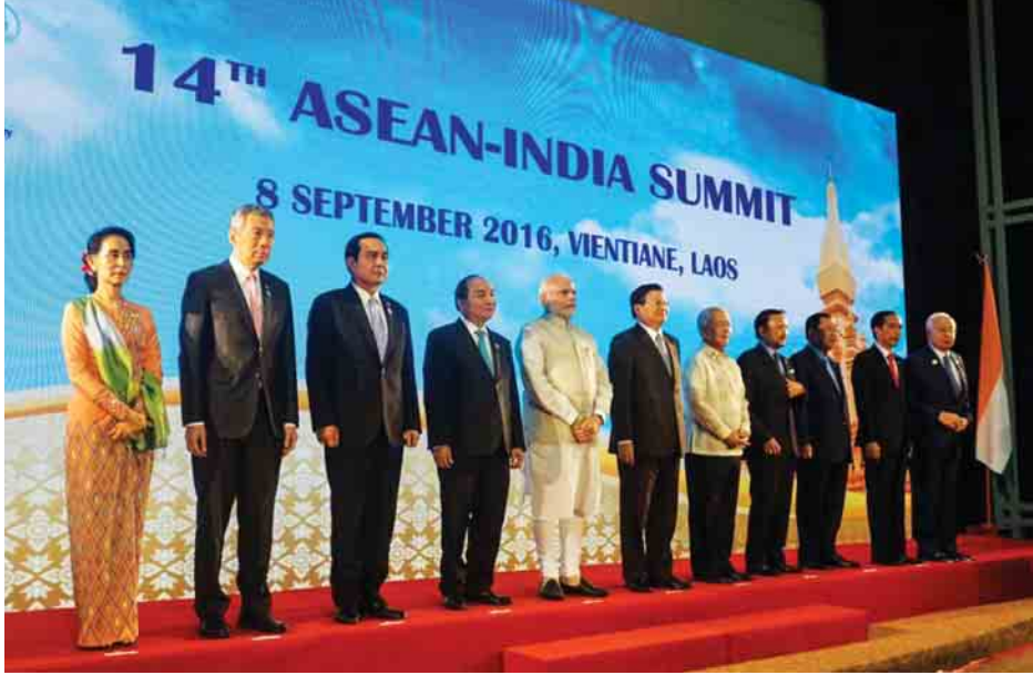
14-လူငါ့ကုန်သွယ်မှုတန်ဖိုးဟာ ၂၀၁၅ ခုနှစ်မှာ ၁၂၃ ဘီလီယံဒေါ်လာရှိတဲ့အတွက် တောင်ကိုရီးယားနိုင်ငံဟာ အာဆီယံအဖွဲ့ ကြီးရဲ့ ပဉ္စမမြောက် အကြီးဆုံးကုန်သွယ်ဘက်နိုင်ငံဖြစ်ပါတယ်။ အလားတူ တောင်ကိုရီးယားနိုင်ငံရဲ့ အာဆီယံဒေသတွင်း ရင်းနှီးမြှုပ်နှံမှုဟာ ဒေါ်လာ ၅ ဒသမ ၇ ဘီလီယံ ရှိတာကြောင့် တောင်ကိုရီးယားနိုင်ငံဟာ အာဆီယံအတွင်းမှာ ပဉ္စမမြောက်အကြီးဆုံးရင်းနှီးမြှုပ်နှံတဲ့နိုင်ငံ ဖြစ်ပါတယ်။

တောင်ကိုရီးယားနိုင်ငံဟာ အာဆီယံအဖွဲ့ကြီးနဲ့ ကဏ္ဍအလိုက်ဆွေးနွေးမှုတွေကို ၁၉၈၉ ခုနှစ်မှာ စတင်ပြုလုပ်ခဲ့ပြီး ၁၉၉၁ ခုနှစ် ဇူလိုင်လမှာ အာဆီယံအဖွဲ့ကြီးရဲ့ ဆွေးနွေးဘက်နိုင်ငံ အပြည့်အဝ ဖြစ်လာခဲ့ပါတယ်။ အာဆီယံအဖွဲ့ကြီးရဲ့ နိုင်ငံရေးနဲ့ လုံခြုံရေးကိစ္စရပ်တွေ၊ ကုန်သွယ်မှု၊ ရင်းနှီး