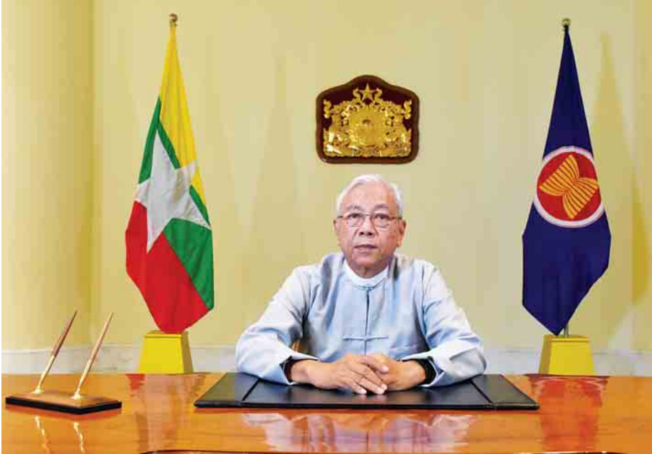
နိုင်ငံတော်သမ္မတ ဦးထင်ကျော်

၂၀၁၇ ခုနှစ် ဩဂုတ်လ ၈ ရက်နေ့တွင် ကျရောက်သည့် နှစ်(၅၀)ပြည့် ရွှေရတနာပတ်လည် အာဆီယံနေ့အတွက် ပြည်ထောင်စုသမ္မတမြန်မာနိုင်ငံတော် နိုင်ငံတော်သမ္မတ ဦးထင်ကျော် ပေးပို့သည့်သဝဏ်လွှာ