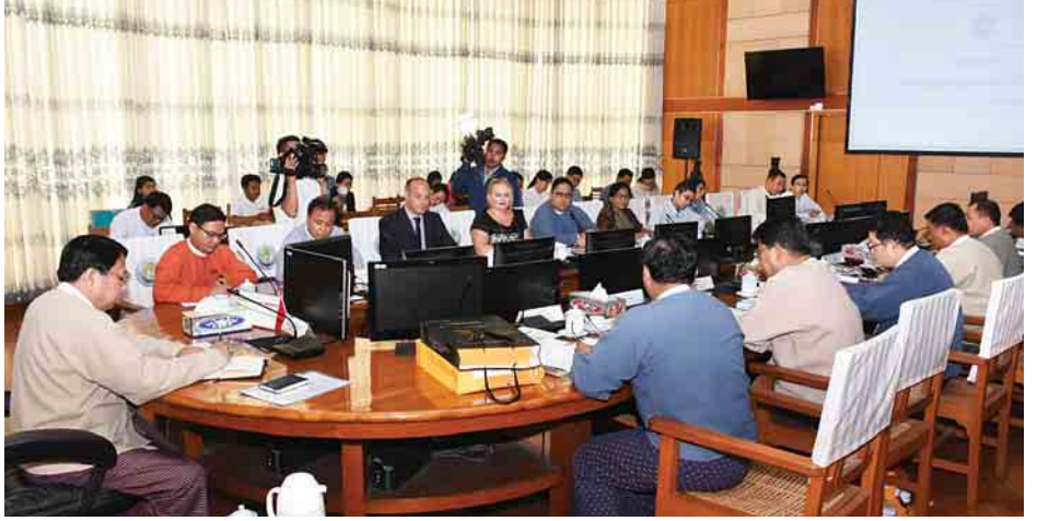
မြန်မာဒီမိုကရေစီ ကူးပြောင်းမှုဖြစ်စဉ် သုံးသပ်ဆွေးနွေးပွဲ (Forum on Myanmar Democratic Transition) အောင်မြင်စွာ ကျင်းပနိုင်ရေးညှိနှိုင်းအစည်းအဝေး ကျင်းပစဉ်။

အစည်းအဝေးတွင် ဖိတ်ကြားရေးနှင့် အခမ်းအနားပြင်ဆင်ရေး