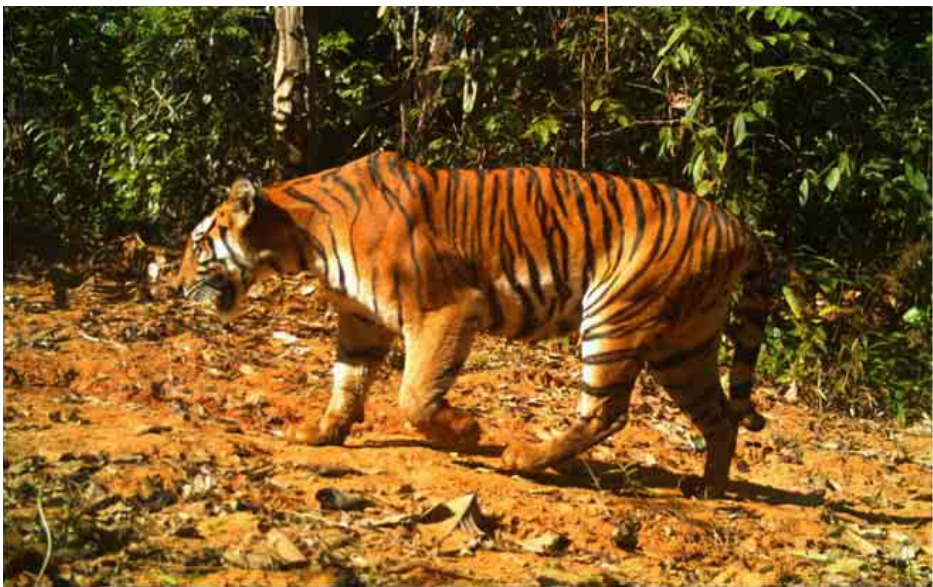
မြန်မာနိုင်ငံကျားထိန်းသိမ်းရေးသဘာဝနယ်မြေတစ်ခုတွင် ထောင်ချောက်ကင်မရာမှ ရိုက်ကူးရရှိသည့် ကျားတစ်ကောင်ကို တွေ့ရစဉ်။

မြန်မာနိုင်ငံတွင်လည်း တောရိုင်းတိရစ္ဆာန်နှင့် သဘာဝအပင်များ ကာကွယ်ရေးနှင့် သဘာဝနယ်မြေများ ထိန်းသိမ်းရေးဥပဒေ (၁၉၉၄) အရ ကျားကို လုံးဝ ကာကွယ်ထားသည့် တောရိုင်းတိရစ္ဆာန်များစာရင်း (Completely protected species of wild animals) တွင် ထည့်သွင်းထားပြီး ကျားများကို သတ်ဖြတ်ခြင်း၊ ကျားနှင့် ယင်းတို့၏အစိတ်အပိုင်းတို့ကို တရားမဝင်ကူးသန်းရောင်းဝယ်မှုတို့ကို ပုဒ်မ ၃၇(က) ဖြင့် ထောင်ဒဏ် ခုနှစ်နှစ်အထိဖြစ်စေ၊ ငွေဒဏ် ၅၀၀၀၀ အထိဖြစ်စေ၊ ဒဏ်နှစ်ရပ်လုံးဖြစ်စေ ချမှတ်နိုင်ပါသည်။ ကျားများ ရေရှည်တည်တံ့ရေးအတွက် ဌာန