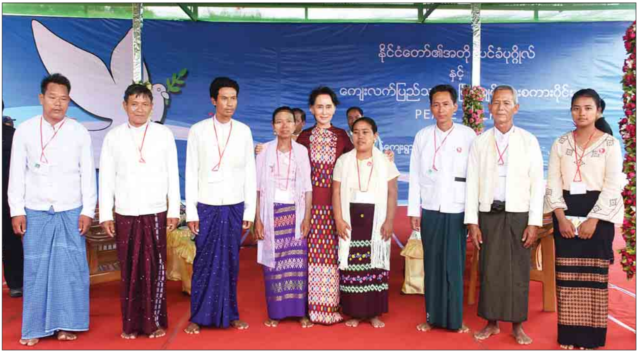
နိုင်ငံတော်၏အတိုင်ပင်ခံပုဂ္ဂိုလ်ဒေါ်အောင်ဆန်းစုကြည်နှင့် ငြိမ်းချမ်းရေးစကားဝိုင်းဆွေးနွေးသူများ မှတ်တမ်းဓာတ်ပုံရိုက်ကြစဉ်။

ထို့ပြင် နိုင်ငံတော်၏အတိုင်ပင်ခံပုဂ္ဂိုလ်က “ကျွန်မတို့ ငြိမ်းချမ်းရေး အပေါ်မှာ ဘယ်လိုစိတ်ထားကြလဲ။ တစ်ခါမှ မစဉ်းစားဖူးဘူးဆိုရင်လည်း အခုလောလောဆယ်ဆယ် ဒီနေ့ဒီအခါမှာ စဉ်းစားရင်းနဲ့ ဘယ်လိုအတွေးတွေ ပေါ်လာတယ်။ နောက်တစ်ခုက လျှပ်စစ်မီး။ လျှပ်စစ်မီးက ဒီရွာကို သုံးလပိုင်းက ရောက်လာတယ်လို့ ကျွန်မနားလည်ပါတယ်။ သုံးလပိုင်းက ရောက်လာတယ်ဆိုတော့ အခု လေးလလောက်ရှိပြီ။ အဲဒီအတွင်းမှာ ဘယ်လိုအခြေအနေတွေ ပြောင်းသွားလဲ။ ကိုယ့်ရွာရဲ့အခြေအနေ ဘယ်လိုပြောင်းသွားလဲ။ ကိုယ့် မိသားစုရဲ့ အခြေအနေဘယ်လိုပြောင်းသွားလဲ။ ကိုယ့်တစ်ဦးချင်းရဲ့ အခြေအနေ ဘယ်လိုပြောင်းသွားလဲ။ လျှပ်စစ်မီးမရခင်နဲ့ ရပြီးတဲ့အချိန်က ဘာကွာခြားသလဲ