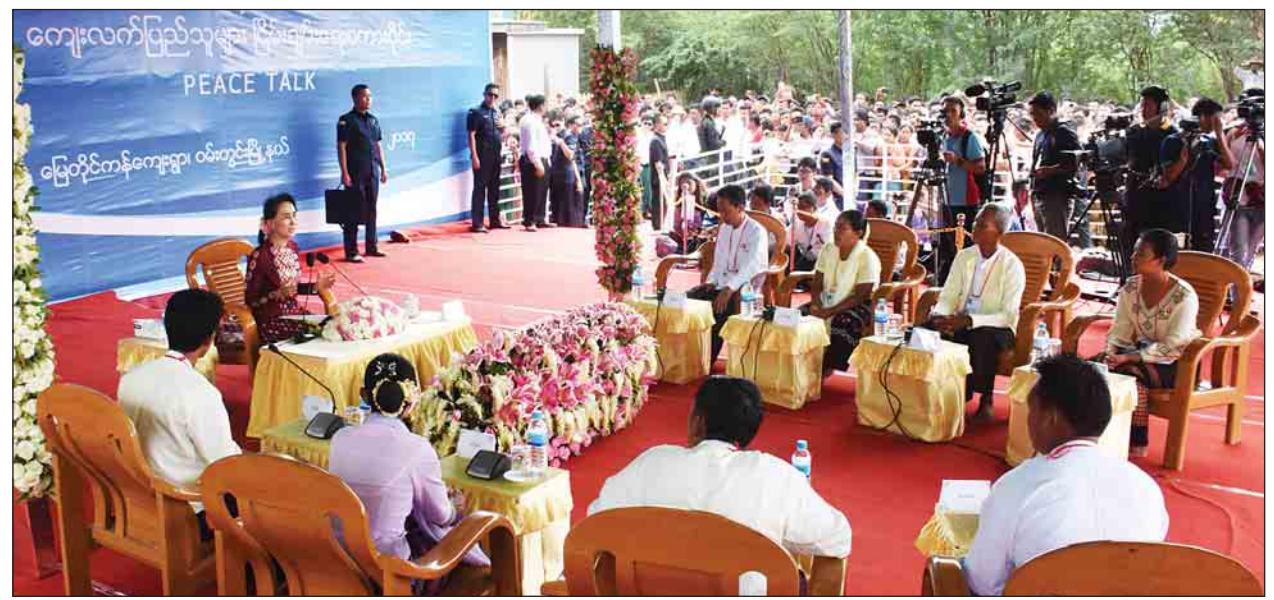
နိုင်ငံတော်၏အတိုင်ပင်ခံပုဂ္ဂိုလ် ဒေါ်အောင်ဆန်းစုကြည်နှင့် မြေတိုင်ကန်ကျေးရွာမှ ရွာသူရွာသားများ ငြိမ်းချမ်းရေးစကားဝိုင်း ပြုလုပ်စဉ်။

နေပြည်တော် ဩဂုတ် ၇ နိုင်ငံတော်၏အတိုင်ပင်ခံပုဂ္ဂိုလ် ဒေါ်အောင်ဆန်းစုကြည်သည် ပြည်ထောင်စုဝန်ကြီး ဒေါက်တာအောင်သူ၊ မန္တလေးတိုင်းဒေသကြီးဝန်ကြီးချုပ် ဒေါက်တာဇော်မြင့်မောင်၊ ဒုတိယဝန်ကြီး ဦးမင်းသူ၊ ဒုတိယဝန်ကြီး ဒေါက်တာ ထွန်းနိုင်တို့နှင့် ယနေ့နံနက်ပိုင်းတွင် ဝမ်းတွင်းမြို့နယ် မြေတိုင်ကန်ကျေးရွာ ဖွံ့ဖြိုးရေးအခြေအနေများကို ကြည့်ရှုစစ်ဆေးပြီး မြေတိုင်ကန်ကျေးရွာ ရပ်မိရပ်ပ များနှင့်တွေ့ဆုံကာ ကျေးရွာဖွံ့ဖြိုးရေးကိစ္စရပ်များကို ဆွေးနွေးသည်။ နိုင်ငံတော်၏အတိုင်ပင်ခံပုဂ္ဂိုလ် ဒေါ်အောင်ဆန်းစုကြည်သည် ယနေ့ နံနက် ၉ နာရီခွဲတွင် မန္တလေးတိုင်းဒေသကြီး မိတ္ထီလာခရိုင် ဝမ်းတွင်းမြို့နယ် မြေတိုင်ကန်ကျေးရွာသို့ရောက်ရှိပြီး ကျေးရွာအတွင်း လျှပ်စစ်ဓာတ်အားဖြန့်ဖြူးပေးနေသည့် ထရန်စဖော်မာကို ကြည့်ရှုစစ်ဆေးရာ အင်ဂျင်နီယာချုပ် ဦးစိုးမင်း ထွန်းက လျှပ်စစ်ဓာတ်အားဖြန့်ဖြူးပေးနေမှု၊ လျှပ်စစ်မီးအသုံးပြုမှုနှင့် လျှပ်စစ် ဓာတ်အားဖြင့် ဆောင်ရွက်နေသည့် အသေးစားစက်မှုလုပ်ငန်းများ ဆောင်ရွက် နေမှုအခြေအနေကို ရှင်းလင်းတင်ပြသည်။ မြေတိုင်ကန်ကျေးရွာတွင် အိမ်ထောင်စုပေါင်း ၂၈၁ စု၊ လူဦးရေ ၁၂၄၂ ဦးနေထိုင်ကြပြီး အများစုမှာ ရက်ကန်းလုပ်ငန်းနှင့် တောင်သူလုပ်ငန်းကို လုပ်ကိုင်ကြပြီး စပါ၊ ဝါနှင့် ပဲမျိုးစုံ စိုက်ပျိုးထုတ်လုပ်သည်။ ၂၀၁၇ ခုနှစ် မတ် ၃၀ ရက်တွင်