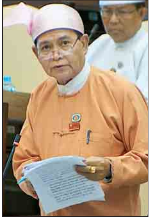
ဧရာဝတီတိုင်းဒေသကြီး မဲဆန္ဒနယ်အမှတ်(၃)မှ ဦးဆန်းမြင့်

အလုပ်သမား၊ လူဝင်မှုကြီးကြပ်ရေးနှင့် ပြည်သူ့အင်အားဝန်ကြီးဌာန ပြည်ထောင်စုဝန်ကြီး ဦးသိန်းဆွေက ပြန်လည်ရှင်းလင်းပြောကြားသည်။