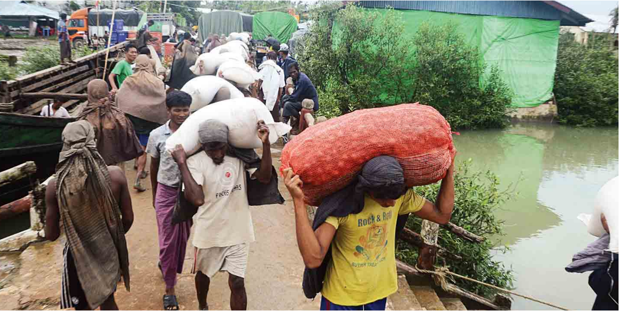
မောင်တောနယ်စပ်ကုန်သွယ်ရေးစခန်းကို ဩဂုတ် ၇ ရက်က တွေ့ရစဉ်။ သတင်း-ကျော့ဖုံး (အောင်းစိုး-မျိုးသူဟိန်း)

မြန်မာဒီမိုကရေစီကူးပြောင်းမှုဖြစ်စဉ် သုံးသပ်ဆွေးနွေးပွဲ (Forum on Myanmar Democratic Transition) ကို ၂၀၁၇ ခုနှစ် ဩဂုတ် ၁၁ ရက်မှ ၁၃ ရက်အထိ မြန်မာအပြည်ပြည်ဆိုင်ရာ ကွန်ဗင်းရှင်းဗဟိုဌာန-၂ (MICC-II) ၌ ကျင်းပမည်ဖြစ်ကြောင်း သတင်းရရှိသည်။ (သတင်းစဉ်)