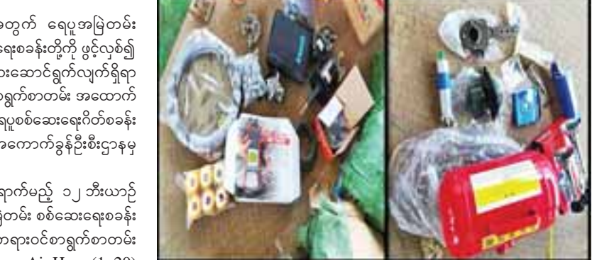
နှစ်လုံး၊ ဝိယာဘောက် ပင်နယ်(အကြီး) ၃၂ ဘူး၊ (အသေး)သုံးခု၊ တာဘိုဒလက် သုံးခု၊ ဘွတ်ခွေ ၂၀၊ Oil Seal ၆၅ ခုံ၊ Mobile Multimedia Speaker အလုံး ၃၅၀ စုစုပေါင်း ခန့်မှန်းတန်ဖိုး ငွေကျပ် ၇ ဒသမ ၈၃၃ သန်းခန့်အား သိမ်းဆည်းရမိခဲ့ကြောင်း အကောက်ခွန်ဦးစီးဌာနမှ သိရသည်။ (ဝဝဝ)

ရန်ကုန် ဩဂုတ် ၅ တရားမဝင်ကုန်စည်များ တားဆီးထိန်းချုပ်ရေးအတွက် ရေပူအမြဲတမ်း စစ်ဆေးရေးစခန်းနှင့် မရမ်းခေတ် အမြဲတမ်းစစ်ဆေးရေးစခန်းတို့ကို ဖွင့်လှစ်၍ ပူးပေါင်းစစ်ဆေးရေးအဖွဲ့များဖြင့် နေ့စဉ်စစ်ဆေးဆောင်ရွက်လျက်ရှိရာ မော်တော်ယာဉ်အပိုပစ္စည်းများအပါအဝင် တရားဝင်စာရွက်စာတမ်း အထောက်အထား တင်ပြနိုင်ခြင်းမရှိသည့် ကုန်ပစ္စည်းများအား ရေပူစစ်ဆေးရေးဂိတ်စခန်းတွင် ဩဂုတ် ၄ ရက်က သိမ်းဆည်းရမိခဲ့ကြောင်း အကောက်ခွန်ဦးစီးဌာနမှ သိရသည်။ ဩဂုတ် ၄ ရက်က မူဆယ်မှ မန္တလေးသို့ သွားရောက်မည့် ၁၂ ဘီးယာဉ်တစ်စီးနှင့် ပရိဘောဂယာဉ်တစ်စီးတို့အား ရေပူအမြဲတမ်း စစ်ဆေးရေးစခန်း ပူးပေါင်းစစ်ဆေးရေးအဖွဲ့က တားဆီးစစ်ဆေးခဲ့ရာ တရားဝင်စာရွက်စာတမ်း အထောက်အထား တစ်စုံတစ်ရာတင်ပြနိုင်ခြင်းမရှိသော Air Horn (1x20) (2)Pkg၊ ကားကြိုးရေလယ်အုံ ရှစ်ခု၊ Ajester ၁၀ ထုပ်၊ လေဆွဲဘား ၁၀ ဘူး၊ ကလပ်အိုး ၄၉ လုံး၊ ကားလက်ကိုင်ခွေအစွပ် ၂၅ ခု၊ Battery Tester ၁၂ ခု၊ ခိုင်အုပ်ကတ်(1x50)(5)Pkg၊ Wiper Motor အခု ၃ခု၊ တိုင်းရေခေါင်း အခု ၄၀၀၊ ကာဗွန် 20Kg၊ Bar 24Nosi ကိုင်ထုပ် ၁၀ လုံး၊ လေအိုး (အသေး)