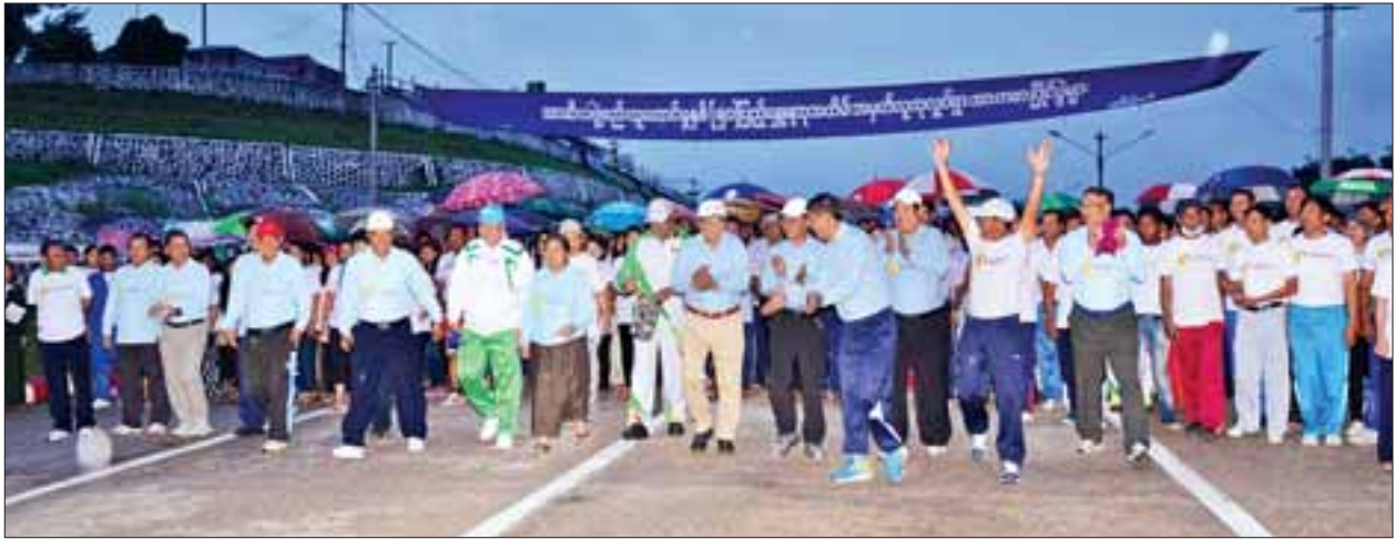
အမျိုးသမီး) ပြိုင်ပွဲများယှဉ်ပြိုင်နေမှုကို ကျန်းမာရေးနှင့်အားကစား ဝန်ကြီးဌာန ပြည်ထောင်စုဝန်ကြီးနှင့် တာဝန်ရှိသူများက လိုက်လံကြည့်ရှုအားပေးခဲ့ကြ သည်။

ဆက်လက်ပြီး စုပေါင်းလမ်းလျှောက်ပွဲအပြီးတွင် ဝဏ္ဏသိဒ္ဓိအားကစား လေ့ကျင့်ရေးကွင်း အမှတ်(၁)၌ ဝန်ကြီးဌာနပေါင်းစုံထုပ်ဆီးတိုးပြင်ပွဲ(အမျိုး သမီး)၊ လွန်ခဲ့ပြီပွဲ (အမျိုးသား၊ အမျိုးသမီး)ပြိုင်ပွဲများနှင့် ရိုးရာအားကစား နည်းများဖြစ်သော ခေါင်းအုံးရိုက်ပြိုင်ပွဲ၊ သုံးချောင်းထောက်ပြေးပြိုင်ပွဲ (အမျိုး သား၊ အမျိုးသမီး)၊ မိတာ ၁၀၀ အပြေးပြိုင်ပွဲ(အမျိုးသား၊ အမျိုးသမီး)၊ မိတာ ၂၀၀ အပြေးပြိုင်ပွဲ (အမျိုးသား၊ အမျိုးသမီး)၊ ဂုန်နီအိတ်စွပ်ပြိုင်ပွဲ (အမျိုးသား၊