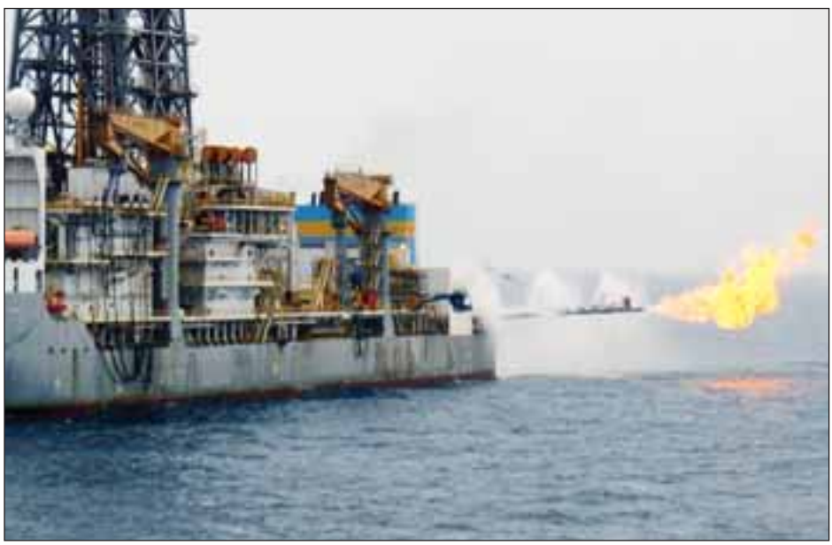
မြန်မာ့ကမ်းလွန်လုပ်ကွက်အမှတ် A(၆)မှ အကဲဖြတ်တွင်း ပြည်သစ်(၁)ကို တွေ့ရစဉ်။