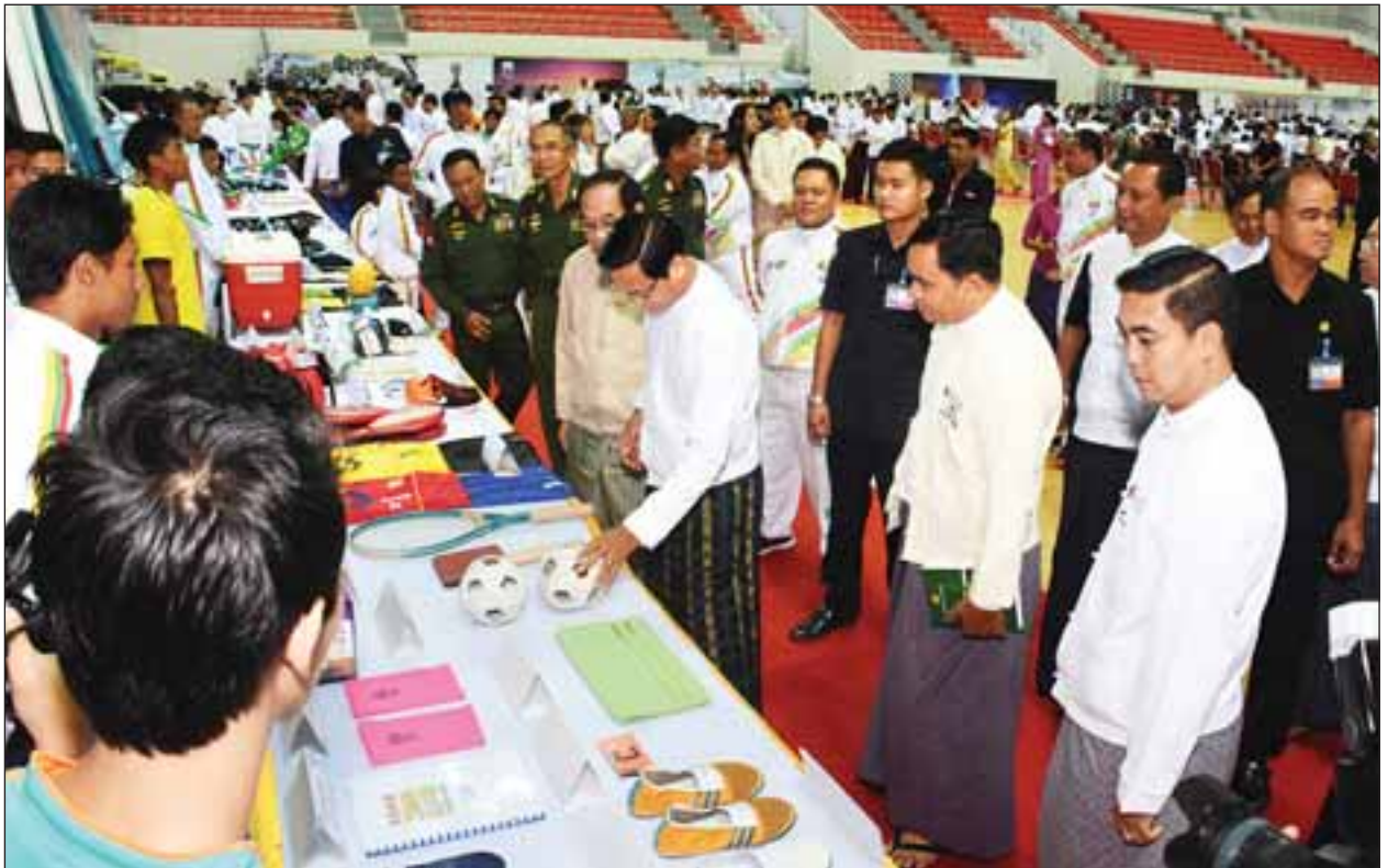
ခင်းကျင်းပြသထားသည့် ပြိုင်ပွဲသုံး အားကစားအထောက်အကူပြုပစ္စည်းများအား ဒုတိယသမ္မတ ဦးဟင်နရီဗန်ထီးယူ ကြည့်ရှုစဉ်။

(၂၉)ကြိမ်မြောက် အရှေ့တောင်အာရှအားကစားပြိုင်ပွဲ၏ အားကစားနည်း ၃၈ မျိုးတွင် မြန်မာနိုင်ငံမှ အားကစားနည်း ၂၉ မျိုး(ကစားသမား ၅၉၀ ခန့်) ဝင်ရောက်ယှဉ်ပြိုင်မည်။