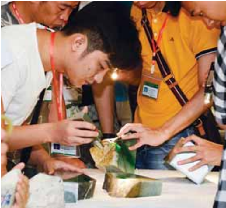
ခင်းကျင်း ပြသထားသည့် ကျောက်စိမ်း အတွဲများကို ကျောက်မျက် ကုန်သည်များ ကြည့်ရှုကြစဉ်။