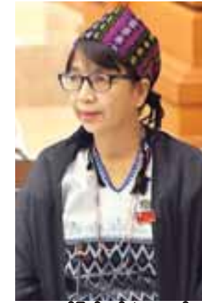
ကရင်ပြည်နယ် မဲဆန္ဒနယ် အမှတ်(၇)မှ နော်ခရစ္စထွန်း

မြို့နယ်ရုံးများကို ရပ်ရွာလူထု တွေ့ဆုံဆက်ဆံရာ လူမှု အခြေပြုဗဟိုဌာန(Community Centre)များ အဖြစ် လည်းကောင်း၊ စာကြည့်တိုက်များကို သက်ဆိုင်ရာဒေသ အသီးသီးတွင်ရှိသည့် ရပ်ရွာလူထု၏ အသိပညာလိုအပ်ချက် နှင့်အညီ ဖြည့်ဆည်းဆောင်ရွက်ပေးမည့် Community Library များ အဖြစ်လည်းကောင်း ပြောင်းလဲဖော်ဆောင် နိုင်ရန် ရည်ရွယ်လုပ်ဆောင်လျက်ရှိပါကြောင်း။