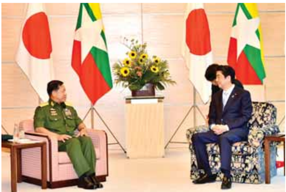
တစ်ဦးအနေဖြင့် ပထမဦးဆုံးအကြိမ် တွေ့ဆုံဆွေးနွေးမှု တစ်ခုလည်းဖြစ်ကြောင်း သိရသည်။ တပ်မတော်ကာကွယ်ရေးဦးစီးချုပ်နှင့် အဖွဲ့အား ဒေသစံတော်ချိန် ည ၇ နာရီတွင် ဂျပန်-မြန်မာ ချစ်ကြည်

SASAKAWA အား အထူးကိုယ်စားလှယ်အဖြစ် စေလွှတ် ကူညီဆောင်ရွက်ပေးလျက်ရှိပါကြောင်း၊ မြန်မာနိုင်ငံ၏ ဖွံ့ဖြိုးရေးနှင့် ငြိမ်းချမ်းရေးရရှိစေရန်အတွက် အစွမ်းကုန် ကူညီဆောင်ရွက်ပေးသွားမည်ဖြစ်ကြောင်း၊ မြန်မာ-ဂျပန် ဆက်ဆံမှုတွင် ဘက်ပေါင်းစုံမှတိုးတက်မှုများကို တွေ့မြင် နေကြောင်း၊ ဆက်ဆံရေးနှင့် ပူးပေါင်းဆောင်ရွက်ရေး တိုးမြှင့်ရန်သည် မိမိတို့၏ ခိုင်မာသည့်မူဝါဒဖြစ်ကြောင်း၊ ဒေသတွင်းတည်ငြိမ်အေးချမ်းရေးအတွက် မြန်မာနိုင်ငံနှင့် ပူးပေါင်းဆောင်ရွက်ရန် ဆန္ဒရှိကြောင်း၊ ဂျပန်နိုင်ငံ၏ ရင်းနှီးမြှုပ်နှံမှုများ မြန်မာနိုင်ငံတွင် တိုးမြှင့်လာမည်ဟု ယုံကြည်ပါကြောင်း၊ ပုဂ္ဂလိကလုပ်ငန်းရှင်များ ရင်းနှီးမြှုပ် နှံမှု ပိုမိုတိုးတက်မြှင့်တင်နိုင်ရေးအတွက် ပတ်ဝန်းကျင် အခြေအနေကောင်းများဖန်တီးပေးရန် လိုအပ်ကြောင်း ပြောကြားသည်။ တပ်မတော်ကာကွယ်ရေးဦးစီးချုပ်နှင့် ဂျပန်နိုင်ငံ ဝန်ကြီးချုပ်တို့ တွေ့ဆုံဆွေးနွေးမှုသည် ဂျပန်နိုင်ငံအစိုးရ အဖွဲ့သစ်ပြောင်းလဲပွဲစည်းပြီးနောက် ပြည်ပခေါင်းဆောင်