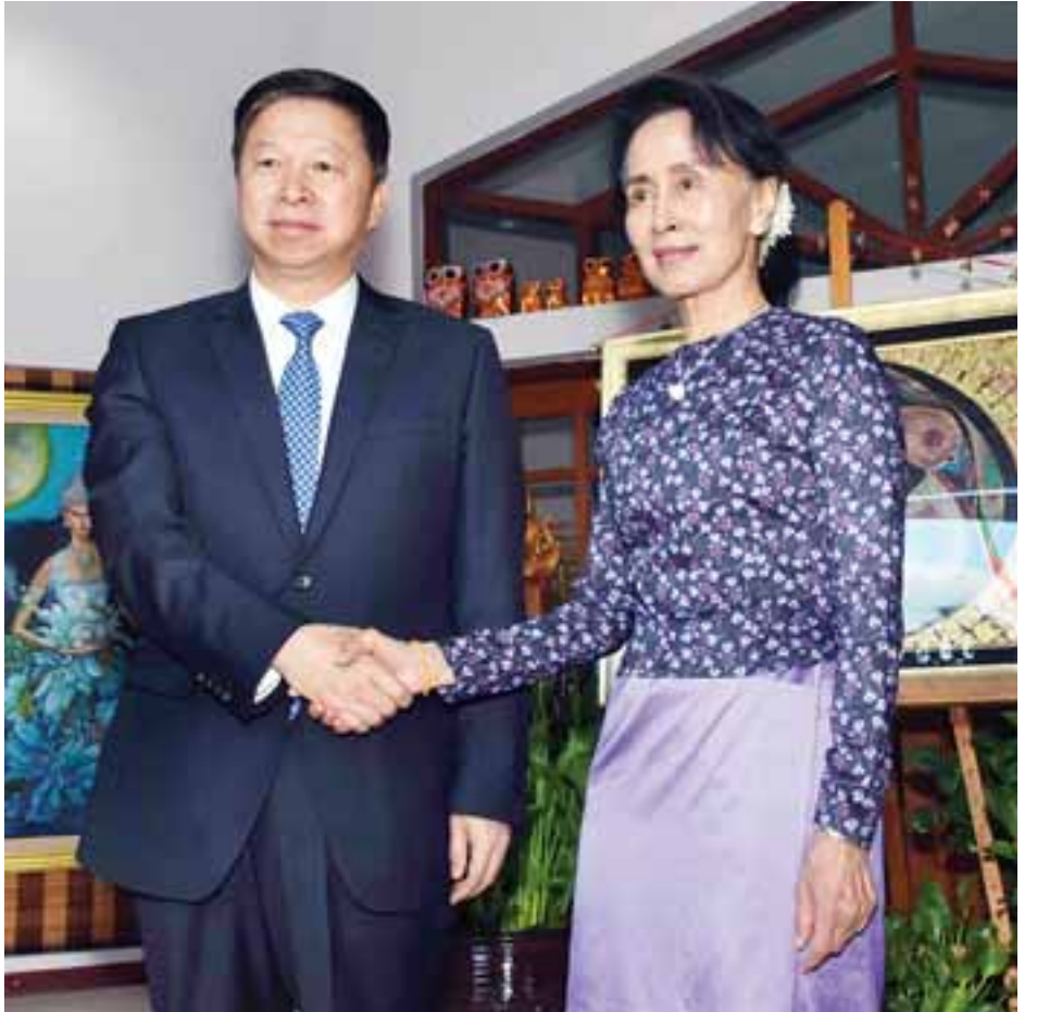
နိုင်ငံတော်၏အတိုင်ပင်ခံပုဂ္ဂိုလ် ဒေါ်အောင်ဆန်းစုကြည်နှင့် တရုတ်ကွန်မြူနစ်ပါတီနိုင်ငံတကာဆက်ဆံရေးဝန်ကြီး H.E. Mr. Song Tao တို့ ရင်းရင်းနှီးနှီးနှုတ်ဆက်စဉ်။