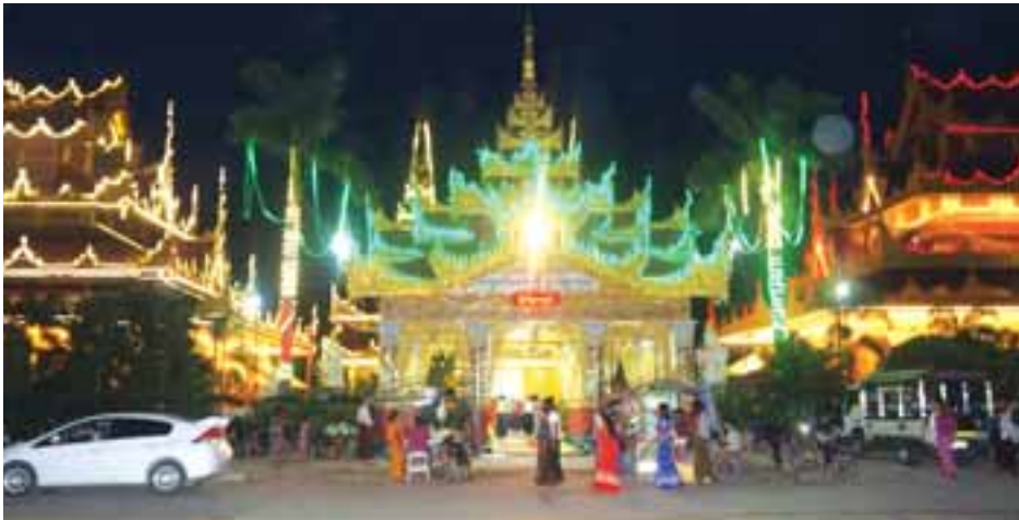
ကျောက်တော်ကြီးဘုရားကို ပဉ္စမ သင်္ဂါယနာတင်ဘဝရှင်မင်းတုန်းမင်း မြန်မာသက္ကရာဇ် ၁၂၂၆ ခုနှစ် ကျောက်တုံးတော်ကြီး တွေ့ရှိခဲ့ပြီး ကျောက်တုံးတော်ကြီးပုံသဏ္ဍာန်မှာ တစ်လုံးတစ်ခဲတည်းဖြစ်သည်။ မကွေး မန္တလေးမြို့ မြောက်ဘက် ၃၂ မိုင် အကွာ စကျင်ကျောက်တောင်မှ ဖြန့်ဖြူးပေးခဲ့ပြီး တောင်မြို့စားသေနတ် ဝန်ကြီးနှင့်လက်တက်ကျောက်ဆတ် သမားများက ၂၂၆ ခုနှစ်၊ ဝါခေါင် လတွင် စကျင်တောင်၌ ရုပ်ပွားတော် စတင်ထုလုပ်ခဲ့ကြောင်း သိရသည်။

အောင်မြေသာစံ ဩဂုတ် ၄ မန္တလေးမြို့ အောင်မြေသာစံမြို့နယ် ရှိသလိုင်းဝင် မဟာသကျမာရဇိန် ကျောက်တော်ကြီး ဘုရားသို့ ပြည်တွင်း၊ ပြည်ပခရီးသွားများ လာရောက် လေ့လာမှုများပြားလျက် ရှိရာ ညနေပိုင်း၌ ဘုရားဖူးပြည်သူများ ပိုမိုစည်ကားလျက် ရှိကြောင်း သိရ သည်။ “ကျောက်တော်ကြီးဘုရားအနီးမှာ သတ္တဌာနတွေ တည်ဆောက်ပြီး ကတည်းက ဘုရားဖူးများလာရောက်မှု များပြားလျက်ရှိကြောင်း၊ ညနေပိုင်း တွေမှာဆိုရင် ဘုရားဖူးခရီးသွား ပိုမို လာရောက်လျက်ရှိကြောင်း၊ နေ့စဉ် ဘုရားဖူးစည်ကားများပြားလျက်ရှိ ကြောင်း ပြည်ပခရီးသွားတွေ၊ ပြည်တွင်း ခရီးသွားတွေရောပါပဲ” ဟု အဆိုပါ ဘုရားအနီးတွင် ရောင်းချနေသောဈေး ဆိုင်ပိုင်ရှင်တစ်ဦးကပြောပြသည်။