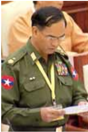
ဒုတိယဝန်ကြီး ဦးဝင်းကျော်

အစည်းအဝေးတွင် ကလေးမြို့နယ်မှ ဒေါ်အေးအေးမူ(ခ)ဒေါ်ရှားမီး၏