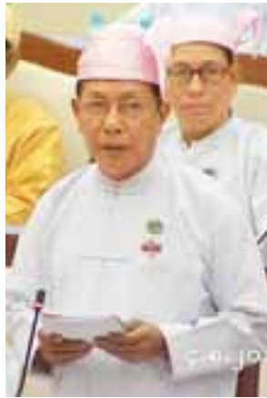
မြေပုံမဲဆန္ဒနယ်မှ ဦးဖေသန်း

ကလေးမြို့နယ်၊ မြို့မြေတိုင်းထွာသတ်မှတ်ပေးရန်အစီအစဉ် ရှိ မရှိ မေးခွန်းနှင့် စပ်လျဉ်း၍ ပြည်ထောင်စုဝန်ကြီးဌာန ဒုတိယဝန်ကြီး ဦးဝင်းကျော်က ကလေးမြို့သည် ရပ်ကွက်(၁၉)ရပ်ကွက်ဖြင့် ဖွဲ့စည်းထားရှိပါကြောင်း၊ အဆိုပါ မြို့ပေါ်ရပ်ကွက်များမှ မြေငှားဂရန်လျှောက်ထားမှုအပေါ် ၂၀၁၇ ခုနှစ် ဇူလိုင် ၂၅ ရက်အထိ ပုဂ္ဂလိက မြေငှားဂရန် ၄၁၉၈၊ စက်မှု၊ စီးပွားမြေငှားဂရန် ၂၈၀၊ ကျေးရွာမြေငှားဂရန် ၂၂၈ ခု မြေငှားဂရန်အမှုတွဲ စုစုပေါင်း ၄၇၀၆ တွဲအား ခွင့်ပြုချထားပေးခဲ့ပါကြောင်း။