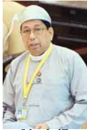
ပြည်ထောင်စုဝန်ကြီး ဒေါက်တာဖေမြင့်

ယခုအခါတွင် ခရိုင်နှင့် မြို့နယ်ရုံး စာကြည့်တိုက်များ ကို ပြည်သူများ အကျွမ်းတဝင် ဝင်ထွက်သွားလာသည့်နေရာ များ၊ ပြည်သူများ အသိပညာဗဟုသုတ ရှာဖွေရာနေရာများ ဖြစ်လာရန်အတွက် ကြိုးစားစီစဉ်ဆောင်ရွက်လျက်ရှိပါ ကြောင်း၊ ယခုကဲ့သို့ ဆောင်ရွက်သည့်နေရာတွင် ခရိုင်နှင့်