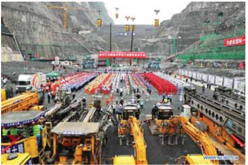
သည့်။ ယင်းပမာဏမှာ ကမ္ဘာ့အကြီးဆုံးရေအားလျှပ်စစ် လျှပ်စစ်စက်ရုံ၏ ထုတ်လုပ်မှု ပမာဏ၏နှစ်ဆဖြစ်သည်။ ဓာတ်အားပေးစက်ရုံဖြစ်သည့် မြစ်ကျဉ်းသုံးသွယ် ရေအား ဆင်ဟွာ။

မည်ဖြစ်သည်။ ကျွန်းမြစ်၌ အမြင့်မီတာ ၃၀၀ ရှိတမံတည်ဆောက်၍ ယင်းမြစ်၏ မြစ်ဝှမ်းဧရိယာ ၉၁ ရာခိုင်နှုန်းဖြစ်သော စတုရန်းကီလိုမီတာ ၄၃၀၀၀၀ အား စက်ရုံစီမံကိန်းအတွက် အသုံးပြုမည်ဖြစ်သည်။ အဆိုပါ စီမံကိန်းအကောင်အထည်ဖော်မှုကြောင့် ယူနန်နှင့် ဆီချမ်ပြည်နယ်များမှ ဒေသခံ ၁၀၀၀၀၀ ကျော်ကို နေရာရွှေ့ပြောင်းပေးရမည်ဖြစ်သည်။ ဘိုင်ဟိတန်စီမံကိန်းတွင် ရေအားလျှပ်စစ်ဓာတ်အားပေးစက်ရုံလေးရုံပါဝင်ပြီး ကျွန်းမြစ်၏ အကြောင်းအစွန်တွင် ဝူဒေါင်ဒီ ရေအားလျှပ်စစ်စက်ရုံကို တည်ဆောက်ဆဲဖြစ်သည်။ ယင်းစီမံကိန်းတွင်ပါရှိသော ရှီလောင်ဒူးနှင့် ရှီကျန်ဂျီဘာရေအားလျှပ်စစ်စက်ရုံများမှာ ၂၀၂၁ ခုနှစ်နှင့် ၂၀၁၃ ခုနှစ်တို့တွင် စတင်လည်ပတ်ခဲ့ကြသည်။ ယင်းစီမံကိန်းပါ ရေအားလျှပ်စစ်စက်ရုံလေးရုံစလုံး လည်ပတ်နိုင်ပါက လျှပ်စစ်ဓာတ်အား ကီလိုဝပ် ၄၆ သန်း ထုတ်လုပ်နိုင်စွမ်းရှိမည်ဖြစ်ပြီး တစ်နှစ်လျှင် ကီလိုဝပ်နာရီသန်းထောင်ပေါင်း ၁၉၀ ခန့်ထုတ်လုပ်ပေးနိုင်မည်ဖြစ်