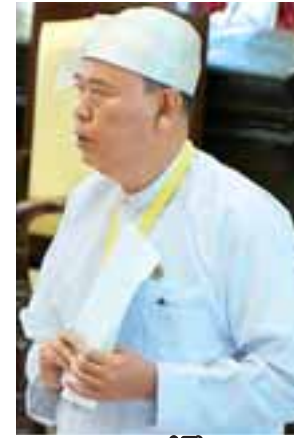
ပညာရေးဝန်ကြီးဌာန ဒုတိယဝန်ကြီး ဦးဝင်းမော်ထွန်း