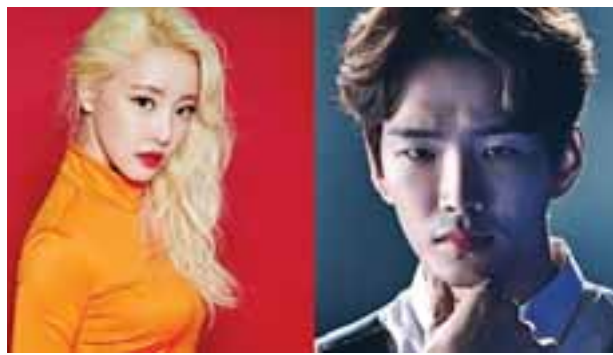
အေးပြည့် - စုစည်းသည်

ပြီးခဲ့တဲ့လကုန်ပိုင်းမှာ ကွယ်လွန်သွားခဲ့တဲ့ ရော့ခ်တေးသံရှင် ချက်စတာဘန်နှင့်တန်ဟာ ကိုယ့်ကိုယ်ကိုယ် သေကြောင်းကြံခဲ့ပြီး ရုတ်တရက်ကွယ်လွန်ခဲ့ခြင်းဖြစ်ကာ ချက်စတာရဲ့ သေဆုံးမှုပေါ် သူ့ရဲ့ ဇနီးသည် တယ်လင်ဒါက “ကျွန်မအနေနဲ့တော့ စိတ်တူကိုယ်တူလူတစ်ဦးကို ဆုံးရှုံးလိုက်ရတာဖြစ်ပြီး ကျွန်မရဲ့ကလေးတွေကတော့ သူတို့ရဲ့စိတ်ထဲက သူရဲကောင်းတစ်ဦးကို ဆုံးရှုံးလိုက်ရတာပါ။ ကျွန်မတို့မိသားစုအတွက်ကတော့ ပုံပြင်တစ်ခုထဲရောက်သွားသလိုမျိုးဖြစ်နေပြီး ရှိတဲ့စပီးယားရဲ့ ဝမ်းနည်းဖွယ် ပြဇာတ်တစ်ခုလိုအလှည့်အပြောင်းတစ်ခုဖြစ်ခဲ့ပါတယ်” လို့ ထုတ်ဖော်ပြောကြားခဲ့တယ်လို့လည်း သိရပါတယ်။ “Linkin Park”ရဲ့ အဖွဲ့ဝင်တစ်ဦးဖြစ်တဲ့ မိုက်ခဲရှင်နီဒါကတော့ သူတို့ရဲ့ကွယ်လွန်သွားခဲ့တဲ့ အဖွဲ့ဝင် ချက်စတာအတွက် ကမ္ဘာတစ်ဝန်းမှာ ဂုဏ်ပြုဖော်ပြေပွဲတွေ ပြုလုပ်ပေးသွားမှာဖြစ်ကြောင်း ထုတ်ဖော်ပြောကြားခဲ့တယ်လို့လည်း သိရပါတယ်။