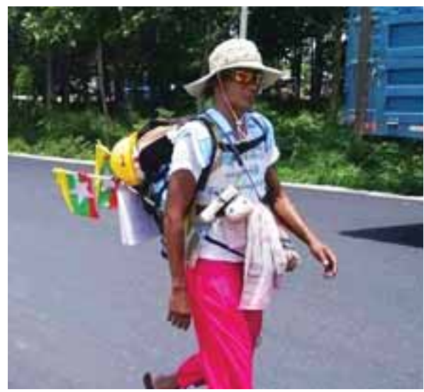
ပြင်ဦးလွင်- ရန်ကုန် အသွားအပြန် တစ်ကိုယ်တော် လမ်းလျှောက်သူ ကိုစနေ။