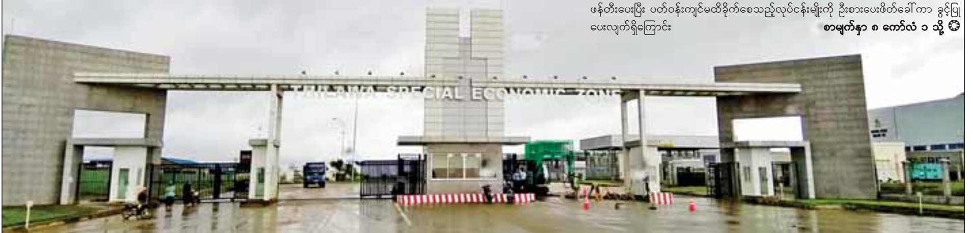
သီလဝါ အထူးစီးပွားရေးဇုန်ကို တွေ့ရစဉ်။