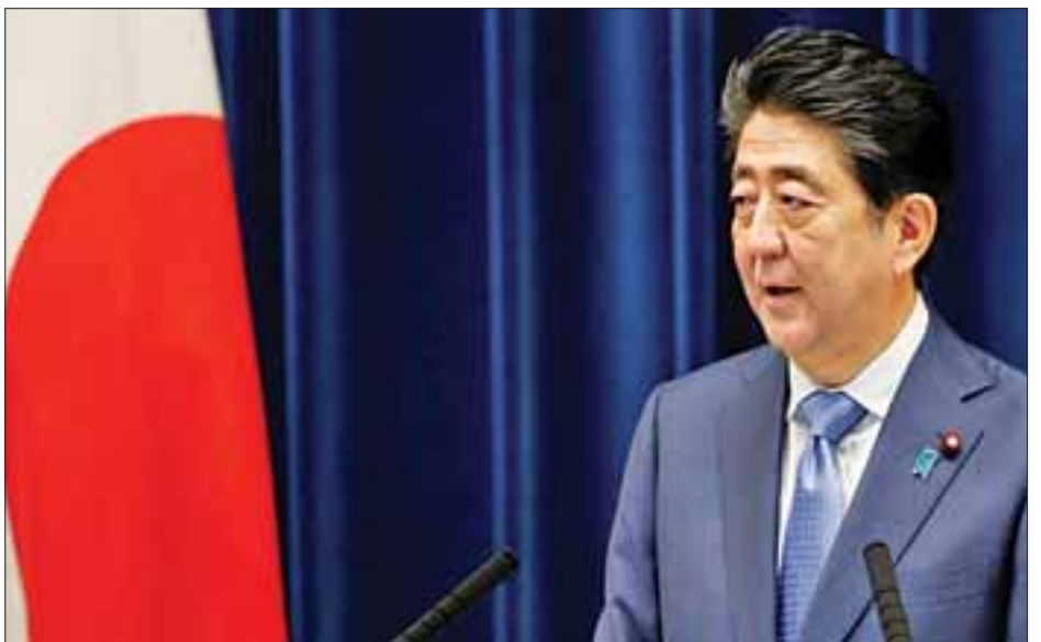
ဝန်ကြီးချုပ် ရှင်ဇီအာဘေးက ဆိုသည်။ ဥပဒေပြုလွှတ်တော်အမတ်များအနေဖြင့် ဖွဲ့စည်းပုံအခြေခံဥပဒေပြင်ဆင်မှုများနှင့်ပတ်သက်ပြီး ဆွေးနွေးညှိနှိုင်းမှုများ တိုးမြှင့်လုပ်ဆောင်ရန်မျှော်လင့်ပါကြောင်း ဝန်ကြီးချုပ်က ၎င်း၏ဆန္ဒကို ထုတ်ဖော်ခဲ့သည်။ အင်န်အိတ်ချီကေ။

လွှတ်တော်အမတ်များအကြား လပေါင်းများစွာ ဆွေးနွေးရသော အရေးပါသည့် ခေါင်းစဉ်တစ်ခုဖြစ်သည်။ ဝန်ကြီးဌာနများနှင့် အစိုးရအဖွဲ့ပြုပြင်ပြောင်းလဲရေးအတွက် အတွေ့အကြုံရှိ နိုင်ငံရေးသမားများအား ရွေးချယ်ခန့်အပ်ထားပြီးဖြစ်ကြောင်း ဝန်ကြီးချုပ်ရှင်ဇီအာဘေးက ဆိုသည်။ အစိုးရအဖွဲ့အား ပြုပြင်ပြောင်းလဲရေး လုပ်ဆောင်မည်ဆိုသည့် အစီအစဉ်သည် မြောက်ကိုရီးယားနိုင်ငံ၏ တာဝေးပစ်ခံ့ဒုံးကျည် စမ်းသပ်ပစ်လွှတ်ပြီးနောက် ရက်အနည်းငယ်အကြာတွင် ထွက်ပေါ်လာခဲ့ခြင်းဖြစ်သည်။ ဂျပန်နိုင်ငံ၏ လုံခြုံရေးနှင့် သံတမန်ဆက်ဆံရေးကို မြှင့်တင်နိုင်မည့် နိုင်ငံခြားရေးနှင့် ကာကွယ်ရေးဝန်ကြီးများအား ရွေးချယ်ခန့်အပ်မည်ဖြစ်ကြောင်း ဝန်ကြီးချုပ်ရှင်ဇီအာဘေးက ပြောကြားခဲ့သည်။ ယခုကဲ့သို့ မြောက်ကိုရီးယားနိုင်ငံနှင့် ဆက်ဆံရေးတင်းမာနေချိန်တွင် ဂျပန်နိုင်ငံအနေဖြင့် အမေရိကန်ပြည်ထောင်စုနှင့် ပိုမိုနက်ရှိုင်းသောမဟာမိတ်ဖွဲ့ရန် လိုအပ်သည့်အပြင် တစ်ဖက်ကလည်း တောင်ကိုရီးယား၊ တရုတ်နှင့် ရုရှားနိုင်ငံအပါအဝင် ကမ္ဘာ့နိုင်ငံများနှင့်လည်း ဆက်ဆံရေးကောင်းမွန်အောင် လုပ်ဆောင်သင့်ကြောင်း