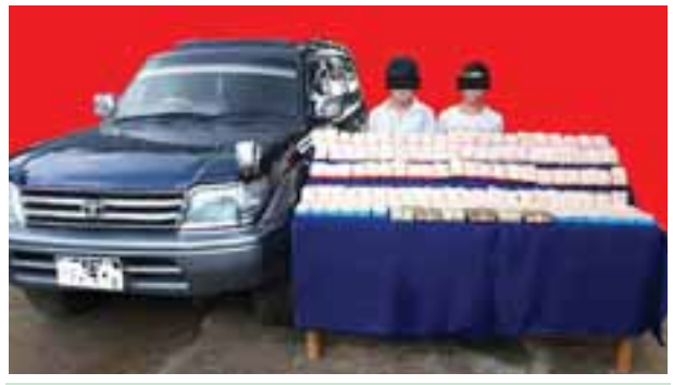
လီကျားချိန်နှင့် လီဖူးကျေးတို့ကို သိမ်းဆည်းရမိ မူးယစ်ဆေးဝါးများနှင့်အတူ တွေ့ရစဉ်။