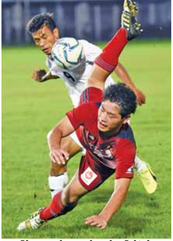
မြန်မာ ယူ-၂၂နှင့် Ryutsu တို့ နောက်ဆုံးခြေစမ်းခဲ့စဉ်။