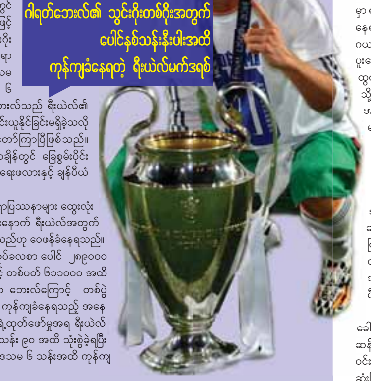
ဂါရတ်ဘေးလ်၏ သွင်းရိုးတစ်ရိုးအတွက် ပေါင်နှစ်သန်းနီးပါးအထိ ကုန်ကျခံနေရတဲ့ ရီးယဲလ်မက်ဒရစ်

ပြီးခဲ့သည့် ၂၀၁၆-၂၀၁၇ ဘောလုံးရာသီတွင် ဒဏ်ရာပြဿနာများကြောင့် ၂၇ ပွဲ၊ မိနစ်အားဖြင့် ၁၉၃၇ မိနစ်သာ ဝင်ရောက်ကစားပြီး သွင်းရိုး ကိုးရိုးနှင့် ရိုးဖန်တီးမှု ကိုးကြိမ်သာ ပြုလုပ်နိုင်ရာ ဘေးလ်၏ သွင်းရိုးတစ်ရိုးအတွက် ပေါင် ၃ ဒသမ ၅ သန်း၊ ရိုးဖန်တီးမှု တစ်ကြိမ်အတွက် ပေါင် ၆ ဒသမ ၃ သန်းအထိ ကုန်ကျခံခဲ့ရသည်။ ဘေးလ်သည် ရီးယဲလ်၏ ရာသီကြိုခြေစမ်းပွဲများတွင်လည်း တစ်ရိုးမျှ သွင်းယူနိုင်ခြင်းမရှိခဲ့သလို ခြေစွမ်းပျောက်ဆုံးနေသည်မှာ ကာလအတော်ကြာပြီဖြစ်သည်။ ဘေးလ်သည် ရီးယဲလ်သို့ စတင်ရောက်ရှိလာချိန်တွင် ခြေစွမ်းပိုင်း ထက်မြက်ခဲ့ပြီး ပွဲဦးထွက်နှစ်မှာပင် ကိုပါဒယ်ရေးဖလားနှင့် ချန်ပီယံ လိဂ်ဖလားတို့ကို ရယူပေးနိုင်ခဲ့သည်။ သို့သော် ပြီးခဲ့သည့် တစ်ရာသီလုံး ဒဏ်ရာပြဿနာများ ထွေးလုံး ရစ်ပတ်လာကာ ကာလရှည် အနားယူခဲ့ရပြီးနောက် ရီးယဲလ်အတွက် ဝန်ပိုထမ်းထားရသည့် ကစားသမားပင်ဖြစ်နေသည်ဟု ဝေဖန်ခံနေရသည်။ ရီးယဲလ်သည် ဘေးလ်အတွက် အသားတင် လုပ်ခလစာ ပေါင် ၂၈၉၀၀၀ ပေးချေသော်လည်း စပိန်အခွန်ဥပဒေကြောင့် တစ်ပတ် ၆၁၀၀၀၀ အထိ ကျခံနေရသလို ဒဏ်ရာရရှိချိန်များလွန်းသော ဘေးလ်ကြောင့် တစ်ပွဲ ဝင်ရောက်ကစားလျှင် ပေါင် ၈၃၀၀၀၀ အထိ ကုန်ကျခံနေရသည့် အနေ အထားပင်ဖြစ်သည်။ အချို့ဝက်ဘ်ဆိုက်များရဲ့ထုတ်ဖော်မှုအရ ရီးယဲလ် သည် ဘေးလ်အတွက် ပြောင်းရွှေ့ပေါင်သန်း ၉၀ အထိ သုံးစွဲခဲ့ရပြီး လေးနှစ်လုပ်ခလစာအတွက် စုစုပေါင်း ၁၂၄ ဒသမ ၆ သန်းအထိ ကုန်ကျ ခဲ့ကြောင်း သိရသည်။