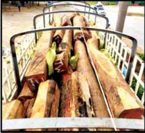
တရားဝင် စာရွက်စာတမ်း အထောက်အထားတစ်စုံတစ်ရာ တင်ပြနိုင် ခြင်းမရှိသော ပိတောက်သစ်လုံး၊ ပိတောက်စားရွေနှင့် ပစ္စည်းသယ်ဆောင် သည့်ယာဉ်။

နေပြည်တော် ဩဂုတ် ၃ တရားမဝင်ကုန်စည်များ တားဆီးထိန်းချုပ်ရေးအတွက် ရေပူနှင့်မရမ်းချောင့် အမြဲတမ်းစစ်ဆေးရေးစခန်းတို့ကို ငွာနဆိုင်ရာ ပူးပေါင်းအဖွဲ့များဖြင့် မတ် ၁ ရက်တွင် စတင်ဖွင့်လှစ်ဆောင်ရွက်ခဲ့ပြီး ဩဂုတ် ၂ ရက်တွင် မန္တလေး-မုဆယ် ပြည်ထောင်စုလမ်းမကြီးတစ်လျှောက် ကုန်သွယ်မှုယာဉ် ပို့ကုန် ၆၂၆ စီး၊ သွင်းကုန် ၅၇၄ စီး၊ ရန်ကုန်-မြဝတီလမ်းမကြီးတစ်လျှောက် ကုန်သွယ်မှုယာဉ် ပို့ကုန် ၅၄ စီး၊ သွင်းကုန် ၁၈၃ စီး ကုန်စည်များ သယ်ယူပို့ဆောင်လျက်ရှိသည်။ အဆိုပါ စစ်ဆေးရေးစခန်းများက တင်သွင်း/တင်ပို့သောကုန်ပစ္စည်း များကို စစ်ဆေးမှုပြုလုပ်ဆောင်ရွက်လျက်ရှိရာ ဩဂုတ် ၂ ရက်တွင် ရေပူအမြဲတမ်း စစ်ဆေးရေးစခန်းက တားဆီးမှုလေးမှု (ခန့်မှန်းတန်ဖိုးငွေကျပ် ၈၈ ဒသမ ၇၉၈ သန်းခန့်)၊ မရမ်းချောင့်အမြဲတမ်းစစ်ဆေးရေးစခန်းက တားဆီးမှုလေးမှု(ခန့်မှန်းတန်ဖိုးငွေကျပ် ၈၈ ဒသမ ၈၄၆ သန်းခန့်) စုစုပေါင်း တားဆီးမှု ရှစ်မှု (ခန့်မှန်းတန်ဖိုးကျပ် ၁၇၇ ဒသမ ၆၄၄သန်းခန့်)ကို သိမ်းဆည်း ရမိခဲ့ကြောင်း သိရသည်။ ထူးခြားသိမ်းဆည်းမှုအနေဖြင့် ဩဂုတ် ၂ ရက်တွင် လားရှိုး-မုဆယ် ပြည်ထောင်စုလမ်းမကြီး လားရှိုးနှင့်ရေပူကြား ရပ်တန့်ထားသော မော်တော်ယာဉ်များကို ရေပူအမြဲတမ်းစစ်ဆေးရေးစခန်း ပူးပေါင်းစစ်ဆေးရေး အဖွဲ့က လိုက်လံစစ်ဆေးခဲ့ရာ မိုင်တိုင်အမှတ်(၁၉၁) မိုင် ခုနစ်ဖာလုံ ပန်ဖက် ကျေးရွာအနီး၌ တွဲကား ၂၂ ဘီးယာဉ်တစ်စီး ရပ်တန့်ထားသည်ကို တွေ့ရှိ၍ စစ်ဆေးခဲ့ရာ ယာဉ်ပေါ်တွင် တရားဝင် စာရွက်စာတမ်း အထောက် အထား တစ်စုံတစ်ရာတင်ပြနိုင်ခြင်းမရှိသော ပိတောက်သစ်လုံး ၁၈ လုံး(၃ ဒသမ ၄၅၅၂ တန်)၊ ပိတောက်စားရွေ ၆၃ တုံး (၆ ဒသမ ၃၈၆၈ တန်)နှင့်