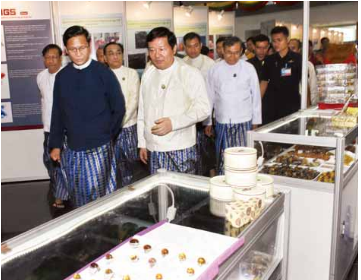
မြန်မာ့ကျောက်မျက်ရတနာနေ့အထိမ်းအမှတ် ခင်းကျင်းပြသထားသည့်ပြခန်းများကို ဒုတိယသမ္မတ ဦးဟင်နရီဗန်ထီးယူ လှည့်လည်ကြည့်ရှုစဉ်။