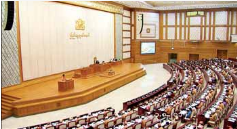
ဒုတိယအကြိမ်ပြည်သူ့လွှတ်တော် ပဋိပက္ခမှန်အစည်းအဝေး (၃၈)ရက်မြောက်နေ့ ကျင်းပစဉ်။

နေပြည်တော် ဩဂုတ် ၃ ဒုတိယအကြိမ်ပြည်သူ့လွှတ်တော် ပဋိပက္ခမှန်အစည်းအဝေး (၃၈)ရက်မြောက်နေ့ကို ယနေ့နံနက် ၁၀ နာရီတွင်ကျင်းပရာ မေးခွန်း(၆)ခု မေးမြန်းဖြေကြားခြင်း၊ ဆက်သွယ်ရေးဥပဒေကို ပြင်ဆင်သည့်ဥပဒေကြမ်း လက်ခံရရှိကြောင်း အသိပေးတင်ပြခြင်းနှင့် သစ်တောဥပဒေကြမ်း တင်သွင်းခြင်းတို့ကို ဆောင်ရွက်ကြသည်။