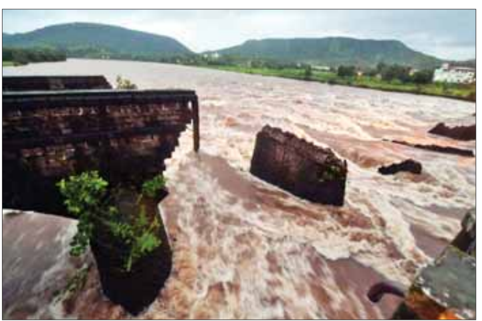
ယခုနှစ် မေလအတွင်းက မြစ်ကူးတံတားတစ်စင်းပြိုကျခဲ့ရာ တံတားပေါ်တွင် ခြေကျင့်လျှောက်သွားနေသည့် လူနှစ်ဦး ထက်မနည်း သေဆုံးခဲ့ပြီး လူအချို့ ထိခိုက်ဒဏ်ရာရခဲ့သည်။ ယမန်နှစ် ဩဂုတ်လအတွင်းကလည်း မွမ်ဘိုင်းမြို့နှင့် ဝိအာအကြား ကားလမ်းပေါ်ရှိ တံတားတစ်စင်း ပြိုကျမှုကြောင့် ခရီးသည်တင် ဘတ်စ်ကားနှစ်စီးနှင့် အခြားယာဉ်တစ်စီးတို့ မြစ်ရေပြင်အတွင်း ကျသွားခဲ့ပြီး လူ ၃၈ ဦး သေဆုံးခဲ့ရသည်။ ဆင်ယွာ။

အချက်အလက်များကောက်ယူခဲ့ကြောင်း၊ ယင်းသို့ လုပ်ဆောင်ခြင်းမှာ မတော်တဆဖြစ်ရပ်များ ဖြစ်ပွားမှုများအား ရှောင်လွှဲနိုင်စေရေးအတွက် လုပ်ဆောင်သည့် အစီအစဉ်တစ်ရပ်ဖြစ်ကြောင်း ၎င်းက ဆက်လက်ပြောကြားသည်။ တံတားများပြိုကျမှုဖြစ်ရပ်များသည် အိန္ဒိယနိုင်ငံ၌ မကြာခဏဖြစ်ပွားလေ့ရှိသည်။ အိန္ဒိယနိုင်ငံ၌ တံတားများပြိုကျမှုဖြစ်ပွားရခြင်းမှာ ဗြိတိသျှကိုလိုနီခေတ်အတွင်းက တည်ဆောက်ခဲ့သည့် တံတားများကို ပြုပြင်ထိန်းသိမ်းမှု အားနည်းခြင်းလည်း ပါဝင်ပြီး အခြားသောအကြောင်းများမှာ တံတားများ တည်ဆောက်မှု၌ အရည်အသွေးစစ်ဆေးမှု ပျက်ယွင်းခြင်းနှင့် စံချိန်စံညွှန်းမမီသော တည်ဆောက်ရေးပစ္စည်းများကို သုံးစွဲခြင်းတို့ကြောင့်လည်းဖြစ်သည်။ အိန္ဒိယနိုင်ငံအနောက်ပိုင်း ဝိအာပြည်နယ်တွင်