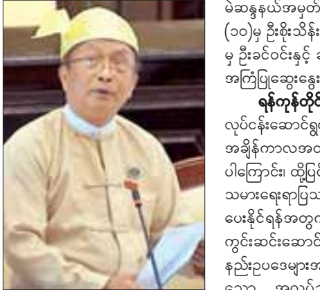
မကွေးတိုင်းဒေသကြီး မဲဆန္ဒနယ် အမှတ်(၁၀)မှ ဒေါက်တာကျော်ငွေ

အစည်းအဝေးတွင် ချင်းပြည်နယ် မဲဆန္ဒနယ်အမှတ်(၁၀)မှ ဦးဝေတင်၏ ပလက်ဝမြို့တွင် တိုင်းရင်းဆေးဌာနတစ်ခုကို ၂၀၁၈-၂၀၁၉ ဘဏ္ဍာနှစ်တွင် ချပေးရန်နှင့် အဆောက်အအုံအသစ် တည်ဆောက်ပေးရန် အစီအစဉ် ရှိ မရှိ မေးခွန်းနှင့်စပ်လျဉ်း၍ ကျန်းမာရေးနှင့် အားကစားဝန်ကြီးဌာန ပြည်ထောင်စုဝန်ကြီး ဒေါက်တာမြင့်ထွေးက တိုင်းရင်းဆေးပညာဦးစီးဌာနအနေဖြင့် ဆေးရုံ၊ ဆေးကုဌာနများကို တိုးချဲ့ဆောင်ရွက်ရာတွင် လိုအပ်သည့် မြေဧရိယာ၊ လူဦးရေသိပ်သည်းမှု၊ လမ်းပန်းဆက်သွယ်ရေး၊ ဝန်ထမ်းများအတွက် လုံခြုံရေး၊ မြန်မာ့တိုင်းရင်းဆေးအား နယ်မြေခံလူထု၏ ယုံကြည်အားထားမှု၊ ပတ်ဝန်းကျင်၌ တိုင်းရင်းဆေးရုံ၊ ဆေးကုဌာနများတည်ရှိမှု၊ ဘတ်ဂျက်ခွင့်ပြုမှု အပေါ်မူတည်၍ တစ်နိုင်ခင်လုံးအတိုင်းအတာဖြင့် ခြံရံစဉ်းစား၍ ဘတ်ဂျက်စည်းမျဉ်း၊ စည်းကမ်းများနှင့်အညီ ဆောင်ရွက်လျက်ရှိပါကြောင်း။