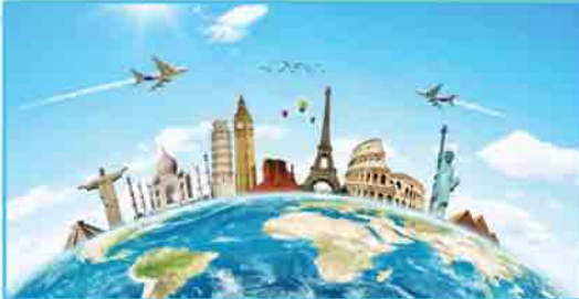
ခရီးသွားအာမခံ