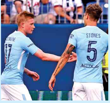
မေလွဲသင်း - ခုနည်းသည်

လာမည့်ရာသီတွင် ပရီမီယာလိဂ်ဆုဖလားကို မန်စီးတီး သာရယူရန် အလားအလာကောင်းနေပြီး စပါးအသင်း မှာမူ ယာယီအိမ်ကွင်း ဝင်ဘလေတွင် ရုန်းကန်ရနိုင် ကြောင်း စပါးနည်းပြဟောင်း ရက်ပ်နက်ပ်က ဟောကိန်း ထုတ်ခဲ့သည်။ ရက်ပ်နက်ပ်က ဂျီဒီယိုလူ၏ အရည် အသွေးပိုင်းအပေါ် ယုံကြည်သူ သူ့အတွက် မန်စီးတီးသာ ပရိသတ်များကို စိတ်လှုပ်ရှားမှုပေးနိုင်ဆုံး ကလပ် အသင်းအဖြစ်သာမက လာမည့်ရာသီ ဗိုလ်စွဲရန် အလားအလာ အကောင်းဆုံးအသင်းဟု မှတ်ချက်ပြု ခဲ့သည်။ မန်စီးတီး၊ မန်ယူ၊ စပါး၊ အဲဗာတန်၊ အာဆင်နယ်၊ လီဗာပူးနှင့် ချယ်လ်ဆီးတို့သာ ထိပ်ဆုံး ခုနစ်နေရာအတွင်းဝင်မည်ဖြစ်ပြီး ချန်ပီယံဆုအတွက် ဆိုလျှင်မူ မန်ယူ၊ မန်စီးတီး၊ ချယ်လ်ဆီးနှင့် လီဗာပူး တို့ထဲကသာ ရယူနိုင်ခြေရှိကြောင်းလည်း ရက်ပ်နက်ပ် က အဖြေထုတ်ခဲ့သည်။