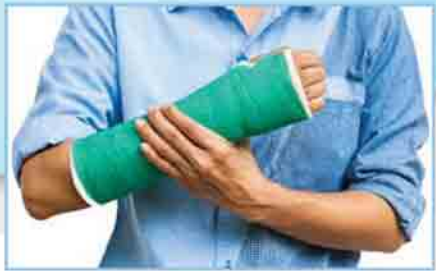
ကိုယ်အင်္ဂါထိခိုက်မှုအာမခံ

အောင်သစ္စာဦးအာမခံကုမ္ပဏီလီမိတက်တွင် ကိုယ်အင်္ဂါထိခိုက်မှုအာမခံ၊ ရေယာဉ်ကိုယ်ထည်အာမခံ၊ ခရီးသွားအာမခံ၊ တောင်သူလယ်သမားအသက်အာမခံ တို့အား (၁၀.၇.၂၀၁၇)ရက်နေ့မှစတင်၍ လက်ခံဆောင်ရွက်ပေးနေပါသည်။