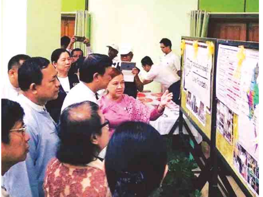
နေနဒီ(မြစ်ဝယ်)

ပါမောက္ခဒေါက်တာဝင်းဝင်းဆွေက အသည်းရောင် အသားဝါရောဂါအကြောင်း သိကောင်းစရာများကို ရှင်းလင်းဆွေးနွေးပြီး တက်ရောက်လာသူများက သိလိုသည်များကိုမေးမြန်းရာ ပြန်လည်ဖြေကြား သည်။ အခမ်းအနားသို့ မန္တလေးတိုင်းဒေသကြီး စည်ပင် သာယာရေးဝန်ကြီး မန္တလေးမြို့တော်ဝန် ဒေါက်တာ ရဲလွင်၊ ပြည်သူ့ကျန်းမာရေးဦးစီးဌာန၊ ကုသရေး ဦးစီးဌာနနှင့် ကျန်းမာရေးဆိုင်ရာ လူ့စွမ်းအား အရင်းအမြစ်ဦးစီးဌာနတို့မှ တာဝန်ရှိသူများ၊ WHO, Clinton Health Access Initiative, အသည်း ဖောင်ဒေးရှင်း အစရှိသော NGO, INGO များမှ ကိုယ်စားလှယ်များနှင့် ဖိတ်ကြားထားသူများ တက် ရောက်ကြသည်။ ပြည်သူ့ကျန်းမာရေးဦးစီးဌာန၊ ဗဟိုကူးစက် ရောဂါ တိုက်ဖျက်ရေးဌာနခွဲ၊ အမျိုးသားအသည်း ရောင် အသားဝါရောဂါ ကာကွယ်ထိန်းချုပ်ရေးစီမံ ချက်ဖြင့် ၂၀၁၄ ခုနှစ်မှ စတင်၍ အသည်းရောင် အသားဝါရောဂါ ကာကွယ်တိုက်ဖျက်ရေးလုပ်ငန်း များကို ကျန်းမာရေးနှင့်အားကစားဝန်ကြီးဌာန၏ ကြီးကြပ်လမ်းညွှန်မှု၊ ကမ္ဘာ့ကျန်းမာရေးအဖွဲ့၊ Clinton Health Access Initiative၊ အသည်း ဖောင်ဒေးရှင်းစသည့် မိတ်ဖက်အဖွဲ့အစည်းများ၏ ထောက်ပံ့မှုများဖြင့်အကောင်အထည်ဖော်ဆောင် ရွက်လျက်ရှိသည်။ ၂၀၁၇ ခုနှစ် ကမ္ဘာ့အသည်းရောင်အသားဝါ ရောဂါ တိုက်ဖျက်ရေးနေ့အတွက် ကမ္ဘာ့ကျန်းမာရေး အဖွဲ့၏ ဆောင်ပုဒ်မှာ Eliminate Hepatitis အသည်းရောင်အသားဝါရောဂါ ကင်းဝေးဖို့ အား လုံးပူးပေါင်းကြိုးပမ်းစို့ဖြစ်ကြောင်းသိရသည်။ (၀၀၂)