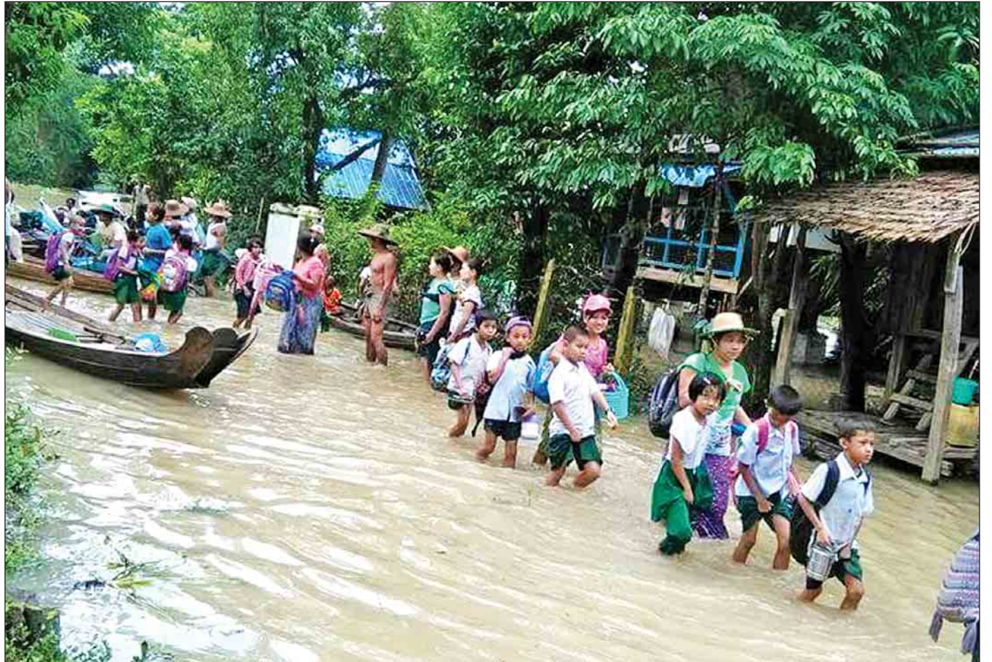
ပုသိမ်ခရိုင် ကန်ကြီးထောင့်မြို့တွင် ဒုက္ခသည်များအား ကျောင်းသားကျောင်းသူများ ကျောင်းသို့ ခက်ခဲစွာသွားလာနေရစဉ်၊ မြို့နယ်အတွင်းရှိ အခြေခံပညာကျောင်းရှစ်ကျောင်းလည်း ယာယီပိတ်ထားရကြောင်း သိရသည်။ (သတင်း စာမျက်နှာ - ၈)