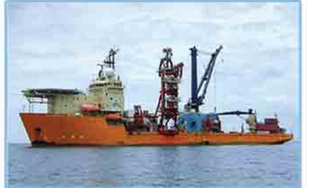
ရေယာဉ်ကိုယ်ထည်အာမခံ

“အမေရိကန်ဒေါ်လာဖြင့်လည်း လက်ခံဆောင်ရွက်ပေးနေပါသည်”