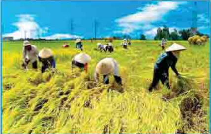
တောင်သူလယ်သမားအသက်အာမခံ