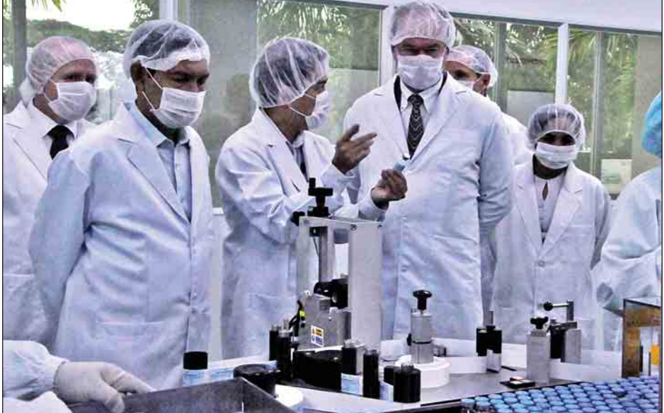
များ၌ သာမန်အခန်းအပူချိန်တွင် ထိန်းသိမ်းထားနိုင် များကို ပိုမိုထုတ်လုပ်ဖြန့်ဖြူးပေးနိုင်တော့မည်ဖြစ်ကြောင်း သိရသည်။ သတင်း-မင်းသစ်(MNA)၊ ဓာတ်ပုံ-နေလင်း

ဆေးဝါးစက်ရုံ(အင်းစိန်) BPI သည် မြေဆိပ်ဖြေဆေးများကို နိုင်ငံတော်၏ လိုအပ်ချက်ပြည့်မီအောင် ထုတ်လုပ်ပေးနေပြီး ၂၀၁၇-၂၀၁၈ ဘဏ္ဍာနှစ်တွင် ကျေးလက်ဒေသ