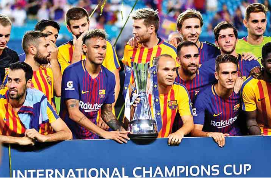
တော့ မန်စီးတီးက ပရီမီယာလိဂ်ပြိုင်ဘက် စပါးကို ကို အနိုင်ရခဲ့တာကြောင့် ဒုတိယနေ့သာ ကျေနပ်ခဲ့ရတာ သုံးဂိုးပြတ်နဲ့ အနိုင်ကစားခဲ့ပေမယ့် ဘာစီလိုနာက နီးယဲလ် ဖြစ်ပါတယ်။