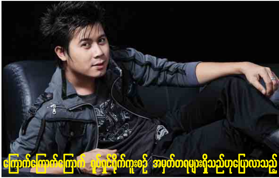
ကြောက်ကြောက်ကြောက် ရုပ်ရှင်ရိုက်ကူးစဉ် အမှတ်တရများရှိသည်ဟုပြောလာသည်