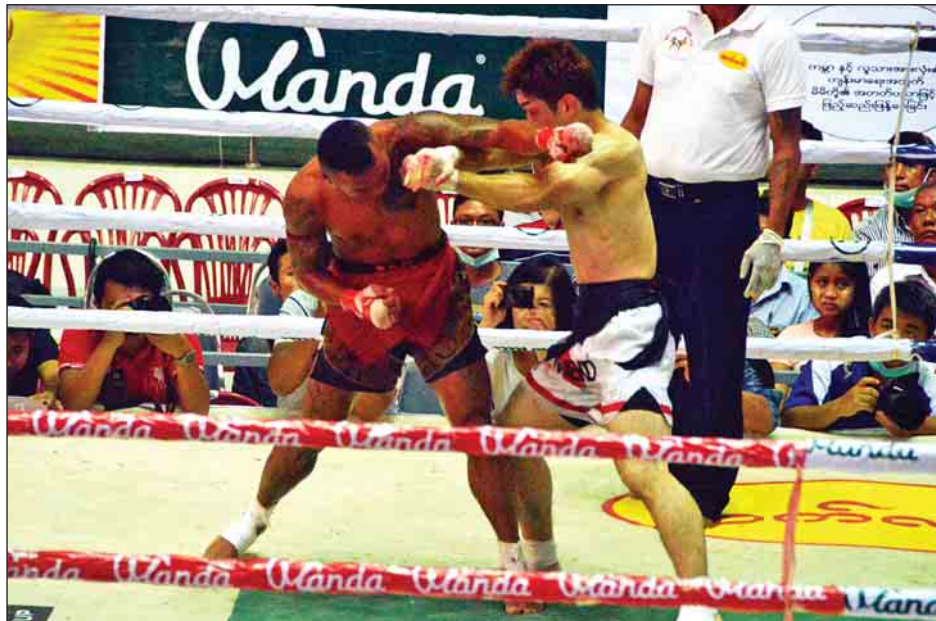
နိုင်ငံတကာစိန်ခေါ်ပွဲအဖြစ် သပြေညို(Adventure)နှင့် နိုင်ငံခနဲကို(ဂျပန်)တို့ ယှဉ်ပြိုင်ထိုးသတ်ကြစဉ်။