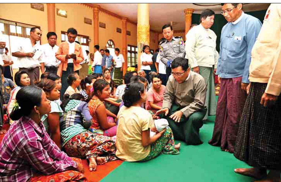
ဦးအတွက်ဆန်ရိက္ခာတစ်ပတ်စာ တန်ဖိုးငွေကျပ် ၈၃၇၉၀၀၊ ၁၅၀၀၀၀၊ ရေဘေးသင့်ပြည်သူများ ညပိုင်းလျှပ်စစ်မီးရရှိရေးအတွက် စက်သုံးဆီဖိုး ငွေကျပ် ၄၇၆၀၀၀၊ ရေဘေး

ထို့နောက် ပြည်ထောင်စုဝန်ကြီးနှင့်အဖွဲ့သည် တလုပ်ကုန်းကျေးရွာအုပ်စု နွားတောင်ကျေးရွာရှိ မင်္ဂလာရာမကျောင်းတိုက်သို့ရောက်ရှိကြပြီး နွားတောင်၊ ဘုရားကုန်း၊ ကျိန္တလီ၊ ကမ်းပါးနီကျေးရွာများမှ ရေဘေးရှောင်ပြည်သူများနှင့်တွေ့ဆုံကာ အားပေးစကားပြောကြားပြီး ဘုရားကုန်းရွာ၊ ကျိန္တလီကျေးရွာများမှ ရေဘေးသင့်ပြည်သူ ၃၉၉