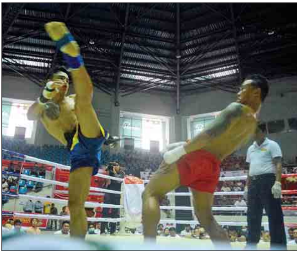
(၆၇)ကီလိုတန်း ဗိုလ်လုပွဲအဖြစ် ဖိုးလပြည့်(ရွှေဖူး)နှင့် ရွှေမင်းရာဇာ(မြိုင်ကလေးဘီလပ်မြေစက်ရုံ)တို့ ယှဉ်ပြိုင်ထိုးသတ်စဉ်။

အဆိုပါ ဖမ်းဆီးရမိ ဂျာနီအာလောင်းပါ နှစ်ဦးအား အမှုဖွင့်အရေးယူထားပြီး တစ်ဖက်နိုင်ငံ တာဝန်ရှိသူများအား အကြောင်းကြားရန် ဆောင်ရွက်လျက်ရှိကြောင်း သိရသည်။ (သတင်းစဉ်)