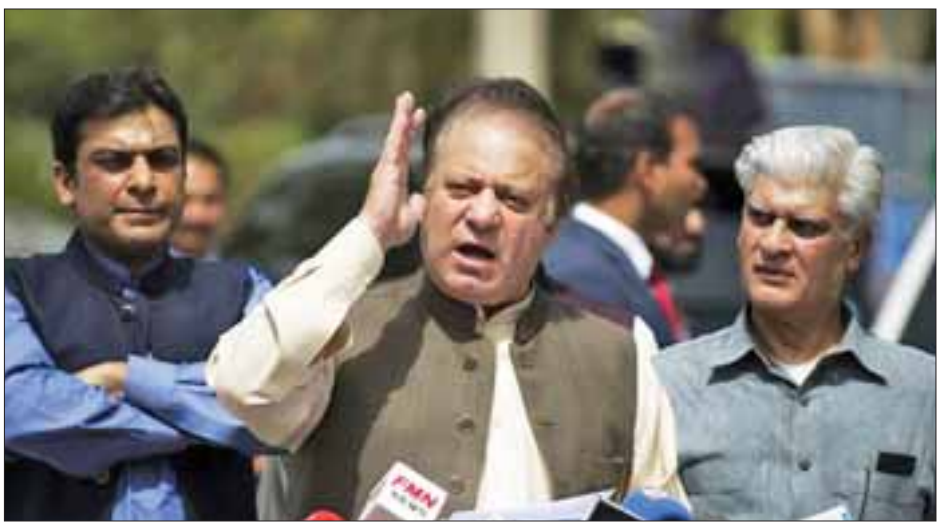
ဝန်ကြီးချုပ်နာဝပ်ရှရစ်ဖ်သည် တရားရုံးချုပ်၏ ဆင်းပေးခဲ့ကြောင်း အာဏာရပါတီဖြစ်သည့် ပါကစ္စတန် ဆုံးဖြတ်ချက်ပေါ်ထွက်ခဲ့ပြီး ချက်ချင်းပင် ရာထူးမှ မွတ်စလင်လိင်က ပြောကြားသည်။