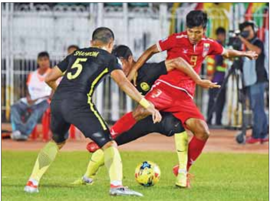
မြန်မာလက်ရွေးစင်အသင်းနှင့် မလေးရှားလက်ရွေးစင်အသင်းတို့ ပြီးခဲ့သည့်နှစ် ဆူဇူကီးဖလားပြိုင်ပွဲတွင် တွေ့ဆုံခဲ့စဉ်။