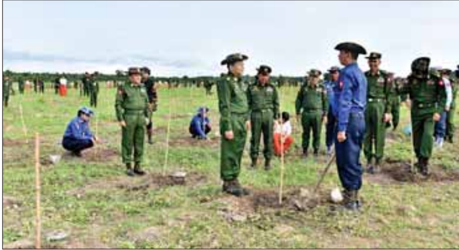
ထို့နောက် တပ်မတော်ကာကွယ်ရေးဦးစီးချုပ် ဗိုလ်ချုပ်မှူးကြီးမင်းအောင်လှိုင်နှင့် ဇနီးတို့က မိုးရာသီ သစ်ပင်စိုက်ပျိုးပွဲအထိမ်းအမှတ် ရတနာတန်းဝင်ကျွန်းပင် ကို စိုက်ပျိုးပေးကြသည်။ ဆက်လက်၍ ဒုတိယတပ်မတော်

တပ်မတော်ကာကွယ်ရေးဦးစီးချုပ် ဗိုလ်ချုပ်မှူးကြီး မင်းအောင်လှိုင်သည် ယနေ့နံနက် ၇ နာရီတွင် နေပြည်တော် ဇေယျာသီရိမြို့နယ် ရေဆင်းဆည်အနီး၌ ကျင်းပသည့် ကာကွယ်ရေးဦးစီးချုပ်ရုံး (ကြည်း၊ ရေ၊ လေ) မိသားစုများ၏ ရေဆင်းဆည် သဘာဝပတ်ဝန်းကျင် ထိန်းသိမ်းရေးအတွက် ဒုတိယအကြိမ် မိုးရာသီသစ်ပင် စိုက်ပျိုးပွဲအခမ်းအနားသို့ တက်ရောက်သည်။