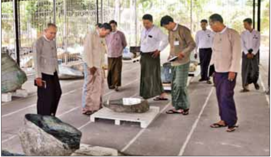
လုပ်ငန်းကော်မတီအသီးသီးမှ တာဝန် ရှိသူများက သက်ဆိုင်ရာလုပ်ငန်းများ အလိုက် ရှင်းလင်းတင်ပြကြသည်။ ပြည်ထောင်စုဝန်ကြီးသည် ရတနာ ပြပွဲတွင်ရောင်းချမည့် ကျောက်စိမ်း အတွဲများ မင်္ဂလာကျောက်စိမ်း ခန်းမအတွင်း ခင်းကျင်းထားရှိမှုကို ကြည့်ရှုစစ်ဆေးပြီး ပြပွဲဆိုင်ရာ လုပ်ငန်းများနှင့်စပ်လျဉ်း၍ လိုအပ်

သယံဇာတနှင့် သဘာဝပတ်ဝန်းကျင် ထိန်းသိမ်းရေးဝန်ကြီးဌာန မြန်မာ့ ကျောက်မျက်ရတနာပြပွဲ ဗဟို ကော်မတီသည် (၅၄) ကြိမ်မြောက် မြန်မာ့ကျောက်မျက်ရတနာပြပွဲကို ဩဂုတ် ၂ ရက်မှ ၁၁ ရက်အထိ နေပြည်တော် မင်္ဂလာကျောက်စိမ်း ခန်းမ၌ ကျင်းပမည်ဖြစ်သည်။