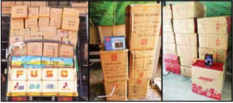
တရားဝင်စာရွက်စာတမ်း အထောက်အထား တစ်စုံတစ်ရာ တင်ပြနိုင်ခြင်းမရှိသော စလောင်းကြီး၊ LED ဘုရားမီး၊ ခြင်ထောင်း၊ ရေဒီယို၊ ဓာတ်မီး၊ မီးလုံးအခွံ၊ LED Panel Light Power Adapter နှင့် Hot Plate။