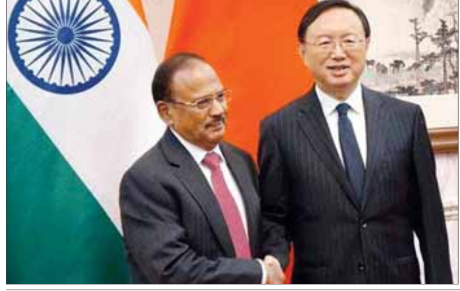
ဝီတီအိုင်း။