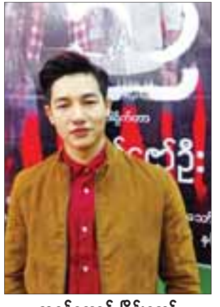
သရုပ်ဆောင် မိုးယသော်